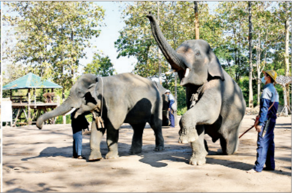
ဒုတိယသမ္မတ ဦးဟင်နရီဗန်ထီးယူ ငလိုက်စခန်းသာဆင်စခန်းတွင် ကျွမ်းကျင်ဆင်လိမ္မာများ ပြကွက်ပြသမှုကို အားပေးကြည့်ရှုစဉ်။

★ ရှေ့ဖွဲ့မှ ထို့နောက် ဒုတိယသမ္မတနှင့်အဖွဲ့သည် တောတွင်းဖြတ်လျှောက်လမ်း (သစ်သားတံတား) တည်ဆောက်ပြီးစီးမှုအခြေအနေများကို လှည့်လည်ကြည့်ရှု စစ်ဆေးရာ ပြည်ထောင်စုဝန်ကြီး ဦးအုန်းဝင်းနှင့် မြန်မာ့သစ်လုပ်ငန်း ဦးဆောင် ညွှန်ကြားရေးမှူး ဦးစောညွန့်ရွှေတို့က လိုက်လံရှင်းလင်းပြသကြသည်။ အရှည်ဆုံးသစ်သားတံတားဖြစ် အဆိုပါ တောတွင်းဖြတ်လျှောက်လမ်း (သစ်သားတံတား)သည် ထင်းရှူး တော ဆင်စခန်းမှ စားသောက်ဆိုင်ကမ်းခြေအထိ စုစုပေါင်းအရှည် ၄၈၁၇ ပေ ရှိပြီး အရှည်ပေ ၃၀၇၀ တည်ဆောက် ပြီးစီးပြီဖြစ်ကြောင်း၊ တံတားကို ၂၀၂၀-