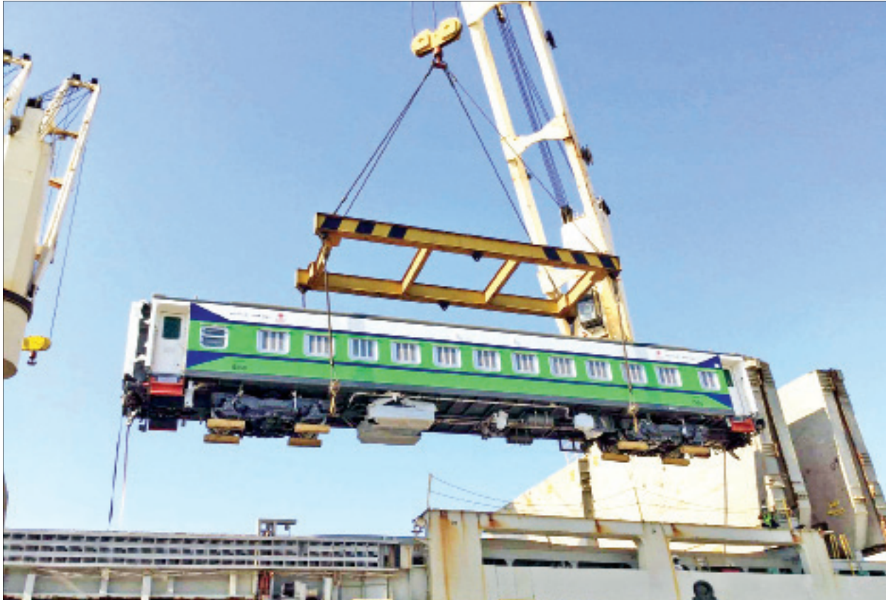
တရုတ်နိုင်ငံမှ အဲကွန်းလေအိတ်ရထားတွဲသစ်များ အပြည်ပြည်ဆိုင်ရာသီလဝါဆိပ်ကမ်းသို့ တွေ့ရစဉ်။