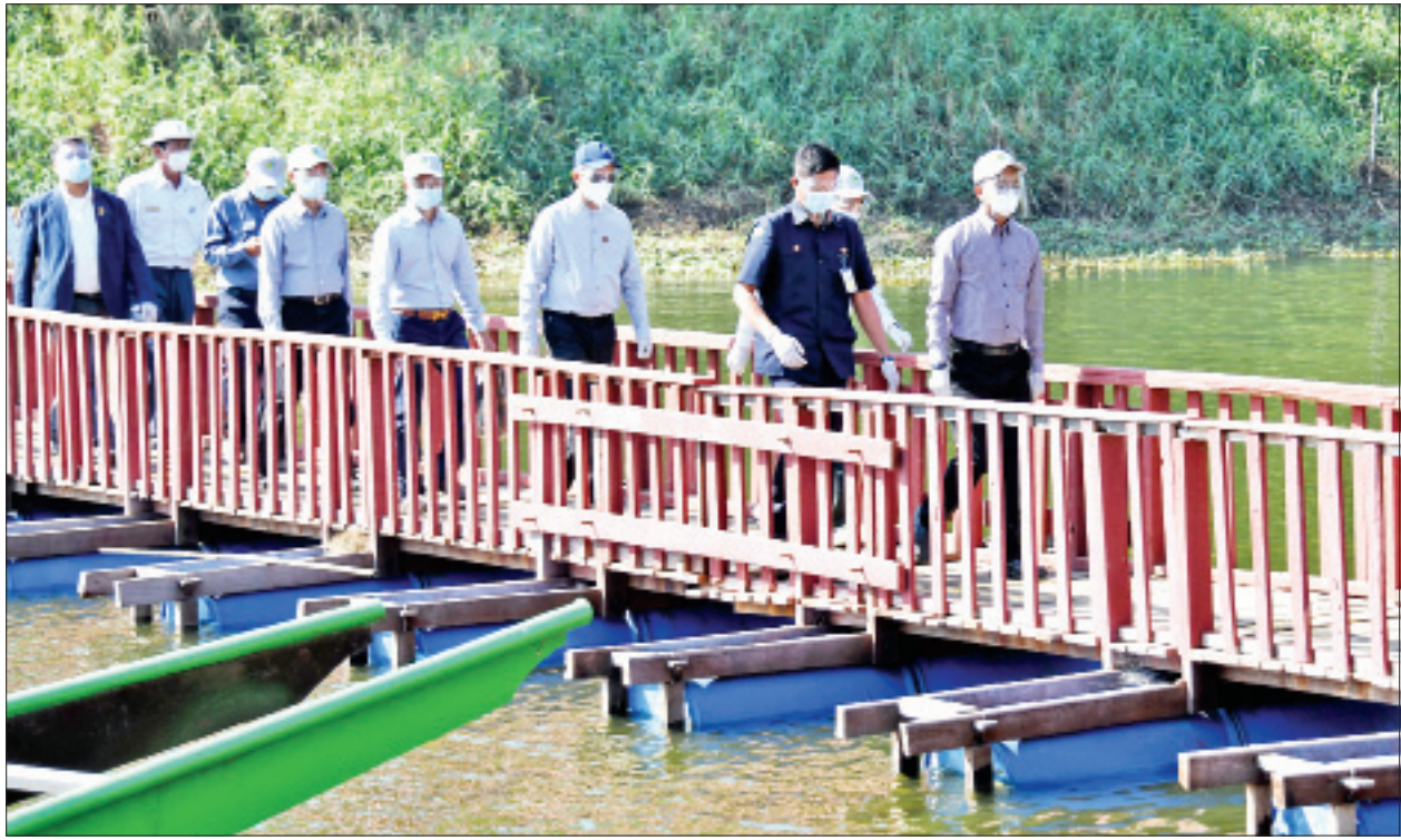
ဒုတိယသမ္မတ ဦးဟင်နရီဗန်ထီးယူ တောတွင်းဖြတ်လျှောက်လမ်း(သစ်သားတံတား) တည်ဆောက်ပြီးစီးမှုအခြေအနေများကို ကြည့်ရှုစစ်ဆေးစဉ်။