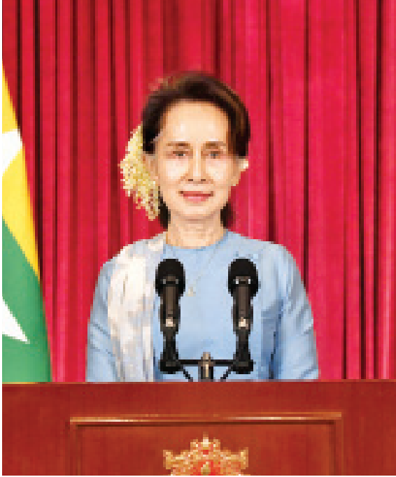
(အမျိုးသားပြန်လည်သင့်မြတ်ရေးနှင့် ငြိမ်းချမ်းရေးဗဟိုဌာန၊ ဥက္ကဋ္ဌ နိုင်ငံတော်၏အတိုင်ပင်ခံပုဂ္ဂိုလ် ဒေါ်အောင်ဆန်းစုကြည် ၁-၁-၂၀၂၁ ရက်နေ့ နိုင်ငံတကာနှစ်သစ်ကူး အထိမ်းအမှတ် အခါသမယတွင် ပြောကြားသည့် မိန့်ခွန်းမှ ကောက်နုတ်ချက်)

ဒီလိုဦးတည်ချက်ထားပြီး လုပ်ငန်းစဉ်ပိုင်း၊ ဒီဇိုင်းပိုင်း၊ ပါဝင်သူတွေအားလုံး အကျုံးဝင်စေခြင်း အပိုင်းတွေကို လာမယ့်ငါးနှစ်တာကာလမှာ လက်တွေ့အသက်ဝင်ဖို့ ဆောင်ရွက်သွားမှာ ဖြစ်ပါတယ်။ ဒီလိုဆောင်ရွက်နိုင်ဖို့အတွက် ပညာရပ်ဆိုင်ရာ၊ စီမံခန့်ခွဲမှုဆိုင်ရာ အထောက်အကူပြုအဖွဲ့တွေ၊ နိုင်ငံရေးပါတီတွေ၊ အရပ်ဘက်အဖွဲ့အစည်းတွေကအစ ပြည်သူတွေအပါအဝင် အဓိကအင်အားစုတွေအဆုံး အကျေအလည် ဆွေးနွေးညှိနှိုင်းနိုင်မယ့် ပြန်လည်သုံးသပ်ရေး လုပ်ငန်းစဉ်ကို ကျယ်ကျယ်ပြန့်ပြန့် ဘက်စုံစဉ်းစားပြီး ကိုယ်စားပြုမှုနဲ့ ထိရောက်မှုဟန်ချက် ဘက်ညီမျှတစေမယ့် “၂၀၂၀ အလွန် ငြိမ်းချမ်းရေး ဖွဲ့စည်းတည်ဆောက်မှုအသစ်” (New Peace Architecture) ကို အရှိန်အဟုန်နဲ့ ဖော်ဆောင်သွားမှာ ဖြစ်ပါတယ်။ “ပင်လုံစာချုပ်” လက်မှတ်ရေးထိုးမှုနှစ်ပေါင်း (၇၅)နှစ် ပြည့်မြောက်မယ့် “စိန်ရတနာ” ဖြစ်တဲ့ ၂၀၂၂ ခုနှစ်မှာ ပြည်ထောင်စုရဲ့ ပန်းတိုင်ကို အတူတကွဆက်ပြီး လျှောက်လှမ်းသွားမယ့် လမ်းကြောင်းတွေ ခိုင်ခိုင်မာမာ ထင်ထင်ရှားရှား လှမ်းမြင်နေရတဲ့ အားတက်ဖွယ်ရာ အခြေအနေတစ်ရပ်ကို ရောက်ရှိလာဖို့ ရည်မှန်းချက်ထားပြီး ၂၀၂၀ အလွန် ငြိမ်းချမ်းရေး ဖွဲ့စည်းတည်ဆောက်မှုအသစ်အနေနဲ့ ကြိုးပမ်းဆောင်ရွက်သွားမှာဖြစ်ကြောင်း ပြောကြားလိုပါတယ်။