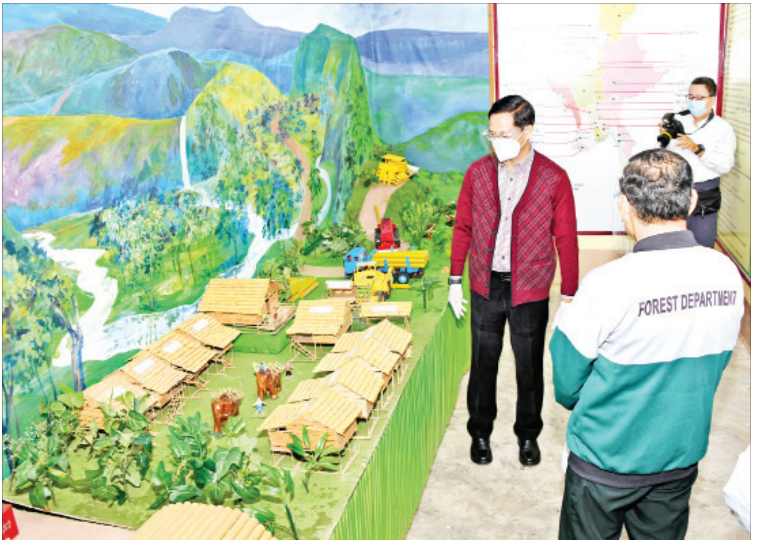
ဒုတိယသမ္မတ ဦးဟင်နရီဗန်ထီးယူ ငလိုက်စခန်းသာဆင်စခန်းရှိ ဆင်ပြတိုက်အတွင်း လှည့်လည်ကြည့်ရှုစဉ်။

ယင်းနောက် ဒုတိယသမ္မတသည် ကျွမ်းကျင်ဆင်လိမ္မာများ မိတ်ဆက်ခြင်း၊ အမည်ခေါ်ထူးခြင်း၊ ဂါရဝပြုအလေးပြုခြင်း၊ တေးသီချင်းဖြင့် ကပြခြင်း၊ ပစ္စည်းကောက်ယူ ပြခြင်း၊ ဟန်အမူအရာလုပ်ပြခြင်း၊ ဆင်ဦးစီးကို ခမောက်ဆောင်းပေးခြင်း၊ ဘောလုံးကန်ပြခြင်း နှင့် ဆုယူပြကွက်ပြသမှုများကို အားပေး ကြည့်ရှုသည်။ စာမျက်နှာ ၃ ကော်လံ ၁ သို့ ၁၃