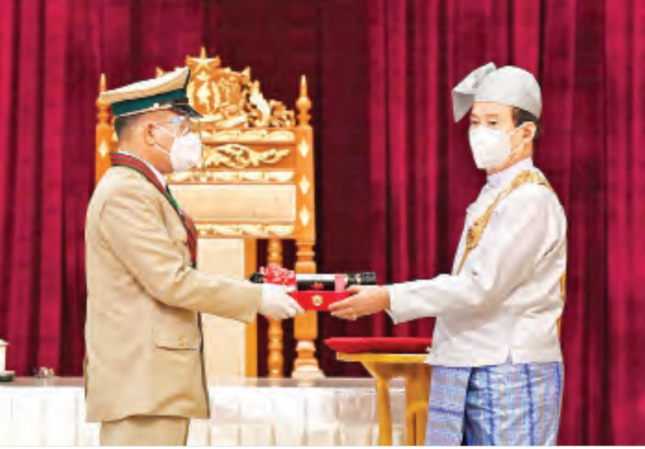
နိုင်ငံတော်သမ္မတ ဦးဝင်းမြင့် အမှတ် (၅၆၄) ခြေမြန်တပ်ရင်းမှ ဗိုလ်မှူးရန်နိုင်ဦးအား ၂၀၂၀ ပြည့်နှစ်တွင် ချီးမြှင့်အပ်နှင်းခဲ့သော တပ်မတော်ဆိုင်ရာ စွမ်းရည်သတ္တိဘွဲ့ဖြစ်သည့် သူရဘွဲ့ ပေးအပ်ချီးမြှင့်စဉ်။