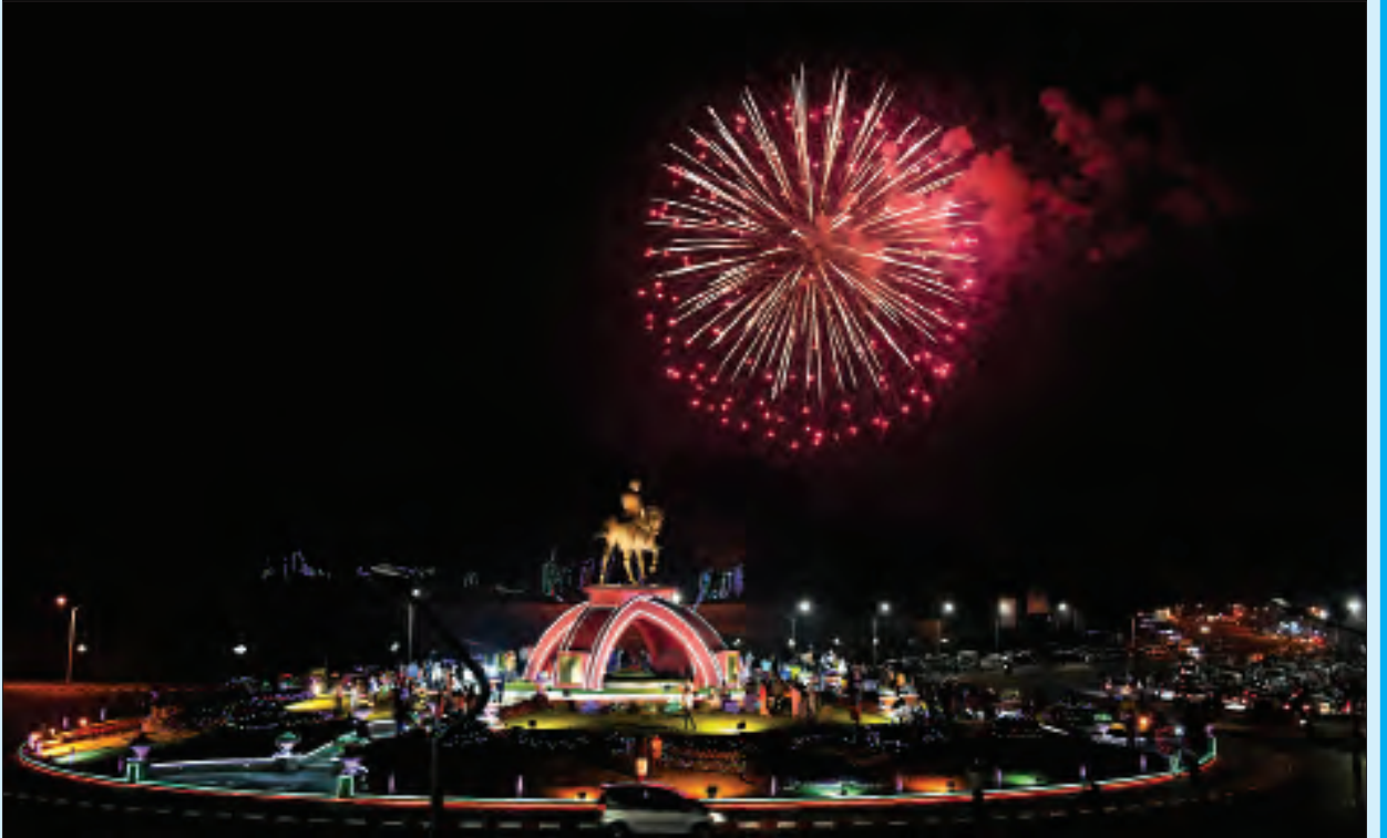
နေပြည်တော်၌ မီးရှူးမီးပန်းများ ပစ်ဖောက်စဉ်။