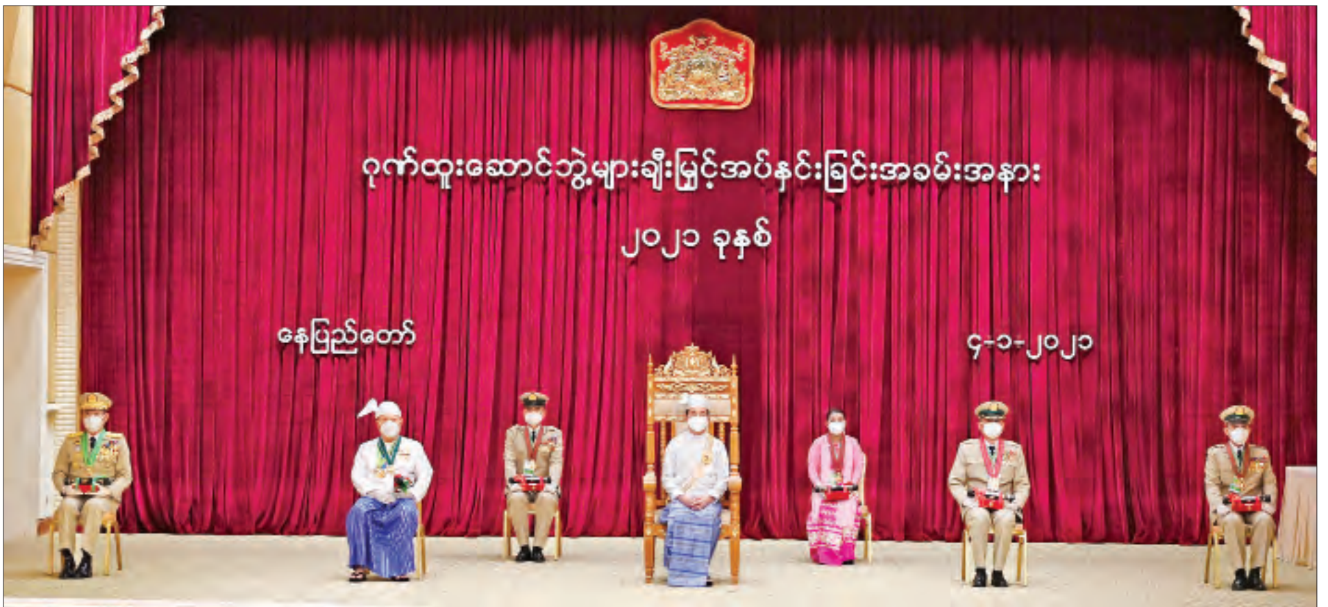
နိုင်ငံတော်သမ္မတ ဦးဝင်းမြင့် ဂုဏ်ထူးဆောင်ဘွဲ့များ ချီးမြှင့်အပ်နှင်းခြင်းအခမ်းအနားတွင် ဂုဏ်ထူးဆောင်ဘွဲ့များ ရရှိကြသူများနှင့်အတူ မှတ်တမ်းတင်ဓာတ်ပုံရိုက်စဉ်။ (သတင်း - ရှေ့ဖုံး)