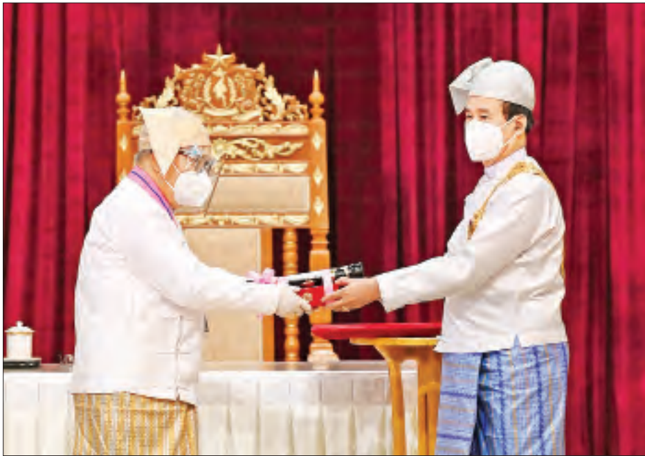
နိုင်ငံတော်သမ္မတ ဦးဝင်းမြင့် ဘာသာရပ်ဆိုင်ရာပညာရှင် ဒေါက်တာတိုးလှအား ၂၀၂၀ ပြည့်နှစ်တွင် ချီးမြှင့်အပ်နှင်းခဲ့သော သိပ္ပံကျော်စွာဘွဲ့ ပေးအပ်ချီးမြှင့်စဉ်။ (သတင်း - ရှေ့ဖုံး)