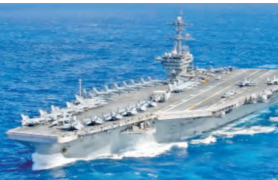
သော်လည်း အမေရိကန်အစိုးရအပေါ် အီရန်၏ ခြိမ်းခြောက် မှုများကြောင့် အဆိုပါစစ်သင်္ဘောကို အရှေ့အလယ်ပိုင်း ဒေသတွင် ဆက်လက်ဖြန့်ဖြူးရန် ပြန်လည်စီစဉ်ခဲ့ ခြင်းဖြစ်သည်။ အမေရိကန်စစ်တပ်က လုပ်ကြံသတ်ဖြတ်ခဲ့သည့် အီရန်ထိပ်တန်းတပ်မှူး ကာဆမ်းဆိုလန်းမန်းနီသေဆုံး သည့် ပထမအကြိမ် နှစ်ပတ်လည်နေ့ အထိမ်းအမှတ် အတောအတွင်း အီရန်အစိုးရက ထရမ်နှင့် အခြား အမေရိကန်အစိုးရ အရာရှိများအပေါ် ခြိမ်းခြောက်ခဲ့ခြင်း ဖြစ်သည်။

ဝါရှင်တန် ဇန်နဝါရီ ၄ အီရန်၏ ခြိမ်းခြောက်မှုများကြောင့် အရှေ့အလယ်ပိုင်း ဒေသရေပြင်တွင် အမေရိကန်လေယာဉ်တင်သင်္ဘော USS Nimitz ကို ဆက်လက်ဖြန့်ဖြူးထားမည်ဖြစ် ကြောင်း ပင်တဂွန်စစ်ဌာနချုပ်က ဇန်နဝါရီ ၃ ရက်တွင် ပြောကြားသည်။ အရှေ့အလယ်ပိုင်းဒေသတွင် ဖြန့်ဖြူးထားသည့် စစ်သင်္ဘောကို ပြန်လည်ရုပ်သိမ်းရန် ဆုံးဖြတ်ထားသော် လည်း မကြာသေးမီက သမ္မတ ဒေါ်နယ်ထရမ်နှင့် အခြား အမေရိကန်အစိုးရအရာရှိများအပေါ် အီရန်ခေါင်းဆောင် များ၏ ခြိမ်းခြောက်မှုများကြောင့် ယင်းစစ်သင်္ဘောကို အရှေ့အလယ်ပိုင်းဒေသရှိ အမေရိကန်စစ်ဌာနချုပ်မှ တပ်ဖွဲ့ဝင်များ လှုပ်ရှားလျက်ရှိရာဒေသရှိ တပ်စခန်းတွင် ဆက်လက်ဖြန့်ဖြူးထားမည်ဖြစ်ကြောင်း၊ အရှေ့ အလယ်ပိုင်းဒေသ၌ လေယာဉ်တင်သင်္ဘော ဆက်လက် ဖြန့်ဖြူးရန် အမေရိကန်၏ ဆုံးဖြတ်ချက်အပေါ် မည်သူမျှ သံသယမရှိသင့်ကြောင်း ခေတ္တအမေရိကန် ကာကွယ်ရေးဝန်ကြီး ခရစ်စီးလာက ထုတ်ပြန်ချက်တစ်ရပ် တွင် ဖော်ပြထားသည်။ အရှေ့အလယ်ပိုင်းဒေသတွင် ဆယ်လနီးပါးကြာ ဖြန့်ဖြူးထားသည့် အမေရိကန်လေယာဉ်တင်သင်္ဘော ကို အမိမြေသို့ ချက်ချင်းပြန်စေရန် ခေတ္တကာကွယ်ရေး ဝန်ကြီး မီးလာအနေဖြင့် ဇန်နဝါရီ ၃ ရက်က ဆုံးဖြတ်ခဲ့