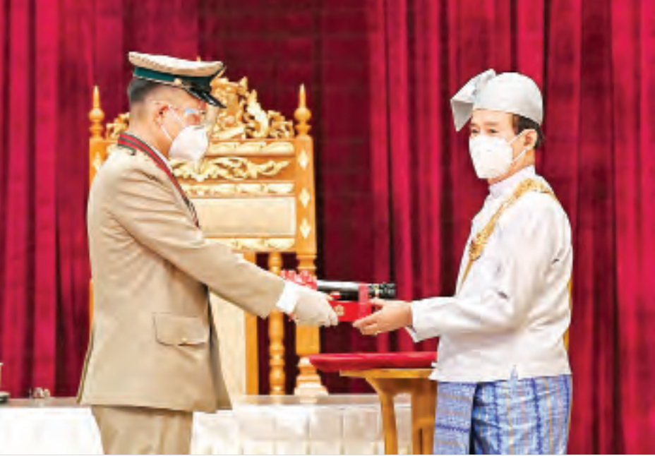
နိုင်ငံတော်သမ္မတ ဦးဝင်းမြင့် စစ်တက္ကသိုလ်မှ ဗိုလ်ကြီးဇော်ဦးလွင်အား ၂၀၂၀ ပြည့်နှစ်တွင် ချီးမြှင့်အပ်နှင်းခဲ့သော တပ်မတော်ဆိုင်ရာ စွမ်းရည်သတ္တိဘွဲ့ဖြစ်သည့် သူရဘွဲ့ ပေးအပ်ချီးမြှင့်စဉ်။