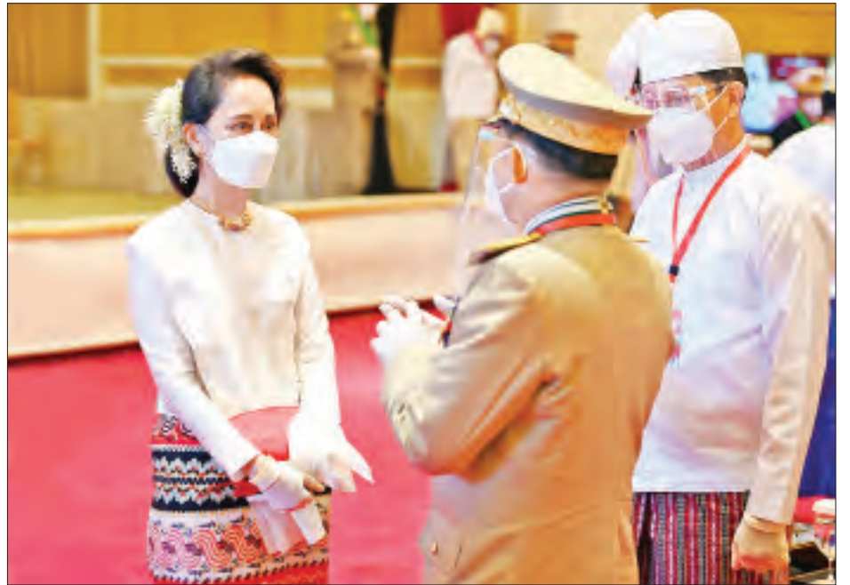
ဂုဏ်ထူးဆောင်ဘွဲ့များ ချီးမြှင့်အပ်နှင်းခြင်းအခမ်းအနားသို့ တက်ရောက်လာသော နိုင်ငံတော်၏ အတိုင်ပင်ခံပုဂ္ဂိုလ် ဒေါ်အောင်ဆန်းစုကြည်က တပ်မတော်ကာကွယ်ရေးဦးစီးချုပ် ဗိုလ်ချုပ်မှူးကြီးမင်းအောင်လှိုင်အား ရင်းရင်းနှီးနှီး တွေ့ဆုံနှုတ်ဆက်စဉ်။ (သတင်း - ရှေ့ဖုံး)