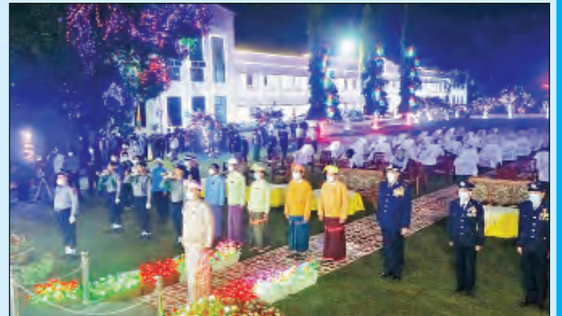
ဘားအံမြို့၌ ကျင်းပစဉ်။