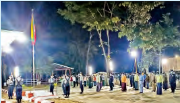
ပူတာအိုမြို့၌ ကျင်းပစဉ်။