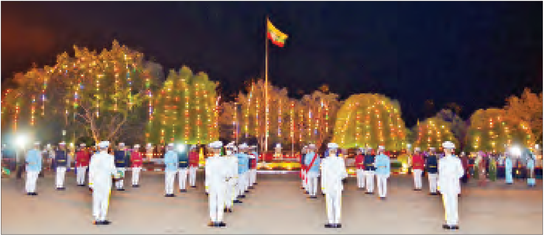
(၇၃)နှစ်မြောက် လွတ်လပ်ရေးနေ့ အလံတင်အခမ်းအနား ကျင်းပစဉ်။