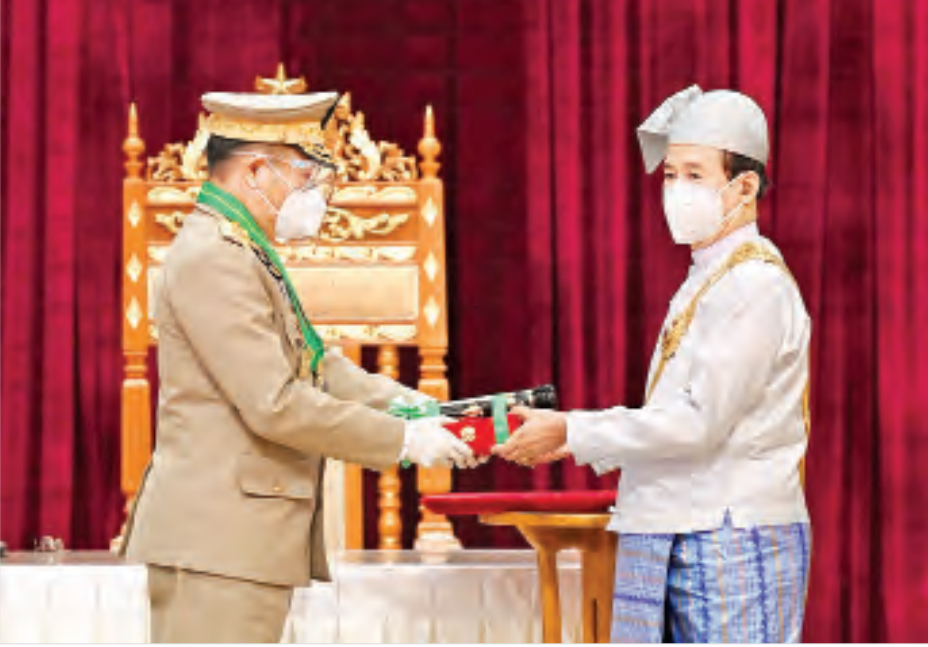
နိုင်ငံတော်သမ္မတ ဦးဝင်းမြင့် ဒုတိယဗိုလ်ချုပ်ကြီးသက်ပုံအား ၂၀၂၀ ပြည့်နှစ်တွင် ချီးမြှင့်အပ်နှင်းခဲ့သော စွမ်းဆောင်မှုဆိုင်ရာ ဂုဏ်ထူးဆောင်ဘွဲ့ဖြစ်သည့် ဇေယျကျော်ထင်ဘွဲ့ ပေးအပ်ချီးမြှင့်စဉ်။