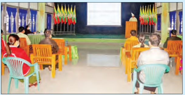
တပ်ကုန်းမြို့၌ ကျင်းပစဉ်။