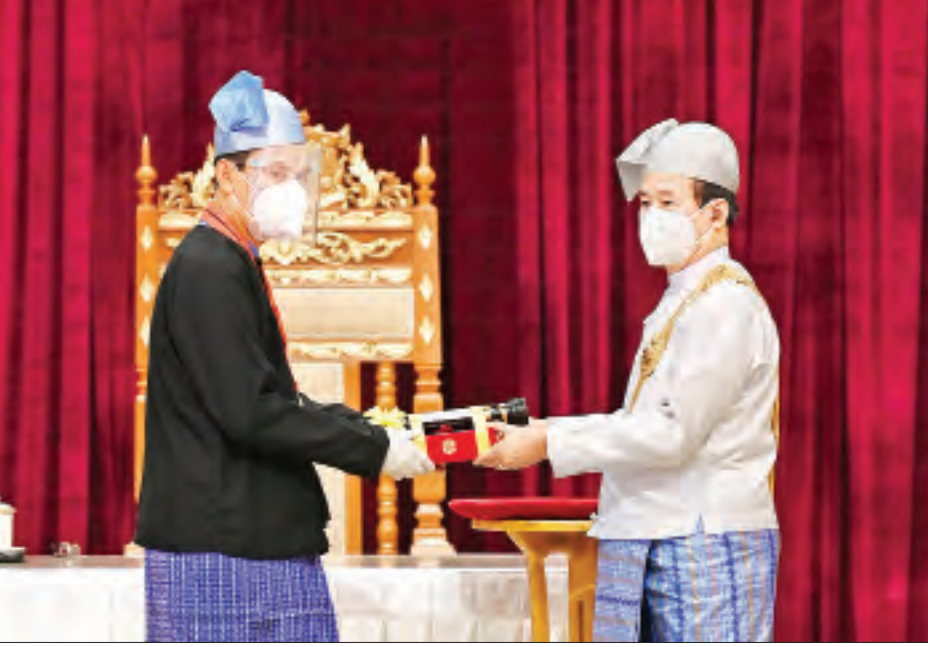
နိုင်ငံတော်သမ္မတ ဦးဝင်းမြင့် ဆိုင်းပညာရှင် ဦးစိန်စတင်(ခ) ဦးတင်မောင်(ကွယ်လွန်) ကိုယ်စား သားဖြစ်သူ ဦးမင်းဟန်(ခ)ဦးစိန်မင်းနိုင်အား ၂၀၂၀ ပြည့်နှစ်တွင် ချီးမြှင့်အပ်နှင်းခဲ့သော အလင်္ကာကျော်စွာဘွဲ့ ပေးအပ်ချီးမြှင့်စဉ်။