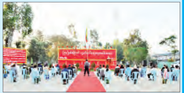
ပြင်ဦးလွင်မြို့၌ ကျင်းပစဉ်။