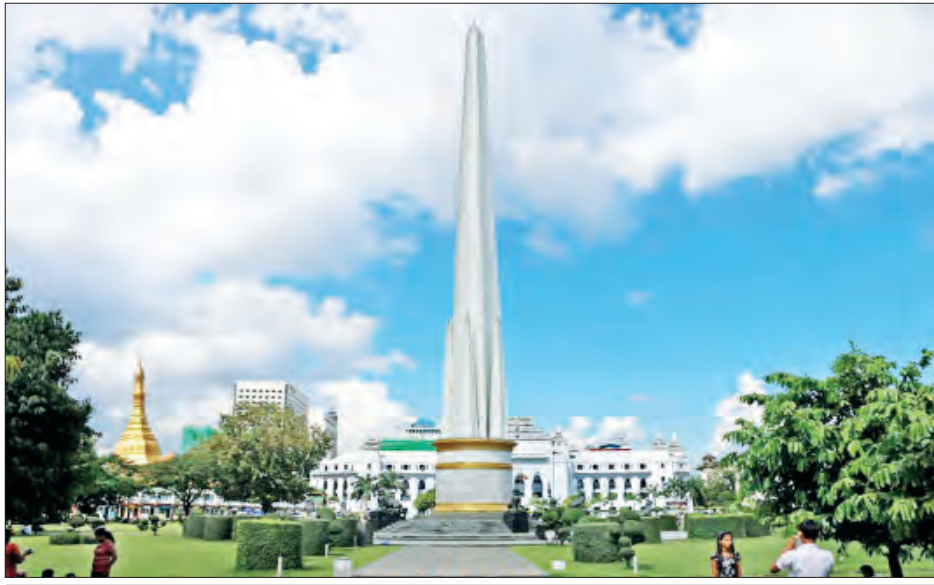
ရန်ကုန်မြို့ မဟာဗန္ဓုလပန်းခြံအတွင်းရှိ လွတ်လပ်ရေးကျောက်တိုင်အား တွေ့ရစဉ်။

မိမိတို့မြန်မာနိုင်ငံသည် နှစ်ပေါင်း (၁၀၀) ခန့် သူ့ကျွန် ၁၀၀တွင် နေထိုင်ခဲ့ရာမှ ၁၉၄၈ ခုနှစ်တွင် လွတ်လပ်သော ပြည်ထောင်စုသမ္မတမြန်မာနိုင်ငံတော် ပေါ်ထွန်းလာခဲ့ပြီး ကမ္ဘာ့အလယ်တွင် လွတ်လပ်သောနိုင်ငံတစ်နိုင်ငံအဖြစ် ရပ်တည်နေထိုင်လာနိုင်ခဲ့ရသည့် အကြောင်းရင်းခံများ များစွာရှိသည့်အနက် အရေးကြီးပြီး အဓိကကျသည့် အကြောင်းရင်းခံတစ်ခုမှာ (၂၀) ရာစုနှစ် ပထမပင်လုံညီလာခံကို အောင်မြင်စွာကျင်းပနိုင်ခဲ့ခြင်းကြောင့်ဖြစ်ပါသည်။