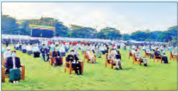
ပုသိမ်မြို့၌ ကျင်းပစဉ်။