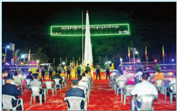
မြဝတီမြို့၌ ကျင်းပစဉ်။