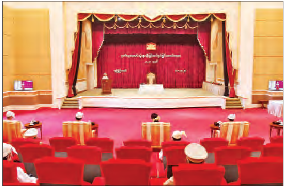
ဂုဏ်ထူးဆောင်ဘွဲ့များ ချီးမြှင့်အပ်နှင်းခြင်းအခမ်းအနား ကျင်းပစဉ်။ (သတင်း - ရှေ့ဖုံး)