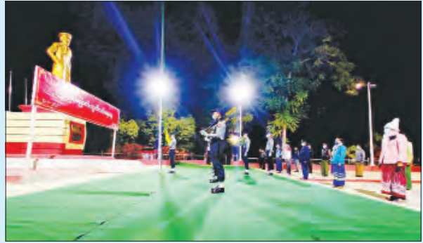
မင်းဘူးမြို့၌ ကျင်းပစဉ်။ ဓာတ်ပုံ-မောင်မောင်(မင်းဘူး)

(၇၃)နှစ်မြောက် လွတ်လပ်ရေးနေ့ အခမ်းအနားကို ယနေ့နံနက်ပိုင်းတွင် နိုင်ငံတစ်ဝန်း၌ ကျင်းပလျက်ရှိရာ အဆိုပါအခမ်းအနားသို့ တက်ရောက်လာကြသူများက ပြည်ထောင်စုသမ္မတမြန်မာနိုင်ငံတော်အလံအား လွှင့်တင်ပြီး အလေးပြုကြခြင်း၊ နိုင်ငံတော်သမ္မတတံမှ ပေးပို့သော (၇၃)နှစ်မြောက် လွတ်လပ်ရေးနေ့ သဝဏ်လွှာအား ဖတ်ကြားခြင်းနှင့် ညပိုင်းတွင် နေပြည်တော်၌ မီးရှူးမီးပန်းများ ပစ်ဖောက်ခြင်းတို့ ဆောင်ရွက်ခဲ့ကြသည်။