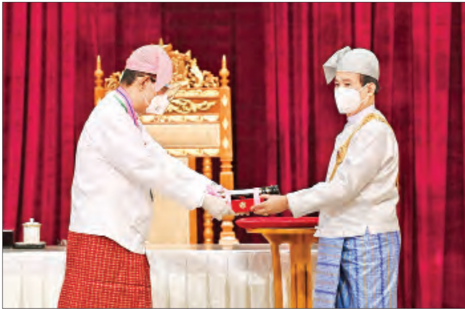
နိုင်ငံတော်သမ္မတ ဦးဝင်းမြင့် ဘာသာရပ်ဆိုင်ရာပညာရှင် ဦးကျော်ဝင်းအား ၂၀၂၀ ပြည့်နှစ်တွင် ချီးမြှင့်အပ်နှင်းခဲ့သော သိပ္ပံကျော်စွာဘွဲ့ ပေးအပ်ချီးမြှင့်စဉ်။ (သတင်း - ရှေ့ဖုံး)