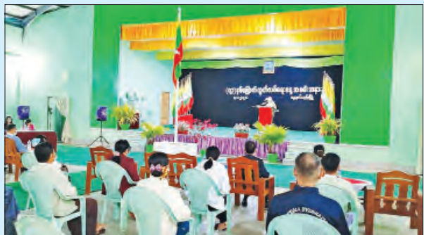
ညောင်တုန်းမြို့၌ ကျင်းပစဉ်။ ဓာတ်ပုံ-မြို့နယ်(ပြန်/ဆက်)