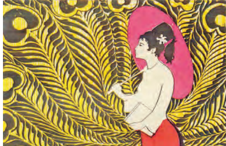
ဟိုတုန်းက တက္ကသိုလ်ကျောင်းသူတစ်ဦး

ပထမနှစ် ဓာတုဗေဒအောင်လျှင် ဒုတိယနှစ် ကုန်ထုတ်ဓာတုဗေဒဘာသာသို့ ပြောင်းရွှေ့ရပါသည်။ သို့သော် ကန့်သတ်ချက်များရှိပါသည်။ ဓာတုနှင့် ကုန်ထုတ်ဓာတု နှစ်ဘာသာစလုံး တတိယနှစ်တွင် စက်ရုံ၊ အလုပ်ရုံများသို့ ငါးယောက် တစ်အုပ်စု လုပ်ငန်းခွင်လက်တွေ့