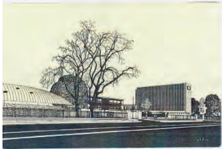
လိပ်ခုံးနှင့်ဆေးတက္ကသိုလ်(၁)ရန်ကုန်။ ပန်းချီ နန်းဝေ

ရန်ကုန်တက္ကသိုလ် နှစ်(၅၀)ပြည့်တွင် ထုတ်ဝေခဲ့သော ပို့စ်ကတ်များ