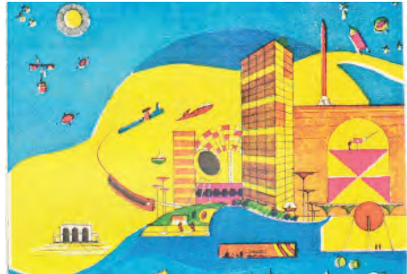
အနာဂတ်ကို မျှော်မှန်းလျက်