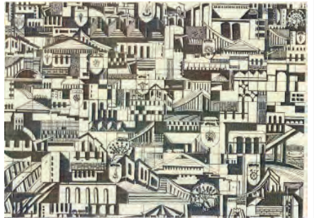
တက္ကသိုလ်များ၏ အမှတ်အသားတံဆိပ်များ