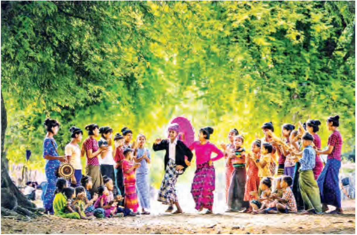
မြန်မာ့ရိုးရာ ဦးရွှေရိုး ဒေါ်မိုးအက။

(နိုင်ငံတော်၏အတိုင်ပင်ခံပုဂ္ဂိုလ် ဒေါ်အောင်ဆန်းစုကြည်၏ (၁၅-၁-၂၀၂၀) ရက်နေ့တွင် ကယားပြည်နယ်နေ့အခမ်းအနား၌ ပြောကြားသည့် နှုတ်ခွန်းဆက်စကားမှ ကောက်နုတ်ချက်)