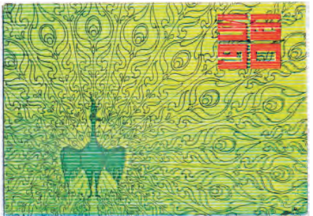
ခေါင်းနှင့် နှစ်(၅၀)

ရန်ကုန်တက္ကသိုလ် နှစ်(၅၀)ပြည့်တွင် ထုတ်ဝေခဲ့သော ပို့စ်ကတ်များ