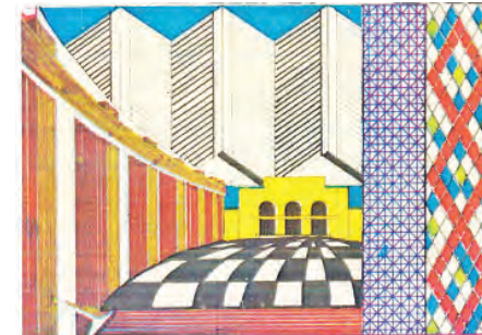
တက္ကသိုလ်များ ပေါင်းဆုံရာ