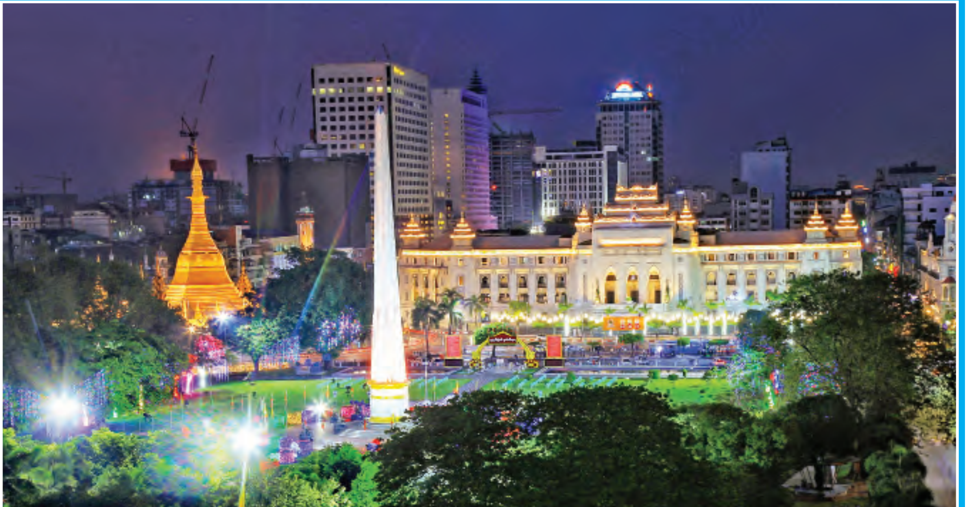
၂၀၂၁ ခုနှစ် (၇၃)နှစ်မြောက် လွတ်လပ်ရေးနေ့အကြို ရန်ကုန်မြို့ရှိ လွတ်လပ်ရေးကျောက်တိုင်နှင့် ပတ်ဝန်းကျင်တွင် ရောင်စုံမီးများဖြင့် အလှဆင်ထားသည်ကို ဇန်နဝါရီ ၂ ရက် ညပိုင်းက တွေ့ရစဉ်။

(၇၃)နှစ်မြောက် လွတ်လပ်ရေးနေ့ နိုင်ငံတော်အလံ အလေးပြုပွဲအခမ်းအနား MRTV မှ တိုက်ရိုက်ထုတ်လွှင့်မည် နေပြည်တော် ဇန်နဝါရီ ၂ ၂၀၂၁ ခုနှစ် (၇၃)နှစ်မြောက် လွတ်လပ်ရေးနေ့ နိုင်ငံတော်အလံ အလေးပြုပွဲ အခမ်းအနားကို ဇန်နဝါရီ ၄ ရက် နံနက် ၇ နာရီတွင် နေပြည်တော် မြို့တော်ခန်းမရှေ့ ရင်ပြင်တွင် ကျင်းပမည်ဖြစ်သည်။ ယင်းအခမ်းအနား ကျင်းပပုံများကို နံနက် ၆ နာရီ မိနစ် ၄၀ မှစတင်၍ မြန်မာ့အသံနှင့် ရုပ်မြင်သံကြား (MRTV)၊ MITV၊ Up to Date၊ Channel 9၊ One News၊ BBM Channel၊ MRTV-4၊ မြဝတီရုပ်မြင်သံကြား (MWD)၊ မြန်မာ့အသံ ရေဒီယို၊ Ministry of Information Facebook Page၊ MRTV Facebook Page နှင့် Myanmar Digital News Facebook Page တို့မှ တိုက်ရိုက် ထုတ်လွှင့်သွားမည်ဖြစ်ကြောင်း သိရသည်။ သတင်းစဉ်