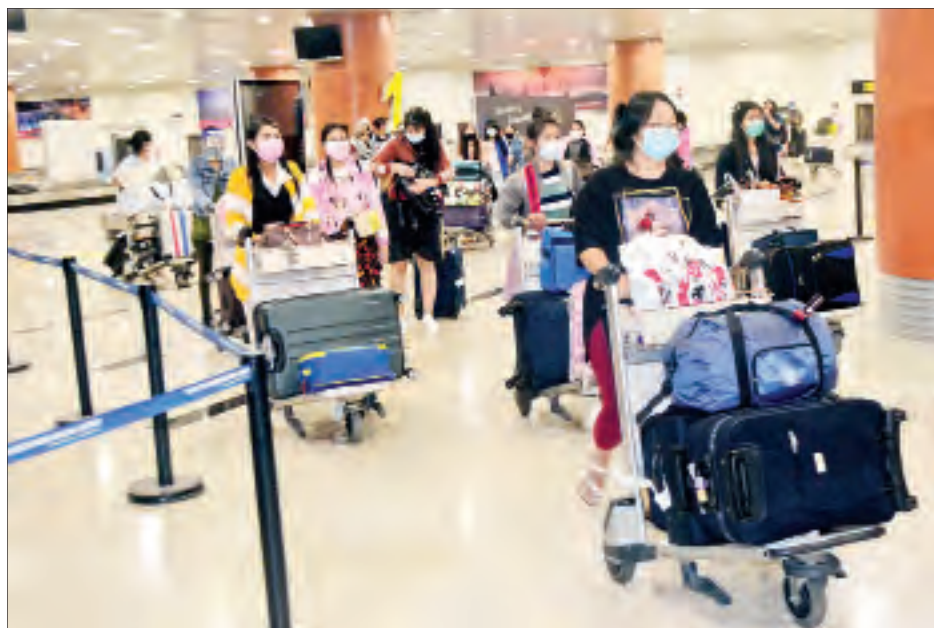
စင်ကာပူနိုင်ငံမှ ပြန်လည်ရောက်ရှိလာသည့် မြန်မာနိုင်ငံသားများအား ရန်ကုန်အပြည်ပြည်ဆိုင်ရာလေဆိပ်၌ တွေ့ရစဉ်။

နေပြည်တော် ဇန်နဝါရီ ၂ နိုင်ငံတကာခရီးသည်တင် လေယာဉ် များ ပျံသန်းမှု ယာယီရပ်ဆိုင်းထားခြင်း ကြောင့် စင်ကာပူနိုင်ငံတွင် အခက်အခဲ ကြုံတွေ့နေရသည့် မြန်မာနိုင်ငံသား ၇၈ ဦးအား စင်ကာပူမြို့ရှိ မြန်မာသံရုံး မှ စီစဉ်သည့် (၄)ကြိမ်မြောက် မြန်မာ အမျိုးသားလေကြောင်း (MNA) စင်းလုံးငှား အထူးကယ်ဆယ်ရေး လေယာဉ်ဖြင့် ပြန်လည်ခေါ်ဆောင်ခဲ့ ရာ ယနေ့ညနေပိုင်းတွင် ရန်ကုန် အပြည်ပြည်ဆိုင်ရာ လေဆိပ်သို့ အဆင်ပြေချောမွေ့စွာ ပြန်လည် ရောက်ရှိခဲ့ကြသည်။