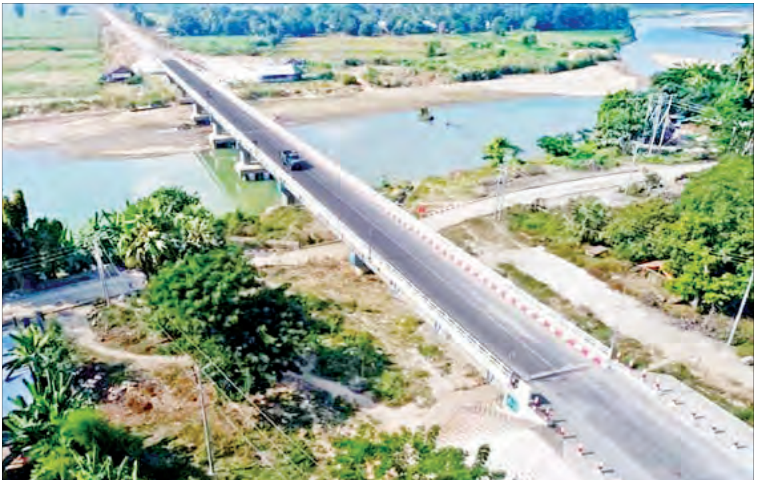
ရေတာရှည်- ကရင်ချောင်း-လိပ်သိုလမ်းပေါ်ရှိ စစ်တောင်းမြစ်ကူးတံတား(ရေတာရှည်)ကို တွေ့ရစဉ်။