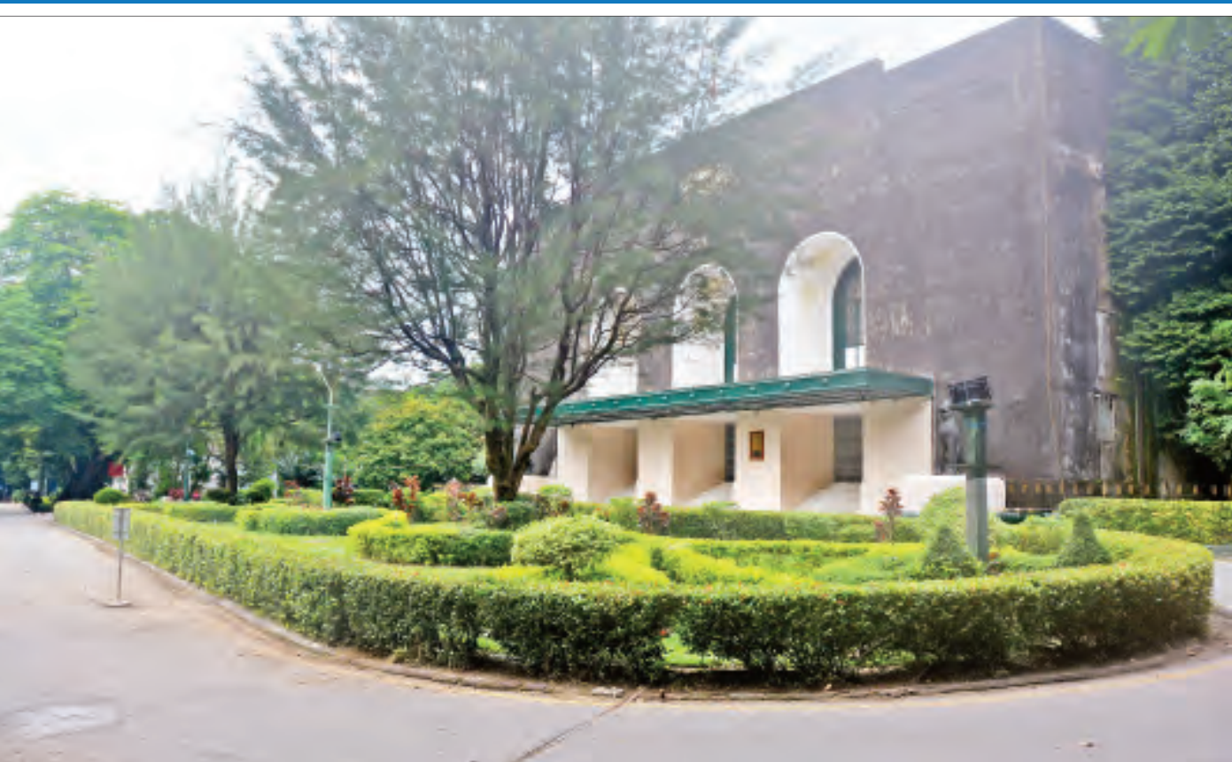
ရန်ကုန်တက္ကသိုလ်ဘွဲ့နှင့်သဘင်ခန်းမ။

ပညာရေးခရီးလမ်း- ၁၉၆၅ ခုနှစ်တွင် စေတနာအထက်တန်းကျောင်း (အလွတ်ပညာသင်) တွင် ၇ တန်းမှစ၍ တက်ရ၏။ ၁၉၆၆ ခုနှစ် ၈ တန်းနှစ်တွင် နိုင်ငံတော်အစိုးရက အလွတ်ပညာသင်တန်းကျောင်းအားလုံးကို ပိတ်လိုက်၍ ကျောင်းတက်ရန်