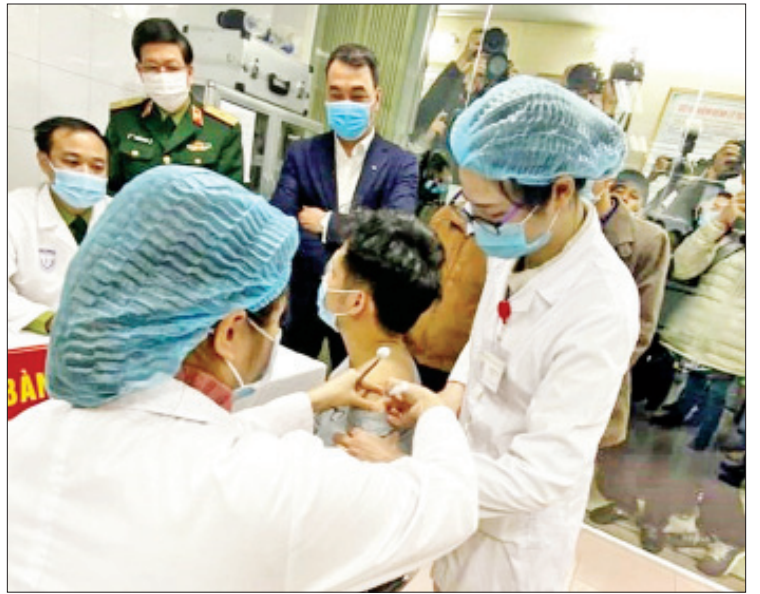
ကိုးကား-သည်စထရိတ်တိုင်းမ် ဘာသာပြန်-ဆန်းသစ်ဆန်း

လက်ရှိအချိန်တွင် ခွင့်ပြုချက်အရ ကိုဗစ်-၁၉ ကာကွယ်ဆေးများ၏အရေအတွက်မှာ ကမ္ဘာလူဦးရေ၏ ငါးပုံတစ်ပုံခန့်အတွက်သာ ရရှိနိုင်ပြီး ဆေးအများစုမှာလည်း ချမ်းသာသောနိုင်ငံများသို့သာ ရောက်ရှိသွားကြမည်ဟု တပ်မတော်ဆေးတက္ကသိုလ်၏ ညွှန်ကြားရေးမှူး ဒုတိယဗိုလ်ချုပ်ကြီး ဒိုက်က ပြောကြားခဲ့သည်။