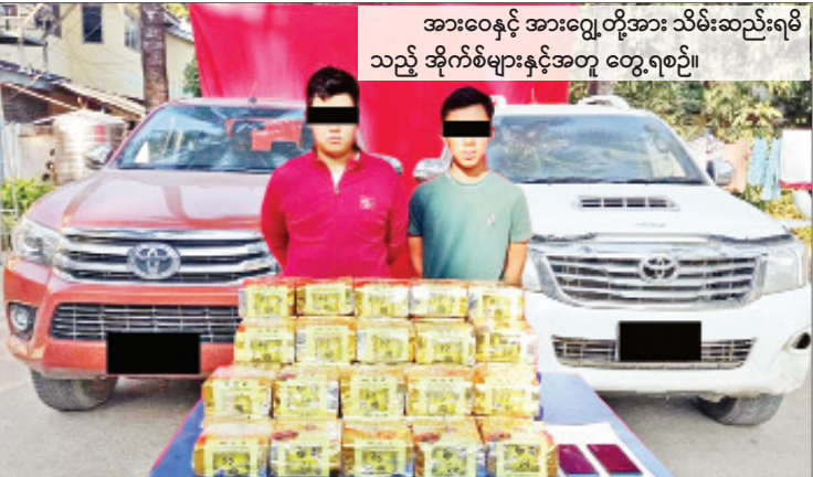
အားဝေနှင့် အားရွှေ့တို့အား သိမ်းဆည်းရမိသည့် အိုင်ကွဲများနှင့်အတူ တွေ့ရစဉ်။

နေပြည်တော် ဒီဇင်ဘာ ၁၈ တာချီလိတ်မြို့နယ်တွင် ငွေကျပ် တစ်ဘီလီယံ တန်ဖိုးရှိ အိုင်ကွဲများ သိမ်းဆည်းရမိခဲ့ကြောင်း မြန်မာနိုင်ငံရဲတပ်ဖွဲ့၏ သတင်းထုတ်ပြန်ချက် အရ သိရသည်။