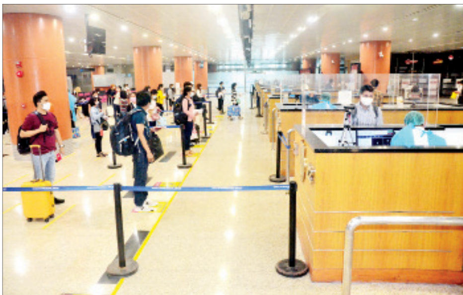
စင်ကာပူနိုင်ငံမှ ပြန်လည်ရောက်ရှိလာသည့် မြန်မာနိုင်ငံသားများအား ရန်ကုန်အပြည်ပြည်ဆိုင်ရာလေဆိပ်၌ တွေ့ရစဉ်။

ထို့ပြင် ထိုင်းနိုင်ငံ၌ အခက်အခဲ ကြုံတွေ့နေရသည့် မြန်မာနိုင်ငံသား ၃၉ ဦးအား ဗန်ကောက်မြို့ မြန်မာ သံရုံးက စီစဉ်သည့် (၁၃)ကြိမ်မြောက် မြန်မာအမျိုးသားလေကြောင်း(MNA) ကယ်ဆယ်ရေးလေယာဉ်ဖြင့် ပြန်လည် စာမျက်နှာ ၈ ကော်လံ ၁ သို့ ❖