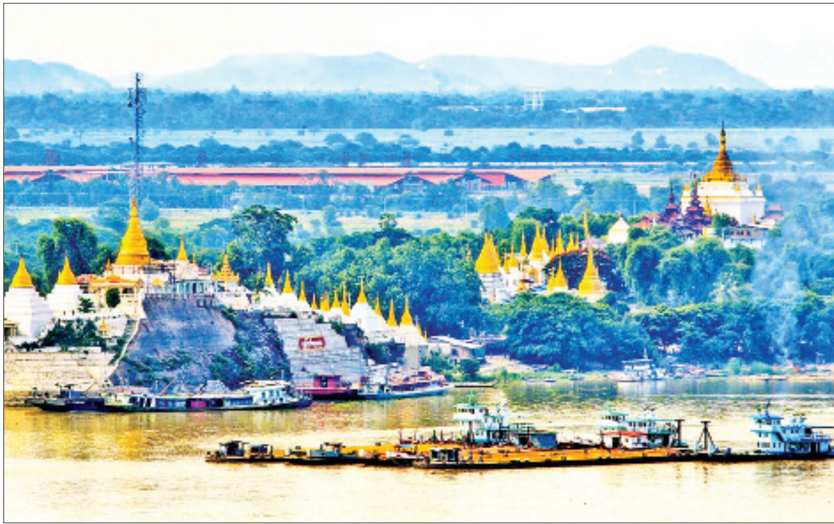
ရွှေကြက်ယက်၊ ရွှေကြက်ကျတုရား။

(ဗိုလ်ချုပ်အောင်ဆန်း၏ ၁၁-၂-၁၉၄၇ ရက်နေ့တွင် ပင်လုံမြို့စော်ဘွားများ ထမင်းစားပွဲတွင် ပြောကြားသောမိန့်ခွန်းမှ ကောက်နုတ်ချက်)