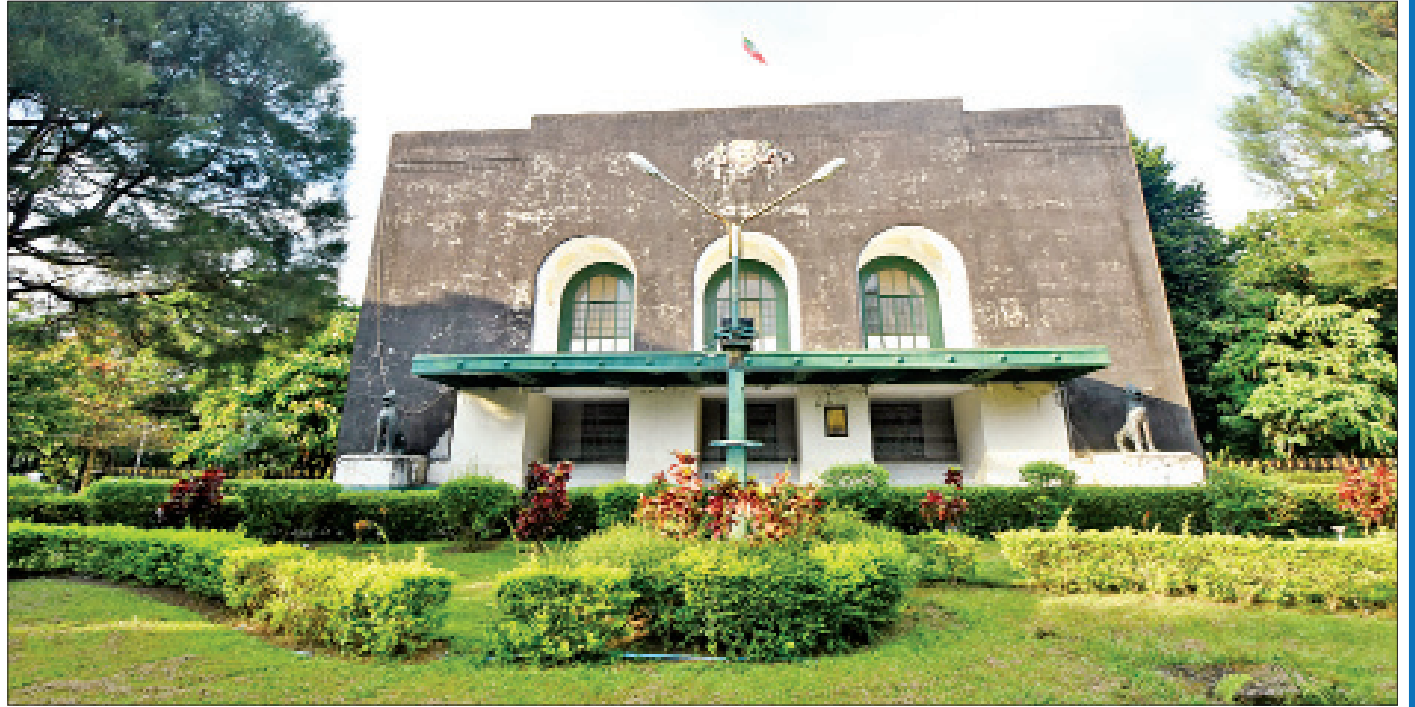
ရန်ကုန်တက္ကသိုလ်ဘွဲ့နှင်းသဘင်ခန်းမ။

၁၉၂၀ ပြည့်နှစ်က စတင်မွေးဖွားခဲ့တဲ့ အဓိကတက္ကသိုလ်ကြီး ၂၀၂၀ ပြည့်နှစ်မှာ မွေးနေ့ နှစ်(၁၀၀)ပြည့်ပါပြီ။ သမိုင်းတစ်လျှောက် ဖျော်ရွှင်ခြင်း၊ ဝမ်းနည်းခြင်း၊ မြင့်ခြင်း၊ နိမ့်ခြင်း စတဲ့ လောကဓံတရားတွေကို ကြုံကြုံခံပြီး အသက် ၁၀၀ တိုင်ခဲ့ပါပြီ။ သားသမီးတွေ ဖျော်ရွှင်ရယ်မောရင် သူလည်း အတူပျော်ခဲ့ပြီး သားသမီးတွေ ဝမ်းနည်းကြေကွဲရင်တော့ တိတ်တဆိတ် ငိုကြွေးနေခဲ့မှာပါ။ သမိုင်းကြောင်းလှခဲ့တဲ့ အဓိကတက္ကသိုလ်အတွက် အမြဲဂုဏ်ယူရသလို အဓိကတက္ကသိုလ်ရဲ့ သားသမီးဖြစ်ခွင့်ရခဲ့တာကိုလည်း ကျေနပ်ဂုဏ်ယူလို့ မဆုံးပါဘူး။ ရာပြည့်မွေးနေ့မှာ သားသမီးတစ်ယောက်အနေနဲ့ မွေးနေ့လက်ဆောင်အဖြစ် ဒီစာလေးကို ပေးချင်ပါတယ်ရှင်။