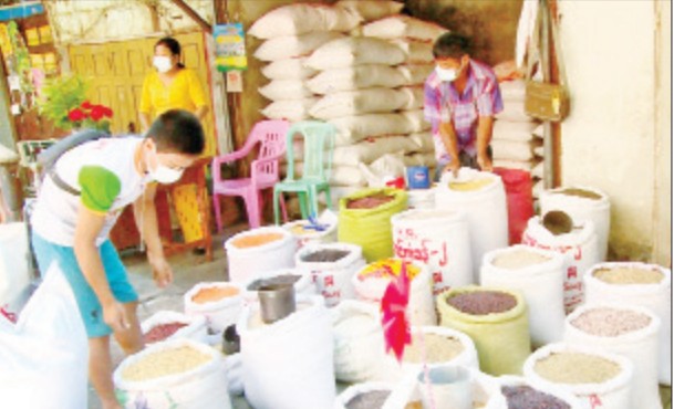
မြန်မာနိုင်ငံမှ ထွက်ရှိသည့် မတ်ပဲကို တရုတ်နိုင်ငံကလည်း လွန်ခဲ့သည့် လေးနှစ်ခန့်ကတည်းက စတင်ဝယ်ယူမှုများရှိခဲ့သော်လည်း ဈေးနှုန်းမြင့်တက်လာပါက ဝယ်ယူမှုများရပ်တန့်သွားခဲ့ကြောင်း သိရသည်။ မတ်ပဲကို မြန်မာနိုင်ငံအလယ်ပိုင်းဒေသများ၌ ဩဂုတ်လအတွင်း စတင်စိုက်ပျိုးကာ ဇန်နဝါရီလအတွင်း၌ လှိုင်လှိုင်ပေါ်ထွက်လေ့ရှိပြီး မြန်မာနိုင်ငံအောက်ပိုင်းဒေသများဖြစ်သည့် ဧရာဝတီ၊ ရန်ကုန်နှင့် ပဲခူးတိုင်းဒေသကြီးတို့တွင် ဖော်ဖော်ဝါရီလနှင့် မတ်လအတွင်း၌ လှိုင်လှိုင်ထွက်ပေါ်လေ့ရှိကြောင်း သိရသည်။

မန္တလေး ဒီဇင်ဘာ ၁၈ ၂၀၂၁ ခုနှစ် ပဲရသီအတွက် မတ္တရာဒေသမှ အစောဆုံးထွက်ရှိလာသည့် ပေါ့ဦးပေါ့ဖျား မတ်ပဲများ မန္တလေးဈေးကွက်တွင် အဖွင့်ဈေးကောင်းမွန်လျက်ရှိကြောင်း မန္တလေးပဲကုန်သည်များထံမှ သိရသည်။