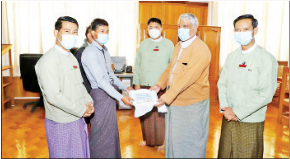
တိုင်းဒေသကြီး(ပြန်/ဆက်)

လေးပို့သွားမည်ဖြစ်ပြီး ပညာရှင်အဖွဲ့က စစ်ဆေး၍ မူလရွှေထည်တန်ဖိုးအပြင် ခေတ်ကာလတန်ဖိုးနှင့် အနုစိတ်လက်ရာကြေးတို့ကို ဖြည့်စွက်ပေါင်းထည့်၍ ထိုက်တန်စွာ ထပ်မံဆန်းစစ်နိုင်ရေး စီစဉ်ဆောင်ရွက်သွားမည်ဖြစ်ကြောင်း ပြောကြားခဲ့သည်။