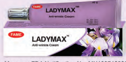
Myanmar FDA Notification No. MN17037447

အသားတင်းသရုပ် အရေးအကြောင်း လျော့နည်းစေပြီး အသားအရေ တင်းရင်းလှပစေရန်