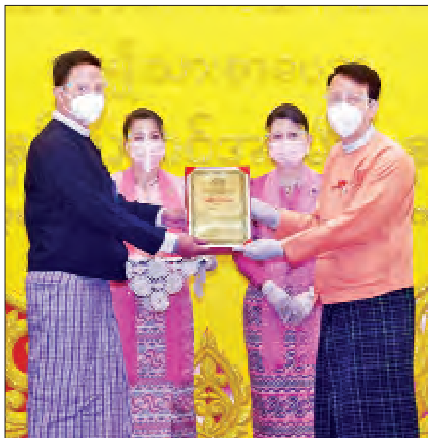
ရန်ကုန်တိုင်းဒေသကြီး ဝန်ကြီးချုပ် ဦးဖြိုးမင်းသိန်း ၂၀၁၉ ခုနှစ်အတွက် အမျိုးသားစာပေဆု ဝတ္ထုရှည်ဆုရ ဆရာမိုးကျော်စင်ကိုယ်စား ဦးမင်းဝေဟင် အား ဆုပေးအပ်ချီးမြှင့်စဉ်။