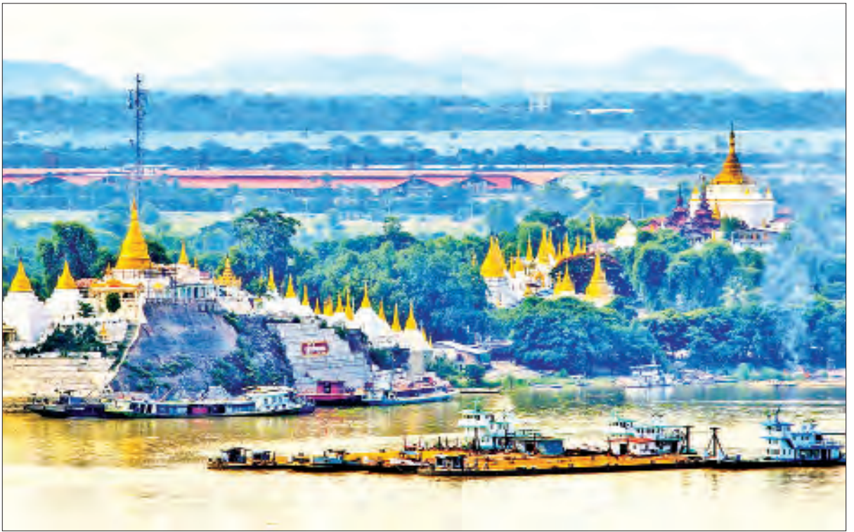
ရွှေကြက်ယက်၊ ရွှေကြက်ကျတုရား။

(ဗိုလ်ချုပ်အောင်ဆန်း၏ ၁၁-၂-၁၉၄၇ ရက်နေ့တွင် ပင်လုံမြို့စော်ဘွားများ ထမင်းစားပွဲတွင် ပြောကြားသောမိန့်ခွန်းမှ ကောက်နုတ်ချက်)