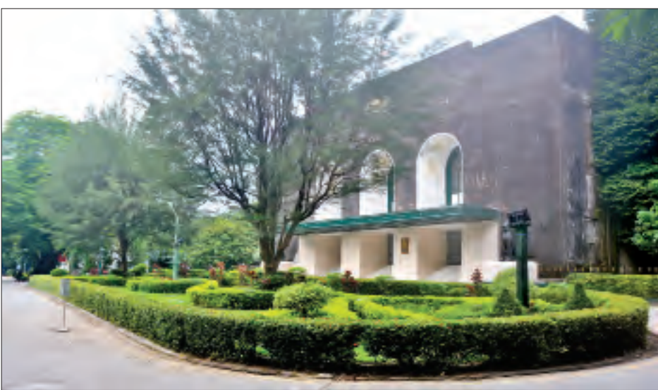
ရန်ကုန်တက္ကသိုလ်ဘွဲ့ နှင်းသဘင်ခန်းမ။

ဘုန်းကြီးကျောင်းသား ကိုရင်ကျော်ဘဝမှာ ဆွမ်းဟင်းချိုင့်နှုတ်ခမ်းနဲ့ အဖိုးမှာ U.S.B ဆိုပြီး အတိုကောက်ရေးတာ ကျွန်တော့်အဖေ (U San Ba) ဦးစံဘလို့ စဉ်းစားတတ်ပေမယ့် U.S.A လို့ အတိုကောက် ရေးတာတွေတွေ့တော့ ဘာအဓိပ္ပာယ်လဲပေါ့။ မြန်မာပြည် မြေပုံကိုဆွဲတတ်ဖို့ လေ့ကျင့်ခဲ့ရတာတွေ၊ သက်သေပြချက် တွေ ကောင်းတော့ ကမ္ဘာကြီးလုံးတယ်ဆိုတာ လက်ခံ ခဲ့တဲ့ ကျောင်းသားဘဝ၊ မြန်မာပြည်အလယ်ပိုင်းဟာ သဲကန္တာရဖြစ်မယ့် အလားအလာများကြောင်း ပထဝီ ဆရာက သင်တော့ ကျွန်တော်တို့ အညာဒေသကို ဘယ်လို ကာကွယ်နိုင်မလဲ၊ ကာကွယ်နိုင်မယ့်နည်းတွေ ဘယ်မှာ သင်ယူနိုင်မလဲ စဉ်းစားရင်း ရန်ကုန်စာစစ် မင်းကြီးရုံးက ကျင်းပတဲ့ တက္ကသိုလ်ဝင်စာမေးပွဲကို မလှိုင်မြို့ စာစစ်ဌာနက သင်္ချာဂုဏ်ထူးနဲ့ အောင်မြင်ခဲ့ ပါတယ်။ ၁၉၆၀ ပြည့်နှစ်မှာ ကျွန်တော့်အတွက် မိခင် ရန်ကုန်တက္ကသိုလ်ကြီးက ပေါက်ဖွားလာတဲ့ တက္ကသိုလ်၊ မိဘတွေနေရပ်နဲ့အလွမ်းမဝေးတဲ့ မန္တလေးတက္ကသိုလ်မှာ