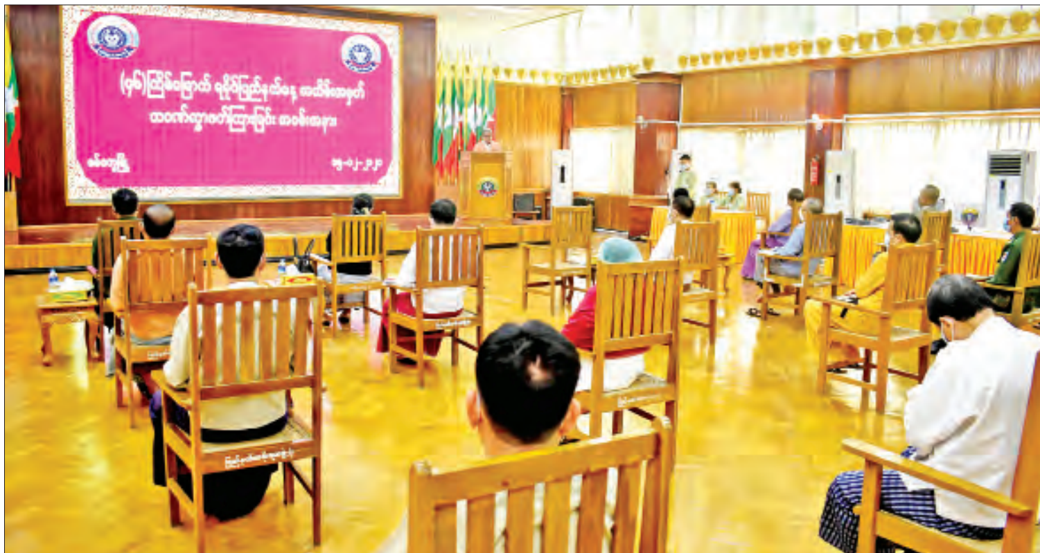
(၄၆)ကြိမ်မြောက် ရခိုင်ပြည်နယ်နေ့ အခမ်းအနား စစ်တွေမြို့၌ ကျင်းပစဉ်။

စစ်တွေ ဒီဇင်ဘာ ၁၅ ယနေ့ကျရောက်သည့် (၄၆)ကြိမ်မြောက် ရခိုင်ပြည်နယ်နေ့ အခမ်းအနားကို နံနက် ၉ နာရီတွင် ရခိုင်ပြည်နယ်အစိုးရအဖွဲ့ရုံး အစည်း အဝေးခန်းမ၌ ကျန်းမာရေးနှင့်အားကစား ဝန်ကြီးဌာန၏ ကိုဗစ်-၁၉ ကာကွယ် ထိန်းချုပ် ရေး ညွှန်ကြားချက်များနှင့်အညီ ကျင်းပ သည်။ အခမ်းအနားတွင် ပြည်ထောင်စုသမ္မတ မြန်မာနိုင်ငံတော် နိုင်ငံတော်သမ္မတ ဦးဝင်းမြင့် ထံမှ (၄၆)ကြိမ်မြောက် ရခိုင်ပြည်နယ်နေ့အခမ်း အနားသို့ ပေးပို့သော သဝဏ်လွှာကို ရခိုင် ပြည်နယ်ဝန်ကြီးချုပ် ဦးညီပုက ဖတ်ကြား သည်။