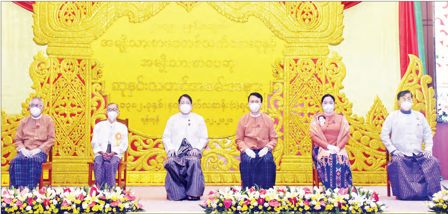
ပြည်ထောင်စုဝန်ကြီး ဒေါက်တာဖေမြင့်၊ ရန်ကုန်တိုင်းဒေသကြီး ဝန်ကြီးချုပ် ဦးဖြိုးမင်းသိန်း၊ တိုင်းဒေသကြီးလွှတ်တော်ဥက္ကဋ္ဌ ဦးတင်မောင်ထွန်း၊ တိုင်းဒေသကြီး အစိုးရအဖွဲ့ ဝန်ကြီးများ ၂၀၁၉ ခုနှစ်အတွက် အမျိုးသားစာပေ တစ်သက်တာဆုရ စာပေပညာရှင် ဆရာကြီး ဦးညွန့်မောင်(မောင်မောင်ညွန့်-မန်းတက္ကသိုလ်)နှင့်အတူ စုပေါင်းမှတ်တမ်းတင် ဓာတ်ပုံရိုက်စဉ်။

စိစစ်ရွေးချယ်ရေးကော်မတီအဖွဲ့များ နှင့် ကြွရောက်လာသည့် ဧည့်သည် တော်အပေါင်းကို ကျေးဇူးအထူးတင် ရှိကြောင်း ပြောကြားရင်း နိဂုံးချုပ် အပ်ပါကြောင်း ပြောကြားသည်။