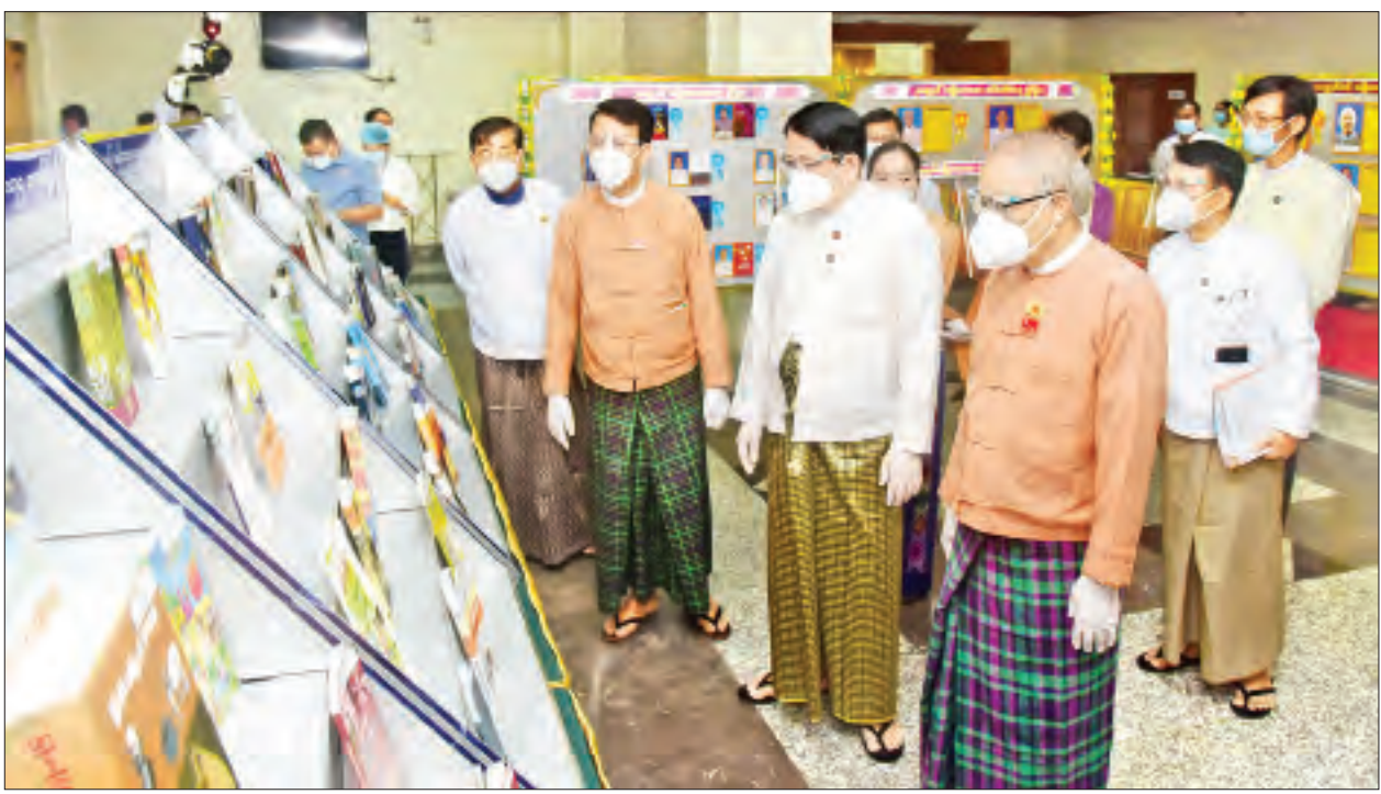
ပြည်ထောင်စုဝန်ကြီး ဒေါက်တာဖေမြင့်၊ ရန်ကုန်တိုင်းဒေသကြီး ဝန်ကြီးချုပ် ဦးဖိုးမင်းသိန်း၊ တိုင်းဒေသကြီးလွှတ်တော်ဥက္ကဋ္ဌ ဦးတင်မောင်ထွန်းနှင့် တာဝန်ရှိသူများ ၂၀၁၉ ခုနှစ်အတွင်း ထုတ်ဝေခဲ့သည့် စာအုပ်များနှင့် ယခင်နှစ် ဆုရရှိခဲ့သောစာအုပ်များ ခင်းကျင်းပြသထားမှုကို လှည့်လည်ကြည့်ရှုစဉ်။

များ၏ ကျန်းမာရေးသည်လည်း အလွန်အရေးကြီးသည့်အတွက် မိမိတို့ အနေဖြင့် ယနေ့ပွဲကို ဖြစ်နိုင်သမျှ အတိုင်းအတာအထိ တင့်တယ်ခမ်းနား မှုလည်းရှိစေ၊ ဘေးအန္တရာယ်လည်း ကင်းစေဆိုသည့် ပုံသဏ္ဍာန်မျိုးဖြင့် ကျင်းပပြုလုပ်ရခြင်း ဖြစ်ပါကြောင်း၊ တကယ်တော့ ယနေ့ အခမ်းအနား ကျင်းပရာမှာသာ မဟုတ်ဘဲ ဆုစိစစ် ရွေးချယ်ရေးကော်မတီ၏ လုပ်ငန်း များ စတင်ဆောင်ရွက်စဉ်ကတည်းက ကိုဗစ်-၁၉ ၏ အကန့်အသတ်များ ရှိနေခဲ့တာဖြစ်၍ ကော်မတီအနေဖြင့် အစည်းအဝေးများ ဖြစ်မြောက်ရန် ယခင်နှစ်များကထက် ပိုပြီးအားထုတ် ဆောင်ရွက်ခဲ့ရပါကြောင်း၊ ယနေ့မှာ လည်း ဆုရွေးချယ်ရေး ကော်မတီဝင် များထဲမှာရာ၊ စာပေဆုပုဂ္ဂိုလ်ကြီး