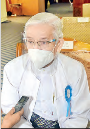
ဒေါက်တာလှကြည်