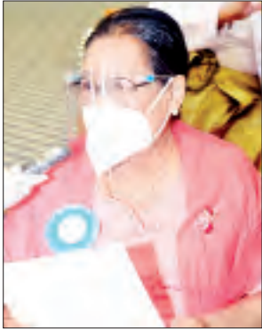
စာရေးဆရာမကြီး နတ်မောက်အနီချို