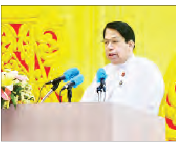
ပြည်ထောင်စုဝန်ကြီး ဒေါက်တာဖေမြင့် ၂၀၁၉ ခုနှစ်အတွက် အမျိုးသား စာပေတစ်သက်တာဆုနှင့် အမျိုးသားစာပေဆု ချီးမြှင့်ပွဲအခမ်းအနားတွင် အမှာစကား ပြောကြားစဉ်။

တွင် စာပေကဏ္ဍ ၁၈ မျိုးအတွက် ဆုများ သတ်မှတ်ထားရှိပြီး ဖြစ်ပါ ကြောင်း၊ ဤကဏ္ဍ သို့မဟုတ်ဘာသာ ရပ် ၁၈ မျိုးရှိသည့်အထဲမှ ယခုနှစ်တွင် ၁၀ မျိုးအတွက် ချီးမြှင့်နိုင်မည် ဖြစ်ပါ ကြောင်း။ ဆုချီးမြှင့်ပေးလိုက်သည့် ၁၉၄၈ ခုနှစ် တွင် တစ်ထောင်ကျပ်ချီးမြှင့်ခဲ့ရာမှ နောက်ပိုင်းတွင် ကာလအလျောက် တိုးမြှင့်ခဲ့ပြီး ယခုအခါတွင် ငွေကျပ် ၂၅ သိန်းအထိ တိုးတက်ချီးမြှင့်နိုင်ခဲ့ပြီ ဖြစ်ပါကြောင်း။ ကျပ်သိန်း ၅၀ ချီးမြှင့် ဘာသာရပ်အလိုက် အမျိုးသား စာပေဆုများအပြင် တစ်သက်တာလုံး စာပေဖန်တီးပြုစုသည့်အလုပ်ကို စွဲမြဲ စွာဆောင်ရွက်ခဲ့သော ပုဂ္ဂိုလ်ကြီးများ ကို လေးစားဂုဏ်ပြုသောအားဖြင့် အမျိုးသားစာပေ တစ်သက်တာဆုကို လည်း ၂၀၀၁ ခုနှစ်မှစပြီး ချီးမြှင့်ခဲ့သည် မှာ ယခုနှစ်အတွက် ဆရာကြီး နှစ်ဦး နှင့်ပါဆိုလျှင် ဆရာကြီး၊ ဆရာမကြီး ၃ ဦးကို ချီးမြှင့်နိုင်ပြီဖြစ်ပါကြောင်း၊ တစ်သက်တာစာပေဆုကို ကျပ် သိန်း ၅၀ ချီးမြှင့်မည် ဖြစ်ပါကြောင်း။ အမျိုးသားစာပေဆုချီးမြှင့်ပွဲ အခမ်း အနားများကို ဆု၏ ဂုဏ်အဆင့် အတန်းနှင့်လျော်ညီစွာ ခမ်းနား သိုက်မြိုက်စွာ ကျင်းပနိုင်ရန် နှစ်စဉ် စီစဉ် ဆောင်ရွက်ခဲ့ကြပါကြောင်း၊ စာပေပညာရှင်ကြီးများ၊ စာရေးဆရာ ဆရာမကြီးများ၏ ဂုဏ်ရည်ကို လေးစားသတ်မှတ်သည့် အနေဖြင့် နိုင်ငံတော်သမ္မတ၊ ဒုတိယသမ္မတ စသည့် အကြီးအကဲပုဂ္ဂိုလ်များ ကိုယ်တိုင်လည်း တက်ရောက်ချီးမြှင့် ပေးခဲ့ကြပါကြောင်း။ သို့သော် ယခုနှစ်တွင် တစ်ကမ္ဘာလုံး ကြုံတွေ့နေရသည့် ကိုဗစ်-၁၉ ကပ် ရောဂါ အန္တရာယ်ကြောင့် စည်ကား သိုက်မြိုက်သည့် ပွဲလမ်းအခမ်းအနား များ ကျင်းပဖို့ရာ အင်မတန်ခက်ခဲ လျက်ရှိပါကြောင်း၊ မြန်မာနိုင်ငံမှာရာ