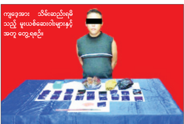
ကျေးရွာအား သိမ်းဆည်းရမိသည့် မူးယစ်ဆေးဝါးများနှင့်အတူ တွေ့ရစဉ်။