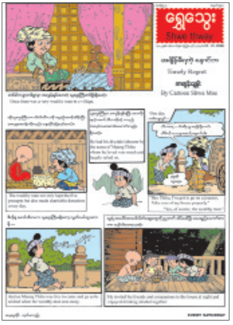
ရွှေသွေး Shwe Dwee အမျိုးသားနှင့် မိန်းမများအတွက် ကဏ္ဍစုံ ပုံနှိပ်ရေးနှင့် ထုတ်ဝေရေးဦးစီးဌာနမှ ထုတ်ဝေခြင်း။

ရန်ကုန် ဒီဇင်ဘာ ၁၁ ပြန်ကြားရေးဝန်ကြီးဌာန ပုံနှိပ်ရေးနှင့် ထုတ်ဝေရေးဦးစီးဌာန စာပေဗိမာန် ရုံးက အပတ်စဉ် စနေနေ့တိုင်း ရွှေသွေးဂျာနယ်ကို ထုတ်ဝေဖြန့်ချိလျက် ရှိသည်။ ဒီဇင်ဘာ ၁၂ ရက် (စနေနေ့)တွင် ထုတ်ဝေမည့် ရွှေသွေးဂျာနယ်တွင် မောင်သီဟသည် မူးယစ်ဆေးဝါးသောက်မိပြီး အပျော်လွန်သွားသည့်အခါ သူ၏ ကျေးဇူးရှင်သူဌေးအပေါ် မကောင်းသောအကြံများ ကြံမိတော့မည့်အကြောင်းကို ရေးဖွဲ့ထားသည့် "အချိန်မီရတဲ့ နောင်တ" မျက်နှာဖုံးကာတွန်း၊ ကိုယ်ခန္ဓာ ကျန်းမာသန်စွမ်းစေရန်နှင့် သင်ယူလေ့လာမှုတို့တွင် ဉာဏ်ရည်ထက်မြက်ဖွံ့ဖြိုးစေရန်အတွက် လိမ္မော်သီးကို ပုံမှန်စားသင့်ကြောင်း ရေးဖွဲ့ထားသည့် "လိမ္မော်သီး" သုတအောင်းပါ။ မိဘများကို ရိုသေလေးစားစွာ ပြုစုလုပ်ကျွေးသင့်ကြောင်း ရေးဖွဲ့ထားသည့် ဆုံးမစာကို ရွှေသွေးတို့ ဗဟုသုတရရှိစေရန်အတွက် တင်ဆက်ထားသည့် "မိခင် ဖခင် ကျေးဇူးရှင်" ဆုံးမစာကဏ္ဍ၊ ကလေးတို့စိတ်ကြိုက် အရောင်များကို ရွေးချယ်ပြီး အရောင်များဖြယ်သန့်ရှင်းရန်အတွက် ရုပ်ပုံနှင့် တင်ဆက်ထားသည့် "ဆေးရောင်လှလှဖြယ်ကြမယ်" ကဏ္ဍ၊ ပတ်ဝန်းကျင် လှပသာယာစေရန်အတွက် မိမိတို့ကိုယ်တိုင် တန်ဖိုးထားထိန်းသိမ်းရမည်ဖြစ်ကြောင်းကို ရေးဖွဲ့ထားသည့် "ပေတိုး" နှစ်မျက်နှာကာတွန်း၊ ဆရာ ဆရာမများအပေါ်တွင် မကောင်းသည့်အပြစ်များ မထားသင့်သည့်အကြောင်းကို ပညာပေးရေးဖွဲ့ထားသည့် "မကောင်းတဲ့အပြစ် မထားတော့ပါ" ကလေးဝတ္ထု၊ ကလေးတို့ပေးပို့သော ကာတွန်းလက်ရာများကို ဖော်ပြပေးထားသည့် "ရွှေသွေးတို့ လက်ရာ" ကဏ္ဍ၊ အင်္ဂလိပ်စာကဏ္ဍ၊ ကဗျာကဏ္ဍစုံလင်စွာဖြင့် ဖတ်စရာ မှတ်စရာများ ပါရှိကြောင်း သိရသည်။