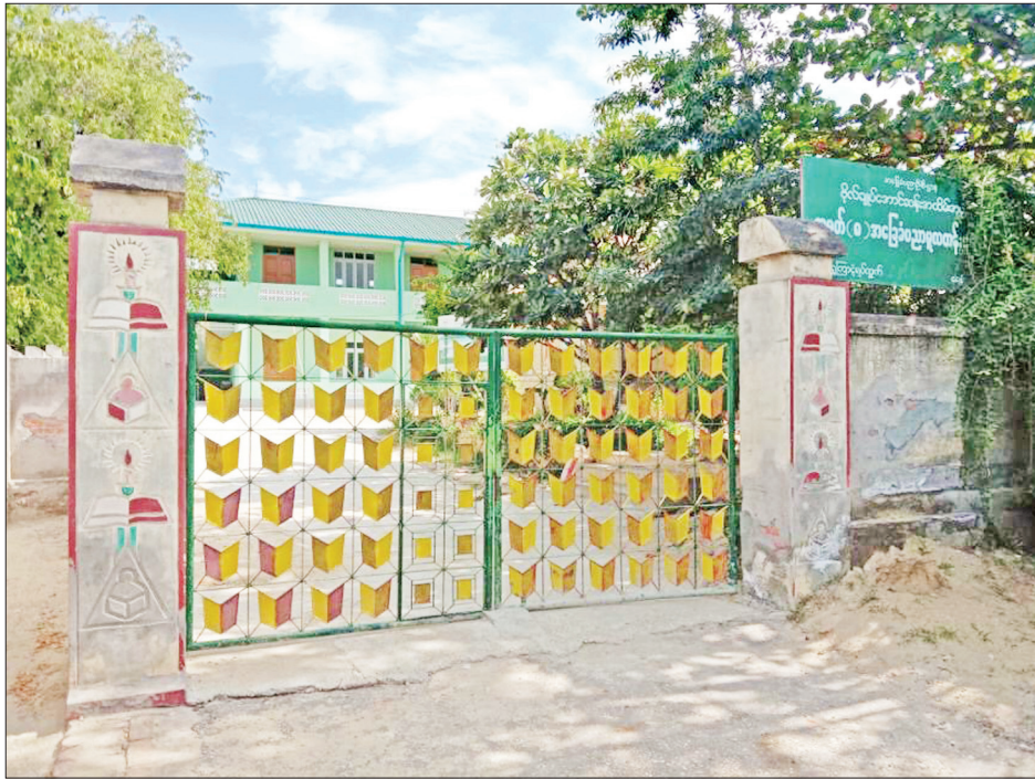
ယနေ့တွေ့မြင်ရသည့်ဗိုလ်ချုပ်ကျောင်း။

ပုဂံ အလောင်းစည်သူမင်းလက်ထက် ရေနံတွေက ချောင်းသဖွယ် စီးဆင်းခဲ့ပြီး သုံးချောင်းငင် လက်ယက် တွင်းမှသည် သံပန်းမျှော်စင်ကြီးတွေ တဝဝေနဲ့ 'မီးမငြိမ်းမြို့တော်' ရယ်လို့ ရာဇဝင်တွင်ခဲ့တဲ့ သမိုင်းဝင် မြို့ ဖြစ်ပါတယ်။