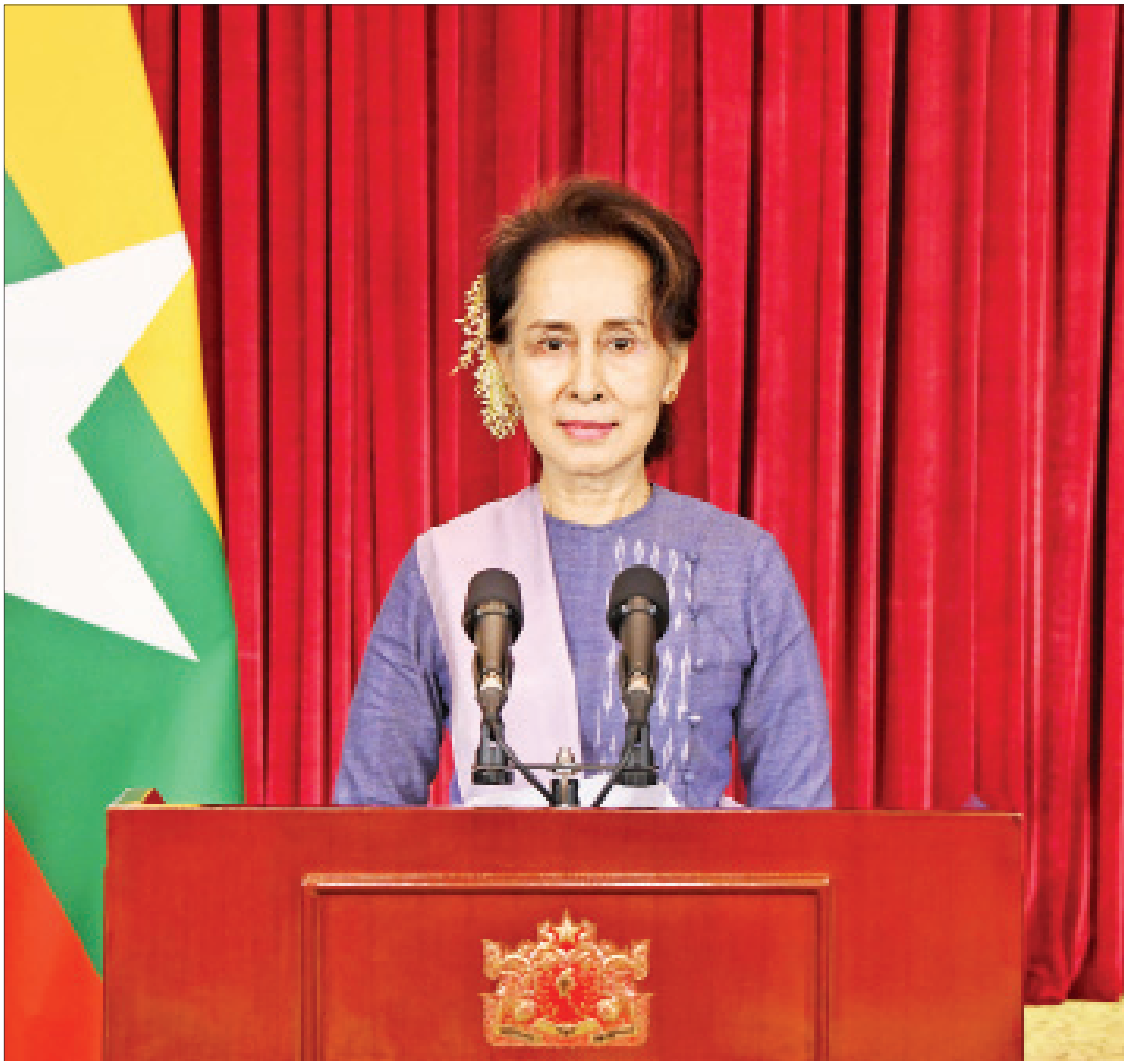
နိုင်ငံတော်၏အတိုင်ပင်ခံပုဂ္ဂိုလ် ဒေါ်အောင်ဆန်းစုကြည် ပြည်သူများသို့ အစီရင်ခံတင်ပြသည့် မိန့်ခွန်းပြောကြားစဉ်။

အခု ကိုဗစ်နောက်ဆုံးအခြေအနေ ပြောရမယ်ဆိုရင် ကိုဗစ်ကို မထိန်းချုပ်နိုင်သေးတဲ့ နေရာတွေကိုလည်း အဓိကထားပြီးတော့ ပြောဖို့လည်းလိုတယ်။ နောက်ပြီးတော့ ကျွန်မတို့ ကာကွယ်ဆေးအစီအစဉ်တွေနဲ့ ပတ်သက်လို့လည်း ပြောဖို့တော့လိုပါတယ်။ ကိုဗစ်ထိန်းချုပ်ရာမှာ အားနည်းနေတဲ့နေရာ အများဆုံးကတော့ ရန်ကုန်ပေါ့။ အဲဒါတော့လည်း ကျွန်မတို့ ရန်ကုန်တိုင်းက ပြည်သူတွေ သိပြီးသားဖြစ်ပါတယ်။ အဲဒါတော့ အထူးသတိထားစေချင်ပါတယ်။ အခုအချိန်မှာဆိုရင် ရာသီဥတုကလည်း အေးလာပြီ။ ရာသီဥတုက အေးလာတဲ့အခါကျတော့ တခြားအေးတဲ့ရာသီနဲ့ ဆောင်းရာသီနဲ့ ပတ်သက်နေတဲ့ ဖြစ်တတ် ဖြစ်လေ့ဖြစ်ထရှိတဲ့ အအေးမိတာလေးတွေ၊ တုပ်ကွေးဖြစ်တာလေးတွေလည်း ရှိနိုင်ပါတယ်။ အဲဒါတော့ ကျွန်မနားလည်သလောက်ကတော့ တုပ်ကွေးဖြစ်နေသူ တစ်ဦးကနေပြီးတော့ ကိုဗစ်ပါကူးမယ်ဆိုရင် အခြေအနေက နည်းနည်းပိုပြီးတော့ ပြင်းထန်နိုင်ပါတယ်။ ဒါကြောင့် အားလုံး အထူးသတိထားဖို့ ဆိုတာကို ကျွန်မတို့ သတိပေးချင်ပါတယ်။ ရန်ကုန်ကနေပြီးတော့ မထိန်းချုပ်နိုင်တာကတော့ ကျွန်မတို့ နိုင်ငံတစ်နိုင်ငံလုံး အတွက် စိန်ခေါ်မှုတစ်ခုပါပဲ။ ဘာဖြစ်လို့လဲ ဆိုတော့ ရန်ကုန်က ကျွန်မတို့ရဲ့ တစ်နည်းအားဖြင့် ပြောရမယ်ဆိုရင် စီးပွားရေး မြို့တော်ဆိုရင်လည်း မမှားပါဘူး။ ဒီတော့ စီးပွားရေးမြို့တော်ကြီးကို ပြန်ပြီးတော့ နာလန် ထူအောင်လုပ်ဖို့ဆိုတာဟာ ကျွန်မတို့ရဲ့ စီးပွားရေးပြန်လည်ထူထောင်ရေးအတွက် အင်မတန်မှ အရေးကြီးပါတယ်ဆိုတာလည်း ကျွန်မက သတိပေးချင်ပါတယ်။ စာမျက်နှာ ၃ ကော်လံ ၁ သို့ ◆