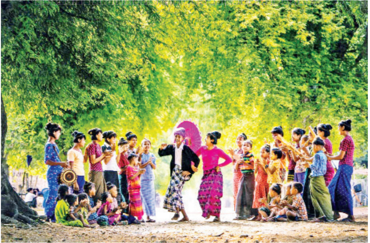
မြန်မာ့ရိုးရာ ဦးရွှေရိုး ဒေါ်ဇိုးအက။

(နိုင်ငံတော်၏အတိုင်ပင်ခံပုဂ္ဂိုလ် ဒေါ်အောင်ဆန်းစုကြည်၏ (၁၅-၁-၂၀၂၀) ရက်နေ့တွင် ကယားပြည်နယ်နေ့အခမ်းအနား၌ ပြောကြားသည့် နှုတ်ခွန်းဆက်စကားမှ ကောက်နုတ်ချက်)