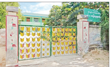
ဆောင်းပါး စာမျက်နှာ » ၆

ဂုဏ်ယူမှန်းဆ ... လွမ်းရပါကြောင်း ရေနံချောင်းမြို့က ... အမျိုးသားကျောင်း