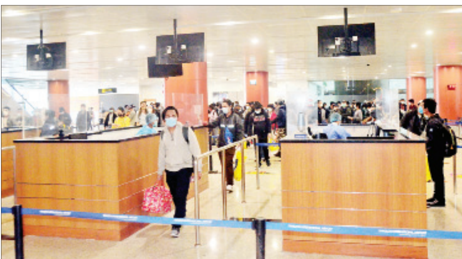
ဘယ်လိုလို့၊ နယ်သာလန်နှင့် အနီးတစ်ဝိုက်ဒေသများမှ မြန်မာနိုင်ငံသားများ ရန်ကုန်အပြည်ပြည်ဆိုင်ရာလေဆိပ်သို့ ပြန်လည်ရောက်ရှိလာစဉ်။

စိစစ်ရေး၊ သီးသန့်စီစဉ်ပေးသည့် နေရာ/သတ်မှတ် ဟိုတယ်များ၌ အသွားအလာကန့်သတ်မှု ခုနစ်ရက်နှင့် နေအိမ်တွင် အသွားအလာကန့်သတ်မှု ခုနစ်ရက် နေထိုင်စေရေးတို့ကို အလုပ်သမား၊ လူဝင်မှုကြီးကြပ်ရေးနှင့် ပြည်သူ့အင်အားဝန်ကြီးဌာန၊ ကျန်းမာရေးနှင့် အားကစားဝန်ကြီးဌာနနှင့် ရန်ကုန်တိုင်းဒေသကြီးအစိုးရအဖွဲ့တို့က သက်ဆိုင်ရာ အခန်းကဏ္ဍအလိုက် တာဝန်ယူဆောင်ရွက်ပေးခဲ့ကြသည်။ ပြည်ပနိုင်ငံများတွင် အခက်အခဲကြုံတွေ့နေရသည့် မြန်မာသင်္ဘောသားများနှင့် မြန်မာနိုင်ငံသားများအား ပြန်လည်ခေါ်ဆောင်ရန် Coronavirus Disease 2019 (COVID-19) ကာကွယ်၊ ထိန်းချုပ်၊ ကုသရေး အမျိုးသားအဆင့် ဗဟိုကော်မတီ၏လမ်းညွှန်ချက်နှင့်အညီ နိုင်ငံခြားရေး ဝန်ကြီးဌာနအနေဖြင့် သက်ဆိုင်ရာဝန်ကြီးဌာနများ၊ သက်ဆိုင်ရာနိုင်ငံများရှိ မြန်မာသံရုံးများ၊ သင်္ဘောကုမ္ပဏီများ၊ အဖွဲ့အစည်းများနှင့် ပူးပေါင်းညှိနှိုင်းဆောင်ရွက်ပေးလျက်ရှိကြောင်း သိရသည်။ သတင်းစဉ်