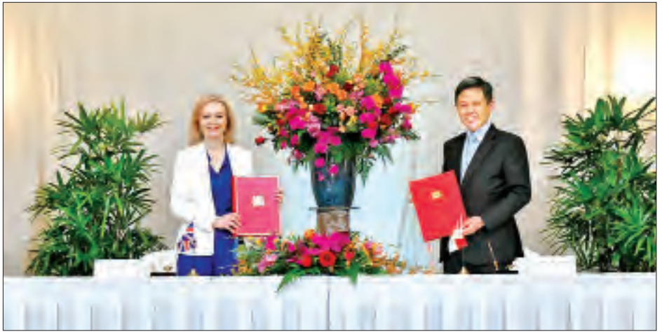
နိုင်ငံတကာ ကုန်သွယ်ရေးဆိုင်ရာ မြိတ်နီနိုင်ငံခြားရေးဝန်ကြီး လစ်ထရက်စ်နှင့် စင်ကာပူကုန်သွယ်ရေးဝန်ကြီး ချန်ချူးဆင်းတို့ နှစ်နိုင်ငံအကြား လွတ်လပ်သောကုန်သွယ်ရေးစာချုပ်ကို လက်မှတ်ရေးထိုးစဉ်။

ကိုးကား - ဘီဘီစီ၊ ဘာသာပြန် - အောင်ကျော်ကျော်