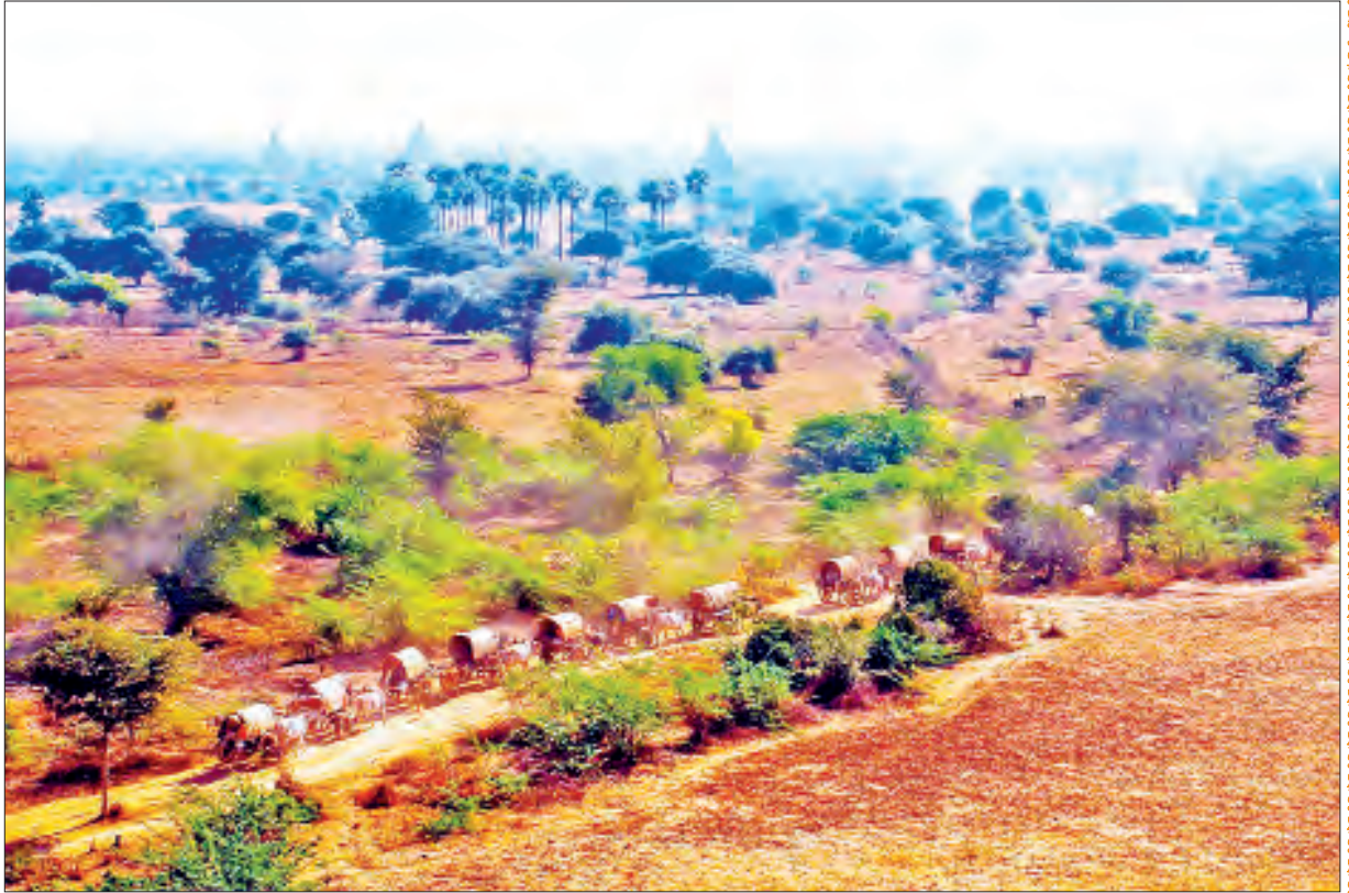
ပုဂံရှေးဟောင်းယဉ်ကျေးမှုနယ်မြေရှုခင်း။

(နိုင်ငံတော်သမ္မတ ဦးဝင်းမြင့်၏ ၄-၁-၂၀၂၀ ရက်နေ့တွင် (၇၂)နှစ်မြောက် လွတ်လပ်ရေးနေ့ အထိမ်းအမှတ် အခမ်းအနားသို့ ပေးပို့သည့် သဝဏ်လွှာမှ ကောက်နုတ်ချက်)