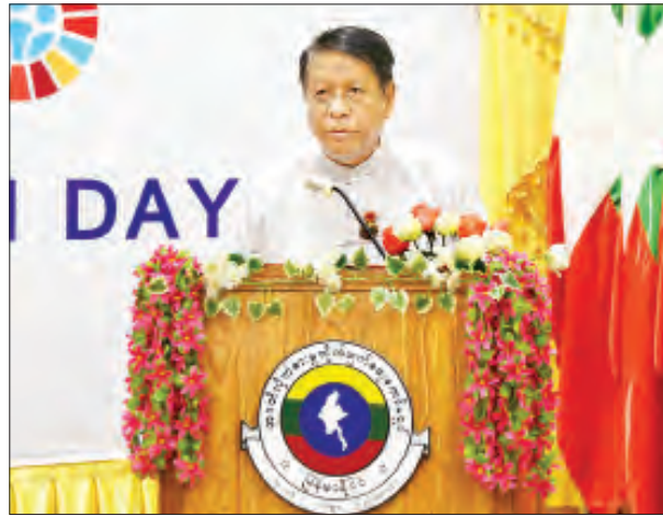
အဂတိလိုက်စားမှုတိုက်ဖျက်ရေးကော်မရှင် ခေတ္တဥက္ကဋ္ဌ ဦးစန်းဝင်း ရှင်းလင်းတင်ပြစဉ်။

★ ရှေ့ဖူးမှ အခမ်းအနားတွင် နိုင်ငံတော်သမ္မတ ဦးဝင်းမြင့်က မိန့်ခွန်းပြောကြားသည်။ (နိုင်ငံတော်သမ္မတ ဦးဝင်းမြင့်၏ မိန့်ခွန်းကို စာမျက်နှာ ၃ တွင် ဖော်ပြထားပါသည်။) ယင်းနောက် ပြည်ထောင်စုလွှတ်တော်နာယက၊ ပြည်သူ့လွှတ်တော်ဥက္ကဋ္ဌ ဦးတီခွန်မြတ်က အမှာစကားပြောကြားသည်။ (ပြည်ထောင်စုလွှတ်တော်နာယက ဦးတီခွန်မြတ်၏ အမှာစကားကို သီးခြားဖော်ပြထားပါသည်။) ဆက်လက်၍ ပြည်ထောင်စုတရားသူကြီးချုပ် ဦးထွန်းထွန်းဦးက အမှာစကားပြောကြားသည်။ (ပြည်ထောင်စုတရားသူကြီးချုပ် ဦးထွန်းထွန်းဦး၏ အမှာစကားကို စာမျက်နှာ ၅ တွင် ဖော်ပြထားပါသည်။) ထို့နောက် အဂတိလိုက်စားမှုတိုက်ဖျက်ရေးကော်မရှင် ခေတ္တဥက္ကဋ္ဌ ဦးစန်းဝင်းက အဂတိလိုက်စားမှုတိုက်ဖျက်ရေးလုပ်ငန်းများ အကောင်အထည်ဖော် ဆောင်ရွက်နေမှုကို ရှင်းလင်းတင်ပြရာတွင် အဂတိလိုက်စားမှုတိုက်ဖျက်ရေး မဟာဗျူဟာစီမံချက် (၂၀၁၅-၂၀၂၁)အပေါ် ပြီးခဲ့သည့် (၃)နှစ်တာ ဆောင်ရွက်ချက်များအရ (၈၅)ရာခိုင်နှုန်းခန့် အကောင်အထည်ဖော် ဆောင်ရွက်နိုင်ခဲ့ပါကြောင်း၊ ကော်မရှင်အနေဖြင့် အပြည်ပြည်ဆိုင်ရာနှင့် ဒေသတွင်းပူးပေါင်းဆောင်ရွက်မှုဖြင့်တင်ရန် အပြည်ပြည်ဆိုင်ရာ အဂတိလိုက်စားမှုတိုက်ဖျက်ရေး အကယ်ဒမီ (IACA)တွင် ၂၀၁၉ ခုနှစ် နှစ်ကုန်က အဖွဲ့ဝင်အဖြစ် ပါဝင်နိုင်ခဲ့ပြီး ၂၀၂၀ ပြည့်နှစ် အောက်တိုဘာလတွင် အိန္ဒိယနိုင်ငံ အဂတိလိုက်စားမှုတိုက်ဖျက်ရေး အကယ်ဒမီနှင့် နားလည်မှုစာချွန်လွှာ လက်မှတ်ရေးထိုးနိုင်ခဲ့ပါကြောင်း။ လုပ်ငန်းလမ်းညွှန်များ ချမှတ်ပေး အဂတိလိုက်စားမှုများကို ထိရောက်စွာ လျော့ချနိုင်ရန်အတွက် အဂတိလိုက်စားမှု တားဆီးကာကွယ်ရေးအဖွဲ့များ ဖွဲ့စည်းရေး ရှေ့ပြေးစီမံကိန်းကို ၂၀၁၈ ခုနှစ်တွင် စတင်ခဲ့ချိန်က ပြည်ထောင်စုဝန်ကြီးဌာန (၁၄) ခုတွင် ဖွဲ့စည်းခဲ့သော်လည်း ယခုအခါ ပြည်ထောင်စုအဆင့် ဝန်ကြီးဌာန/ အဖွဲ့အစည်း စုစုပေါင်း