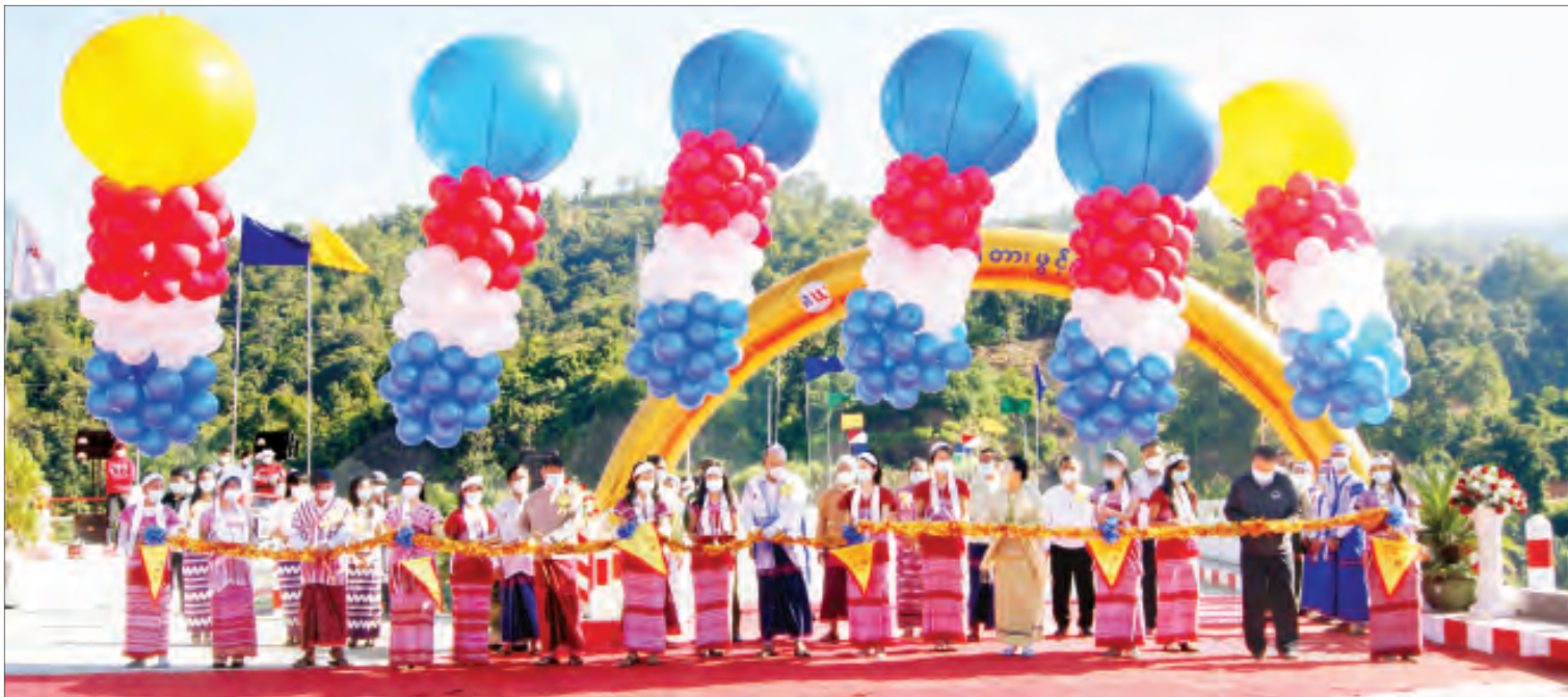
အမျိုးသားလွတ်တော်ဥက္ကဋ္ဌ မန်းဝင်းခိုင်သန်း၊ ကရင်ပြည်နယ်ဝန်ကြီးချုပ် ဒေါ်နန်းခင်ထွေးမြင့်၊ ပြည်နယ်လျှပ်စစ်နှင့်စက်မှုဝန်ကြီးဦးစိုးလှိုင်နှင့် တာဝန်ရှိသူများက ပလက်ဝတ်တားအား ဖွင့်ပွဲဖွင့်လှစ်ပေးကြစဉ်။

သံတောင်ကြီး ဒီဇင်ဘာ ၁၀ ကရင်ပြည်နယ် ဘားအံခရိုင် သံတောင်ကြီး မြို့နယ် ဘောဂလီမြို့ ပြောင်သိုကျေးရွာအုပ်စုရှိ ပလက်ဝတ်တားဖွင့်ပွဲကို ယနေ့နံနက် ၉ နာရီခွဲက ကျင်းပရာ အမျိုးသားလွတ်တော် ဥက္ကဋ္ဌ မန်းဝင်းခိုင်သန်း တက်ရောက်ဖွင့်လှစ် ပေးသည်။