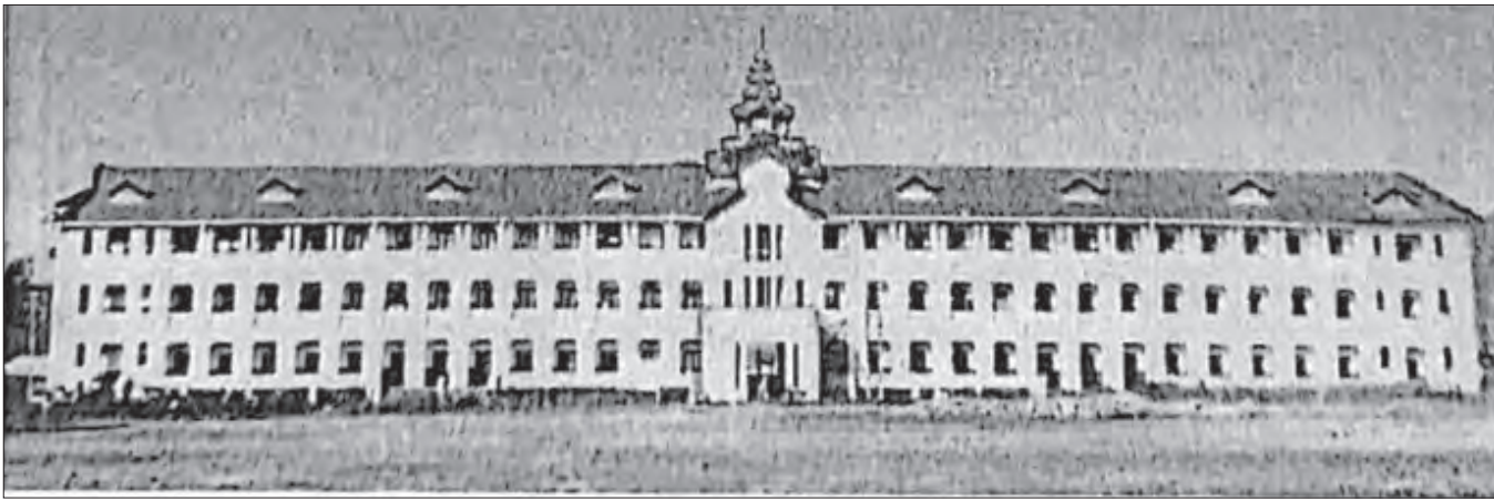
မြို့မအမျိုးသားကျောင်း အဆောက်အအုံ။