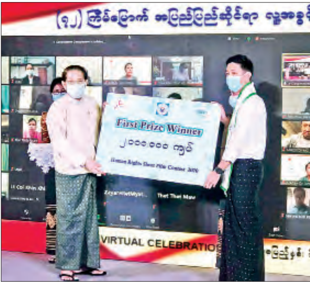
မြန်မာ (Alliance Myanmar) တို့ ပူးပေါင်းကျင်းပသည့် ရုပ်ရှင်ဇာတ်လမ်းတိုပြိုင်ပွဲ ဆုရရှိသူများကို ကြေညာပြီး မဟာမိတ်မြန်မာတာဝန်ရှိသူများက ဆုများ အသီးသီးပေးအပ်ချီးမြှင့်ခဲ့သည်။

ထို့နောက် မြန်မာနိုင်ငံအမျိုးသားလူ့အခွင့်အရေးကော်မရှင်နှင့် မဟာမိတ်