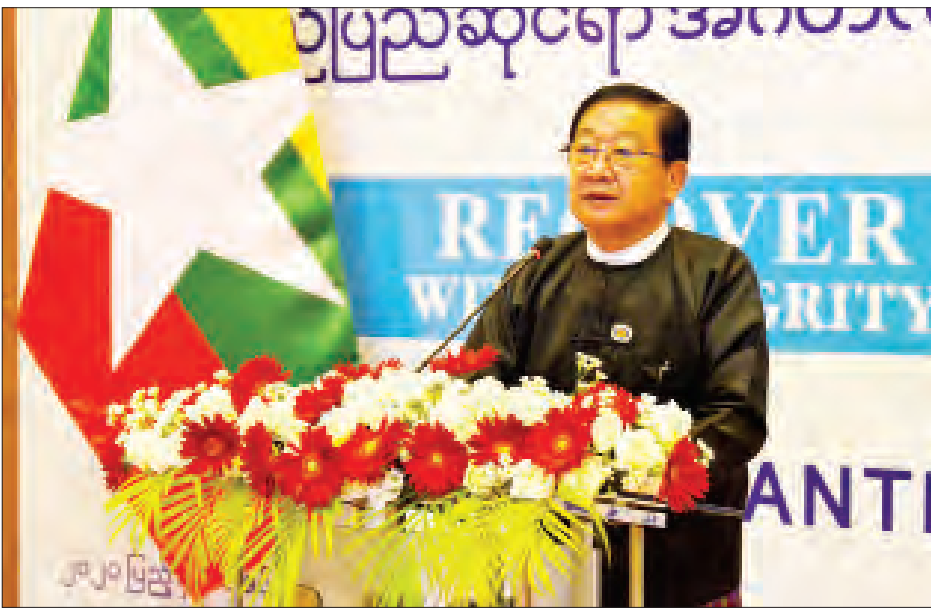
ပြည်ထောင်စုလွှတ်တော်နာယက ဦးတီခွန်မြတ် အပြည်ပြည်ဆိုင်ရာ အဂတိလိုက်စားမှုတိုက်ဖျက်ရေးနေ့ အထိမ်းအမှတ် အခမ်းအနားတွင် အမှာစကားပြောကြားစဉ်။

ဒါကြောင့် မိမိတို့ပြည်ထောင်စုလွှတ်တော်အနေဖြင့် အဂတိလိုက်စားမှုတိုက်ဖျက်ရေးဥပဒေကို ၂၀၁၃ ခုနှစ်၊ ဩဂုတ်လ ၇ ရက်တွင် အတည်ပြုပြဋ္ဌာန်းပေးခဲ့ပြီး ၂၀၁၄ ခုနှစ်၊ ဖေဖော်ဝါရီလ ၂၅ ရက်မှာ အဂတိလိုက်စားမှုတိုက်ဖျက်ရေးကော်မရှင် ဖွဲ့စည်းခြင်းကိုလည်း ပြည်ထောင်စုလွှတ်တော်က သဘောတူ အတည်ပြုပေးနိုင်ခဲ့ပါတယ်။ အဂတိလိုက်စားမှု တိုက်ဖျက်ရေးလုပ်ငန်းများ တိုးမြှင့်ဆောင်ရွက်ရာမှာ ပိုမိုထိရောက်ပြီး ကျယ်ကျယ်ပြန့်ပြန့် လုပ်ဆောင်နိုင်စေရေးအတွက် အဂတိလိုက်စားမှုတိုက်ဖျက်ရေးဥပဒေကို ပြင်ဆင်သည့် ဥပဒေများကို စတုတ္ထအကြိမ်အထိ လွှတ်တော်က အတည်ပြုပြဋ္ဌာန်းပေးနိုင်ခဲ့ပါတယ်။ ဒီလို ဥပဒေကို ပြင်ဆင်ပြဋ္ဌာန်းပေးနိုင်ခဲ့တဲ့အတွက် ကော်မရှင်ဟာ တံစိုးလက်ဆောင် ယူသူရော၊ ပေးသူပါ မည်သူမဆိုကို အရေးယူနိုင်ခြင်း၊ ပြည်သူ့