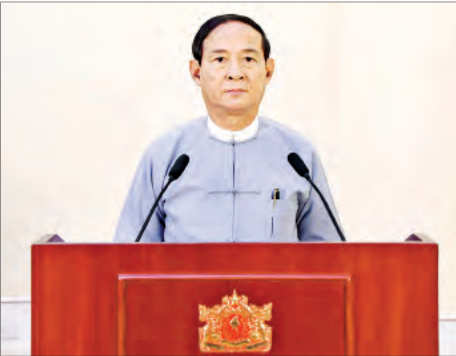
နိုင်ငံတော်သမ္မတ ဦးဝင်းမြင့် အပြည်ပြည်ဆိုင်ရာ အဂတိလိုက်စားမှုတိုက်ဖျက်ရေးနေ့ အထိမ်းအမှတ် အခမ်းအနားတွင် မိန့်ခွန်းပြောကြားစဉ်။

ဒီဇင်ဘာလ(၉)ရက်နေ့မှာ ကျရောက်တဲ့ အပြည်ပြည်ဆိုင်ရာ အဂတိလိုက်စားမှုတိုက်ဖျက်ရေးနေ့ အထိမ်းအမှတ်အခမ်းအနား အခမ်းအနားကို Virtual Format မှ တစ်ဆင့် တက်ရောက်ကြတဲ့ ပြည်ထောင်စုလွှတ်တော် နာယက၊ ပြည်သူ့လွှတ်တော်နဲ့ အမျိုးသားလွှတ်တော် ဥက္ကဋ္ဌများ၊ ပြည်ထောင်စုတရားသူကြီးချုပ်၊ ပြည်ထောင်စုဝန်ကြီးများ၊ နေပြည်တော်ကောင်စီဥက္ကဋ္ဌ၊ အဂတိလိုက်စားမှုတိုက်ဖျက်ရေးကော်မရှင်ဥက္ကဋ္ဌ၊ တိုင်းဒေသကြီးနဲ့ ပြည်နယ်ဝန်ကြီးချုပ်များ၊ အဂတိလိုက်စားမှုတိုက်ဖျက်ရေးကော်မရှင်အတွင်းရေးမှူးနဲ့ အဖွဲ့ဝင်များ၊ UNODC နှင့် UNDP တို့မှ တာဝန်ရှိပုဂ္ဂိုလ်များ၊ ဖိတ်ကြားထားတဲ့ ဧည့်သည်တော်များအားလုံး မင်္ဂလာအပေါင်းနဲ့ ပြည့်စုံကြပါစေကြောင်း ဆုမွန်ကောင်းတောင်းလျက် နှုတ်ခွန်း ဆက်သအပ်ပါတယ်။