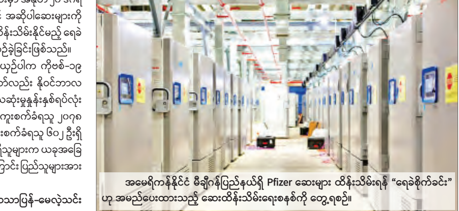
အမေရိကန်နိုင်ငံ မီချီဂန်ပြည်နယ်ရှိ Pfizer ဆေးများ ထိန်းသိမ်းရန် “ရေခဲစိုက်ခင်း” ဟု အမည်ပေးထားသည့် ဆေးထိန်းသိမ်းရေးစနစ်ကို တွေ့ရစဉ်။

၇၅ ဒီဂရီစင်တီဂရိတ်နှင့် Moderna ကာကွယ်ဆေးမှာ အနုတ် ၂၀ ဒီဂရီ စင်တီဂရိတ်တွင် ထားသို့ရမည်ဖြစ်သောကြောင့် အဆိုပါဆေးများကို ထိန်းသိမ်းရေးအတွက် အအေးဓာတ်မြင့်မားစွာထိန်းသိမ်းနိုင်မည့် ရေခဲ သေတ္တာအလုံး ၁၀၀၀၀ ကျော်ကို ဝယ်ယူရန် စီစဉ်ခဲ့ခြင်းဖြစ်သည်။ ဂျပန်နိုင်ငံမှာ အနောက်နိုင်ငံများနှင့် နှိုင်းယှဉ်ပါက ကိုဗစ်-၁၉ ရောဂါကူးစက်မှုနှုန်း မြင့်မားသည်ဟု မဆိုနိုင်သော်လည်း နိုဝင်ဘာလ နှောင်းပိုင်းကတည်းက ကူးစက်မှုနှုန်းနှင့် သေဆုံးမှုနှုန်းနှစ်ရပ်လုံး မြင့်မားလာခဲ့ကာ လွန်ခဲ့သည့် ၂၄ နာရီအတွင်း ကူးစက်ခံရသူ ၂၀၇၈ ဦးရှိပြီး မြို့တော်တိုကျိုတစ်မြို့တည်းမှာပင် ကူးစက်ခံရသူ ၆၀၂ ဦးရှိ ကြောင်း သိရသည်။ ကျန်းမာရေးဌာနမှ တာဝန်ရှိသူများက ယခုအခြေ အနေမှာ အထူးသတိပြုရမည့်အနေအထားဖြစ်ကြောင်း ပြည်သူများအား သတိပေးထားသည်။ ကိုးကား-ဖရီးမလေးရှားတူဒေ၊ ဘာသာပြန်-မေလွဲသင်း