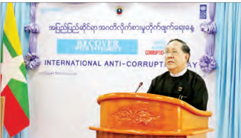
ပြည်ထောင်စုတရားသူကြီးချုပ် ဦးထွန်းထွန်းဦး အပြည်ပြည်ဆိုင်ရာ အဂတိလိုက်စားမှုတိုက်ဖျက်ရေးနေ့ အထိမ်းအမှတ်အခမ်းအနားတွင် အမှာစကား ပြောကြားစဉ်။

ယနေ့ကျင်းပပြုလုပ်တဲ့ အပြည်ပြည်ဆိုင်ရာ အဂတိလိုက်စားမှုတိုက်ဖျက်ရေးနေ့ အထိမ်းအမှတ်အခမ်းအနားကို တက်ရောက်လာကြတဲ့ နိုင်ငံတော်သမ္မတကြီးနဲ့ ပြည်ထောင်စုလွှတ်တော် နာယက၊ ပြည်ထောင်စုဝန်ကြီးများ၊ ပြည်ထောင်စုရှေ့နေချုပ်၊ ပြည်ထောင်စုစာရင်းစစ်ချုပ်၊ တိုင်းဒေသကြီး/ပြည်နယ်ဝန်ကြီးချုပ်များ၊ အဂတိလိုက်စားမှုတိုက်ဖျက်ရေးကော်မရှင် ခေတ္တဥက္ကဋ္ဌနှင့် အဖွဲ့ဝင်များ၊ အစိုးရဌာန/အဖွဲ့အစည်းများမှ တာဝန်ရှိပုဂ္ဂိုလ်များ၊ မြန်မာနိုင်ငံဆိုင်ရာ ကုလသမဂ္ဂဌာန ညွှန်ကြားရေးမှူး၊ UNDP နှင့် UNODC တို့မှ တာဝန်ရှိပုဂ္ဂိုလ်များ၊ အဂတိလိုက်စားမှုတိုက်ဖျက်ရေးလုပ်ငန်း ဆောင်ရွက်လျက်ရှိသည့် အစိုးရမဟုတ်သော အဖွဲ့အစည်းများ၊ ပုဂ္ဂလိကကဏ္ဍနှင့် အရပ်ဘက်လူမှုအဖွဲ့အစည်းများမှ ကိုယ်စားလှယ်များအားလုံး ကိုယ်စိတ်နှစ်ဖြာ ချမ်းသာသုခနဲ့ ပြည့်စုံကြပါစေကြောင်း ဆုမွန်ကောင်းတောင်းရင်း နှုတ်ခွန်းဆက်သ အပ်ပါတယ်။