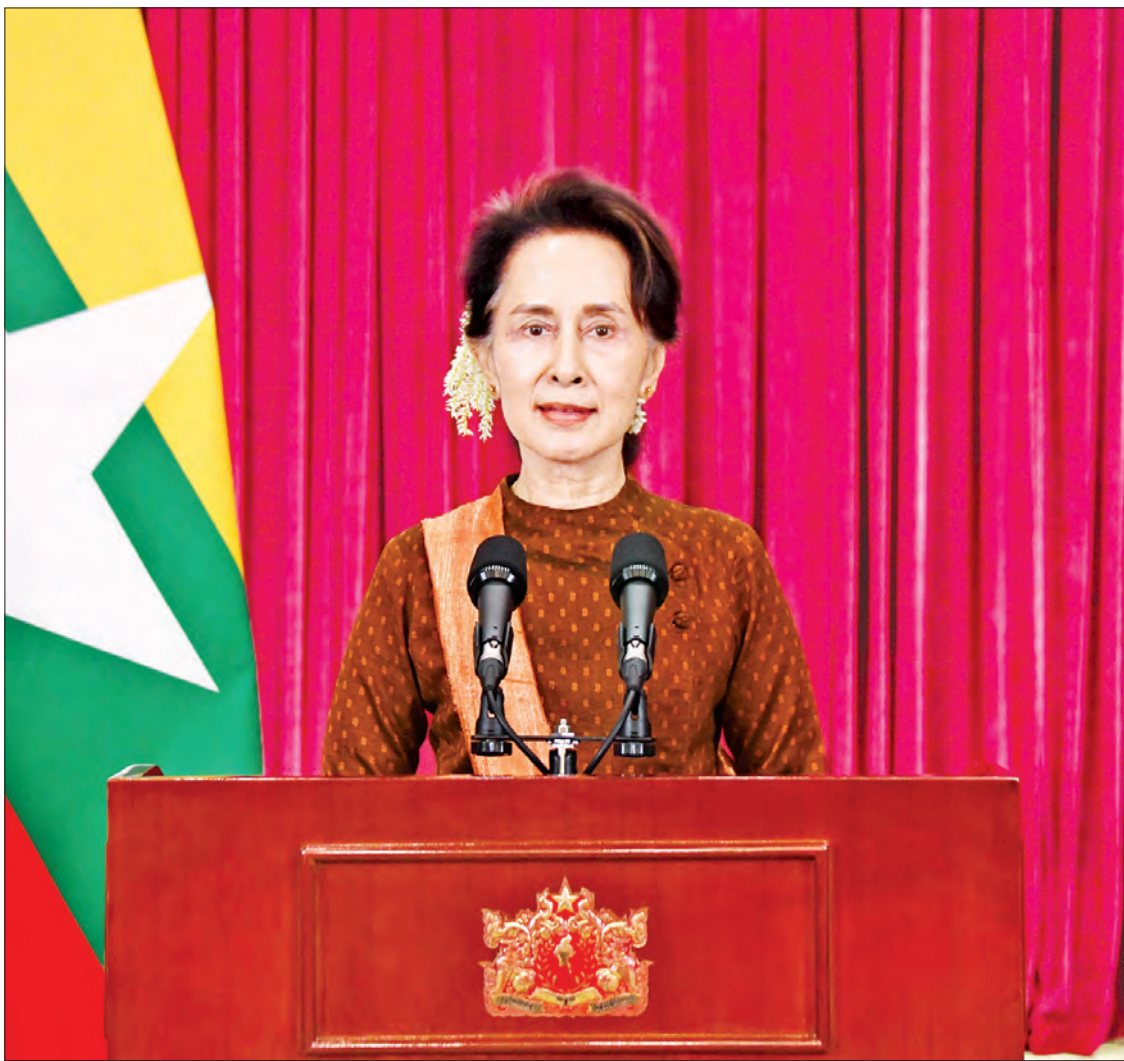
နိုင်ငံတော်၏အတိုင်ပင်ခံပုဂ္ဂိုလ် ဒေါ်အောင်ဆန်းစုကြည် ပြည်သူများသို့ အစီရင်ခံတင်ပြသည့် မိန့်ခွန်းပြောကြားစဉ်။

ရန်ကုန်တိုင်းက လူဦးရေ ထူထပ်မှု ကြောင့်ရော၊ အသွားအလာများတာကြောင့် ရော ရောဂါပြန့်ပွားတာတွေလည်း များတယ်ဆိုတာ ကျွန်မတို့လက်ခံပါတယ်။ ဒါပေမယ့်လည်း ပြည်သူလူထုရဲ့ စည်းကမ်း လိုက်နာမှုဟာလည်း အရေးပါပါတယ်။ ပြည်သူလူထုက စည်းကမ်းလိုက်နာမှု များလေလေ၊ ကောင်းလေလေ၊ အခြေအနေ က ကောင်းမှာပါ။ ဥပမာဆိုရင် မန္တလေးတိုင်း မှာဆိုရင်လည်း ကိုဗစ်ရောဂါဖြစ်ပွားမှုဟာ အရင်တစ်လလောက်က နည်းနည်းတက် လာတဲ့ အခြေအနေရှိပါတယ်။ သို့သော် ငြားလည်း ပြည်သူလူထုရဲ့ ပူးပေါင်း ဆောင်ရွက်မှုကြောင့် အရင် ၁၄ ရက် လောက်အတွင်းမှာဆိုရင် အခြေအနေက ပိုကောင်းလာပါတယ်။ ထိန်းထားနိုင်တဲ့ အဆင့်ကို ရောက်ပြီလို့ ပြောလို့ရပါတယ်။ အဲဒီတော့ တိုင်းတိုင်း၊ ပြည်နယ်တိုင်းမှာ လည်း ဒီလိုပဲ သက်ဆိုင်ရာအစိုးရများက စာမျက်နှာ ၃ ကော်လံ ၁ သို့ ✨