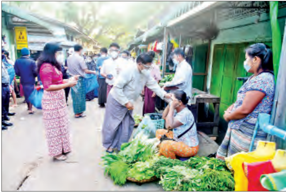
သန်လျင်မြို့မဈေးကြီးအတွင်း Mask နှင့် Face shield တပ်ဆင်ရေး လူထုလှုပ်ရှားမှုပြုလုပ်နေသည်ကို တွေ့ရစဉ်။

များပြားလှသော ကိုဗစ်-၁၉ ရောဂါ ကာကွယ်ရေး ပစ္စည်းများကို သယ်ယူကုသသည့် လက်ကမ်းစာစောင် ဝေသူကဝေ၊ Mask တပ်ပါ၊ Face shield တပ်ပါ၊ လက်ဆေးပါ၊ ပြောသူကပြော၊ Mask နှင့် Face shield တပ်မထားသူများအား ကိုယ်တိုင်တပ်ဆင်ပေးသူက ပေးဖြင့် တက်တက်ကြွကြွ လုပ်ဆောင်နေသည့် လှုပ်ရှားသက်ဝင်နေသည့် မြင်ကွင်း။