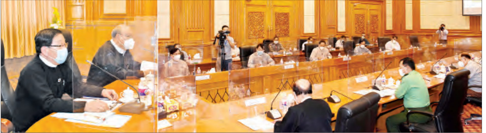
ပြည်ထောင်စုလွှတ်တော်နာယက၊ ပြည်သူ့လွှတ်တော်ဥက္ကဋ္ဌ ဦးတီခွန်မြတ် လွှတ်တော်အစည်းအဝေးများကျင်းပရေး ဗဟိုကော်မတီနှင့် လုပ်ငန်းကော်မတီများ၏ လုပ်ငန်းညှိနှိုင်းအစည်းအဝေးတွင် အမှာစကားပြောကြားစဉ်။