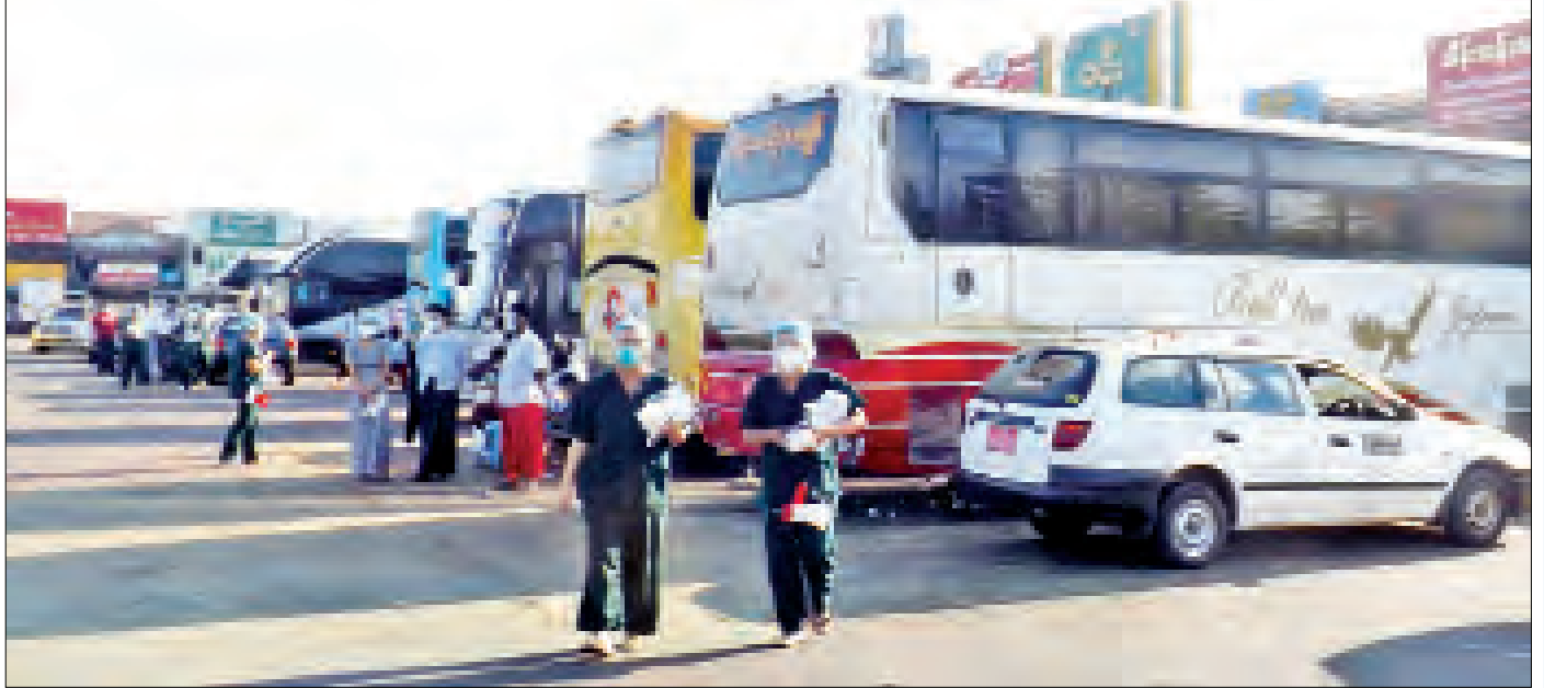
အောင်မင်္ဂလာအဝေးပြေးကားခင်းအတွင်း Mask နှင့် Face shield တပ်ဆင်ရေး လူထုလှုပ်ရှားမှုပြုလုပ်နေသည်ကို တွေ့ရစဉ်။