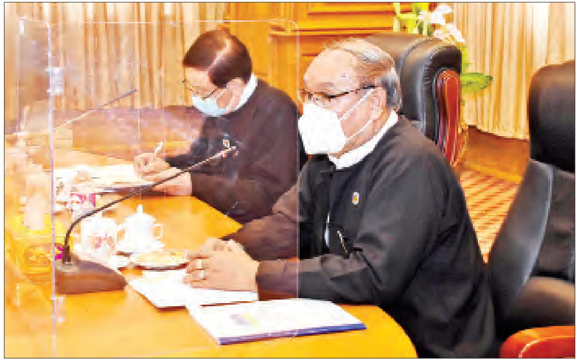
အမျိုးသားလွတ်တော်ဥက္ကဋ္ဌ မန်းဝင်းခိုင်သန်း လွတ်တော်အစည်းအဝေးကျင်းပရေး ဗဟိုကော်မတီနှင့် လုပ်ငန်းကော်မတီများ၏ လုပ်ငန်းညှိနှိုင်းအစည်းအဝေးတွင် အမှာစကားပြောကြားစဉ်။

ဆက်လက်၍ ဗဟိုကော်မတီ နာယက အမျိုးသားလွတ်တော်ဥက္ကဋ္ဌ မန်းဝင်းခိုင်သန်း က ယခင်လွတ်တော် ပုံမှန်အစည်းအဝေးများ နည်းတူ ကိုဗစ်-၁၉ ကပ်ရောဂါ ကူးစက်ဖြစ်ပွား မှု အန္တရာယ်ကာကွယ်ထိန်းချုပ်ရေးကာလ အတွင်း တတိယအကြိမ် လွတ်တော်ပုံမှန် အစည်းအဝေးများ အောင်မြင်စွာ ကျင်းပ ပြုလုပ်နိုင်ရေးအတွက် သက်ဆိုင်ရာလုပ်ငန်း ကော်မတီများက ရိုင်းဝန်းပူးပေါင်း၍ အကြံပြု ဆွေးနွေးပေးကြစေလိုကြောင်း ပြောကြား သည်။ ဖြည့်စွက်ဆွေးနွေး ယင်းနောက် အစည်းအဝေးသို့ တက်ရောက် လာကြသည့် သက်ဆိုင်ရာ လုပ်ငန်းကော်မတီ ဥက္ကဋ္ဌ ပြည်ထောင်စုဝန်ကြီးများနှင့် တာဝန် ရှိသူများက လုပ်ငန်းကော်မတီအလိုက် စီမံ ဆောင်ရွက်ထားရှိမှု အခြေအနေများကို ရှင်းလင်းတင်ပြကြပြီး ပြည်ထောင်စု လွတ်တော်နာယက က လုပ်ငန်းကော်မတီ များ၏ ဆွေးနွေးတင်ပြချက်များအပေါ် ဖြည့်စွက်ဆွေးနွေး၍ နိဂုံးချုပ်အမှာစကား ပြောကြားပြီး အစည်းအဝေးကို ရပ်သိမ်း လိုက်သည်။ အစည်းအဝေးသို့ ပြည်ထောင်စုလွတ်တော် ဒုတိယနာယက ဦးထွန်းအောင်(ခ) ဦးထွန်းထွန်းဟိန်၊ အမျိုးသားလွတ်တော်