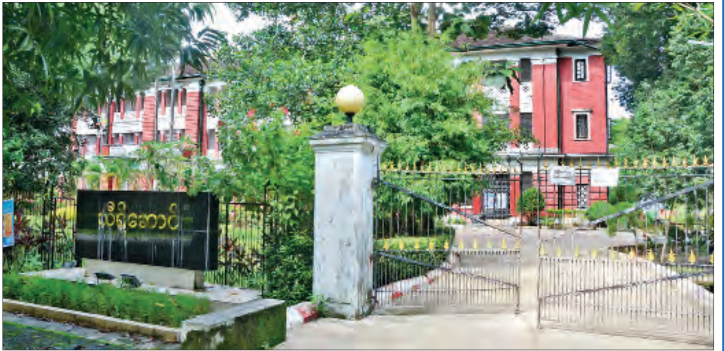
ရန်ကုန်တက္ကသိုလ်ကျောင်းသူများ ကွန်းခိုရာ သီရိဆောင်။

ဧရာဝတီတိုင်း၏ မြို့တော် ပုသိမ်မြို့၏ ကျက်သရေ ဆောင်ကောလိပ်ဖြစ်သဖြင့် ကျွန်ုပ်တို့ အဆောင်နေ ကျောင်းသား ကျောင်းသူများအတွက် ဆန်ကိုအညှစ်စား မဟုတ်ဘဲ တိုင်းဂုဏ်ဆောင် ပုသိမ်ဆန်ဖြင့် ကျွေးမွေး ခဲ့ပါသည်။ ထိုစဉ်ကာလ Hostel Fee မှာ တစ်လ ၅၇ ကျပ် ဖြစ်ပါသည်။ ကျောင်းလခမှာ တစ်လ ၁၅ ကျပ်ဖြစ်ပြီး