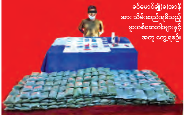
ခင်မောင်ချို(ခ)အာနီ အား သိမ်းဆည်းရမိသည့် မူးယစ်ဆေးဝါးများနှင့် အတူ တွေ့ရစဉ်။