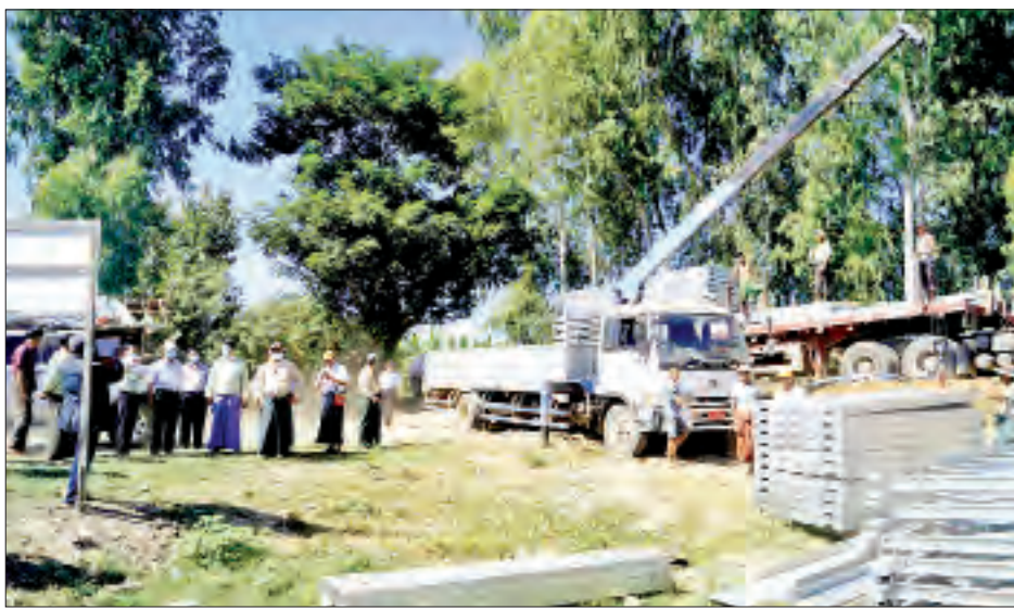
အောင် ဆက်လက်ဆောင်ရွက်မည့်လုပ်ငန်းများကို ရှင်းလင်းတင်ပြရာ တိုင်းဒေသကြီးဝန်ကြီးချုပ်က ကျေးလက်နေပြည်သူများ အဆင်ပြေစွာဖြတ်သန်းသွားလာနိုင်ရေးအတွက် လုပ်ငန်းအရည်အသွေး ပြည့်စုံအောင် ကြိုးပမ်းဆောင်ရွက်သွားကြရန် ဆွေးနွေးမှာကြားသည်။

ပွင့်ဖြူ ဒီဇင်ဘာ ၆ မကွေးတိုင်းဒေသကြီးဝန်ကြီးချုပ် ဒေါက်တာအောင်မိုးညို သည် တိုင်းဒေသကြီး/ခရိုင်နှင့် မြို့နယ်အဆင့် ဌာနဆိုင်ရာ တာဝန်ရှိသူများလိုက်ပါ၍ ယနေ့မုန်းတည့် ၁၂ နာရီက ပွင့်ဖြူမြို့နယ် မုန်းလဲကျေးရွာတွင် ကျေးရွာအုပ်ချုပ်ရေးမှူးရုံး ဆောက်လုပ်နေမှုနှင့် ဒေသခံကျေးလက်နေပြည်သူများ မြို့ပြနှင့်ကျေးလက် ရာသီမရွေး အဆင်ပြေစွာသွားလာနိုင်ရေးအတွက် ပွင့်ဖြူမြို့- မုန်းလဲကျေးရွာ ရေကျော်ချောင်းကူးတံတား တည်ဆောက်နေမှု တို့ကို ကွင်းဆင်းကြည့်ရှုစစ်ဆေးခဲ့ကြောင်း သိရသည်။