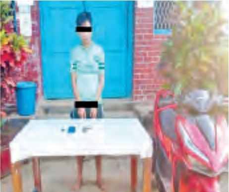
သိမ်းဆည်းရမိသည့် စိတ်ကြွရူးသွပ်ဆေးပြားများ၊ လက်နက်ခဲယမ်းများနှင့် ဖမ်းဆီးရမိသူများကို တွေ့ရစဉ်။