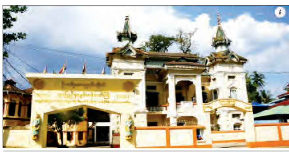
ရန်ကုန်မြို့ ဗဟန်းမြို့နယ်ရှိ ဦးအရိယကျောင်းတိုက်။

အလားတူ ရုပ်မြင်သံကြားအစီအစဉ်များမှ ရာပြည့် အထိမ်းအမှတ်သီချင်းများ ထုတ်လွှင့်ပြသခြင်း၊ ကျောင်းတော်ကြီး၏သမိုင်းကြောင်းများ ထုတ်လွှင့်ပြသခြင်းတို့ကိုလည်း ကြည့်ရှုခံစားခဲ့ရပါသည်။ ရန်ကုန်တက္ကသိုလ်အောင်ပွဲနှင့် ဒွန်တွဲပါလာသည့် ဒုတိယအောင်ပွဲ ထိုရန်ကုန်တက္ကသိုလ် ရာပြည့်သဘင်ကြီးနှင့် တစ်ဆက်တည်း ကပ်လျက်ဒွန်တွဲပါလာသည့် ရာပြည့် အခမ်းအနားကြီးတစ်ခုကလည်း အသင့်စောင့်ကြိုလျက် ရှိနေသေးသည်။ ထိုရာပြည့်နေ့ အထိမ်းအမှတ်အခမ်းအနားကြီးသည်လည်း ယခုကျင်းပပြီးစီးသွားသည့် ရန်ကုန်တက္ကသိုလ်ကြီး မဖြစ်ပေါ်မီ မပေါ်ပေါက်မီကတည်းက အတူယှဉ်တွဲကာ သန္ဓေတည်မြစ်ဖျားခံခဲ့ရသည်ဟုလည်း ဆို၍ရသည်။ ဆိုလိုရင်းမှာ ရန်ကုန်တက္ကသိုလ်ကြီး ပေါ်ပေါက်ရန် ကြိုးစားခဲ့ကြပြီး စတင်ဖွင့်လှစ်နိုင်ခဲ့ခြင်းသည် ပထမအဆင့်အောင်ပွဲဖြစ်ကာ နောက်ထပ်မံ၍ ထိုတက္ကသိုလ်ကြီးအတွက် ပြဋ္ဌာန်းသတ်မှတ်ခဲ့သည့် ဖိနှိပ်သော စည်းကမ်းချက်များကို အောင်မြင်အောင် တောင်းဆို ကျော်လွှားပြင်ဆင်နိုင်ခဲ့သည်မှာ ဒုတိယအဆင့် အမျိုးသားအောင်ပွဲအဖြစ် ဒွန်တွဲဖြစ်ပေါ်လာခဲ့ခြင်းကို ပြောလိုရင်း ဖြစ်သည်။ သို့အတွက် ရန်ကုန်တက္ကသိုလ် ရာပြည့်သဘင်