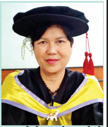
ရာသက်ပန် (တောင်ငူဆောင်)၏ ကိုယ်ရေးအကျဉ်း

ကျောင်းထဲမှာ လဲကျ၊ ပြိုကျ သေဆုံးသွားကြသော သစ်ပင်တွေနေရာမှာ အသစ် အသစ်သော အပင်တို့ ဝေဆာ လာပေပြီ။ မသေဘဲ ကျန်ခဲ့သော သစ်ပင်ပင်ကြီးသည် ကျွန်မတို့၏ ဘဝအားမာန်ကို တက်ကြွစေသည်။ ပင်ပျိုပင်အိုတို့ဖြင့် ဝေဆာနေသော ကျောင်းတော်ကြီးသည် ရာပြည့်နှစ်မှသည် နောင် နှစ်ပေါင်း များစွာ ရှင်သန်နေဦးမည် မှာသေချာလှသည်။ ထို့ကြောင့် လောကဓံသည် ကျွန်မတို့၏ ခြေထောက်အောက်သို့ ရောက်သွားသောအခါ လေကားထစ် များဖြစ်သွားကြသည့် သဘောကို စောကြောမိရသည်။