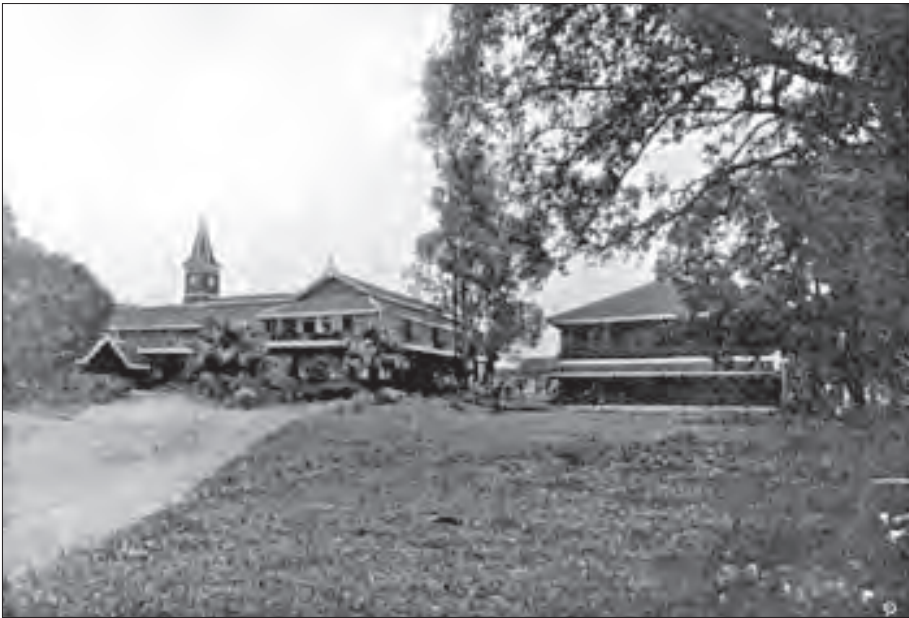
ဂျပ်ဆင်ကောလိပ်နှင့်မပေါင်းမီ ၁၉၀၀ ပြည့်နှစ်ဝန်းကျင်က ရန်ကုန်ကောလိပ်။