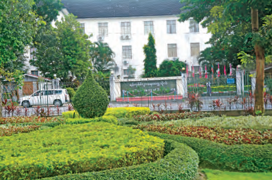
ရန်ကုန်စီးပွားရေးတက္ကသိုလ်ကို တွေ့ရစဉ်။

၁၉၄၇ ခုနှစ်တွင် မန္တလေးယူနီဗာစတီ ကောလိပ်သို့ လက်ထောက်ကထိကအနေဖြင့်ပြောင်းသည်။ ၁၉၄၈