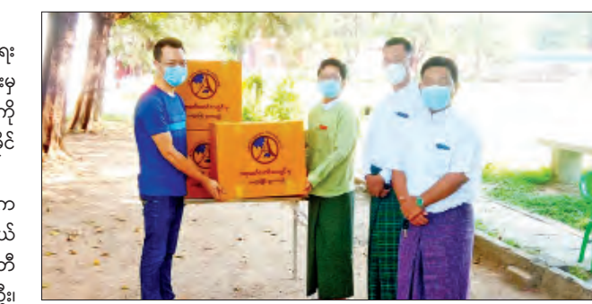
စကား ပြန်လည်ပြောကြားကာ ဂုဏ်ပြုမှတ်တမ်းလွှာ ပေးအပ်ခဲ့ကြောင်း သိရ သည်။

ရန်ကုန် ဒီဇင်ဘာ ၆ ရန်ကုန်မြောက်ပိုင်းခရိုင် အင်းစိန်မြို့နယ်အတွင်း ကန့်သတ်စောင့်ကြည့်ရေး စင်တာများတွင် လိုအပ်သည့်နေရာများ၌ အသုံးပြုနိုင်ရန် ဧရာဝတီဖောင်ဒေးရှင်းမှ ကိုဗစ်-၁၉ ရောဂါ ကာကွယ်ရေးအထောက်အကူဖြစ်စေရန် နှာခေါင်းစည်းများကို ယမန်နေ့ မွန်းလွဲ ၃ နာရီတွင် အင်းစိန်မြို့နယ် ရွာမအရှေ့ အင်းစိန်ဂျီတီအိုင် ကန့်သတ်စောင့်ကြည့်ရေးစင်တာ-၁၅ လာရောက်လှူဒါန်းခဲ့ကြသည်။