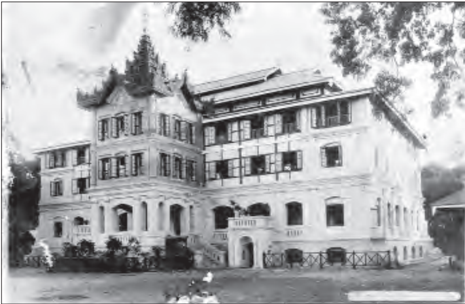
မန္တလေးဗဟိုအမျိုးသားကျောင်း။

ဒီသီချင်းကို အမျိုးသားအောင်ပွဲနေ့အတွက်သာမက ၁၉၄၈ ခုနှစ် ဇွန်လမှာမန္တလေး ယူနီဗာစီတီကောလိပ် အဖြစ် ဖွင့်လှစ်နိုင်တဲ့ အထိမ်းအမှတ်ဖွင့်ပွဲမှာလည်း သီဆိုခဲ့ကြသတဲ့။ ဒီနှစ်ဟာ အနှစ် ၁၀၀ ပြည့် အမျိုးသား အောင်ပွဲနေ့ဖြစ်သလို မန္တလေးတက္ကသိုလ်က ၂၀၂၅ ခုနှစ် မှာ နှစ် ၁၀၀ ပြည့်မှာမို့ အခုလို ထူးခြားတဲ့ မင်္ဂလာအခါ သမယအချိန် ဆရာမြို့မငြိမ်းသီချင်းကလည်း အမှတ်တရ ပါပဲ။