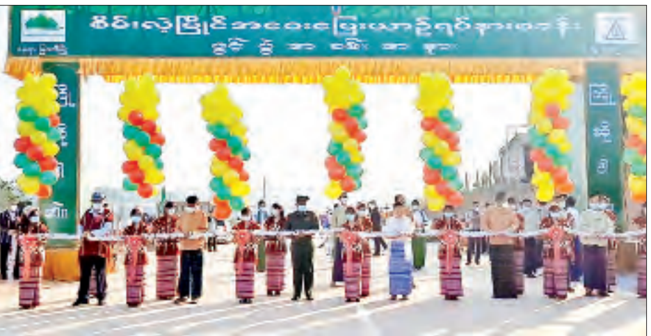
ရပ်ကွက် ၆/၇ စီမံကိန်း အကောင်အထည်ဖော်ဆောင်ရွက်နေမှု၊ အာဇာနည်ပန်းခြံတိုးချဲ့ပြင်ဆင်နေမှု၊ လေးကျောက်မြို့သစ်ရှိ လျှို့ဝှက်တံစံ ပြင်ဆင်မွမ်းမံနေမှုနှင့် မဲကနယ်

ဂုဏ်ပြုမှတ်တမ်းလွှာ ပြန်လည်ပေးအပ် ယင်းနောက် ပြည်နယ်ဝန်ကြီးချုပ်သည် အမှတ်(၃) အခြေခံပညာအထက်တန်းကျောင်း၏ သုံးထပ်ကျောင်းဆောင်သစ်လွှဲပြောင်းပေးအပ်ပွဲနှင့် ဖွင့်ပွဲအခမ်းအနားသို့တက်ရောက်ပြီး အဖွင့်အမှာစကားပြောကြားသည်။ အခမ်းအနားတွင် ကျောင်းဆောင်သစ်အား ဆောက်လုပ်သည့်သပြေသူဆောင်ရွက်ရေးကုမ္ပဏီမှပညာရေးဌာနသို့ လွှဲပြောင်းပေးအပ်ခြင်း၊ ကရင်ပြည်နယ်ပညာရေးမှူးဦးငွေစိုးက ဂုဏ်ပြုမှတ်တမ်းလွှာ ပြန်လည်ပေးအပ်ခြင်း၊ ကျောင်းဆောင်သစ်အား ဖဲကြိုးဖြတ်ဖွင့်လှစ်ပေးခြင်းတို့ကို ဆောင်ရွက်သည်။ ဆက်လက်ပြီး ပြည်နယ်ဝန်ကြီးချုပ်သည် မြဝတီမြို့