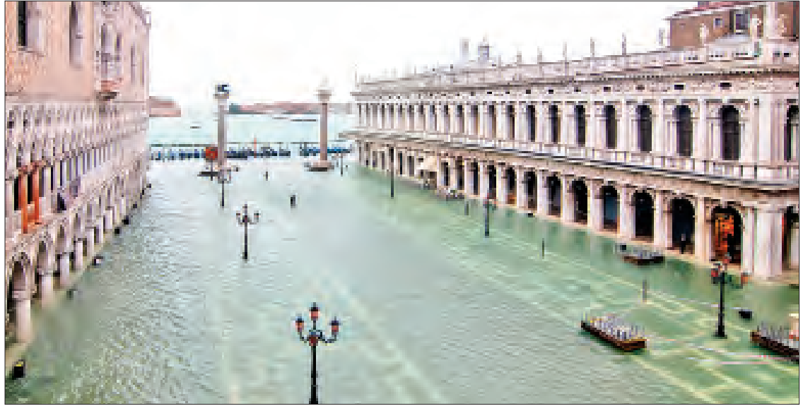
ကမ္ဘာ့အမွေအနှစ်စာရင်းဝင် ဗင်းနစ်မြို့တစ်နေရာအား တွေ့ရစဉ်။

ကိုးကား-အင်န်အိတ်ချ်ကော့ဘာသာပြန်-ဇော်ဝင်း