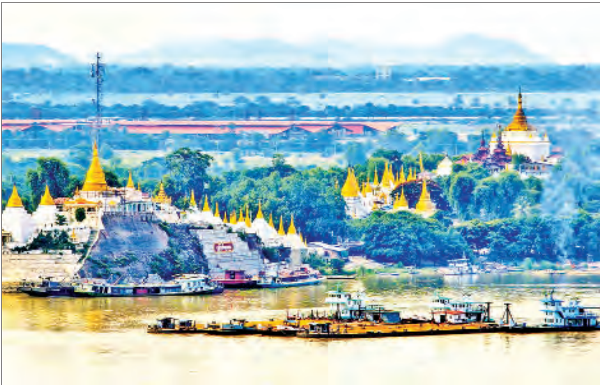
ရွှေကြက်ယက်၊ ရွှေကြက်ကျဘုရား။

(ဗိုလ်ချုပ်အောင်ဆန်း၏ ၁၁-၂-၁၉၄၇ ရက်နေ့တွင် ပင်လုံမြို့စော်ဘွားများ ထမင်းစားပွဲတွင် ပြောကြားသောမိန့်ခွန်းမှ ကောက်နုတ်ချက်)