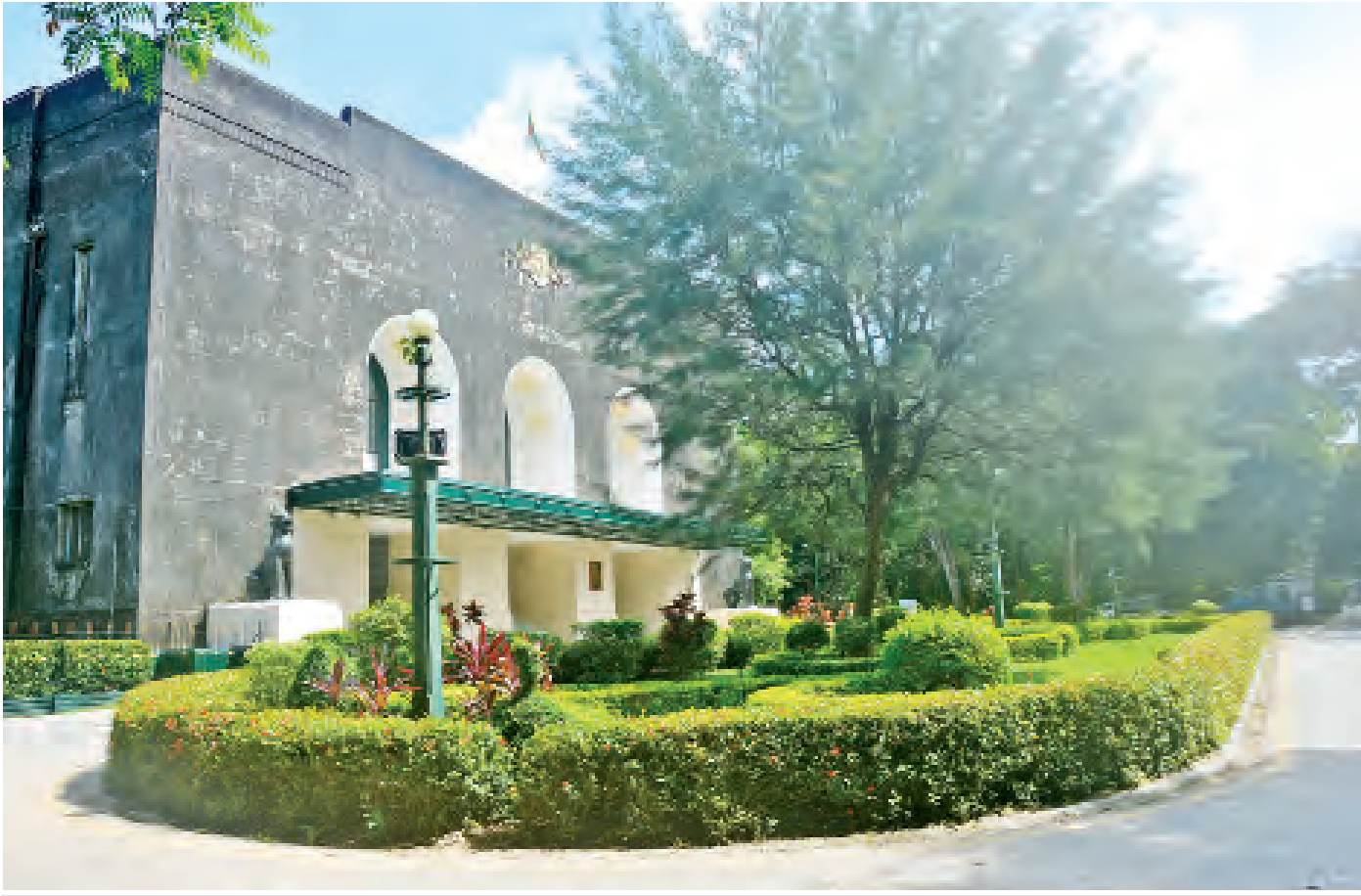
ရန်ကုန်တက္ကသိုလ်ဘွဲ့နှင့်သဘင်ခန်းမ။

၂၀၂၀ ပြည့်နှစ် ဒီဇင်ဘာလ ၁ ရက်နေ့က ရန်ကုန်တက္ကသိုလ် နှစ်တစ်ရာပြည့်ခဲ့ပြီ ဖြစ်ပါသည်။ ရန်ကုန်တက္ကသိုလ် ရာပြည့်အမှတ်တရဆောင်းပါးများ သတင်းစာများထဲ ဖတ်ရသည်မှာ အင်မတန်အရသာရှိလှပါ၏။ ရန်ကုန် တက္ကသိုလ်ဆိုသည့်အသံကြားရတိုင်း စိတ်ထဲ မည်သည့် အရာကို လွမ်းလို့လွမ်းရမှန်းမသိလွမ်းမိပါ။ တက္ကသိုလ် ကျောင်းသားဘဝကို ပြန်တွေးမိတိုင်း ကြည်နူးပျော်ရွှင်မှု သိရှိရသလို ခံစားမိကြမှာ အမှန်ပင်ဖြစ်ပါ၏။