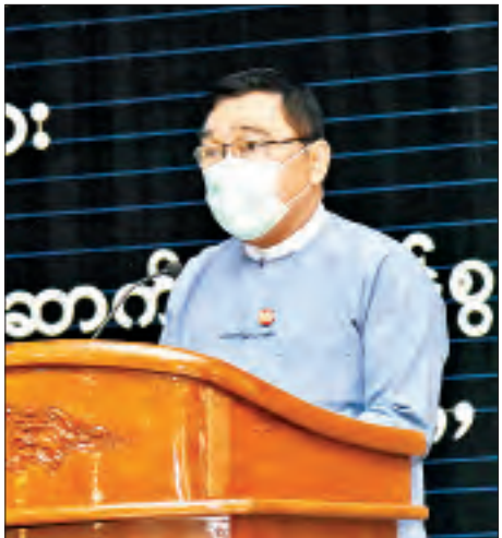
ပြည်ထောင်စုဝန်ကြီး ဒေါက်တာဝင်းမြတ်အေး ဂုဏ်ပြုစကား ပြောကြားစဉ်။

ဒေသကြီး၊ မန္တလေးတိုင်းဒေသကြီးနှင့် ပုဂံမြို့တို့ရှိ ခရီးသွားလုပ်ငန်းနှင့် သက်ဆိုင်သော ဦးစားပေးနေရာများ၌ မသန်စွမ်းသူများအနေဖြင့် အတားအဆီးကင်းမဲ့စွာ သွားလာနိုင်ရေး ရှေ့ပြေးစီမံကိန်း (Myanmar Barrier Free Tourism Pilot Project) ကို ၂၀၂၀ ပြည့်နှစ် ဇွန် ၁၄ ရက်တွင် ထုတ်ပြန်ခဲ့ခြင်းဖြစ်ပါကြောင်း၊ ထို့ကြောင့် ပို၍ ကောင်းမွန်သော အစီအစဉ်များကို ကြုံတွေ့ခံစားနိုင်ရေး အကောင်အထည်ဖော် ဆောင်ရွက်သွားရန် လိုအပ်