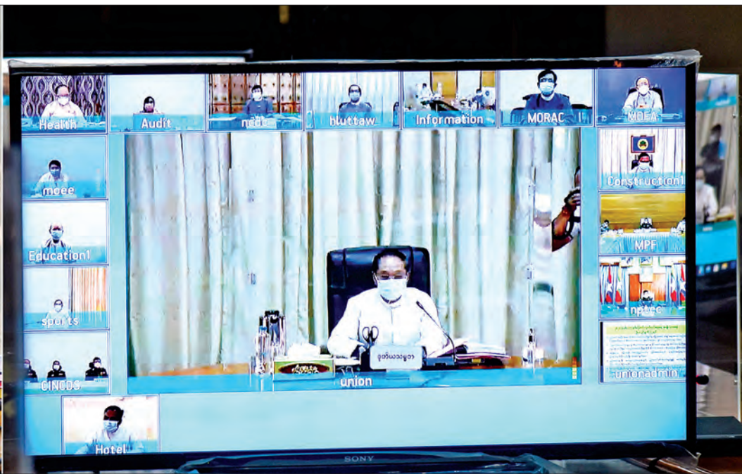
ဒုတိယသမ္မတ ဦးမြင့်ဆွေ ၂၀၂၁ ခုနှစ်၊ (၇၃)နှစ်မြောက် လွတ်လပ်ရေးနေ့ ကျင်းပရေး ဗဟိုကော်မတီ တတိယအကြိမ် ညှိနှိုင်းအစည်းအဝေးတွင် အမှာစကားပြောကြားစဉ်။

နေပြည်တော် ဒီဇင်ဘာ ၃ ၂၀၂၁ ခုနှစ်၊ (၇၃)နှစ်မြောက် လွတ်လပ်ရေးနေ့ကျင်းပရေးဗဟိုကော်မတီ၏ တတိယအကြိမ် ညှိနှိုင်းအစည်းအဝေးကို ဗီဒီယိုကွန်ဖရင့်စနစ်ဖြင့် ယနေ့ နံနက် ၉ နာရီခွဲတွင် နေပြည်တော်ရှိ ပြည်ထောင်စုအစိုးရအဖွဲ့ရုံး အစည်းအဝေး ခန်းမ၌ ကျင်းပရာ (၇၃)နှစ်မြောက် လွတ်လပ်ရေးနေ့ ကျင်းပရေးဗဟိုကော်မတီ ဥက္ကဋ္ဌ ဒုတိယသမ္မတ ဦးမြင့်ဆွေ တက်ရောက်အမှာစကား ပြောကြားသည်။ အစည်းအဝေးသို့ ပြည်ထောင်စုအစိုးရအဖွဲ့ရုံးဝန်ကြီးဌာန ဒုတိယဝန်ကြီး