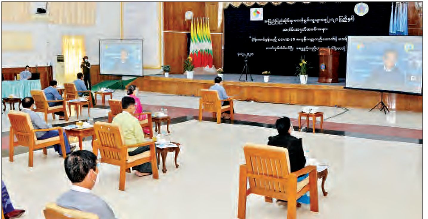
အပြည်ပြည်ဆိုင်ရာ မသန်စွမ်းသူများနေ့ အထိမ်းအမှတ် အခမ်းအနားကျင်းပစဉ်။

မသန်စွမ်းသူများအတွက် အတားအဆီးကင်းသော လူ့အဖွဲ့အစည်းဖြစ်စေရန် Barrier Free Community ဆိုင်ရာ ကနဦးစီမံကိန်းများကို နေပြည်တော်မြို့မဈေးနှင့် ရေပန်းဥယျာဉ်တို့၌ စံနမူနာပြုဆောင်ရွက်ထားရှိပြီးဖြစ်၍ အခြားတိုင်းဒေသကြီးနှင့် ပြည်နယ်များ၌လည်း ဆောင်ရွက်နိုင်ရန် တိုက်တွန်းလိုပါကြောင်း၊ ဟိုတယ်နှင့် ခရီးသွားလာရေးဝန်ကြီးဌာနက မြန်မာနိုင်ငံ၏ ခရီးစဉ်ဒေသများတွင် ပါဝင်သော နေပြည်တော်ကောင်စီနယ်မြေ၊ ရန်ကုန်တိုင်း