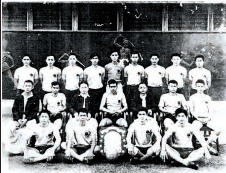
၁၉၆၆-၆၇ ခုနှစ် ပထမတန်းပတ်လည် ဘောလုံးပြိုင်ပွဲ ချန်ပီယံ ရန်ကုန်တက္ကသိုလ်လက်ရွေးစင်ဘောလုံးအသင်းဝင်များ။