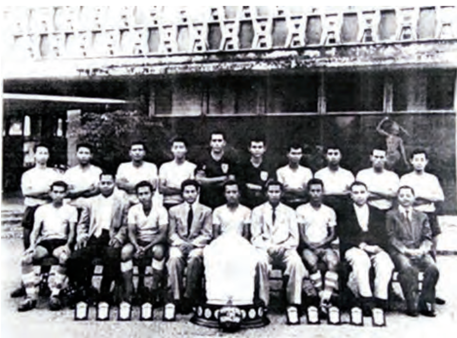
၁၉၆၃ ခုနှစ်က အောင်ဆန်းဒိုင်းဆရာ ရန်ကုန်တက္ကသိုလ် လက်ရွေးစင်ဘောလုံးအသင်း။

အာရှတိုက်အတွက်ပါ ဂုဏ်ယူဖွယ်ကောင်း မြန်မာနိုင်ငံအနေဖြင့် ၁၉၂၀ ပြည့်နှစ်တွင် ရန်ကုန် တက္ကသိုလ်ကို စတင်တည်ထောင်ခဲ့ရာ စတင်ချိန်က “တက္ကသိုလ်”ဟု မခေါ်သေးဘဲ ရန်ကုန်တက္ကသိုလ် “ယူနီဗာစီတီ” ကျောင်းတော်ကြီးဟုသာ ခေါ်ပါသေး သည်။ တက္ကသိုလ်ဆိုသည်ဝေါဟာရကို ၁၉၃၀ ပြည့်နှစ် တွင် စတင်သုံးစွဲခဲ့သည်။ ဆရာကြီးမင်းသုဝဏ်၏ မှတ်တမ်းများအရ ၁၉၂၅ ခုနှစ် သီတင်းကျွတ်လဆန်း ၆ ရက်နေ့တွင် ပြည်လမ်းတက္ကသိုလ်ကျောင်းတိုက်ကြီး (ယူနီဗာစီတီကောလိပ်)၊ ပင်းယဆောင် ဆရာများ၏ အခန်းတွင် ကျင်းပခဲ့သော အစည်းအဝေးက ဝေါဟာရ အချို့ကို မြန်မာမှုပြုခဲ့ကြောင်း သာဓကအားဖြင့် “University” ကို “တက္ကသိုလ်”၊ “College” ကို “ကျောင်းတိုက်”၊ “Senate” ကို “ပါမောက္ခအဖွဲ့”ဟု ခေါ်ဆိုခဲ့ပြီး “ကျောင်းတိုက်”ဆိုသည့်အခေါ်ကို ၁၉၃၆ ခုနှစ်နေ့ကပိုင်း ဆရာကြီးဦးဖေမောင်တင် တက္ကသိုလ် ကျောင်းအုပ်ကြီးအဖြစ် ဆောင်ရွက်စဉ်က သုံးခဲ့သေးပြီး စစ်ကြီးအပြီးတွင် မူလဝေါဟာရဖြစ်သော “ကောလိပ်” ဆိုသည်ကိုပဲ ပြန်သုံးခဲ့ကြောင်းပါ သိရပါသည်။ ရန်ကုန် တက္ကသိုလ်သည် မြန်မာနိုင်ငံအတွက်သာမက ကမ္ဘာလောကကြီးအတွက်ပါ တန်ဖိုးရှိသည့်ပညာရှင် များကိုပါ မွေးထုတ်ပေးနိုင်ခဲ့ပါသည်။ ရန်ကုန် တက္ကသိုလ်၏ ထင်ရှားသောအကြောင်းအရာတို့ကို ဖော်ပြကြရာတွင် ရန်ကုန်တက္ကသိုလ် ဘောလုံးအသင်း အကြောင်းကို လုံးဝချန်လှပ်ထားလျှင် ပြည့်စုံမည် မဟုတ်ဟု ယူဆပါသည်။ ရန်ကုန်တက္ကသိုလ် ဘောလုံး