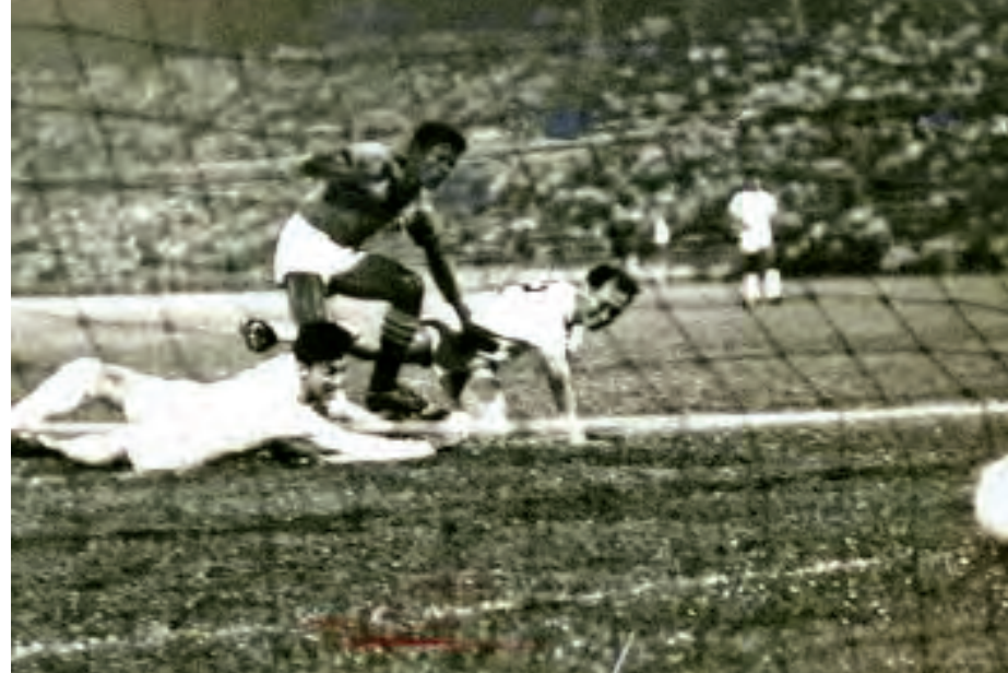
၁၉၆၆ ခုနှစ်တွင် ထိုင်းနိုင်ငံ ဗန်ကောက်မြို့၌ကျင်းပသည့် အာရှအားကစားပြိုင်ပွဲတွင် မြန်မာ့လက်ရွေးစင် ဘောလုံးအသင်း၏ ခုခံကာကွယ်နေမှု မြင်ကွင်း။

၁၉၆၀ ပြည့်နှစ်ကျော် ရန်ကုန်တက္ကသိုလ်ဘောလုံးအသင်းသည် အောင်ဆန်းဒိုင်း၊ ပထမတန်းပတ်လည် ပြိုင်ပွဲ၊ ရှုံးထွက်ပြိုင်ပွဲ၊ ဆန်စက် ပိုင်ရှင်များဖလား စသည့် ထိပ်တန်းပြိုင်ပွဲများတွင် “တက္ကသိုလ်အသင်း” အမည်ဖြင့် ပါဝင်ခဲ့သည်။ တက္ကသိုလ်ကျောင်းသားဖြစ်သည်နှင့် ဝါသနာ အလျောက် အပျော်တမ်း ဘောလုံးသမားများသာဖြစ်သော်လည်း အလွန် ထူးချွန်သော အဆင့်မြင့်ဘောလုံးသမားများအဖြစ် တွေ့မြင်ကြရ။