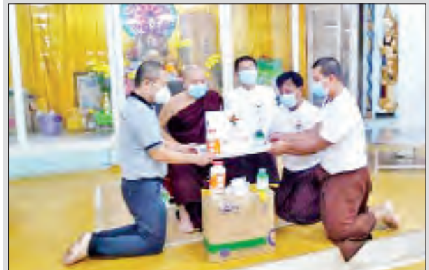
ဒီဇင်ဘာ ၃ ရက်တွင် ရွှေပါရမီကျွန်းမာရေးဖောင်ဒေးရှင်းက ရန်ကုန်တိုင်း ဒေသကြီး မရမ်းကုန်းမြို့နယ် နာဂလီထိဂူကလေးဝကျောင်းတိုက်မှ သံဃာတော်များနှင့် သီလရှင်များအတွက် အာဟာရဖြည့်စွက် အားဆေးဘူးများ လှူဒါန်းစဉ်။

အနေနဲ့ လောလောဆယ် နေရေး ခက်ခဲနေကြတဲ့ ပြည်သူတွေအတွက် ဝန်ဆောင်မှုပေးနိုင်စေဖို့ ဒီစီမံကိန်းကို အမြန်ဆုံးပြီးစီးအောင် ကြိုးစား ဆောင်ရွက်နေပါတယ်”ဟု ၎င်းက ပြောသည်။