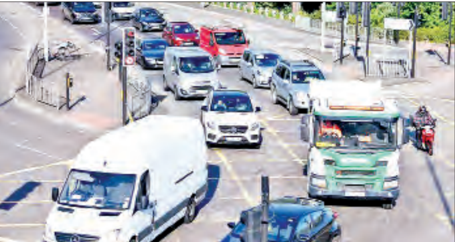
အသွားအလာကန့်သတ်မှုများဖြေလျှော့ပေးပြီး တစ်နာရီအကြာမှာပင် လန်ဒန်မြို့ရှိ မြောက်ဆက်ကူလာလမ်းတွင် ယာဉ်ကြောပိတ်ဆို့မှုများ တွေ့ရစဉ်။

သည်အထိ စည်ကားလျက်ရှိသည်။ ဂျာမနီနိုင်ငံကမူ ခရစ္စမတ်နှင့် နှစ်သစ်ကူးကာလများ တွင် ကိုဗစ်-၁၉ ကူးစက်မှုနှုန်းမြင့်တက်မည်ကို တားဆီးရန် အတွက် ကန့်သတ်ချက်များကို ဇန်နဝါရီ ၁၀ ရက်အထိ ငါးပတ်ကြာ သက်တမ်းထပ်တိုးရန် ဆုံးဖြတ်ခဲ့သည်။ ဂျာမနီ အဓိပတိ မာကာယ၏ အဆိုပါဆုံးဖြတ်ချက်မှာ ကန့်သတ်ချက် များကို ဒုတိယအကြိမ် သက်တမ်းထပ်တိုးခြင်းလည်း ဖြစ်လာခဲ့သည်။ စားသောက်ဆိုင်များ၊ ဘားများအပြင် မရှိမဖြစ် ပစ္စည်း အရောင်းဆိုင်များမှအပ ကျန်အမျိုးအစားရောင်းချသည့် ဆိုင်များအားလုံးကို ကန့်သတ်ကာလအထိ ပိတ်ထားမည် ဖြစ်သည်။ ဂျာမနီနိုင်ငံ၌ နိုဝင်ဘာလကတည်းက နေ့စဉ် ဗိုင်းရပ်စ်ကူးစက်သူ နှစ်သောင်းနှင့်အထက်ရှိနေပြီး ဒီဇင်ဘာ ၂ ရက်တစ်ရက်တည်းမှာပင် ဗိုင်းရပ်စ်ကူးစက်မှု ကြောင့် သေဆုံးသူ ၄၈၅ ဦးရှိခဲ့ရာ အဆိုပါ သေဆုံးသူဦးရေ မှာ ဂျာမနီနိုင်ငံအတွက် စံချိန်သစ်ဖြစ်လာခဲ့ကြောင်း သိရ သည်။ ကိုးကား-အင်န်အိတ်ချ်ကေ၊ ဘာသာပြန်-မေလွဲသင်း