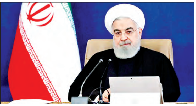
အီရန်နိုင်ငံသမ္မတ ရိုဟာနီ

မြို့တော်မော်စကိုသည် ရုရှားနိုင်ငံ၏ ကိုဗစ်-၁၉ ရောဂါ ကူးစက်ဖြစ်ပွားမှုဒဏ်အခံရဆုံး ဖြစ်ပြီး လွန်ခဲ့သည့်တစ်ရက်တာကာလအတွင်း ကူးစက်ခံရသူ ၇၇၅၀ အထိရှိခဲ့ခြင်းကြောင့် စုစုပေါင်း ၆၂၅၁၈၉ ဦးအထိ ရှိလာခဲ့သည်။ ညွှန်ကြား ထို့ကြောင့် ရုရှားသမ္မတ ပူတင်က လာမည့်သီတင်းပတ်မှစတင်ကာ ကိုဗစ်-၁၉ ရောဂါ တိုက်ဖျက်ရေး အစီအစဉ် အဖြစ် အကြီးစားကာကွယ်ဆေးထိုးနှံမှုကို စတင်ရန် ရုရှားအစိုးရအဖွဲ့အား ယမန်နေ့က ညွှန်ကြားခဲ့ကြောင်း သိရသည်။ ကိုးကား - ဆင်ဟွာ ဘာသာပြန် - အလင်းသစ်