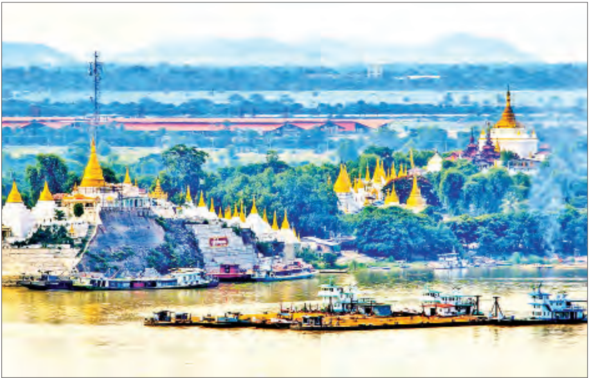
ရွှေကြက်ယက်၊ ရွှေကြက်ကျဘုရား။

(ဗိုလ်ချုပ်အောင်ဆန်း၏ ၁၁-၂-၁၉၄၇ ရက်နေ့တွင် ပင်လုံမြို့စော်ဘွားများ ထမင်းစားပွဲတွင် ပြောကြားသောမိန့်ခွန်းမှ ကောက်နုတ်ချက်)