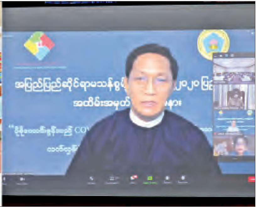
ဒုတိယသမ္မတ ဦးဟင်နရီဗန်ထီးယူ ၂၀၂၀ ပြည့်နှစ် အပြည်ပြည်ဆိုင်ရာမသန်စွမ်းသူများနေ့ အထိမ်းအမှတ်အခမ်းအနားတွင် အမှာစကားပြောကြားစဉ်။

နေပြည်တော် ဒီဇင်ဘာ ၃ ၂၀၂၀ ပြည့်နှစ် အပြည်ပြည်ဆိုင်ရာမသန်စွမ်းသူများနေ့ အထိမ်းအမှတ် အခမ်းအနားကို ယနေ့နံနက် ၉ နာရီခွဲတွင် နေပြည်တော်ရှိ လူမှုဝန်ထမ်း၊ ကယ်ဆယ်ရေးနှင့် ပြန်လည်နေရာချထားရေးဝန်ကြီးဌာန အစည်းအဝေးခန်းမ၌ ကျင်းပရာ မသန်စွမ်းသူများ၏ အခွင့်အရေးများဆိုင်ရာအမျိုးသားကော်မတီဥက္ကဋ္ဌ ဒုတိယသမ္မတ ဦးဟင်နရီဗန်ထီးယူ ဗီဒီယိုကွန်ဖရင့်စနစ်ဖြင့် တက်ရောက်အမှာစကားပြောကြားသည်။