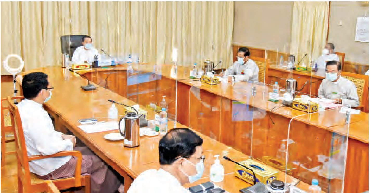
၂၀၂၀ ခုနှစ် (၇၃)နှစ်မြောက် လွတ်လပ်ရေးနေ့ ကျင်းပရေး ဗဟိုကော်မတီ တတိယအကြိမ် ညှိနှိုင်းအစည်းအဝေး ကျင်းပစဉ်။

နိုင်ငံတော်သမ္မတအိမ်တော်၌ ညနေပိုင်းတွင် ကျင်းပမည့် “လွတ်လပ်ရေးနေ့ဧည့်ခံပွဲနှင့် ညစာစားပွဲအခမ်းအနား” ကို ယခုနှစ်တွင် ကျင်းပခြင်းမပြုတော့ဘဲ လွတ်လပ်ရေးနေ့ကို ဂုဏ်ပြုသောအားဖြင့် မီးရှူး၊ မီးပန်းများ ဂုဏ်ပြု