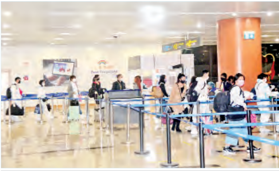
မကာအိုမှ ပြန်လည်ရောက်ရှိလာသော မြန်မာနိုင်ငံသားများအား ရန်ကင်းအပြည်ပြည်ဆိုင်ရာလေဆိပ်၌ တွေ့ရစဉ်။