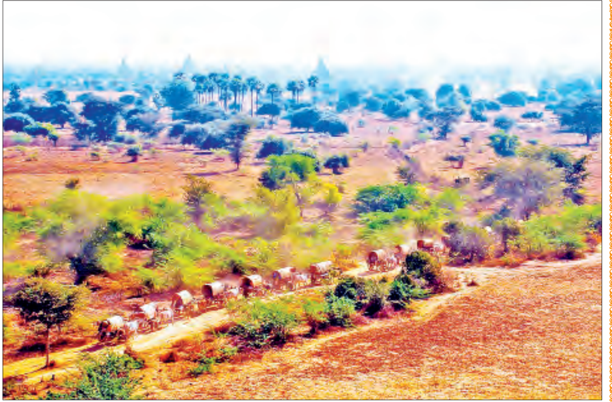
ပုဂံရှေးဟောင်းယဉ်ကျေးမှုနယ်မြေရှုခင်း။

နိုင်ငံတော်သမ္မတ ဦးဝင်းမြင့်၏ ၄-၁-၂၀၂၀ ရက်နေ့တွင် (၇၂)နှစ်မြောက် လွတ်လပ်ရေးနေ့ အထိမ်းအမှတ် အခမ်းအနားသို့ ပေးပို့သည့် သဝဏ်လွှာမှ ကောက်နုတ်ချက်