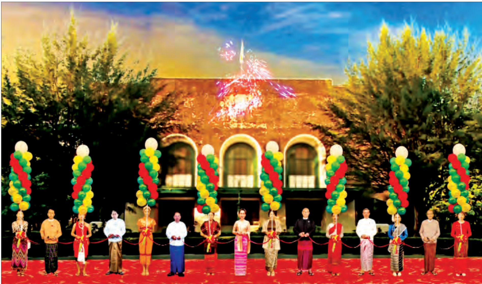
နိုင်ငံတော်၏အတိုင်ပင်ခံပုဂ္ဂိုလ် ဒေါ်အောင်ဆန်းစုကြည်၊ ဒုတိယသမ္မတ ဦးမြင့်ဆွေ၊ အမျိုးသားလွှတ်တော်ဥက္ကဋ္ဌ မန်းဝင်းခိုင်သန်း၊ ပြန်ကြားရေးဝန်ကြီးဌာန ပြည်ထောင်စုဝန်ကြီး ဒေါက်တာ ဖေမြင့်၊ ပညာရေးဝန်ကြီးဌာန ပြည်ထောင်စုဝန်ကြီး ဒေါက်တာ မျိုးသိမ်းကြီး၊ ရန်ကုန်တိုင်းဒေသကြီးဝန်ကြီးချုပ် ဦးဖြိုးမင်းသိန်းနှင့် ရန်ကုန်တက္ကသိုလ် ပါမောက္ခချုပ် ဒေါက်တာဖိုးကောင်းတို့က ရန်ကုန်တက္ကသိုလ် နှစ် (၁၀၀) ပြည့် ရာပြည့်သဘင်အခမ်းအနားကို Virtual စနစ်ဖြင့် ဖဲကြိုးဖြတ်ဖွင့်လှစ်ပေးကြစဉ်။

နေပြည်တော် ဒီဇင်ဘာ ၁ ရန်ကုန်တက္ကသိုလ် နှစ်(၁၀၀)ပြည့် ရာပြည့်သဘင် အထိမ်းအမှတ်အခမ်းအနားကို ယနေ့ ညနေ ၅ နာရီတွင် Virtual စနစ်ဖြင့် ကျင်းပရာ ရန်ကုန်တက္ကသိုလ် ရာပြည့်သဘင်အခမ်းအနားကျင်းပရေး ဦးစီးကော်မတီဥက္ကဋ္ဌ နိုင်ငံတော်၏ အတိုင်ပင်ခံပုဂ္ဂိုလ် ဒေါ်အောင်ဆန်းစုကြည်က Video Message ပေးပို့၍ ဂုဏ်ပြုဝမ်းမြောက်စကား ပြောကြားသည်။ ရှေးဦးစွာ ရန်ကုန်တက္ကသိုလ် နှစ်(၁၀၀)ပြည့် ရာပြည့်သဘင်အခမ်းအနားကို “ရန်ကုန်တက္ကသိုလ် နှစ်တစ်ရာပြည့် ပွဲတော်” သီချင်းဖြင့် စတင်ဖွင့်လှစ်သည်။ ထို့နောက် နိုင်ငံတော်၏အတိုင်ပင်ခံပုဂ္ဂိုလ် ဒေါ်အောင်ဆန်းစုကြည်၊ ဒုတိယသမ္မတ ဦးမြင့်ဆွေ၊ အမျိုးသားလွှတ်တော် ဥက္ကဋ္ဌ မန်းဝင်းခိုင်သန်း၊ ပြန်ကြားရေးဝန်ကြီးဌာန ပြည်ထောင်စုဝန်ကြီး ဒေါက်တာဖေမြင့်၊ ပညာရေးဝန်ကြီးဌာန ပြည်ထောင်စုဝန်ကြီး ဒေါက်တာ မျိုးသိမ်းကြီး၊ စာမျက်နှာ ၅ ကော်လံ ၁ သို့ ❖