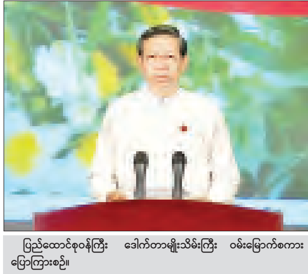
ပြည်ထောင်စုဝန်ကြီး ဒေါက်တာမျိုးသိမ်းကြီး ဝမ်းမြောက်စကား ပြောကြားစဉ်။

ထို့နောက် ရန်ကုန်တက္ကသိုလ် ရာပြည့်သဘင်အခမ်းအနား ကျင်းပ ရေးဦးစီးကော်မတီ အတွင်းရေးမှူး ပညာရေးဝန်ကြီးဌာန ပြည်ထောင်စု ဝန်ကြီး ဒေါက်တာမျိုးသိမ်းကြီးက ဝမ်းမြောက်စကား ပြောကြားရာတွင် ရန်ကုန်တက္ကသိုလ် အဆင့်မြှင့်တင်ရေး လုပ်ငန်းများကို အားလုံးရဲ့ စုပေါင်း အင်အားနဲ့ ပူးပေါင်းဆောင်ရွက်လျက်ရှိ ပါကြောင်း၊ ၂၀၁၆ ခုနှစ် ဧပြီလမှစ၍ ဆောင်ရွက်နေခြင်းမဟုတ်ဘဲ ပထမ အကြိမ် ပြည်သူ့လွှတ်တော် အစည်း အဝေးကျင်းပစဉ်က ကော့မှူးမဲဆန္ဒ နယ် ပြည်သူ့လွှတ်တော်ကိုယ်စား လှယ် ဒေါ်အောင်ဆန်းစုကြည် (ယခု နိုင်ငံတော်၏ အတိုင်ပင်ခံပုဂ္ဂိုလ်) တင်သွင်းခဲ့သည့် “တက္ကသိုလ်ဥပဒေ အသစ် ရေးဆွဲ၍ ရန်ကုန်တက္ကသိုလ် (ပင်မ) အဆင့်မြှင့်တင်ပြုပြင်ရေး အဆိုပြုချက်” ကို ပြည်သူ့လွှတ်တော် က အတည်ပြုဆုံးဖြတ်ပြီးသည့်နောက် ၂၀၁၂ ခုနှစ် နိုဝင်ဘာလ ၂၇ ရက် ရက်စွဲ