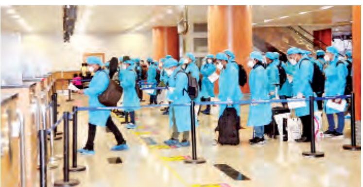
ကိုရီးယားနိုင်ငံမှတစ်ဆင့် ပြန်လည်ရောက်ရှိလာသည့် မြန်မာသင်္ဘောသားများအား ရန်ကင်းအပြည်ပြည်ဆိုင်ရာလေဆိပ်၌ တွေ့ရစဉ်။

ခဲ့ကြသည်။ အဆိုပါ ကယ်ဆယ်ရေးလေယာဉ် တွင် မြန်မာနိုင်ငံသား စုစုပေါင်း ၁၆၈ ဦး လိုက်ပါခဲ့ကြသည်။ ၎င်းတို့ ရန်ကင်းအပြည်ပြည်ဆိုင်ရာ လေဆိပ်သို့ ရောက်ရှိချိန်တွင် လူဝင်မှုကြီးကြပ် ရေး၊ ကျန်းမာရေးစစ်ဆေးရေး၊ သီးသန့်စီစဉ် ပေးသည့် နေရာ/သတ်မှတ်ဟိုတယ်များ၌ အသွားအလာကန့်သတ်မှု ခုနစ်ရက်နှင့် နေအိမ် တွင် အသွားအလာကန့်သတ်မှု ခုနစ်ရက် နေထိုင်စေရေးတို့ကို အလုပ်သမား၊ လူဝင်မှု ကြီးကြပ်ရေးနှင့်ပြည်သူ့အင်အားဝန်ကြီးဌာန၊ ကျန်းမာရေးနှင့် အားကစားဝန်ကြီးဌာနနှင့် ရန်ကင်းတိုင်းဒေသကြီး အစိုးရအဖွဲ့တို့က သက်ဆိုင်ရာအခန်းကဏ္ဍအလိုက် တာဝန်ယူ ဆောင်ရွက်ပေးခဲ့ကြသည်။ ပြည်ပနိုင်ငံများတွင် အခက်အခဲကြုံတွေ့ နေရသည့် မြန်မာနိုင်ငံသားများနှင့် မြန်မာ