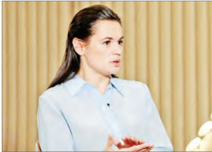
ဘီလာရစ်အတိုက်အခံခေါင်းဆောင် တီခါနော့စ်စကာယာ

ကိုးကား - အင်န်အိတ်ချ်ကေ၊ ဘာသာပြန် - အလင်းသစ်