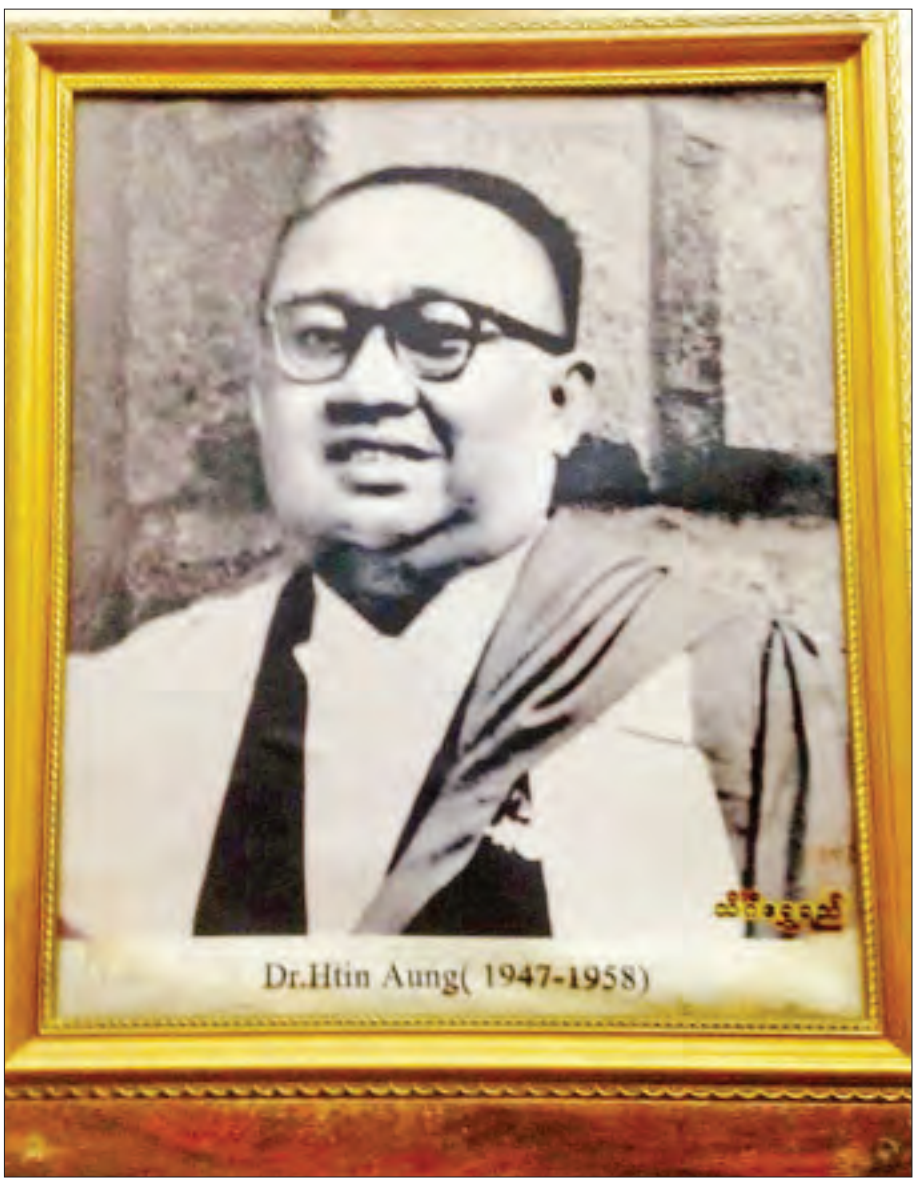
ပါမောက္ခချုပ် ဒေါက်တာထင်အောင်။

ဖြေ ။ ။ စာအုပ်တွေ အများကြီးရေးခဲ့တယ်။ အလွန် လည်းကောင်းတယ်။ သူကတော့ တကယ် စကော့လား (scholar)ပါ။ ဘယ်ရောက်ရောက် စာကြည့် တိုက်ထဲဝင် စာအုပ်တွေလေ့လာတယ်။ အများကြီး လေ့လာ ပြီးမှ ရေးလေ့ရှိတယ်။ နောက်ပိုင်းသူရေးတဲ့ History of Burma စာအုပ်ဖတ်ကြည့်လိုက်တဲ့အခါ အင်္ဂလိပ်တွေ ရေးခဲ့တဲ့ မြန်မာသမိုင်းတချို့ အချက်အလက်တွေကို ပြန်ချေပထားတယ်။ တချို့က တစ်ဖက်စောင်းနင်းဖြစ်နေ တယ်။ ကျွန်တော်တို့ ဘုရင်တွေ၊ သမိုင်းတွေကို ဟိုဘက် အမြင်နဲ့ ရေးထားတာ တချို့ ချွတ်ချော်နေတာကို ပြန်ပြီး တော့ ချေပလိုက်တယ်။ မြန်မာ့သမိုင်းအမှန်ကို ကမ္ဘာက သိအောင် ဆရာကြီးက ပြန်လုပ်ပေးခဲ့ပါတယ်။ ဒီအချက် တွေမှန်တယ်။ ဒီအချက်မှားတယ်ဆိုတာကို ဆရာကြီးက ထောက်ပြတယ်။ သူက အင်္ဂလိပ်လိုကျွမ်းတော့ အင်္ဂလိပ်လို