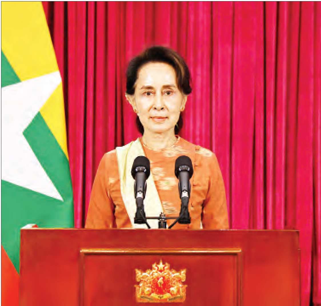
နိုင်ငံတော်၏အတိုင်ပင်ခံပုဂ္ဂိုလ် ဒေါ်အောင်ဆန်းစုကြည် ပြည်သူများသို့ အစီရင်ခံတင်ပြသည့် မိန့်ခွန်းပြောကြားစဉ်။

ရွေးကောက်ပွဲဆိုတော့ ရွေးကောက်ပွဲ အကြောင်းပဲ အခုပြောချင်ကြတာပေါ့။ ဒါပေမယ့် ကျွန်ုပ်အနေနဲ့ ကိုဗစ်-၁၉ စာမျက်နှာ ၃ ကော်လံ ၁ သို့ ❖