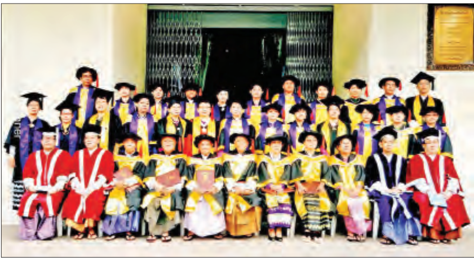
ရန်ကုန်တက္ကသိုလ် ဂုဏ်ထူးဆောင်ပါရဂူဘွဲ့ချီးမြှင့်သည့် အခမ်းအနားတွင် မှတ်တမ်းတင်ဓာတ်ပုံရိုက်စဉ်။

တက္ကသိုလ်ဟူသည် အဆင့်မြင့်ပညာရပ်များကို လေ့လာဆည်းပူးရာ၊ ပညာဖြန့်ဖြူးရာ၊ သုတေသနပြုရာ ဌာန၊ တစ်နည်းအားဖြင့် “ပညာ”တည်းဟူသော မီးရှူး တန်ဆောင် ထွန်းပြောင်ရာဌာန၊ နိုင်ငံတော်၏ ပညာဂုဏ် ဆောင်ရာဌာနဖြစ်သည့်အလျောက် ရွှေပေးရန် လည်းမသင့်၊ ငွေပေးရန်လည်းမကောင်း၊ ဂုဏ်ထူးဆောင် ဘွဲ့ဆက်ကပ်၊ ပေးအပ်၊ ချီးမြှင့်ခြင်းသည်သာ အဆီလျော် ဆုံး (ဆီလျော်အပ်စပ်)သင့်မြတ်ဆုံး ဖြစ်ပါသည်။