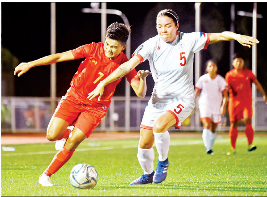
၂၀၁၉ ဆီးဂိမ်း အမျိုးသမီးဘောလုံးပြိုင်ပွဲတွင် မြန်မာအသင်းနှင့်ဖိလစ်ပိုင်အသင်းတို့ ယှဉ်ပြိုင်စဉ်။

ရန်ကုန် နိုဝင်ဘာ ၉ မြန်မာ့လက်ရွေးစင် အမျိုးသမီး အသင်းသည် လာမည့်နှစ်တွင် ယှဉ်ပြိုင်ရမည့် အာရှနှင့် အရှေ့တောင် အာရှအဆင့်ပြိုင်ပွဲများအတွက် ပြင်ဆင် မှုများပြုလုပ်မည်ဖြစ်ပြီး ကိုဗစ်-၁၉ ကပ်ရောဂါအပေါ်မူတည်၍ ပြင်ဆင်မှု များ ပြုလုပ်သွားမည်ဖြစ်သည်။