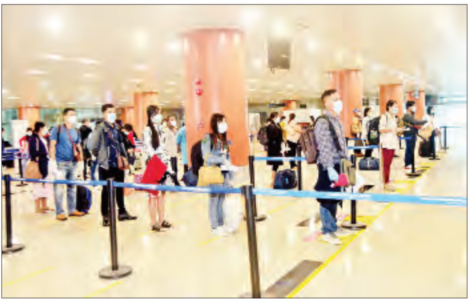
မလေးရှားနိုင်ငံမှ ပြန်လည်ရောက်ရှိလာသည့် မြန်မာနိုင်ငံသားများအား ရန်ကင်းအပြည်ပြည်ဆိုင်ရာလေဆိပ်၌ တွေ့ရစဉ်။