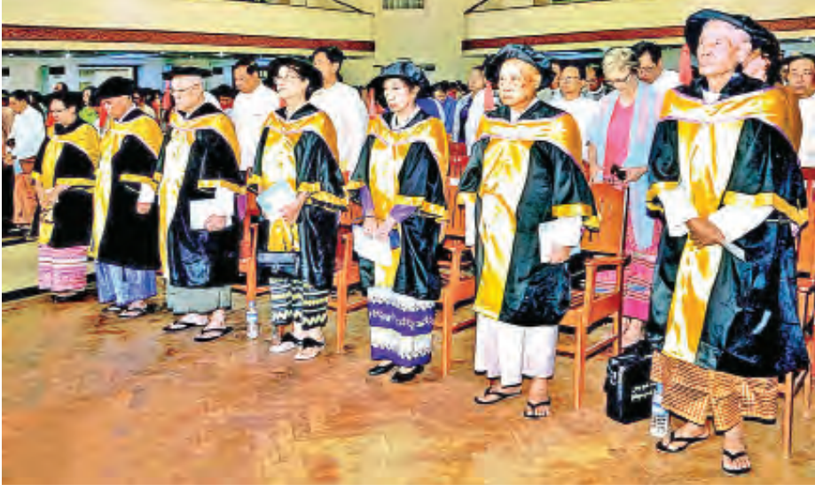
ရန်ကုန်တက္ကသိုလ် ဂုဏ်ထူးဆောင်ပါရဂူဘွဲ့ကို အပ်နှင်းချီးမြှင့်ခဲ့သည့် ပုဂ္ဂိုလ် ခုနစ်ဦး။

၁၉၆၁ ခုနှစ် ဒီဇင်ဘာလ ၂၀ ရက်နေ့တွင် အထူး ဘွဲ့ နှင်းသဘင်အခမ်းအနားဖြင့် အစွဲရေးဝန်ကြီးချုပ် ဒေးဗစ် ဘင်ဂူရီယန်အား ဂုဏ်ထူးဆောင် ဥပဒေပါရဂူဘွဲ့ ကို အပ်နှင်းချီးမြှင့်ခဲ့သည်။