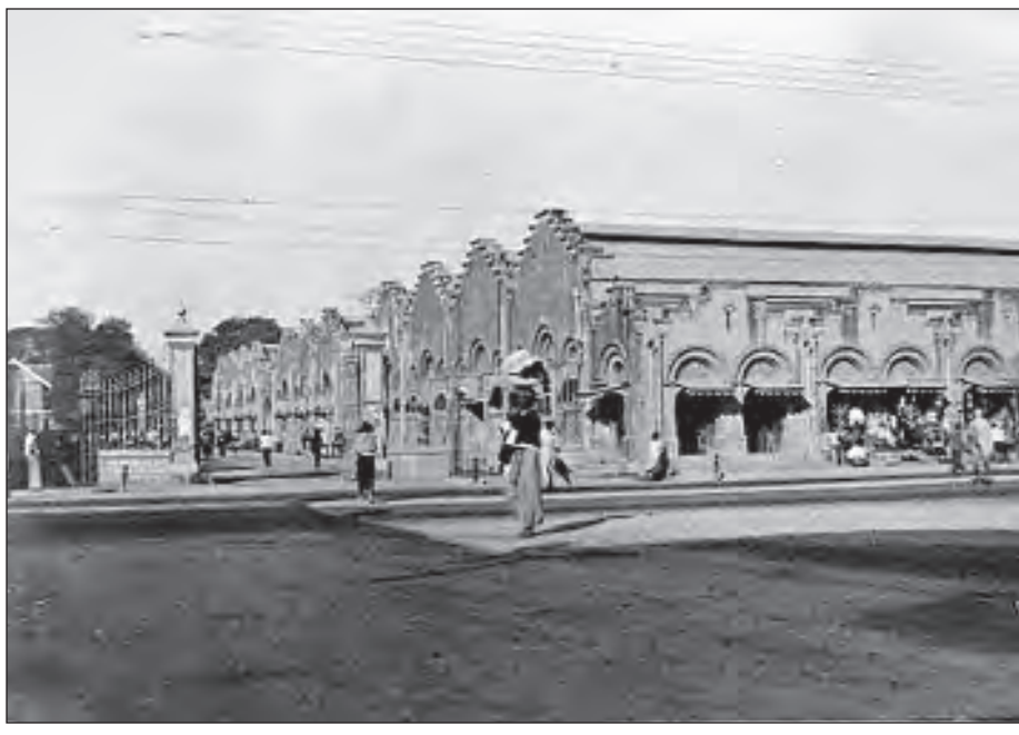
ရှေးဈေးချို

နောက်ပိုင်းနှစ်တွေရောက်တော့ မန္တလေးသိန်းဇော် နာမည်ကြီးလာတဲ့အခါ ရွှေဆိုင်တန်းကထိန်ဆိုရင်နှစ်တိုင်း လာပြီး ကပြလေ့ရှိတယ်။ မန္တလေးသိန်းဇော် နာမည်ကြီးတာနဲ့ တစ်ချိန်တည်း မန္တလေး Shell တီးပိုင်းက အမြဲပါတယ်။ အဲဒီနေ့ဆိုရင် အလယ်ပေါက်ကြီးတစ်ခုလုံး