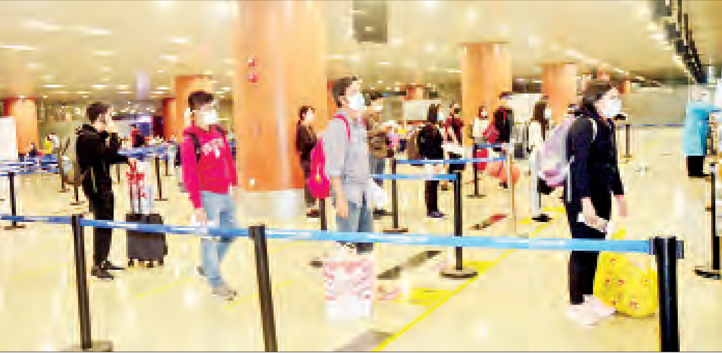
စင်ကာပူနိုင်ငံမှ ပြန်လည်ရောက်ရှိလာသည့် မြန်မာနိုင်ငံသားများအား ရန်ကုန်အပြည်ပြည်ဆိုင်ရာလေဆိပ်၌ တွေ့ရစဉ်။

နေပြည်တော် နိုဝင်ဘာ ၆ နိုင်ငံတကာခရီးသည်တင်လေယာဉ်များပျံသန်းမှု ယာယီ ရပ်ဆိုင်းထားခြင်းကြောင့် စင်ကာပူနိုင်ငံ၌ အခက်အခဲ ကြုံတွေ့နေရသည့် မြန်မာနိုင်ငံသား ၁၅၁ ဦးကို စင်ကာပူ မြို့ရှိ မြန်မာသံရုံးမှ စီစဉ်သည့် (၂၅) ကြိမ်မြောက် မြန်မာ အမျိုးသားလေကြောင်း (MNA) ကယ်ဆယ်ရေးလေယာဉ် ဖြင့် ပြန်လည်ခေါ်ဆောင်ခဲ့ရာ ယနေ့ ညနေ ၅ နာရီတွင် ရန်ကုန်အပြည်ပြည်ဆိုင်ရာလေဆိပ်သို့ အဆင်ပြေ ချောမွေ့စွာ ပြန်လည်ရောက်ရှိခဲ့ကြသည်။