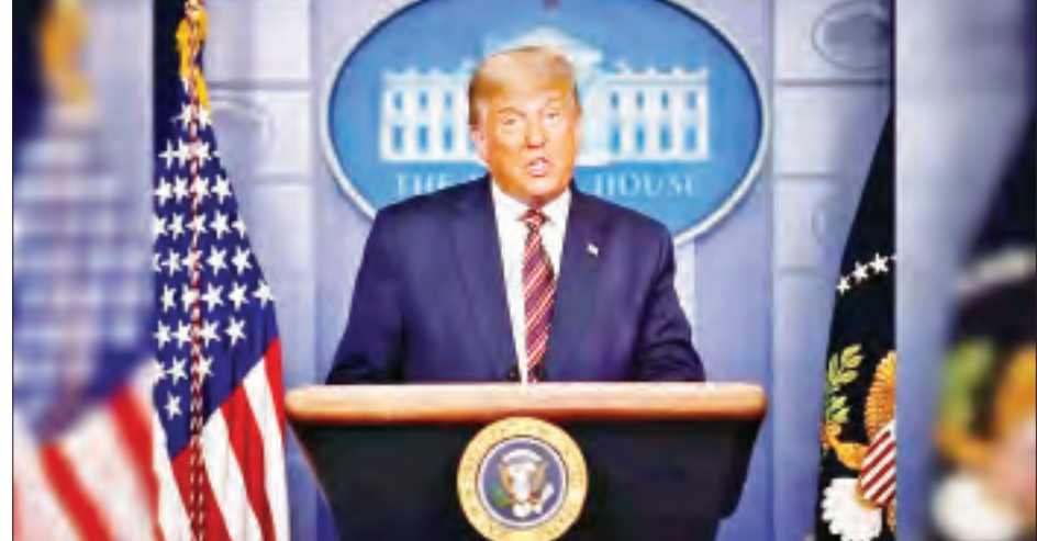
နိုဝင်ဘာ ၅ ရက် ညနေပိုင်းက သမ္မတ ထရမ် အိမ်ဖြူတော်မှ မိန့်ခွန်းပြောကြားစဉ်။

မျှဝေနေထိုင်ကြတာ ဖြစ်တဲ့အတွက် အခြားသူတွေ အလေးထားတဲ့အရာကို ကျွန်တော်တို့ လေးစားမှုရှိရပါမယ်။ ဥပမာအားဖြင့် ရုပ်ရှင်ရုံထဲမှာ မီးလောင်နေပြီလို့ တစ်စုံတစ်ဦးက အော်လိုက်ရင် အထဲကသူတွေ အလှအယက်ထွက်ဖို့ကြိုးစားတဲ့အခါ မလိုအပ်တဲ့ ဆုံးရှုံးမှုဖြစ်လာနိုင်တာမျိုးနဲ့ အလားသဏ္ဍာန်တူပါတယ်။ လွတ်လပ်ခွင့်ဆိုတာ တစ်ပါးသူအကျိုးကို မထိခိုက်တာမျိုးပါ” ဟု မှတ်ချက်ပြုခဲ့ခြင်းဖြစ်သည်။ သို့ရာတွင် ထရူးဒေါက အနုညာရှင်များ၏ လွတ်လပ်စွာတောင်းဆိုခွင့်နှင့် ဖော်ထုတ်ခွင့်ကို အကာအကွယ်ပေးရေးသည် အရေးကြီးကြောင်း မှတ်ချက်ပြုခဲ့သည်။ မက်ခရွန်နှင့်ထရူးဒေါတို့နှစ်ဦးစလုံးမှာ မူဝါဒချမှတ်မှု၊ ကမ္ဘာ့အရေးရှုမြင်မှုတို့တွင် အခြေခံအားဖြင့် တူညီကြသော်လည်း ယခုတစ်ကြိမ် လွတ်လပ်စွာထုတ်ဖော်ပြောဆိုခွင့်နှင့် ပတ်သက်၍ ရှုမြင်သုံးသပ်ပုံ အနည်းငယ်ကွဲပြားခဲ့ခြင်း ဖြစ်သည်။ ကိုးကား - ဘီဘီစီ၊ ဘာသာပြန်-မေလွဲသင်း