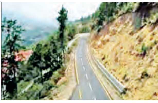
ကလေး-ဖလမ်း-ဟားခါးလမ်းမှ ချင်းပြည်နယ်မြို့တော် ဟားခါးမြို့သို့ ခရီးလမ်းလုံခြုံရေးအတွက် ရာသီမရွေးသွားလာနိုင်ကြပြီဖြစ်သည့်အတွက် ချင်း ပြည်နယ်အတွင်းရှိ ဒေသခံတိုင်းရင်းသားများ၏ လူမှုစီးပွားဘဝများ ဖွံ့ဖြိုး တိုးတက်လာတော့မည် ဖြစ်သည်။

ရန်ကုန် နိုဝင်ဘာ ၆ ကလေး-ဖလမ်း-ဟားခါးလမ်းသည် ချင်းပြည်နယ်အတွက် အဓိကအရေးပါသော လမ်းမကြီးဖြစ်ပြီး စစ်ကိုင်းတိုင်းဒေသကြီး ကလေးမြို့မှ ချင်းပြည်နယ် ဟားခါး မြို့အထိ ၁၂၄ မိုင်ရှိသည်။ ၂၀၁၆ ခုနှစ်မှစ၍ လမ်း/တံတားအဆင့်တိုးမြှင့်ခြင်း လုပ်ငန်းများ ဆောင်ရွက်ခဲ့ရာ ၂၀၂၀ ပြည့်နှစ် စက်တင်ဘာလကုန်တွင် ဖလမ်း- ဟားခါး မြို့တွင်းလမ်းများတွင် AC Road ၇/၄ မိုင် အတက်အဆင်းနေရာများတွင် ကွန်ကရစ်လမ်း ၃/၆ မိုင် ကတ္တရာလမ်းအဆင့် ၁၀၃/၇ မိုင်အထိ တိုးမြှင့် ဆောင်ရွက်ပေးနိုင်ခဲ့ကြောင်း သိရသည်။