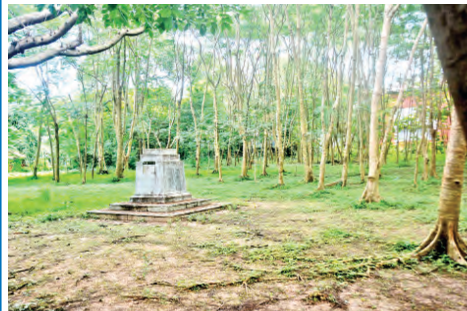
ရန်ကုန်တက္ကသိုလ်ဝင်းအတွင်းရှိ ဗိုလ်အောင်ကျော်အထိမ်းအမှတ် ကျောက်တိုင်ကို တွေ့ရစဉ်။ ဓာတ်ပုံ-မြင့်မောင်မောင်

ရန်ကုန်တက္ကသိုလ် ကမ္ဘာတည်သရွေ့ အသက်ရှည်ပါစေ။ ကျန်းမာချမ်းသာပါစေ။ ။