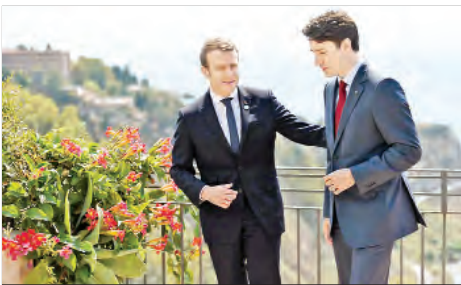
ပြင်သစ်သမ္မတ မက်ခရွန် (ဝဲ) နှင့် ကနေဒါဝန်ကြီးချုပ် ထရူးဒေါ (ယာ) တို့ ၂၀၁၇ ခုနှစ် မေ ၂၆ ရက်က G-7 ထိပ်သီးအစည်းအဝေးကာလအတွင်း တွေ့ရစဉ်။

ကိုးကား - နယူးယောက်တိုင်းမိစ်ဘာသာပြန် - မေလွဲသင်း