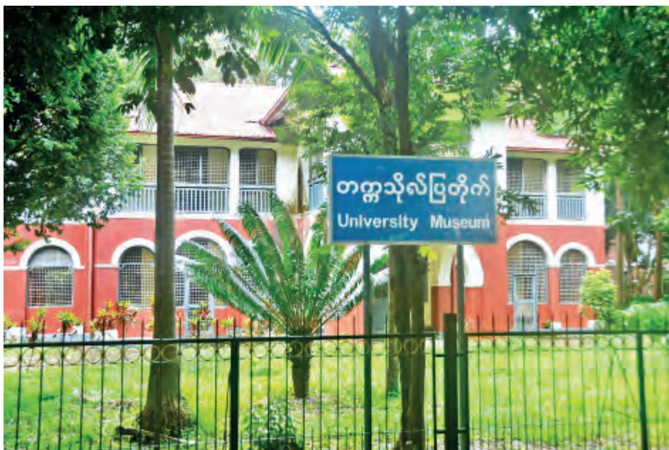
ရန်ကုန်တက္ကသိုလ် ပြတိုက်အဆောက်အအုံကို ဤသို့တွေ့ရစဉ်။

စာရေးဆရာ သိန်းဖေမြင့်သည် မိမိကိုယ်ကို အရန်ဇာတ်ဆောင်၊ သမိုင်းဇာတ်ဆောင်အဖြစ် ထည့်သွင်းလှုပ်ရှားစေပြန်သည်။ ဇာတ်ဆောင်သခင်တင်ထွန်း၏ အမြင်ဖြင့် “သူကား ဆရာ ကိုကျော်ငြိမ်းတို့ အရွယ်မှာရှိပြီး ချည်လှံချည်နှင့် ပင်နီအင်္ကျီကို ဝတ်ဆင်ထားသဖြင့် သခင်တစ်ယောက် ဖြစ်လိမ့်မည်ဟု ခန့်မှန်းရပါသည်။ သူ့မှာ အရပ်မတိုမရည်နှင့် ပီနီပီနီပါးပါးဖြစ်သည်။ သို့သော်