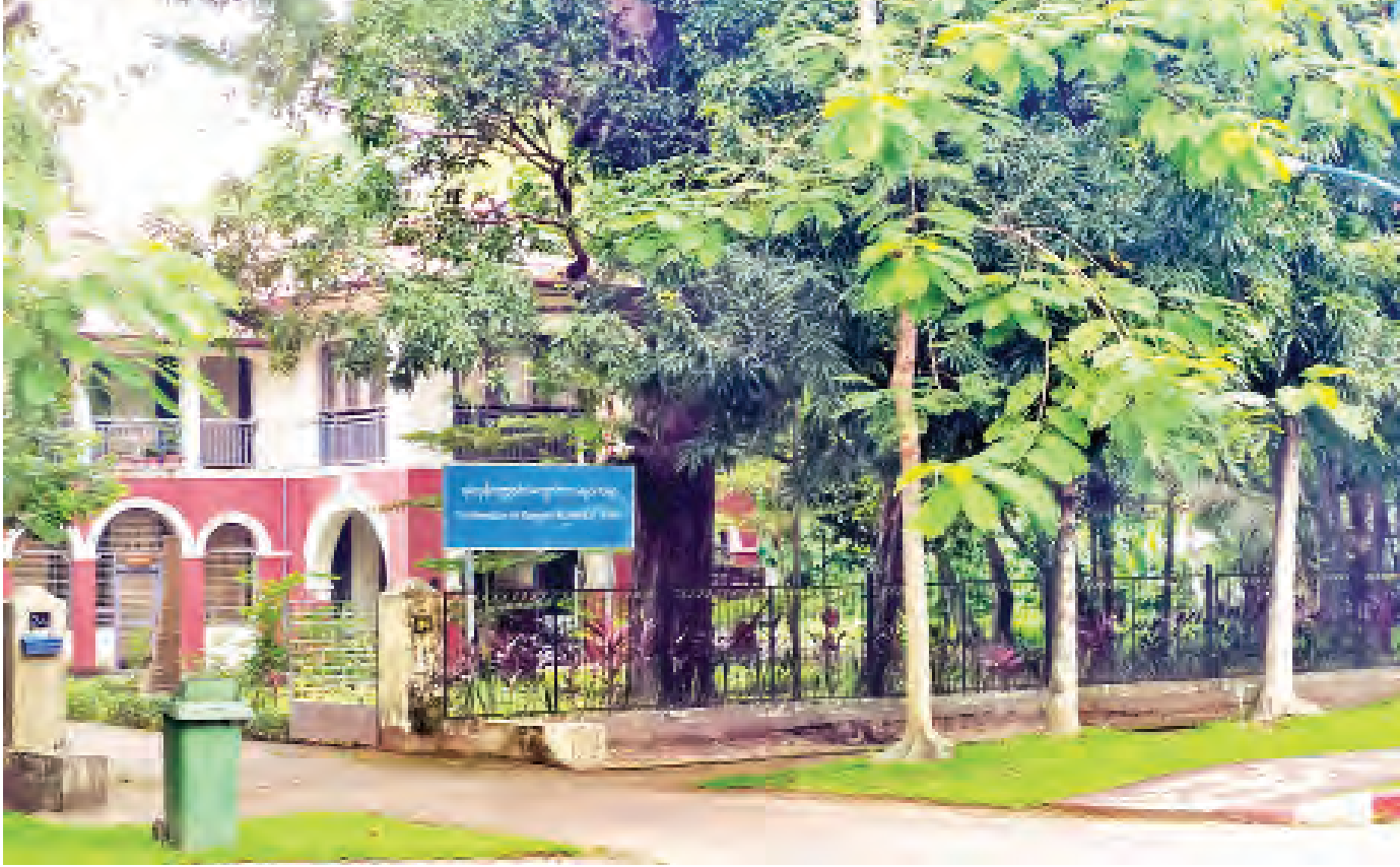
ရန်ကုန်တက္ကသိုလ် ကျောင်းသားများသမဂ္ဂ

သူအရိပ်တွင် ပညာသင်နေကြသော ကျောင်းသားတို့၏ အင်အားဖြင့် အမျိုးသားရေးအသိ အစွမ်းကုန်နိုးကြား နေသည်။ တက္ကသိုလ်ကျောင်းသားများသည် နိုင်ငံ၏ ခရီးလမ်းသစ်ကို ထွင်နေကြသည်မှာ အားတက်ဖွယ်ကောင်း ပါတိခြင်း။ ထိုသို့သော တက္ကသိုလ်၏ အမျိုးသားရေးလှုပ်ရှား မှု အငွေ့အသက်များကြောင့် တင်ထွန်း၏ စိတ်ပြောင်းလဲ