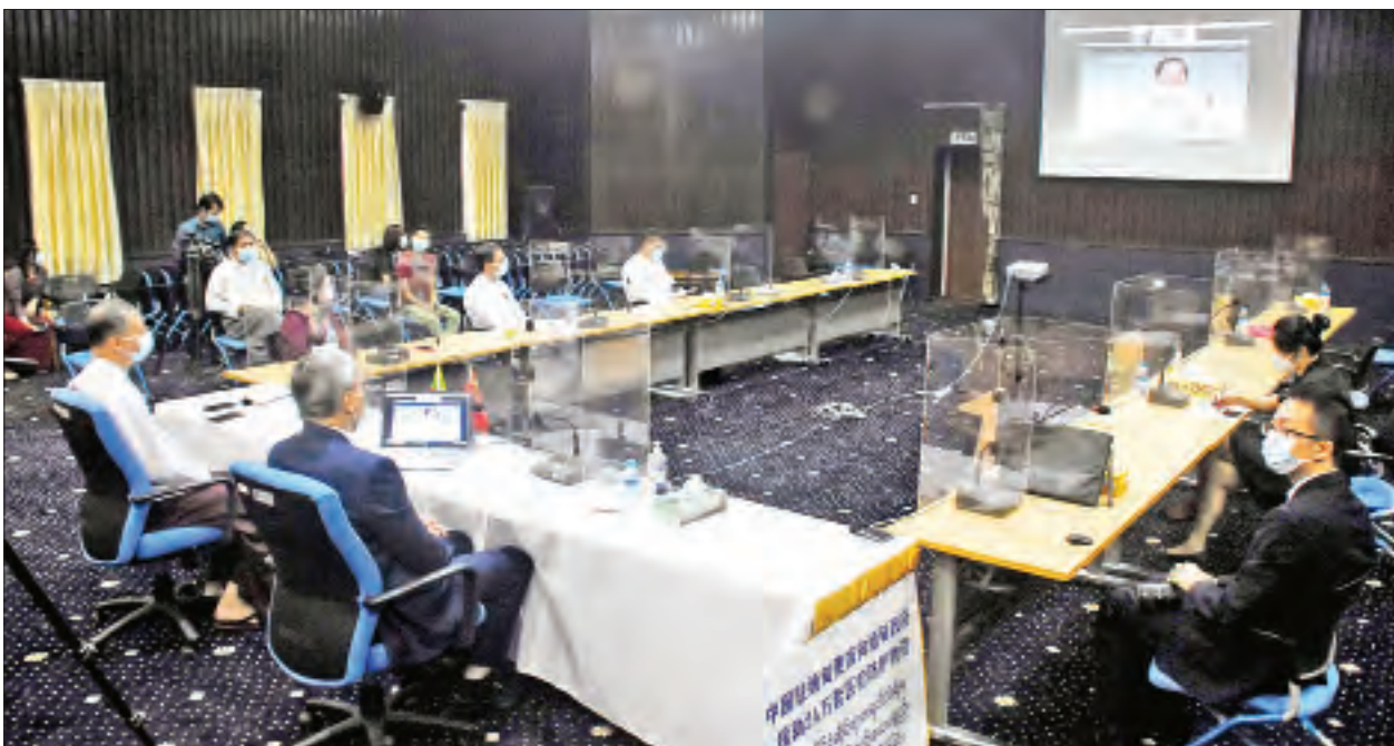
ပြည်ထောင်စုဝန်ကြီး ဒေါက်တာမြင့်ထွေး ကိုဗစ်-၁၉ ကာကွယ်၊ ထိန်းချုပ်ရေးလုပ်ငန်းများတွင် အသုံးပြုရန်အတွက် တရုတ်ပြည်သူ့သမ္မတနိုင်ငံမှ ဆေးပစ္စည်းကိရိယာများ လှူဒါန်းပွဲတွင် ဗီဒီယိုကွန်ဖရင့်ဖြင့် အမှာစကားပြောကြားစဉ်။

ထို့နောက် ပြည်ထောင်စုဝန်ကြီး ဒေါက်တာမြင့်ထွေးက ယခုကဲ့သို့ တရုတ်နိုင်ငံမှ နှစ်နိုင်ငံရင်းနှီးချစ်ကြည်စွာဖြင့် ကိုဗစ်-၁၉ ကာကွယ်ထိန်းချုပ်မှုလုပ်ငန်းများအတွက် ပံ့ပိုးဆောင်ရွက်နေမှုများအပေါ် ဝန်ကြီးဌာန၏ ဆေးရုံများမှ ဝန်ထမ်းများ၊ ရောဂါကာကွယ်ထိန်းချုပ်ရေးလုပ်ငန်း ဆောင်ရွက်နေသည့် ဝန်ထမ်းများနှင့် ပြည်သူများအားလုံးကိုယ်စား ကျေးဇူးတင်ရှိပါကြောင်း၊ ယခု ကိုဗစ်-၁၉ ဖြစ်ပွားချိန်တွင် တရုတ်နိုင်ငံအစိုးရက အမေရိကန်ဒေါ်လာ ၅ ဒသမ ၉၄ သန်းကျော်နှင့် ကုမ္ပဏီနှင့် လူမှုအဖွဲ့အစည်းများက မတ် ၁၇ ရက်မှ ယနေ့အထိ အမေရိကန်ဒေါ်လာ ၈ သိန်း ၉ သောင်းကျော် စုစုပေါင်း အမေရိကန်ဒေါ်လာ ၆ ဒသမ ၈ သန်းကျော် တန်ဖိုးရှိ ဆေးနှင့် ဆေးပစ္စည်းကိရိယာများကို ပံ့ပိုးပေးအပ်ခဲ့သည့်အပြင် ဆေးဘက်ဆိုင်ရာ ပညာရှင်အဖွဲ့များလေ့လာပြီး ရောဂါကာကွယ်ထိန်းချုပ်မှု အတွေ့အကြုံများဝေမျှခြင်းနှင့် အကြံပြုခြင်းများ ဆောင်ရွက်ခဲ့သည့်အပေါ် ကျေးဇူးတင်ရှိပါကြောင်း၊ ထိုသို့ပံ့ပိုးမှုများကြောင့် မြန်မာနိုင်ငံပြည်သူများ၏ အသက်များကို ကယ်တင်ကုသခြင်း၊ ပြည်သူများ