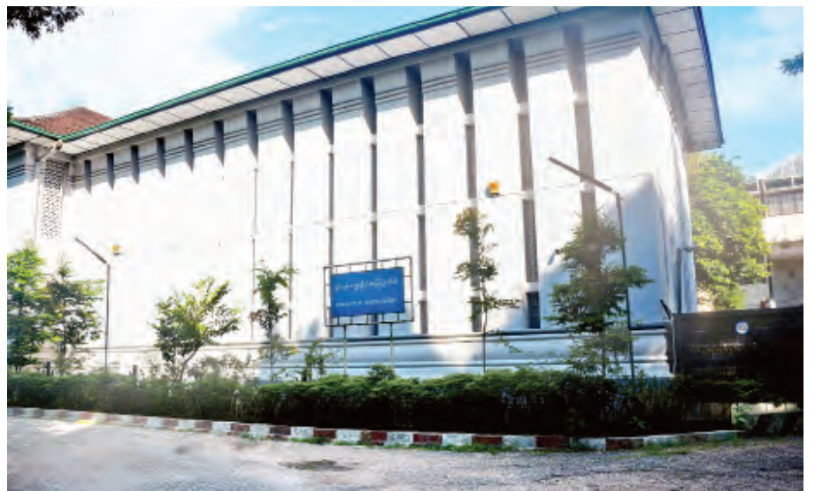
ရန်ကုန်တက္ကသိုလ် ကျောင်းသား ကျောင်းသူများ မှီငြမ်းကိုးကားရာ ရန်ကုန်တက္ကသိုလ်စာကြည့်တိုက်။

လာပုံကို “ကျွန်တော်သည် တက္ကသိုလ်ပိဋကတ်တိုက်သို့ အရောက်နည်းသည်ထက် နည်းလာသည်။ တက္ကသိုလ် ပိဋကတ်တိုက်စာကြည့်ခန်းသည် ကျွန်တော်အဖို့ အသက် ရှူကျပ်သလိုလို၊ စွတ်စိုထိုင်းထိုင်းသလိုလို၊ မှောင်သလိုလို ထင်မိတော့သည်။ ကျွန်တော်သည် ကျောင်းသားသမဂ္ဂ စာကြည့်တိုက်သို့သာ အရောက်များသည်ထက် များလာ ပါတော့သည်။ တက္ကသိုလ်သမဂ္ဂစာကြည့်ခန်းသည် ကျွန်တော် အဖို့ အသက်ရှူချောင်သည်။ နှလုံးမွေ့လျော်ဖွယ်ရှိသည်။ အလင်းရောင်ထွန်းသည်။ ကျွန်တော်သည် ကျယ်ပြန့်၍ သားနားသော စာသင်ခန်းထက် ကျဉ်းကျပ်၍ နံချာသော နိုင်ငံရေးဆွေးနွေးခန်းများကို ပိုလိုမြတ်နိုးနေပေပြီ။ နည်းပြဆရာ၏ သင်တန်းတွင် စာစီစာကုံးရေးရသည်ထက် အိုးဝေမဂ္ဂဇင်း၊ ဒဂုံမဂ္ဂဇင်း၊ တက္ကသိုလ်ကဏ္ဍနှင့် သတင်းစာ များတွင် ဆောင်းပါးရေးရသည်ကို ပိုလိုနှစ်သက်စိတ်ဝင် စားနေပြီ” ဟု တင်ပြခဲ့ပါသည်။ စာမျက်နှာ ၇ သို့ *