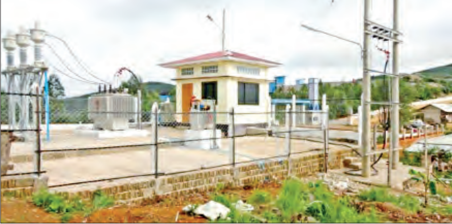
GPS Joint Venture Co., Ltd. မှ ရှမ်းပြည်နယ် ဘော်ဆိုင်းဒေသရှိ ကျေးရွာ (၄)ရွာ မီးလင်းရေး ဆောင်ရွက်ထားစဉ်။