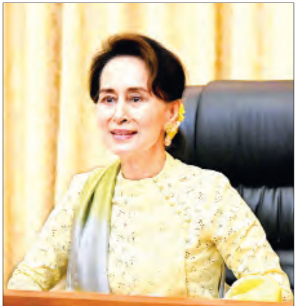
(Coronavirus Disease 2019 (COVID-19) ကာကွယ်၊ ထိန်းချုပ်၊ ကုသရေး အမျိုးသားအဆင့် ဗဟိုကော်မတီဥက္ကဋ္ဌ၊ နိုင်ငံတော်၏အတိုင်ပင်ခံပုဂ္ဂိုလ် ဒေါ်အောင်ဆန်းစုကြည် ၂၆-၁၀-၂၀၂၀ ရက်နေ့တွင် ကိုဗစ်-၁၉ ရောဂါဖြစ်ပွားမှု နောက်ဆုံး အခြေအနေနှင့်စပ်လျဉ်း၍ ပြည်သူများသို့ အစီရင်ခံတင်ပြသည့် မိန့်ခွန်းမှ ကောက်နုတ်ချက်)

ကျန်းမာရေးနှင့် အားကစားဝန်ကြီးဌာနက ကိုဗစ် ဒုတိယလှိုင်း နည်းနည်းကြာလာတာနဲ့အမျှ ဒီဟာကို ဘယ်လိုရင်ဆိုင်ရမယ်၊ ဘယ်လိုကျော်လွှားရမယ်၊ ဆက်ပြီးတော့ တွေ့တဲ့ ကိုဗစ်ရောဂါရှိနေတဲ့ ပြည်သူတွေ ကို ဘယ်လိုစောင့်ရှောက်ရမယ်၊ ကုသရမယ်ဆိုတာ ပိုပြီးတော့ နားလည်လာပါတယ်။ ပိုပြီး နားလည်တာနဲ့ အမျှ ပိုပြီး ထိထိရောက်ရောက် ကိုင်တွယ်နိုင်ပါတယ်။ ဒီအချိန်မှာဆိုရင် ပုဂ္ဂလိကဆေးခန်းတွေ၊ ပုဂ္ဂလိက ဆေးရုံတွေ ပိုပြီးတော့ ကိုဗစ်ရောဂါ ထိန်းချုပ်ရေးထဲမှာ ပါနိုင်အောင်လည်း ကျွန်မတို့ အစီအစဉ် တွေလုပ်နေပါတယ်။ ပြည်သူတွေအနေနဲ့လည်း ကိုယ့်ဘာသာကိုယ် ရွေးချယ်ပိုင်ခွင့်ရှိအောင်လို့ပါ။ ပုဂ္ဂလိကဆေးခန်းတွေကို သွားချင်တယ်၊ ပုဂ္ဂလိကဆေးရုံတွေကို တက်ချင်တယ်ဆိုရင် ကိုဗစ်ကြောင့်ပဲ ဖြစ်ဖြစ်၊ ရှိပြီးသား အခံရောဂါတွေ၊ တခြားရောဂါတွေကြောင့်ပဲဖြစ်ဖြစ် တက်နိုင်အောင်လို့ ကိုယ့်ရဲ့ ဆုံးဖြတ်ချက်အရ ရွေးချယ်နိုင်အောင်လို့ပါ။ ဒီလို ရွေးချယ်တဲ့နေရာမှာလည်း ရွေးချယ်ပြီးတော့ သွားတဲ့ ပြည်သူတွေအတွက်ရော၊ ဆေးရုံအတွက်ရော၊ အများပြည်သူအတွက်ရော လုံလုံခြုံခြုံဖြစ်အောင်လို့ ကျန်းမာရေးနှင့် အားကစားဝန်ကြီးဌာနက စည်းမျဉ်း စည်းကမ်းတွေချပြီးတော့ ပုဂ္ဂလိကဆေးခန်းတွေ၊ ဆေးရုံတွေနဲ့ ညှိနှိုင်းပြီး လုပ်ဆောင်နေပါတယ်။ ဒီဟာက ပြည်သူတွေအနေနဲ့ ရွေးချယ်ချင်သလို ရွေးချယ်နိုင်တဲ့အပြင် နိုင်ငံတော်ရဲ့ ဆေးရုံတွေအပေါ်မှာ ဝန်ထုပ်ဝန်ပိုးနည်းနည်းလျော့သွားနိုင်တယ်။ အဲဒါကလည်း ကိုဗစ်ကို ရင်ဆိုင်တဲ့နေရာမှာ အထောက်အကူဖြစ်မယ်လို့ ကျွန်မတို့ ယုံကြည်ပါတယ်။