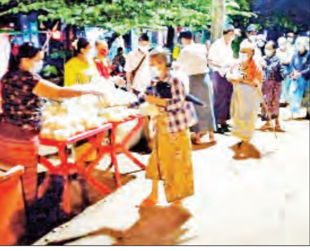
လက်ခံကြကြောင်း သိရသည်။ ရှစ်ရက်မြောက်နေ့အလှူဖြစ်ကြောင်း ထိုသို့အလှူပြုလုပ်မှုသည် ယနေ့ သိရသည်။ ပြည်နယ်(ပြန်/ဆက်)

ထိုသို့ဆောင်ရွက်ရာတွင် မော်လမြိုင် ငန်းတေးရပ်ကွက်ပြည်သူများအတွက် ဆန်နှင့် အခြေခံစားသောက်ကုန်ပစ္စည်းမျိုးစုံနှင့် ဟင်းသီးဟင်းရွက်များကို အလှူရှင်များက လှူဒါန်းကြပြီး လိုအပ်သူများက လာရောက်တန်းစီကာ