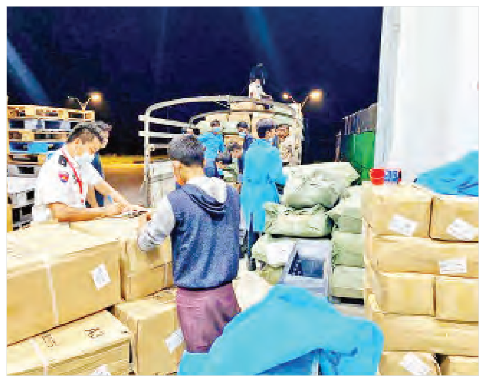
ပါတီစုံဒီမိုကရေစီအထွေထွေရွေးကောက်ပွဲအတွက် တရုတ်ပြည်သူ့သမ္မတနိုင်ငံမှ ဝယ်ယူထားသည့် ကိုဗစ်-၁၉ ရောဂါ ကာကွယ် ထိန်းချုပ်၊ ကုသရေး အထောက်အကူပြု ပစ္စည်းများ မန္တလေးအပြည်ပြည်ဆိုင်ရာလေဆိပ်သို့ ရောက်ရှိရာ တာဝန်ရှိသူများက စစ်ဆေးစဉ်။

ကျောပိုးမှ ယနေ့တွင် ရန်ကုန်အပြည်ပြည်ဆိုင်ရာလေဆိပ်သို့ အထူးလေယာဉ် ခုနစ်ခေါက် ၊ မန္တလေးအပြည်ပြည်ဆိုင်ရာလေဆိပ်သို့ သုံးခေါက်ရောက်ရှိသည်။ ယနေ့ ရောက်ရှိသောပစ္စည်းများမှာ KN95 Mask များ၊ Boots များနှင့် PPE Medical Protective clothing များဖြစ်ကြောင်း သိရသည်။ သတင်းစဉ်