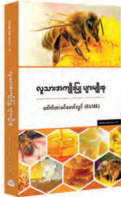
၂၀၁၈ ခုနှစ်အတွက် ပခုက္ကူဦးအုံးဖေစာကြည့်တိုက် စာအုပ်ဆုရ လူသားအကျိုးပြု ပျားပျားစု

ကျန်းမာသုတစာအုပ်များ အားလုံးကို ရန်ကုန်မြို့တွင်း အိမ်အရောက် ပို့ပေးနေပါပြီ။