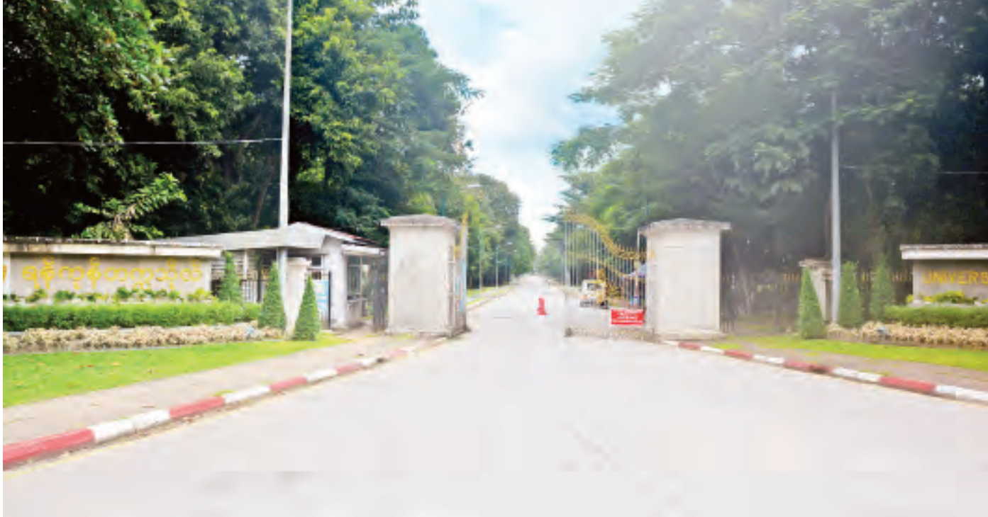
တက္ကသိုလ်ကျောင်းသား ကျောင်းသူများ ဓာတ်ပုံရိုက်ရာ အမှတ်တရတစ်ခုဖြစ်သည့် ရန်ကုန်တက္ကသိုလ် အဝင်မုခ်ဦး။

ကောင်းမှီရလျှင် ပိုမိုရှင်သန်ဖွံ့ဖြိုးသကဲ့သို့ သူတို့သည် လည်း ပညာရပ်အသီးသီးမှာ ထူးချွန်ပေါက်မြောက်ခဲ့ကြ သည်။ နိုင်ငံအနှံ့အပြားရှိ ဌာနအသီးသီးသို့သွားကာ ကျရာ တာဝန်ကို ကျေပွန်စွာထမ်းရွက်ကြရင်း ခေတ်မီ ဖွံ့ဖြိုးတိုးတက်သော နိုင်ငံတော်ကြီးကို ထူထောင်နေကြ သည်မှာ ငယ်ငယ်က ကခုန်သော “အသီးတစ်ရာ အညှာ တစ်ခု” သီချင်းကိုမြင်ယောင်၊ ကြားယောင်မိပါသည်။ ဤသို့ ကံ့ကော်တောမှာ အိပ်မက်ရည် မက်နေသရွေ့ တက္ကသိုလ်မြေ နေဝင်မည်ကို စိုးရိမ်စရာမလိုတော့ပေ။ စာမျက်နှာ ၇ သို့ ❖