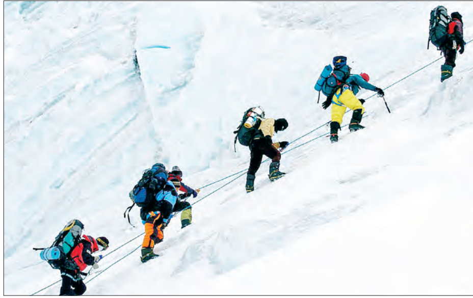
၂၀၁၈ ခုနှစ်က ဧဝရက်တောင်ပေါ်သို့ ခရီးသွားအများအပြား တက်ရောက်နေမှုကို တွေ့ရစဉ်။

တောင်တက်သမားများ၊ ခြေကျင်ခရီးသွားလည်ပတ် သူများအားလုံးကိုနီပေါနိုင်ငံသို့လာရောက်လည်ပတ်နိုင်ရေး ခွင့်ပြုပေးသွားမည်ဖြစ်ကြောင်း တာမန်းက ဆိုသည်။