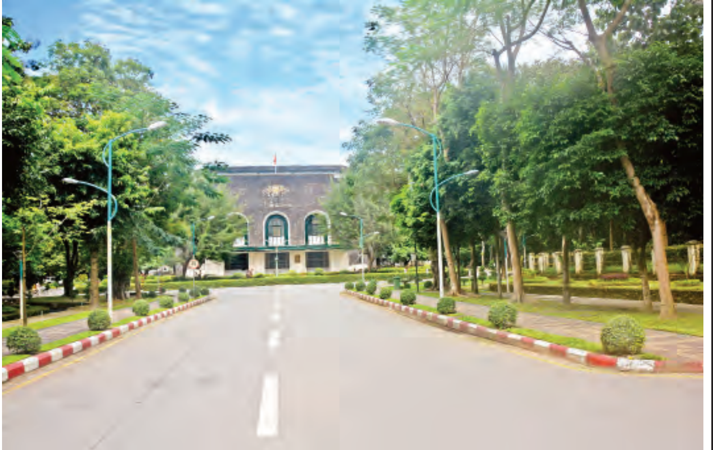
ရန်ကုန်တက္ကသိုလ် ဘွဲ့နှင်းသဘင်ခန်းမကြီးနှင့် အိပ်ပတ်လမ်း။

တက္ကသိုလ်ကြီးသည် တက္ကသိုလ်အားလုံးတို့၏ မိခင်ဖြစ် သည်။ ထို့အတူ ၁၃၅ မျိုးသော တိုင်းရင်းသားတို့ ပညာ အမွေအနှစ်များ ရှာဖွေရာဌာနကြီးလည်းဖြစ်သည်။