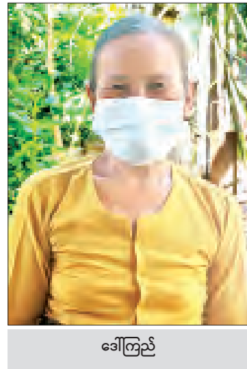
ဒေါ်ကြည်