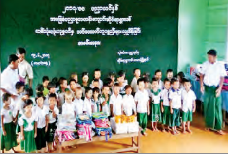
လုံးခင်းနယ်မြေ ဆိုင်းရာရွာသစ် အခြေခံပညာမူလတန်းကျောင်းအတွက် တစ်သုံးလုံးကျောက်မျက်ကုမ္ပဏီမှ ကျေးရွာလမ်းခင်းပေးထားမှုနှင့် သင်ထောက်ကူပစ္စည်း ၁၄ မျိုး ပေးအပ်လှူဒါန်းမှု မှတ်တမ်းများ။