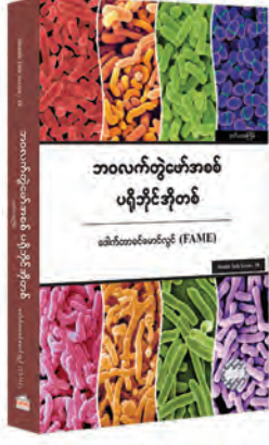
၂၀၁၈ ခုနှစ်အတွက် ထွန်းဖောင်ဒေးရှင်း စာပေဆုရ ဘဝလက်တွဲဖော်အစစ် ပရိုဘိုင်အိုတစ်