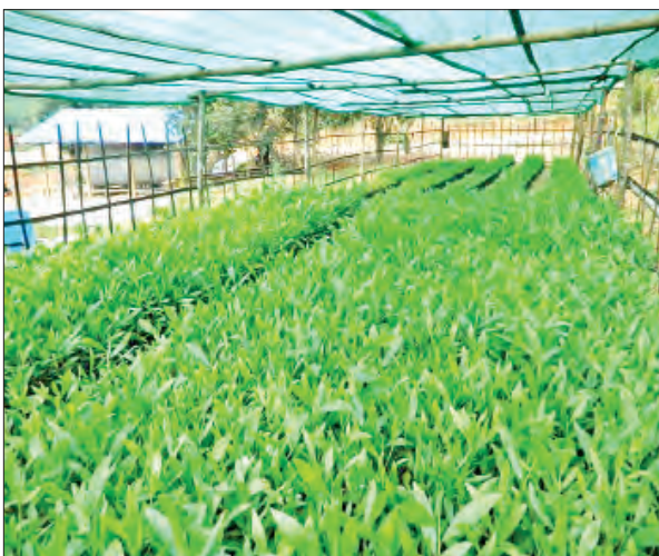
သဘာဝပတ်ဝန်းကျင်ထိန်းသိမ်းရေးလုပ်ငန်းအတွက် သတ္တုတူးဖော်သည့် ကုမ္ပဏီများက သစ်ပင်စိုက်ပျိုးထားရှိမှုများ