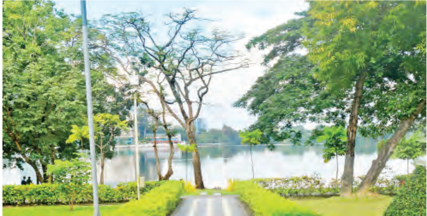
ရန်ကုန်တက္ကသိုလ်ဝန်းကျင် အင်းလျားကန်နှင့် စိန်ပန်းအလှ။