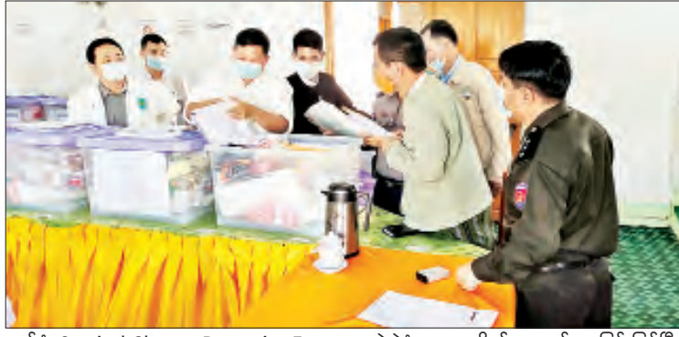
ဝတ်စုံ၊ Surgical Glove၊ Protective Face Mask၊ Goggles၊ Boots စသည့် ပစ္စည်းများကို မြို့နယ် ရွေးကောက်ပွဲကော်မရှင်အဖွဲ့ခွဲမှ ရပ်ကွက်/ကျေးရွာ ရွေးကောက်ပွဲကော်မရှင် အဖွဲ့ခွဲရုံးများအလိုက် ထုတ်ပေးခြင်းဖြစ်ပြီး လဲချားမြို့နယ်တွင် မဲရုံပေါင်း ၃၆ ရုံအတွက် စနစ်တကျထုတ်ပေးလျက်ရှိကြောင်း သိရသည်။ လွှမ်းသူဇောင် (ပြန်/ဆက်)

လဲချား နိုဝင်ဘာ ၃ ရှမ်းပြည်နယ်(တောင်ပိုင်း) လဲချားမြို့နယ်၌ ၂၀၂၀ ပြည့်နှစ် ပါတီစုံဒီမိုကရေစီ အထွေထွေ ရွေးကောက်ပွဲတွင် မဲရုံအလိုက် အသုံးပြုရန် မဲရုံသုံးပစ္စည်းများနှင့် မဲရုံအလိုက် တာဝန်ထမ်းဆောင်ကြမည့်သူများနှင့် မဲဆန္ဒရှင်ပြည်သူများအား ဖြန့်ဝေရန် ကိုဗစ်-၁၉ ရောဂါ ကာကွယ်ရေးသုံးပစ္စည်းများကို မြို့နယ်ရွေးကောက်ပွဲကော်မရှင်အဖွဲ့ခွဲမှ အထွေထွေအုပ်ချုပ်ရေးဦးစီးဌာန အစည်းအဝေးခန်းမ၌ ယနေ့နံနက် ၉ နာရီကစ၍ ဖြန့်ဝေပေးလျက်ရှိသည်။ ထိုသို့ ဖြန့်ဝေပေးရာတွင် မဲရုံသုံးပစ္စည်းများနှင့် ကိုဗစ်-၁၉ ရောဂါ ကာကွယ်ရေးသုံးပစ္စည်းများဖြစ်သည့် KN -95၊ Face Shield၊ Surgical Gown၊ Medical Cap၊ PPE Level-3