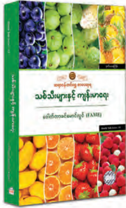
၂၀၁၇ ခုနှစ်အတွက် ဆရာဝန်တင်ပြစာပေဆုရ သစ်သီးများနှင့် ကျန်းမာရေး