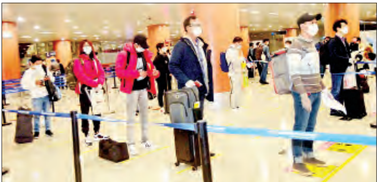
ကိုရီးယားနိုင်ငံမှ ပြန်လည်ရောက်ရှိလာသော မြန်မာနိုင်ငံသားများအား ရန်ကင်း အပြည်ပြည်ဆိုင်ရာလေဆိပ်၌ တွေ့ရစဉ်။

ပြည်ပ၌ အခက်အခဲကြုံတွေ့နေရသည့် မြန်မာ နိုင်ငံသားများအား ဆိုးလ်မြို့ရှိ မြန်မာသံရုံးမှ စီစဉ်သည့် (၂၉)ကြိမ်မြောက် မြန်မာ