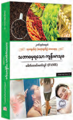
၂၀၀၆ ခုနှစ်အတွက် သုတေသနဆိုင်ရာ (အသုံးချသိပ္ပံ) စာပေဆုရ သဘာဝပတ်ဝန်းကျင်ထိခိုက်မှုများ