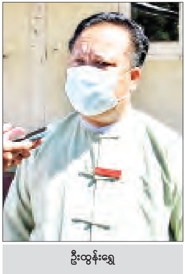
ဦးထွန်းရွှေ

နိုဝင်ဘာ ၈ ရက်တွင် ကျင်းပမည့် ၂၀၂၀ ပြည့်နှစ် ပါတီစုံဒီမိုကရေစီ အထွေထွေရွေးကောက်ပွဲအတွက် ကြိုတင်ဆန္ဒမဲပေးပိုင်ခွင့်ရှိသူများအနေဖြင့် အောက်တိုဘာ ၂၉ ရက်မှစတင်၍ ကိုဗစ် - ၁၉ ရောဂါ ကာကွယ် ထိန်းချုပ်၊ ကုသရေးလုပ်ငန်း စဉ်များနှင့်အညီ မဲရုံများသို့ လာရောက်၍ ကြိုတင်ဆန္ဒမဲများ ပေးလျက်ရှိကြသည်။ ပြည်ထောင်စုနယ်မြေ နေပြည်တော် ဒက္ခိဏာဒီမိုကရေစီ၊ ဧမ္မာဒီရီမြို့နယ်၊ ဒက္ခိဏာဒီမိုကရေစီ၊ ဖျဉ်းမနားမြို့နယ်၊ လယ်ဝေးမြို့နယ်နှင့် ဥတ္တရဒီမိုကရေစီဒေယျာသီရိမြို့နယ်၊ တပ်ကုန်းမြို့နယ်၊ ပုပ္ဖသီရိမြို့နယ်နှင့် ဥတ္တရဒီမိုကရေစီဒေယျာသီရိမြို့နယ်တို့တွင်လည်း ကြိုတင်ဆန္ဒမဲပေးခွင့်ရှိသူ မဲဆန္ဒရှင်ပြည်သူများသည် သက်ဆိုင်ရာရပ်ကွက်/ကျေးရွာ ရွေးကောက်ပွဲကော်မရှင်အဖွဲ့ခွဲရုံးများနှင့် မဲရုံများသို့လာရောက်၍ လှူဒါန်းဆန္ဒပြု မဲပေးလျက်ရှိကြသည်။