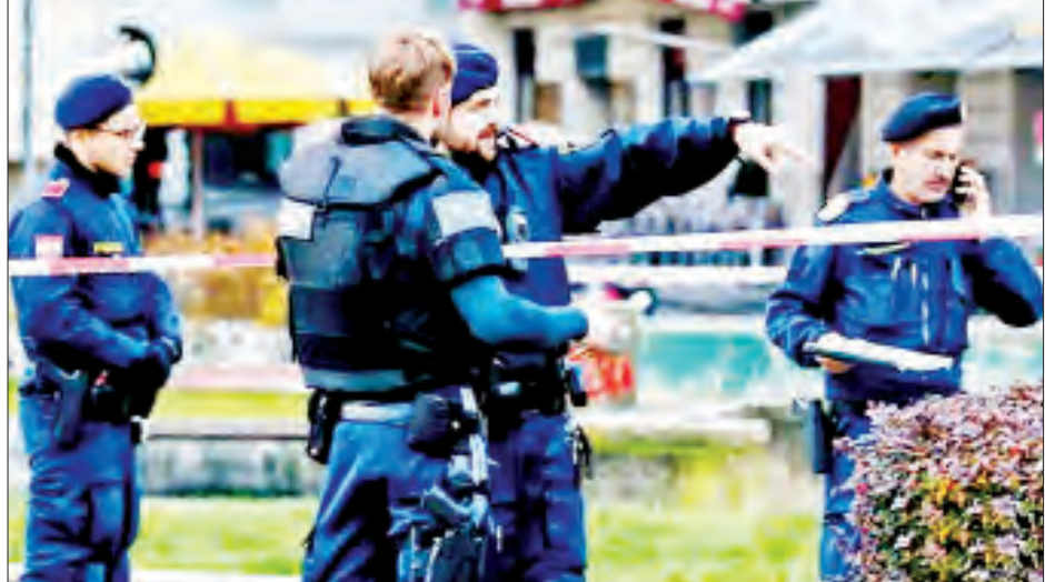
နိုဝင်ဘာ ၃ ရက်က ဗီယင်နာမြို့လယ်တွင် ရဲတပ်ဖွဲ့ဝင်များ လုံခြုံရေးတာဝန်ထမ်းဆောင်မှုကို တွေ့ရစဉ်။

ဘရာဟင်အီဆောင်စီဆိုင်ရာ တူနီးရှားနိုင်ငံသားသည် ဘာသာရေးကျောင်း၌ ဓားဖြင့်တိုက်ခိုက်မှုပြုလုပ်ခဲ့ပြီးနောက် လုံခြုံရေးရဲတပ်ဖွဲ့က သေနတ်ဖြင့် အချက်ပေါင်းများစွာပစ်ခတ်ခဲ့ပြီး ဆေးရုံတင်ထားရကြောင်း သိရသည်။ တိုက်ခိုက်ရေးသမားကို စစ်ကြောမေးမြန်းမှု မလုပ်ရသေးကြောင်း၊ အကြောင်းမှာ ၎င်း၏ ရောဂါအလားအလာ မသေချာသေးသောကြောင့်ဖြစ်ကြောင်း အခြား စုံစမ်းရေးသတင်းရင်းမြစ်က ဖော်ပြထားသည်။ တူနီးရှားနိုင်ငံ၏ အကြမ်းဖက်မှုနှင့် မူးယစ်ဆေးဝါးနှိမ်နင်းရေးရဲတပ်ဖွဲ့ဝင်ဟု သိရသော အီဆောင်စီသည် ပြီးခဲ့သည့်လက ပြင်သစ်နိုင်ငံသို့ ရောက်ရှိလာခဲ့ကြောင်း သိရသည်။