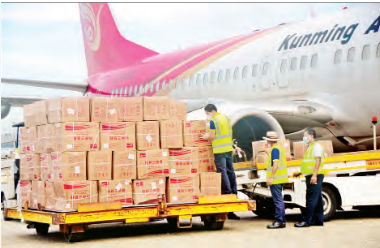
ပါတီစုံဒီမိုကရေစီအထွေထွေရွေးကောက်ပွဲအတွက် တရုတ်ပြည်သူ့သမ္မတနိုင်ငံမှ ဝယ်ယူထားသည့် ကိုဗစ်-၁၉ ရောဂါ ကာကွယ်၊ ထိန်းချုပ်၊ ကုသရေး အထောက်အကူပစ္စည်းများ ရန်ကုန်အပြည်ပြည်ဆိုင်ရာလေဆိပ်သို့ ရောက်ရှိစဉ်။

နေပြည်တော် နိုဝင်ဘာ ၃ နိုဝင်ဘာ ၈ ရက်တွင် ကျင်းပမည့် ပါတီစုံဒီမိုကရေစီအထွေထွေရွေးကောက်ပွဲတွင် မဲဆန္ဒရှင်များ၊ မဲရုံတာဝန်ကျဝန်ထမ်းများနှင့် စေတနာ့ဝန်ထမ်းများအား ကိုဗစ်-၁၉ ရောဂါ ကာကွယ်၊ ထိန်းချုပ်၊ ကုသရေးအတွက် ဖြန့်ဝေပေးမည့် တရုတ်ပြည်သူ့သမ္မတနိုင်ငံမှ ဝယ်ယူထားသောပစ္စည်းများ ရန်ကုန်အပြည်ပြည်ဆိုင်ရာလေဆိပ်နှင့် မန္တလေးအပြည်ပြည်ဆိုင်ရာလေဆိပ်တို့သို့ ယနေ့တွင် အထူးလေယာဉ်များဖြင့် ဆက်လက်ရောက်ရှိသည်။