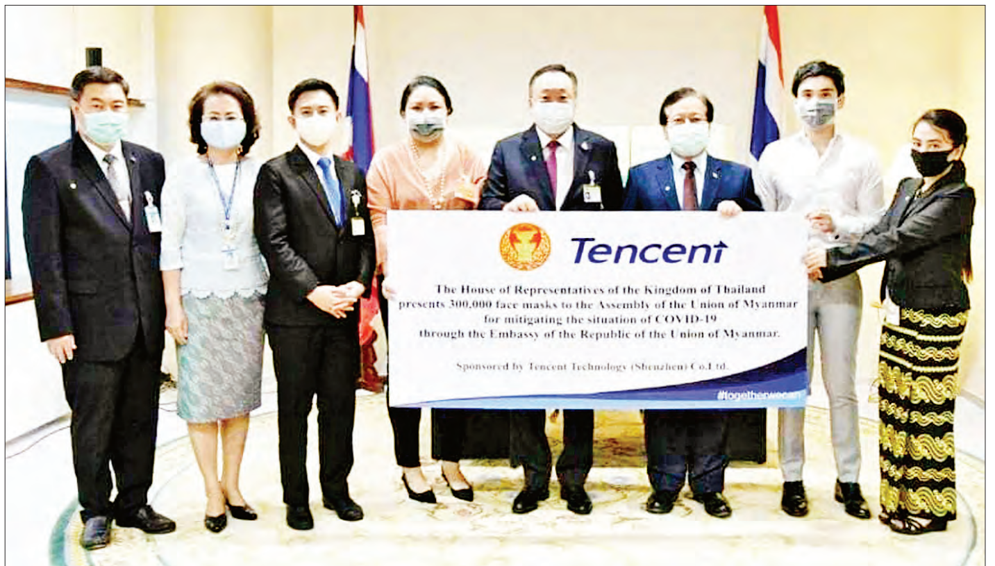
နေပြည်တော် နိုဝင်ဘာ ၃ Coronavirus Disease 2019 (COVID-19) ကာကွယ်ရေးတွင် အသုံးပြုရန်အတွက် ပြည်သူ့ လွှတ်တော်ဥက္ကဋ္ဌ ဦးတီခွန်မြတ်ထံသို့ ထိုင်းနိုင်ငံအောက်လွှတ်တော်ဥက္ကဋ္ဌ Mr. Chuan Leekpai က ဧပြီ ၂၄ ရက်တွင် နှာခေါင်းစည်း ၂၀၀၀ ကို လည်းကောင်း၊ ထိုင်းနိုင်ငံ အောက်လွှတ်တော် ဒုတိယဥက္ကဋ္ဌ Mr. Suchart Tonjaroen က ဇွန် ၂၆ ရက်တွင် နှာခေါင်းစည်း ၆၀၀၀၀ နှင့် အောက်တိုဘာ ၂၉ ရက်တွင် နှာခေါင်းစည်း ၃၀၀၀၀၀ တို့ကို