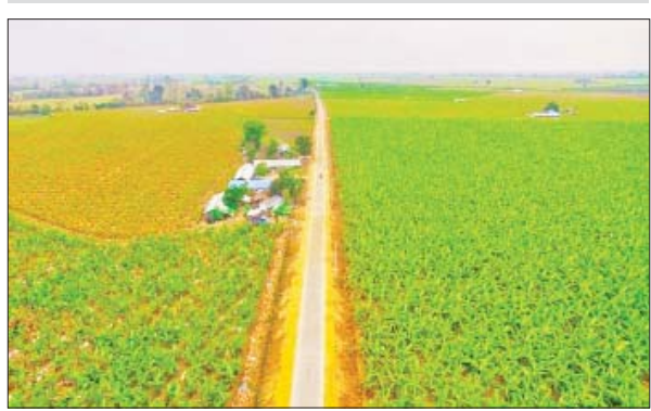
ကချင်ပြည်နယ် ဝိုင်းမော်မြို့နယ် မုတ်လွဲ-ခတ်ချို-မခန္တီး-နောင်ဟီး-စန်းကား-တာဆန်း-ဥလောက် ကျေးရွာချင်းဆက်လမ်း။