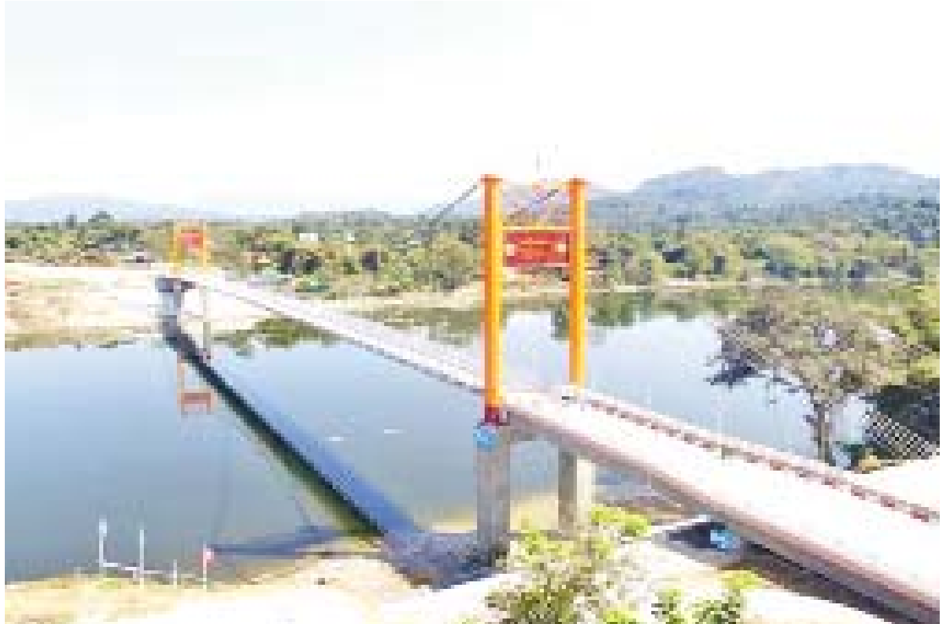
မချမ်းဘော-ဖရူခ-ရပ်ဘော-နောင်မွန်လမ်းပေါ်ရှိ မလိခတံတား(မချမ်းဘော) ပေ ၈၄၀ တည်ဆောက်ပြီးစီးမှုကို တွေ့ရစဉ်။

ပြည်ထောင်စု/ပြည်နယ် ရန်ပုံငွေများဖြင့် မြစ်ကြီးနား- ဆွမ်ပရာဘွမ်-ပူတာအိုလမ်းပေါ်ရှိ တီယန်ဇွပ်တံတား ပေ ၃၀၀၊ ဒရူခ တံတား ပေ ၂၀၀၊ စီနှင့်ခတံတား ၂၀၄ ပေ၊ ဖုန်ချန်တံတားပေ ၁၈၀၊ ဆွမ်ပီယန်တံတား ပေ ၁၇၀ တံတားကြီးများအား သံကူကွန်ကရစ် တံတားကြီးများအဖြစ် အဆင့်မြှင့် တင်တည်ဆောက်ပြီးစီးခဲ့ပြီး ၂၀၂၀-၂၀၂၁ ဘဏ္ဍာနှစ်တွင် ကျန်ရှိသည့် ဖုန်အင်တံတား ၂၃၅ ပေအား သံကူကွန်ကရစ်တံတားများအဖြစ် အခိုင်အမာ တည်ဆောက်ပေးရန် လျာထားဆောင်ရွက်လျက်ရှိ