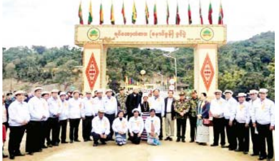
မချမ်းဘော-ဖရူခ-ရပ်ဘော-နောင်မွန်လမ်းပေါ်ရှိ တံတားအမှတ်(၁/၅၀)ရပ်ဘောတံတား ဖွင့်ပွဲအခမ်းအနား၌ တာဝန်ရှိသူများ မှတ်တမ်းဓာတ်ပုံရိုက်ကြစဉ်။

ပြည်ထောင်စု/ပြည်နယ် ရန်ပုံငွေများဖြင့် မြစ်ကြီးနား- ဆွမ်ပရာဘွမ်-ပူတာအိုလမ်းပေါ်ရှိ တီယန်ဇွပ်တံတား ပေ ၃၀၀၊ ဒရူခ တံတား ပေ ၂၀၀၊ စီနှင့်ခတံတား ၂၀၄ ပေ၊ ဖုန်ချန်တံတားပေ ၁၈၀၊ ဆွမ်ပီယန်တံတား ပေ ၁၇၀ တံတားကြီးများအား သံကူကွန်ကရစ် တံတားကြီးများအဖြစ် အဆင့်မြှင့် တင်တည်ဆောက်ပြီးစီးခဲ့ပြီး ၂၀၂၀-၂၀၂၁ ဘဏ္ဍာနှစ်တွင် ကျန်ရှိသည့် ဖုန်အင်တံတား ၂၃၅ ပေအား သံကူကွန်ကရစ်တံတားများအဖြစ် အခိုင်အမာ တည်ဆောက်ပေးရန် လျာထားဆောင်ရွက်လျက်ရှိ