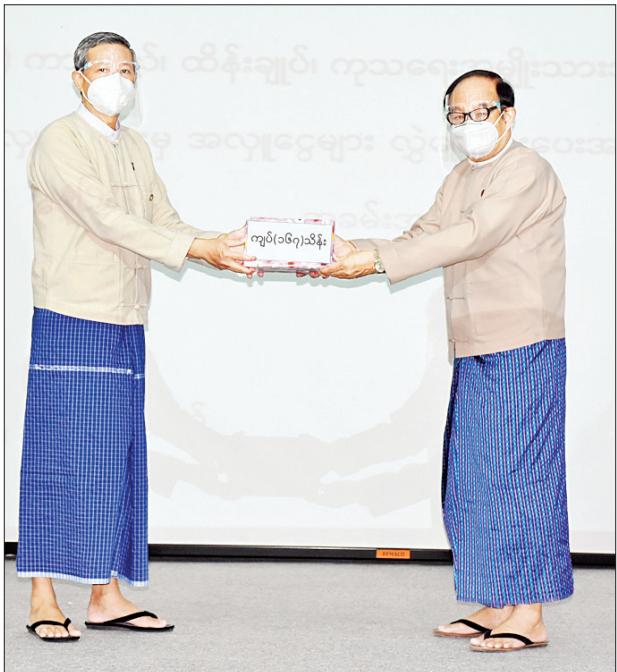
ပြည်ထောင်စုဝန်ကြီး ဒေါက်တာမျိုးသိမ်းကြီး ပညာရေးဝန်ကြီးဌာန ဝန်ထမ်းမိသားစုက စုပေါင်းလှူဒါန်းသည့် အလှူငွေကို ပေးအပ်လှူဒါန်းရာ ပြည်ထောင်စုဝန်ကြီး ဒေါက်တာမြင့်ထွေး လက်ခံစဉ်။