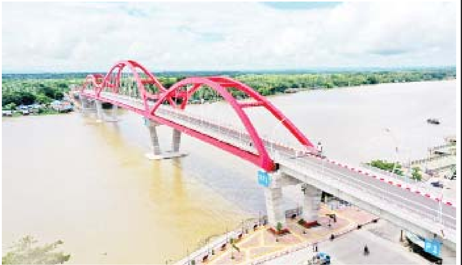
ပုသိမ်တံတားအား တွေ့ရစဉ်။

ပုသိမ်တံတားသည် ဧရာဝတီတိုင်းဒေသကြီး ပုသိမ်ခရိုင် ပုသိမ်မြို့ မဟာဗန္ဓုလလမ်းနှင့် ငဝန်မြစ်အနောက်ဘက်ကမ်းရှိ လူနေရပ်ကွက်များသို့ တိုက်ရိုက်ဆက်သွယ်ထားသော တံတားတစ်စင်းဖြစ်ပြီး မူလပုသိမ်ကြီးတံတား၏ ခံနိုင်ရည် လျော့နည်းလာမှုကြောင့် လည်းကောင်း၊ ပုသိမ်မြို့၏ ဖွံ့ဖြိုးတိုးတက်မှု မြန်ဆန်လာသည်နှင့်အမျှ ငဝန်မြစ်၏ အနောက်ဘက်ခြမ်းတွင် မြို့ပြအိမ်ရာများ တိုးချဲ့လာ၍ လည်းကောင်း၊ ချောင်းသာ/ငွေဆောင်ကမ်းခြေအပါအဝင် ဧရာဝတီတိုင်းဒေသကြီးနှင့်ရခိုင်ပြည်နယ် ကမ်းခြေပတ်လမ်းများကို ချိတ်ဆက်သွားလာနိုင်ရန် လည်းကောင်း တည်ဆောက်ခဲ့ခြင်း ဖြစ်သည်။