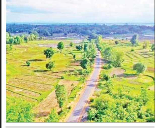
ပဲခူးတိုင်းဒေသကြီး ရွှေတောင်မြို့နယ် ညောင်စာရေး-ကွေ့မလမ်း။