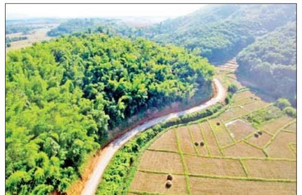
ရှမ်းပြည်နယ်(အရှေ့ပိုင်း) တာချီလိတ်ခရိုင် တာချီလိတ်မြို့နယ် ယန်းကျောက်-ကော်မယ်လိတ်-မလိပါကော်ဖတ်ဟီ(အောက်)-ဝေလု-ဝေလေလန်(အခါ) လမ်း။