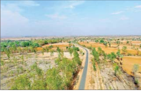
မကွေးတိုင်းဒေသကြီး မကွေးခရိုင် နတ်မောက်မြို့နယ် ငွေးကုန်း-ဝက်ချုပ်-နတ်မောက်လမ်း။

ကျေးလက်လမ်းဖွံ့ဖြိုးရေးဦးစီးဌာနက တိုင်းဒေသကြီး / ပြည်နယ် ၁၅ ခုတွင် Pilot Project လမ်း ၂၅ လမ်း ဆောင်ရွက်ရာတွင် ကွန်ကရစ်လမ်း ၅၁ မိုင် ၆ ဗာလုံ၊ ကတ္တရာလမ်း ၁၄၈ မိုင် ၅ ဗာလုံ၊ ကတ္တရာ ထပ်ပိုးလွှာ ၃၅ မိုင် ၃ ဗာလုံ၊ ကျောက်လမ်း ၉၁ မိုင် ၁ ဗာလုံ၊ အမာခံလမ်း ၄ မိုင် ၅ ဗာလုံ၊ မြေလမ်း ၉၁ မိုင် ၆ ဗာလုံ၊ ပေါင်း ၄၂၃ မိုင် ၂ ဗာလုံနှင့် လမ်းပေါ်ရှိ တံတား / Box Culvert ပေါင်း ၄၉၈ စင်း ဆောင်ရွက်ပြီးစီးခဲ့သည်။