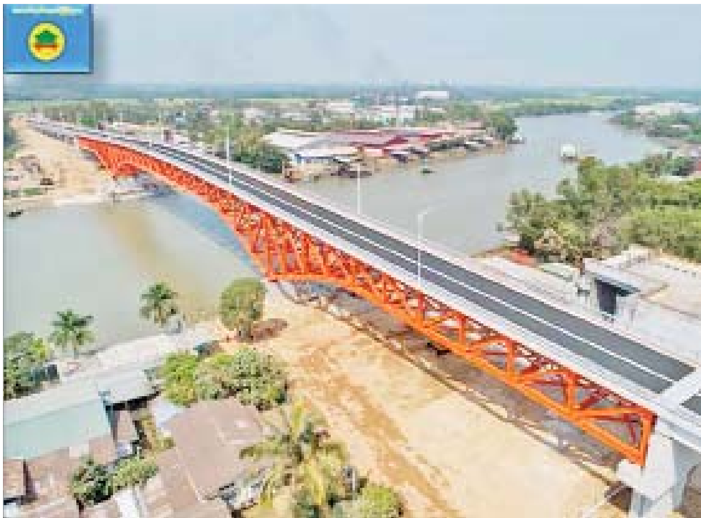
လပွတ္တာ-မြောင်းမြ-အိမ်မဲ-ကျောင်းကုန်း-ကျိုပျော်လမ်းပေါ်ရှိ မြောင်းမြတံတား။

မြောင်းမြတံတား အသစ် ဖြစ်ပေါ်လာမှုကြောင့် မြောင်းမြမြို့နယ်ရှိ ရပ်ကွက်ပေါင်း ၁၆ ရပ်ကွက်၊ ကျေးရွာအုပ်စုပေါင်း ၉၈ အုပ်စုနှင့် ကျေးရွာပေါင်း ၅၀၂ ရွာတို့မှ ဒေသခံပြည်သူ လူထု သုံးသိန်းကျော်တို့ လုံခြုံစိတ်ချစွာ တံတားကြီးအား ဖြတ်ပြီး ကူးလူးသွားလာနိုင်မည် ဖြစ်သည့်အတွက် ပညာရေး၊ စီးပွားရေး၊ ကျန်းမာရေး၊ လူမှုရေးကိစ္စရပ်များတွင် ယခင်ကထက် ပိုမိုတိုးတက်လာမည်