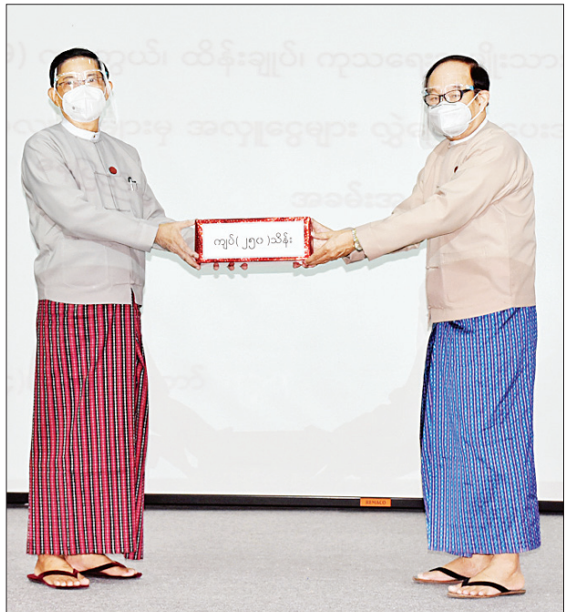
ပြည်ထောင်စုဝန်ကြီး ဦးမင်းသူ ပြည်ထောင်စုအစိုးရအဖွဲ့ရုံးဝန်ကြီးဌာန ဝန်ထမ်းမိသားစုက စုပေါင်းလှူဒါန်းသည့် အလှူငွေကို ပေးအပ်လှူဒါန်းရာ ပြည်ထောင်စုဝန်ကြီး ဒေါက်တာမြင့်ထွေး လက်ခံစဉ်။