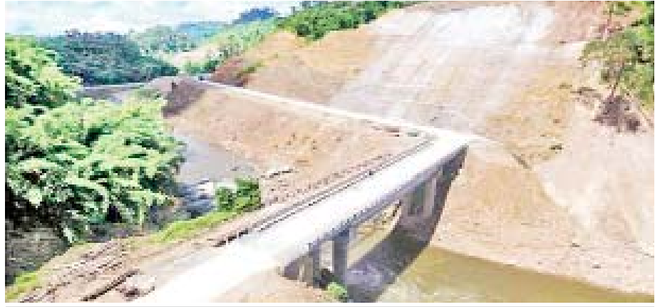
မြစ်ကြီးနား-ဆွမ်ပရာဘွမ်-ပူတာအိုလမ်းပေါ်ရှိ တံတားအမှတ်(၆/၁၁၁) စီနင်ခံတံတား ၂၀၄ ပေ တည်ဆောက်ပြီးစီးမှုကို တွေ့ရစဉ်။

၂၀၂၀-၂၀၂၁ ဘဏ္ဍာနှစ်တွင် ပြည်ထောင်စု/ပြည်နယ် ဘဏ္ဍာရန်ပုံငွေကျပ် ၁၀၇၉၅ ဒသမ ၂၄၀ သန်းဖြင့် ကွန်ကရစ်လမ်းခင်းရန် ၆/၁ မိုင် လျာထားပြီး ဘဏ္ဍာနှစ်ကုန်တွင် မြစ်ကြီးနားမှ ပူတာအိုအထိ ကွန်ကရစ်လမ်း၊ ကတ္တရာလမ်းများ တစ်ဆက်တည်း ဆက်သွယ်သွားလာနိုင်မည်ဖြစ်သည်။ ယခုအခါ ရာသီမရွေးလမ်းများ ဆက်သွယ်သွားလာကောင်းမွန်နေပြီဖြစ်သည့်အတွက် မြစ်ကြီးနားမှ ပူတာအိုသို့ နေ့ချင်းပေါက် ၉ နာရီခန့်ဖြင့် ဆက်သွယ်သွားရောက်နိုင်ပြီ ဖြစ်သည်။