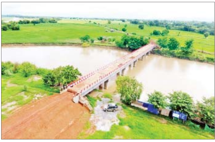
ကရင်ပြည်နယ် ဘားအံမြို့နယ် ထုံးအိုင်-မိန်းမလှကျွန်း-ဖအွဲ-ဖဲကတာလမ်းပေါ်ရှိ သံကူကွန်ကရစ်တံတား။

ပေ ၁၈၀ အထက် အထင်ကရတံတားများအနေဖြင့် ဆောင်ရွက်ခဲ့သော ကွန်ကရစ်တံတား ၆၃ စင်းနှင့် ဘေလီတံတား ၁၂ စင်း အပါအဝင် ၂၀၁၇-၂၀၁၈ ဘဏ္ဍာရေးနှစ်မှ ယနေ့အထိ ကွန်ကရစ်တံတား ၁၈၅၆ စင်း၊ သစ်သားတံတား ၆၁ စင်း၊ ဘေလီ/ကြိုးတံတား ၁၈၃ စင်း၊ ရေကျော်/Box Culvert ၅၄၁၉ စင်း စုစုပေါင်း ၇၅၁၉ စင်းအား ဆောင်ရွက်နိုင်ခဲ့။