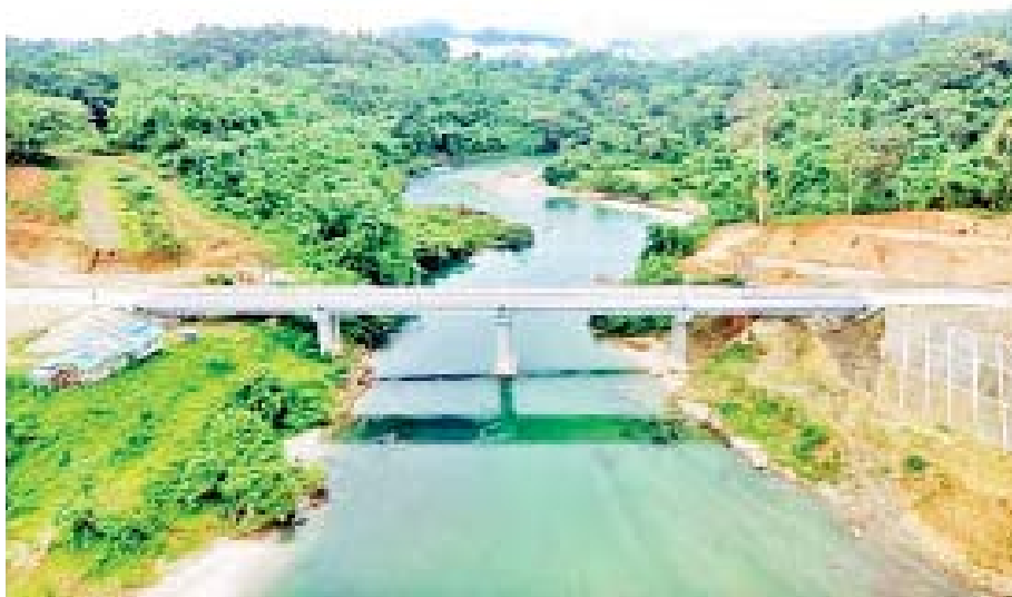
၂၀၁၉-၂၀၂၀ ဘဏ္ဍာနှစ် မချမ်းဘော-ဖရူခ-ရပ်ဘော-နောင်မွန်လမ်းပေါ်ရှိ တံတားအမှတ်(၁/၈)ထိခတ်တား ပေ ၄၀၀ တည်ဆောက်ပြီးစီးမှုကို တွေ့ရစဉ်။