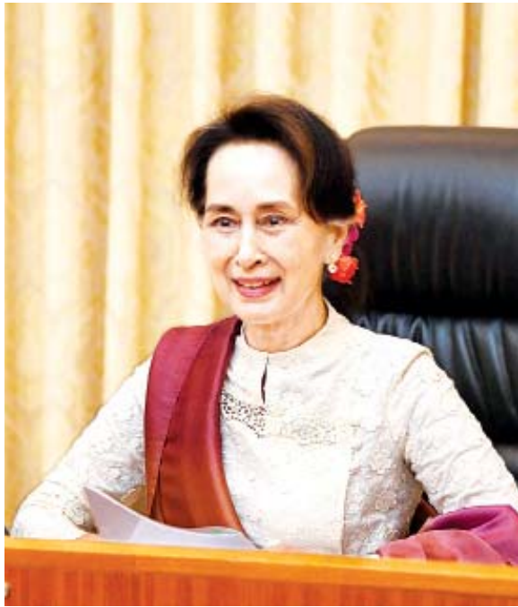
(Coronavirus Disease 2019 (COVID-19) ကာကွယ်၊ ထိန်းချုပ်၊ ကုသရေး အမျိုးသားအဆင့် ဗဟိုကော်မတီဥက္ကဋ္ဌ၊ နိုင်ငံတော်၏အတိုင်ပင်ခံပုဂ္ဂိုလ် ဒေါ်အောင်ဆန်းစုကြည် ၁၆-၁၀-၂၀၂၀ ရက်နေ့တွင် ကိုဗစ်-၁၉ ရောဂါဖြစ်ပွားမှု နောက်ဆုံးအခြေအနေနှင့် စပ်လျဉ်း၍ ပြည်သူများသို့ အစီရင်ခံတင်ပြသည့် မိန့်ခွန်းမှ ကောက်နုတ်ချက်)

ရွေးကောက်ပွဲအတွက် နောက်ဆုံးစည်းမျဉ်းစည်းကမ်းတွေကို ထုတ်ပြန်ပါမယ်။ ဒါကတော့ ရွေးကောက်ပွဲကော်မရှင်က ကျန်းမာရေးနှင့် အားကစားဝန်ကြီးဌာနနဲ့ညှိပြီးတော့ ထုတ်ပြန်မှာပါ။ ဒီလို လုပ်တဲ့နေရာမှာ နေရာတိုင်းနေရာတိုင်းမှာ တစ်ပြေးညီလုပ်မှာ မဟုတ်ပါဘူး။ Stay at Home မြို့နယ် တွေ၊ ကိုဗစ်ရောဂါ ပြန့်ပွားမှုများတဲ့ မြို့နယ်တွေမှာ အထူးအစီအစဉ်ကို ကျွန်မတို့လုပ်ပါမယ်။ ကိုဗစ်ရောဂါ မရှိသလောက် မြို့နယ်တွေမှာတော့ ပုံမှန်အတိုင်းပဲ လုပ်သွားပါမယ်။ သို့သော်လည်း Mask တပ်ဖို့ လက်ဆေးဖို့တွေကို ကျွန်မတို့ စီစဉ်ပါမယ်။ Stay at Home မြို့နယ်တွေ၊ ကိုဗစ်ရောဂါပြန့်ပွားမှုများတဲ့ မြို့နယ်တွေမှာဆိုရင် Mask တွေအပြင် Faceshield ကို အပေါ်က နောက်တစ်ထပ်လုပ်ဖို့ စသဖြင့် ပိုပြီးတော့သေချာတဲ့ အစီအစဉ်တွေကို သတ်မှတ်ပြီးတော့ အကောင်အထည်ဖော်မှာပါ။ ဒါကြောင့် ပြည်သူ့ ပြည်သားတွေအနေနဲ့ အထွေထွေရွေးကောက်ပွဲမှာလည်း တက်တက်ကြွကြွနဲ့ပါဝင်ပြီးတော့ မဲပေးကြပါ။ ကိုဗစ်ရောဂါကို ကာကွယ်တဲ့နေရာမှာလည်း တက်တက်ကြွကြွနဲ့ အားလုံးပါဝင်ပြီးတော့ ဆောင်ရွက်ပေးကြပါ လို့ ကျွန်မမေတ္တာရပ်ခံလိုပါတယ်။