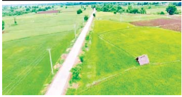
နေပြည်တော် တပ်ကုန်းမြို့နယ် မကျိုးပင်-ကျောက်စရစ်ကုန်း ကျေးရွာချင်းဆက်လမ်း။