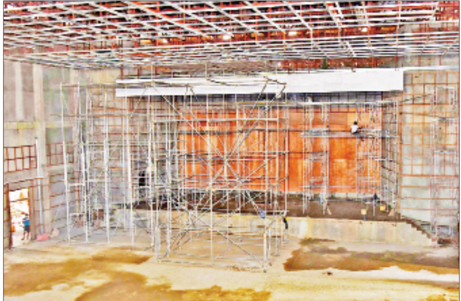
ဟားခါးတက္ကသိုလ် ဘွဲ့နှင့်သဘင်ခန်းမ တည်ဆောက်ခြင်းလုပ်ငန်းများ ဆောင်ရွက်စဉ်။ [အဆိုပါ ဘွဲ့နှင့် သဘင်ခန်းမသည် အလျား ၂၅ ပေနှင့် ခြောက်လက်မ၊ အနံ ၂၀၈ ပေရှိ သံကူကွန်ကရစ် အဆောက်အအုံ ဖြစ်ပြီး စီမံကိန်း တန်ဖိုးငွေကျပ် ၉၃၃၁ ဒသမ ၁၉၄ သန်းဖြစ်ကာ ဒီဇင်ဘာလအတွင်း တည်ဆောက်ပြီးစီးမည် ဖြစ်သည်။]

ဗန်ထီးယူသည် Hakha University Chapel တည်ဆောက်မှုအခြေအနေ ကိုကြည့်ရှုစစ်ဆေးပြီး အလျှင်အမြန် ပေးအပ်လျှာခြင်းသည်။ သတင်းစဉ်