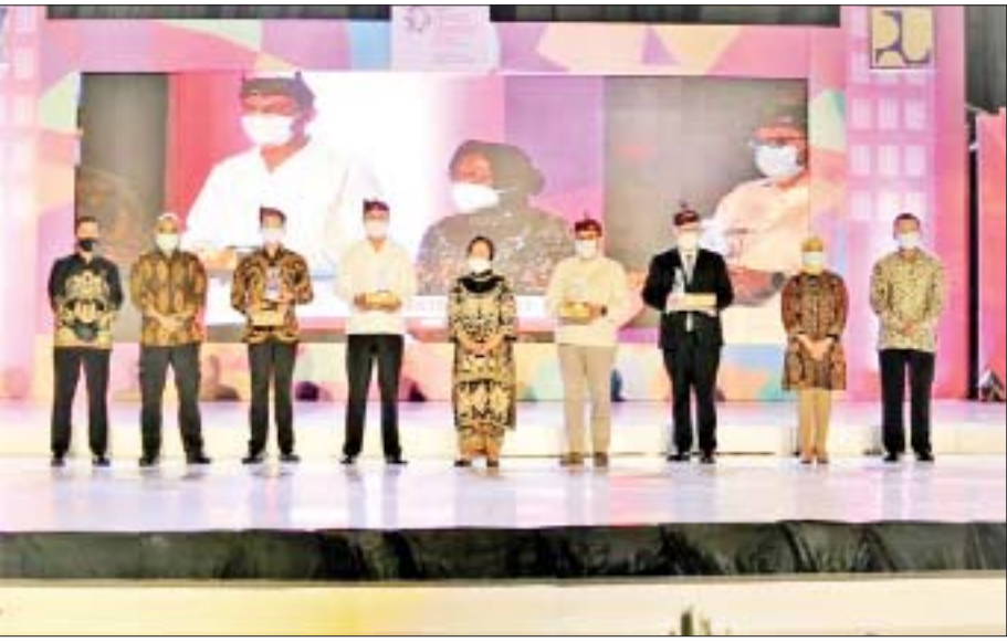
UN-Habitat မှ ပေးအပ်သည့် ဆုရရှိသူများ။

World Cities Day အား ၂၀၁၄ ခုနှစ်မှ စတင်၍ ကျင်းပလာရာ ယခုနှစ်ဆိုလျှင် ခုနှစ်ကြိမ်မြောက်သို့ ရောက်ရှိလာခဲ့ပြီဖြစ်ပါသည်။ ယခု ၂၀၂၀ ပြည့်နှစ်တွင် လူမှုအဖွဲ့အစည်းများနှင့် မြို့များအား တန်ဖိုးထားခြင်း (Valuing Our Communities and Cities) ဆိုသော ဆောင်ပုဒ်ဖြင့် တရုတ်ပြည်သူ့သမ္မတနိုင်ငံ ဖူကျူမြို့၌