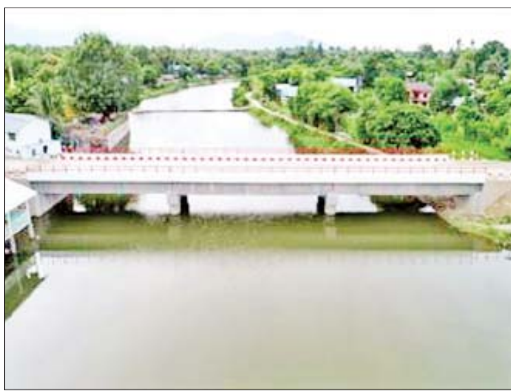
မန္တလေးတိုင်းဒေသကြီး မြစ်သားမြို့နယ် မြစ်သား-ညောင်ဝန်း-တကိုယ်တည်းလမ်းပေါ်ရှိ ပန်းလောင်မြစ်ကူးတံတား။