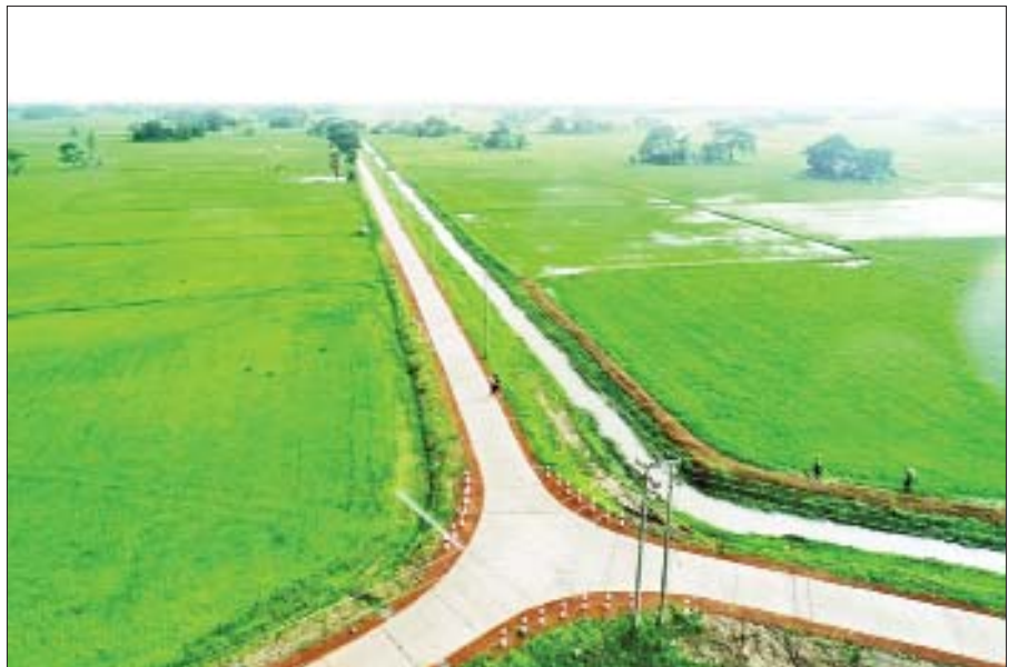
ရန်ကုန်တိုင်းဒေသကြီး ခရမ်းမြို့နယ် ပေါက်ပင် - အေးရွာ ကွန်ကရစ်လမ်း။