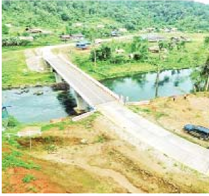
၂၀၁၉-၂၀၂၀ ဘဏ္ဍာနှစ် မချမ်းဘော-ဖရူခ-ရပ်ဘော-နောင်မွန်လမ်းပေါ်ရှိ တံတားအမှတ်(၃/၂၂) ထာခတ်တား ပေ ၂၀၀ တည်ဆောက်ပြီးစီးမှုကို တွေ့ရစဉ်။