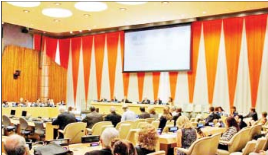
၂၀၂၀ ပြည့်နှစ် ကမ္ဘာ့လူနေမြို့ရွာနေ့ (World Habitat Day 2020) ကျင်းပစဉ်။

ဆွေးနွေးပွဲတိုင်းတွင် မကြာခင်မှာ လူ့အခွင့်အရေး ဆိုင်ရာ အတွင်းရေးမှူးက “ကပ်ရောဂါသည် အိမ်ရာ၏ အခန်းကဏ္ဍ အရေးပါမှုကို ပြသနေကြောင်း၊ ကိုဗစ်-၁၉ ကာလအတွင်းရရှိတဲ့ အခွင့်အရေးကောင်းတစ်ခုမှာ “New Normality” လူနေမှုပုံစံကို ဖန်တီးနိုင်ဖို့ အစိုးရ တွေက (ပြည်ထောင်စုနှင့် တိုင်းဒေသကြီး/ပြည်နယ်) ကောင်းမွန်သောအိမ်ရာတွေ ဖွံ့ဖြိုးတိုးတက်ရေးအတွက် ခိုင်မာတုံ့မူဝါဒတွေ ချမှတ်ခြင်းသာမက မြို့ပြတွေရဲ့ တည်ငြိမ်မှုနဲ့ လူ့အဖွဲ့အစည်း၏ ကြံ့ခိုင်မှုအတွက်ပါ အားဖြည့်ပံ့ပိုးပေးရပါမည်” ဟု တင်ပြခဲ့ပါသည်။ ဥရောပ