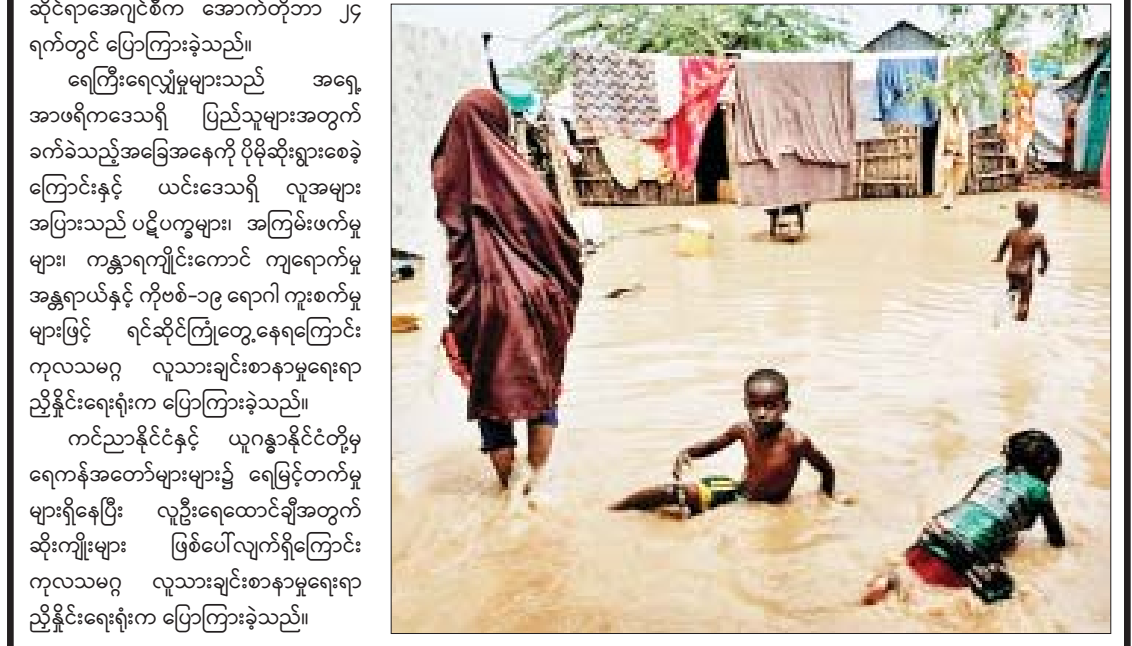
ရေကြီးရေလျှံမှုများသည် အရှေ့အာဖရိကဒေသရှိ ပြည်သူများအတွက် ခက်ခဲသည့်အခြေအနေကို ပိုမိုဆိုးရွားစေခဲ့ကြောင်းနှင့် ယင်းဒေသရှိ လူအများ အပြားသည် ပဋိပက္ခများ၊ အကြမ်းဖက်မှုများ၊ ကန္တာရကျိုင်းကောင် ကျရောက်မှု အန္တရာယ်နှင့် ကိုဗစ်-၁၉ ရောဂါ ကူးစက်မှုများဖြင့် ရင်ဆိုင်ကြုံတွေ့နေရကြောင်း ကုလသမဂ္ဂ လူသားချင်းစာနာမှုရေးရာ ညှိနှိုင်းရေးရုံးက ပြောကြားခဲ့သည်။ ကင်ညာနိုင်ငံနှင့် ယူဂန္ဒာနိုင်ငံတို့မှ ရေကန်အတော်များများ၌ ရေမြင့်တက်မှုများရှိနေပြီး လူဦးရေထောင်ချီအတွက် ဆိုးကျိုးများ ဖြစ်ပေါ်လျက်ရှိကြောင်း ကုလသမဂ္ဂ လူသားချင်းစာနာမှုရေးရာ ညှိနှိုင်းရေးရုံးက ပြောကြားခဲ့သည်။

နိုင်ဂျီဘီ အောက်တိုဘာ ၂၆ အရှေ့အာဖရိက၌ ဇွန်လနောက်ပိုင်း လူဦးရေ ၃ ဒသမ ၆ သန်းမှာ ရေကြီးရေလျှံ မှုနှင့် မြေပြိုမှုဒဏ်ခံစားခဲ့ရကြောင်း ကုလ သမဂ္ဂ လူသားချင်းစာနာထောက်ထားမှု ဆိုင်ရာအေဂျင်စီက အောက်တိုဘာ ၂၄ ရက်တွင် ပြောကြားခဲ့သည်။ တောင်ဆူဒန်နိုင်ငံ၌ ဇွန်လနောက်ပိုင်း လူဦးရေ ၈၅၆၀၀၀ မှာ ရေကြီးရေလျှံမှုဒဏ် ခံခဲ့ရပြီး လူဦးရေလေးသိန်းမှာလည်း ဘေးလွတ်ရာသို့ ရွှေ့ပြောင်းခဲ့ရကြောင်းနှင့် အီသီယိုးပီးယားနိုင်ငံ၌ လူဦးရေ ၁ ဒသမ ၁ သန်းနီးပါး ရေကြီးရေလျှံမှုဒဏ်ခံခဲ့ရပြီး လူဦးရေ ၃၃၀၀၀ မှာ ဘေးလွတ်ရာသို့ ရွှေ့ပြောင်းခဲ့ရကြောင်း သိရသည်။ ကိုးကား-ဆင်ပွား ဘာသာပြန်-အလင်းသစ်