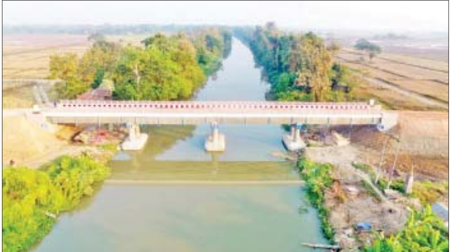
ရန်ကုန်တိုင်းဒေသကြီး လှည်းကူးမြို့နယ် ဂျိုးဂျိုးကျ-ဘိုးကရင်လေး-ကင်ပွန်းခြုံ လမ်းပေါ်ရှိ ငမိုးရိပ်ချောင်းကူးတံတား။