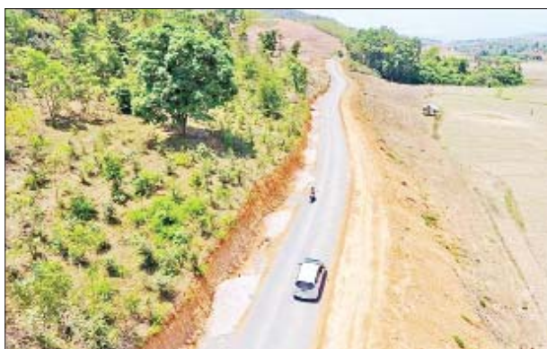
ရှမ်းပြည်နယ်(မြောက်ပိုင်း) ကျောက်မဲခရိုင် ကျောက်မဲမြို့နယ် ကွဲကုန်း-နားပြန်လမ်း။