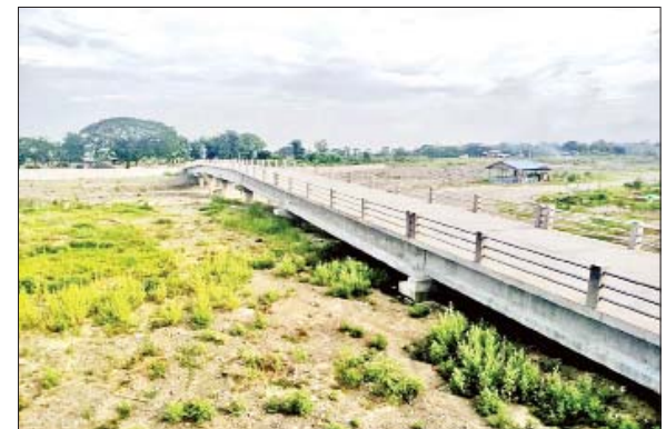
ဂျာမနီနိုင်ငံ KfW ဘဏ် အထောက်အပံ့ဖြင့် ကျေးလက်လမ်းများ ပြန်လည်ထူထောင်ရေးစီမံကိန်းမှ ကလေးမြို့နယ် ဆည်ကြီးတံတား။

ပေ ၁၈၀ အထက် အထင်ကရတံတားများအနေဖြင့် ဆောင်ရွက်ခဲ့သော ကွန်ကရစ်တံတား ၆၃ စင်းနှင့် ဘေလီတံတား ၁၂ စင်း အပါအဝင် ၂၀၁၇-၂၀၁၈ ဘဏ္ဍာရေးနှစ်မှ ယနေ့အထိ ကွန်ကရစ်တံတား ၁၈၅၆ စင်း၊ သစ်သားတံတား ၆၁ စင်း၊ ဘေလီ/ကြိုးတံတား ၁၈၃ စင်း၊ ရေကျော်/Box Culvert ၅၄၁၉ စင်း စုစုပေါင်း ၇၅၁၉ စင်းအား ဆောင်ရွက်နိုင်ခဲ့။