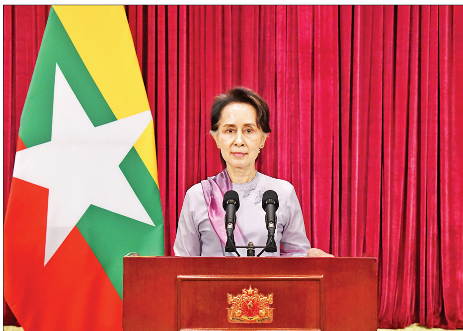
နိုင်ငံတော်၏အတိုင်ပင်ခံပုဂ္ဂိုလ် ဒေါ်အောင်ဆန်းစုကြည် ပြည်သူများသို့ အစီရင်ခံတင်ပြသည့် မိန့်ခွန်း ပြောကြားစဉ်။

ကိုဗစ်-၁၉ ရောဂါဖြစ်ပွားမှု နောက်ဆုံးအခြေအနေနှင့် စပ်လျဉ်း၍ ပြည်သူများသို့ အစီရင်ခံတင်ပြသည့် မိန့်ခွန်း