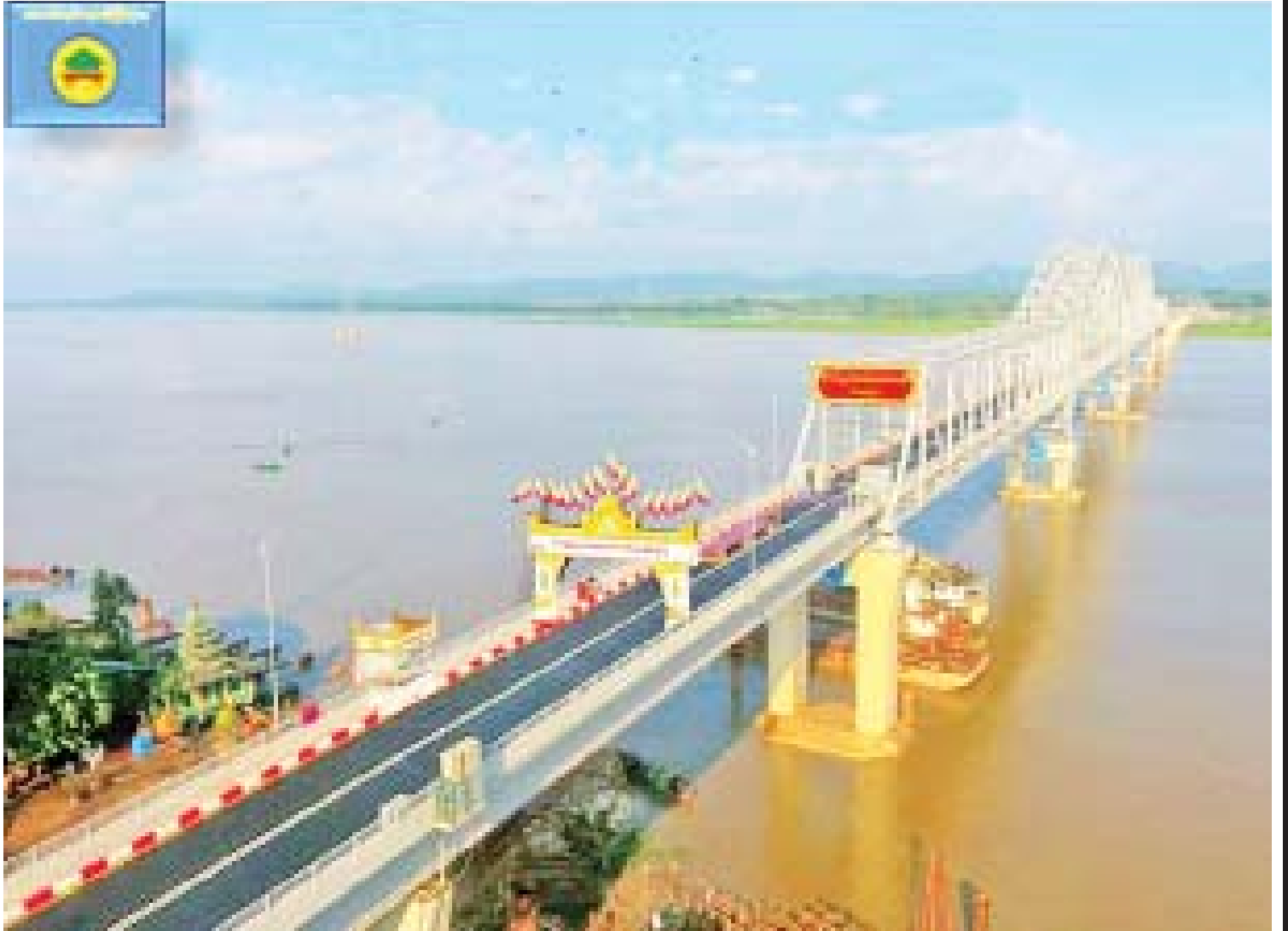
မော်လမြိုင်-ချောင်းဆုံလမ်းပေါ်ရှိ ဗိုလ်ချုပ်အောင်ဆန်းတံတား(ဘီလူးကျွန်း)။