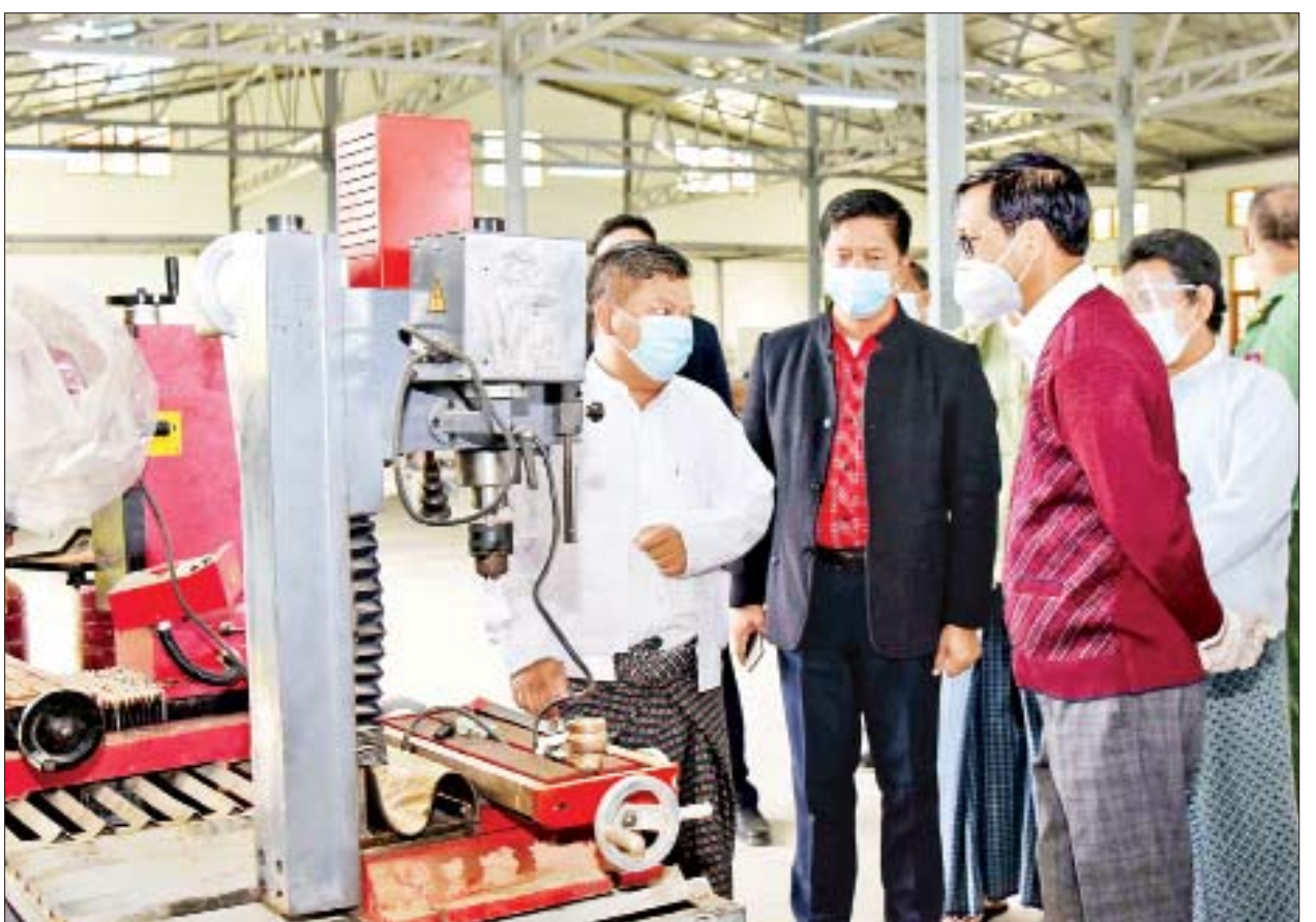
ဒုတိယသမ္မတ ဦးဟင်နရီဗန်ထီးယူ အစိုးရစက်မှုလက်မှုသိပ္ပံ (ဟားခါး) ၌ လက်တွေ့သင်ကြားပို့ချမှုများကို ကြည့်ရှုစစ်ဆေးစဉ်။

အလျား ၂၅ ပေနှင့် ခြောက်လက်မ၊ အနံ ၂၀၈ ပေရှိ သံကူကွန်ကရစ် အဆောက်အအုံဖြစ်ပြီး စီမံကိန်း တန်ဖိုးငွေကျပ် ၉၃၃၁ ဒသမ ၁၉၄