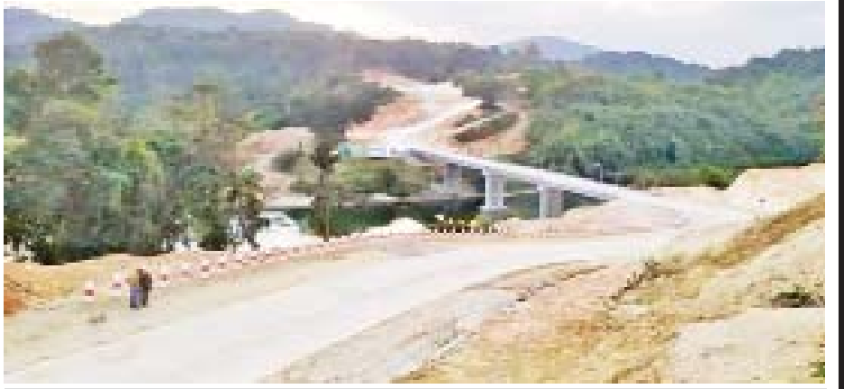
၂၀၁၉-၂၀၂၀ ဘဏ္ဍာနှစ် မချမ်းဘော-ဖရူခ-ရပ်ဘော-နောင်မွန်လမ်းပေါ်ရှိ တံတားအမှတ်(၁/၈) ထီခံတံတား၏ ချဉ်းကပ်လမ်းတာပေါင်ပေါ် ကွန်ကရစ်လမ်းခင်းခြင်းလုပ်ငန်း ဆောင်ရွက်ပြီးစီးမှုကို တွေ့ရစဉ်။