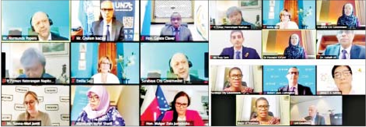
ဆွေးနွေးပွဲစကားပိုင်းများ ကျင်းပစဉ်။

မြန်မာနိုင်ငံ၏ မြို့ပြဖြစ်ထွန်းမှုနှုန်းသည် ၂၀၁၄ ခုနှစ်တွင် လူဦးရေစုစုပေါင်း၏ ၈၀ ရာခိုင်နှုန်း (၁၅ ဒသမ ၄ သန်း)ခန့်ရှိပြီး ၂၀၃၀ ပြည့်နှစ်တွင် သန်း ၂၀ ခန့်အထိ ရှိလာမည်ဟု ခန့်မှန်းထားပါသည်။ အဆိုပါ တိုးလာမည့် မြို့ပြလူဦးရေ၏ ၇၅ ရာခိုင်နှုန်းခန့်သည် လူဦးရေ တစ်သန်း နှင့်အထက်ရှိသည့် မြို့ကြီးများ တွင်ဖြစ်လာ မည် ဖြစ်သည်။ သို့ဖြစ်ရာ မြို့ကြီးများတွင် လူဦးရေစုစု တိုးပွားလာမှုကို ထိန်းသိမ်းရန်၊ တိုးတက်မှုနည်းပေး သည့် အလယ် အလတ်မြို့များ၏ ဖွံ့ဖြိုးမှုကို ပိုမိုအားပေး ရန်နှင့် စီးပွားရေး ဖွံ့ဖြိုးတိုးတက်လာသည့်အခါ မြို့ပြ ဖြစ်ထွန်းမှုမှာ ပိုမိုမြန်ဆန်လာစေပြီး မြန်ဆန်စွာဖြစ်ထွန်း ပေါ်ပေါက်လာနေသော မြို့ပြများအား ကဏ္ဍခံ ရေရှည် စဉ်ဆက်မပြတ် စာမျက်နှာ ၁၉ သို့ ○