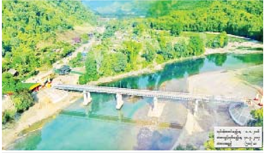
မချမ်းဘော-ဖရူခ-ရပ်ဘော-နောင်မွန်လမ်းပေါ်ရှိ တံတားအမှတ်(၁/၅၀) ရပ်ဘောတံတား ပေ ၅၀၀ တည်ဆောက်ပြီးစီးမှုကို တွေ့ရစဉ်။