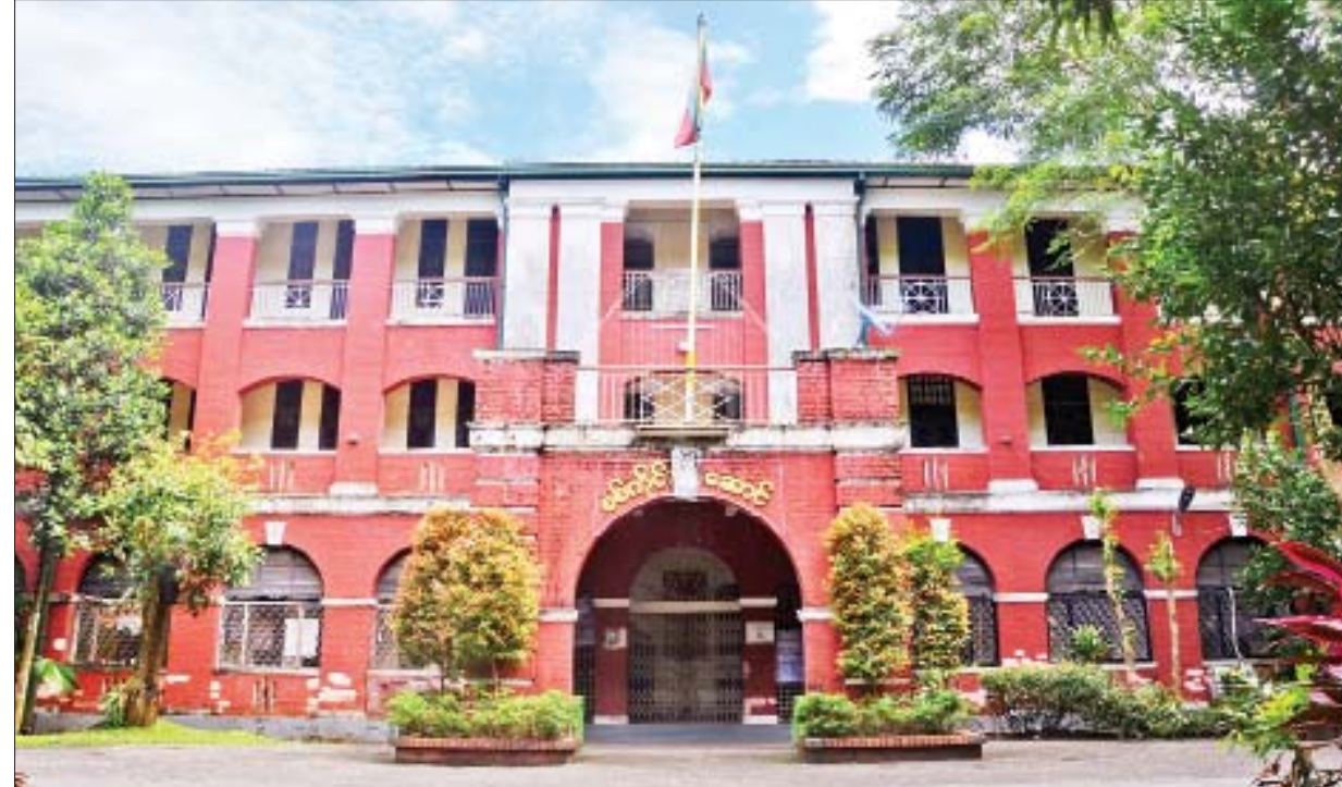
စစ်ကိုင်းဆောင်။

ဤမျှ ပေါများလှသော ကံ့ကော်တောတွင် ကံ့ကော်ပန်းတွေ ပွင့်ပြီဆိုလျှင် ကံ့ကော်ရနံ့တို့ အလွန်သင်းပျံ့လှပေသည်။ ကံ့ကော်ပွင့်ချပ်များ ကြွေကာ မြေပြီဆိုလျှင် ဖွေးဖွေးလှုပ်ကာ ပို၍ပင် မွှေးလွန်းလှပေသည်။ ဘယ်ဘဝ ဘယ်အရပ်ရောက်ရောက် မမေ့နိုင်သော အငွေ့အသက်ပဲ ဖြစ်သည်။ ထိုကံ့ကော်တန်းတို့ကလည်း သူငယ်ချင်းတွေအကြောင်း၊ ချစ်သူတွေအကြောင်း၊ ဟိုအကြောင်း၊ သည်အကြောင်းများကို ဆွေးဆွေး မြည်မြည် ပြန်ပြောပြနေပေလိမ့်မည်။