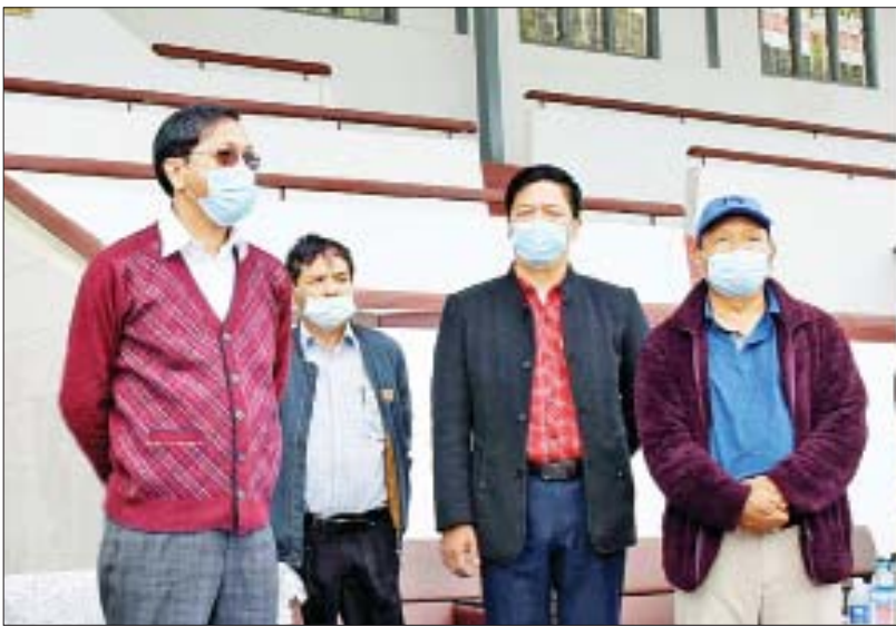
ဒုတိယသမ္မတ ဦးဟင်နရီဗန်ထီးယူ ဟားခါးမြို့ရှိ ဝမ္မသူးမောင် အားကစားကွင်း အဆင့်မြှင့်တင်တည်ဆောက်မှုကို ကြည့်ရှုစစ်ဆေးစဉ်။

ထို့နောက် ဒုတိယသမ္မတသည် ဟားခါး ပညာရေးဒီဂရီကောလိပ် သို့ ရောက်ရှိရာ ကျောင်းအုပ်ကြီး