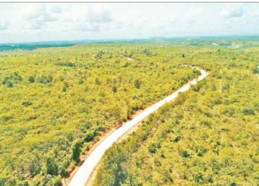
ဧရာဝတီတိုင်းဒေသကြီး သာပေါင်းမြို့နယ် ကြက်သွန်ကွင်း-သဲဖြူ-မကျီးဇင်လမ်း။