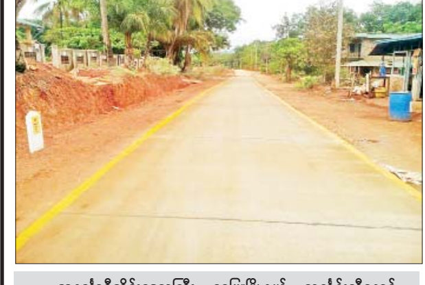
တနင်္သာရီတိုင်းဒေသကြီး ရေဖြူမြို့နယ် သင်္ကန်းညီနောင် - သဲချောင်း-သပွတ်ချောင်းလမ်း။