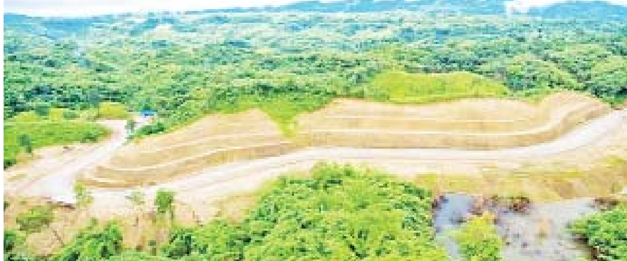
မြစ်ကြီးနား-ဆွမ်ပရာဘွမ်-ပူတာအိုလမ်း km(83.39-85.5)အတွင်း (5.49m) အကျယ် ကွန်ကရစ်ခင်းခြင်းလုပ်ငန်းဆောင်ရွက်စဉ်။

၂၀၂၀-၂၀၂၁ ဘဏ္ဍာနှစ်တွင် ပြည်ထောင်စု/ပြည်နယ် ဘဏ္ဍာရန်ပုံငွေကျပ် ၁၀၇၉၅ ဒသမ ၂၄၀ သန်းဖြင့် ကွန်ကရစ်လမ်းခင်းရန် ၆/၁ မိုင် လျာထားပြီး ဘဏ္ဍာနှစ်ကုန်တွင် မြစ်ကြီးနားမှ ပူတာအိုအထိ ကွန်ကရစ်လမ်း၊ ကတ္တရာလမ်းများ တစ်ဆက်တည်း ဆက်သွယ်သွားလာနိုင်မည်ဖြစ်သည်။ ယခုအခါ ရာသီမရွေးလမ်းများ ဆက်သွယ်သွားလာကောင်းမွန်နေပြီဖြစ်သည့်အတွက် မြစ်ကြီးနားမှ ပူတာအိုသို့ နေ့ချင်းပေါက် ၉ နာရီခန့်ဖြင့် ဆက်သွယ်သွားရောက်နိုင်ပြီ ဖြစ်သည်။