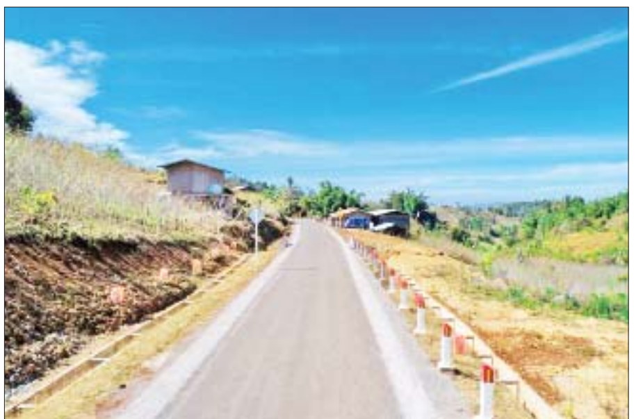
ဣန္ဒာစိန် KfW ဘဏ် အထောက်အပံ့ဖြင့် ကျေးလက်ဖွံ့ဖြိုးရေးအစီအစဉ် - အဆင့် (၂) စီမံကိန်းမှ တောင်ကြီးမြို့နယ် ကန်လောင်း - ဇလဲလမ်း ကတ္တရာလမ်း။