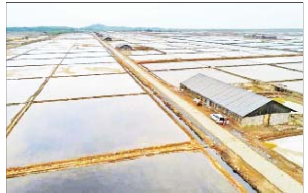
မွန်ပြည်နယ် မော်လမြိုင်ခရိုင် သံဖြူဇရပ်မြို့နယ် ပင- ကရပွဲ-ဝဲကလောင်-အံခဲ- ကော့လေး-ထင်းရှူး-ကျောင်းရွာ- အနင်းကျေးရွာချင်း ဆက်လမ်း။

ကျေးလက်လမ်းဖွံ့ဖြိုးရေးဦးစီးဌာနက တိုင်းဒေသကြီး / ပြည်နယ် ၁၅ ခုတွင် Pilot Project လမ်း ၂၅ လမ်း ဆောင်ရွက်ရာတွင် ကွန်ကရစ်လမ်း ၅၁ မိုင် ၆ ဗာလုံ၊ ကတ္တရာလမ်း ၁၄၈ မိုင် ၅ ဗာလုံ၊ ကတ္တရာ ထပ်ပိုးလွှာ ၃၅ မိုင် ၃ ဗာလုံ၊ ကျောက်လမ်း ၉၁ မိုင် ၁ ဗာလုံ၊ အမာခံလမ်း ၄ မိုင် ၅ ဗာလုံ၊ မြေလမ်း ၉၁ မိုင် ၆ ဗာလုံ၊ ပေါင်း ၄၂၃ မိုင် ၂ ဗာလုံနှင့် လမ်းပေါ်ရှိ တံတား / Box Culvert ပေါင်း ၄၉၈ စင်း ဆောင်ရွက်ပြီးစီးခဲ့သည်။