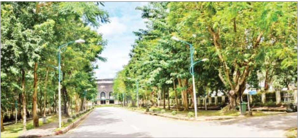
အဓိပတိလမ်း။

မြန်မာ့သမိုင်းတစ်လျှောက်တွင် လိုအပ်ချက်အရ ပေါ်ထွက်ခဲ့သူများ ရှိခဲ့ကြပါသည်။ မြန်မာနိုင်ငံသည် သူ့ကျွန်ဘဝရောက်ခဲ့ပြီးနောက် လွတ်လပ်ရေးနှင့် ဝေးနေခဲ့ရသည်။ ထိုလွတ်လပ်ရေးကို ပြန်လည်ရယူပေးမည့်သူတစ်ဦး ပေါ်ထွက်လာခဲ့ပါသည်။ ထိုသူမှာ သခင်အောင်ဆန်းမှသည် ဗိုလ်ချုပ်အောင်ဆန်းဖြစ်လာသည့် ရန်ကုန်တက္ကသိုလ်ကျောင်းသား မောင်အောင်ဆန်းပင် ဖြစ်သည်။ သမိုင်းလိုအပ်ချက်ကို သိရှိမွေးထုတ်ပေးခဲ့သည့် ရန်ကုန်တက္ကသိုလ်ဟု ဆိုနိုင်ပါလိမ့်မည်။