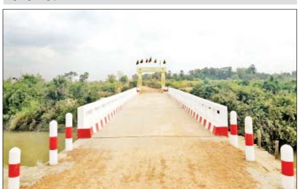
ကရင်ပြည်နယ် ဘားအံမြို့ ကျောက်စရစ်ကုန်း-အညောကုန်း တံတား။