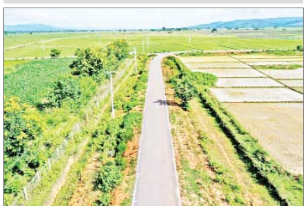
ကယားပြည်နယ် ကျေးလက်လမ်းဖွံ့ဖြိုးရေးဦးစီးဌာန ရေယိုး-နိုးကိုး-ကုန်းသာလမ်း။