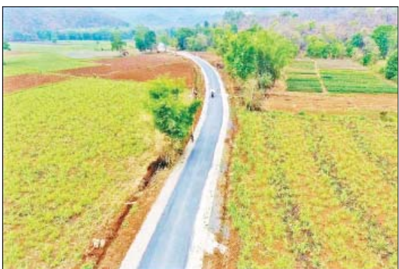
ရှမ်းပြည်နယ်(တောင်ပိုင်း) တောင်ကြီးခရိုင် ညောင်ရွှေမြို့နယ် အင်းတိန်-မှော်ဘီလမ်း။