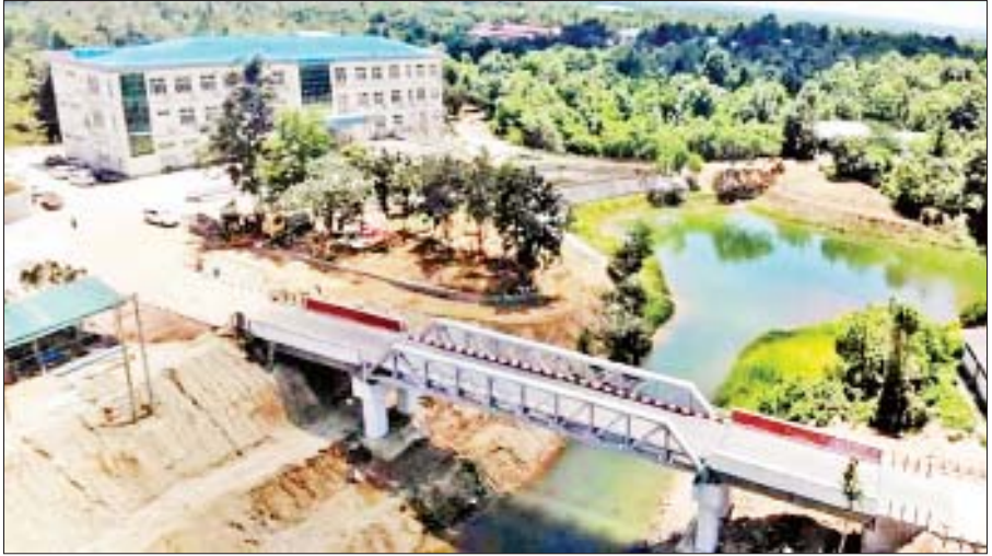
နေပြည်တော်ကောင်စီနယ်မြေ ဥတ္တရသီရိမြို့နယ် ရုံးအမှတ်(၁၁)အတွင်းရှိ Heritage တံတား ၁၈၈ ပေ တည်ဆောက်ခြင်းလုပ်ငန်း။