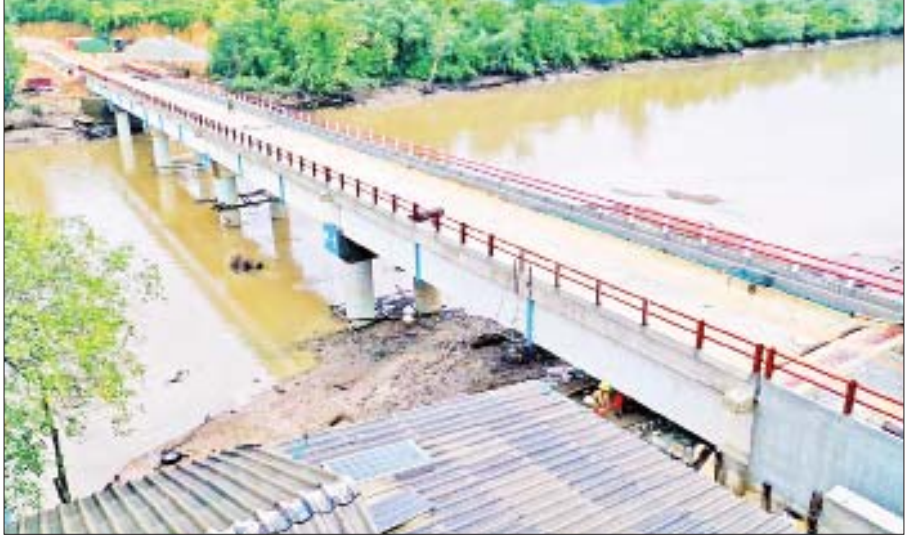
တနင်္သာရီတိုင်းဒေသကြီး ကော့သောင်းမြို့နယ် ရှမ်းကိုးရွာနယ်စပ်ပတ်လမ်းပေါ်ရှိ ဖောင်ဆိပ်တံတား။