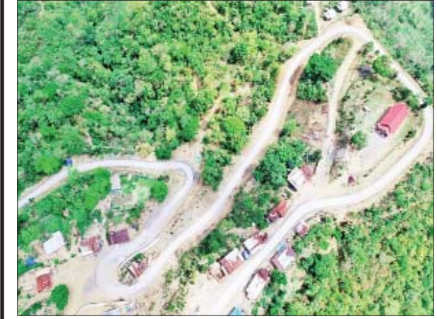
ချင်းပြည်နယ် ဖလမ်းမြို့နယ် ဆအက်-သီးကျိရ်-မွန်လွ-ကြော့သဲ-လျှန်နာ(က)-လျှန်နာ(ခ) -တီအိုချောင်း(ရိဒ်)လမ်း။

တိုင်းဒေသကြီး/ပြည်နယ် ၁၅ ခုတွင် ဆောင်ရွက်ခဲ့သည့် Pilot Project လမ်း ၂၅ လမ်း၌ ကတ္တရာလမ်း(၁၄၈/၅.၅၇)မိုင်၊ ကတ္တရာထပ်ပိုးလွှာ (၃၅/၃.၁၂) မိုင်၊ ကွန်ကရစ်လမ်း(၅၁/၆)မိုင်၊ ကျောက်လမ်း (၉၁/၀.၇၅)မိုင်၊ အမာခံလမ်း(၄/၅)မိုင်၊ မြေလမ်း (၉၁/၅.၈၆)မိုင် စုစုပေါင်း(၄၂၃/၂.၃)မိုင်နှင့် ကွန်ကရစ်တံတား ၇၈ စင်း၊ ဘေလီတံတား ၁၄ စင်း၊ သစ်သားတံတား တစ်စင်း၊ ရေကျော်ခြောက်စင်း၊ Box Culvert ၃၉၉ စင်း စုစုပေါင်း ၄၉၈ စင်း ဆောင်ရွက်ပြီးဖြစ်သည်။