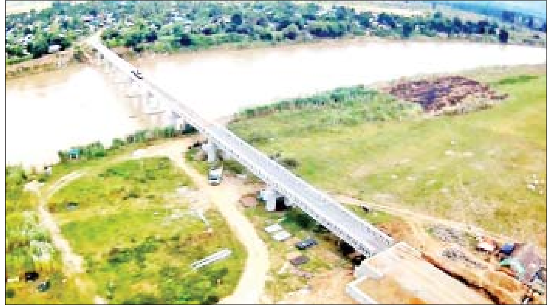
မကွေးတိုင်းဒေသကြီး ဂန့်ဂေါမြို့နယ် တောင်ခင်ရန်း - သာလင်း - မြင်သာ ကျေးရွာချင်းဆက်လမ်းပေါ်ရှိ သာလင်း - မြင်သာ မြစ်သာမြစ်ကူးတံတား။