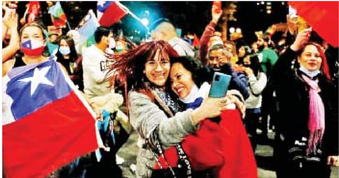
အောက်တိုဘာ ၂၅ ရက်က ချီလီပြည်သူများ လမ်းပေါ်ထွက် အောင်ပွဲခံကြစဉ်။

ပြည်လုံးကျွတ်ဆန္ဒခံယူပွဲကို ဧပြီလကတည်းက ကျင်းပရန် စီစဉ်ခဲ့သော်လည်း ကိုဗစ်-၁၉ ရောဂါ ပြန့်ပွားနေမှုကြောင့် ရွှေ့ဆိုင်းခဲ့ရခြင်း ဖြစ်သည်။ ဖွဲ့စည်းပုံအခြေခံဥပဒေရေးဆွဲရေးဆိုင်ရာ စီမံရေးအတွက် အဖွဲ့ဝင် ၁၅၅ ဦးကို ၂၀၂၂ ခုနှစ် ဧပြီလတွင် မဲပေးရွေးချယ်မည်ဖြစ်သည်။ ကိုးကား-ဘီဘီစီ၊ ဘာသာပြန်-မေလွဲသင်း