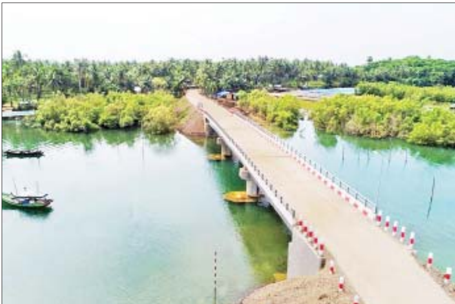
ရခိုင်ပြည်နယ် ပွဲမြို့နယ် မကျေးငူ-ကျောက်ချွန်လမ်း ကျောက်ချွန်တံတား။