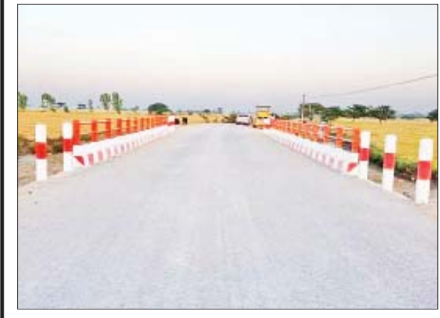
စစ်ကိုင်းတိုင်းဒေသကြီး ရွှေဘိုခရိုင် ဝက်လက်မြို့နယ် စိုင်နိုင်-ဟံလင်းလမ်းပေါ်ရှိ တံတား။