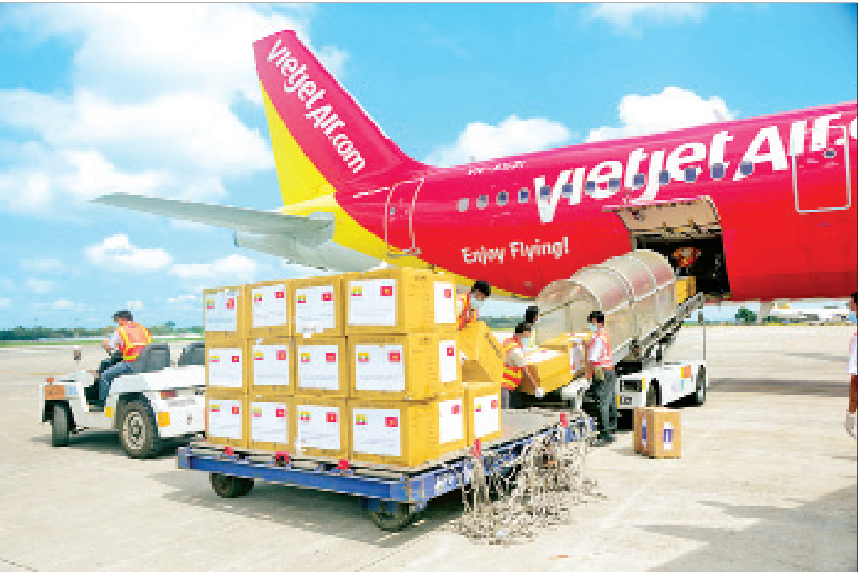
ဗီယက်နမ်နိုင်ငံအစိုးရနှင့် ပြည်သူများက လှူဒါန်းသည့် နှာခေါင်းစည်းများနှင့် ဆေးရုံသုံးလက်အိတ်များ တင်ဆောင်လာသည့် လေယာဉ်အား ရန်ကုန် အပြည်ပြည်ဆိုင်ရာလေဆိပ်၌ တွေ့ရစဉ်။

ရန်ကုန် အောက်တိုဘာ ၁၅ ဗီယက်နမ်နိုင်ငံအစိုးရနှင့် ပြည်သူများက မြန်မာနိုင်ငံ၏ ကိုဗစ်-၁၉ ရောဂါ ကာကွယ်၊ ထိန်းချုပ်၊ တိုက်ဖျက်ရေးလုပ်ငန်းများ ဆောင်ရွက် ရာတွင် အသုံးပြုရန်အတွက် နှာခေါင်းစည်းများနှင့် ဆေးရုံသုံး လက်အိတ်များ ထောက်ပံ့လှူဒါန်းခြင်း အခမ်းအနားကို ယနေ့နံနက်ပိုင်းက ရန်ကုန်အပြည်ပြည် ဆိုင်ရာလေဆိပ်၌ ပြုလုပ်သည်။ အဆိုပါ အထောက်အကူပြုပစ္စည်းများ တင်ဆောင်လာသော လေယာဉ် သည် ယနေ့နံနက် ၁၀ နာရီတွင် ရန်ကုန်အပြည်ပြည်ဆိုင်ရာလေဆိပ်သို့ ရောက်ရှိ လာရာ ကျန်းမာရေးနှင့်အားကစားဝန်ကြီးဌာနနှင့် မြန်မာနိုင်ငံဆိုင်ရာ ဗီယက်နမ်