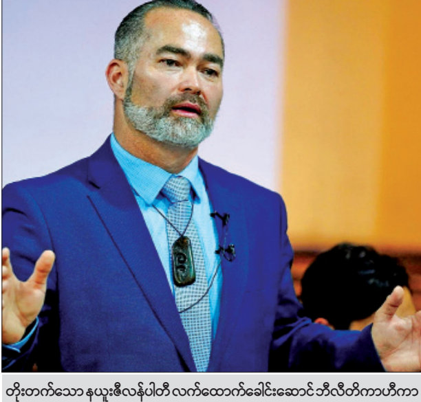
တိုးတက်သော နယူးဇီလန်ပါတီ လက်ထောက်ခေါင်းဆောင် ဘီလီတီကာဟီကာ

ဖေ့စ်ဘွတ်အား ၎င်း၏ မီဒီယာ စာမျက်နှာများရှိ သတင်းအမှားများ အား တုံ့ပြန်ဆောင်ရွက်ခြင်းမရှိဘဲ လျစ်လျူရှုခဲ့သဖြင့် ယခင်က ဝေဖန်မှု များရှိခဲ့သည်။ ဇွန်လနေ့စဉ်ပိုင်းမှ အောက်တိုဘာလ အစောပိုင်းကာလ အတွင်း တိုးတက်သော နယူးဇီလန် ပါတီမှထုတ်လွှင့်မှုများကို ကြည့်ရှုသူ ပရိသတ် ၅ ဒသမ ၃ သန်းရှိကြောင်း သိရသည်။ ကိုးကား- အေအက်ဖ်ပီဘာသာပြန်- ဦးသူရ