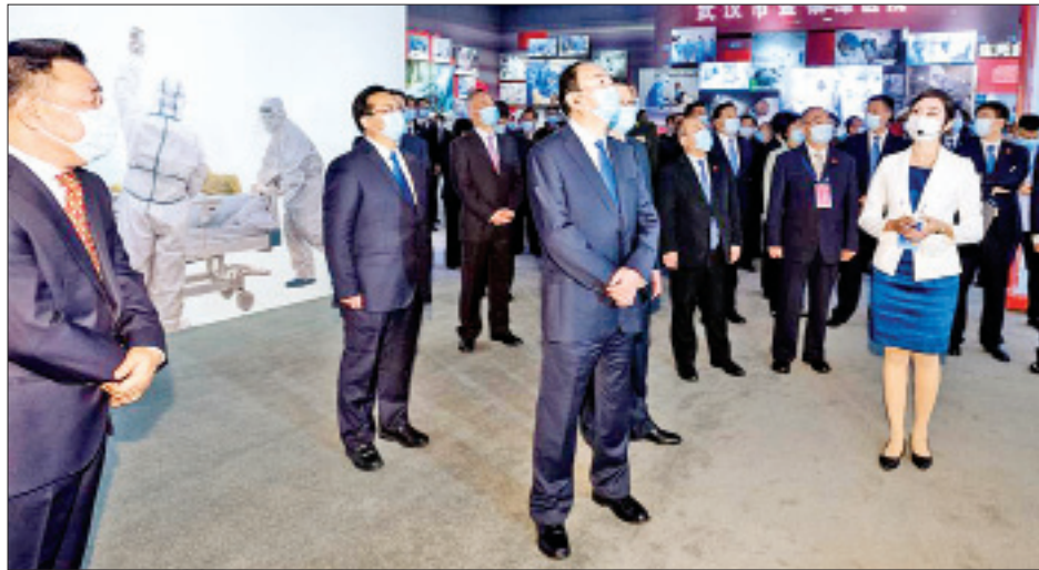
တရုတ်ကွန်မြူနစ်ပါတီဗဟိုကော်မတီ နိုင်ငံရေးဗျူရိုအဖွဲ့ဝင်နှင့် ပြည်သူ့ဆက်ဆံရေးဌာနအကြီးအကဲ ဟောင်ကွန်မင် ကိုဗစ်-၁၉ ရောဂါ တိုက်ဖျက်ရေးဆိုင်ရာပြပွဲသို့ တက်ရောက်စဉ်။