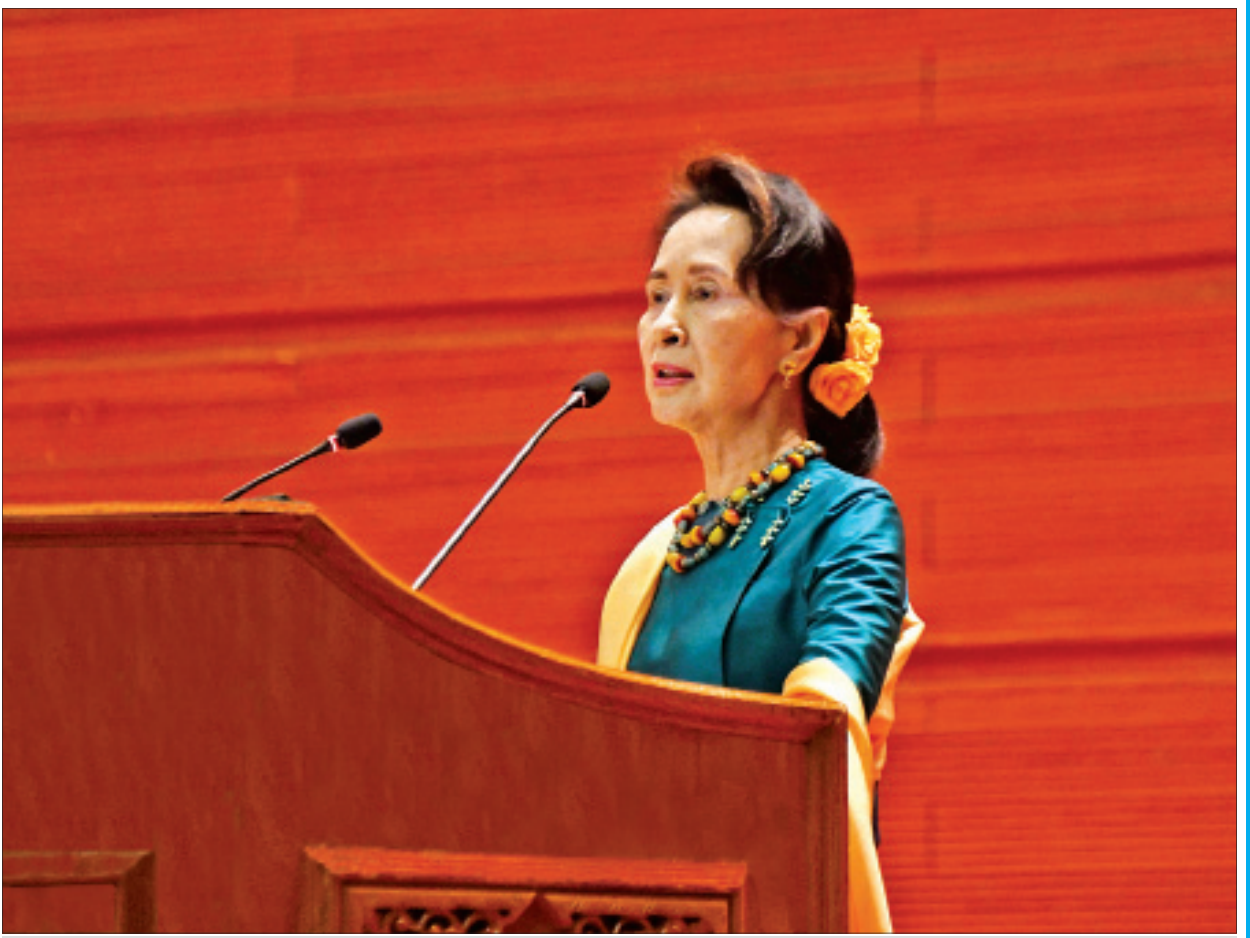
နိုင်ငံတော်၏အတိုင်ပင်ခံပုဂ္ဂိုလ် ဒေါ်အောင်ဆန်းစုကြည် တစ်နိုင်ငံလုံးပစ်ခတ်တိုက်ခိုက်မှုရပ်စဲရေး သဘောတူစာချုပ်(NCA)လက်မှတ်ရေးထိုးခြင်း (၅)နှစ်မြောက် နှစ်ပတ်လည်အခါသမယတွင် မိန့်ခွန်းပြောကြားစဉ်။

နှစ်ပတ်လည်အခမ်းအနားတွေ၊ အထိမ်းအမှတ်ပွဲတွေ ကျင်းပပြုလုပ်ခဲ့ရခြင်းဟာ တစ်နိုင်ငံလုံး ပစ်ခတ်တိုက်ခိုက်မှုရပ်စဲရေး သဘောတူစာချုပ် (NCA) မှာ ပါဝင်လက်မှတ်ရေးထိုးခဲ့ကြတဲ့ အစုအဖွဲ့အသီးသီးအနေနဲ့ ဒီစာချုပ်မှာဖော်ပြပါရှိတဲ့ အခြေခံမူတွေ၊ သဘောတူညီချက်တွေ၊ သန့်ရှင်းရေးကို ထပ်လောင်းအတည်ပြုကြခြင်းပဲ ဖြစ်ပါတယ်။ NCA ဆိုတာ နှစ်ဖက်ပူးတွဲပိုင်ဆိုင်တဲ့ စာချုပ်ဖြစ်ပါတယ်။ စာမျက်နှာ ၃ ကော်လံ ၁ သို့ ။