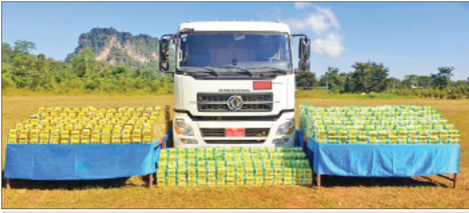
သိမ်းဆည်းရမိသည့် ဆီဘောက်ဆာယာဉ်နှင့် အိုက်စများအား တွေ့ရစဉ်။

နေပြည်တော် အောက်တိုဘာ ၁၅ ရှမ်းပြည်နယ် ကျေးသီးမြို့နယ်၌ ငွေကျပ်သိန်း ၃၆၀၀၀၀ တန်ဖိုးရှိ အိုက်စ ကီလို ၁၈၀၀ ကို သိမ်းဆည်းရမိကြောင်း မြန်မာနိုင်ငံရဲတပ်ဖွဲ့၏ သတင်းထုတ်ပြန်ချက်အရ သိရသည်။