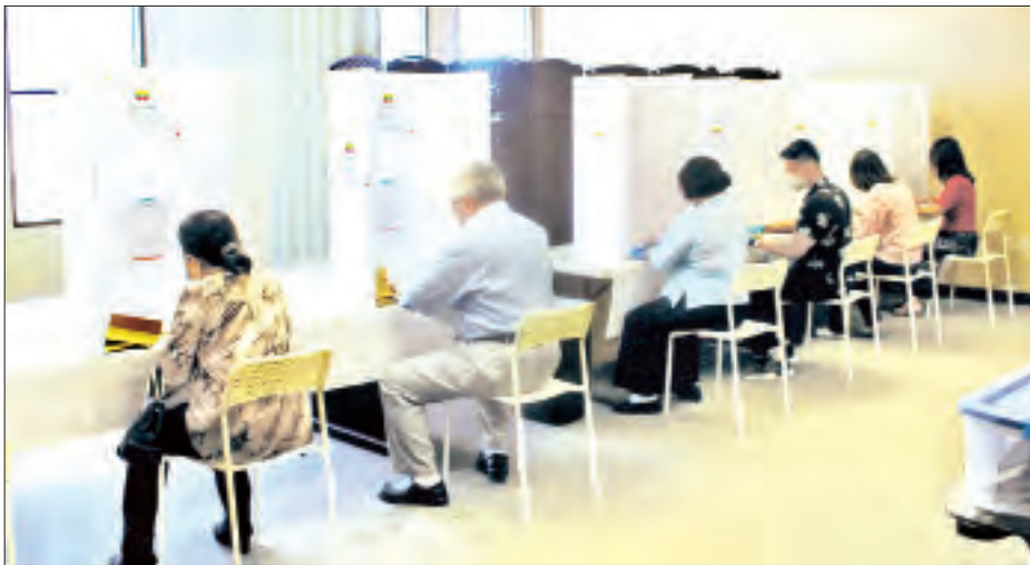
အမေရိကန်နိုင်ငံရောက် မြန်မာနိုင်ငံသားများ လော့စ်အိန်ဂျယ်လီစီမြို့၊ မြန်မာကောင်စစ်ဝန်ချုပ်ရုံး၌ ကြိုတင် ဆန္ဒမဲပေးကြစဉ်။

စပ်လျဉ်း၍ ချမှတ်ထားသော စည်းကမ်းများနှင့်အညီ ဖြစ်စေရေး မဲရုံအတွင်းသို့မဝင်မီ ကိုယ်အပူချိန်တိုင်းတာ ခြင်း၊ လက်သန့်ဆေးရည်များဖြင့် စနစ်တကျ လက်သန့် စေခြင်း၊ တစ်ခါသုံးလက်အိတ်နှင့် နှာခေါင်းစည်းများ ပုံပိုး ပေးခြင်းတို့ကို စနစ်တကျ ဆောင်ရွက်ပေးခဲ့ပြီး မဲဆန္ဒရှင် များကလည်း မြန်မာသံရုံးများမှ စီစဉ်ဆောင်ရွက်ထားရှိ သည့်အတိုင်း လိုက်နာကာ စနစ်တကျဆန္ဒမဲများ ပေးခဲ့ကြ ကြောင်း သိရသည်။ ယနေ့တွင် မြန်မာသံရုံး ၁၁ ရုံး၊ အဖွဲ့ရုံးတစ်ရုံး၊ ကောင်စစ်ဝန်ချုပ်ရုံးနှစ်ရုံး၊ ပြင်ပမဲခွဲတစ်ခုတို့တွင် ကြိုတင်ဆန္ဒမဲများ လာရောက်ပေးခဲ့ကြရာ မဲဆန္ဒရှင် စုစုပေါင်း ၄၀၉၃ ဦးနှင့် ယမန်နေ့က ဒေသဆိုင်ရာ စံတော်ချိန်များနှင့်အညီ ဆက်လက်မဲပေးခဲ့ကြသည့် မဲဆန္ဒရှင် စုစုပေါင်း ၇၇၃ ဦး ဆန္ဒမဲများ ပေးခဲ့ကြသဖြင့် မဲဆန္ဒရှင် စုစုပေါင်း ၄၈၆၆ ဦး ဆန္ဒမဲပေးခဲ့ကြကြောင်း သိရသည်။ သတင်းစဉ်