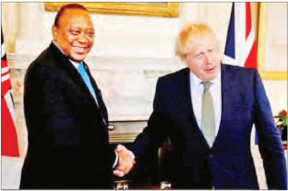
ကင်ညာသမ္မတ ကန်ယာတာ(ဝဲ)နှင့် ဗြိတိန်ဝန်ကြီးချုပ် ဘောရစ်ဂျွန်ဆင်(ယာ)

ယခု အစီအစဉ်သာ ဖြစ်ပေါ်လာပါက မဖွံ့ဖြိုးသေး သည့်နိုင်ငံများမှ ကလေးငယ်များ ကောင်းမွန်သည့် ပညာရေးဆိုင်ရာ အထောက်အပံ့များ ရရှိလာဖွယ်ရှိသည်။ ကိုးကား - အေအက်ဖ်ပီ၊ ဘာသာပြန် - မေလွဲသင်း