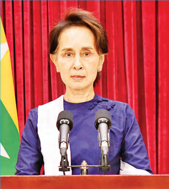
(Coronavirus Disease 2019 (COVID-19) ကာကွယ်၊ ထိန်းချုပ်၊ ကုသရေး အမျိုးသားအဆင့်ဗဟိုကော်မတီဥက္ကဋ္ဌ၊ နိုင်ငံတော်၏အတိုင်ပင်ခံပုဂ္ဂိုလ် ဒေါ်အောင်ဆန်းစုကြည် အောက်တိုဘာ ၂ ရက်တွင် ကိုဗစ်-၁၉ ရောဂါဖြစ်ပွားမှု နောက်ဆုံးအခြေအနေနှင့်စပ်လျဉ်း၍ ပြည်သူများသို့ အစီရင်ခံတင်ပြသည့် မိန့်ခွန်းမှ ကောက်နုတ်ချက်)

ကိုဗစ်ရောဂါနဲ့ပတ်သက်ပြီး နိုင်ငံတကာသတင်းတွေကို လေ့လာမယ်ဆိုရင်လည်း တခြား နိုင်ငံတွေမှာလည်း တော်တော်ပြန်နေတယ်ဆိုတာတွေ သတိပြုမိမယ်လို့ ထင်ပါတယ်။ ဒုတိယလှိုင်းပေါ့။ တချို့က တတိယလှိုင်းတောင်ရောက်ပြီလို့ ခန့်မှန်းတဲ့သူတွေ ရှိပါတယ်။ တချို့နိုင်ငံတွေမှာတော့ ဒုတိယလှိုင်း၊ တချို့နိုင်ငံတွေမှာတော့ ရောဂါအခြေအနေကို ထိန်းထား နိုင်တယ်။ ရောဂါအခြေအနေကို ထိန်းထားနိုင်တယ်ဆိုတာ ဘာကြောင့်ထိန်းထားနိုင်လဲလို့ ကြည့်လိုက်ရင် နိုင်ငံချမ်းသာတာနဲ့လည်း မဆိုင်ဘူး။ ဆင်းရဲတာနဲ့လည်း မဆိုင်ဘူး။ နောက်ဆုံး ကျတော့ ပြည်သူတွေ စည်းကမ်းရှိမှု၊ ပြည်သူတွေ စည်းမျဉ်းစည်းကမ်း လိုက်နာမှုနဲ့ပဲ ဆိုင်တယ်ဆိုတာ ထပ်ပြီး ကျွန်မ သတိပေးပါရစေ။