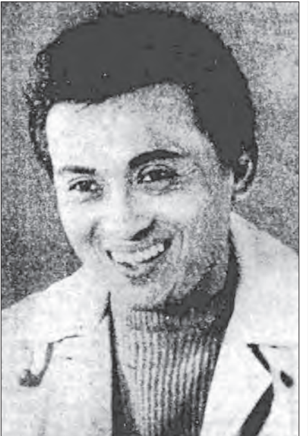
မြန်မာ့ရုပ်ရှင်ရွှေရတုခေတ်ဦးက ပြည်တော်ချစ် စတန့်မင်းသားကြီး (ဦး)ရွှေဘူ။

(၂) မှတ်တမ်းရုပ်ရှင် နိုင်ငံတော်က ဆောင်ရွက်သည့် နိုင်ငံရေး၊ စီးပွားရေး၊ လူမှုရေး၊ ယဉ်ကျေးမှု စသည့်ကိစ္စရပ်များ တွင် မှတ်တမ်းတင်ရသည့် အချက်အလက်များ ရှာဖွေစုဆောင်းရိုက်ကူးခြင်းများ ဖြစ်ပါသည်။ (သာဓကအားဖြင့် နိုင်ငံတော်အကြီးအကဲများ၏ ပြည်တွင်း ပြည်ပခရီးစဉ်များ၊ ပြည်ပ နိုင်ငံအကြီး အကဲများ မြန်မာနိုင်ငံသို့ လာရောက်ခြင်း၊