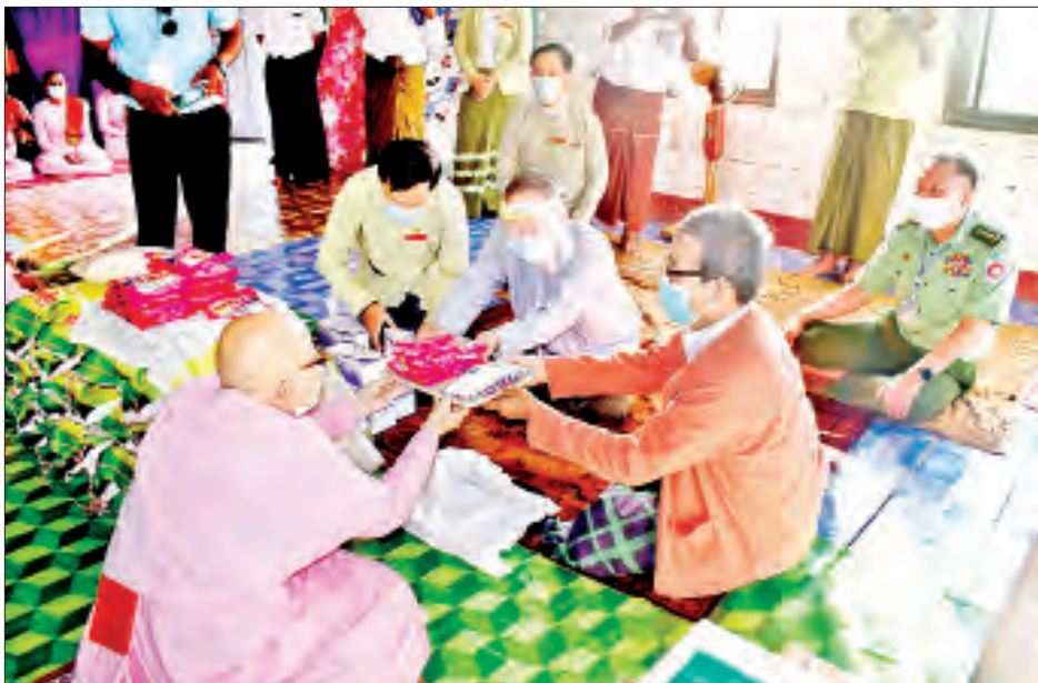
သံဃာတော်များနှင့် သီလရှင်များ အေးချမ်းသာယာစွာဖြင့် လှူဒါန်းမှုများကို ထမ်းဆောင်နိုင်ရန် ရခိုင်ပြည်နယ် အစိုးရအဖွဲ့က ဆန်နှင့် လှူဖွယ်ပစ္စည်းများကို လှူဒါန်းပေးလျက်ရှိရာ စစ်တွေမြို့ကျောင်းတိုက်အသီးအသီးရှိ သံဃာတော်များအား ဆန်အိတ်တစ်ထောင်ကိုလည်း လှူဒါန်းခဲ့ကြောင်း သိရသည်။ တင်ထွန်း(ပြန်/ဆက်)

စစ်တွေ အောက်တိုဘာ ၁၂ ရခိုင်ပြည်နယ်ဝန်ကြီးချုပ် ဦးညီပုသည် ပြည်နယ်ဝန်ကြီးများ၊ ပြည်နယ်အတွင်းရေးမှူး၊ ဌာနဆိုင်ရာတာဝန်ရှိသူများနှင့် အတူ ယနေ့ညနေပိုင်းတွင် စစ်တွေမြို့ လမ်းသစ်ရပ်ကွက် အမွှာရာမသာသနာ့နယ်ဝင် သီလရှင်ပရိယတ္တိစာသင်တိုက် သို့ ဆန်နှင့် လှူဖွယ်ပစ္စည်းများ လှူဒါန်းသည်။