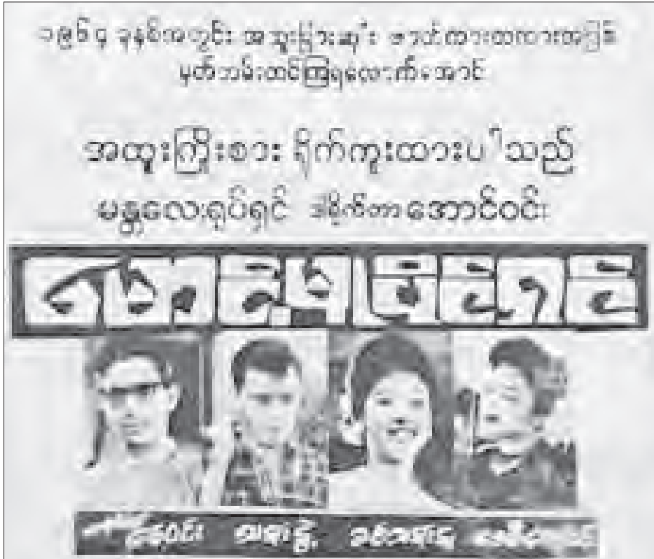
မောင့်မူပိုင်ရှင် ရုပ်ရှင်ဇာတ်ကားကို အောင်မြင်ကျော်ကြားခဲ့သဖြင့် ဒုတိယအကြိမ် သရုပ်ဆောင်များပြောင်း၍ ရိုက်ကူးပြသခဲ့သည်။

ဤနေရာတွင် ဗိုလ်ချုပ်၏ မော်ကွန်းတင်ရုပ်ရှင်ကားအကြောင်းကို ပြောသောအခါ လက်ရှိ ရိုက်လက်စဖြစ်သော “ဗိုလ်ချုပ်” ရုပ်ရှင်ကားကြီးကို ပြည်သူပရိသတ်က သမိုင်းဝင် ဂန္ထဝင်မော်ကွန်းတင်ရုပ်ရှင်ကားကြီးအဖြစ် မျှော်လင့်နေကြပါသည်။ မြန်မာနိုင်ငံ၌သာမက ကမ္ဘာနိုင်ငံများသို့ပါ ပေးပို့တင်ဆက်နိုင်မည်ဆိုပါက နိုင်ငံခေါင်းဆောင်များနှင့်ပတ်သက်၍ ရိုက်ကူးထားသော ကမ္ဘာကျော်ဂန္ထဝင်ရုပ်ရှင်ဇာတ်ကားကြီးများကဲ့သို့ အောင်မြင်ကျော်ကြားနိုင်မည်ဟု ယုံကြည်နေမိပါတော့သည်။ ။