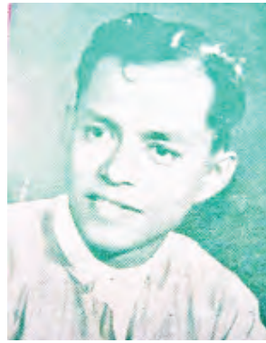
မောင်သောင်း