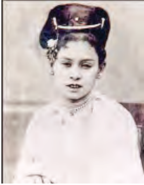
ခင်ခင်ကြည်(အငယ်ပုံ)