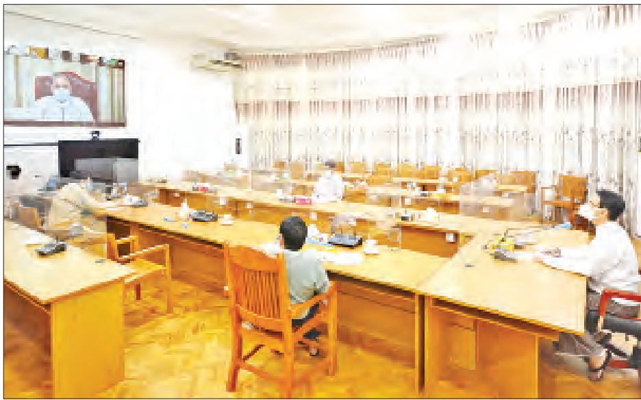
ပြောကြားသည်။

အစည်းအဝေးသို့ စိုက်ပျိုးရေး၊ မွေးမြူရေးနှင့် ဆည်မြောင်းဝန်ကြီးဌာန ပြည်ထောင်စုဝန်ကြီး ဒေါက်တာအောင်သူ၊ စီးပွားရေးနှင့်ကူးသန်းရောင်းဝယ်ရေးဝန်ကြီးဌာန ပြည်ထောင်စုဝန်ကြီး ဒေါက်တာသန်းမြင့်၊ စိုက်ပျိုးရေး၊ မွေးမြူရေးနှင့်ဆည်မြောင်းဝန်ကြီးဌာနနှင့် စီးပွားရေးနှင့်ကူးသန်းရောင်းဝယ်ရေးဝန်ကြီးဌာနတို့မှ ဒုတိယဝန်ကြီးများ၊ အမြဲတမ်းအတွင်းဝန်များ၊ ဦးစီးဌာနများမှ ညွှန်ကြားရေးမှူးချုပ်များနှင့် တာဝန်ရှိသူများ၊ မြန်မာနိုင်ငံ ဆန်စပါးအသင်းချုပ်ဥက္ကဋ္ဌနှင့် တာဝန်ရှိသူများ၊ စိုက်ပျိုးရေးဦးစီးဌာနနှင့် စက်မှုလယ်ယာဦးစီးဌာန တိုင်းဒေသကြီး/ပြည်နယ်မှူးများက Zoom Application အသုံးပြု၍ သက်ဆိုင်ရာဒေသများမှ တက်ရောက်ကြသည်။