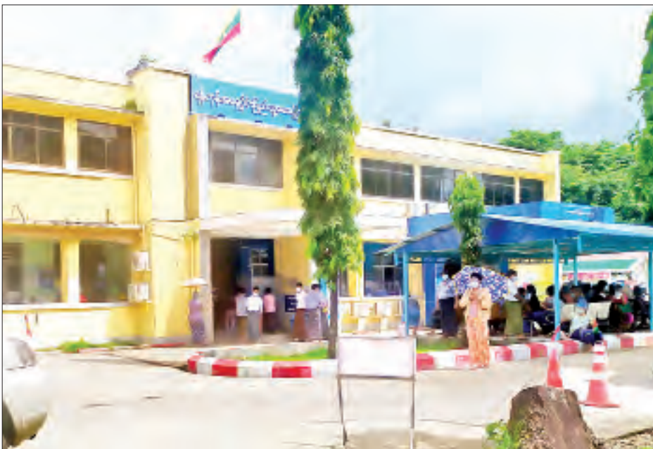
ရန်ကုန်အရှေ့ပိုင်း ပြည်သူ့ဆေးရုံကြီးကို တွေ့ရစဉ်။

“အောက်ဆီဂျင်ပေးရမယ့် လူနာတွေအတွက် အောက်ဆီဂျင်အသုံးပြု ကုသနိုင်အောင် စီစဉ်နေပါတယ်။ အောက်ဆီဂျင်ကို ပိုက်နဲမဟုတ်ဘဲ စာမျက်နှာ ၈ ကော်လံ ၁ သို့ ●