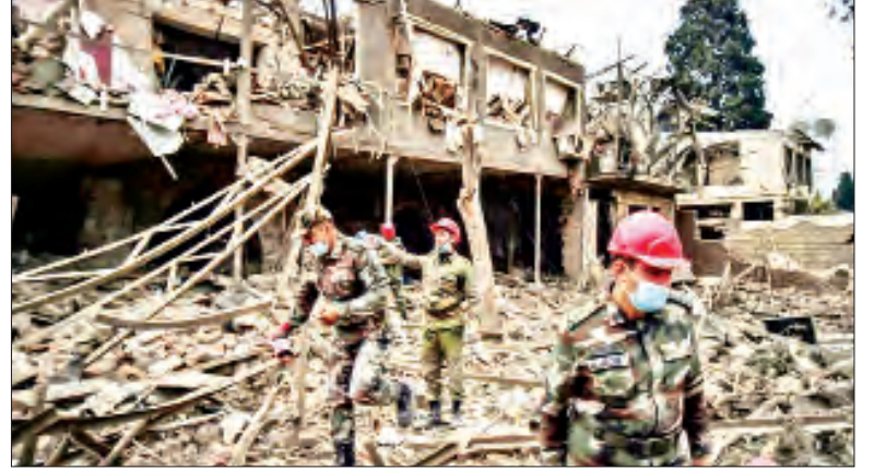
အောက်တိုဘာ ၁၁ ရက်က နာဂေါ့-ကာရာဘတ်ခံဒေသရှိ အပျက်အစီးများကို တွေ့ရစဉ်။