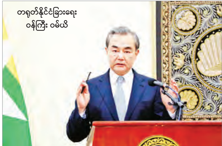
တရုတ်နိုင်ငံခြားရေး ဝန်ကြီး ဝမ်ယိ

ကန်ဒေါ်လာ ၁၀ ဘီလီယံ ဝယ်လိုအား တိုးတက်လာရေးအတွက် စီးပွားရေးလှုံ့ဆော်မှုစီမံချက် အိန္ဒိယအစိုးရ ကြေညာ နယူးဒေလီ အောက်တိုဘာ ၁၂ အိန္ဒိယအစိုးရသည် ပွဲတော်ကာလအတွင်း ဝယ်လိုအားတိုးတက်လာရေးအတွက် ဗဟိုအစိုးရက ကြိုတင်ငွေထုတ်ပေးခြင်းအပါအဝင် စီးပွားရေးလှုံ့ဆော်မှုစီမံချက်များကို ဆောင်ရွက်သွားမည် ဖြစ်ကြောင်း ယနေ့တွင် ကြေညာခဲ့သည်။ ပွဲတော်ကာလသည် အောက်တိုဘာလမှ မတ်လ အထိ ဖြစ်သည်။ အိန္ဒိယသည် ကိုဗစ်-၁၉ ရောဂါ ရိုက်ခတ်မှုဒဏ်ကို အဆိုးဆုံးကြုံတွေ့ရသည့် နိုင်ငံ တစ်နိုင်ငံဖြစ်ပြီး စီးပွားရေး ကျဆင်းလာသည့်အတွက် လှုံ့ဆော်ရေးအစီအမံများဖြင့် နိုင်ငံ စီးပွားရေးကို ပြန်လည်ဆွတ်တင်ရန် ဆောင်ရွက်နေခြင်းဖြစ်သည်။ ဘဏ္ဍာရေးဝန်ကြီးက ဝမ်ယိ အား တိုးတက်လာရေးအတွက် ကုန်ပစ္စည်းများဝယ်ယူရာတွင် အခွန်ကင်းလွတ်ခွင့်အပြင် ခရီးသွားလာရေးတို့တွင်လည်း အခွန်ကင်းလွတ်ခွင့်များ ပေးအပ်သွားမည်ဖြစ်ကြောင်း ပြောသည်။ အစိုးရက ပြီးခဲ့သည့်လကပင် ချေးငွေကိစ္စရပ်များကို ပြန်လည်သုံးသပ်သွားမည်ဖြစ် ကြောင်း ကြေညာခဲ့ပြီး ယခုဘဏ္ဍာနှစ်အတွင်း ချေးငွေရရှိပေး ၁၂ ယူအေအီးအိမ်ရှေ့မင်းသားနှင့် အစ္စရေးဝန်ကြီးချုပ်တို့ ဖုန်းဖြင့်ဆက်သွယ်ဆွေးနွေး ကိုးကား - စီအင်န်အေ ဘာသာပြန် - မေလွဲသင်း