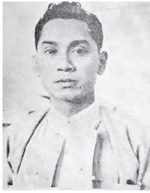
တက္ကသိုလ် ဘုန်းနိုင်