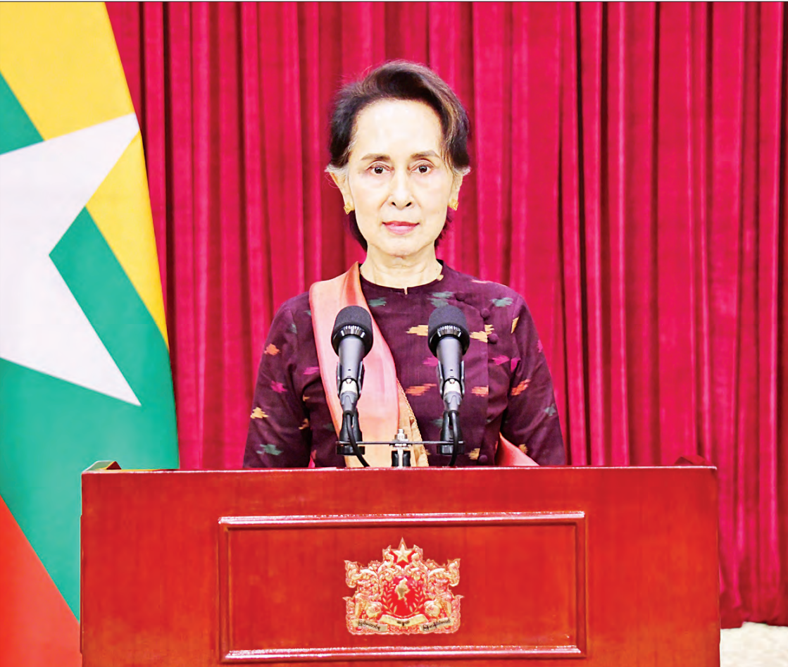
နိုင်ငံတော်၏အတိုင်ပင်ခံပုဂ္ဂိုလ် ဒေါ်အောင်ဆန်းစုကြည် ပြည်သူများသို့ အစီရင်ခံတင်ပြသည့် မိန့်ခွန်းပြောကြားစဉ်။

အခု ပြန်ပွားမှုဟာ ဘယ်လိုနေရာတွေ မှာ ဖြစ်နေသလဲ၊ ဘယ်လိုအခြေအနေ တွေမှာ ဖြစ်နေသလဲလို့ ကြည့်လိုက်တဲ့ အခါကျတော့ ရပ်ထဲရွာထဲမှာ ပြန်ပွားနေတဲ့ အခြေအနေတွေကိုပဲ ပြောရမှာပေါ့။ အထူး သဖြင့် သွားလာနေတဲ့ ပုဂ္ဂိုလ်များကြားထဲမှာ ပြန့်ပွားတာပေါ့။ အဝေးပြေးယာဉ်တွေ မောင်းတဲ့ ယာဉ်မောင်းတွေကို အခုဆိုရင် စစ်ဆေးနိုင်တဲ့အခြေအနေရှိတဲ့ အခါကျ တော့ စစ်ဆေးတဲ့အခါမှာ သန့်သန့်မာမာလို့ ထင်ရတဲ့ ပုဂ္ဂိုလ်တွေက တကယ်တော့ ရောဂါပိုးရှိနေတယ်ဆိုတာ တွေ့ရပါတယ်။ စာမျက်နှာ ၃ ကော်လံ ၁ သို့ *