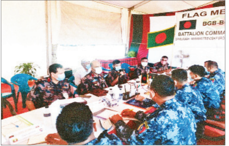
မြန်မာ-ဘင်္ဂလားဒေ့ရှ် နှစ်နိုင်ငံ နယ်ခြားစောင့်တပ်ဖွဲ့များ၏ အလံတင်အစည်းအဝေး ကျင်းပစဉ်။