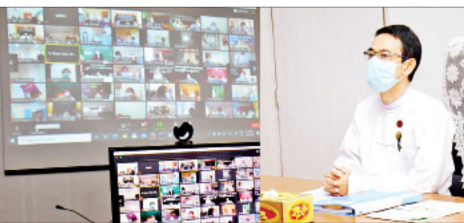
အဂတိတရားကင်းရှင်းပြီး ပွင့်လင်းမြင်သာစွာ ဆောင်ရွက်ကြရန်နှင့် ဖွံ့ဖြိုးရေးလုပ်ငန်းစဉ်များတွင် ပါဝင်ပတ်သက်သူအားလုံးတို့နှင့် ဟန်ချက်ညီ ပူးပေါင်းဆောင်ရွက်ကြရန် လိုအပ်ကြောင်း ပြောကြားသည်။

အစည်းအဝေးသို့ စိုက်ပျိုးရေး၊ မွေးမြူရေးနှင့် ဆည်မြောင်းဝန်ကြီးဌာန ပြည်ထောင်စုဝန်ကြီး ဒေါက်တာအောင်သူ၊ အမြဲတမ်းအတွင်းဝန် ဦးကျော်မင်းဦးနှင့် စီမံကိန်းဦးစီးဌာန ညွှန်ကြားရေးမှူးချုပ် ဦးကျော်ဆွေလင်း၊ စိုက်ပျိုးရေးဦးစီးဌာန ညွှန်ကြားရေးမှူးချုပ် ဒေါက်တာရဲတင့်ထွန်း၊ ကျေးလက်ဒေသဖွံ့ဖြိုးတိုးတက်ရေးဦးစီးဌာန ညွှန်ကြားရေးမှူးချုပ် ဦးခန့်ဇော်နှင့် ဒုတိယညွှန်ကြားရေးမှူးချုပ်များ၊ ညွှန်ကြားရေးမှူးများ၊ တိုင်းဒေသကြီး၊ ပြည်နယ် ဦးစီးမှူးများ၊ ခရိုင်နှင့် မြို့နယ်ဦးစီးမှူးများက သက်ဆိုင်ရာ နေရာအသီးသီးမှ ဗီဒီယိုကွန်ဖရင့်ဖြင့် တက်ရောက်ကြသည်။ အစည်းအဝေးတွင် ပြည်ထောင်စုဝန်ကြီး ဒေါက်တာအောင်သူက ကိုဗစ်-၁၉ ရောဂါကြောင့် ဖြစ်ပွားသည့် စီးပွားရေးအကျပ်အတည်းများမှ အမြန်ဆုံးရုန်းထွက်နိုင်ရေးအတွက် နိုင်ငံတော်က ချမှတ်အကောင်အထည်ဖော်လျက်ရှိသည့် ကိုဗစ်-၁၉ စီးပွားရေးထိခိုက်မှု သက်သာရေး စီမံချက် (CERP) အရ မိမိတို့ဝန်ကြီးဌာနအနေဖြင့် CERP Action Plan 2.1.7 ကို အောင်မြင်စွာ အကောင်အထည်ဖော်ဆောင်ရွက်နိုင်ခဲ့သည့်နည်းတူ ဆက်လက်ဆောင်ရွက်ရမည့် ဖွံ့ဖြိုးရေးဆိုင်ရာလုပ်ငန်းများ အောင်မြင်စွာ အကောင်အထည်ဖော် ဆောင်ရွက်နိုင်ရေးအတွက်ကိုလည်း ဝိုင်းဝန်းကြိုးပမ်း ဆောင်ရွက်သွားကြရမည်ဖြစ်ကြောင်း၊ ကျေးလက်ဒေသဖွံ့ဖြိုးရေးလုပ်ငန်းများကို ဆောင်ရွက်ရာတွင် သတ်မှတ်ခံချိန်ညှိနှိုင်း ပြည့်မီစွာ ဆောင်ရွက်ကြရန်