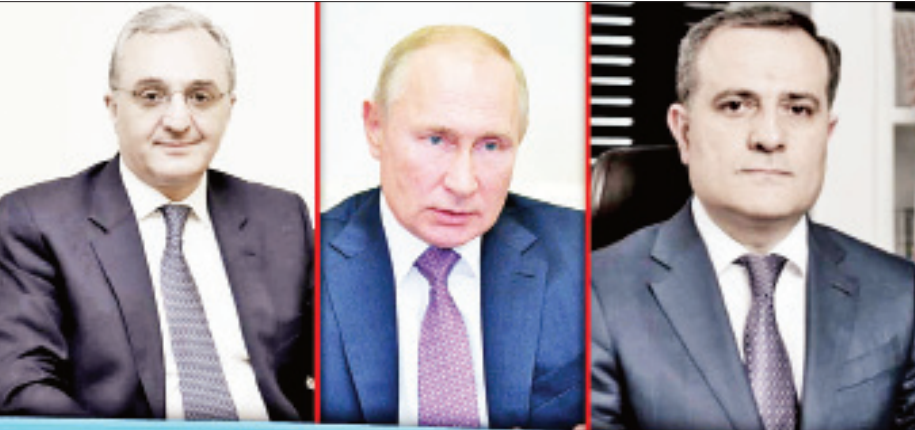
အာမေးနီးယားနိုင်ငံခြားရေးဝန်ကြီး အမ်နက်ဆာကန်ယန်၊ ရုရှားသမ္မတ ဗလာဒီမာပူတင်နှင့် အဇာဘိုင်ဂျန် နိုင်ငံခြားရေးဝန်ကြီး ဘောရာမေ့ဗ်။

အားကောင်းသည့် သဘောတူညီချက်တစ်စုံတစ်ရာ ဖြစ်ထွန်းခြင်းမရှိခဲ့ဘဲ အဇာဘိုင်ဂျန် နိုင်ငံခြားရေးဝန်ကြီး ဘောရာမေ့ဗ်ကသာ ပြင်သစ်၊ ရုရှားနှင့် အမေရိကန် နိုင်ငံခြားရေးဝန်ကြီးများနှင့် တွေ့ဆုံခဲ့ပြီး ၁၉၉၀ ပြည့်နှစ် လွန်ကာလများကတည်းက ဖြစ်ပွားခဲ့သည့် ကာရာဘက်ခ ဒေသပဋိပက္ခအတွက် အဖြေရှာရေးကိစ္စရပ်များကို ဆွေးနွေးခဲ့သည်။ လက်ရှိဖြစ်ပွားနေသည့် နာဂေါ်နီ-ကာရာဘက်ခဒေသ စစ်ပွဲများသည် ဆိုဗီယက်ပြည်ထောင်စုပြိုကွဲပြီးနောက် အဇာဘိုင်ဂျန်ပိုင် နယ်မြေကို အာမေးနီးယားတို့ထိန်းချုပ် ထားရာမှဖြစ်ပွားခဲ့သည့် ပဋိပက္ခလည်းဖြစ်သည်။ လတ်တလောဖြစ်ပွားနေသည့် စစ်ပွဲသည် ၁၉၉၄ခုနှစ် အပစ်အခတ်ရပ်စဲရေး သဘောတူညီချက် ရရှိပြီးနောက် လူအသေအပျောက် အများဆုံးဖြစ်ပေါ်ခဲ့ကြောင်း သိရ သည်။ ကိုးကား-အေအက်ပီ၊ ဘာသာပြန်-မေလွဲသင်း