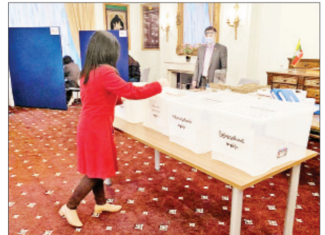
ဗြိတိန်နိုင်ငံရောက် မြန်မာနိုင်ငံသားများ လန်ဒန်မြို့၌ ကြိုတင်ဆန္ဒမဲပေးကြစဉ်။ တိုင်းခြင်း၊ လက်ဆေးခြင်း၊ Face Mask ဖြန့်ဝေတပ်ဆင်ခြင်းနှင့် သက်ဆိုင်ရာ နိုင်ငံအလိုက် ကိုဗစ်-၁၉ ရောဂါ တားဆီးကာကွယ်ရေး အစီအမံများကိုလည်း အလေးထား လိုက်နာဆောင်ရွက်ခဲ့ကြကြောင်း သိရသည်။ သတင်းစဉ်

စိုက်ပျိုးရေးပညာရပ်များသင်ကြားရန် ရောက်ရှိနေသည့် ကျောင်းသား ကျောင်းသူများ ဆန္ဒမဲပေးနိုင်ရေးအတွက် သွားရောက်ဆောင်ရွက်ပေးခဲ့ရာတွင် မဲဆန္ဒရှင် ၆၅ ဦး ကြိုတင်ဆန္ဒမဲပေးခဲ့ကြသည်။ ယနေ့တွင် မြန်မာသံရုံး ခုနစ်ရုံးနှင့် အစွဲအမတ်အဖြစ် အာရာဇာနှင့် နီဂတ် ဒေသ၌ ရောက်ရှိနေသော ပြည်ပရောက်မြန်မာနိုင်ငံသားများ ကြိုတင်ဆန္ဒမဲများ ပေးခဲ့ကြသည်။ ၂၀၂၀ ပြည့်နှစ် အထွေထွေရွေးကောက်ပွဲအတွက် နိုင်ငံပြင်ပသို့ ရောက်ရှိ နေသည့် မြန်မာနိုင်ငံသားများ ကြိုတင်ဆန္ဒမဲပေးခဲ့ကြရာ ယနေ့အထိ ဘရူနိုင်း၊ ဘရာဇီး၊ ဘင်္ဂလားဒေ့ရှ်၊ နီပေါ၊ အစွဲအမတ်အဖြစ် အာရာဇာနှင့် နီဂတ် တရုတ်ပြည်သူ့သမ္မတနိုင်ငံ ကုမင်းမြို့နှင့် နန်နင်းမြို့ရှိ မြန်မာကောင်စစ်ဝန်ချုပ်ရုံး နှစ်ရုံးတို့တွင် ကြိုတင်ဆန္ဒမဲပေးမှုများ ပြီးဆုံးပြီဖြစ်သည်။ ကြိုတင်ဆန္ဒမဲပေးရန် မြန်မာသံရုံးများသို့ ရောက်ရှိလာသည့် နိုင်ငံသား များအား ကိုဗစ်-၁၉ ရောဂါ တားဆီးကာကွယ်ရေးဆိုင်ရာ ချမှတ်ထားရှိသည့် ကျန်းမာရေးဆိုင်ရာ သတ်မှတ်ချက်များနှင့်အညီ သံရုံးအဝင်ဝ၌ ကိုယ်အပူချိန်