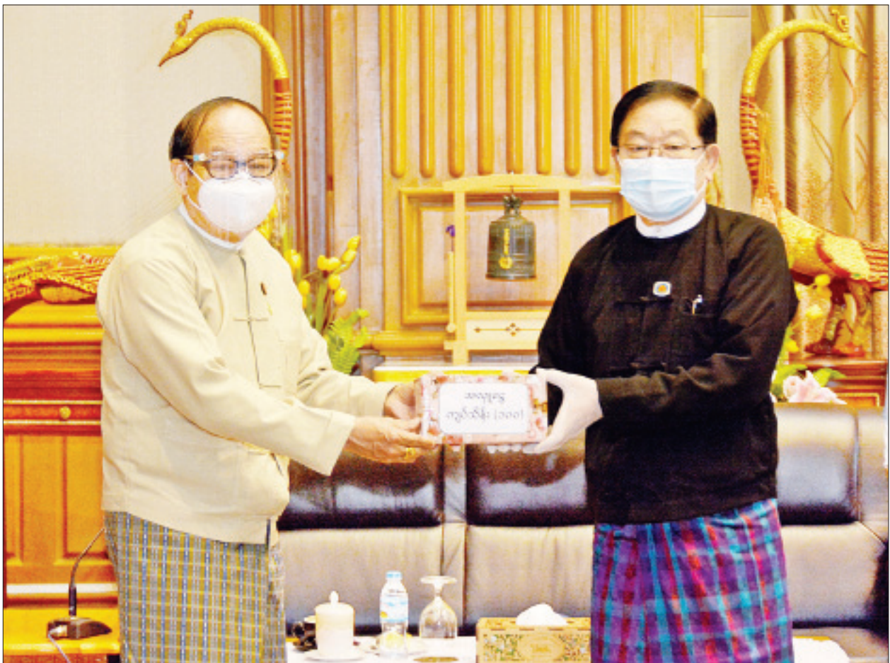
ပြည်သူ့လွှတ်တော်ဥက္ကဋ္ဌ ဦးတီခွန်မြတ်က ကျန်းမာရေးနှင့် အားကစားဝန်ကြီးဌာန ပြည်ထောင်စုဝန်ကြီး ဒေါက်တာမြင့်ထွေးထံသို့ ပေးအပ်လှူဒါန်းသည်။

ရှေးဦးစွာ ပြည်သူ့လွှတ်တော်ဥက္ကဋ္ဌ ဦးတီခွန်မြတ်က Coronavirus Disease 2019 (COVID-19) ကာကွယ်၊ ထိန်းချုပ်၊ ကုသရေးလုပ်ငန်းများကို ရှေ့တန်းမှကိုင်ကိုင်ပြီးမိမိနှင့် စွမ်းစွမ်းတစ်တစ်ဆောင်ဆောင်ကျန်းမာရေးနှင့် အားကစားဝန်ကြီးဌာနမှ အရာထမ်း၊ အမှုထမ်းများနှင့် ပရဟိတစေတနာ့ဝန်ထမ်းများအားလုံးကို လေးစားဂုဏ်ပြုသည့်အနေဖြင့် မိမိနှင့်အတူ ပြည်ထောင်စုလွှတ်တော်ရုံးနှင့် ပြည်သူ့လွှတ်တော်ရုံးမှ အရာထမ်း၊ အမှုထမ်းများ၏ စုပေါင်းလှူဒါန်းငွေကို အပ်နှံလှူဒါန်းခြင်းဖြစ်ကြောင်း၊ မိမိတို့ ပါဝင်လှူဒါန်းငွေသည် ပမာဏအားဖြင့် နည်းသော်လည်း ကိုဗစ်-၁၉ ကူးစက်ရောဂါ ကာကွယ်၊ ထိန်းချုပ်၊ ကုသရေးဆိုင်ရာ စီမံခန့်ခွဲမှုကြီးကို ရှေ့တန်းမှ တုံ့ပြန်ရင်ဆိုင်ဖြေရှင်းနေသော ကျန်းမာရေးနှင့် အားကစားဝန်ကြီးဌာနနှင့်အတူ မိမိတို့လွှတ်တော်များမှ အရာထမ်း၊ အမှုထမ်းများအားလုံးက တစ်စိတ်တစ်ပိုင်း တစ်စိတ်တစ်ပိုင်း တစ်သားတည်း ရပ်တည်လျက်ရှိကြောင်း၊ ကိုဗစ်-၁၉ ရောဂါ ဖြစ်ပွားလျက်ရှိသော်လည်း မေလ၊ ဇူလိုင်လနှင့် ဩဂုတ်လများ၌ ကျင်းပခဲ့သည့် လွှတ်တော်အစည်းအဝေးများတွင် ကျန်းမာရေးနှင့် အားကစားဝန်ကြီးဌာနသည် အစည်းအဝေးတင်ပြချိန်မှ ပြီးဆုံးသည်အထိ ကျန်းမာရေးစောင့်ရှောက်မှုများကို စနစ်တကျ ဆောင်ရွက်ပေးခဲ့သည့်အတွက် အစည်းအဝေးများကို အောင်မြင်စွာ ကျင်းပနိုင်ခဲ့ခြင်းဖြစ်၍ လွှတ်တော်များကိုယ်စား အထူးကျေးဇူးတင်ရှိကြောင်း ပြောကြားကာ စုပေါင်းလှူဒါန်းငွေကျပ် သိန်း ၁၀၀ ကို ပြည်သူ့လွှတ်တော်ဥက္ကဋ္ဌ ဦးတီခွန်မြတ်က ကျန်းမာရေးနှင့် အားကစားဝန်ကြီးဌာန ပြည်ထောင်စုဝန်ကြီး ဒေါက်တာမြင့်ထွေးထံသို့ ပေးအပ်လှူဒါန်းသည်။ (ယာပုံ)