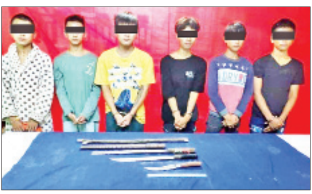
ပြစ်မှုကျူးလွန်သူများအား သက်သေခံပစ္စည်းများနှင့်အတူ တွေ့ရစဉ်။

လားရှိုး အောက်တိုဘာ ၉ လားရှိုးမြို့ ရပ်ကွက်(၅) အတွင်း ယမန်နေ့ ညနေ ၆ နာရီကျော်ခန့်က လူငယ်တစ်ဦးအား လူကြောက်စိုးက ဓားရှည်များဖြင့် ဝိုင်းခုတ်သည့် ဖြစ်စဉ်မှ ပြစ်မှုကျူးလွန်သူ ခြောက်ဦးအား နယ်ထိန်းခေါင်းဆောင် ရဲအုပ်စိုးမိုးဌေး ဦးဆောင်သော ရဲတပ်ဖွဲ့ဝင်များက နာရီပိုင်းအတွင်း စုံစမ်းဖော်ထုတ်ဖမ်းဆီးနိုင်ခဲ့ကြောင်း သိရသည်။