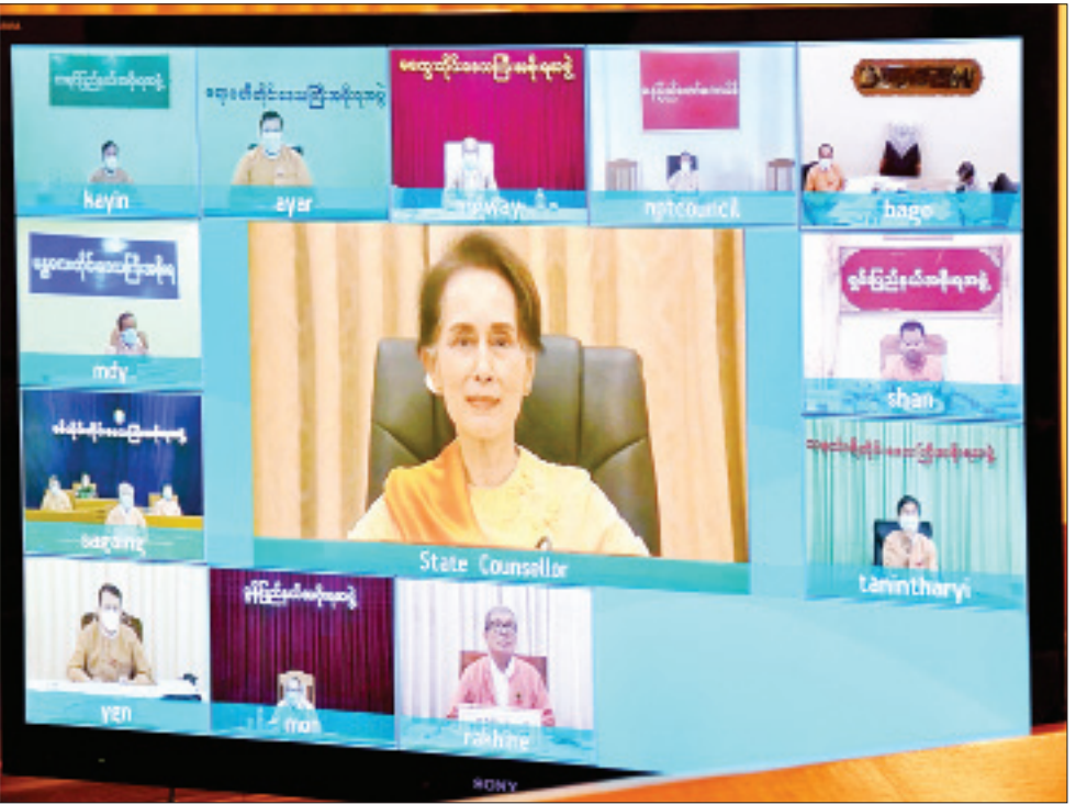
နိုင်ငံတော်၏အတိုင်ပင်ခံပုဂ္ဂိုလ် ဒေါ်အောင်ဆန်းစုကြည် နိုင်ငံတစ်ဝန်းကုန်စည်စီးဆင်းမှု သွက်လက်လျင်မြန်ချောမွေ့မှုကန်စေရေး ညှိနှိုင်းအစည်းအဝေးတွင် လမ်းညွှန်မှာကြားစဉ်။