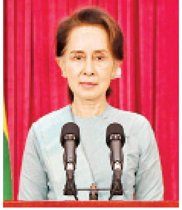
(Coronavirus Disease 2019 (COVID-19) ကာကွယ်၊ ထိန်းချုပ်၊ ကုသရေး အမျိုးသားအဆင့်ဗဟိုကော်မတီဥက္ကဋ္ဌ၊ နိုင်ငံတော်၏အတိုင်ပင်ခံပုဂ္ဂိုလ် ဒေါ်အောင်ဆန်းစုကြည် စက်တင်ဘာလ ၂၈ ရက်နေ့တွင် ကိုဗစ်-၁၉ ရောဂါဖြစ်ပွားမှု နောက်ဆုံးအခြေအနေနှင့်စပ်လျဉ်း၍ ပြည်သူများသို့ အစီရင်ခံတင်ပြသည့် မိန့်ခွန်းမှကောက်နုတ်ချက်)

အခုချိန်မှာ ကျန်းမာအောင်နေပါ။ အကယ်၍ ရောဂါပိုးဝင်နေပြီဆိုရင် ရောဂါပိုးကို ကျော်လွှားနိုင်ဖို့အတွက် ကိုယ့်စိတ်ကိုကိုယ် မှန်မှန်ထားပါ။ ကျွန်မတို့အားလုံး နိုင်ငံတော် အစိုးရကရော၊ ပြည်သူ့ပြည်သားတွေကရော ကိုယ့်ဘက်မှာရှိနေတယ်ဆိုတာကို ယုံကြည်ပါ။ နောင်လာမယ့် စီးပွားရေးအခက်အခဲတွေအတွက် ကျွန်မတို့နိုင်ငံတော်ကနေပြီးတော့ ပြင်ဆင် ထားတာရှိပါတယ်။ ပြင်ဆင်ထားပြီးသားပါ။ ဆက်ပြီးတော့လည်း လုပ်သွားမှာပါ။ အရင်တုန်းက ပြင်ဆင်ထားပြီးပြီဆိုတော့ ထိုင်ပြီးကြည့်နေမှာ မဟုတ်ပါဘူး။ အခြေအနေပြောင်းလဲတာနဲ့အမျှ ကျွန်မတို့ ဘယ်လိုပြောင်းလဲသင့်တယ်၊ ဘယ်လိုခြေလှမ်းတွေလှမ်းနိုင်မယ်ဆိုတာကို ကြည့်ပြီး တော့ ဆက်လုပ်သွားမှာ ဖြစ်ပါတယ်။