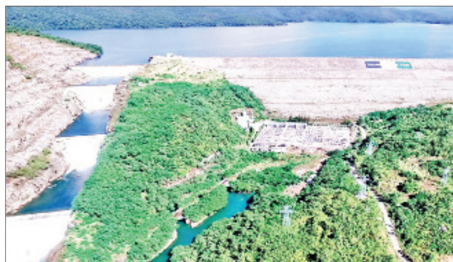
ပေါင်းလောင်းရေအားလျှပ်စစ်ဓာတ်အားပေးစက်ရုံကို တွေ့ရစဉ်။

ကိုဗစ်ကပ်ရောဂါဆိုးကြီးနှင့် နွေကာလတွင် အများပြည်သူများ ဓာတ်အား ပြတ်တောက်မှု မရှိရလေအောင် နိုင်ငံတော် မဟာဗျူဟာ အရန်စက်သုံးဆီမှပင် အရေးပေါ်အနေဖြင့် ဒီဇယ်ဆီဂါလန် ၂၀၅၀၀၀၀ တစ်ကြိမ်၊ ဂါလန် ၁၀၀၀၀၀၀ တစ်ကြိမ် နှစ်ရပ်ပေါင်းဒီဇယ်ဆီဂါလန် ၃၀၅၀၀၀၀ ကို ခေတ္တချေးယူခဲ့ပြီး အားချင်းဖြည့်ဆည်းမောင်းနှင်ကြရ၏။