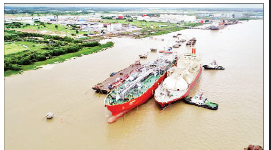
ဓာတ်အားပေးစက်ရုံများတွင် အသုံးပြုဆောင်ရွက်ရန် လိုအပ်သော LNG များအား သင်္ဘောဖြင့် သယ်ဆောင်လာစဉ်။