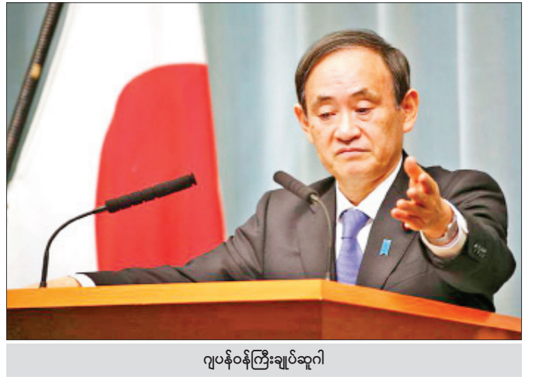
ဂျပန်ဝန်ကြီးချုပ်ဆူဂါ

ဆူဂါက အေဂျင်စီအသစ်တစ်ခုကို ဖွဲ့စည်းလိုပြီး အဆိုပါလုပ်ငန်းအတွက် အခြေခံအစီအမံကို ယခုနှစ် နှစ်ကုန်ပိုင်းတွင် ရေးဆွဲသွားရေးနှင့် လာမည့်နှစ်ဇန်နဝါရီတွင် ဥပဒေမူကြမ်းကို တင်သွင်းနိုင်ရေး ဆွေးနွေးခဲ့သည်။ ဆက်လက်ပြီး ဝန်ကြီးချုပ်က ကိုဗစ်-၁၉ ကြောင့် ဂျပန်နိုင်ငံ၏ ဒစ်ဂျစ်တယ်လိုက်ဇေးရှင်းတိုးတက်မှုနှုန်း နှောင့်နှေးသွားခဲ့ကြောင်း၊ လုပ်ငန်းစဉ်လည်ပတ်မှု မြန်ဆန်စေရေးအတွက် အားလုံးစုပေါင်းလုပ်ဆောင် ကြရန် လိုအပ်ကြောင်း မှာကြားခဲ့သည်။ ဒစ်ဂျစ်တယ်ပြောင်းလဲရေးဝန်ကြီး တာကဟာက စက်တင်ဘာလကုန်မှာပင် အထူးဆောင်ရွက်ရေးအဖွဲ့ (Task Force) ဖွဲ့စည်းပြီး ကြိုတင်ပြင်ဆင်ရေးလုပ်ငန်းစဉ်များ လုပ်ဆောင်တော့မည်ဖြစ်ကြောင်း အစည်းအဝေးအပြီးတွင် မီဒီယာများသို့ ပြောကြားသည်။