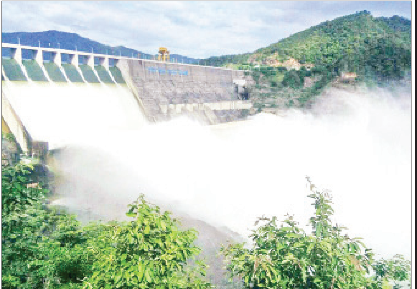
ရဲရွာရေအားလျှပ်စစ်ဓာတ်အားပေးစက်ရုံကို တွေ့ရစဉ်။

ထိုကာလများတွင် သဘာဝဓာတ်ငွေ့သုံး ဓာတ်အား ပေးစက်ရုံများနှင့် ကျောက်မီးသွေးသုံး စက်ရုံတို့က အဓိကမောင်းနှင် ထုတ်လုပ်ပေးကြရပေသည်။ ထိုကာလ