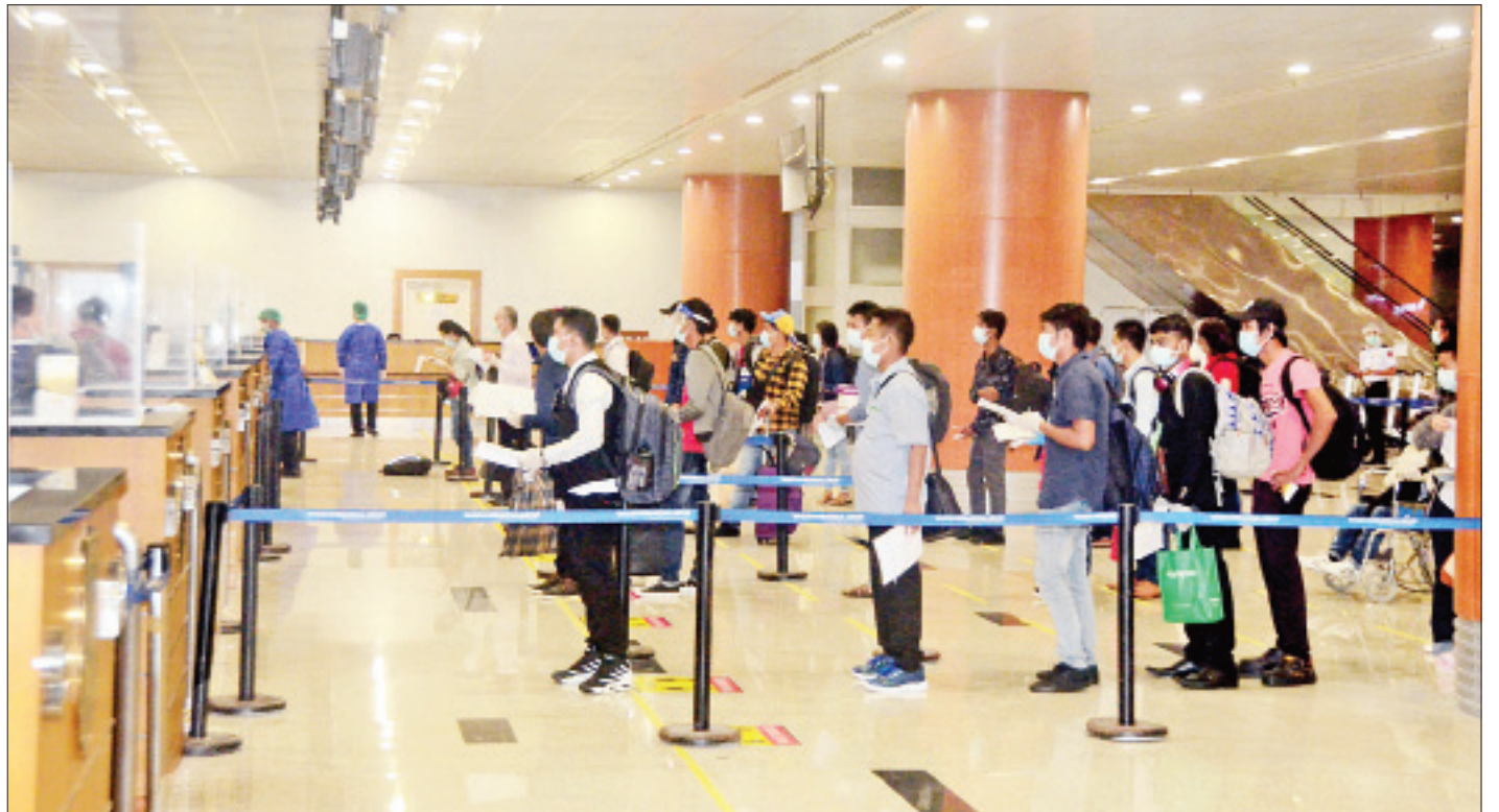
မလေးရှားနိုင်ငံမှ ပြန်လည်ရောက်ရှိလာသည့် မြန်မာနိုင်ငံသားများအား ရန်ကုန်အပြည်ပြည်ဆိုင်ရာလေဆိပ်၌ တွေ့ရစဉ်။

ဆက်လက်၍ မလေးရှားနိုင်ငံရောက် အထောက် ထားမှ မြန်မာနိုင်ငံသားများနှင့် အကြောင်းအမျိုးမျိုးကြောင့် မလေးရှားနိုင်ငံရှိ ထိန်းသိမ်းရေးစခန်းများတွင် ဖမ်းဆီး ထိန်းသိမ်းခံခဲ့ရသည့် မြန်မာနိုင်ငံသားများအား နိုင်ငံသား ဖြစ်တည်မှုမှန်ကန်ကြောင်း အထောက်အထားများ စိစစ်လျက် စာမျက်နှာ ၃ ကော်လံ ၁ သို့ ❖