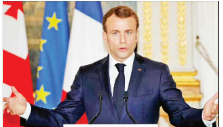
ပြင်သစ်သမ္မတ မက်ခရွန်