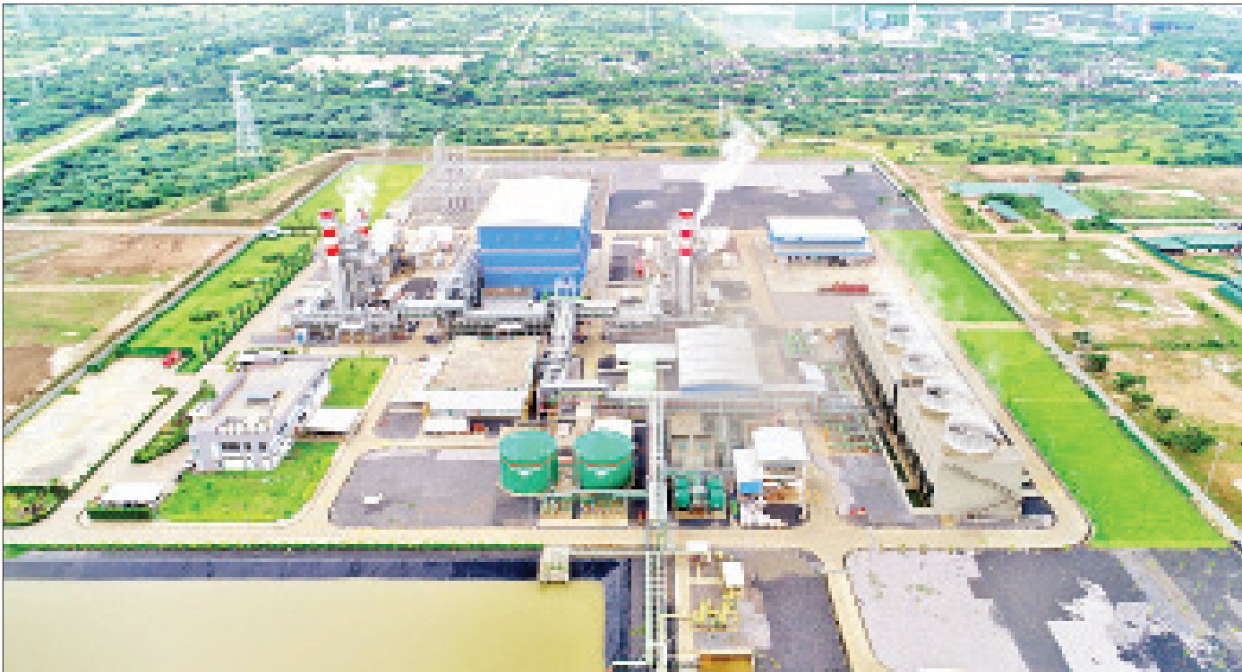
မြင်းခြံ သဘာဝဓာတ်ငွေ့သုံး လျှပ်စစ်ဓာတ်အားပေးစက်ရုံကို တွေ့ရစဉ်။

နိုင်ငံတော်ဓာတ်အားစနစ်၏ အနည်းငယ်မျှသော ဓာတ်အားလိုအပ်ချက်နှင့် လစ်ဟာမှုများကို အများပြည်သူများကလည်း နားလည်ပေးနိုင်ကြပေပြီ။