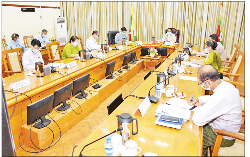
အသင်းချုပ်နှင့် ညီနောင်အသင်းအဖွဲ့များ၊ ရန်ကုန်တိုင်း ဒေသကြီး သယ်ယူပို့ဆောင်ရေးကြပ်ကွပ်ကဲမှုအဖွဲ့ဝင် အဖွဲ့နှင့် ဘုရင့်တော်စီးပွားရေးနှင့် ကူးသန်းရောင်းဝယ်ရေး ဝန်ကြီးဌာနက ကုန်စည်စီးဆင်းမှုများနှင့်ပတ်သက်၍ တင်ပြဆွေးနွေးကြရာ

ထို့နောက်အစည်းအဝေးသို့ တက်ရောက်လာကြသည့် ဌာနဆိုင်ရာများမှ တာဝန်ရှိသူများ၊ ပြည်ထောင်စုသမ္မတ မြန်မာနိုင်ငံတော်အစိုးရအဖွဲ့ဝင်များနှင့် စက်မှုလက်မှုလုပ်ငန်းရှင်များ