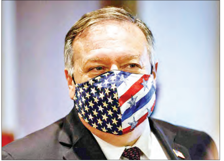
အမေရိကန်နိုင်ငံခြားရေးဝန်ကြီး မိုက်ပွန်ပီယို

ကြောင်းအရ ဖြစ်နိုင်မည်မဟုတ်ကြောင်း တုံ့ပြန်ထားပြီးဖြစ်သည်။ ထို့ပြင် ၂၀၁၅ စာချုပ်တွင် ပါဝင်ခဲ့သည့် ဗြိတိန်၊ ပြင်သစ်နှင့် ဂျာမနီနိုင်ငံတို့ကလည်း အဆိုပါအချက်ကိုပင် ထောက်ပြကာ အမေရိကန်၏ လုပ်ဆောင်မှုက ဥပဒေကြောင်းအရ သက်ရောက်မှုတစ်စုံတစ်ရာ ရှိမည်မဟုတ်ဟု ပြောသည်။ အီရန်နိုင်ငံခြားရေးဝန်ကြီး မိုဟာမက်ဂျာဗင်ဇာရစ်က ကမ္ဘာ့အသိုက်အဝန်းက အမေရိကန်၏ ယခုလို ရှုံးမိုက်သည့်လုပ်ဆောင်ချက်အပေါ် ဆန့်ကျင်မည်ဖြစ်ကြောင်း ဆိုခဲ့သည်။ ကိုးကား-စီအင်န်အေဘာသာပြန်-မေလွဲသင်း