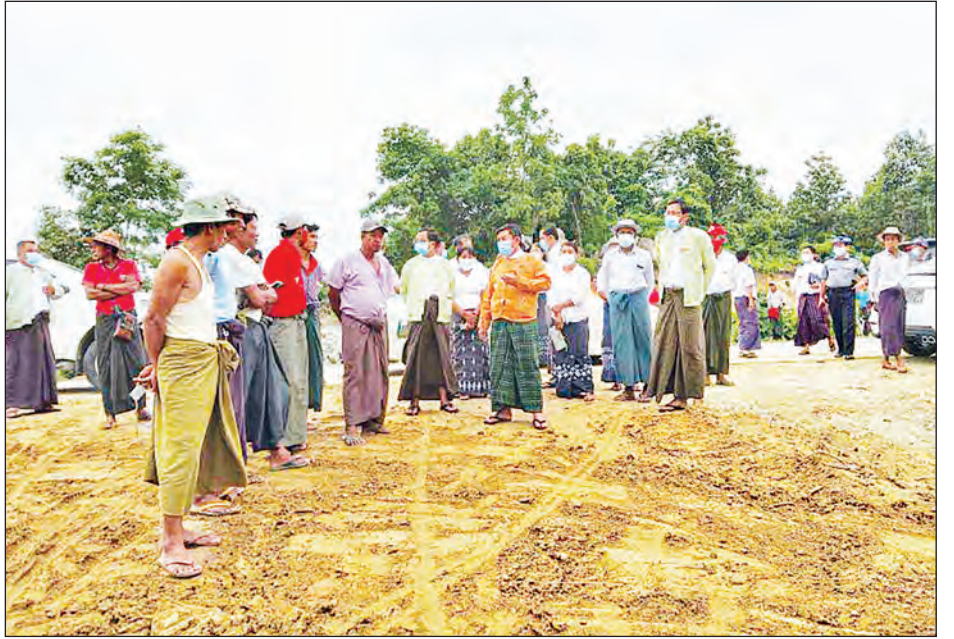
တင်စိုး(ပဲခူး)

ကျောင်းသားနှစ်ဦးအား စက်ဘီးထောက်ပံ့ပေးခဲ့သည်။ ထို့နောက် ဝန်ကြီးချုပ်သည် တောင်ငူခရိုင်အုပ်ချုပ်ရေးမှူး ဦးမိုးထက်၊ တောင်ငူ/ရေတာရှည်မြို့နယ် အုပ်ချုပ်ရေးမှူးများ၊ ဌာနဆိုင်ရာများနှင့်အတူ ရေတာရှည်မြို့နယ်နှင့် တောင်ငူမြို့နယ်သို့ ဆက်သွယ်သည့် ကျွဲရိုင်းပြင်- ကရင်ချောင်းတံတား ချဉ်းကပ်လမ်းမကြီးပေါ်သို့ တက်ရောက် ဖြတ်သန်းနိုင်မည့် ကျေးရွာလမ်းများ အဆင့်မြှင့်တင်ဖောက်လုပ် ဆောင်ရွက်မှုအခြေအနေများကို ကွင်းဆင်းကြည့်ရှု စစ်ဆေးပြီး တာဝန်ရှိသူများကို လိုအပ်သည်များ လမ်းညွှန် မှာကြားကာ တံတားအနီးဝန်းကျင်တွင်လည်း BIO Park လုပ်ငန်းစဉ်များ ဖော်ဆောင်နိုင်ရေးအတွက် လမ်းညွှန် မှာကြားခဲ့သည်။