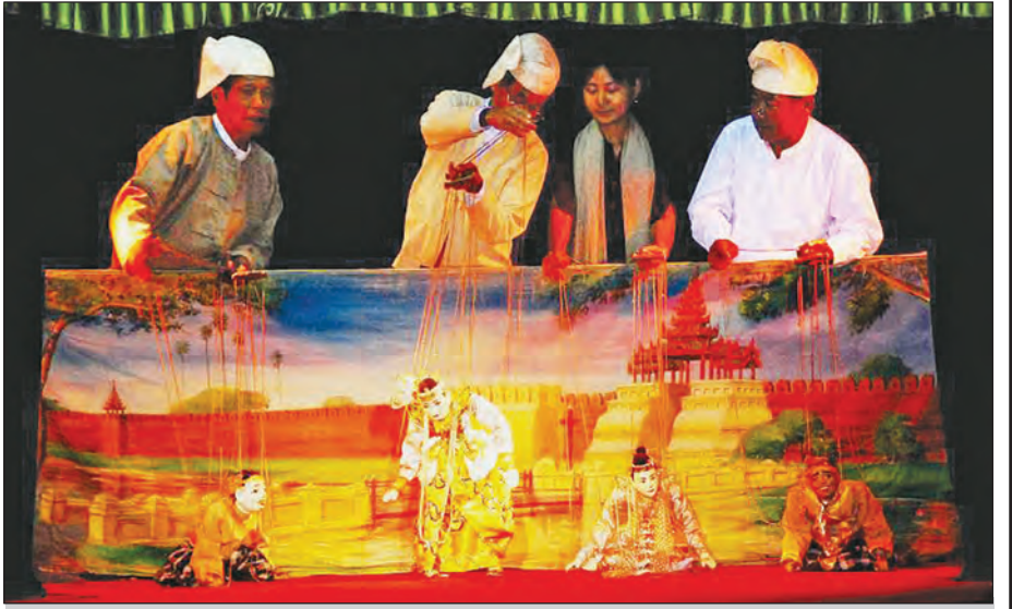
ရုပ်သေးသဘင်

အတော်ဆုံး ကြိုးဆွဲ အချို့သော ရုပ်သေးများသည် ဇော်ဂျီရုပ်ကို "ကောင်းချီး သင်္ခါ" ယိုးဒယားဖြင့် ခပ်လေးလေးထွက် တတ်ကြပါသည်။ ဇော်ရုပ်ကို ကြိုးဆွဲကျွမ်းကျင်သော မင်းသားကြီးဆွဲကြီးများသာ ကိုင်လေ့ရှိပါသည်။ ဇော်ရုပ်ဆွဲနိုင်သူက အတော်ဆုံး ကြိုးဆွဲဖြစ်သည်ဟု သတ်မှတ်ကြသည်။ ထို့ကြောင့် ဇော်ဆွဲသည် 'လူပေါ်လူဇော်' စသည်ဖြင့် ကျွမ်းကျင်ထူးခြားမှုကို တင်စားသုံးနှုန်းကြသည်။ ရုပ်သေးတွင် ဇော်ကကိုကြည့်၍ မင်းသားကြီးဆွဲကောင်းမည် မကောင်းမည်ကို အကဲခတ်ကြသလို နှံနှင့်ပတ်မထိန်း အစွမ်းကိုလည်း ဇော်တီးကွက်တွင် အကဲခတ်ကြပါသည်။ တချို့ရုပ်သေးများက ဇော်ဂျီကို နှစ်မျိုးနှစ်စားခွဲခြားထားသည်။ အနုအယဉ်သိမ်မွေ့စွာ ကသော နန်းဇော်နှင့် ကြမ်းတမ်းပေါ့ပါးစွာ ကသော တောဇော်ဟူ၍ ဖြစ်သည်။ ဇော်စထွက်လျှင် "ဇော်လာ