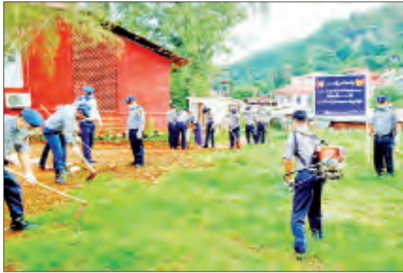
ရှမ်းပြည်နယ်(တောင်ပိုင်း) တောင်ကြီးခရိုင် ကလေးမြို့နယ်၌ (၅၆)နှစ်မြောက် မြန်မာနိုင်ငံရဲတပ်ဖွဲ့နေ့ကို ကြိုဆိုဂုဏ်ပြုသောအားဖြင့် ကလေးမြို့နယ် ရဲတပ်ဖွဲ့ဝင်များက စက်တင်ဘာ ၁၉ ရက်တွင် မြို့နယ်ပြည်သူ့ဆေးရုံအတွင်း စုပေါင်းသန့်ရှင်းရေးဆောင်ရွက်စဉ်။ မြို့နယ်(ပြန်/ဆက်)