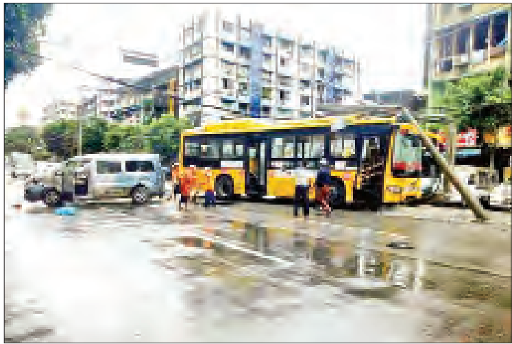
ဓာတ်ကြိုးများပျက်ကျခဲ့ရာ YESC နှင့် ရရှိမှု မရှိကြောင်းနှင့် အမှုဖွင့်အရေးယူရန် ယာဉ်ထိန်းရဲတပ်ဖွဲ့ဝင်များက ပူးပေါင်း စီစဉ်ဆောင်ရွက်လျက်ရှိကြောင်း သိရသည်။ ပွင့်သစ္စာ

ရန်ကုန်မြို့ ပန်းဘဲတန်းမြို့နယ်၌ ယနေ့နံနက်ပိုင်းက ခရီးသည်တင် YBS ယာဉ်တိုက်မိမှုကြောင့် ယာဉ် လမ်းလယ်ကျွန်းနှင့် ဓာတ်တိုင်ပျက်စီးခဲ့ကြောင်း သိရသည်။