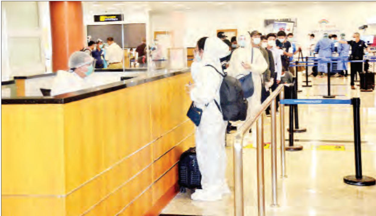
တရုတ်(တိုင်ပေ) မှ ပြန်လည်ရောက်ရှိလာသည့် မြန်မာနိုင်ငံသားများအား ရန်ကုန်အပြည်ပြည်ဆိုင်ရာလေဆိပ်၌ တွေ့ရစဉ်။