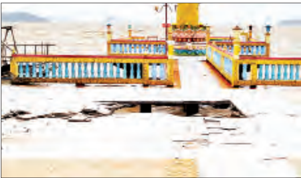
မြို့နယ်မီးသတ်တပ်ဖွဲ့ဝင်များ၊ ရဲတပ်ဖွဲ့ဝင်များ၊ ကျေးသောင်းခရိုင် သဘာဝဘေးအန္တရာယ်စီမံခန့်ခွဲမှုဦးစီးဌာနမှ တာဝန်ရှိသူများက ပျက်စီးဆုံးရှုံးမှုများ ဖြစ်ပေါ်ခဲ့ရသည့် အိမ်ထောင်စုများကို ထောက်ပံ့ကူညီမှုများ ဆက်လက် လုပ်ဆောင်လျက်ရှိကြောင်း သိရသည်။ ကျော်စိုး(ကော့သောင်း)

ကျေးသောင်း စက်တင်ဘာ ၂၀ တနင်္သာရီတိုင်းဒေသကြီး ကျေးသောင်းမြို့တွင် မိုးသည်းထန်စွာရွာသွန်းပြီး လေပြင်းတိုက်ခတ်သဖြင့် သစ်ပင်များပြိုလဲကာ ယမန်နေ့ နံနက်ပိုင်းက မြို့ပေါ်ရပ်ကွက် တချို့နှင့် ကျေးရွာတချို့ရှိ လူနေအိမ်တချို့ ပျက်စီးဆုံးရှုံးမှုများ ဖြစ်ပေါ်ခဲ့ပြီး မြို့အတွင်း ရေကြီးရေလျှံမှုများဖြစ်ပွားခဲ့ကြောင်း သိရသည်။