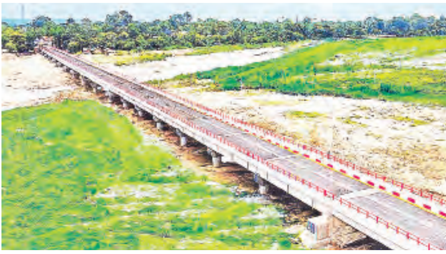
ဒီဇင်ဘာ ၁ ရက်တွင် စတင်ဆောင်ရွက် ဆောက်ရေးလုပ်ငန်းများ ရာနှုန်းပြည့် အများပြည်သူများ အသုံးပြုခွင့်ပြု တည်ဆောက်ခဲ့ပြီး ယခုအခါ တည်ပြီးစီးပြီဖြစ်၍ မော်တော်ယာဉ်နှင့် လိုက်ပြီဖြစ်သည်။ ခရမ်း-စိုးမြင့်

ရန်ကုန် စက်တင်ဘာ ၂၀ နွယ်တမယ်တံတားသည် မကွေးတိုင်းဒေသကြီး စလင်းမြို့နယ် မင်းဘူး-စလင်း-တညောင်း-ဆိပ်ဖြူလမ်းပေါ်တွင်တည်ရှိပြီး စလင်းချောင်းကို ဖြတ်သန်းတည်ဆောက်ထားခြင်းဖြစ်သည်။ တံတားအရှည် ပေ ၁၄၂၀၊ တံတားအမျိုးအစား အောက်ခံအုတ်မြစ် 1.5 m Ø Bored Pile၊ တံတားကိုယ်ထည် သံကူကွန်ကရစ် ကမ်းကပ်ခုံနှင့် ရေလယ်တိုင် တံတားအပေါ်ထည် 100 F Girder+60 RC Girder ဖြစ်ကာ ယာဉ်သွားလမ်း အကျယ် ၂၄ ပေ၊ လူသွားလမ်းအကျယ် တစ်ဖက် ၃ ပေ ၂ လက်မ၊ ခွင့်ပြုတန်ချိန် ယာဉ်တစ်စီးချင်း တန် ၆၀ ဖြစ်သည်။ တံတားစီမံကိန်းအား ၂၀၁၈ ခုနှစ်