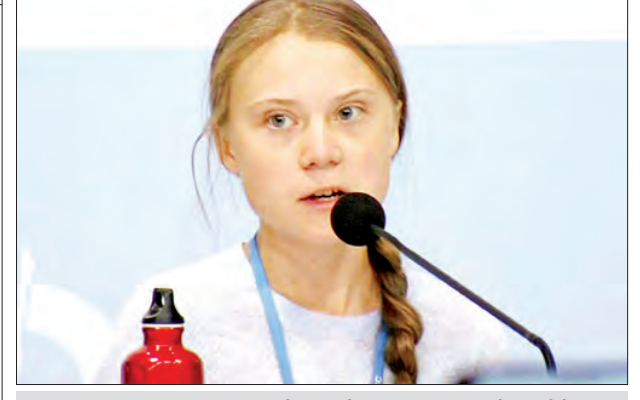
ရာသီဥတုအရေး တက်ကြွလှုပ်ရှားသူ ဂရီတာသွန်းဘက်ဂ်