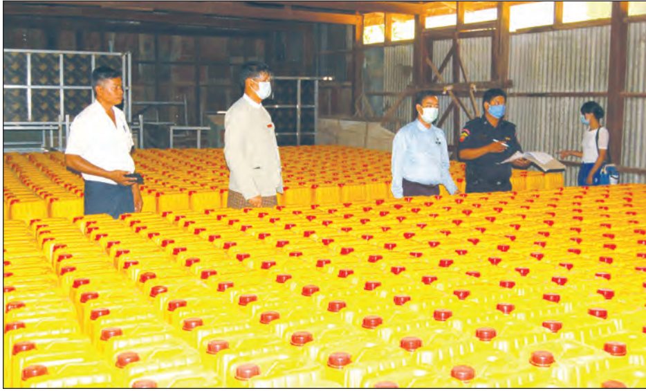
ကျောက်ဆည်ခရိုင်၌ အရေးပေါ်ရိက္ခာစားဆီများ သိုလှောင်ထားရှိ