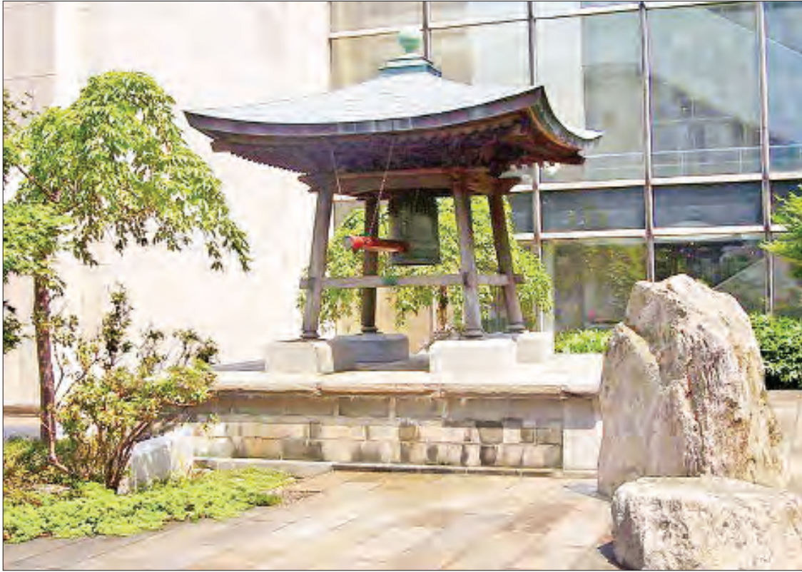
ကမ္ဘာ့ကုလသမဂ္ဂအဆောက်အအုံရှိ ငြိမ်းချမ်းရေးခေါင်းလောင်း။

၂၀၂၀ ပြည့်နှစ်အတွက် ဆောင်ပုဒ်မှာ “Shaping Peace Together” ဖြစ်သည်။ ကိုဗစ်-၁၉ ကပ်ရောဂါကာလနှင့်လည်း တိုက်ဆိုင်နေသဖြင့် သက်ဆိုင်ရာစည်းကမ်း များနှင့်အညီသာ ကျင်းပကြမည်ဖြစ်သည်။ ထူးခြားသည်မှာ ၂၀၁၈ ခုနှစ်က ဆောင်ပုဒ်မှာ “The Right to peace-The Universal Declaration of Human Rights at 70” ဖြစ်ပြီး နှစ် (၇၀) မြောက် အပြည်ပြည်ဆိုင်ရာ လူ့အခွင့်အရေးကြေညာစာတမ်းကို ဂုဏ်ပြု ထားခြင်းလည်းဖြစ်သည်။ ထိုကြေညာ စာတမ်းကို ၁၉၄၈ ခုနှစ် ဒီဇင်ဘာလ ၁၀ ရက်နေ့တွင် ပြင်သစ်နိုင်ငံ ကမ္ဘာ့ကုလသမဂ္ဂ အထွေထွေညီလာခံ၌ ကြေညာခဲ့ခြင်း ဖြစ်ပြီး နိုင်ငံတိုင်း၊ လူသားတိုင်းအတွက် ငြိမ်းချမ်းရေးရရှိစေဖို့ ဆောင်ရွက်ကြရန် တိုက်တွန်းခဲ့ခြင်း ဖြစ်သည်။ ယခုအခါ တစ်ကမ္ဘာလုံးက အလိုအရှိဆုံးဆုလာဘ်သည် ငြိမ်းချမ်းရေးသာ ဖြစ်သည်။ လူသားတိုင်း အေးချမ်းလုံခြုံစွာ နေထိုင်လိုကြခြင်း ဖြစ်သည်။ ကမ္ဘာ့နေရာဒေသ အတော်များများ တွင် ပြည်တွင်းစစ်ပွဲများ၊ အကြမ်းဖက် တိုက်ခိုက်မှုများ ကြုံတွေ့နေရသည်ကို တွေ့နိုင်ပါသည်။ အထူးသဖြင့် ဘာသာရေး အစွန်းရောက်မှုများ (Religious Extremism)၊ မျက်ကန်း အမျိုးချစ်ဝါဒများ (Ultra-Nationalism)၊ အမုန်းတရား ဖြန့်ချိနေမှုများ (Hate Campaign) မှာ ၂၁ ရာစု ငြိမ်းချမ်းရေး၏ အကြီးမားဆုံးစိန်ခေါ်မှု ဖြစ်သည့် အကြမ်းဖက်တိုက်ခိုက်မှုများ ဖြစ်ပေါ်နေကာ လူသားများ၏ ငြိမ်းချမ်းစွာ နေထိုင်ရေးကို ခြိမ်းခြောက်နေပါသည်။ ထိုမျှ မကဘဲ လူကုန်ကူးမှုများ၊ မူးယစ်ဆေးဝါး မှောင်ခိုရောင်းဝယ်နေမှုများ၊ နျူကလီးယား လက်နက် ထုတ်လုပ်လာမှုများ၊ ဓာတု လက်နက် ထုတ်လုပ်လာမှုများ၊ ရာဇဝတ်မှု ထူပြောလာခြင်းများအပါအဝင်၊ ရာသီဥတု ဖောက်ပြန် ပြောင်းလဲလာခြင်းတို့သည်လည်း အေးချမ်းစွာ နေထိုင်နိုင်ရေးကို ထိခိုက်လာနေ ပါသည်။ တစ်ကမ္ဘာလုံးရှိ လူသားများ၏ ရင်ထဲ၌ အနှစ်သက်ဆုံးအရာမှာ အားလုံး