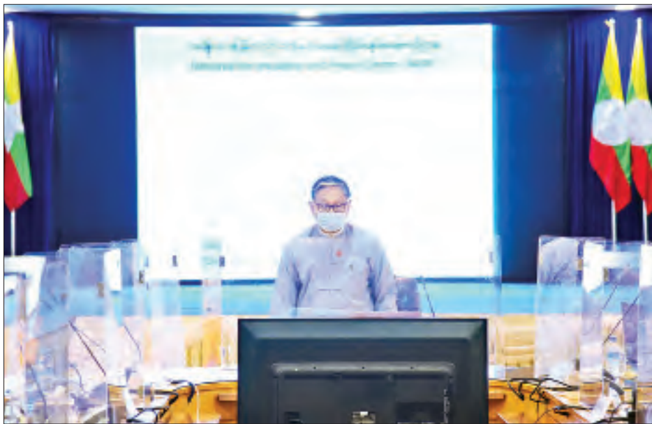
ရှင်းလင်းတင်ပြချက်များနှင့်စပ်လျဉ်း၍ သိရှိလိုသည်များနှင့် အကြံပြုချက်များကို အခမ်းအနားတက်ရောက်လာသူများက ရင်းနှီးပွင့်လင်းစွာ မေးမြန်းဆွေးနွေးခဲ့ရာ အမျိုးသားပြန်လည်သင့်မြတ်ရေးနှင့် ငြိမ်းချမ်းရေးဗဟိုဌာန ဒုတိယ ဥက္ကဋ္ဌနှင့် တာဝန်ရှိသူများက ပြန်လည်ဖြေကြား

◆ ရှေ့ပိုးမှ အဆိုပါ “ငြိမ်းချမ်းရေးဆိုင်ရာကိစ္စရပ်များ ရှင်းလင်းဆွေးနွေးခြင်းအခမ်းအနား”ကို စက်တင်ဘာ ၁၅ ရက်တွင် ရှမ်းပြည်နယ်အစိုးရအဖွဲ့ရုံး၌ ကျင်းပရာ ရှမ်းပြည်နယ်ဝန်ကြီးချုပ် ဒေါက်တာလင်းထွဋ်နှင့် အစိုးရအဖွဲ့ဝင်များ တက်ရောက်ခဲ့ကြပြီး ရှမ်းပြည်နယ်လွှတ်တော်ဥက္ကဋ္ဌ ဦးစိုင်းလှိုင်နှင့် လွှတ်တော်ကိုယ်စားလှယ်များက မီဒီယိုကွန်ဖရင့်ဖြင့်လည်းကောင်း၊ စက်တင်ဘာ ၁၆ ရက် တွင် ဓနကိုယ်ပိုင်အုပ်ချုပ်ခွင့်ရဒေသ ပင်းတယမြို့တွင် ကျင်းပသည့် “ငြိမ်းချမ်းရေးဆိုင်ရာကိစ္စရပ်များရှင်းလင်းဆွေးနွေးခြင်းအခမ်းအနား”သို့ ဓနကိုယ်ပိုင်အုပ်ချုပ်ခွင့်ရ ဒေသဦးစီးအဖွဲ့၏ အလုပ်အမှုဆောင် ကော်မတီဝင်(၂) ဦးညီညီ(ခ) ဦးညီလေးချမ်းနှင့် ဒေသဦးစီးအဖွဲ့ဝင်များက လည်းကောင်း၊ စက်တင်ဘာ ၁၇ ရက် နံနက်ပိုင်းတွင် ပအိုဝ်းကိုယ်ပိုင်အုပ်ချုပ်ခွင့်ရဒေသ ဟိုပုံးမြို့တွင် ကျင်းပသည့် “ငြိမ်းချမ်းရေးဆိုင်ရာကိစ္စရပ်များ ရှင်းလင်းဆွေးနွေးခြင်း အခမ်းအနား”သို့ ပအိုဝ်းကိုယ်ပိုင်အုပ်ချုပ်ခွင့်ရဒေသ ဦးစီးအဖွဲ့ ဥက္ကဋ္ဌ ဦးခွန်စံလွင်နှင့် ဒေသဦးစီးအဖွဲ့ဝင်များက လည်းကောင်း၊ စက်တင်ဘာ ၁၇ ရက် မွန်းလွဲပိုင်းတွင် တောင်ကြီးမြို့ရှိ ရှမ်းပြည်နယ်အစိုးရအဖွဲ့ရုံး၌ ကျင်းပသည့် အခမ်းအနားသို့ ပလောင်ကိုယ်ပိုင်အုပ်ချုပ်ခွင့်ရဒေသ ဦးစီးအဖွဲ့ဥက္ကဋ္ဌ ဦးဝင်းကျော်(ခ)ဦးအိုက်မိန်းနှင့် ဒေသဦးစီးအဖွဲ့ဝင်များကလည်းကောင်း တက်ရောက်ခဲ့ကြသည်။