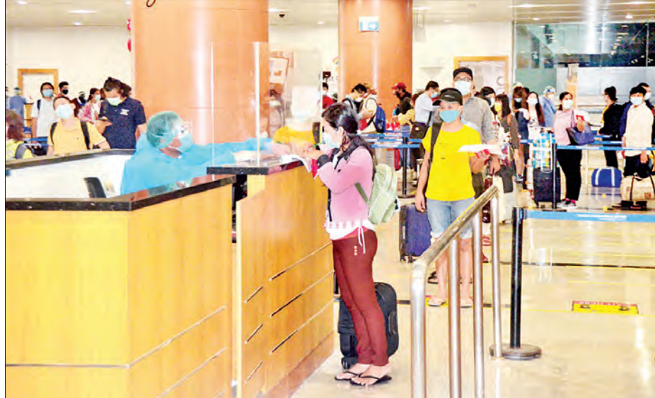
စင်ကာပူနိုင်ငံမှ ပြန်လည်ရောက်ရှိလာသည့် မြန်မာနိုင်ငံသားများအား ရန်ကုန်အပြည်ပြည်ဆိုင်ရာလေဆိပ်၌ တွေ့ရစဉ်။

နေပြည်တော် စက်တင်ဘာ ၁၈ နိုင်ငံတကာ ခရီးသည်တင်လေယာဉ်များပျံသန်းမှု ယာယီရပ်ဆိုင်းထားခြင်းကြောင့် စင်ကာပူနိုင်ငံ၌ အခက်အခဲကြုံတွေ့နေရသည့် မြန်မာနိုင်ငံသား ၁၅၃ ဦးအား မြန်မာအမျိုးသားလေကြောင်း(MNA) ကယ်ဆယ်ရေးလေယာဉ်ဖြင့် ပြန်လည်ခေါ်ဆောင်ခဲ့ရာ ယနေ့ညနေပိုင်းတွင် ရန်ကုန်အပြည်ပြည်ဆိုင်ရာလေဆိပ်သို့ အဆင်ပြေချောမွေ့စွာ ပြန်လည်ရောက်ရှိကြသည်။ ၎င်းတို့ ရန်ကုန်အပြည်ပြည်ဆိုင်ရာလေဆိပ်သို့ ရောက်ရှိချိန်တွင် လူဝင်မှုကြီးကြပ်ရေး၊ ကျန်းမာရေးစစ်ဆေးရေး၊ သီးသန့်စီစဉ်ပေးသည့်နေရာ/သတ်မှတ်ပတ်ဝန်းကျင်များ၌ အသွားအလာကန့်သတ်မှု ၁၄ ရက်နှင့် နေအိမ်တွင် အသွားအလာကန့်သတ်မှု ခုနစ်ရက် နေထိုင်စေရေးတို့ကို အလုပ်သမား၊ လူဝင်မှုကြီးကြပ်ရေးနှင့် ပြည်သူ့အင်အားဝန်ကြီးဌာန၊ ကျန်းမာရေးနှင့် အားကစားဝန်ကြီးဌာနနှင့် ရန်ကုန်တိုင်းဒေသကြီးအစိုးရအဖွဲ့တို့က သက်ဆိုင်ရာ အခန်းကဏ္ဍအလိုက် တာဝန်ယူဆောင်ရွက်ပေးခဲ့သည်။ ပြည်ပနိုင်ငံများတွင် အခက်အခဲကြုံတွေ့နေရသည့် မြန်မာနိုင်ငံသားများအား ပြန်လည်ခေါ်ဆောင်ရန် COVID-19 ကာကွယ်ထိန်းချုပ်ကုသရေး အမျိုးသားအဆင့်ဗဟိုကော်မတီ၏ လမ်းညွှန်ချက်နှင့်အညီ နိုင်ငံခြားရေးဝန်ကြီးဌာနအနေဖြင့် သက်ဆိုင်ရာဝန်ကြီးဌာနများ၊ သက်ဆိုင်ရာနိုင်ငံများရှိ မြန်မာသံရုံးများနှင့် ပူးပေါင်းညှိနှိုင်းဆောင်ရွက်ပေးလျက်ရှိပါသည်။ စင်ကာပူနိုင်ငံမှ ကယ်ဆယ်ရေးလေယာဉ်ကို အပတ်စဉ် သောကြာနေ့တိုင်း ပျံသန်းပြေးဆွဲလျက်ရှိပြီး ယနေ့အထိ စင်ကာပူနိုင်ငံမှ ကယ်ဆယ်ရေးလေယာဉ် ၁၈ ကြိမ် ပျံသန်းပြေးဆွဲခဲ့ပြီးဖြစ်ကြောင်း သိရသည်။ သတင်းစဉ်