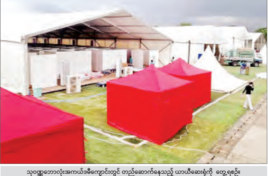
သုဝဏ္ဏဘောလုံးအကယ်ဒမီကျောင်းတွင် တည်ဆောက်နေသည့် ယာယီဆေးရုံကို တွေ့ရစဉ်။

အောင်မြင်မှုများ ရရှိခဲ့သည်။ ဆေးရုံများတွင် ယာယီဆေးရုံများထားရှိခြင်းနှင့် ပတ်သက်၍ နိုင်ငံတကာမှာ အတွေ့အကြုံအရ တရုတ်နိုင်ငံ ဝူဟန်မှာဆိုရင် ကိုဗစ်-၁၉ အတည်ပြုလူနာတွေကို သီးခြားကုပါတယ်။ ကျွန်တော်တို့ ဒါကို သီးခြားလုပ်နေပါတယ်။ အင်္ဂလန်၊ ဥရောပ၊ အီတလီ၊ အမေရိကန် စတဲ့နိုင်ငံတွေမှာ သီးခြားမလုပ်ခဲ့လို့ ဆေးရုံထဲက လူနာတွေရော၊ ကိုဗစ်-၁၉ ကူးစက်လူနာတွေပါ တော်တော်များများ သေတာတွေရမှာပါ။ လမ်းပေါ်အထိကို ရောက်တယ်။ ထားစရာနေရာ မရှိတော့ဘူးဆိုတာမျိုး အထိပေါ့။ ဒါကြောင့် သီးခြားထားနိုင်အောင် စီစဉ်တာပါ” ဟု ဒေါက်တာဇော်ဝေစိုးက ပြောသည်။ သတင်း - ရဲခေါင်ညွန့်၊ ဓာတ်ပုံ - ဇေယျာကျော်ဝင်း