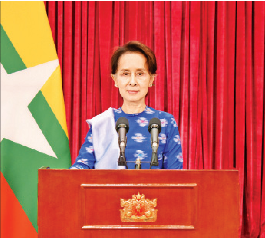
နိုင်ငံတော်၏အတိုင်ပင်ခံပုဂ္ဂိုလ် ဒေါ်အောင်ဆန်းစုကြည် ပြည်သူများသို့ အစီရင်ခံတင်ပြသည့် မိန့်ခွန်းပြောကြားစဉ်။

ကျွန်မတို့ ပြည်သူပြည်သားများအားလုံး ကျန်းမာချမ်းသာကြပါစေလို စတင်ပြီး တော့ ဆုတောင်းမေတ္တာပို့ပါတယ်။ အခု အချိန်မှာ ကျန်းမာဖို့ အထူးအရေးကြီးတယ် ဆိုတာလည်း အားလုံးနားလည်ပြီးသားလို့ ထင်ပါတယ်။ အခု ကိုဗစ်ရောဂါဟာဆိုရင် ဩဂုတ် လဝက်လောက်ကနေ စပြီးတော့ တစ်ကျော့ပြန့်ပြီး ထလာတယ်လို့ ပြောလို့ ရပါတယ်။ အခုဆိုရင် ရန်ကုန်တိုင်းမှာ အထူးပြန့်ပွားနေပါတယ်။ အဲဒါနဲ့ပတ်သက် လို့ ကျွန်မ အခုပြောတဲ့အချိန်မှာ ရန်ကုန်က ပြည်သူပြည်သားတွေကို အဓိကထားပြီး ကျွန်မပြောသွားမှာပါ။ ရခိုင်မှာ စစ်တွေဘက် ကနေစတဲ့ ရောဂါကို အခုအတော်အတန် ထိန်းနိုင်ပြီလို့ ပြောနိုင်ပါတယ်။ ဘာဖြစ် လို့လဲဆိုရင် စည်းမျဉ်းစည်းကမ်းတွေကို ကြပ်ကြပ်မတ်မတ် သတ်မှတ်ပြီးတော့ ပြည်သူလူထုက လိုက်နာလို့ ဖြစ်ပါတယ်။ အဲဒါနဲ့ပတ်သက်လို့လည်း ကျွန်မအနေနဲ့ ရခိုင်ပြည်နယ် ဝန်ကြီးချုပ် ဦးညီပုနဲ့တကွ ရခိုင်အစိုးရအဖွဲ့ရော၊ ပြည်သူပြည်သားတွေ အားလုံးရော ကျေးဇူးတင်တယ်လို့ ပြောချင် ပါတယ်။ ဒီလိုစည်းမျဉ်းစည်းကမ်းတွေကို ကြပ်ကြပ်မတ်မတ်လိုက်နာမယ်ဆိုရင် ကျွန်မ တို့ ဒီရောဂါကို မထိန်းနိုင်စရာအကြောင်း မရှိပါဘူး။