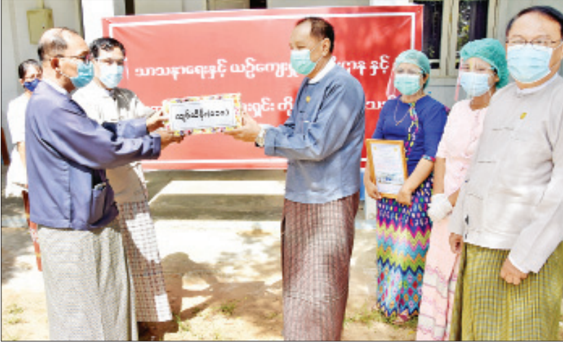
တို့ကို သာသနာရေးနှင့် ယဉ်ကျေးမှုဝန်ကြီးဌာနမှ နှင့် အားကစားဝန်ကြီးဌာနမှ တာဝန်ရှိသူများက တာဝန်ရှိသူများက ပေးအပ်လှူဒါန်းရာ ကျန်းမာရေး လက်ခံရယူခဲ့ကြောင်း သိရသည်။ သတင်းစဉ်

နေပြည်တော် စက်တင်ဘာ ၁၀ နေပြည်တော်အတွင်း ကန့်သတ်စောင့်ကြည့်စခန်း ဝင်ရောက်လျက်ရှိသော အစိုးရဝန်ထမ်းများနှင့် ကျန်းမာရေးကိစ္စရပ်များနှင့်စပ်လျဉ်း၍ တာဝန်ယူ စောင့်ရှောက်မှုပေးနေသည့် ကျန်းမာရေးနှင့် အားကစားဝန်ကြီးဌာနမှ ဆရာဝန်များ၊ သူနာပြုများ နှင့် ကျန်းမာရေးဝန်ထမ်းများအတွက် သာသနာရေး နှင့် ယဉ်ကျေးမှုဝန်ကြီးဌာနနှင့် လေးကျွန်းသူ ဖောင်ဒေးရှင်းတို့မှ အလှူငွေများ ပေးအပ်လှူဒါန်း ပွဲကို ယနေ့နံနက် ၁၀ နာရီတွင် နေပြည်တော် စည်ပင်ဧည့်ရိပ်သာရှိ အဆောင်(၅၆)တွင် ကျင်းပ သည်။ လှူဒါန်းပွဲတွင် သာသနာရေးနှင့် ယဉ်ကျေးမှု ဝန်ကြီးဌာန(သာသနာရေး)က ငွေကျပ် သိန်း ၄၀၊ သာသနာရေးနှင့်ယဉ်ကျေးမှုဝန်ကြီးဌာန(ယဉ်ကျေးမှု) က ငွေကျပ်သိန်း ၄၀၊ လေးကျွန်းသူဖောင်ဒေးရှင်းက ငွေကျပ် သိန်း ၃၀ စုစုပေါင်းငွေကျပ် သိန်း ၁၁၀