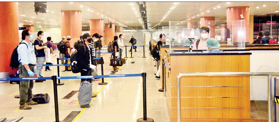
ကိုရီးယားနိုင်ငံမှ ပြန်လည်ရောက်ရှိလာသော မြန်မာနိုင်ငံသားများအား ရန်ကုန်အပြည်ပြည်ဆိုင်ရာလေဆိပ်၌ တွေ့ရစဉ်။

နေပြည်တော် စက်တင်ဘာ ၁၀ နိုင်ငံတကာခရီးသည်တင် လေယာဉ်များပျံသန်းမှု ယာယီရပ်ဆိုင်းထားခြင်းကြောင့် ဂျပန်နိုင်ငံ၌ အခက်အခဲကြုံတွေ့နေရသည့် မြန်မာနိုင်ငံသား ၁၃၃ ဦးအား တိုကျိုမြို့ မြန်မာသံရုံးမှ စီစဉ်သည့် (၇)ကြိမ်မြောက် All Nippon Airways (ANA) ကာယဆယ်ရေးလေယာဉ်ဖြင့် ပြန်လည်ခေါ်ဆောင်ခဲ့ရာ ယနေ့ညနေပိုင်းတွင် ရန်ကုန်အပြည်ပြည်ဆိုင်ရာလေဆိပ်သို့ အဆင်ပြေချောမွေ့စွာ ပြန်လည်ရောက်ရှိကြသည်။