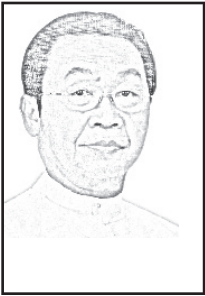
မောင်စာက

၂၀၂၀ ပြည့်နှစ် အထွေထွေရွေးကောက်ပွဲတွင် ပါဝင် ယှဉ်ပြိုင်ကြမည့် လွှတ်တော်ကိုယ်စားလှယ်လောင်းများ စာရင်းကို သက်ဆိုင်ရာ ရွေးကောက်ပွဲကော်မရှင်အဖွဲ့ခွဲ များက အတည်ပြုထုတ်ပြန်ကြေညာခဲ့ပြီးဖြစ်သည်။ လွှတ်တော်ကိုယ်စားလှယ်လောင်းများသည် မိမိတို့ ရွေးကောက်တင်မြှောက်ခံမည့် သက်ဆိုင်ရာ မဲဆန္ဒ နယ်မြေများ၌ စုဝေးဟောပြောခြင်းနှင့် မဲဆွယ်စည်းရုံးရေး လုပ်ငန်းများ ဆောင်ရွက်ကြရပါမည်။ ပြည်ထောင်စု ရွေးကောက်ပွဲကော်မရှင်ကလည်း လွှတ်တော်ကိုယ်စား လှယ်လောင်းများအတွက် မဲဆွယ်စည်းရုံးရေးညွှန်ကြား ချက်ကို ၆-၉-၂၀၂၀ ရက်စွဲပါ၊ ကြေညာချက်အမှတ် ၁၇၃/၂၀၂၀ ဖြင့် ထုတ်ပြန်ခဲ့ပါသည်။ မဲဆွယ်စည်းရုံးရေး ဆိုင်ရာ ညွှန်ကြားချက်များ မည်သို့ရှိသနည်း။ အနှစ်ချုပ် မှုပေးပါရစေ။