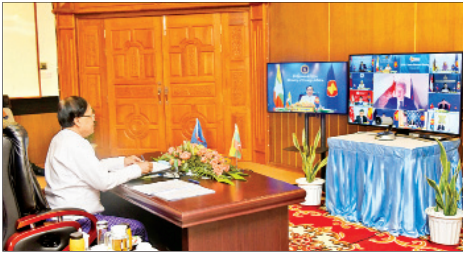
ပြည်ထောင်စုဝန်ကြီး ဦးကျော်တင် အာဆီယံ-ကနေဒါ နိုင်ငံခြားရေးဝန်ကြီးများအစည်းအဝေးသို့ တက်ရောက်စဉ်။

နေပြည်တော် စက်တင်ဘာ ၁၀ အာဆီယံ-အမေရိကန် နိုင်ငံခြားရေးဝန်ကြီးများ အစည်းအဝေး၊ အာဆီယံ-ကနေဒါ နိုင်ငံခြားရေးဝန်ကြီးများ အစည်းအဝေး၊ အာဆီယံ-ဩစတြေးလျ နိုင်ငံခြားရေးဝန်ကြီးများ အစည်းအဝေးနှင့် အာဆီယံ-နယူးဇီလန် နိုင်ငံခြားရေးဝန်ကြီးများအစည်းအဝေးများကို ယနေ့ နံနက် ၇ နာရီခွဲမှ စတင်၍ ဗီဒီယိုကွန်ဖရင့်ဖြင့် ကျင်းပရာ အပြည်ပြည်ဆိုင်ရာ ပူးပေါင်းဆောင်ရွက်ရေးဝန်ကြီးဌာန ပြည်ထောင်စုဝန်ကြီး ဦးကျော်တင် နေပြည်တော်ရှိ နိုင်ငံခြားရေးဝန်ကြီးဌာနမှ တက်ရောက်သည်။