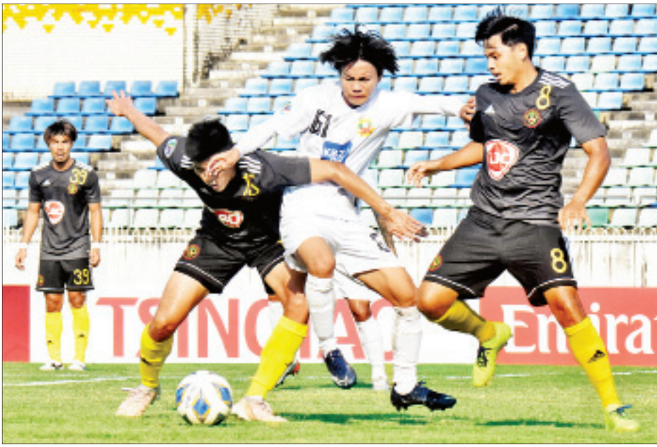
၂၀၂၀ AFC Cup ပြိုင်ပွဲတွင် ရှမ်းယူနိုက်တက်အသင်း ယှဉ်ပြိုင်စဉ်။

ကြေးမုံ ယနေ့ ဖတ်စရာ ရန်ကုန်တိုင်းဒေသကြီး အတွင်းရှိ ပြည်သူများသို့ အသိပေးကြေညာချက် စာမျက်နှာ » ၁၀ ၂၀၂၀ ပြည့်နှစ် အထွေထွေ ရွေးကောက်ပွဲနှင့်အတူ (၃၇) လွှတ်တော် ကိုယ်စားလှယ်လောင်းများ စုဝေးဟောပြောခြင်းနှင့် မဲဆွယ်စည်းရုံးခြင်း ဆောင်းပါး စာမျက်နှာ » ၁၁ ပြင်သစ်၌ ကိုရိုနာဗိုင်းရပ်စ် ကာကွယ်ရေး တိကျစွာ ဆုံးဖြတ်ရန် သိပ္ပံပညာဆိုင်ရာကောင်စီ တိုက်တွန်း စာမျက်နှာ » ၁၃