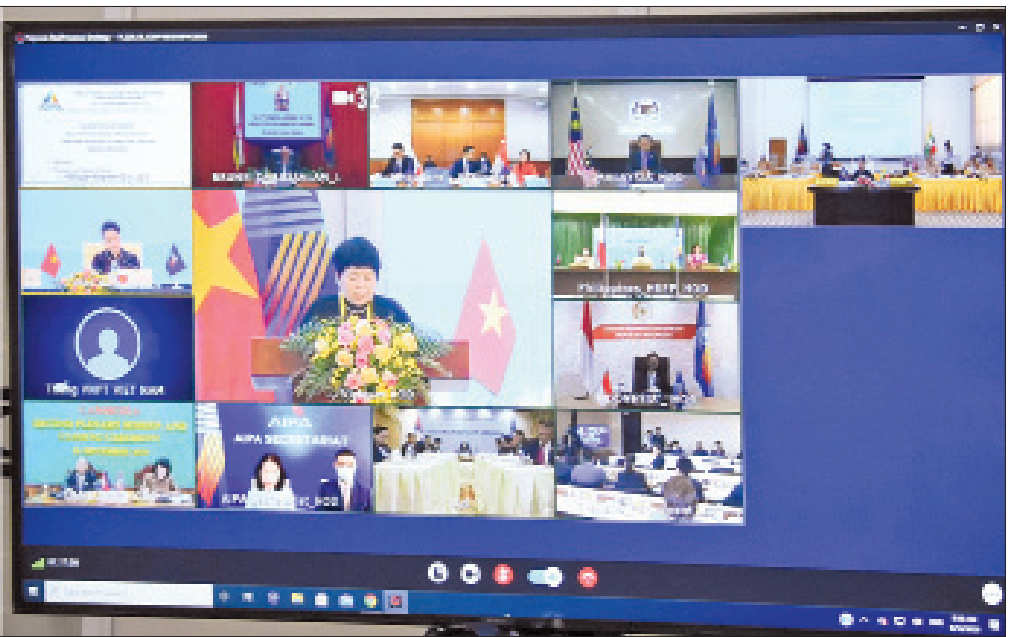
ပြည်ထောင်စုလွှတ်တော်နာယက၊ ပြည်သူ့လွှတ်တော်ဥက္ကဋ္ဌ ဦးတီခွန်မြတ်ဦးဆောင်သော မြန်မာလွှတ်တော်ကိုယ်စားလှယ်အဖွဲ့ (၄၁)ကြိမ်မြောက် အာဆီယံပါလီမန်များ အထွေထွေညီလာခံ ဒုတိယစုံညီအစည်းအဝေးနှင့် ပိတ်ပွဲအခမ်းအနားသို့ တက်ရောက်ကြစဉ်။