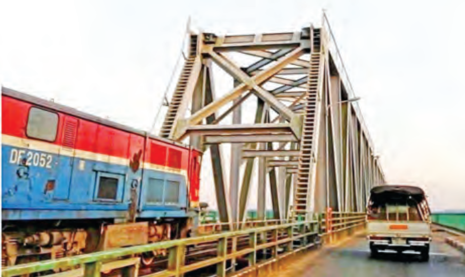
တည်ဆောက်ပြီး ရန်ကုန်-သန်လျင်တံတားအမှတ်(၁)အား တွေ့ရစဉ်။

ရန်ကုန်-သန်လျင်တံတား (အမှတ် ၁) ရန်ကုန်-သန်လျင်တံတားကြီးကို ပြည်ထောင်စု သမ္မတမြန်မာနိုင်ငံနှင့် တရုတ်ပြည်သူ့သမ္မတနိုင်ငံတို့ ၏ ချစ်ကြည်ရေးအထိမ်းအမှတ်အဖြစ် နှစ်နိုင်ငံ အင်ဂျင် နီယာများနှင့် အတတ်ပညာရှင်များ ပူးပေါင်း၍ ၁၉၈၈ ခုနှစ်မှ စတင်တည်ဆောက်ခဲ့ရာ ငါးနှစ်တာကာလအချိန် ကြာခဲ့ပြီး ၁၉၉၃ ခုနှစ် ဇူလိုင်လ ၃၁ ရက်နေ့တွင် တည်ဆောက်ပြီးစီးဖွင့်လှစ်ခဲ့သည်။ ရန်ကုန်-သန်လျင် တံတားမှာ ပဲခူးမြစ်ပေါ်တွင်တည်ဆောက်ခဲ့ပြီး တံတား အလယ်တွင် မီးရထားလမ်းနှင့် ဘေးနှစ်ဖက် ကားလမ်း အသွား/အပြန် ပါရှိသည်။ တံတားအလျား ၅၉၇၇ ပေရှိပြီး တံတားအကျယ်မှာ ၆၇၃၁၁၆၂ ပေရှိသည်။ ၁၉၉၃ ခုနှစ်မှ ယနေ့အချိန်အထိ မီးရထားလမ်းနှင့် ကားလမ်း အသုံးပြု နေရဆဲ တံတားကြီးတစ်စင်းဖြစ်သည်။ ရန်ကုန်- သန်လျင်-ကျောက်တန်းဒေသ၊ ခရမ်း-သုံးခွဒေသများနှင့်