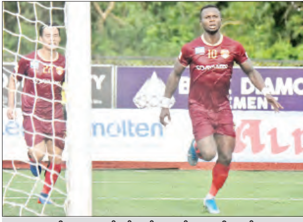
ဒုတိယနေရာတွင် ရပ်တည်နေသည့် ဧရာဝတီအသင်း။

ရန်ကုန် စက်တင်ဘာ ၉ ချန်ပီယံဆုအတွက် ပြိုင်ဆိုင်မှုပိုမိုပြင်းထန်လာတော့မည့် ၂၀၂၀ ရာသီ MNL အမှတ်ပေးပြိုင်ပွဲ ပွဲစဉ်(၁၅)ကို စက်တင်ဘာ ၁၁ ရက်နှင့် ၁၂ ရက်တို့တွင် ဆက်လက်ကျင်းပမည်ဖြစ်သည်။