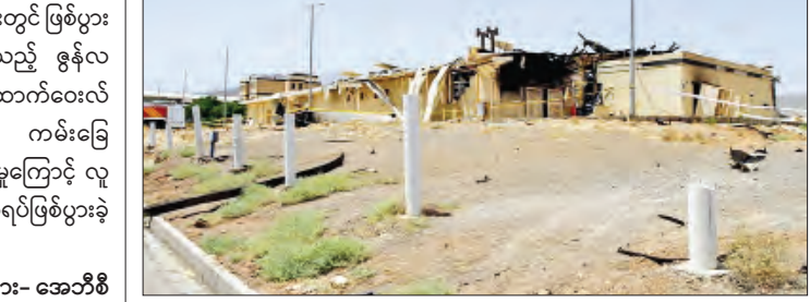
နာတက်ဇ်မြို့ရှိ မီးလောင်ပျက်စီးခဲ့သော ယခင်နျူကလီးယားစက်ရုံကို တွေ့ရစဉ်။

အသေးစိတ် စုံစမ်းမှုပြုသွားမည် ဖြစ်ကြောင်း အာဏာပိုင်များက အတည်ပြုခဲ့သည်။ ဖြစ်စဉ်နှစ်ရပ် စစ္စတာစတာလာ သေဆုံးမှုမှာ ဩစတြေးလျတွင် ယခုနှစ်အတွင်း ငါးမန်းတိုက်ခိုက်မှုကြောင့် ခြောက် ကြိမ်မြောက် လူသေဆုံးမှုဖြစ်စဉ် ဖြစ်ကာ ဖြစ်ရပ်အများစုမှာ နိုင်ငံ၏