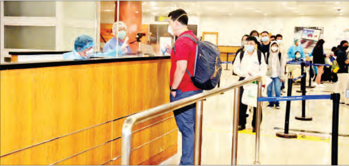
ထိုင်းနိုင်ငံမှ ပြန်လည်ရောက်ရှိလာသည့် မြန်မာနိုင်ငံသားများကို ရန်ကုန်အပြည်ပြည်ဆိုင်ရာလေဆိပ်၌ တွေ့ရစဉ်။