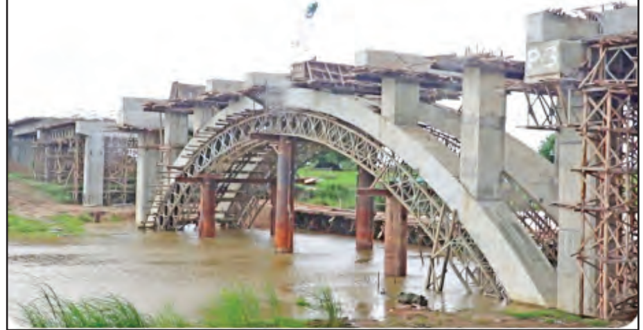
ပဲခူးမြစ်ကူးတံတား(မြို့ဦးကင်း) တည်ဆောက်မှုကို တွေ့ရစဉ်။

ပဲခူးမြစ်ကူးတံတား (မြို့ဦးကင်း) သည် ပဲခူးမြို့ စိန်သာလျောင်းဘုရားလမ်းနှင့် ဥဿာမြို့သစ် သမိန်ဗရမ်းလမ်းသို့ ဆက်သွယ်သွားလာနိုင်သည့် လမ်းဖြစ်သည့်အပြင် ပဲခူးမြို့ရှောင်လမ်းနှင့်ပါ ချိတ်ဆက်သွားလာနိုင်ပြီး သန်ပင်၊ ခရမ်း၊ သုံးခွနှင့် ရန်ကုန်တိုင်းဒေသကြီးအထိ လမ်းပေါက်သွားမည်။ ပဲခူးမြို့ရှောင်လမ်းကို ဆက်သွယ်သည့်လမ်းဖြစ်သည့်အတွက် ပဲခူးမြို့တွင်း ယာဉ်ကြောကျပ်တည်းမှုများ၊ ကုန်စည်စီးဆင်းမှုများ၊ ကျောင်းသား ကျောင်းသူများသွားလာနိုင်ရေး ပိုမိုအဆင်ပြေလာတော့မည်။