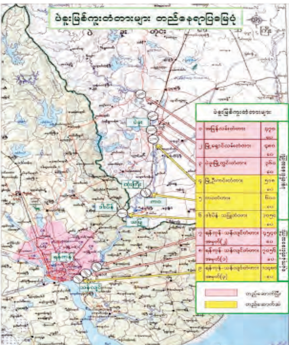
ပဲခူးမြစ်ကူးတံတားများ တည်နေရာပြမြေပုံ။

ပဲခူးတိုင်းဒေသကြီးအတွင်းရှိ တည်ဆောက်ဆဲ ပဲခူးမြစ်ကူးတံတား နှစ်စင်း တည်ဆောက်ဆဲ ပဲခူးမြစ်ကူးတံတား (မြို့ဦးကင်း) ပဲခူးမြို့ ကုန်စည်စီးဆင်းမှုမြန်ဆန်ရေးနှင့် မြို့တွင်း သွားလာရာတွင် ယာဉ်ကြောရှုပ်ထွေးမှုလျော့နည်းစေရန်အတွက် ပဲခူးမြစ်ကူးတံတား (မြို့ဦးကင်း) တည်ဆောက်ခြင်းလုပ်ငန်းကို ပဲခူးတိုင်းဒေသကြီးအစိုးရအဖွဲ့ ခွင့်ပြုရန်ပုံငွေဖြင့် ဆောက်လုပ်ရေးဝန်ကြီးဌာန တံတားဦးစီးဌာန တံတားအထူးအဖွဲ့ (၉)မှ တာဝန်ယူ ဆောင်ရွက်လျက်ရှိရာ ယခုအခါ တည်ဆောက်ရေးလုပ်ငန်း ၈၅ ရာခိုင်နှုန်း ပြီးစီးပြီဖြစ်ကြောင်း သိရှိရသည်။ ပဲခူးမြစ်ကူးတံတား (မြို့ဦးကင်း) တံတားအမျိုးအစားသည် သံကူကွန်ကရစ်တံတားဖြစ်ပြီး အရှည် ၅၁၈ ပေ၊ ယာဉ်သွားလမ်းအကျယ် ၂၈ ပေ နှစ်လမ်းသွားနှင့် လူသွားလမ်းအကျယ်တစ်ဖက်ခြောက်ပေရှိသည်။ ပဲခူးမြစ်ကူးတံတား (မြို့ဦးကင်း) သည် ပဲခူးမြို့ စိန်သာလျောင်းဘုရားလမ်းနှင့် ဥဿာမြို့သစ် သမိန်ဗရမ်းလမ်းသို့ ဆက်သွယ်သွားလာနိုင်သည့်လမ်း ဖြစ်သည့်အပြင် ပဲခူးမြို့ရှောင်လမ်းနှင့်ပါ