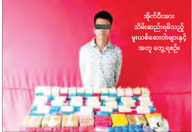
အိုက်ပီးအား သိမ်းဆည်းရမိသည့် မူးယစ်ဆေးဝါးများနှင့် အတူ တွေ့ရစဉ်။

နေပြည်တော် စက်တင်ဘာ ၉ မူးယစ်ဆေးဝါးတားဆီးနှိမ်နင်းရေးရဲတပ်ဖွဲ့မှ တပ်ဖွဲ့ဝင်များသည် စက်တင်ဘာ ၈ ရက် မွန်းလွဲ ၂ နာရီတွင် ချမ်းမြသာစည်မြို့နယ် မြို့သစ်(၁)ရပ်ကွက် (၆၂) လမ်း (၁၀၃) လမ်းထောင့်တွင် ငြိမ်းချမ်းအောင်(ခ)မင်းပြည့်စုံအောင် မောင်းနှင်ပြီး