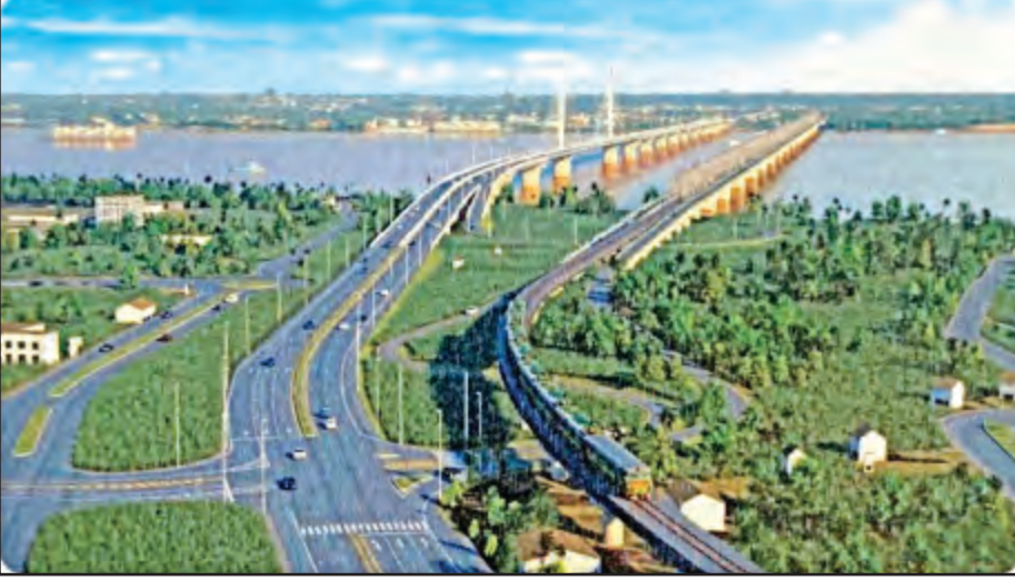
ရန်ကုန်-သန်လျင်တံတား အမှတ်(၃)တည်ဆောက်ပြီးလျှင် တွေ့ရမည့်ပုံစံ။

သန်လျင်ဘက်ကမ်းတွင် သီလဝါအထူးစီးပွားရေးဇုန် (SEZ) နှင့် Myanmar International Terminals Thilawa (MITT) တို့ကို အကောင်အထည်ဖော် ဆောင်ရွက်လျက်ရှိ သည်။ ရန်ကုန်မြို့၏ အဓိက စီးပွားရေးနယ်မြေတွင် ပါဝင်သည့် မြို့နယ်များနှင့် သန်လျင်-သီလဝါ အထူးစီးပွား ရေးဇုန်တို့ ကူးသန်းသွားလာမှုကြောင့် လည်းကောင်း၊ သန်လျင်ဒေသပတ်ဝန်းကျင်မှ ဒေသခံပြည်သူများ ခရီးသွား မှုကြောင့်လည်းကောင်း လက်ရှိ ရန်ကုန်-သန်လျင် တံတား အမှတ် (၁)သည် ဖြတ်သန်းနေသည့်ယာဉ်စီးရေ များပြား လာပြီး ယာဉ်ကြောပိတ်ဆို့မှုများ ဖြစ်ပေါ်လျက်ရှိသည်။ လက်ရှိတံတား၏ အသွား/အပြန် လမ်းယာဉ်ကြောနှင့် မလုံလောက်ပါသဖြင့် ပဲခူးမြစ်ကူးတံတား (သန်လျင်