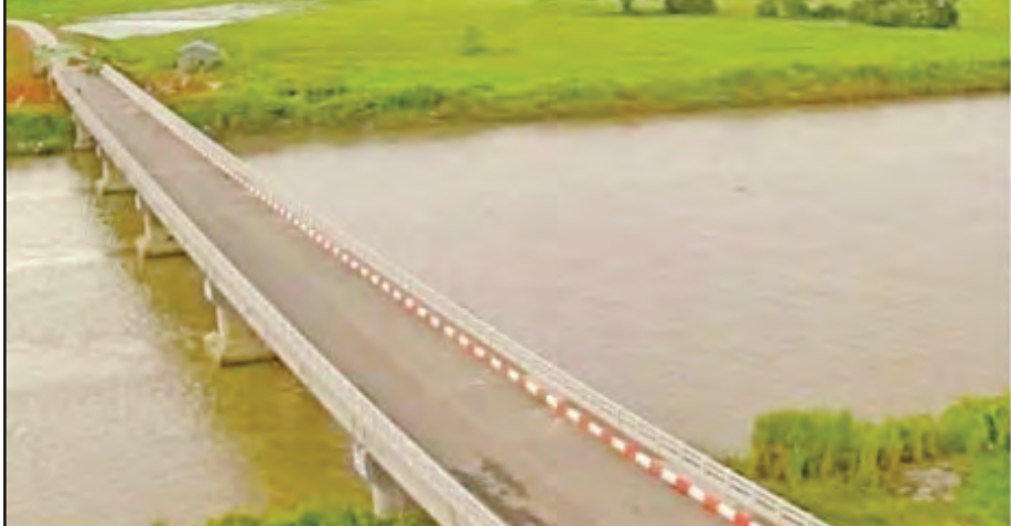
မကြာမီဖွင့်လှစ်တော့မည့် ပဲခူးမြစ်ကူးတံတား(ကဝ) တည်ဆောက်ပြီးစီးမှုကို တွေ့ရစဉ်။