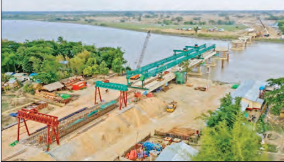
ပဲခူးမြစ်ကူးတံတား(ဒါးပိန်-သပြေ)တည်ဆောက်မှုကို တွေ့ရစဉ်။

အာဆီယံနိုင်ငံများအတွင်း မိမိနိုင်ငံ၏ မြို့ကြီးများ၌ နိုင်ငံတကာအဆင့်မီတံတားများ ပေါ်ထွန်းလာခြင်းဖြင့် မြို့ကြီးများ၏ စနစ်တကျဖွံ့ဖြိုးတိုးတက်မှုများကို အထောက်အပံ့ဖြစ်စေသည်။ အဆင့်မြင့် နည်းပညာများ ဖြင့်ဆောက်လုပ်မည့် တံတားများဖြစ်သည့်အတွက် မြန်မာအင်ဂျင်နီယာများအနေဖြင့် တံတားပုံစံထုတ်လုပ် ခြင်း၊ တည်ဆောက်ခြင်း စသည့်ခေတ်မီနည်းပညာနှင့် အတွေ့အကြုံများရရှိနိုင်ပြီး ကျွမ်းကျင်လုပ်သားများ လည်း ပေါ်ထွက်လာမည်ဖြစ်သည်။ ထို့အပြင် ပြည်တွင်း ရှိ ကျွမ်းကျင်လုပ်သားများအတွက် အလုပ်အကိုင်အခွင့်