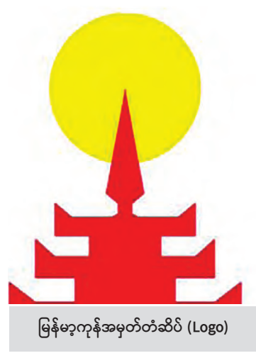
မြန်မာ့ကုန်အမှတ်တံဆိပ် (Logo)

ပို့ကုန်ဦးဆောင်သော ဖွံ့ဖြိုးတိုးတက်ရေး မဟာဗျူဟာကိုကျင့်သုံး၍ မြန်မာ့စီးပွားရေးလုပ်ငန်းများကို မြှင့်တင်ပေးခြင်းဖြင့် မြန်မာနိုင်ငံအား ဒေသတွင်းကုန်သွယ်မှု ယှဉ်ပြိုင်နိုင်စွမ်းရှိသော နိုင်ငံတစ်နိုင်ငံဖြစ်လာစေရန် မျှော်မှန်းချက်ဖြင့် ၂၀၁၆ ခုနှစ် ဧပြီ ၁ ရက်တွင် စတင်ဖွဲ့စည်းခဲ့ပါသည်။ ဌာနအသစ်ဖြစ်သော်လည်း ဌာန၏ပင်မလုပ်ငန်းများဖြစ်သော ကုန်သွယ်မှုမြှင့်တင်ရေးလုပ်ငန်းများကို စနစ်တကျထိရောက်စွာ အကောင်အထည်ဖော်ဆောင်ရွက်နိုင်ရေးအတွက် ရုံးချုပ်/ဌာနခွဲများနှင့် တိုင်းဒေသကြီး/ပြည်နယ်များရှိ ကုန်သွယ်မှုဗဟိုဌာနများ၊ ပြည်ပနိုင်ငံများရှိ စီးပွားရေးသံမှူးများနှင့် ကွန်ရက်သဖွယ် ချိတ်ဆက်ပူးပေါင်း ဆောင်ရွက်လျက်ရှိသည်။