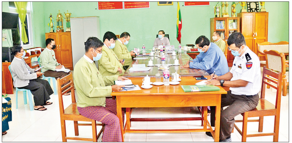
ပြည်ထောင်စုဝန်ကြီး ဦးမင်းသူ ရွေးကောက်ပွဲ အောင်မြင်စွာကျင်းပနိုင်ရေး ကူညီပံ့ပိုးဆောင်ရွက်ပေးရမည့် အုပ်ချုပ်ရေးလုပ်ငန်းစဉ်များအတွက် ကွင်းဆင်းဆောင်ရွက်ညှိနှိုင်းပေးစဉ်။