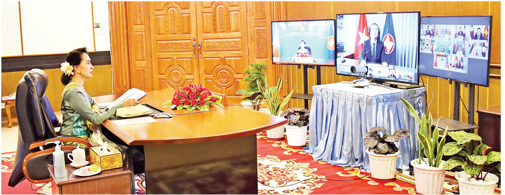
နိုင်ငံတော်၏အတိုင်ပင်ခံပုဂ္ဂိုလ် ဒေါ်အောင်ဆန်းစုကြည် (၅၃)ကြိမ်မြောက် အာဆီယံနေ့အထိမ်းအမှတ်အဖြစ် ရန်ကုန်မြို့ရှိ အာဆီယံအဖွဲ့ဝင်နိုင်ငံများမှ သံအမတ်ကြီးများအား ဗီဒီယိုကွန်ဖရင့်စနစ်ဖြင့် လက်ခံတွေ့ဆုံ၍ ကိုဗစ်-၁၉ ကူးစက်ရောဂါ တိုက်ဖျက်ရေးဆိုင်ရာ အာဆီယံအဖွဲ့ဝင်နိုင်ငံများ၏ ကြိုးပမ်းဆောင်ရွက်မှုများ၊ သတင်းအချက်အလက်များနှင့် အတွေ့အကြုံများကို အပြန်အလှန်ဆွေးနွေးဖလှယ်စဉ်။