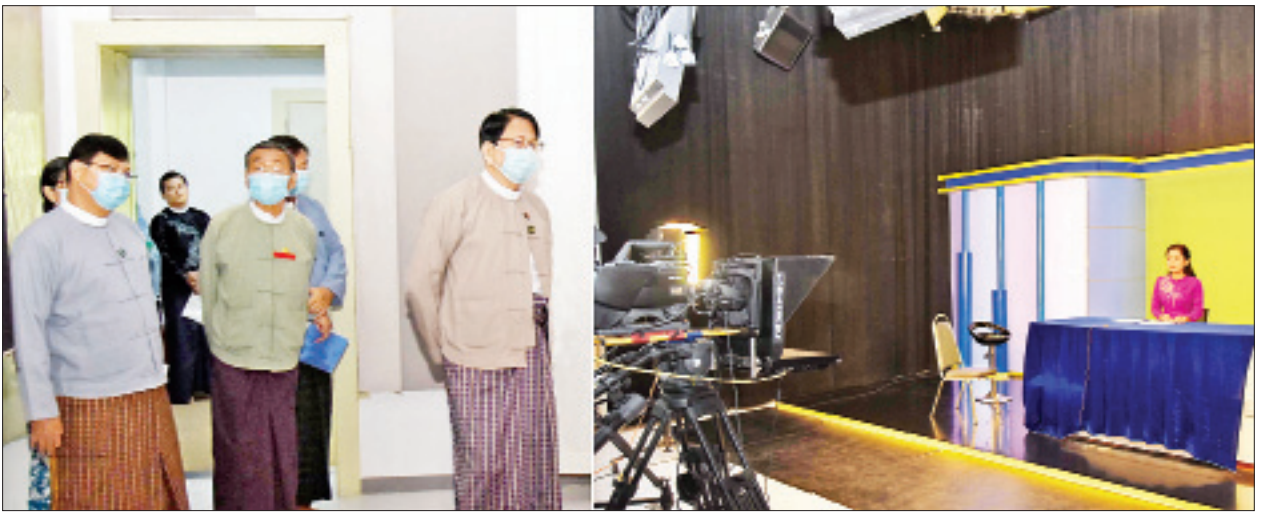
ပြည်ထောင်စုဝန်ကြီး ဒေါက်တာဖေမြင့် တောင်သူလယ်သမားကဏ္ဍရုပ်သံလိုင်းနှင့် တိုင်းရင်းသားလူမျိုးများ ရုပ်သံလိုင်းသတင်းရိုက်ကူးသည့် Small Studio (II) ၌ လုပ်ငန်းများဆောင်ရွက်နေမှုကို ကြည့်ရှုစစ်ဆေးစဉ်။

ထို့နောက် ပြည်ထောင်စုဝန်ကြီးနှင့်အဖွဲ့သည် တောင်သူလယ်သမားကဏ္ဍရုပ်သံလိုင်းနှင့် တိုင်းရင်းသားလူမျိုးများ ရုပ်သံလိုင်းသတင်းရိုက်ကူးသည့် Small Studio (I)၊ ရေဒီယို ဓာတ်ပြားတိုက်၊ ရုပ်မြင်သံကြားရုံ၊ ဖလင်တီပုံနှိပ်စက်ရုံ၊ သိမ်းရေးဌာနစိတ် (Umatic and Betacam) နှင့် ဒစ်ဂျစ်တယ်နည်းဖြင့် မှတ်တမ်းများ ထိန်းသိမ်းသည့်နေရာ၊ သတင်းခန်းများ (News Studio)၊ HD စနစ်ဖြင့် အဆင့်မြင့်