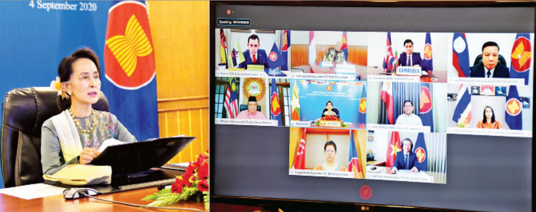
နိုင်ငံတော်၏အတိုင်ပင်ခံပုဂ္ဂိုလ် ဒေါ်အောင်ဆန်းစုကြည် (၅၃)ကြိမ်မြောက် အာဆီယံနေ့အထိမ်းအမှတ်အဖြစ် ရန်ကုန်မြို့ရှိ အာဆီယံအဖွဲ့ဝင်နိုင်ငံများမှ သံအမတ်ကြီးများအား ဗီဒီယိုကွန်ဖရင့်စနစ်ဖြင့် လက်ခံတွေ့ဆုံ၍ ကိုဗစ်-၁၉ ကူးစက်ရောဂါ တိုက်ဖျက်ရေးဆိုင်ရာ အာဆီယံအဖွဲ့ဝင်နိုင်ငံများ၏ ကြိုးပမ်းဆောင်ရွက်မှုများ၊ သတင်းအချက်အလက်များနှင့် အတွေ့အကြုံများကို အပြန်အလှန်ဆွေးနွေးဖလှယ်စဉ်။

နေပြည်တော် စက်တင်ဘာ ၄ နိုင်ငံတော်၏အတိုင်ပင်ခံပုဂ္ဂိုလ်၊ နိုင်ငံခြားရေးဝန်ကြီးဌာန ပြည်ထောင်စုဝန်ကြီး ဒေါ်အောင်ဆန်းစုကြည်သည် (၅၃)ကြိမ်မြောက် အာဆီယံနေ့ အထိမ်းအမှတ် အဖြစ် ရန်ကုန်မြို့ရှိ အာဆီယံအဖွဲ့ဝင်နိုင်ငံများမှ သံအမတ်ကြီးများနှင့် ယနေ့ နံနက် ၁၀ နာရီတွင် ဗီဒီယိုကွန်ဖရင့်စနစ်ဖြင့် နေပြည်တော်ရှိ နိုင်ငံခြားရေး ဝန်ကြီးဌာနမှ လက်ခံတွေ့ဆုံပြီး ကိုဗစ်-၁၉ ကူးစက်ရောဂါ တိုက်ဖျက်ရေးဆိုင်ရာ အာဆီယံအဖွဲ့ဝင်နိုင်ငံများ၏ ကြိုးပမ်းဆောင်ရွက်မှုများ၊ သတင်းအချက်အလက် များနှင့် အတွေ့အကြုံများကို အပြန်အလှန်ဆွေးနွေးဖလှယ်ခဲ့ကြသည်။ စာမျက်နှာ ၃ ကော်လံ ၁ သို့ □