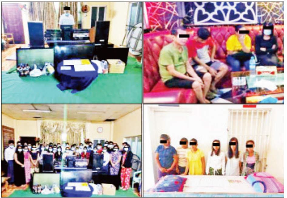
၁၈ မြို့နယ်တို့မှ KTV၊ Bar ၁၀ ဆိုင်၊ အနိပ်ခန်း ၅၈ ခန်း၊ သက်ဆိုင်ရာမြို့နယ်များ၌ ဥပဒေနှင့်အညီ အမှုဖွင့် ပြည့်တန်ဆာအိမ် နှစ်အိမ်နှင့် ဖမ်းဆီးရမိသူ ၂၀၅ ဦးတို့အား အရေးယူဆောင်ရွက်ထားကြောင်း သိရသည်။ သတင်းစဉ်

စုစုပေါင်း တိုင်းဒေသကြီး/ပြည်နယ် ကိုးခု၊ မြို့နယ်