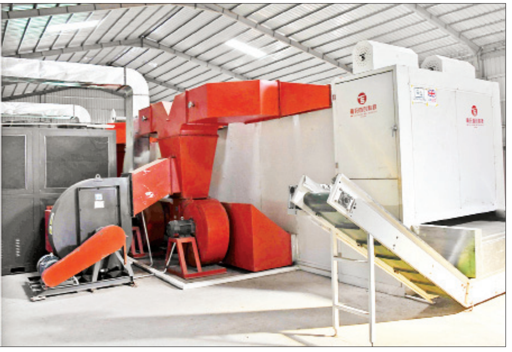
ဒုတိယသမ္မတ ဦးဟင်နရီဗန်ထီးယူ မင်းတပ်မြို့နယ်ရှိ “ဝ”ဥလွှာခြောက်စက်ရုံကို ကြည့်ရှုစစ်ဆေးစဉ်။

လျက်ရှိပြီး ဆက်လက် အကောင် အထည်ဖော် ဆောင်ရွက်နိုင်ရန် ကြိုးပမ်းလျက်ရှိပါကြောင်း။ ချင်းပြည်နယ်၏ မိရိုးဖလာ ရွှေ့ပြောင်းတောင်ယာစနစ်ကို အစား ထိုးနိုင်ရေးအတွက် ချင်းပြည်နယ်၏ တောတောင်ရေမြေ သဘာဝနှင့် ကိုက်ညီပြီး ဈေးကွက်ဝင်သည့် “ဝ”ဥ ကော်ဖီနှင့် ထောပတ် စီးပွားဖြစ် စိုက်ပျိုးထုတ်လုပ်ခြင်းကို ကြိုးပမ်း ဆောင်ရွက်သွားကြရမည် ဖြစ်ပါ ကြောင်း၊ ချင်းပြည်နယ်အတွင်းရှိ စိုက်ပျိုးရေးလုပ်ငန်းများနှင့် အသေး စားနှင့် အလတ်စား လုပ်ငန်းများ ချေးငွေရရှိနိုင်ရေးအတွက် နည်းလမ်း များ ရှာဖွေဖော်ထုတ်ဆောင်ရွက်ပေး သွားကြရမည် ဖြစ်ပါကြောင်း၊ နိုင်ငံတော်အစိုးရက ပြည်နယ်ဖွံ့ဖြိုး ရေးလုပ်ငန်းများ တိုးမြှင့်ဆောင်ရွက် ပေးနေသည့်ကာလတွင် ဒေသခံ ပြည်သူများအနေဖြင့် နိုင်ငံ၏ စီးပွားရေးဖွံ့ဖြိုးတိုးတက်မှုလုပ်ငန်း များတွင် တတ်အားသရွေ့ ပူးပေါင်း ပါဝင်ဆောင်ရွက်သွားကြရမည် ဖြစ်ပါ ကြောင်း၊ သို့မှသာ ဖွံ့ဖြိုးတိုးတက်မှုကို အလျင်အမြန် ရရှိခံစားနိုင်ကြမည် ဖြစ်ပါကြောင်း ပြောကြားသည်။