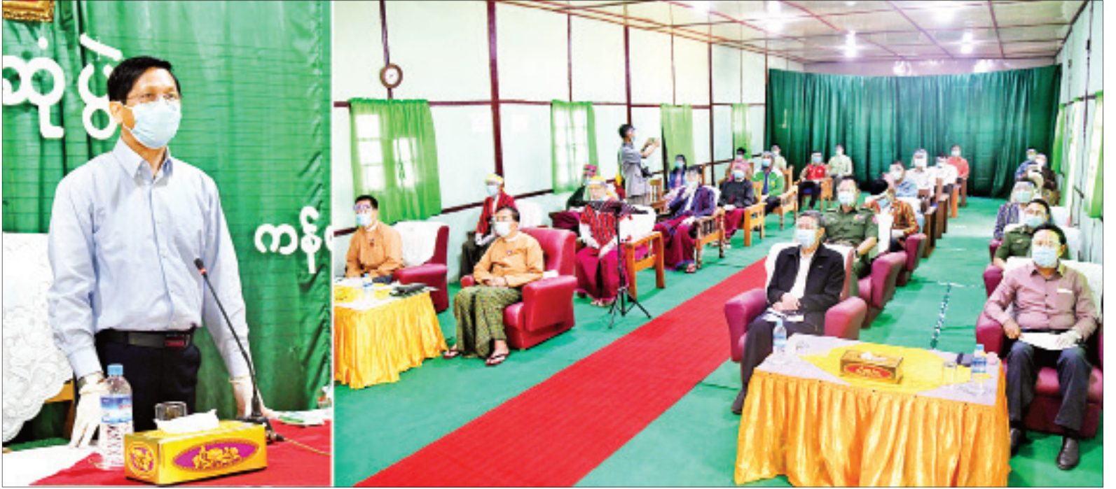
ဒုတိယသမ္မတ ဦးဟင်နရီဗန်ထီးယူ ကန်ပက်လက်မြို့၊ မြို့မိမြို့ဖများနှင့်တွေ့ဆုံပွဲတွင် အမှာစကားပြောကြားစဉ်။

မင်းတပ် စက်တင်ဘာ ၄ ဒုတိယသမ္မတ ဦးဟင်နရီဗန်ထီးယူ သည် ပြည်ထောင်စုဝန်ကြီး ဒေါက်တာ မျိုးသိမ်းကြီး၊ ဒုတိယဝန်ကြီးများ ဖြစ်ကြသည့် ဦးတင်မြင့်နှင့် ဗိုလ်ချုပ် စိုးတင်နိုင်၊ အမြဲတမ်းအတွင်းဝန် ဦးရဲနိုင်၊ ညွှန်ကြားရေးမှူးချုပ်များ၊ တာဝန်ရှိသူများနှင့်အတူ ယမန်နေ့က ကန်ပက်လက်မြို့နှင့် မင်းတပ်မြို့တို့ရှိ မြို့မိမြို့ဖများနှင့် တွေ့ဆုံပြီး ကန်ပက်လက်မြို့ ပြည်သူ့ဆေးရုံ နှစ်ထပ် တိုးချဲ့လှူဒါန်းဆောင် တည်ဆောက်နေမှုနှင့် မင်းတပ်မြို့ အစိုးရနည်းပညာအထက်တန်းကျောင်း စာသင်ဆောင် ဆောက်လုပ်နေမှုတို့ကို ကြည့်ရှုစစ်ဆေးသည်။ ဒုတိယသမ္မတ ဦးဟင်နရီဗန်ထီးယူ နှင့် အဖွဲ့သည် မွန်းလွဲပိုင်းတွင် နေပြည်တော်မှ ချင်းပြည်နယ် (တောင်ပိုင်း) ကန်ပက်လက်မြို့သို့ ရောက်ရှိကြပြီး ကန်ပက်လက်မြို့ စာမျက်နှာ ၄ ကော်လံ ၁ သို့