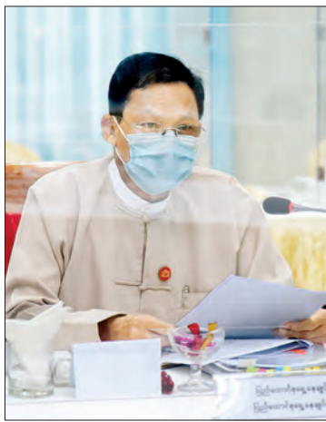
ပြည်ထောင်စုရှေ့နေချုပ် ဦးထွန်းထွန်းဦး