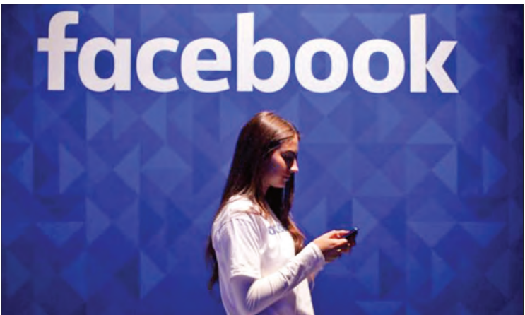
မီဒီယာကိုမဆို အခကြေးငွေ ပေးဆောင်ရန် သည့်အစီအစဉ်ကို ဒေသခံမီဒီယာများက ထောက်ခံကြောင်း သိရသည်။ ကိုးကား- ဘန်ကောက်ပို့စ် ဘာသာပြန်-စိုးသူရ

ကော်မရှင်အနေဖြင့် အရေးကြီးသော အချက် များကို လျစ်လျူရှုခဲ့သည်ဟု ၎င်းက ပြောကြားသည်။ ဖေ့စ်ဘွတ်အနေဖြင့် သတင်းရေးသား ဖြန့်ချိသူများထံမှ အကျိုး အမြတ်များစွာရရှိခဲ့သည်ဟု ကော်မရှင်မှ ယူဆခဲ့သော်လည်း ယူဆချက်မှာ ပြောင်းပြန် အခြေအနေဖြစ်ကြောင်း ၎င်းက ပြောကြား သည်။ အက်စတန်က ဖေ့စ်ဘွတ်အနေဖြင့် ဩစတြေးလျသတင်း ဝက်ဘ်ဆိုက်များအား ၂၀၂၀ ပြည့်နှစ် ပထမဇွန်လအတွင်း သတင်း အပုဒ်ပေါင်း ၂ ဒသမ ၃ ဘီလီယံပေးပို့ခဲ့ပြီး တန်ဖိုးအားဖြင့် ဩစတြေးလျဒေါ်လာ သန်း ၂၀၀ ခန့် တန်ကြေးရှိကြောင်း သိရသည်။ ဆိုရှယ်မီဒီယာများအား အခကြေးငွေ ပေးဆောင်ရန် ဥပဒေပြဋ္ဌာန်းခြင်းသည် ဆိုရှယ်မီဒီယာများဖြစ်သော ဖေ့စ်ဘွတ်နှင့် ဂူဂဲလ်တို့ကို ရည်ရွယ်ပြီး ဆောင်ရွက် ခဲ့ခြင်းဖြစ်သော်လည်း ယခုအခါ မည်သည့်