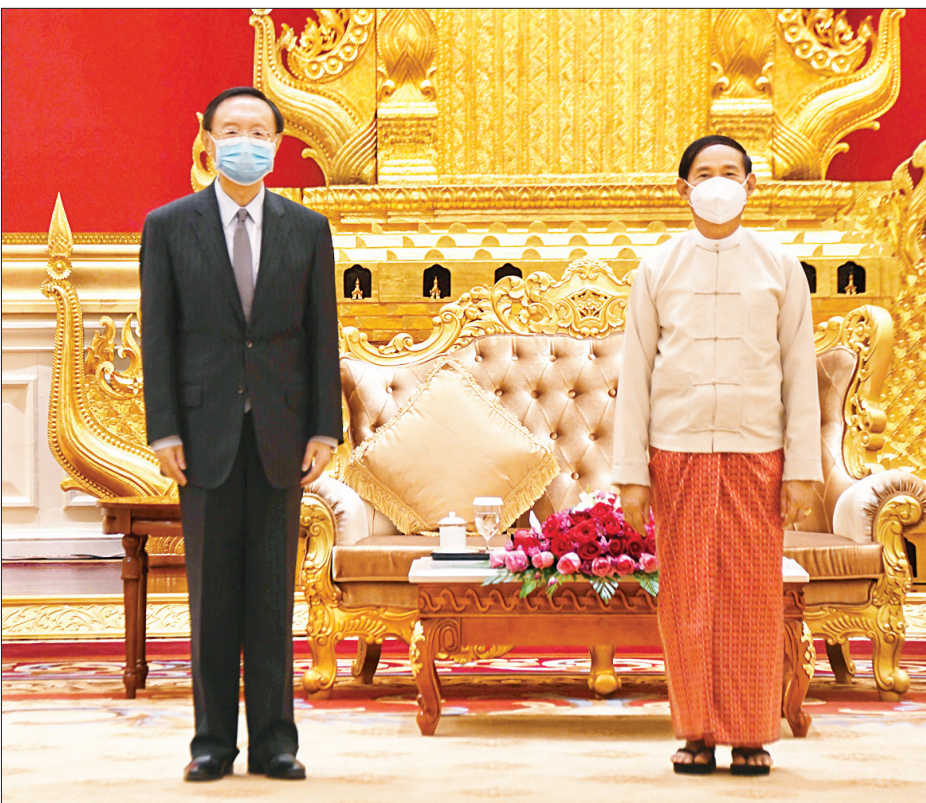
နိုင်ငံတော်သမ္မတ ဦးဝင်းမြင့် တရုတ်ပြည်သူ့သမ္မတနိုင်ငံ တရုတ်ကွန်မြူနစ်ပါတီ ဗဟိုကော်မတီ နိုင်ငံရေးဗျူရို အဖွဲ့ဝင် မစ္စတာ ရန်ကျဲချို အား လက်ခံတွေ့ဆုံစဉ်။

တရုတ်ပြည်သူ့သမ္မတနိုင်ငံ တရုတ်ကွန်မြူနစ်ပါတီ ဗဟိုကော်မတီ နိုင်ငံရေးဗျူရိုအဖွဲ့ဝင် မစ္စတာ ရန်ကျဲချို ဦးဆောင်သော ကိုယ်စားလှယ်အဖွဲ့အား လက်ခံတွေ့ဆုံ