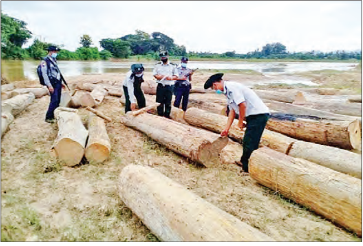
ကိုင်းချိုင်းခြင်း ၂၇၅ ဧက၊ စိုက်ခင်းဟောင်း ဖာထေးစိုက်ပျိုးခြင်း ၄၄၅ ဧက၊ သစ်မျိုးသန့် ဥယျာဉ်နှင့် သစ်စေ့ထုတ် ဧရိယာ တည်ထောင် ခြင်း ဧက ၁၂၀၊ လူထုဖြန့်ဖြူးပင် ဖြန့်ဝေစိုက်ပျိုး ခြင်း ၁၂၉၇၀၀ နှင့် ကြီးပိုင်း/ကြီးပြင် ကာကွယ်တောဖွဲ့စည်းခြင်း ၂၁ ဒဿမ ၈၇၇ စတုရန်းမိုင် စသည့် လုပ်ငန်းများကိုလည်း ၂၀၁၉-၂၀၂၀ ဘဏ္ဍာနှစ်အတွင်း ဆောင်ရွက် သွားမည်ဖြစ်ကြောင်း သိရသည်။

စက်လှေ ၁၄ စင်း၊ သစ်စက်အင်ဂျင် ၁၂၇ လုံး၊ ဆိုင်ကယ် ၄၆ စီး၊ ချိန်းဆော ၁၀ လက်နှင့် ပြစ်မှုကျူးလွန်သူ ၂၀၃ ဦး ဖမ်းဆီးနိုင်ခဲ့ကြောင်း သိရသည်။ ထို့အတူ မြန်မာနိုင်ငံသစ်တောများ ပြန်လည်တည်ထောင်ရေး (MRRP- Reforestation and Rehabilitation Program) စီမံကိန်းအရ ကသာခရိုင်အတွင်း ၂၀၁၈-၂၀၁၉ ဘဏ္ဍာနှစ်၌ စီးပွားရေး ကျွန်းစိုက်ခင်း ဧက ၁၃၅၀ တည်ထောင်စိုက်ပျိုးခဲ့ပြီး ၂၀၁၉-၂၀၂၀ ပြည့်နှစ် မိုးရာသီတွင် စီးပွားရေး ကျွန်းစိုက်ခင်း ဧက ၁၄၀၀ နှင့် ရေဝေရေလဲ စိုက်ခင်း ဧက ၁၀၀ စုစုပေါင်း ဧက ၁၅၀၀ တည်ထောင်ရန် အတွက် စိုက်ခင်းအကြံပြုလုပ်ငန်းများ ဆောင်ရွက် လျက်ရှိပြီး အခြား သစ်တောပြုစုထိန်းသိမ်းရေး လုပ်ငန်းများအနေဖြင့် ဓမ္မတာမျိုးဆက် ဆောင်ရွက်ပေးခြင်း ဧက ၅၆၅၀၊ သဘာဝတော တန်ဖိုးမြှင့် စိုက်ပျိုးခြင်း ဧက ၁၀၀၀၊ ဒေသခံ ပြည်သူ့အစုအဖွဲ့ပိုင် သစ်တောတည်ထောင် ခြင်း ၁၁၉၄၄ ဧက၊ သီးနှံရေးနေစိုက်ပျိုးခြင်း ဧက ၆၀၊ ပင်ကျပ်နတ်ခြင်း ၁၂၅၅ ဧက၊ ပင်ပူးခွာ