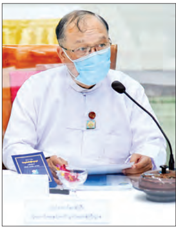
ပြည်ထောင်စုဝန်ကြီး ဦးသန့်စင်မောင်