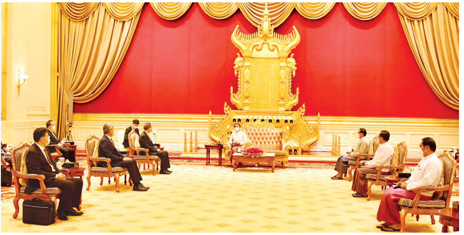
နိုင်ငံတော်သမ္မတ ဦးဝင်းမြင့် တရုတ်ပြည်သူ့သမ္မတနိုင်ငံ တရုတ်ကွန်မြူနစ်ပါတီ ဗဟိုကော်မတီ နိုင်ငံရေးဗျူရိုအဖွဲ့ဝင် မစ္စတာ ရန်ကျဲ့ချို ဦးဆောင်သော ကိုယ်စားလှယ်အဖွဲ့အား လက်ခံ တွေ့ဆုံစဉ်။

★ ရှေ့ဖိုးမှ သဘောတူညီချက်များကို အရှိန် အဟုန်မပျက် အကောင်အထည်ဖော် ရေး၊ ပြည်သူ့အချင်းချင်း ထိတွေ့ ဆက်ဆံမှု မြှင့်တင်ရန်အတွက် ယဉ်ကျေးမှုနှင့် ခရီးသွားလာရေးနှစ် ၂၀၂၀ ကို စနစ်တကျ နှစ်ဖက်ညှိနှိုင်း စီစဉ်ဆောင်ရွက်သွားရေး၊ ပြည်သူများ အကြား ပုံမှန်ကူးလူးဆက်ဆံမှု အမြန် ဆုံး အကောင်အထည်ဖော် သွားနိုင် ရေးနှင့် မြန်မာ-တရုတ် သံတမန် ဆက်ဆံရေး နှစ် (၇၀) ပြည့် အထိမ်း အမှတ် အခမ်းအနားများ ကျင်းပသွား နိုင်ရေး၊ မြန်မာနိုင်ငံ၌ နိုင်ငံတော် အတွင်း ကျင်းပမည့် ရွေးကောက်ပွဲ အောင်မြင်စွာ ကျင်းပသွားနိုင်ရေး ကိစ္စများကို ဆွေးနွေးကြသည်။ အမြင်ချင်းဖလှယ် ထို့ပြင် နှစ်နိုင်ငံအကြား ဒေသ တွင်းနှင့် နိုင်ငံတကာမျက်နှာစာတွင် ဆက်လက် နီးကပ်စွာ ပူးပေါင်းဆောင် ရွက်သွားရေး ကိစ္စရပ်များကို ရင်းနှီး ပွင့်လင်းစွာဆွေးနွေး အမြင်ချင်း ဖလှယ်ခဲ့ကြသည်။ တွေ့ဆုံပွဲသို့ နိုင်ငံတော် သမ္မတနှင့်အတူ ပြည်ထောင်စုဝန်ကြီး များဖြစ်ကြသည့် ဦးမင်းသူ၊ ဦးကျော်တင်နှင့် တာဝန်ရှိသူများ တက်ရောက်ကြပြီး တရုတ်ကွန်မြူနစ် ပါတီ ဗဟိုကော်မတီ နိုင်ငံရေးဗျူရို အဖွဲ့ဝင်နှင့်အတူ အဆင့်မြင့်အရာရှိ ကြီးများနှင့် မြန်မာနိုင်ငံဆိုင်ရာ တရုတ် သံအမတ်ကြီး မစ္စတာချန်ဟိုင်တို့ တက်ရောက်ကြသည်။ သတင်းစဉ်