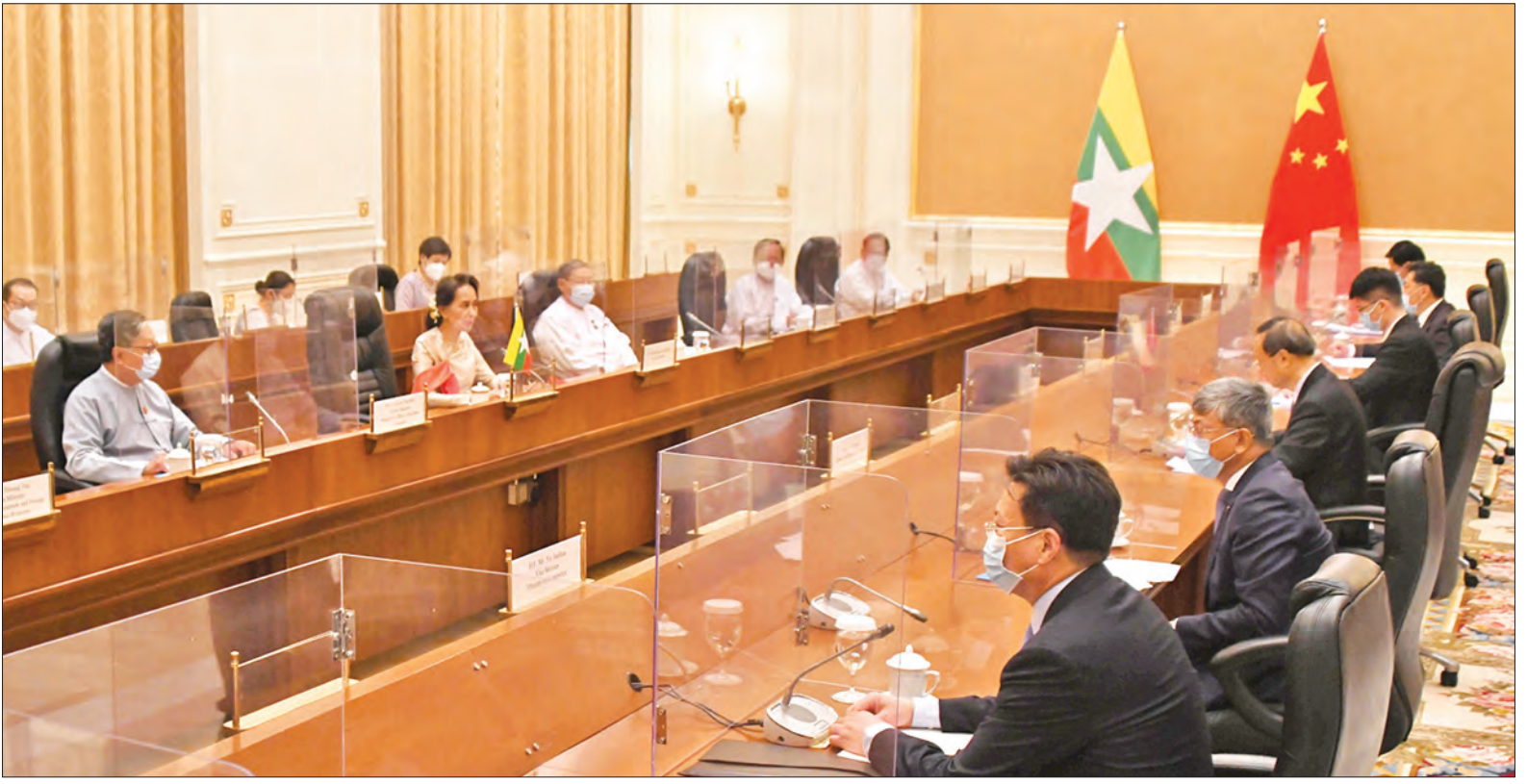
မြန်မာ-တရုတ် နှစ်နိုင်ငံဆွေးနွေးပွဲ ကျင်းပစဉ်။

နိုင်ငံတော်၏အတိုင်ပင်ခံပုဂ္ဂိုလ်မှ တွေ့ဆုံပွဲသို့ နိုင်ငံတော် အတိုင်ပင်ခံရုံး ဝန်ကြီးဌာန ပြည်ထောင်စုဝန်ကြီးဦးကျော်တင့်ဆွေ နှင့် မြန်မာနိုင်ငံဆိုင်ရာ တရုတ် သံအမတ်ကြီး မစ္စတာချန်းဟိုင်တို့ တက်ရောက်ကြသည်။ တွေ့ဆုံပွဲအပြီးတွင် မြန်မာ-တရုတ် နှစ်နိုင်ငံဆွေးနွေးပွဲကို ဆက်လက် ကျင်းပရာ နိုင်ငံတော်၏အတိုင်ပင်ခံ ပုဂ္ဂိုလ် ဒေါ်အောင်ဆန်းစုကြည်နှင့် တရုတ်ပြည်သူ့သမ္မတနိုင်ငံ တရုတ် ကွန်မြူနစ်ပါတီ၊ ဗဟိုကော်မတီ နိုင်ငံရေးဗျူရိုအဖွဲ့ဝင် မစ္စတာ ရန်ကျေချို တို့ တက်ရောက်ဆွေးနွေးကြသည်။