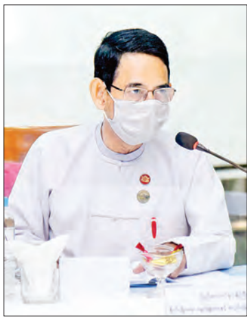
ပြည်ထောင်စုဝန်ကြီး ဒေါက်တာအောင်သူ