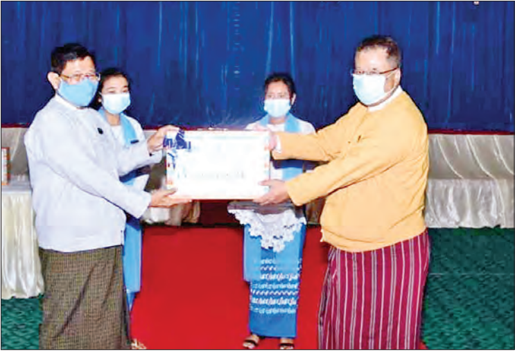
ယင်းနောက် ပြည်နယ်ဝန်ကြီးချုပ်နှင့် မသန်စွမ်းသူများအား လက်ဝယ်အရောက် ဇနီး၊ တာဝန်ရှိသူတို့က တောင်ကြီးမြို့ပေါ် ထောက်ပံ့ပေးအပ်ခဲ့ကြောင်း သိရသည်။ ရပ်ကွက် ၂၂ ရပ်ကွက်မှ တက်ရောက်လာသော ခရိုင်(ပြန်/ဆက်)

၃၃၉၇ ဒသမ ၅ သိန်း၊ ရှမ်းပြည်နယ် အတွင်းရှိ စေတနာ့ဝန်ထမ်းအဖွဲ့အစည်း ၄၆ ခုအတွက် ငွေကျပ် ၅၇၃ ဒသမ ၅၅ သိန်း၊ အသက် ၈၅ နှစ်အထက် ဘိုးဘွားများ လူမှုရေးပင်စင် ၁၀၅၀၅ ဦးအတွက် တစ်ဦးလျှင် ငွေကျပ် ၃၀၀၀ နှုန်းဖြင့် ငွေကျပ် ၃၁၅၂၅ ဒသမ ၇ သိန်း၊ အသက်(၈၀-၈၅)နှစ် ဘိုးဘွားများ လူမှုရေးပင်စင် ၁၄၄၇၆ ဦးအတွက် တစ်ဦး လျှင် ငွေကျပ် ၃၀၀၀ နှုန်းဖြင့် ငွေကျပ် ၄၃၄၂၅ ဒသမ ၈ သိန်းတို့ကို ရှမ်းပြည်နယ် ဝန်ကြီးချုပ် က ပေးအပ်ရာ ဗမာတိုင်းရင်းသား လူမျိုး ရေးရာဝန်ကြီး ဒေါက်တာအောင်သန်းမောင် က လက်ခံရယူသည်။