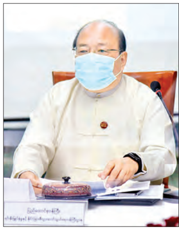
ပြည်ထောင်စုဝန်ကြီး ဦးသောင်းထွန်း