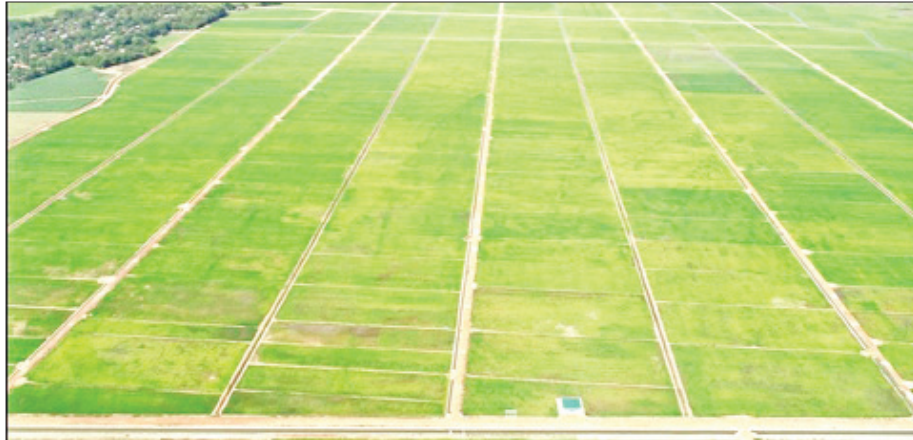
လယ်ဝေးမြို့နယ် ပေါက်မြိုင်စနစ်ကျလယ်ယာမြေဖော်ထုတ်ခြင်းလုပ်ငန်း ဆောင်ရွက်ထားစဉ်။

ကမ္ဘာ့ဘဏ် ချေးငွေဖြင့် ဆောင်ရွက်လျက်ရှိသည့် ပဲခူး တိုင်းဒေသကြီး၊ မန္တလေး တိုင်းဒေသကြီး၊ စစ်ကိုင်းတိုင်း ဒေသကြီးနှင့် နေပြည်တော် ကောင်စီနယ်မြေတို့ရှိ ဆွာ ချောင်း၊ ဘောနီ၊ သဲကော၊ မာလဲနတ်တောင်၊ မြောက် ယမား၊ ဆင်သေ၊ ငလိုက် ရေလျှောင့်တမံ များ၏ ဘေးကင်းလုံခြုံမှု တည်နေရာ ပြုပြင်မှုများကို ကမ္ဘာ့ဘဏ်၏ အတိုင်ပင်ခံ အဖွဲ့ဖြစ်သော KRC အဖွဲ့နှင့် ပူးပေါင်း ရေးဆွဲ ဆောင်ရွက်လျက် ရှိ