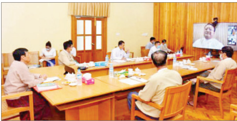
သမဝါယမဦးစီးဌာန ဦးစီးမှူးများ၊ အသင်းစုချုပ်ဥက္ကဋ္ဌများ ဗဟိုသမဝါယမအသင်းအနေဖြင့် အပြည်ပြည်ဆိုင်ရာ သမဝါယမအဖွဲ့ချုပ်သို့ ၁၉၉၃ ခုနှစ်တွင် ဝင်ရောက်ခဲ့ပြီး ပါဝင်ဆွေးနွေးကြသည်။