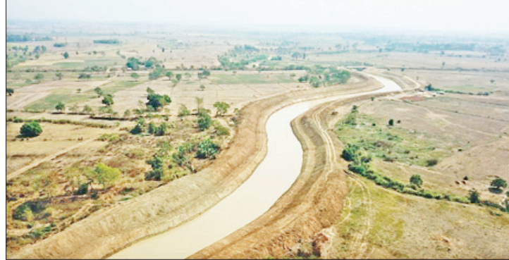
ပဲခူးတိုင်းဒေသကြီး ချိန်းချောင်းပြန်လည်တူးဖော်ခြင်းလုပ်ငန်း ဆောင်ရွက်ထားစဉ်။

များ အသုံးပြုဆောင်ရွက်ခဲ့ကာ ယခုမိုးရာသီ ကာလ တစ်လျှောက်လုံးမှာလည်း ၂၄ နာရီ ကင်းလှည့် စောင့်ကြည့်ထိန်းသိမ်းသည့် လုပ်ငန်းများကိုပါ ဆောင်ရွက်လျက်ရှိသည်။ ထို့အပြင် တည်ဆောက်ထိန်းသိမ်း ထားသော ရေလျှောင့်တမံများ၏ ဘေးကင်း လုံခြုံမှု (Dam Safety) နှင့်ပတ်သက်၍ ဆည်မြောင်းနှင့် ရေအသုံးချမှုစီမံခန့်ခွဲရေး ဦးစီးဌာနအနေဖြင့် အထူးအလေးပေး ဆောင်ရွက်လျက်ရှိသည်။ နေ့စဉ်ပုံမှန် စစ်ဆေးခြင်း (Visual Inspection Report on Dam Surveillance) အစီရင်ခံစာပါ လုပ်ငန်းစဉ်များအတိုင်း ပုံမှန်စောင့်ကြည့် လျက်ရှိပြီး တစ်စစ်ဆေးရေးအဖွဲ့ လေးဖွဲ့ ဖွဲ့စည်း၍ နိုင်ငံအဝှမ်းရှိ ရေလျှောင့်တမံများ အားလုံးကို အသေးစိတ်ကွင်းဆင်းစစ်ဆေး ခဲ့ကြသည်။ စာမျက်နှာ ၇ သို့ ❖