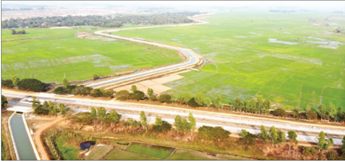
ဆွာရေသောက်စနစ်အဆင့်မြှင့်တင်ပြုပြင်ခြင်းလုပ်ငန်းများ ဆောင်ရွက်ထားစဉ်။

တစ်နိုင်လုံးအတိုင်းအတာဖြင့် ဖွဲ့စည်း ဆောင်ရွက်လျက်ရှိကြောင်း ဆည်မြောင်းနှင့် ရေအသုံးချမှုစီမံခန့်ခွဲရေးဦးစီးဌာနမှ သိရ သည်။ “အခု ၂၀၂၀ ပြည့်နှစ် ဩဂုတ်လအထိ WUG အဖွဲ့ပေါင်း ၇၉၀၆ ဖွဲ့နဲ့ အဖွဲ့ဝင် တောင်သူဦးရေပေါင်း ၂၂၇၉၈ ဦးကို နေပြည်တော်အပါအဝင် တိုင်းဒေသကြီးနဲ့ ပြည်နယ်တွေမှာ ဖွဲ့စည်းပြီး ဖြစ်ပါတယ်။ ကျွန်တော်တို့ အဓိကဦးတည်တာကတော့ ပူးပေါင်းပါဝင် ဆည်မြောင်းစနစ်ကိုအခြေခံ ပြီး ရေစီမံခန့်ခွဲမှု ပိုမိုစနစ်တကျရှိအောင် ဆောင်ရွက်ခြင်းပဲ ဖြစ်ပါတယ်” ဟု ညွှန်ကြား ရေးမှူးချုပ်က ပြောပြသည်။ ယခုနှစ်မိုးရာသီအတွင်း ဆည်မြောင်းနှင့်