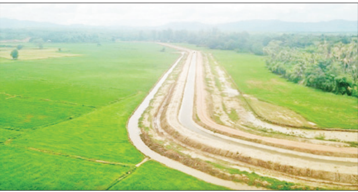
ဘော်ဘင်ရေသောက်စနစ်အဆင့်မြှင့်တင်ပြုပြင်ခြင်းလုပ်ငန်းများ ဆောင်ရွက်ထားစဉ်။

ထို့အပြင် ကမ္ဘာ့ဘဏ်မှ ကျွမ်းကျင် ပညာရှင်များနှင့် Dam Safety Management အလုပ်ရုံဆွေးနွေးပြုလုပ်ကာ ရရှိလာသည့် နည်းပညာဆိုင်ရာ ဗဟုသုတများကို အခြေခံ၍ ရေလျှော့တံခံတွင် သဘာဝဘေးအန္တရာယ်တစ်ရပ်ရပ်ကြောင့် ကျိုးပေါက်မှု မဖြစ်ပေါ်စေရေးနှင့် အရေးပေါ်အခြေအနေ တစ်ရပ်ဖြစ်ပေါ်လာပါက တစ်ဆင့်အောက်ဘက်ရှိ ပြည်သူများ၏ အသက်အိုးအိမ်စည်းစိမ်များ ထိခိုက်ပျက်စီးမှု လျော့ပါးသက်သာစေရေး အတွက် ဒေသဆိုင်ရာ အုပ်ချုပ်ရေးအဖွဲ့အစည်းများ၊ ဆက်စပ်ဌာနဆိုင်ရာများနှင့် ပူးပေါင်း၍ ကြိုတင်စီမံခန့်ခွဲ ဆောင်ရွက်နိုင်ရန် ရေလျှော့တံခံတစ်ခုချင်းအလိုက် အရေးပေါ်အခြေအနေ ကြိုတင်စီမံခန့်ခွဲမှု စီမံချက် (Emergency Preparedness Plan-EPPP) များ စနစ်တကျရေးဆွဲဆောင်ရွက်လျက် ရှိကြောင်း အဆိုပါဦးစီးဌာနမှ သိရသည်။ “ကျွန်တော်တို့ဦးစီးဌာနကတည်ဆောက် ထိန်းသိမ်းထားရှိပြီးဖြစ်တဲ့ ရေလျှော့တံခံ အရေအတွက်ပေါင်း ၂၃၅ ခု ရှိပါတယ်။ အများစုဟာ မြေသားရေလျှော့တံခံတွေ ဖြစ်သလို တည်ဆောက်ပြီးကာလမှာ နှစ် ၂၀ ကျော်တွေ များပါတယ်။ ဒါကြောင့်မို့ ရေလျှော့တံခံတွေ ဘေးကင်းလုံခြုံမှု (Dam Safety) နဲ့ပတ်သက်ပြီး ဦးစားပေးအဆင့် ထား ဆောင်ရွက်လျက်ရှိပါတယ်။ အခုလို မိုးရာသီကာလမှာ အထူးဂရုစိုက်ပြီး