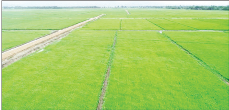
လယ်ဝေးမြို့နယ် ပျံချီစနစ်ကျလယ်ယာမြေဖော်ထုတ်ခြင်းလုပ်ငန်း ဆောင်ရွက်ထားစဉ်။