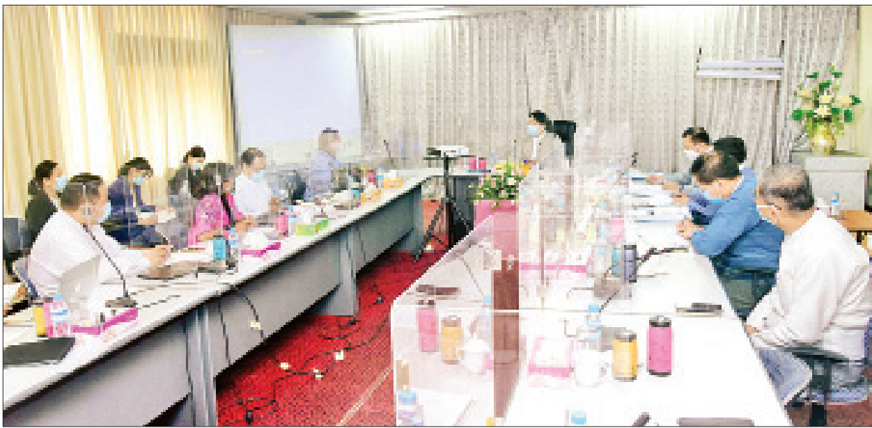
ပြည်ထောင်စုဝန်ကြီး ဒေါက်တာဖေမြင့် Myanmar International (MITV Channel) ဖွံ့ဖြိုးတိုးတက်ရေးအစည်းအဝေးတွင် ဆွေးနွေးမှာကြားစဉ်။

ထိုသို့ တင်ပြချက်များအပေါ် ပြည်ထောင်စုဝန်ကြီးက လတ်တလော တိုးတက်ပြောင်းလဲဆောင်ရွက်နိုင်မည့် အစီအစဉ်များကို မြန်မြန်ဆန်ဆန် ညှိနှိုင်းပူးပေါင်းဆောင်ရွက်ရန်၊ ရေရှည်ဆောင်ရွက်လိုသည့် အစီအစဉ်များကို နှစ်ဖက်ညှိနှိုင်းဆွေးနွေးပြီး ပြုစုတင်ပြရန်၊ ၂၀၂၀ ပြည့်နှစ် ပါတီစုံဒီမိုကရေစီ အထွေထွေရွေးကောက်ပွဲနှင့်ပတ်သက်၍ ပွင့်လင်းမြင်သာစွာဖြင့် စနစ်တကျ စီစဉ်ဆောင်ရွက်နေမှု၊ ကိုဗစ်-၁၉ ကပ်ရောဂါနှင့်ပတ်သက်၍ အလေးထားပြီး