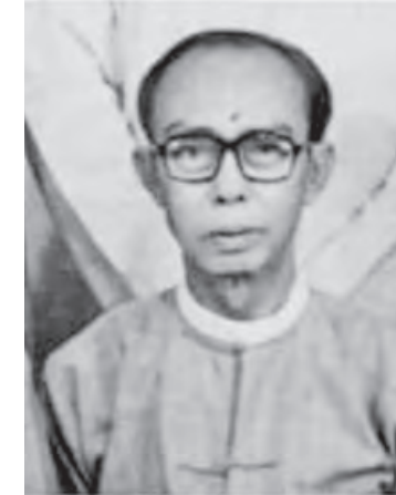
ရန်နိုင်စိန်