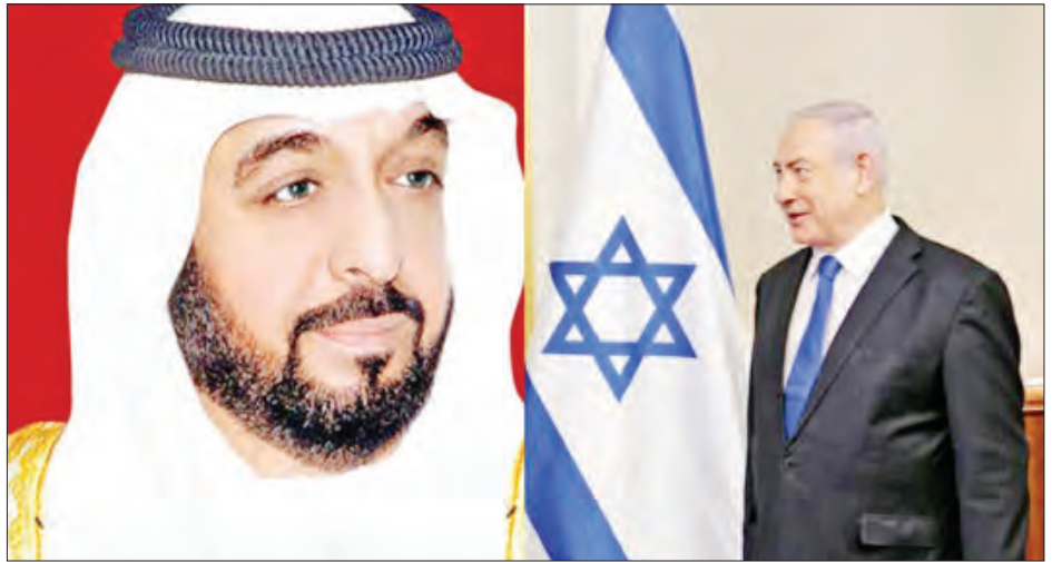
ယူအေအီးနိုင်ငံအကြီးအကဲ ရှိတ်ခါလီဖာဆင်းဇိုက် အယ်လ်နက်ယန်နှင့် အစ္စရေးဝန်ကြီးချုပ် နေတန်ယာဟု