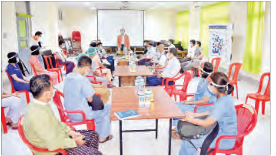
ပြည်နယ်ဝန်ကြီးချုပ်နှင့်အဖွဲ့သည် အဆိုပါအသွားအလာ လူငယ်များနှင့်တွေ့ဆုံကာ လိုအပ်ချက်များကို တာဝန်ရှိသူကန်သတ်စောင့်ကြည့်နေရာများတွင် ပူးပေါင်းပါဝင်ကူညီဆောင်ရွက်ပေးနေကြသည့် နိုင်ငံအနှံ့မှ စေတနာ့ဝန်ထမ်းများနှင့် ပေါင်းစပ်ဆောင်ရွက်ပေးခဲ့ကြောင်း သိရသည်။ တင်ထွန်း(ပြန်/ဆက်)

တွေ့ဆုံသည်။ တွေ့ဆုံစဉ် ပြည်နယ်ဝန်ကြီးချုပ်က ရခိုင်ပြည်နယ်၏ ကိုဗစ် - ၁၉ ရောဂါ ကာကွယ်၊ ထိန်းချုပ်၊ ကုသရေးလုပ်ငန်းများတွင် တာဝန်အရမဟုတ်ဘဲ မိမိတို့၏ စေတနာမေတ္တာများဖြင့် လာရောက်ကူညီဆောင်ရွက်ပေးကြသည့်အတွက် အထူးပင်ကျေးဇူးတင်ပါကြောင်း၊ မိမိတို့အစိုးရအဖွဲ့အနေဖြင့် တတ်နိုင်သလောက် ပိုင်းဝန်းပူးပေါင်းဆောင်ရွက်သွားမည်ဖြစ်ကြောင်း၊ နေထိုင်စားသောက်ရေးနှင့် ဆေးဝါးများအတွက်လည်း ကူညီဖြည့်ဆည်းပေးသွားမည်ဖြစ်ကြောင်း၊ ယခုကဲ့သို့ အင်အားအပြည့်ဖြင့် လာရောက်ဆောင်ရွက်ပေးကြသည့်အတွက် မိမိတို့အတွက် စိတ်အား၊ ခွန်အားများဖြစ်ပါကြောင်း၊ ကျေးဇူးလည်း များစွာတင်ပါကြောင်း ပြောကြားပြီး “မိမိဆန္ဒအလျောက်” ယာယီတာဝန်ထမ်းဆောင်မည့် ဆရာဝန်နှင့် သူနာပြုများအတွက် ထောက်ပံ့ငွေကျပ် ၄၅ သိန်းအား ပေးအပ်သည်။ ထို့နောက် ပြည်နယ်ဝန်ကြီးချုပ်နှင့်အဖွဲ့သည် စစ်တွေတက္ကသိုလ်(ဘုမေ)၌ ကိုဗစ်-၁၉ ပိုးတွေ့လူနာများအတွက် သီးသန့်လူနာဆောင်များပြုလုပ်မည့် အဆောင်များနှင့် အသွားအလာကန့်သတ် စောင့်ကြည့်သူများထားရှိရာ အဆောင်များသို့ သွားရောက်ကြည့်ရှုစစ်ဆေးသည်။