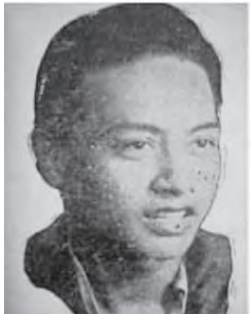
ခင်မောင်မြင့်