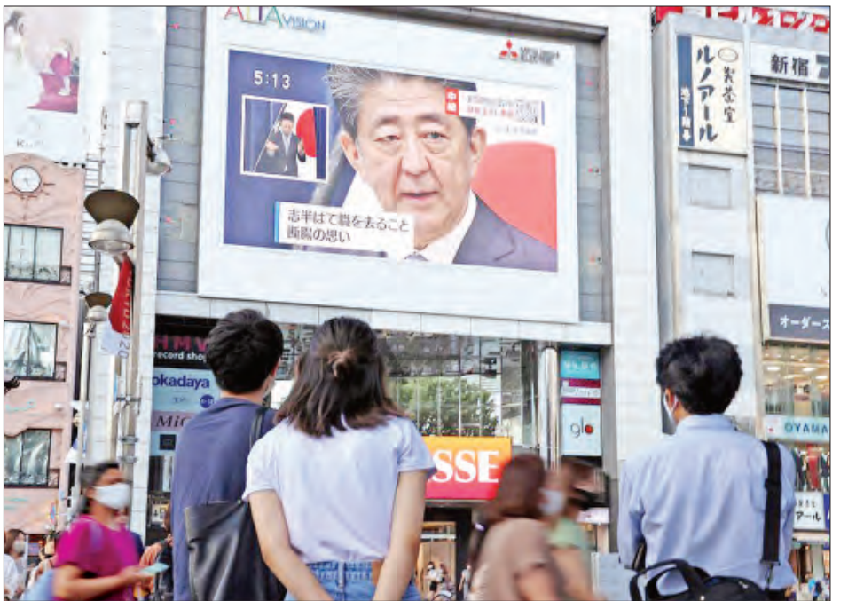
အဖွဲ့မှ အဆင့်မြင့်တာဝန်ရှိသူတစ်ဦးက ဆိုသည်။ အမေရိကန်နှင့်ဂျပန် နှစ်နိုင်ငံဆက်ဆံရေးသည် သမ္မတထရမ်နှင့် ဝန်ကြီးချုပ် အာဘေးတို့၏ ရင်းနှီးကျွမ်းဝင်မှုများကြောင့် ပိုမိုကောင်းမွန်လာခဲ့ကြောင်း ၎င်းက ဆက်လက်ပြောကြားခဲ့သည်။ ထို့ပြင် နှစ်နိုင်ငံဆက်ဆံရေးကို ဆက်လက်ထိန်းသိမ်းစောင့်ရှောက်သွားမည်ဖြစ်ပြီး နောင်လာမည့်အနာဂတ်ခေါင်းဆောင်အသစ်နှင့်အတူ နှစ်နိုင်ငံအကျိုးစီးပွားဖြစ်ထွန်းစေရေးအတွက် ပူးပေါင်းဆောင်ရွက်ရန် မျှော်လင့်လျက်ရှိကြောင်း ၎င်းက ပြောကြားခဲ့သည်။ ကိုးကား-အင်န်အိတ်ချ်ကော့ဘာသာပြန်-အောင်ကျော်ကျော်

ဂျပန်ဝန်ကြီးချုပ် အာဘေး၏ ဂျပန်နိုင်ငံနှင့် လူမျိုးအကျိုးအတွက် ဆောင်ရွက်ခဲ့သည့် ထူးချွန်ပြောင်မြောက်သော စွမ်းဆောင်မှုများအတွက် ချီးကျူးထောက်ခံပြုပါကြောင်း အမေရိကန်သမ္မတ ထရမ်က ဦးဆောင်သော အစိုးရ