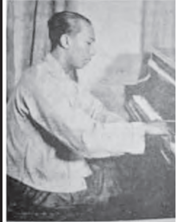
တက္ကသိုလ်စိုး

ချုပ်ပေး၊ မင်းသားအဝတ်အစား။ ကြည်စိုးထွန်း။ ။ ဩော်။ မင်းသားကြီးမြင့်စိုး။ ။ ကွင်းတက်က အဝတ် အစားချုပ်ပေးဆိုတော့ ချုပ်ပေးမယ် ငွေတစ်ထောင်ထုတ်ပေးတယ် ဟိုတုန်းက။ ကြည်စိုးထွန်း။ ။ မနည်းဘူးပဲပေါ့ တစ် ထောင်ဆိုတာ။ မင်းသားကြီးမြင့်စိုး။ ။ ဟုတ်ကဲ့ နည်းတာ