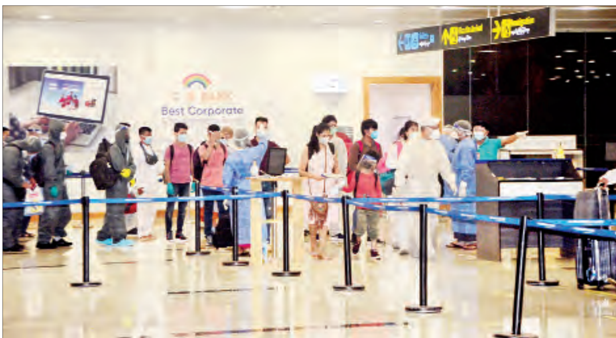
အိန္ဒိယနိုင်ငံမှ ပြန်လည်ရောက်ရှိလာသည့် မြန်မာနိုင်ငံသားများအား ရန်ကုန်အပြည်ပြည်ဆိုင်ရာလေဆိပ်၌ တွေ့ရစဉ်။

နိုင်ငံခြားရေးဝန်ကြီးဌာန နေပြည်တော် ၂၀၂၀ ပြည့်နှစ်၊ ဩဂုတ်လ ၂၉ ရက်