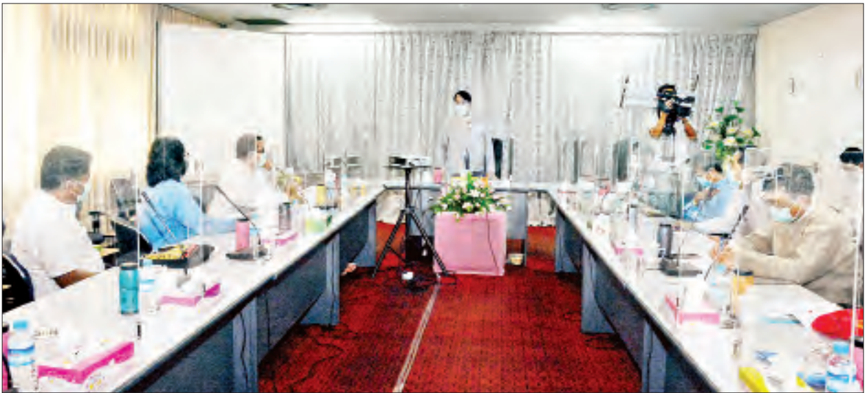
ပြည်ထောင်စုဝန်ကြီး ဒေါက်တာဖေမြင့် သရုပ်ဖော်ဒီဇိုင်းနှင့် ဆက်စပ်လုပ်ငန်းများမှ တာဝန်ရှိသူများနှင့် တွေ့ဆုံဆွေးနွေးစဉ်။

ရန်ကုန် ဩဂုတ် ၂၉ ပြန်ကြားရေးဝန်ကြီးဌာန ပြည်ထောင်စုဝန်ကြီး ဒေါက်တာဖေမြင့်သည် ယနေ့တွင် ရန်ကုန်မြို့၊ ပြည်လမ်းရှိ မြန်မာအသံနှင့် ရုပ်မြင်သံကြား၌ ကျင်းပသည့် မြန်မာနိုင်ငံ ကာတွန်းဆရာများအသင်းမှ ကာတွန်းပညာရှင်များ၊ သရုပ်ဖော်ဒီဇိုင်းနှင့် ဆက်စပ်လုပ်ငန်းများမှ တာဝန်ရှိသူများနှင့် တွေ့ဆုံဆွေးနွေးသည်။