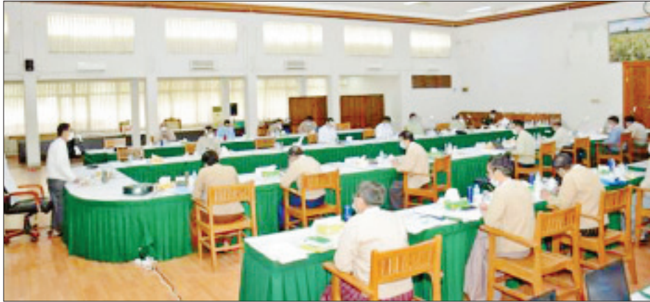
ရမည့်အကြောင်းအရာများအလိုက်တင်ပြရာ အစည်းအဝေး တက်ရောက်လာကြသူများက ကဏ္ဍအလိုက် ဆွေးနွေးခဲ့ကြသည်။

နေပြည်တော် ဩဂုတ် ၂၆ မြေလွတ်၊ မြေလပ်နှင့် မြေရိုင်းများ စီမံခန့်ခွဲရေးဗဟိုကော်မတီ၏ (၂၉)ကြိမ်မြောက် လုပ်ငန်းညှိနှိုင်းအစည်းအဝေးကို ယနေ့နံနက်ပိုင်းတွင် စိုက်ပျိုးရေး၊ မွေးမြူရေးနှင့် ဆည်မြောင်းဝန်ကြီးဌာန ပြည်ထောင်စုဝန်ကြီးရုံး အစည်းအဝေးခန်းမ၌ ကျင်းပသည်။