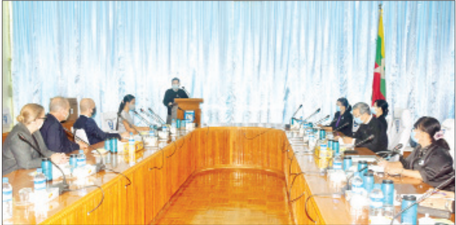
နှင့် ပြည်နယ်ဥပဒေချုပ်ရုံးများသို့ ထောက်ပံ့ပေးအပ်သည့် အတွက်လည်း ကျေးဇူးတင်ရှိပါကြောင်း ပြောကြားသည်။ အခမ်းအနားတွင် အမေရိကန်သံရုံးမှ ပြည်ထောင်စု ရှေ့နေချုပ်ရုံးသို့ အမေရိကန်ဒေါ်လာ သုံးသောင်းခန့်တန်ဖိုး

တိုးတက်ရေးအတွက် အထောက်အပံ့ဖြစ်ပါကြောင်း၊ အထူးသဖြင့် ကိုဗစ်-၁၉ ကူးစက်ရောဂါ ထိန်းချုပ်ကာလ အတွင်း ပြည်ထောင်စုရှေ့နေချုပ်ရုံး၏ လုပ်ငန်းများနှင့် ဥပဒေအရာရှိများ အရည်အသွေး မြှင့်တင်ရေးအတွက် အလွန်အသုံးဝင်ပါကြောင်း၊ ယင်းပစ္စည်းများသည် ကိုဗစ်-၁၉ အလွန်ကာလတွင်လည်း ဥပဒေအရာရှိများ အရည်အသွေးမြှင့်တင်ရာတွင် အထောက်အကူပြုပေးနိုင်စွမ်းကို အထောက်အကူပြုပါကြောင်း၊ ဥပဒေအရာရှိများ၏ အရည်အသွေးမြှင့်တင်ရေးတွင် နည်းပညာဆိုင်ရာ အထောက်အပံ့များသာမက ယခုကဲ့သို့ ရုပ်ပိုင်းဆိုင်ရာ အထောက်အပံ့များအား အမေရိကန်သံရုံးမှ ထောက်ပံ့ပေးသည့်အတွက် ကျေးဇူးတင်ရှိပါကြောင်း၊ အဆိုပါပစ္စည်းများကို နေပြည်တော်အပြင် တောင်ကြီး၊ လွိုင်ကော်၊ မကွေး၊ ဟားခါး၊ ဘားအံ၊ ထားဝယ်၊ စစ်တွေ စသောမြို့များရှိ တိုင်းဒေသကြီး