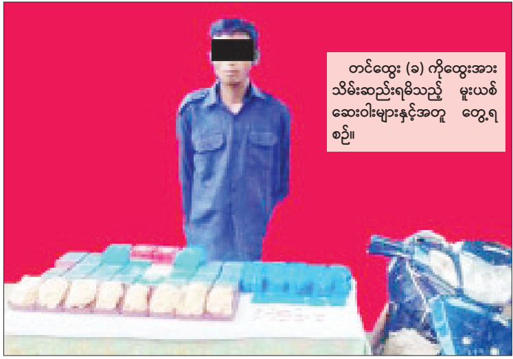
စိတ်ကြွဆေးပြား ၁၀၀၀၀ နှင့် လက်ကိုင်ဖုန်း စေသော ဆေးဝါးများဆိုင်ရာ ဥပဒေအရ နှစ်လုံးတို့ကို သိမ်းဆည်းရမိခဲ့သဖြင့် ၎င်းတို့ အရေးယူထားကြောင်း သိရသည်။ အား မူးယစ်ဆေးဝါးနှင့် စိတ်ကိုပြောင်းလဲ ရဲပြန်ကြား

အလားတူ ယင်းနေ့ မွန်းလွဲ ၂ နာရီခွဲ တွင် မူးယစ်ဆေးဝါးတားဆီးနှိမ်နင်းရေးရဲတပ်ဖွဲ့ မှ တပ်ဖွဲ့ဝင်များသည် တာချိုလိတ်မြို့နယ် လွယ်တော်ခမ်းကျေးရွာအုပ်စု မိုင်းဆတ်- ဟော့ရဲသွား ကားလမ်းတွင် အညီးမောင်းနှင် လာသည့်ဆိုင်ကယ်နှင့် မနာဟ် မောင်းနှင် လာသည့် ဆိုင်ကယ်တို့အား ရှာဖွေရာ