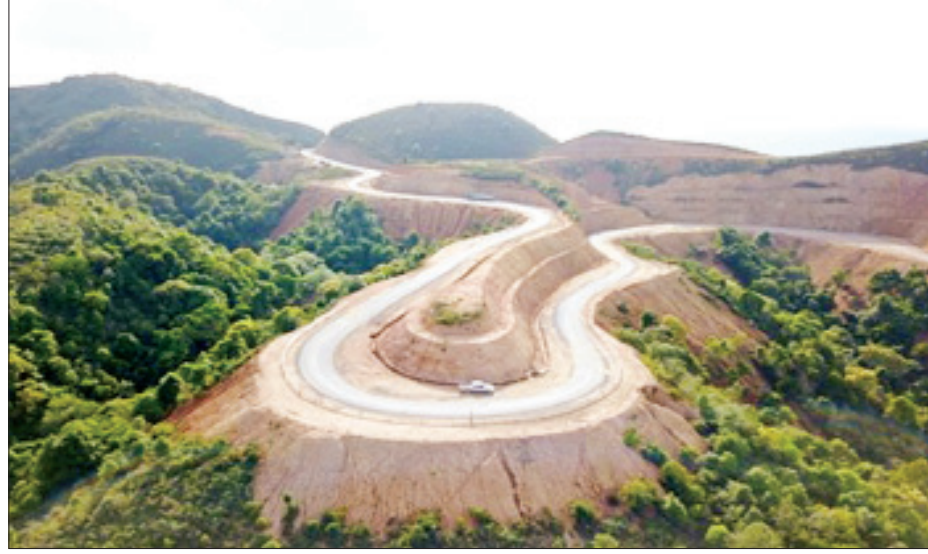
မိတ္ထီလာ-တောင်ကြီး-ကျိုင်းတုံ-တာချီလိတ်လမ်း

နိုင်ငံတကာ အကူအညီ အထောက်အပံ့တွေ ရလာတယ်။ ဌာနပိုင်စက်သာမက ပြင်ပပုဂ္ဂလိကပိုင် စက်တွေ ငှားရမ်းအသုံးပြုလို့ရလာတယ်။ လမ်းခင်းရာမှာသုံးတဲ့ စက်ကိရိယာတွေက နဂိုထက်ပိုပြီး ပြည့်စုံလာတယ်။ ဌာနအနေနဲ့လည်း ဘတ်ဂျက်ကနေထည့်ပြီး ဝယ်ယူပါတယ်။ အားလုံးမြှင့်တဲ့အတိုင်း ယေဘုယျအားဖြင့်တော့ လမ်းတွေက ပိုကောင်းလာတယ်။ မြန်မြန်ဆန်ဆန် သွားလာနိုင်ပြီ။ တော်တော်