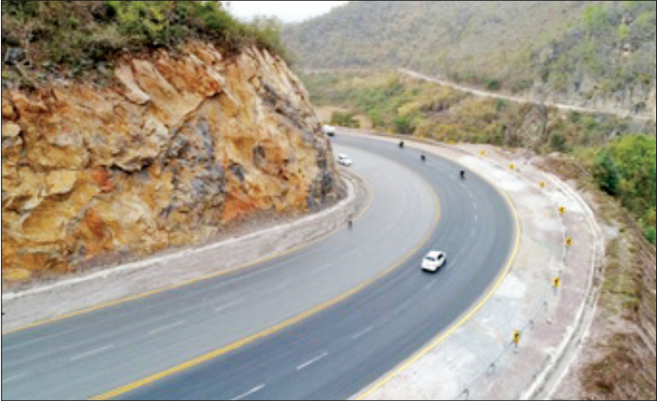
မန္တလေး-လားရှိုး-ဗန်းမော်-မြစ်ကြီးနားလမ်း။

အလေးချိန် Standard axle Load (၁၀)တန်နဲ့ ဒီဇိုင်းပြုလုပ် သတ်မှတ်ထားတာပါ။ ဒါကြောင့် ကားတွေမှာ သတ်မှတ် axle Load ထက် ပိုမတင်ဖို့ကလည်း အရေးကြီးပါတယ်။ ဂိတ် တွေမှာ အလေးချိန်စစ်ဆေးတာတွေရှိပါတယ်။ ဒါပေမဲ့ ကုန်ကို အရင်ကွဲထားပြီး ဂိတ် ကျော်ပြီးရင် သတ်မှတ်တန်ချိန်ကို ပိုတင်တာ မျိုးတွေရှိပါတယ်။ ဒါတွေကို အသိနဲ့ရှောင်ဖို့ လိုပါတယ်။ လမ်းဦးစီးဌာနကလည်း သက်ဆိုင် ရာ အာဏာပိုင်အဖွဲ့အစည်း၊ ဌာနတွေနဲ့ ပူးပေါင်းဆောင်ရွက် စစ်ဆေးအရေးယူမှုတွေ ဆောင်ရွက်နေပါတယ်။ ပြီးတော့ လမ်းနယ် မကျူးကျော်ဖို့ပါ။ လမ်းနယ်ဆိုတာ လမ်းပြင် ဆင်ထိန်းသိမ်းခြင်း ဆောင်ရွက်တဲ့အခါ