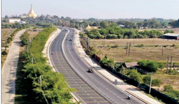
သန်လျင်-သီလဝါလမ်းမကြီး

ယခုအစိုးရလက်ထက် ၂၀၁၆ ခုနှစ်မှ ၂၀၂၀ ပြည့်နှစ်အတွင်း ကတ္တရာ ကွန်ကရစ်လမ်း ၁၉၀၁ မိုင် ၇ ဖာလုံ၊ ကွန်ကရစ်လမ်း ၁၀၄၅ မိုင် ၃ ဖာလုံ၊ ကတ္တရာလမ်း ၂၀၉ မိုင် ၄ ဖာလုံဆောင်ရွက်ခဲ့