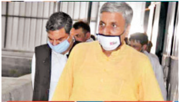
ကြောင်း၊ ထို့အတူ တစ်ရက်အတွင်း ကိုဗစ်-၁၉ ရောဂါကြောင့် ၁၀၅၉ ဦး ထပ်မံ သေဆုံးခဲ့ရာ အဆိုပါ ရောဂါကြောင့် သေဆုံးသူပေါင်း ၅၉၄၄၉ ဦးရှိလာကြောင်း သိရသည်။

အိန္ဒိယနိုင်ငံ၌ ကိုဗစ်-၁၉ ရောဂါ ကူးစက်ခံရသူ ၆၇၁၅၁ ဦး ယနေ့ စမ်းသပ် တွေ့ရှိခဲ့ရာ လက်ရှိအချိန်အထိ ရောဂါကူးစက်ခံရသူပေါင်း ၃၂၄၄၇၄ ဦး ရှိလာ