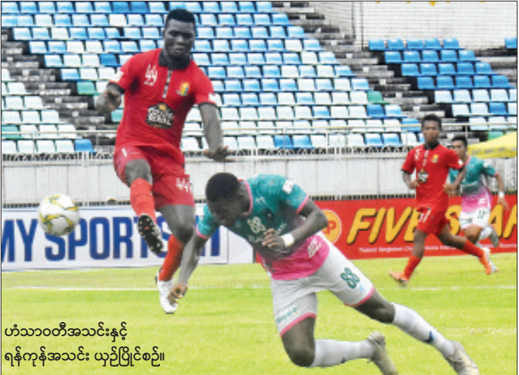
ဟံသာဝတီအသင်းနှင့် ရန်ကုန်အသင်း ယှဉ်ပြိုင်စဉ်။

ရန်ကုန် ဩဂုတ် ၂၆ ၂၀၂၀ ရာသီ MNL အမှတ်ပေးပြိုင်ပွဲ ပွဲစဉ်(၁၁) ပထမနေ့ကို ယနေ့ညနေပိုင်းက ကျင်းပရာ ဟံသာဝတီအသင်းက ရာသီဝက်ချန်ပီယံအဖြစ် ရပ်တည်နိုင်ခဲ့သည်။ သုဝဏ္ဏကွင်း၌ ကျင်းပသည့်ပွဲတွင် ဟံသာဝတီအသင်းက ရန်ကုန်အသင်းကို သုံးဂိုး-တစ်ဂိုးဖြင့် အနိုင်ရခဲ့သည်။ ယခုရာသီ တွင် ခြေစွမ်းပြပြီး ရလဒ်ကောင်းနေသည့် ဟံသာဝတီအသင်းသည် ပထမအကျော့ နောက်ဆုံးပွဲတွင် နာမည်ကြီး ရန်ကုန်အသင်း ကို အနိုင်ယူကာ ရာသီဝက်ချန်ပီယံအဖြစ် ရပ်တည်နိုင်ခဲ့သည်။ ဟံသာဝတီအသင်းသည် နောက်မှ လိုက်ကစားခဲ့ရသော်လည်း အမှတ် ပြည့်ရယူနိုင်ခဲ့ပြီး ဒုတိယပိုင်းသွင်းဂိုးများဖြင့် စာမျက်နှာ ၂၁ ကော်လံ ၄ သို့ ၀