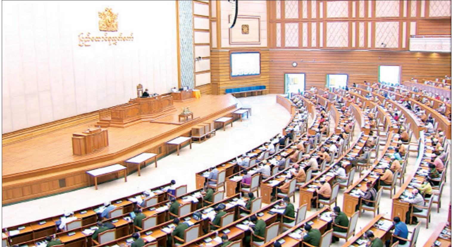
ဒုတိယအကြိမ် ပြည်ထောင်စုလွှတ်တော် (၁၇) ကြိမ်မြောက် ပုံမှန်အစည်းအဝေး ၁၃ ရက်မြောက်နေ့ ကျင်းပစဉ်။

နေပြည်တော် ဩဂုတ် ၂၆ ဒုတိယအကြိမ် ပြည်ထောင်စုလွှတ်တော် (၁၇) ကြိမ်မြောက် ပုံမှန်အစည်းအဝေး ၁၃ ရက်မြောက်နေ့ကို ယနေ့နံနက် ၁၀နာရီတွင် နေပြည်တော်ရှိ ပြည်ထောင်စုလွှတ်တော် အစည်းအဝေးခန်းမ၌ ကျင်းပသည်။ အစည်းအဝေးတွင် နိုင်ငံတော်သမ္မတထံမှ ပေးပို့ထားသော ပြည်ထောင်စုသဘောတူစာချုပ် အစိတ်အပိုင်း(၃)နှင့်စပ်လျဉ်း၍ ပြည်ထောင်စုအစိုးရအဖွဲ့ ကိုယ်စားပြည်ထောင်စုရှေ့နေချုပ် ဦးထွန်းထွန်းဦးက လွှတ်တော်သို့ ရှင်းလင်းတင်ပြရာတွင် ၂၀၁၅ ခုနှစ် အောက်တိုဘာ ၁၅ ရက်တွင် ပြည်ထောင်စုသမ္မတမြန်မာနိုင်ငံတော်အစိုးရနှင့် တိုင်းရင်းသားလက်နက်ကိုင်အဖွဲ့အစည်းများအကြား တစ်နိုင်ငံလုံးပစ်ခတ်တိုက်ခိုက်မှု ရပ်စဲရေး သဘောတူစာချုပ်ကို ချုပ်ဆိုခဲ့ပြီး ၂၀၁၅ ခုနှစ် ဒီဇင်ဘာ ၈ ရက်တွင် အဆိုပါ သဘောတူစာချုပ်ကို ပြည်ထောင်စုလွှတ်တော်က အတည်ပြုခဲ့ပါကြောင်း၊ တစ်နိုင်ငံလုံးပစ်ခတ်တိုက်ခိုက်မှုရပ်စဲရေး သဘောတူစာချုပ်အရ ဖွဲ့စည်းခဲ့သည့် ပြည်ထောင်စုငြိမ်းချမ်းရေး ဆွေးနွေးမှုပူးတွဲကော်မတီ (UPDJ) ကို နိုင်ငံတော်သမ္မတရုံး၏ အမိန့်ကြော်ငြာစာအမှတ် (၄၈/ ၂၀၁၆) ဖြင့် နိုင်ငံတော်၏ အတိုင်ပင်ခံပုဂ္ဂိုလ် ဒေါ်အောင်ဆန်းစုကြည်က ဥက္ကဋ္ဌအဖြစ် ဆောင်ရွက်၍ အစိုးရစာမျက်နှာ ၄ ကော်လံ ၁ သို့ □