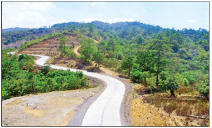
ဟားခါး-မတူပီလမ်း။

လမ်းဦးစီးဌာနသည် ရန်ကုန်-မန္တလေး အမြန်လမ်း အဆင့်မြှင့်တင်ခြင်းအဖြစ် ကတ္တရာ ကွန်ကရစ်ခင်းခြင်း၊ လမ်းလယ်ကျွန်း အား Raised Median မှ Depressed Median သို့ ပြောင်းလဲ၍ Median Shoulder တိုးချဲ့ ခြင်းနှင့် Guard Rail တပ်ဆင်ခြင်း၊ လမ်းလယ် ကျွန်း ရေမြောင်းတည်ဆောက်ခြင်း ၊ အမြန် လမ်းမကြီးနှင့်အပြိုင် ကျေးရွာချင်းဆက် ကုန်ထုတ်ဆက်သွယ်ရေးလမ်းဖောက်လုပ်ခြင်း လုပ်ငန်းများ ဆောင်ရွက်လျက်ရှိကြောင်း သိရသည်။