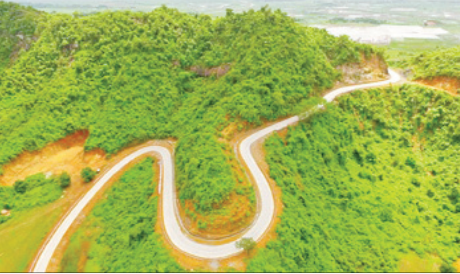
မင်းဘူး-အမ်း-စစ်တွေလမ်း