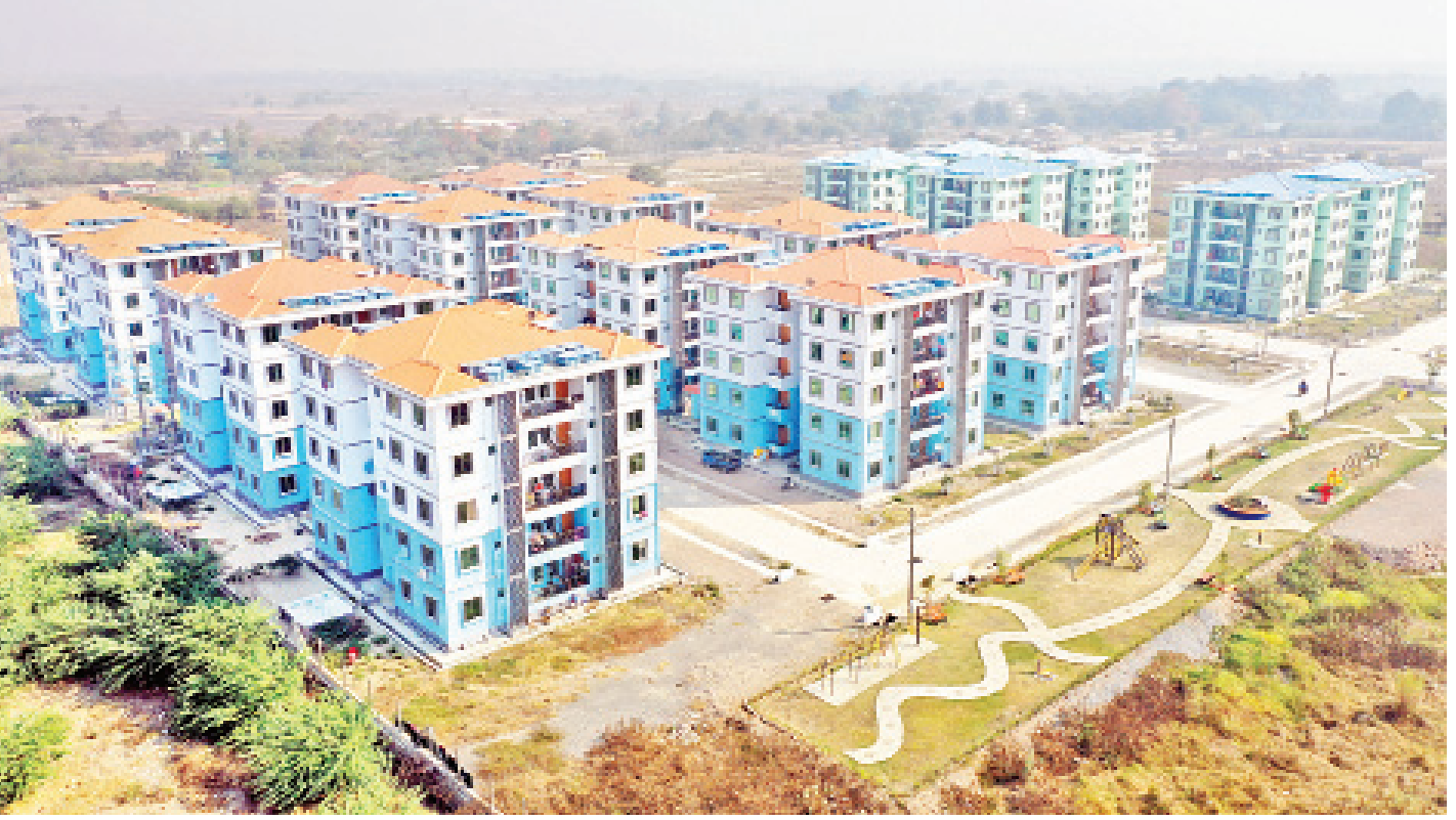
မန္တလေးတိုင်းဒေသကြီး မြို့ပြနှင့်အိမ်ရာဖွံ့ဖြိုးရေးဦးစီးဌာနမှ ပုသိမ်ကြီးမြို့နယ် ရန်ကင်းကုန်းကျေးရွာအနီးတွင် အကောင်အထည်ဖော် တည်ဆောက်ပေးထားသည့် ဝန်ထမ်းအိမ်ရာများအား တွေ့ရစဉ်။

မန္တလေး ဩဂုတ် ၂၀ မြို့ပြနှင့် အိမ်ရာဖွံ့ဖြိုးရေးဦးစီးဌာနမှ မန္တလေးတိုင်းဒေသကြီး ပုသိမ်ကြီးမြို့နယ် ရန်ကင်းတောင်အနီး ရှင်တော်ကုန်းကျေးရွာတွင် ပြည်သူ့အငှားအိမ်ရာ အခန်းပေါင်း ၃၀၀၀ ကို ယခုလမှစတင်၍ ၂၀၂၁ ခုနှစ် ဖေဖော်ဝါရီ ၂၈ ရက်အထိ ခြောက်လနှင့် အပြီးတည်ဆောက်နိုင်ရန် အကောင်အထည်ဖော် ဆောင်ရွက်သွားမည်ဖြစ်ကြောင်း မန္တလေးတိုင်းဒေသကြီး မြို့ပြနှင့်အိမ်ရာ ဖွံ့ဖြိုးရေးဦးစီးဌာနမှ သိရသည်။ အကောင်အထည်ဖော်တည်ဆောက် အဆိုပါတိုက်ခန်းများအား အိမ်ရာဝယ်ယူနိုင်စွမ်းမရှိသည့် အငြိမ်းစားဝန်ထမ်းများ၊ အငြိမ်းစားယူရန် နီးကပ်နေသည့် ဝန်ထမ်းများ၊ ဝင်ငွေနည်း ဝန်ထမ်းများနှင့် နေရေးခက်ခဲနေသည့် ပြည်သူများအတွက် ပြည်ထောင်စုအစိုးရနှင့် တိုင်းဒေသကြီး အစိုးရတော်လှန်ရေးအဖွဲ့အစည်းတို့မှ အထောက်အကူပြုပေးခြင်းဖြင့် တစ်ခန်းလျှင် စတုရန်းပေ ၆၅၀ အကျယ်အဝန်းရှိ လေးခန်းတွဲ ငါးထပ်ပါ တိုက် ၁၈၈ လုံးကို တည်ဆောက်ရန် စီစဉ်ထားရှိကြောင်း မန္တလေးတိုင်းဒေသကြီး မြို့ပြနှင့် အိမ်ရာဖွံ့ဖြိုးရေးဦးစီးဌာနမှ တာဝန်ရှိသူတစ်ဦးက ပြောပြသည်။ "ကျွန်တော်တို့ဌာနအနေနဲ့ ပြည်သူတွေနေရေးအတွက် မန္တလေးတိုင်းအတွင်းမှာ ဝန်ထမ်းအိမ်ရာတွေကို နှစ်စဉ် တည်ဆောက်ပေးနေတဲ့အပြင် အရောင်းအိမ်ရာတွေ အနေနဲ့လည်း မြရည်နန္ဒာတန်ဖိုးမျှတအိမ်ရာ အခန်းပေါင်း ၁၂၃၂ ခန်းကို ဆောက်လုပ်ပြီး ဘက်ချေးငွေစနစ်နဲ့ ရောင်းချပေးခဲ့ပါတယ်။ စာမျက်နှာ ၇ ကော်လံ ၁ သို့ □