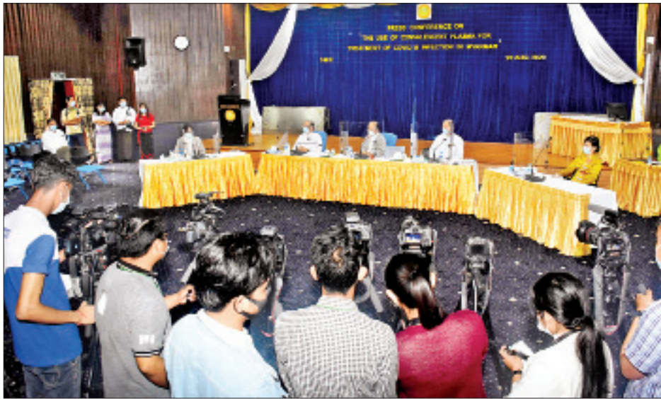
မဖြစ်စေရန် အသေးစိတ်လေ့လာမှုများကို စနစ်တကျ ပြုလုပ်ခဲ့ကြောင်း။

မြန်မာနိုင်ငံတွင် ကျန်းမာရေးနှင့်အားကစားဝန်ကြီးဌာနက ကိုဗစ်-၁၉ ရောဂါ ပြန်လည်ကောင်းမွန်သွားသည့် လူနာများမှ လှူဒါန်းထားသည့် သွေးရည်ကြည်ဖြင့် လက်ရှိ လူနာများအား ကုသနိုင်ရန် Ad-hoc ကော်မတီဖွဲ့စည်းပေးခဲ့ကြောင်း၊ ယင်းအဖွဲ့မှ မြန်မာနိုင်ငံတွင် ကိုဗစ်-၁၉ လူနာများအား သွေးရည်ကြည်ဖြင့် ကုသမှုများစနစ်များကို စနစ်တကျ လေ့လာမှုများပြုလုပ်ခဲ့ပြီး ကုသမှုများပြုလုပ်နိုင်ရန် စီစဉ်ဆောင်ရွက်ခဲ့ကြောင်း၊ ထို့ပြင် သွေးရည်ကြည်လက်ခံသော လူနာများတွင် ဘေးထွက်ဆိုးကျိုးအန္တရာယ်