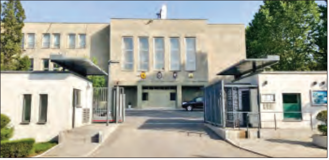
မြောက်ကိုရီးယားနိုင်ငံရှိ ဆွီဒင်သံရုံးအား တွေ့ရစဉ်။

စတော့ဟုမ်း ဩဂုတ် ၁၉ ဆွီဒင်နိုင်ငံသည် မြောက်ကိုရီးယားနိုင်ငံတွင်ရှိနေသည့် ဆွီဒင်သံတမန်များအား ယာယီ ပြန်လည်ရုပ်သိမ်းလိုက်ကြောင်း ပြောကြားခဲ့သည်။ မြောက်ကိုရီးယားနိုင်ငံရှိ ဆွီဒင်သံတမန်များအား ကိုရိုနာဗိုင်းရပ်စ်ကပ်ရောဂါ ကြောင့် ပြန်လည်ရုပ်သိမ်းရန် စီစဉ်ခဲ့ခြင်းဖြစ်ကြောင်းလည်း ဆွီဒင်နိုင်ငံခြားရေး ဝန်ကြီးဌာန ပြောရေးဆိုခွင့်ရှိသူတစ်ဦးက ဩဂုတ် ၁၈ ရက်တွင် ပြောကြားခဲ့သည်။ ကိုဗစ်-၁၉ ရောဂါ ကူးစက်မှုကို တားဆီးကာကွယ်နိုင်ရန် အစီအမံများကို ဆောင်ရွက်နေခြင်းကြောင့် ဗြိတိန်နှင့် ဂျာမနီကဲ့သို့သော အနောက်နိုင်ငံများကလည်း ၎င်းတို့၏ သံတမန်များကို မြောက်ကိုရီးယားနိုင်ငံမှ ပြန်လည်ရုပ်သိမ်းခဲ့ပြီး ဖြစ်ကြောင်းလည်း သိရသည်။ မြောက်ကိုရီးယားနိုင်ငံကမူ နိုင်ငံအတွင်း ကိုဗစ်-၁၉ ရောဂါ ကူးစက်မှုရှိကြောင်း အတည်ပြုပြောကြားခဲ့ပြီး ကိုဗစ်-၁၉ ရောဂါကူးစက်မှုကို တားဆီးကာကွယ်ရန် အတွက် ခရီးသွားလာခွင့်ဆိုင်ရာ ကန့်သတ်ချက်များကို ချမှတ်ထားခဲ့ကြောင်း သိရသည်။ ဆွီဒင်သံတမန်များ ရုပ်သိမ်းခြင်းသည် ယာယီသာဖြစ်ကြောင်း၊ ပြုယမ်းရှိ