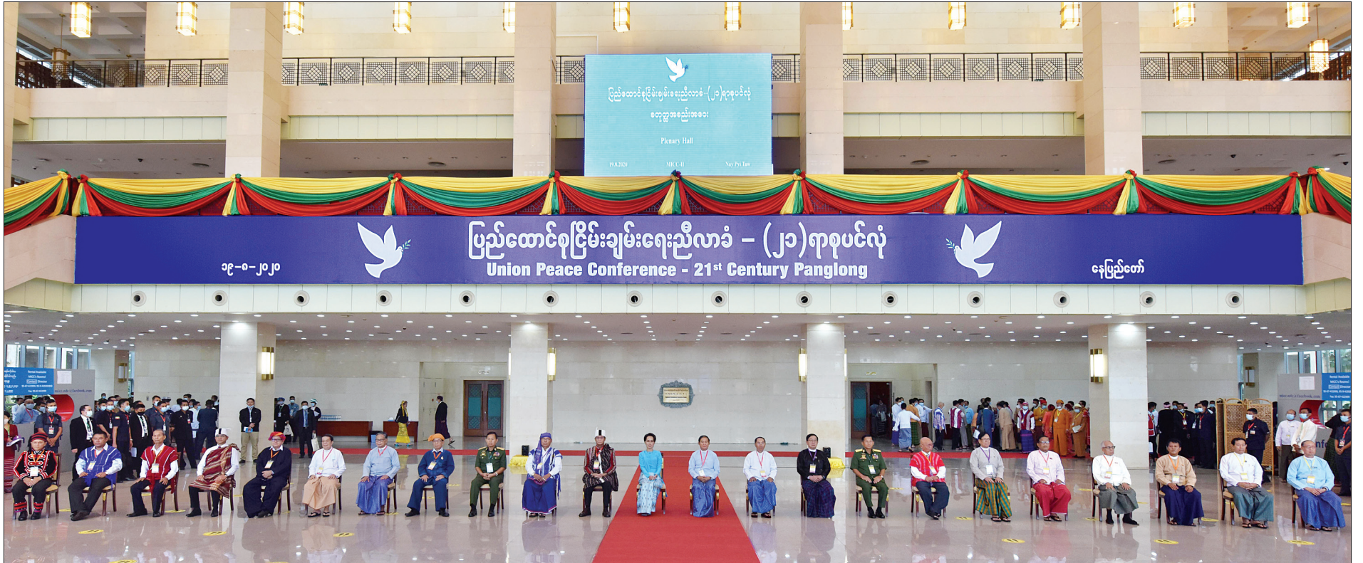
နိုင်ငံတော်သမ္မတ ဦးဝင်းမြင့်၊ နိုင်ငံတော်၏အတိုင်ပင်ခံပုဂ္ဂိုလ် ဒေါ်အောင်ဆန်းစုကြည်၊ ဒုတိယသမ္မတများဖြစ်ကြသည့် ဦးမြင့်ဆွေနှင့် ဦးဟင်နရီဗန်ထီးယူ၊ ပြည်သူ့လွှတ်တော်ဥက္ကဋ္ဌ ဦးတီခွန်မြတ်၊ အမျိုးသားလွှတ်တော်ဥက္ကဋ္ဌ မန်းဝင်းခိုင်သန်း၊ တပ်မတော်ကာကွယ်ရေးဦးစီးချုပ် ဗိုလ်ချုပ်မှူးကြီးမင်းအောင်လှိုင်နှင့် ပြည်ထောင်စုငြိမ်းချမ်းရေးညီလာခံ-(၂၁)ရာစုပင်လုံ စတုတ္ထအစည်းအဝေး ဖွင့်ပွဲအခမ်းအနားသို့ တက်ရောက်လာကြသူများ စုပေါင်းမှတ်တမ်းတင် ဓာတ်ပုံရိုက်ကြစဉ်။

● ရှေးဦးမှ RCSS ၏ ငြိမ်းချမ်းရေးဆွေးနွေးရေး ကိုယ်စားလှယ်အဖွဲ့ ခေါင်းဆောင် စစ်ဘောင်ခေ၊ မွန်ပြည်သစ်ပါတီ (NMSP) ဥက္ကဋ္ဌ နိုင်ဟံသာနှင့် ဒုတိယဥက္ကဋ္ဌ နိုင်အောင်မင်း၊ လားဟူဒီမိုကရက်တစ်အစည်းအရုံး (LDU) ဥက္ကဋ္ဌ ကျာခွန်ဆာနှင့် NCA-S EAO အစုအဖွဲ့မှ ညီလာခံကိုယ်စားလှယ်များ၊ ပါဝင်သည့် ပါဝင်ထိုက်သူ အစုအဖွဲ့မှ ကိုယ်စားလှယ်များ၊ နိုင်ငံခြားသံရုံးများမှ သံတမန်များ၊ ကုလသမဂ္ဂလက်အောက်ခံ အဖွဲ့အစည်းများမှ ကိုယ်စားလှယ်များ၊ ပြည်တွင်း၊ ပြည်ပမှ အစိုးရမဟုတ်သော အဖွဲ့အစည်းများနှင့် ဖိတ်ကြားထားသူများ တက်ရောက်ကြသည်။ ဖွင့်ပွဲအခမ်းအနားတွင် ကယား