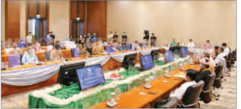
တာဝန်ခွဲဝေမှုနှင့် သဘောတူစာချုပ်တွင် လက်မှတ်ရေးထိုး သူများ၊ အသိသက်သေများ၊ အကြိမ် (၂၀) မြောက် UPDJC အစည်းအဝေး အစီအစဉ်နှင့် အထွေထွေကိစ္စရပ်များကို ဆွေးနွေးခဲ့ကြသည်။ သတင်းစဉ်

အစည်းအဝေးတွင် ပြည်ထောင်စုငြိမ်းချမ်းရေး ညီလာခံ-(၂၁) ရာစုပင်လုံ စတုတ္ထအစည်းအဝေးတွင် ချုပ်ဆို မည့် ပြည်ထောင်စုသဘောတူစာချုပ် အစိတ်အပိုင်း (၃) ကိစ္စ၊ NCA အကောင်အထည်ဖော်မှုဆိုင်ရာ မူဘောင်သဘော တူညီချက်၊ ၂၀၂၀ အလွန် အဆင့်လိုက်လုပ်ငန်းစဉ်များနှင့် အဆင့်လိုက် အကောင်အထည်ဖော်မှုများ (ဇယား-၁)၊ ဒီမိုကရေစီနှင့် ဖက်ဒရယ်စနစ်တို့ကို အခြေခံသည့် ပြည်ထောင်စုတည်ဆောက်ရေးဆိုင်ရာ လမ်းညွှန်အခြေခံ မူသဘောတူညီချက်၊ ညီလာခံဆိုင်ရာ ကိစ္စရပ်များဖြစ်သည့် ညီလာခံ တတိယနေ့အစီအစဉ်၊ ညီလာခံတွင် လုပ်ငန်း