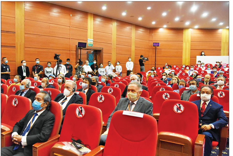
ပြည်ထောင်စုငြိမ်းချမ်းရေးညီလာခံ-(၂၁)ရာစုပင်လုံ စတုတ္ထအစည်းအဝေး ဖွင့်ပွဲအခမ်းအနားသို့ တက်ရောက်လာကြသူများကို တွေ့ရစဉ်။