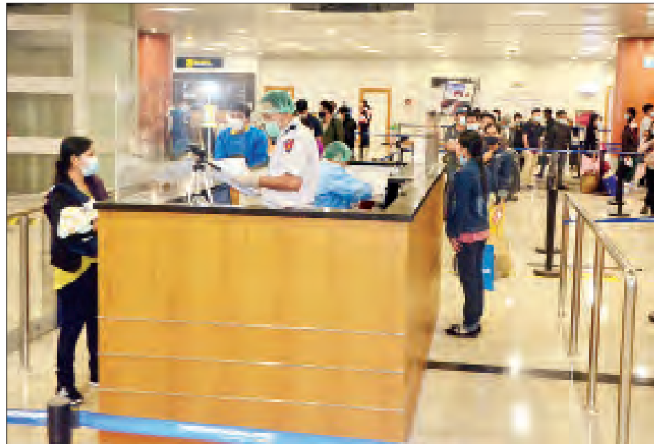
မလေးရှားနိုင်ငံမှ ပြန်လည်ရောက်ရှိလာသည့် မြန်မာနိုင်ငံသားများအား ရန်ကုန်အပြည်ပြည်ဆိုင်ရာလေဆိပ်၌ တွေ့ရစဉ်။

နေပြည်တော် ဩဂုတ် ၁၉ နိုင်ငံတကာ ခရီးသည်တင်လေယာဉ် များပျံသန်းမှု ယာယီရပ်ဆိုင်းထား ခြင်းကြောင့် မလေးရှားနိုင်ငံ၌ အခက်အခဲကြုံတွေ့နေရသည့် မြန်မာ နိုင်ငံသား ၁၆၄ ဦးအား မြန်မာ အပြည်ပြည်ဆိုင်ရာလေကြောင်း (MAI) ကယ်ဆယ်ရေးလေယာဉ်ဖြင့် ပြန်လည် ခေါ်ဆောင်ခဲ့ရာ ယနေ့ ညနေပိုင်းတွင် ရန်ကုန်အပြည်ပြည်ဆိုင်ရာလေဆိပ် သို့ အဆင်ပြေချောမွေ့စွာ ပြန်လည် ရောက်ရှိကြသည်။ ၎င်းတို့ ရန်ကုန်အပြည်ပြည်ဆိုင်ရာ လေဆိပ်သို့ ရောက်ရှိချိန်တွင် လူဝင်မှု ကြီးကြပ်ရေး၊ ကျန်းမာရေးစစ်ဆေးရေး နှင့် ၂၁ ရက်တာ အသွားအလာ ကန့်သတ်နေထိုင်ရေးတို့ကို အလုပ် သမား၊ လူဝင်မှုကြီးကြပ်ရေးနှင့် ပြည်သူ့အင်အား ဝန်ကြီးဌာန၊ စာမျက်နှာ ၁၇ ကော်လံ ၁ သို့ ❖