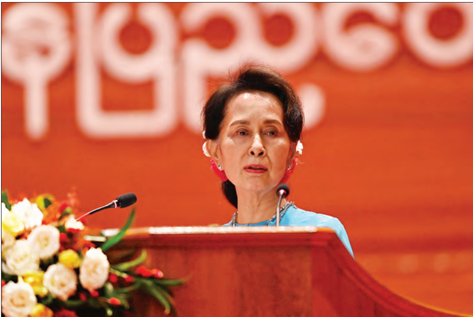
အမျိုးသားပြန်လည်သင့်မြတ်ရေးနှင့်ငြိမ်းချမ်းရေးဗဟိုဌာန ဥက္ကဋ္ဌ၊ နိုင်ငံတော်၏အတိုင်ပင်ခံပုဂ္ဂိုလ် ဒေါ်အောင်ဆန်းစုကြည် ပြည်ထောင်စုငြိမ်းချမ်းရေးညီလာခံ-(၂၁)ရာစုပင်လုံ စတုတ္ထအစည်းအဝေး ဖွင့်ပွဲအခမ်းအနားတွင် မိန့်ခွန်းပြောကြားစဉ်။

ဒီလိုကျန်ခဲ့ရခြင်း အကြောင်းရင်းကလည်း “ပြည်နယ် အခြေခံဥပဒေ”နဲ့ “ပြည်နယ်ဖွဲ့စည်းပုံအခြေခံ ဥပဒေ” စကားရပ်၊ အခေါ်အဝေါ် ညှိယူလို့မရတဲ့အတွက် လို့ ဆိုနိုင်ပေမယ့်လည်း ဝေါဟာရတွေပေါ်မှာ အနက် အဓိပ္ပာယ် ကောက်ယူဖွင့်ဆိုမှုတွေရဲ့ အကျိုးဆက်လို့ ဆိုနိုင်ပါတယ်။ ဒါဟာ တကယ်တော့ နှစ်ဖက်စလုံးမှာ ရှိနေတဲ့ စိုးရိမ်မှုတွေပါပဲ။ ဒီစိုးရိမ်မှုတွေကို ထပ်ပြီး စိစစ်သုံးသပ်ကြည့်လိုက်ရင် သံသယတွေနဲ့ ကြည့်မြင်နေ