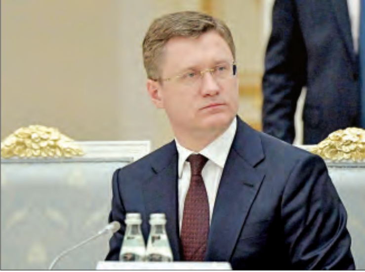
ရုရှားစွမ်းအင်ဝန်ကြီး အလက်ဇန္ဒားနိုဗက်ခ်

ဖြစ်ကြောင်း မိရှူစတင်က ဆိုသည်။ ပြီးခဲ့သည့်အပတ်က စတင်ခဲ့သည့် ရုရှားဝန်ကြီးချုပ်၏ အရှေ့ဖျားခရီးစဉ်တွင် လိုက်ပါလာခဲ့သော သတင်းထောက်အချို့၌ ကိုရိုနာဗိုင်းရပ်စ်ပိုး တွေ့ရှိခဲ့ပြီး ၎င်းတို့အား မော်စကိုမြို့တော်သို့ ပြန်လည်စေလွှတ်ခဲ့သည်။ သမ္မတရုံး ပြောရေးဆိုခွင့်ရှိသူ ဒီမီထရီပက်ရှ် ကော့ဗ်၊ ဝန်ကြီးအချို့နှင့် လွှတ်တော်အမတ်များအပါအဝင် ရုရှားနိုင်ငံရေး သမားအချို့သည်လည်း မကြာသေးမီလများအတွင်း ကိုရိုနာဗိုင်းရပ်စ် ကူးစက်ခံခဲ့ရသည်။ ရုရှားနိုင်ငံက ကိုရိုနာဗိုင်းရပ်စ်ကာကွယ်ဆေး ထုတ်လုပ်ခဲ့ကြောင်း သမ္မတ ဗလာဒီမာပူတင်က ပြီးခဲ့သည့်အပတ်အတွင်း ကြေညာ ခဲ့သော်လည်း ထိုကြေညာချက်ကို သိပ္ပံပညာရှင်များနှင့် ကမ္ဘာ့ ကျန်းမာရေးအဖွဲ့တို့က သတိပေးမှုပြုလုပ်ခဲ့သည်။ ကိုးကား- အေအက်ဖ်ပီ ဘာသာပြန်- ကျော်ထိုက်စိုး