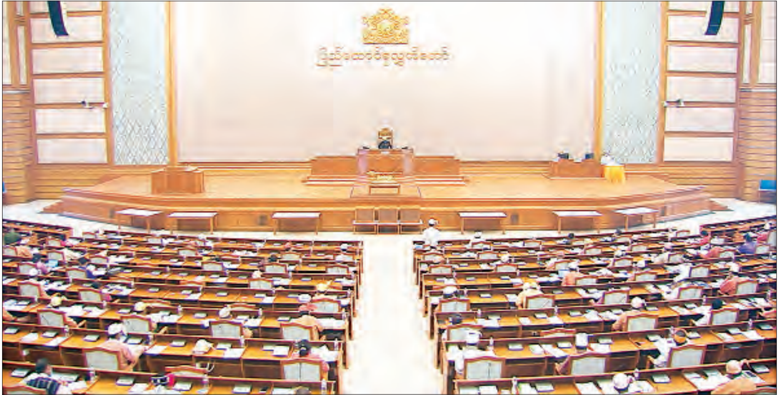
ဒုတိယအကြိမ် ပြည်ထောင်စုလွှတ်တော် (၁၇)ကြိမ်မြောက် ပုံမှန်အစည်းအဝေး ဒသမနေ့ကျင်းပစဉ်။

နေပြည်တော် ဩဂုတ် ၁၉ ဒုတိယအကြိမ် ပြည်ထောင်စုလွှတ်တော် (၁၇) ကြိမ်မြောက် ပုံမှန်အစည်းအဝေး ဒသမနေ့ကို ယနေ့နံနက် ၁၀ နာရီတွင် နေပြည်တော်ရှိ ပြည်ထောင်စုလွှတ်တော် အစည်းအဝေးခန်းမ၌ ကျင်းပသည်။