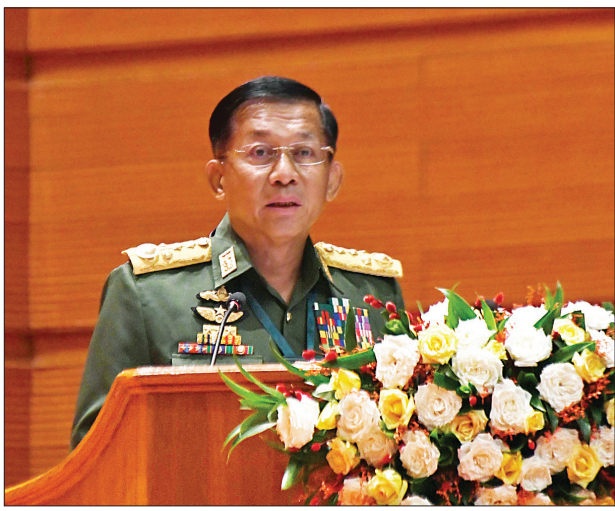
တပ်မတော်ကာကွယ်ရေးဦးစီးချုပ် ဗိုလ်ချုပ်မှူးကြီးမင်းအောင်လှိုင် ပြည်ထောင်စုငြိမ်းချမ်းရေးညီလာခံ-(၂၁)ရာစုပင်လုံ စတုတ္ထအစည်းအဝေးတွင် နှုတ်ခွန်းဆက်အမှာစကား ပြောကြားစဉ်။

ငြိမ်းချမ်းရေးအကြောင်းကိုပြောတဲ့အခါမှာ ဆွေးနွေးပွဲတွေ၊ ရေးသားမှုတွေမှာ ကျွန်တော်အမြဲတမ်းတွေ့နေရတာက “တိုင်းရင်းသားအခွင့်အရေး” ဆိုတဲ့ကိစ္စ “လူနည်းစုအခွင့်အရေး” ဆိုတဲ့ ကိစ္စတွေနဲ့ပတ်သက်ပြီး ပြောလိုပါတယ်။ ကျွန်တော်တို့နိုင်ငံမှာ တိုင်းရင်းသားလူမျိုးစု ၁၃၀ ကျော် ရှိပါတယ်။ အားလုံးသည် တန်းတူညီတူ အခွင့်အရေး၊ သာတူညီမျှအခွင့်အရေး ရှိကြပါတယ်။ ကျွန်တော်တို့နိုင်ငံရဲ့ ဖွဲ့စည်းပုံအခြေခံဥပဒေမှာလည်း နိုင်ငံသူ၊ နိုင်ငံသားအားလုံး၊ တိုင်းရင်းသား ပြည်သူတစ်ရပ်လုံးအတွက် အခွင့်အရေးတွေ၊ ကတိကဝတ်တွေကို အခန်း (၁)၊ နိုင်ငံတော် အခြေခံမူများအခန်းနဲ့ အခန်း (၈)၊ နိုင်ငံသား၊ နိုင်ငံသားများ၏ မူလအခွင့်အရေးနှင့် တာဝန်များအခန်းမှာ ပြည့်ပြည့်စုံစုံ ထည့်သွင်းရေးသား ပြဋ္ဌာန်းထားတာကို တွေ့ရပါတယ်။ ပြောရရင်