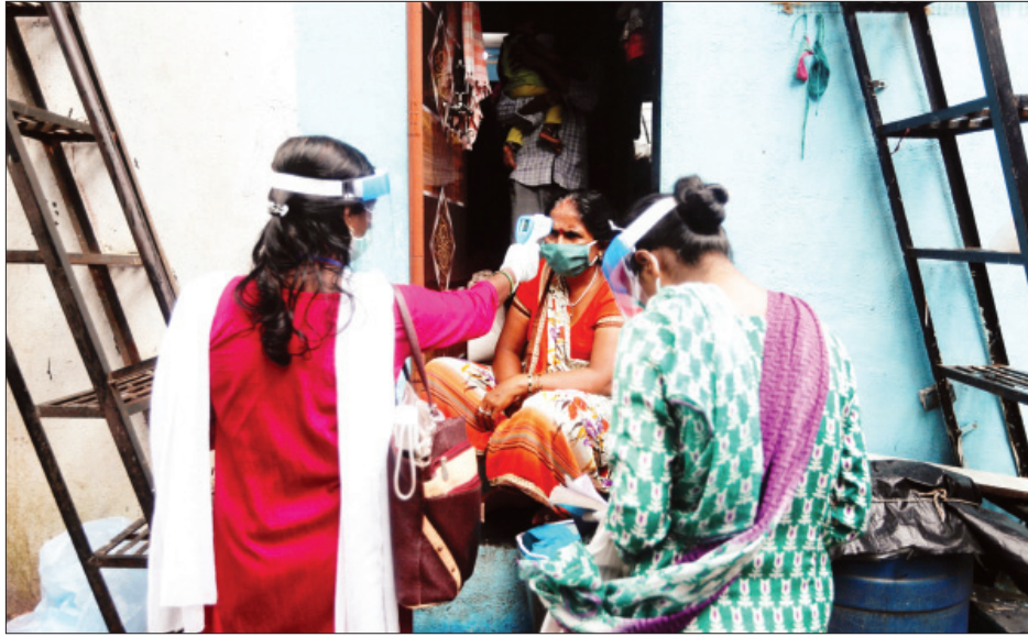
အိန္ဒိယနိုင်ငံ မွန်ဘိုင်းမြို့ရှိ ကိုရိုနာဗိုင်းရပ်စ်တိုက်ဖျက်ရေးလှုပ်ရှားမှုတွင် ကျန်းမာရေးဝန်ထမ်းများက ကိုယ်အပူချိန် တိုင်းတာပေးနေသည်ကို တွေ့ရစဉ်။

ပေကျင်း ဩဂုတ် ၁၇ နိုင်ငံပေါင်း ၃၀ ကျော်၌ နေ့စဉ်ကိုဗစ်-၁၉ ရောဂါကူးစက်မှု ၁၀၀၀ ကျော်စီရှိကြောင်း ကမ္ဘာ့ကျန်းမာရေးအဖွဲ့က ဩဂုတ် ၁၆ ရက်တွင် ထုတ်ပြန်သည့် ထုတ်ပြန်ချက်တစ်ရပ်အရ သိရသည်။ နေ့စဉ် ကိုဗစ်-၁၉ ရောဂါ ကူးစက်ခံရသူ ၁၀၀၀၀ ကျော်အထိရှိသည့် နိုင်ငံလေးနိုင်ငံရှိပြီး အိန္ဒိယနိုင်ငံတွင် နေ့စဉ် ကိုဗစ်-၁၉ ရောဂါကူးစက်သူ ၆၅၀၀၂ ဦး၊ ဘရာဇီး နိုင်ငံတွင် ၆၀၀၉၁ ဦး၊ အမေရိကန်နိုင်ငံတွင် ၅၂၇၉၉ ဦးနှင့် ကိုလံဘီယာနိုင်ငံတွင် ၁၁၂၈၆ ဦး အသီးသီးရှိကြောင်းလည်း ကမ္ဘာ့ကျန်းမာရေးအဖွဲ့က ပြောကြားခဲ့သည်။ နေ့စဉ် ကိုဗစ်-၁၉ ရောဂါကူးစက်မှု အရေအတွက် ၁၀၀၀ နှင့် ၁၀၀၀၀ အကြားရှိသည့် နိုင်ငံများမှာ လက်တင် အမေရိက၊ ဥရောပနှင့် အာရှတိုက်တို့ဖြစ်ကြောင်းလည်း သိရသည်။ လက်တင်အမေရိကနိုင်ငံများ၏ နေ့စဉ် ကိုဗစ်-၁၉ ရောဂါကူးစက်မှုမှာ ပီရူးနိုင်ငံတွင် ၉၄၄၁ ဦး၊ အာဂျင်တီးနား နိုင်ငံတွင် ၇၄၉၈ ဦး၊ မက္ကဆီကိုနိုင်ငံတွင် ၇၀၀၀၊ ချီလီနိုင်ငံ တွင် ၂၀၇၇ ဦး၊ ဘိုလီဘီယားနိုင်ငံတွင် ၁၃၈၈ ဦး၊ ဗိုဗီနိုကန်