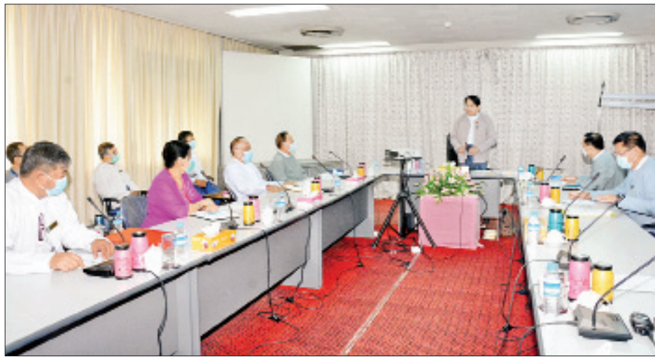
ရုံးခန်းနေရာ အကူအညီပေးရေးကိစ္စနှင့် တေးသီချင်း အယ်လ်ဘမ်များ ဖြန့်ဝေပေးပို့မှုကိစ္စတို့ကို ဆွေးနွေးကြ သည်။ ဆက်လက်၍ မြန်မာ့အသံနှင့်ရုပ်မြင်သံကြား အဆိုပါ အစည်းအဝေးသို့ ပြန်ကြားရေးဝန်ကြီးဌာနမှ

ရန်ကုန် ဩဂုတ် ၁၇ ပြန်ကြားရေးဝန်ကြီးဌာန ပြည်ထောင်စုဝန်ကြီး ဒေါက်တာ ဖေမြင့်သည် ယနေ့ နံနက်ပိုင်းက ရန်ကုန်မြို့၊ ပြည်လမ်းရှိ မြန်မာ့အသံနှင့်ရုပ်မြင်သံကြား အစည်းအဝေးခန်းမ၌ မြန်မာနိုင်ငံ ဂီတအစည်းအရုံး၊ မြန်မာနိုင်ငံတေးသီချင်း မူပိုင်ရှင်များအသင်းနှင့် မြန်မာနိုင်ငံတေးသီချင်း မူပိုင် ထုတ်လုပ်သူများအသင်းတို့မှ တာဝန်ရှိသူများနှင့် တွေ့ဆုံ ဆွေးနွေးခဲ့သည်။