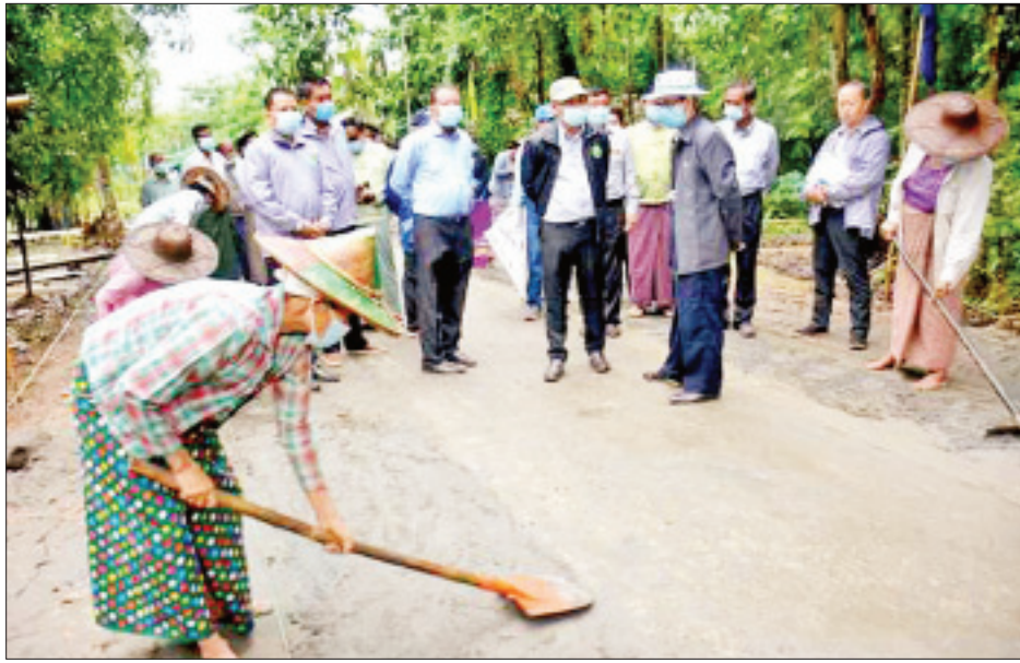
ပြည်ထောင်စုဝန်ကြီး ဒေါက်တာအောင်သူ ကျိုက်လတ်မြို့နယ် အိပ်ယာကြီးကျေးရွာတွင် CERP အရ အကောင်အထည်ဖော် ဆောင်ရွက်လျက်ရှိသည့် Cash for Work စီမံကိန်းလုပ်ငန်းများ ကြည့်ရှုစစ်ဆေးစဉ်။

နေပြည်တော် ဩဂုတ် ၁၇ စိုက်ပျိုးရေး၊ မွေးမြူရေးနှင့် ဆည်မြောင်းဝန်ကြီးဌာန ပြည်ထောင်စုဝန်ကြီး ဒေါက်တာအောင်သူသည် ဩဂုတ် ၁၅ ရက် ညနေပိုင်းက ရန်ကုန်တိုင်းဒေသကြီး ကွမ်းခြံကုန်း မြို့နယ် ထင်းပုံဆိပ်ကျေးရွာနှင့် ရောဂါတိုင်းဒေသကြီး ဒေသဒရိုမြို့နယ် ညောင်ပင်တန်းကျေးရွာများ၌ CERP အရ အကောင်အထည်ဖော်ဆောင်ရွက်လျက်ရှိသည့် Cash for Work စီမံကိန်းလုပ်ငန်းများကို ကြည့်ရှုစစ်ဆေးသည်။ ရှေးဦးစွာ ပြည်ထောင်စုဝန်ကြီးနှင့်အဖွဲ့သည် လမ်း၊ တံတား၊ မြောင်း စသည့် ကျေးရွာအခြေခံအဆောက်အအုံ ဖွံ့ဖြိုးရေးလုပ်ငန်းများတွင် ပါဝင်ဆောင်ရွက်နေကြသည့် ကျေးရွာသူ ကျေးရွာသားများနှင့်တွေ့ဆုံ၍ ဒေသဖွံ့ဖြိုးရေး ဆိုင်ရာ လိုအပ်ချက်များကို ရင်းရင်းနှီးနှီး မေးမြန်းဆွေးနွေး သည်။