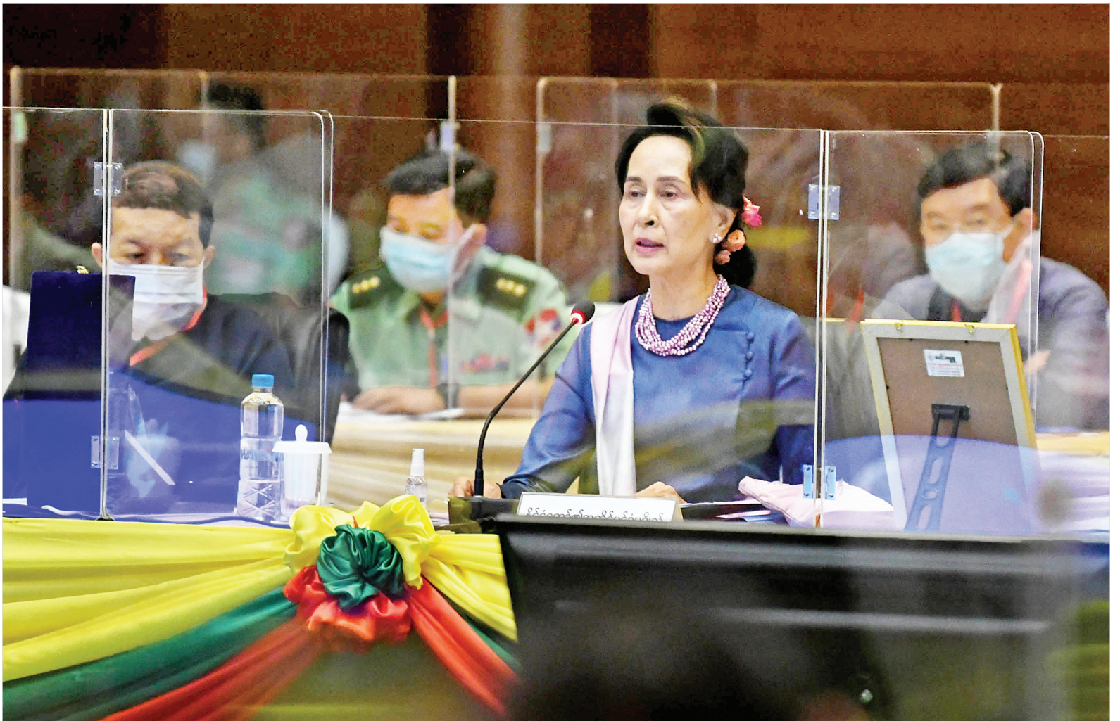
ပြည်ထောင်စုငြိမ်းချမ်းရေးဆွေးနွေးမှု ပူးတွဲကော်မတီ ဥက္ကဋ္ဌ၊ နိုင်ငံတော်၏အတိုင်ပင်ခံပုဂ္ဂိုလ် ဒေါ်အောင်ဆန်းစုကြည် (၁၉)ကြိမ်မြောက် ပြည်ထောင်စုငြိမ်းချမ်းရေးဆွေးနွေးမှု ပူးတွဲကော်မတီ အစည်းအဝေးတွင် မိန့်ခွန်းပြောကြားစဉ်။

တက်ရောက် အစည်းအဝေးသို့ အစိုးရလွှတ်တော်၊ တပ်မတော်အစုအဖွဲ့မှ ပြည်ထောင်စု ငြိမ်းချမ်းရေး ဆွေးနွေးမှု ပူးတွဲ ကော်မတီ ဒုတိယဥက္ကဋ္ဌများဖြစ်ကြ သည့် ပြည်ထောင်စုဝန်ကြီး ဦးကျော် တင့်ဆွေ၊ ငြိမ်းချမ်းရေးကော်မရှင်ဥက္ကဋ္ဌ ဒေါက်တာတင်မျိုးဝင်းနှင့် ပြည်ထောင်စု ရှေ့နေချုပ် ဦးထွန်းထွန်းဦး၊ ပြည်ထောင်စုဝန်ကြီး ဦးမင်းသူ၊ UPDJC အဖွဲ့ဝင်များဖြစ်ကြသည့် ပြည်ထောင်စုဝန်ကြီး ဦးသန့်စင်မောင်၊ ဦးသိန်းဆွေ၊ ဒေါက်တာဝင်းမြတ်အေး နှင့် နိုင်သက်လွင်၊ ငြိမ်းချမ်းရေး ကော်မရှင်အတွင်းရေးမှူး ဒုတိယ ဗိုလ်ချုပ်ကြီး ခင်ဇော်ဦး(ငြိမ်း)၊ ကာကွယ်ရေး ဦးစီးချုပ်ရုံး(ကြည်း)မှ ဒုတိယဗိုလ်ချုပ်ကြီး တင်မောင်ဝင်း၊ ဗိုလ်ချုပ်စန်းမြင့်၊ ဗိုလ်ချုပ်စိုးနိုင်ဦးနှင့် စာမျက်နှာ ၃ ကော်လံ ၁ သို့ ၀