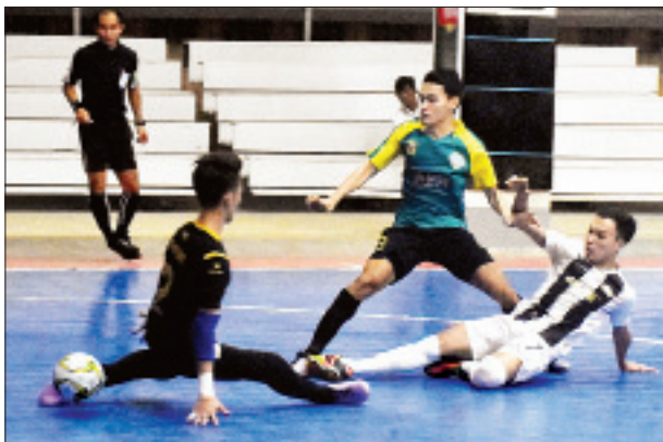
နိုင်ငံတကာ ဖူဆယ်ကလပ်ပြိုင်ပွဲ ယှဉ်ပြိုင်မည့် MIU နှင့် VUC အသင်းတို့ ၂၀၁၉-၂၀၂၀ ရာသီ ဖူဆယ်လိဂ်ပြိုင်ပွဲတွင် တွေ့ဆုံခဲ့စဉ်။

မြန်မာနိုင်ငံဘောလုံးအဖွဲ့ချုပ်သည် ၂၀၁၉-၂၀၂၀ ရာသီ ဖူဆယ်လိဂ်ချန်ပီယံအသင်းကို အာရှဖူဆယ်ကလပ်ပြိုင်ပွဲနှင့် ၂၀၁၉ MFF Open Cup ပြိုင်ပွဲ ချန်ပီယံအသင်းကို အာဆီယံဖူဆယ်ကလပ်ပြိုင်ပွဲတွင် ဝင်ရောက်ယှဉ်ပြိုင်ခွင့်ပြုရန် ဆုံးဖြတ်ထားသော်လည်း ပြိုင်ပွဲနှစ်ခုစလုံးတွင် MIU အသင်းက ဗိုလ်ရခဲ့သောကြောင့် ပြိုင်ပွဲတစ်ခုသာ ရွေးချယ်ခဲ့ခြင်းဖြစ်သည်။ MIU ဖူဆယ်အသင်းသည် ၂၀၂၁ ခုနှစ်တွင် ကျင်းပမည့် ၂၀၂၁ အာဆီယံဖူဆယ်ကလပ်ပြိုင်ပွဲတွင် ဝင်ရောက်ယှဉ်ပြိုင်ရန် ဦးစားပေးရွေးချယ်ခဲ့သောကြောင့် လိဂ်ပြိုင်ပွဲတွင် ဒုတိယရခဲ့သည့် VUC အသင်းက အာရှဖူဆယ်ကလပ်ပြိုင်ပွဲတွင် ယှဉ်ပြိုင်မည်ဖြစ်သည်။ အာရှဘောလုံးအဖွဲ့ချုပ်သည် ၂၀၂၀ အာရှဖူဆယ်ကလပ်ပြိုင်ပွဲကို ဒီဇင်ဘာလတွင် ကျင်းပရန် စီစဉ်ထားသော်လည်း ကိုဗစ်-၁၉ ရောဂါကြောင့် ကျင်းပရန် မသေချာသေးဘဲ လာမည့်နှစ်သို့ ပြောင်းရွှေ့ခဲ့ပါကလည်း VUC အသင်းသာ ဝင်ရောက်ယှဉ်ပြိုင်မည်ဖြစ်သည်။ အာဆီယံဘောလုံးအဖွဲ့ချုပ်မှာ ယခုနှစ်တွင်ကျင်းပမည့်