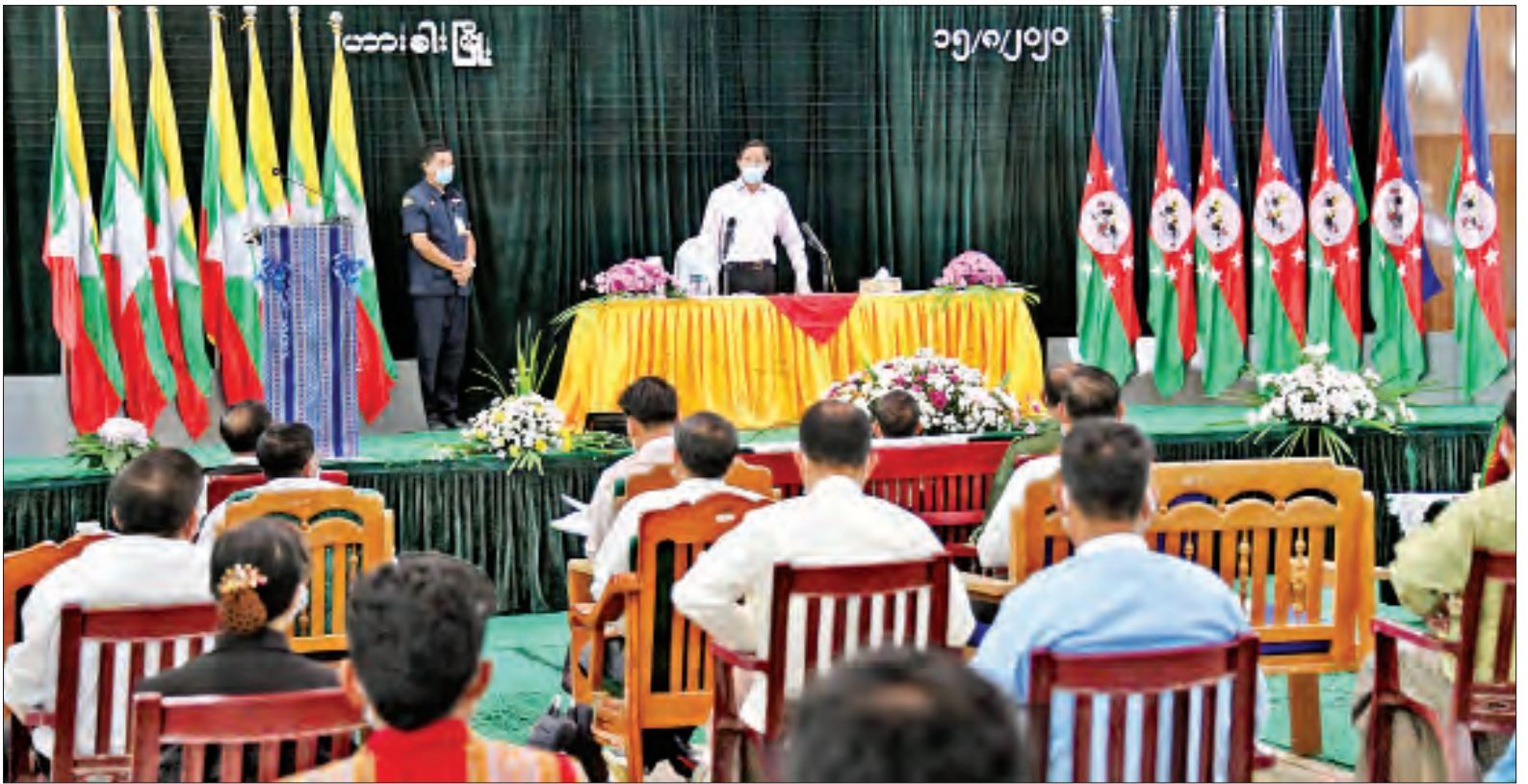
ဒုတိယသမ္မတ ဦးဟင်နရီဗန်ထီးယူ ဟားခါးမြို့မှ မြို့မိမြို့ဖများနှင့် တွေ့ဆုံအမှာစကား ပြောကြားစဉ်။

○ စာမျက်နှာ ၃ မှ ရှင်းလင်းတင်ပြချက်များနှင့် စပ်လျဉ်း၍ ဒုတိယသမ္မတက တည်ဆောက်ရေးလုပ်ငန်းများ ဆောင်ရွက်ကြရာတွင် သဘာဝပတ်ဝန်းကျင်ထိခိုက်မှု အနည်းဆုံးဖြစ်အောင် ဆောင်ရွက်ကြရမည် ဖြစ်ကြောင်း လမ်းညွှန်မှာကြားသည်။