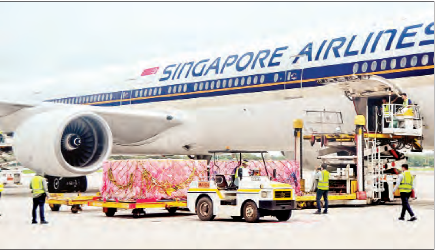
မြန်မာနိုင်ငံ၏ ကိုဗစ်-၁၉ ရောဂါ ကာကွယ်၊ ထိန်းချုပ်၊ တိုက်ဖျက်ရေးလုပ်ငန်းများ ဆောင်ရွက်ရာတွင် အသုံးပြုရန်အတွက် ဂျပန်အစိုးရနှင့် ပြည်သူများက လှူဒါန်းသော ဆေးဝါးနှင့် ကျန်းမာရေးဆိုင်ရာ အထောက်အကူပြုပစ္စည်းများ တင်ဆောင်လာသောလေယာဉ်ကို ရန်ကုန်အပြည်ပြည်ဆိုင်ရာလေဆိပ်၌ တွေ့ရစဉ်။

ထို့နောက် မြန်မာနိုင်ငံ၌ ကိုဗစ်-၁၉ ရောဂါ ကာကွယ်၊ ထိန်းချုပ်၊ တိုက်ဖျက်ရေးလုပ်ငန်းများ ဆောင်ရွက်ရာတွင် အသုံးပြုရန်အတွက် ဆေးဝါးနှင့် ကျန်းမာရေးဆိုင်ရာ အထောက်အကူပြုပစ္စည်းများကို မြန်မာနိုင်ငံဆိုင်ရာ ဂျပန်သံအမတ်ကြီး မစ္စတာ အိချီရော့မာရယာမ က လွှဲပြောင်းပေးအပ်ရာ ကျန်းမာရေးနှင့်အားကစားဝန်ကြီးဌာန ဆေးသုတေသနဦးစီးဌာနမှ စာမျက်နှာ ၇ ကော်လံ ၁ သို့ *