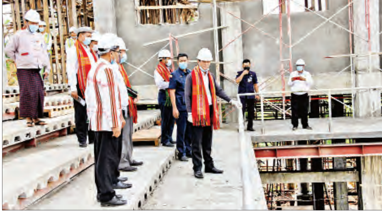
ဒုတိယသမ္မတ ဦးဟင်နရီဗန်ထီးယူ ဟားခါးတက္ကသိုလ် ဘွဲ့နှင်းသဘင်ခန်းမ တည်ဆောက်နေမှုကို ကြည့်ရှုစစ်ဆေးစဉ်။

တန်းကျောင်းနှင့် ကျေးလက်ကျန်းမာ ရေးဌာနတည်ရှိသည့် ကျေးရွာများကို မဟာဓာတ်အားလိုင်းမှ လျှပ်စစ် ဓာတ်အား သွယ်တန်းပေးနိုင်ရေး၊ ဘွေကူးမြစ်ကူးတံတား တည်ဆောက် ပေးနိုင်ရေး၊ ထန်တလန်မြို့တော်ခန်းမ အသစ် ဆောက်လုပ်ပေးနိုင်ရေးနှင့် ထန်တလန်မြို့ ရေပေးစနစ်နှင့် စပ်လျဉ်းသည့် ကိစ္စရပ်များကို တင်ပြ ကြရာ ပြည်ထောင်စုဝန်ကြီး ဒေါက်တာမျိုးသိမ်းကြီး၊ ဒုတိယ ဝန်ကြီးများဖြစ်ကြသည့် ဦးတင်မြင့်နှင့် ဦးခင်မောင်ဝင်း၊ ပြည်နယ်ဝန်ကြီး ဦးစိုးထက်၊ ဦးရွှေထီးယိုနှင့် အမြဲတမ်း အတွင်းဝန် ဦးရွှေလေးတို့က ပြန်လည် ရှင်းလင်းဆွေးနွေးကြသည်။