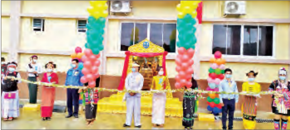
ရှမ်းအင်နှင့်စက်မှုဝန်ကြီး ဦးစိုင်းရှန် (ညာဘက်) တက်ရောက်ပြီး နှစ်စဉ်အစီအစဉ်အရ နေရာချပြီး စီစဉ်ထားကြောင်း၊ လူအများတိုးဝေပြီး ဝယ်ယူရန်အား အားဆေးစွာ ရွေးချယ် ဝယ်ယူနိုင်ရန် စီစဉ်ပေးထားကြောင်း သိရသည်။

မိုင်းပျဉ်း ဩဂုတ် ၁၅ ရှမ်းပြည်နယ်(အရှေ့ပိုင်း) ကျိုင်းတုံ ခရိုင် မိုင်းပျဉ်းမြို့၌ ၂၃၀ ကေဗွီ ဓာတ်အားခွဲရုံနှင့် ၆၆ ကေဗွီဓာတ်အား ခွဲရုံ ဖွင့်လှစ်အခမ်းအနားကို ယနေ့နံနက် ၉ နာရီက ၂၃၀ ကေဗွီဓာတ်အားခွဲရုံတွင် ကျင်းပသည်။