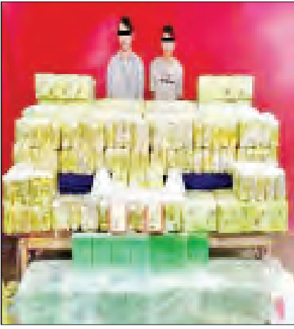
စိုင်းကျောက်စိုင်းနော်ခမ်းတို့အား သိမ်းဆည်းရမိသည့် အိုက်စီများနှင့်အတူ တွေ့ရစဉ်။