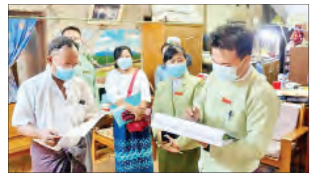
က ကြီးကြပ်ပြီး မြို့နယ်တာဝန်ရှိသူ များ၊ ထွေအုပ်ဝန်ထမ်းများ၊ ရပ်ကွက် ကျေးရွာအုပ်စု အုပ်ချုပ်ရေးမှူးများ၊ ရပ်ကျေးစာရေးများ(အတွင်းရေးမှူးများ)၊ ရွေးကောက်ပွဲကော်မရှင်အဖွဲ့ခွဲ အဖွဲ့ ဝင်များက အုပ်စုများခွဲကာ ရပ်ကွက် ကျေးရွာအုပ်စု ၃၂ အုပ်စု၌ မဲဆန္ဒရှင် စာရင်းတွင် ပါဝင်မှု ရှိ မရှိ စစ်စစ်ခြင်း၊ မဲစာရင်းတွင် ပါရှိသည့် အချက်အလက် များ ပြည့်စုံမှန်ကန်မှု ရှိ မရှိနှင့် မဲစာရင်း များ ကျန်ရှိမှုမရှိစေရအောင် တိုက်ဆိုင် စစ်ဆေးခြင်းလုပ်ငန်းများကို အိမ်တိုင် ရာရောက် ကွင်းဆင်းဆောင်ရွက်ခဲ့ ကြောင်း သိရသည်။ ညဏ်ဟိန်း

ရန်ကုန် ဩဂုတ် ၁၅ ၂၀၂၀ ပြည့်နှစ် ပါတီစုံဒီမိုကရေစီ အထွေထွေရွေးကောက်ပွဲတွင် မဲဆန္ဒ ရှင်စာရင်းများ ပြည့်စုံမှန်ကန်မှုရှိစေ ရေးနှင့် ကျန်ရှိမှုများမရှိစေရေးတို့ အတွက် မဲဆန္ဒရှင်စာရင်းများ တိုက် ဆိုင်စစ်ဆေးခြင်းနှင့် အသိပညာပေး ခြင်းတို့ကို ရန်ကုန်မြောက်ပိုင်းခရိုင် မင်္ဂလာဒုံမြို့နယ်အတွင်း ရပ်ကွက်၊ ကျေးရွာအုပ်စု ၃၂ အုပ်စုရှိ မဲဆန္ဒရှင် များ၏ နေအိမ်များသို့ အိမ်တိုင်ရာ ရောက်သွားရောက်၍ မြို့နယ်တာဝန်ရှိ သူများက ယမန်နေ့နံနက်ပိုင်းမှစ၍ ကွင်းဆင်း ဆောင်ရွက်ခဲ့ကြောင်း သိရ သည်။ ထိုသို့ ကွင်းဆင်းဆောင်ရွက်ရာတွင် မင်္ဂလာဒုံမြို့နယ် အထွေထွေအုပ်ချုပ် ရေးဦးစီးဌာန မြို့နယ်အုပ်ချုပ်ရေးမှူး