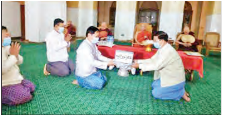
ဥက္ကဋ္ဌနှင့် အဖွဲ့ဝင်များ၏ ရှင်းလင်းတင်ပြချက်များအပေါ် လိုအပ်သည်များမှာကြားကာ ဇီဝိတဒါနသံဃာ့ဆေးရုံကြီးအတွက် ဆွမ်းပဒေသာပင် ငွေကျပ် ၁၅ သိန်း လှူဒါန်းသည်။

ထိုမှတစ်ဆင့် ညနေပိုင်းတွင် ပြည်ထောင်စုဝန်ကြီးသည် ချမ်းမြသာစည်မြို့နယ် ကန်တော်ကြီးကန်ပတ်လမ်းရှိ ဇီဝိတဒါနသံဃာ့ဆေးရုံကြီးသို့ ရောက်ရှိပြီး ဇီဝိတဒါနသံဃာ့ဆေးရုံ စီမံခန့်ခွဲမှုဗဟိုကော်မတီနာယက၊ ဥက္ကဋ္ဌ ဒုတိယ