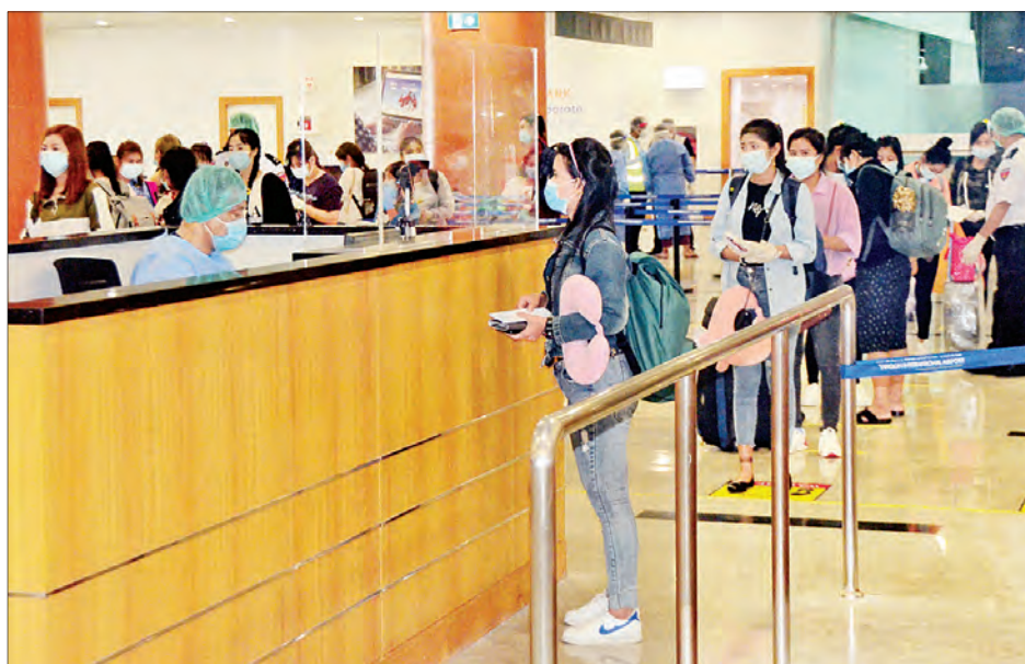
မလေးရှားနိုင်ငံမှ ပြန်လည်ရောက်ရှိလာသည့် မြန်မာနိုင်ငံသားများအား ရန်ကုန်အပြည်ပြည်ဆိုင်ရာလေဆိပ်၌ တွေ့ရစဉ်။

နေပြည်တော် ဩဂုတ် ၁၅ နိုင်ငံတကာခရီးသည်တင် လေယာဉ်များပျံသန်းမှု ယာယီ ရပ်ဆိုင်းထားခြင်းကြောင့် အခက်အခဲကြုံတွေ့နေရသည့် မလေးရှားနိုင်ငံ ဝိနန်းမြို့ရှိ အထည်ချုပ်စက်ရုံများမှ မြန်မာ အလုပ်သမား ၁၇၀ အတွက် မြန်မာသံရုံး ကွာလာလမ်ပူ မြို့နှင့် ၎င်းတို့၏ကုမ္ပဏီများမှ ပူးပေါင်းစီစဉ်မှုဖြင့် မြန်မာ အပြည်ပြည်ဆိုင်ရာလေကြောင်း (MAI) စင်းလုံးငှား အထူး လေယာဉ်အား ပြေးဆွဲခဲ့သည်။ အဆိုပါ ကယ်ဆယ်ရေး အထူးလေယာဉ်သည် ယနေ့မုန်းလွဲပိုင်းတွင် ရန်ကုန် အပြည်ပြည်ဆိုင်ရာလေဆိပ်သို့ အဆင်ပြေချောမွေ့စွာ ပြန်လည်ရောက်ရှိကြသည်။ တာဝန်ယူဆောင်ရွက် ၎င်းတို့ ရန်ကုန်အပြည်ပြည်ဆိုင်ရာလေဆိပ်သို့ ရောက်ရှိချိန်တွင် လူဝင်မှုကြီးကြပ်ရေး၊ ကျန်းမာရေးစစ်ဆေး ရေးနှင့် ၂၁ ရက်တာ အသွားအလာ ကန့်သတ်နေထိုင်ရေး တို့ကို အလုပ်သမား၊ လူဝင်မှုကြီးကြပ်ရေးနှင့် ပြည်သူ့ အင်အားဝန်ကြီးဌာန၊ ကျန်းမာရေးနှင့် အားကစား ဝန်ကြီးဌာနနှင့် ရန်ကုန်တိုင်းဒေသကြီးအစိုးရအဖွဲ့တို့မှ သက်ဆိုင်ရာ အခန်းကဏ္ဍအလိုက် တာဝန်ယူဆောင်ရွက် ပေးခဲ့သည်။ စာမျက်နှာ ၇ ကော်လံ ၅ သို့