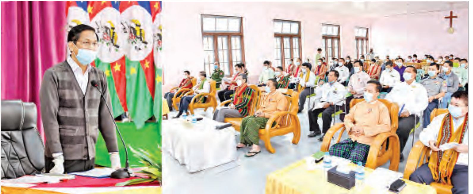
ဒုတိယသမ္မတ ဦးဟင်နရီဗန်ထီးယူ ထန်တလန်မြို့မှ မြို့မိမြို့ဖများနှင့် တွေ့ဆုံအမှာစကား ပြောကြားစဉ်။

ဆက်လက်ပူးပေါင်းပါဝင် နိုင်ငံဖွံ့ဖြိုး တိုးတက်မှုများကို ဒေသခံပြည်သူများ လက်တွေ့ခံစားနေ ကြရပြီဖြစ်ပါကြောင်း၊ ထိုဖွံ့ဖြိုး တိုးတက်မှုများမှ အချို့ကိုကောက်နုတ် ပြောကြားလိုပါကြောင်း၊ ပထမအချက် မှာ ၂၀၁၈ ခုနှစ်က မြန်မာနိုင်ငံ၏ ဆန် နှင့် ဆန်ထွက်ပစ္စည်းများ ပြည်ပသို့ တင်ပို့ရောင်းချနိုင်မှုသည် လွန်ခဲ့သည့် ၁၉၃၄ ခုနှစ် နောက်ပိုင်း ၇၃ နှစ် အတွင်း အမြင့်ဆုံးတင်ပို့ရောင်းချ နိုင်ခဲ့ခြင်းဖြစ်ပါကြောင်း၊ ဒုတိယသည် နိုင်ငံ၏ ခရီးသွားလုပ်ငန်းဖြစ်ပါ ကြောင်း၊ မိမိတို့နိုင်ငံ၏ ခရီးသွား လုပ်ငန်းကို ၂၀၁၉ ခုနှစ် ခရီးသွား လုပ်ငန်းဖွံ့ဖြိုးတိုးတက်မှုနှုန်း အမြန် ဆုံးအဖြစ် UNWTO က သတ်မှတ်ခြင်း ခံခဲ့ရပါကြောင်း၊ ခရီးသွားလုပ်ငန်း ဖွံ့ဖြိုးတိုးတက်မှုနှုန်း ၄၀ ဒသမ ၂ ရာခိုင်နှုန်းထိ ရှိခဲ့ပါကြောင်း၊ ထိုသို့ သော ဖွံ့ဖြိုးတိုးတက်မှုများသည် နိုင်ငံတော်အစိုးရ၊ ဌာနဆိုင်ရာများ၊