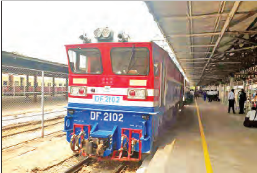
ခရီးသည် ၃၃ ဦး စီးနင်းနိုင်သော အထက်တန်း လိုက်ပါစီးနင်းနိုင်သော ရိုးရိုးတန်းတွဲ (လူစီးဘရိတ် တွဲ) တစ်တွဲပါဝင်ကြောင်း သိရသည်။ သတင်း-ပွင့်သစ္စာ၊ ဓာတ်ပုံ-စိုးမြင့်အောင်

ယင်းရထားခရီးစဉ်အတွက် ရထား လက်မှတ်ခ နှုန်းထားမှာ တစ်ဦးလျှင် ရိုးရိုးတန်းကျပ် ၄၀၀၀နှင့် အထူးတန်းကျပ် ၈၀၀၀ဖြစ်ပြီး ရထားတွဲတစ်တွဲလျှင်