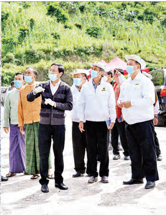
ဒုတိယသမ္မတ ဦးဟင်နရီဗန်ထီးယူ ထန်တလန်မြို့၌ သဘာဝဘေးဒဏ်ကြောင့် မြို့ပတ်လမ်း ပျက်စီးမှုကို ကြည့်ရှုစစ်ဆေးစဉ်။