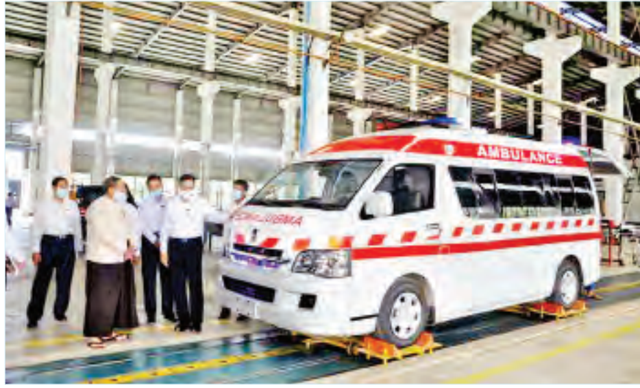
ပြည်ထောင်စုဝန်ကြီး ဦးစိုးဝင်း လူနာတင်ယာဉ်များ တပ်ဆင်နေမှုအခြေအနေကို ကြည့်ရှုစစ်ဆေးစဉ်။

နေပြည်တော် ဩဂုတ် ၁၅ စီမံကိန်း၊ ဘဏ္ဍာရေးနှင့် စက်မှုဝန်ကြီးဌာန ပြည်ထောင်စုဝန်ကြီး ဦးစိုးဝင်းသည် ယနေ့နံနက်ပိုင်းတွင် ပဲခူးတိုင်းဒေသကြီး ရေနီမြို့ရှိ စက္ကူစက်ရုံ(ရေနီ)နှင့် သာဂရစက်မှုနယ်မြေတို့ကို ကြည့်ရှုစစ်ဆေးသည်။