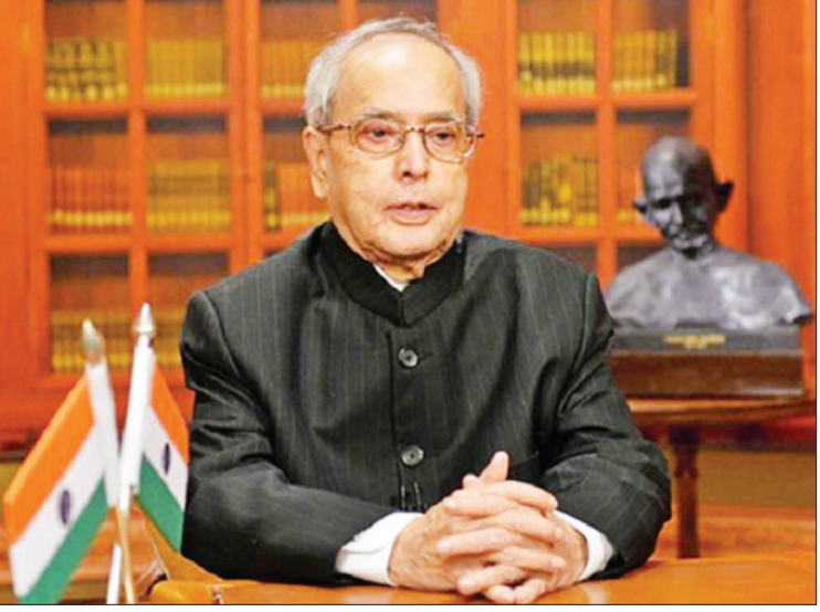
အိန္ဒိယသမ္မတဟောင်း ပါရာနက်ဘ်မူခါဂျီ

မူခါဂျီသည် ၎င်းမှာ ကိုဗစ်-၁၉ ရောဂါပိုး စမ်းသပ်တွေ့ရှိမှုကို ဩဂုတ် ၁၀ ရက်က လူမှု မီဒီယာမှတစ်ဆင့် ကြေညာခဲ့သည်။ ပြီးခဲ့ သည့်သီတင်းပတ်က မိမိနှင့် ထိတွေ့ဆက်ဆံခဲ့ သည့် လူများကို သီးခြားခွဲခြားပြီး ကိုဗစ်-၁၉ ရောဂါပိုး ရှိ မရှိ စမ်းသပ်စစ်ဆေးမှုခံယူကြရန် တောင်းဆိုထားကြောင်း မူခါဂျီက ၎င်း၏ တွစ်တာစာမျက်နှာတွင် ရေးသားဖော်ပြ ထားသည်။