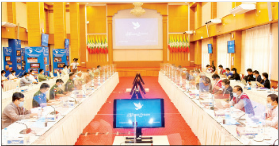
စာချုပ် အကောင်အထည်ဖော်မှုဆိုင်ရာ ညှိနှိုင်းအစည်း အဝေး (JICM) အကြံပြုညှိနှိုင်းအစည်းအဝေး တတိယနေ့ကို ဩဂုတ် ၁၂ ရက်တွင် ဆက်လက်ကျင်းပသွားမည်ဖြစ်ကြောင်း သိရသည်။ သတင်းစဉ်

ယနေ့အစည်းအဝေးတွင် (၉) ကြိမ်မြောက် JICM အစည်းအဝေးသို့ တင်ပြမည့် နှစ်ဖက်အဆိုပြုချက်များ၊ ပြည်ထောင်စုငြိမ်းချမ်းရေးညီလာခံ-(၂၁) ရာစုပင်လုံ စတုတ္ထအစည်းအဝေးဆိုင်ရာ ကိစ္စရပ်များနှင့် အထွေထွေ ကိစ္စရပ်များကို ဆွေးနွေးခဲ့ကြသည်။ တစ်နိုင်ငံလုံး ပစ်ခတ်တိုက်ခိုက်မှုရပ်စဲရေး သဘောတူ