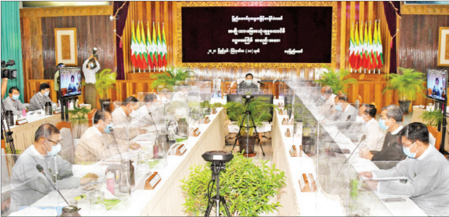
ဒုတိယသမ္မတ ဦးဟင်နရီဗန်ထီးယူ အမျိုးသားမြေအသုံးချမှုကောင်စီ၏ ပဉ္စမအကြိမ်အစည်းအဝေးတွင် အမှာစကားပြောကြားစဉ်။

နေပြည်တော် ဩဂုတ် ၁၁ အမျိုးသားမြေအသုံးချမှုကောင်စီ၏ ပဉ္စမ အကြိမ်အစည်းအဝေးကို ယနေ့မနန်းလွဲ ၁ နာရီ တွင် နေပြည်တော်ရှိ သယံဇာတနှင့် သဘာဝ ပတ်ဝန်းကျင်ထိန်းသိမ်းရေး ဝန်ကြီးဌာန သစ်တောဦးစီးဌာန အင်ကြင်းခန်းမ၌ ကျင်းပ ရာ အမျိုးသားမြေအသုံးချမှုကောင်စီဥက္ကဋ္ဌ ဒုတိယသမ္မတဦးဟင်နရီဗန်ထီးယူ တက်ရောက် အမှာစကားပြောကြားသည်။