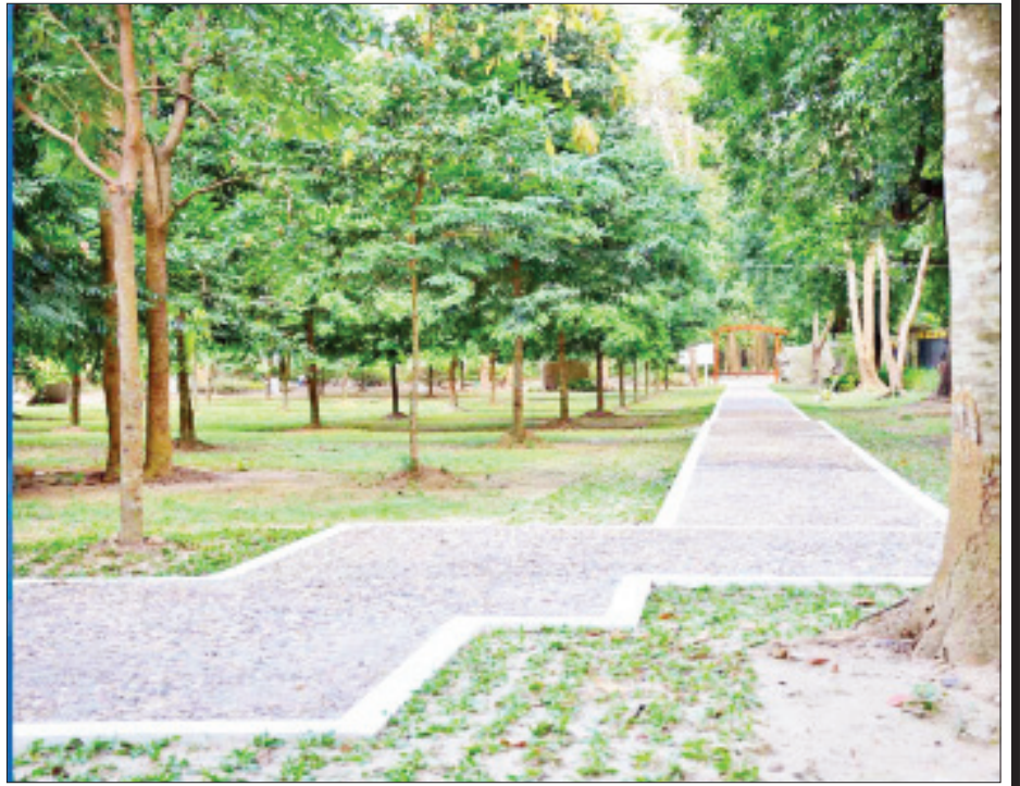
ရန်ကုန်တက္ကသိုလ်၏ ကံကော်တော။

ထို့အတူ အဆောင်တွေကလည်း ပဲခူးဆောင်၊ အင်းဝဆောင်၊ ဒဂုံဆောင်၊ ရာမညဆောင်၊ အင်းလျားဆောင်၊ မာလာဆောင်၊ ပင်းယဆောင်၊ ပြည်၊ သထုံဆောင်၊ သီရိဆောင်၊ စစ်ကိုင်းဆောင်၊ ရွှေဘိုဆောင်၊ တကောင်းဆောင်၊ ဝေသာလီဆောင်၊ မန္တလေးဆောင်၊ တောင်ငူဆောင် စတဲ့ ကျွန်မတို့ မြန်မာပြည်ကြီးရဲ့ တိုင်းဒေသကြီးနဲ့ ပြည်နယ်အသီးသီးရဲ့ အဓိကအမည်နာမတွေကို မှည့်ခေါ်ထားတာဟာ ဘယ်လောက်ချစ်စရာကောင်းလိုက်ပါလဲ။ လမ်းနားမည်တွေကျတော့ရော အမိပတ်လမ်း၊ စစ်ကိုင်းလမ်း၊ ပုဂံလမ်းတို့။ ဘယ်လောက် ကဗျာဆန်လိုက်ပါသလဲ။ ‘အမိပတ်လမ်းမပေါ်---တူစုံတဲ့လို့