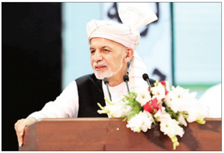
အာဖဂန်နစ္စတန်သမ္မတ အာရှတ်ဂါနီ