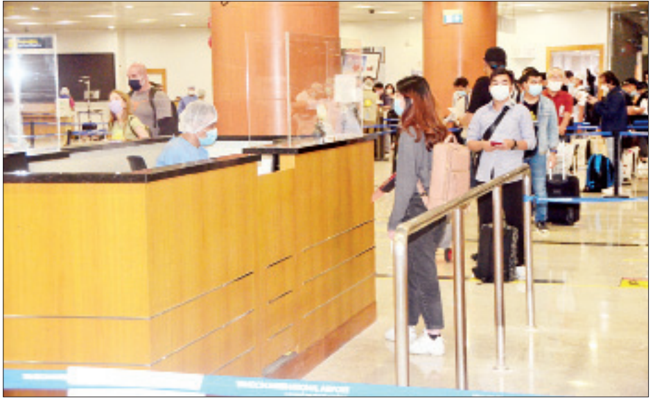
ကိုရီးယားသမ္မတနိုင်ငံမှတစ်ဆင့် ပြန်လည်ရောက်ရှိလာသည့် မြန်မာနိုင်ငံသားများအား ရန်ကုန်အပြည်ပြည်ဆိုင်ရာ လေဆိပ်၌ တွေ့ရစဉ်။

နေပြည်တော် ဩဂုတ် ၁၁ နိုင်ငံတကာခရီးသည်တင် လေယာဉ်များပျံသန်းမှု ယာယီ ရပ်ဆိုင်းထားခြင်းကြောင့် စင်ကာပူနိုင်ငံတွင် အခက်အခဲ ကြုံတွေ့နေရသည့် မြန်မာနိုင်ငံသား ၁၅၀ အား (၁၃) ကြိမ်မြောက် မြန်မာအမျိုးသားလေကြောင်း(MNA) ကယ်ဆယ်ရေးလေယာဉ်ဖြင့် ပြန်လည်ခေါ်ဆောင်ခဲ့ရာ ယနေ့ညနေပိုင်းတွင်လည်းကောင်း၊ နိုင်ငံအရပ်ရပ်တွင် အခက်အခဲကြုံတွေ့နေရသည့် မြန်မာနိုင်ငံသား ၉၇ ဦးအား ကိုရီးယားသမ္မတနိုင်ငံမှတစ်ဆင့် (၁၇)ကြိမ်မြောက် မြန်မာ အပြည်ပြည်ဆိုင်ရာ လေကြောင်း(MAI) ကယ်ဆယ် ရေးလေယာဉ်ဖြင့် ပြန်လည်ခေါ်ဆောင်ခဲ့ရာ ယနေ့ ညပိုင်း တွင်လည်းကောင်း ရန်ကုန်အပြည်ပြည်ဆိုင်ရာ လေဆိပ်သို့ အဆင်ပြေချောမွေ့စွာ အသီးသီးပြန်လည်ရောက်ရှိကြ သည်။ ၎င်းတို့ ရန်ကုန်အပြည်ပြည်ဆိုင်ရာလေဆိပ်သို့ ရောက်ရှိချိန်တွင် လူဝင်မှုကြီးကြပ်ရေး၊ ကျန်းမာရေးစစ်ဆေး ရေးနှင့် ၂၁ ရက်တာ အသွားအလာကန့်သတ်နေထိုင်ရေး တို့ကို အလုပ်သမား၊ လူဝင်မှုကြီးကြပ်ရေးနှင့် ပြည်သူ့ အင်အားဝန်ကြီးဌာန၊ ကျန်းမာရေးနှင့်အားကစားဝန်ကြီး ဌာနနှင့် စာမျက်နှာ ၁၈ ကော်လံ ၁ သို့ ❖