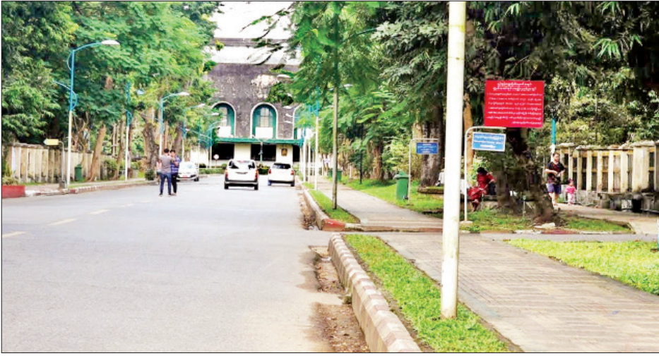
ရန်ကုန်တက္ကသိုလ်၏ အမိပတ်လမ်းမကြီး။

‘ငါလည်း ဆယ်တန်းအောင်ရင် အဲဒီတက္ကသိုလ်ကြီးကို တက်ဖြစ်အောင်တက်မယ်’လို့ ကျွန်မရင်ထဲမှာ ကြိုးဝါးခဲ့ဖူးတယ်။ နောက်ပြီး အမိပတ်လမ်းကို အစအဆုံးလျှောက်မယ်။ ကံကော်ပွင့်တွေ ကောက်မယ်။