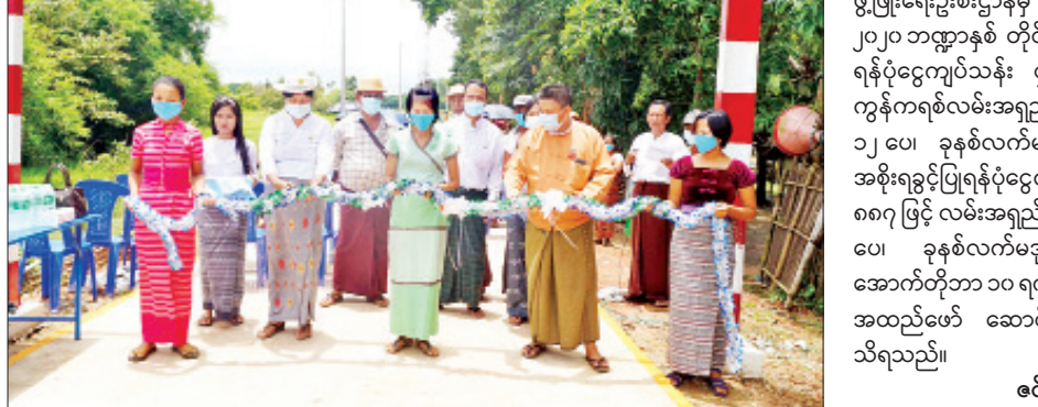
ဇင်မင်းထိုက်(ထန်းတပင်)

အဆင်ပြေလွယ်ကူစေရေးအတွက် ရန်ကုန်- ပုသိမ်ကားလမ်းမကြီးမှ ပရွတ်ကျေးရွာအဝင် ကွန်ကရစ်လမ်းခင်းခြင်းကို မြို့နယ်ကျေးလက် လမ်းဖွံ့ဖြိုးရေးဦးစီးဌာနမှ တင်ဒါခန့်ဖြင့် ဆောင်ရွက်ခဲ့ခြင်းဖြစ်ကာ ၂၀၁၉-၂၀၂၀ ဘဏ္ဍာ နှစ် တိုင်းဒေသကြီးအစိုးရ ခွင့်ပြုရန်ပုံငွေ ကျပ်သန်း ၂၅၆ ဒသမ ၉၀၀ ဖြင့် ကွန်ကရစ် လမ်းအရှည် ပေ ၃၇၀၀၊ အကျယ် ၁၂ ပေ၊ ခုနစ် လက်မအထိ ရှုမဝမေကုမ္ပဏီလီမိတက်က ဇန်နဝါရီ ၁၇ ရက်မှစတင်၍ ဆောင်ရွက်ခဲ့ခြင်း ဖြစ်သည်။ ယင်းတင်ကျေးရွာ ယင်းတင်- ရခိုင်စုလမ်းကို မြို့နယ်ကျေးလက်လမ်း ဖွံ့ဖြိုးရေးဦးစီးဌာနမှ တာဝန်ယူကာ ၂၀၁၉- ၂၀၂၀ ဘဏ္ဍာနှစ် တိုင်းဒေသကြီးအစိုးရခွင့်ပြု ရန်ပုံငွေကျပ်သန်း ၄၀၇ ဒသမ ၅၆၉ ဖြင့် ကွန်ကရစ်လမ်းအရှည် ပေ ၆၀၀၀၊ အကျယ် ၁၂ ပေ၊ ခုနစ်လက်မအထိ ပြည်ထောင်စု အစိုးရခွင့်ပြုရန်ပုံငွေကျပ်သန်း ၈၉ ဒသမ ၈၈၇ ဖြင့် လမ်းအရှည် ပေ ၁၃၂၀၊ အကျယ် ၁၂ ပေ၊ ခုနစ်လက်မအထိကို ၂၀၁၉ ခုနှစ် အောက်တိုဘာ ၁၀ ရက်မှစတင်၍ အကောင် အထည်ဖော် ဆောင်ရွက်ခဲ့ခြင်းဖြစ်ကြောင်း သိရသည်။