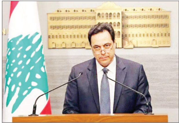
လက်ဘနွန်ဝန်ကြီးချုပ် ဟတ်ဆန်ဒီယက်