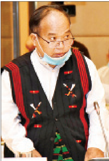
“နာဂ” ကိုယ်ပိုင်အုပ်ချုပ်ခွင့်ရဒေသ ဦးစီးအဖွဲ့ဥက္ကဋ္ဌ ဦးကေဆိုင်

ကိုယ်ပိုင်အုပ်ချုပ်ခွင့်ရ တိုင်း၊ ဒေသ ဦးစီးအဖွဲ့ ဥက္ကဋ္ဌများသည် မိမိတို့ဒေသ၏ အခြေအနေများကို အကောင်းဆုံးဖြစ်အောင် ဆောင်ရွက်ပေးရမည်ဖြစ်ပါကြောင်း။ ဒေသ၏