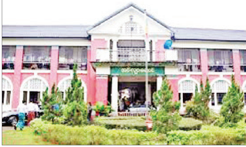
ရန်ကုန်တက္ကသိုလ် အင်းလျားဆောင်။

သလို အဓိကဇာတ်လိုက်တစ်ဦးလည်း ဖြစ်သည်။ ကံကောင်းတာဟု ခေါ်ရလောက်အောင် တက္ကသိုလ်နဲ့ ကံကောင်းတာ ခွဲခြား၍မရပေ။ ကံကောင်းတာလည်းတက္ကသိုလ်၊ တက္ကသိုလ်ဟာလည်းကံကောင်းတာပါပင်။ မြန်မာစာကို အဆင့်မြင့်ဘာသာရပ်တစ်ခုအနေနဲ့