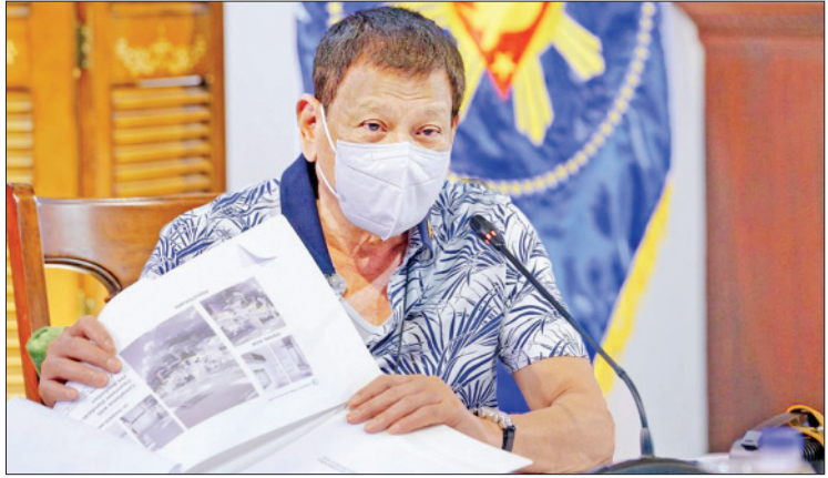
ဖိလစ်ပိုင်သမ္မတ ရော့ဒရီဂိုဒူတာတေး

ကိုးကား-ဘန်ကောက်ပို့စံ၊ ဘာသာပြန်-ကျော်ထိုက်စိုး