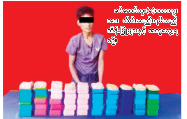
ခင်မောင်ထွေး(ခ)ဝလာတူး အား သိမ်းဆည်းရမိသည့် တိန်းဖြူများနှင့် အတူတွေ့ရ စဉ်။