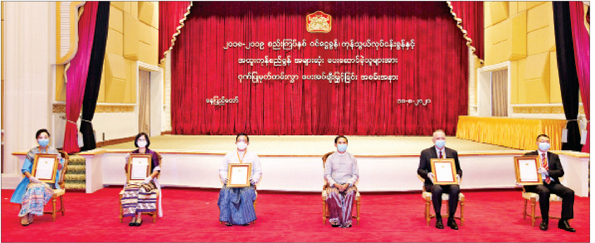
နိုင်ငံတော်သမ္မတ ဦးဝင်းမြင့် ၂၀၁၈ - ၂၀၁၉ ဧည့်သည်အတွက် ဝင်ငွေခွန်အများဆုံးပေးဆောင်ခဲ့ကြသော ပုဂ္ဂလိကပိုင် နိုင်ငံခြားကုမ္ပဏီများမှ တာဝန်ရှိသူများနှင့်အတူ စုပေါင်းမှတ်တမ်းတင်ဓာတ်ပုံရိုက်စဉ်။