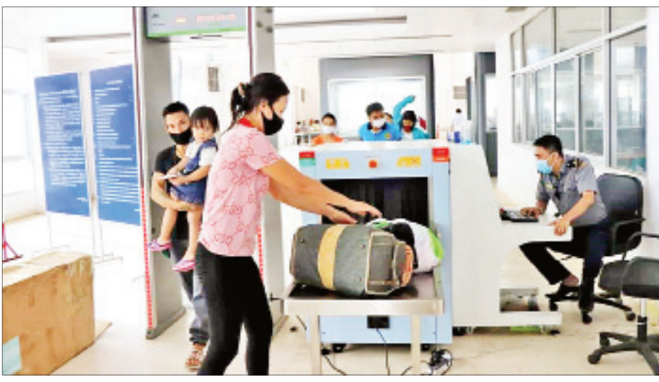
ဇူလိုင် ၃၁ ရက်အထိ ၁၈၅၉၇ ဦး၊ ဩဂုတ် ၁ ရက်မှ ယနေ့ အထိ ၆၉၂၈ ဦး စုစုပေါင်း ၆၅၄၃၅ ဦးတို့ ပြန်လည် ဝင်ရောက်ခဲ့ပြီး ဖြစ်သည်။ ယနေ့ ပြန်လည်ဝင်ရောက်သူများ မှာ တိုင်းဒေသကြီး၊ ပြည်နယ်များမှ အမျိုးသား ၃၅၂ ဦး၊ အမျိုးသမီး ၂၃၆ ဦး စုစုပေါင်း ၅၈၈ ဦးဖြစ်ပြီး သက်ဆိုင် ရာ အသွားအလာ ကန့်သတ် စောင့် ကြည့်ရေးစခန်းများသို့ ပို့ဆောင်ပေးခဲ့ ကြောင်း သိရသည်။ ထိန်းလင်းအောင်(ပြန်/ဆက်)

မြဝတီ ဩဂုတ် ၁၀ ထိုင်းနိုင်ငံမှ မြန်မာရွှေ့ပြောင်းလုပ်သား ၅၈၈ ဦးသည် မြဝတီမြို့ မြန်မာ-ထိုင်း အမှတ် (၂) ချစ်ကြည်ရေး တံတားမှတစ်ဆင့် ယနေ့ဆက်လက် ဝင်ရောက်လာကြောင်း သိရသည်။ ဆောင်ရွက်လျက်ရှိ ပြန်လည် ဝင်ရောက်လာသူများ အား တာဝန်ရှိသူများက ကြိုဆိုကြပြီး ကျန်းမာရေးစစ်ဆေးမှုနှင့် အခြား သော လိုအပ်ချက်များကို ဆောင်ရွက် နိုင်ရန်အတွက် သက်ဆိုင်ရာ ခရိုင်/ မြို့နယ်မှ တာဝန်ရှိသူများက ကြီးကြပ် ဆောင်ရွက်လျက်ရှိကြောင်း သိရ သည်။ ပြန်လည်ဝင်ရောက် ပြန်လည် ဝင်ရောက်လာသူများ အနေဖြင့် မေ ၁ ရက်မှ မေ ၃၁ ရက် အထိ ၁၁၆၈၀၊ ဇွန် ၁ ရက်မှ ဇွန် ၃၀ ရက်အထိ ၂၅၃၃၈ ဦး၊ ဇူလိုင် ၁ ရက်မှ