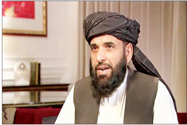
တာလီဘန်ပြောရေးဆိုခွင့်ရှိသူ ဆူဟေးလ်ရှာဟီး

များကို အချိန်မီဆောင်ရွက်ရေး အပြည့်အဝကတိကဝတ်ပြု သိရသည်။ ရန်လည်း အလျှင်နိုင်ငံများက တောင်းဆိုထားကြောင်း ကိုးကား-ဂျကာတာပိုစ်၊ ဘာသာပြန်-အလင်းသစ်