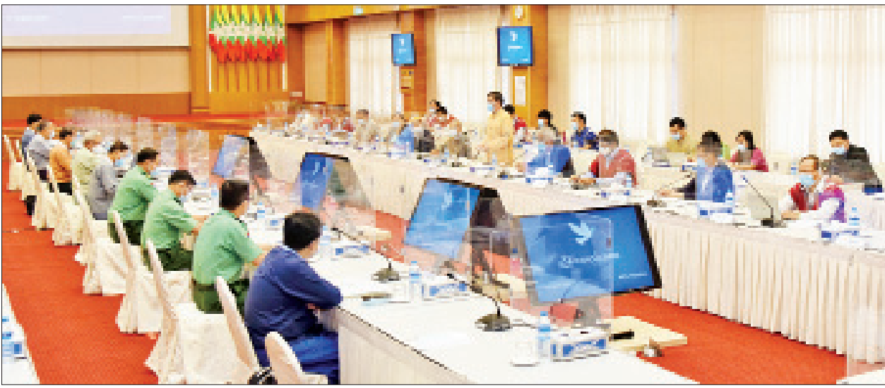
NCA-S EAO ညှိနှိုင်းရေးအဖွဲ့ခေါင်းဆောင် စစ်ဦးစီးဌာန ဆွေးနွေးပြောကြားစဉ်။

တွင် ဆက်လက်ညှိနှိုင်းမည်ဖြစ်ပါ ကြောင်း၊ ဒီမိုကရေစီနှင့် ဖက်ဒရယ်စနစ် ကိုအခြေခံသည့် ပြည်ထောင်စု တည်ဆောက်ရေးဆိုင်ရာ လမ်းညွှန် အခြေခံမူအနေဖြင့် အချက်နှစ်ချက်ကို သဘောတူညီထားပြီးဖြစ်ပါကြောင်း၊ ဆက်လက်ဆွေးနွေးရန် ကျန်ရှိနေသည့် နှစ်ဖက်အဆိုပြုချက်များကို ယနေ့ အစည်းအဝေးတွင် အပြီးသတ်ညှိနှိုင်း ကြမည်ဖြစ်ပြီး ဩဂုတ် ၁၃ ရက်တွင် ကျင်းပမည့် (၉) ကြိမ်မြောက် JICM အစည်းအဝေးတွင် အတည်ပြုမည်ဖြစ်ပါ ကြောင်း။ အစိုးရ၊ လွှတ်တော်၊ တပ်မတော် ကိုယ်စားလှယ်များနှင့် တိုင်းရင်းသား လက်နက်ကိုင် အဖွဲ့အစည်းကိုယ်စား လှယ်များသည် တတိယအကြိမ် (၂၀) ရာစု ပင်လုံညီလာခံပြီးနောက် နှစ်နှစ် ကျော်ကာလအတွင်း အလွတ်သဘော နှင့် တရားဝင်တွေ့ဆုံမှုများစွာ ပြုလုပ် ခဲ့ကြပါကြောင်း၊ နှစ်ဦးနှစ်ဖက် ကျေကျေ လည်လည်ဖြစ်စေရန် အချိန်ယူကာ ဆွေးနွေးညှိနှိုင်းခဲ့ကြပြီး ယခုကဲ့သို့ သဘောတူညီချက်များ ရယူနိုင်သည့် အခြေအနေ အခင်းအကျင်းမျိုးကို ရောက်ရှိလာခြင်းဖြစ်ပါကြောင်း၊ ယင်း အတွက် ငြိမ်းချမ်းရေးလုပ်ငန်းစဉ် အပေါ် စိတ်ရင်းစေတနာ အပြည့်အဝ ဖြင့် ပါဝင်ဆောင်ရွက်ခဲ့ကြသူများကို NRCPC ကိုယ်စား တန်ဖိုးထား