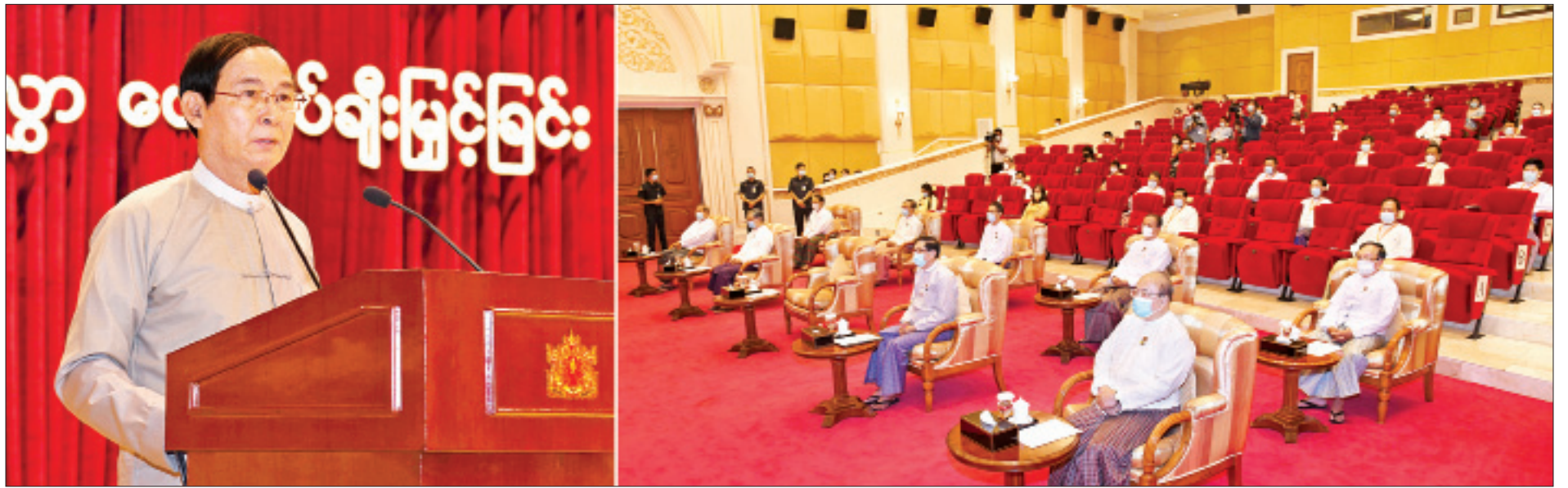
နိုင်ငံတော်သမ္မတ ဦးဝင်းမြင့် ၂၀၁၈ - ၂၀၁၉ စည်းကြပ်နှစ် ဝင်ငွေခွန်၊ ကုန်သွယ်လုပ်ငန်းခွန်နှင့် အထူးကုန်စည်ခွန် အများဆုံးပေးဆောင်ခဲ့သူများအား ဂုဏ်ပြုမှတ်တမ်းလွှာပေးအပ်ချီးမြှင့်ခြင်း အခမ်းအနားတွင် မိန့်ခွန်းပြောကြားစဉ်။

ဝ ရှေးဦးမှ ကျေနပ်စွာလိုက်နာပြီး အခွန်ထမ်းဆောင်ခဲ့ကြသူများကိုလည်း အထူးကျေးဇူးတင်ပါကြောင်း၊ နောင်တွင်လည်း စီးပွားရေးလုပ်ငန်းများ ပိုမိုတိုးတက်ကောင်းမွန်စေရန်နှင့် မိမိတို့တိုင်းပြည်နှင့် ပြည်သူများကို အကျိုးပြုနိုင်ကြပါစေဟု ဆန္ဒပြုဆုမွန်ကောင်းတောင်းပါကြောင်း။ မိမိတို့အစိုးရအနေဖြင့် ပြည်သူကို ဗဟိုပြုပြီး အားလုံးပါဝင်နိုင်သော စဉ်ဆက်မပြတ် ဖွံ့ဖြိုးတိုးတက်မှုရှိစေရန်ဆိုသည့် ရည်ရွယ်ချက်ဖြင့် စီးပွားရေးမူဝါဒများ ချမှတ်ဆောင်ရွက်လျက် ရှိရာတွင် “နိုင်ငံတော်၏ဝင်ငွေတိုးတက်ရရှိရန် အကျိုးသက်ရောက်မှုရှိပြီး မျှတသော အခွန်စနစ်ထူထောင်၍ ပြည်သူများ၏ အခွင့်အရေးနှင့် ပစ္စည်းဥစ္စာပိုင်ဆိုင်ခွင့်ကို ဥပဒေများ၊ လုပ်ထုံးလုပ်နည်းများပြဋ္ဌာန်းလျက် အကာအကွယ်ပေးရန်”ဟု အခွန်နှင့်ပတ်သက်ပြီး မူဝါဒချမှတ် ဆောင်ရွက်လျက်ရှိပါကြောင်း။