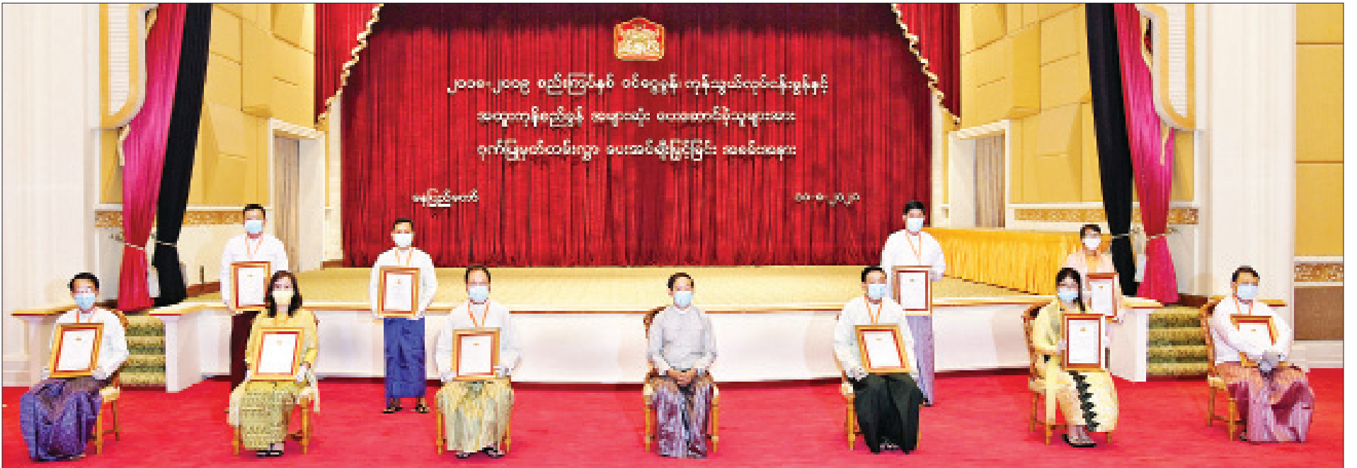
နိုင်ငံတော်သမ္မတ ဦးဝင်းမြင့် ၂၀၁၈ - ၂၀၁၉ စည်းကြပ်နှစ်အတွက် ဝင်ငွေခွန်အများဆုံးပေးဆောင်ခဲ့ကြသော မြန်မာကုမ္ပဏီများမှ လုပ်ငန်းရှင်များနှင့်အတူ စုပေါင်းမှတ်တမ်းတင်ဓာတ်ပုံရိုက်စဉ်။