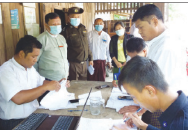
မယ်စု ဩဂုတ် ၁၀ ကယားပြည်နယ် မယ်စုမြို့နယ်၌ ဇူလိုင် ၂၅ ရက်မှစ၍ ရပ်ကွက်/ကျေးရွာ အုပ်စု ရွေးကောက်ပွဲကော်မရှင်အဖွဲ့ခွဲများ၌ မဲဆန္ဒရှင်စာရင်းများကို ကပ်ထား