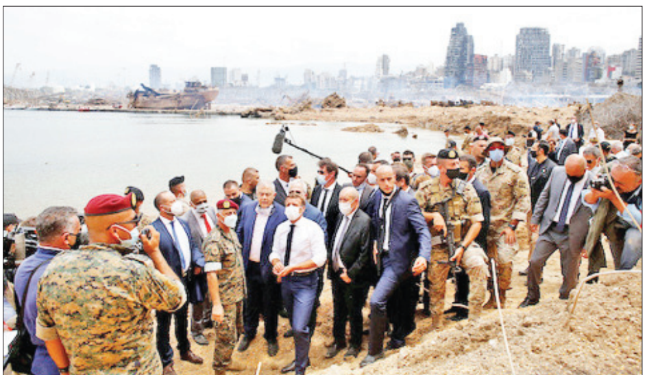
ပြင်သစ်သမ္မတ မက်ရွန် ဘေရုတ်ဆိပ်ကမ်းရှိ ပေါက်ကွဲမှုဖြစ်ပွားရာနေရာသို့ သွားရောက်ခဲ့စဉ်။

ထို့ကြောင့် လက်ဘနွန်နိုင်ငံ အာဏာပိုင်များအနေဖြင့် နိုင်ငံ၏ စီးပွားရေးနှင့် တာဝန်ပေးဆိုင်ရာ ပြန်လည်ဦးမော့လာစေရေးအတွက် ကာလရှည်ကြာ ထောက်ပံ့မှုများကို ဆောင်ရွက်ရန်အလို့ငှာ အစီအမံများနှင့် ပြုပြင်ပြောင်းလဲမှု