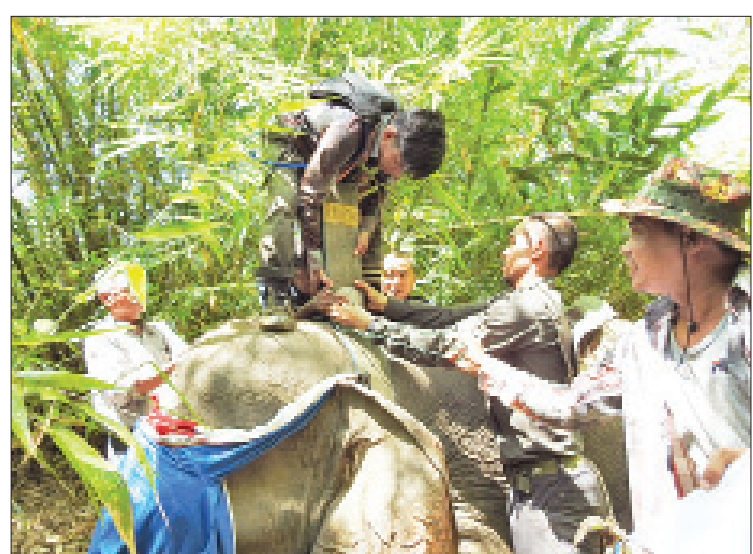
ဘုတ်ပြင်းမြို့နယ် လေညာကြိုးပိုင်းအတွင်း တောဆင်ရိုင်းအား လည်ပတ်တပ်ဆင်နေမှု မြင်ကွင်းကို တွေ့ရစဉ်။ သော ကျေးရွာများ၌ ကျေးရွာအုပ်ချုပ်ရေးမှူး ရှောင်ရှားနိုင်စေရန် ဆောင်ရွက်သွားမည်ဖြစ် များ၊ ရပ်မိရပ်ဖများ၊ ဒေသခံများ၊ အရပ်ဘက် ကြောင်း သိရသည်။ အဖွဲ့အစည်းများနှင့် ကြိုတင်ညှိနှိုင်းတိုင်ပင်၍ သတင်း-ပိန်းဇလုပ်သိန်းညွှန် လူနှင့်ဆင် ပဋိပက္ခဖြစ်စဉ်များကို ကြိုတင် ဓာတ်ပုံ-FFI

အောက်သာ ကျန်ရှိပါတယ်။ ပဋိပက္ခ ပိုပြီးဖြစ်လာ “လူတွေက တောထဲမှာနေထိုင်ပြီး တောင်ယာခုတ်ထွင်ခြင်း၊ စိုက်ခင်းများစွာကို လုပ်ကိုင်တွေ့နဲ့ စီးပွားဖြစ် စက်မှုသီးနှံစိုက်ခင်းတွေ ဖော်ဆောင်လာကြလို့ သစ်တောဧရိယာရှားပါးလာကာ တောဆင်တွေအတွက် စားကျက်မြေများ နည်းပါးလာလို့ သူတို့တွေဟာ ဒေသခံတွေစိုက်ပျိုးထားတဲ့ ဥယျာဉ်၊ စိုက်ခင်းတွေကို လာရောက်စားသောက်ရာမှ လူနှင့်ဆင် ပဋိပက္ခဖြစ်ရပ်တွေ ပိုပြီးဖြစ်လာရတယ်။ ဒါကြောင့် တောဆင်ရိုင်းတွေကို မေ့ဆေးပေးပြီး တည်နေရာပြလည်ပတ်တွေ တပ်ဆင်ကာ စောင့်ကြည့်လေ့လာမှုတွေ ဆောင်ရွက်နေတာ ဖြစ်ပါတယ်”ဟု အပြည်ပြည်ဆိုင်ရာတောရိုင်းတိရစ္ဆာန်နှင့် သဘာဝအပင်အဖွဲ့ (FFI) (မြန်မာနိုင်ငံအစီအစဉ်)မှ တနင်္သာရီ စီမံကိန်းမန်နေဂျာ ဒေါက်တာနေမျိုးရွှေက ပြောသည်။ ထိုသို့စောင့်ကြည့်လေ့လာမှုမှ ရရှိလာသောအချက်အလက်များကိုအခြေခံ၍ လူနှင့်ဆင် ပဋိပက္ခအများဆုံး ရင်ဆိုင်ကြုံတွေ့နေရ