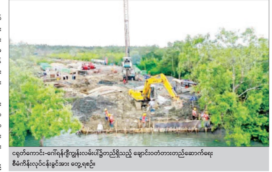
ငရုတ်ကောင်း-ဂေါ်ရန်ဂျီကျွန်းလမ်းပေါ်၌တည်ရှိသည့် ချောင်းဝတံတားတည်ဆောက်ရေးစီမံကိန်းလုပ်ငန်းခွင်အား တွေ့ရစဉ်။

သတင်း-ပွင့်သစ္စာ