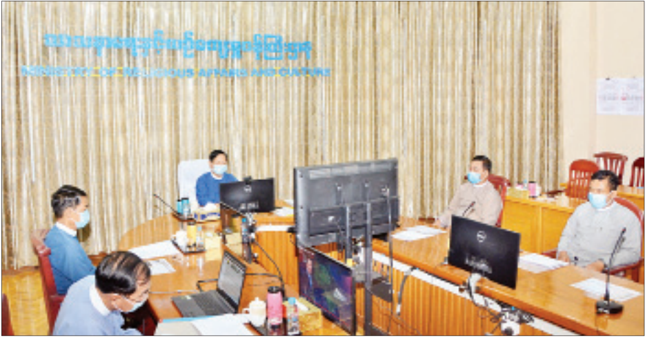
Video Conferencing ဖြင့် တက်ရောက်ခဲ့ကြပြီး ကုလသမဂ္ဂအတွင်းရေးမှူးချုပ်ဟောင်း မစ္စတာ ဘန်ကီမွန်းနှင့် ကမ္ဘောဒီးယားနိုင်ငံ ဝန်ကြီးချုပ် ချပ်ဟောင်း မစ္စတာ ဘန်ကီမွန်းနှင့် နိုင်ငံအသီးသီးမှ နိုင်ငံခေါင်းဆောင်များနှင့် ဝန်ကြီးချုပ်ဟောင်းများ တက်ရောက်၍ အမှာစကားပြောကြားကြကြောင်း သိရသည်။ သတင်းစဉ်

နေပြည်တော် ဩဂုတ် ၉ Universal Peace Federation-Asia Pacific အဖွဲ့က International Summit Council for Peace (ISCP) မှတစ်ဆင့် Interdependence, Mutual Prosperity and Universal Values မြှင့်တင်မှုများကို ကိုရီးယားနိုင်ငံမှဦးဆောင်၍ တစ်ကမ္ဘာလုံးဆိုင်ရာ Rally of Hope အစီအစဉ်ကို Video Conferencing ဖြင့် ယနေ့ နံနက်ပိုင်းတွင်ကျင်းပရာ သာသနာရေးနှင့် ယဉ်ကျေးမှုဝန်ကြီးဌာန ပြည်ထောင်စုဝန်ကြီးသူရဦးအောင်ကို၊ ဒုတိယဝန်ကြီး ဦးကြည်မင်းနှင့် တာဝန်ရှိသူများ ပါဝင်တက်ရောက် ဆွေးနွေးကြသည်။ အဆိုပါအစီအစဉ်သို့ အာရှပစိဖိတ်ဒေသနိုင်ငံများမှကိုယ်စားလှယ်များက