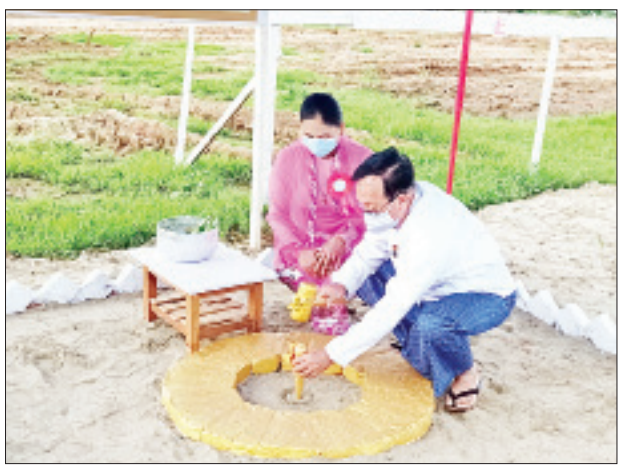
ပြည်ထောင်စုဝန်ကြီး ဦးဟန်ဇော် ပန္နက်တော်တင်ပေးစဉ်။

ပါရမီပညာရိပ်သာတို့တွင် အိမ်ခန်းပေါင်း ၁၄၄၀ ခန့်အား အကောင် အထည်ဖော်ဆောင်ရွက်ပြီးနောက် ကျန်ရှိနေသောအိမ်ခန်းများကို တိုင်းဒေသ ကြီးနှင့် ပြည်နယ် ၁၃ ခုတွင် ပညာရိပ်သာအိမ်ရာဝင်း ၁၃ ခုဖြင့် ဖြန့်ခွဲ၍ ဆက်လက်အကောင်အထည်ဖော် ဆောင်ရွက်ခြင်းဖြစ်သည်။ ပညာရိပ်သာအိမ်ရာဝင်းတစ်ခုတွင် အိမ်ခန်း ၁၆၀ ၊ Community Center