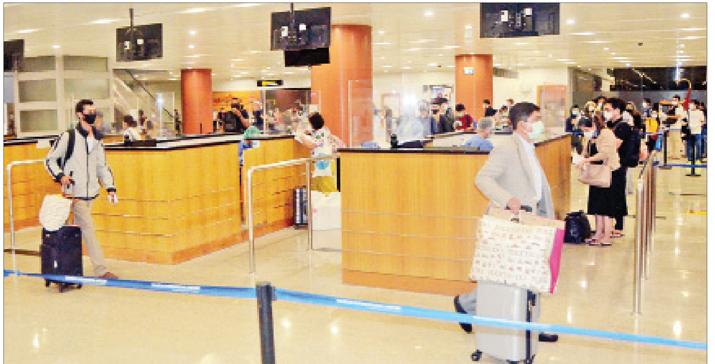
ထိုင်းနိုင်ငံမှ ပြန်လည်ရောက်ရှိလာသည့် မြန်မာနိုင်ငံသားများအား ရန်ကုန်အပြည်ပြည်ဆိုင်ရာလေဆိပ်၌ တွေ့ရစဉ်။