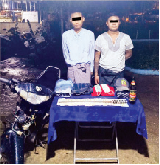
ချမ်းငြိမ်း(ခ)ခေါလေး၊ ဝဏ္ဏ(ခ)သက်ပိုင်ထွန်းနှင့် သက်သေခံပစ္စည်းများ ကိုတွေ့ရစဉ်။