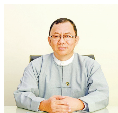
မြန်မာနိုင်ငံတော်ဗဟိုဘဏ် ငွေကြေးစီမံခန့်ခွဲမှုဌာန ညွှန်ကြားရေးမှူးချုပ် ဦးဝင်းမြင့်

ကြမ်းတမ်းမှုရှိကြောင်း တွေ့ရှိရပါတယ်။ ငွေစက္ကူနံပါတ်ကို မြန်မာအက္ခရာ မြန်မာဂဏန်းနဲ့ အလျားလိုက်၊ အင်္ဂလိပ်အက္ခရာ အင်္ဂလိပ်ဂဏန်းနဲ့ ဒေါင်လိုက် ရိုက်နှိပ်ထားပါတယ်။ ငွေစက္ကူရဲ့ မျက်နှာစာဘက်ရှိ ဘယ်/ညာ အစွန်းတွေမှာ အမြင်အာရုံအားနည်းသူတွေအတွက် လက်နဲ့ထိတွေ့စမ်းသပ်ကြည့်ရင် အာရုံခံသိရှိနိုင်တဲ့ ဖောင်းကြွလှိုင်းတိုမျိုးကြောင်းငယ်ကိုကြောင်းစီ ရိုက်နှိပ်ထားပါတယ်။ ငွေစက္ကူပုံစံသစ်ကို အလင်းရောင်မှာထောင်ကြည့်ရင် ငွေစက္ကူမျက်နှာစာဘက်ဗိုလ်ချုပ်အောင်ဆန်းရုပ်ပုံရဲ့ လက်ဝဲဘက်မှာ ဗိုလ်ချုပ်အောင်ဆန်းရုပ်ပုံနဲ့ ငွေစက္ကူရဲ့ တန်ဖိုးဂဏန်း ၅၀၀ ရေစာကို ရှင်းလင်းစွာတွေ့မြင်နိုင်ပါတယ်။ ငွေရောင်လုံခြုံရေးကြိုးကို တစ်ဝက်ဖုံး တစ်ဝက်ပေါ် ဒေါင်လိုက်ဖြန့်ထားပါတယ်။ ငွေစက္ကူမျက်နှာစာရဲ့ လက်ယာဘက်က မြန်မာစာသား “ငါးရာကျပ်” နဲ့ဘေးနိညိုရောင် ဧရိယာကို ၄၅ ဒီဂရီခန့် တိမ်းစောင်းကြည့်ရင် အင်္ဂလိပ်အက္ခရာ “CBM” ကို တွေ့မြင်နိုင်ပါတယ်။ မေး။ ။ အခုထုတ်ဝေတဲ့ ငွေကျပ် ၅၀၀ တန်ပုံစံသစ်နဲ့ ထုတ်ဝေခဲ့ပြီးတဲ့ ငွေကျပ် ၅၀၀ တန် အရောင်ဆင်တူနေတယ်။ ကွဲပြားခြားလှဲသင့်တယ်လို့ ပြင်ပမှာ ပြောဆိုနေတာတွေအပေါ် ဆွေးနွေးပေးစေလိုပါတယ်။ ဖြေ။ ။ မြန်မာနိုင်ငံမှာ လည်ပတ်သုံးစွဲနေတဲ့ ငွေစက္ကူ