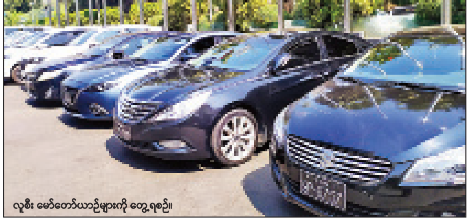
လူစီး မော်တော်ယာဉ်များကို တွေ့ရစဉ်။