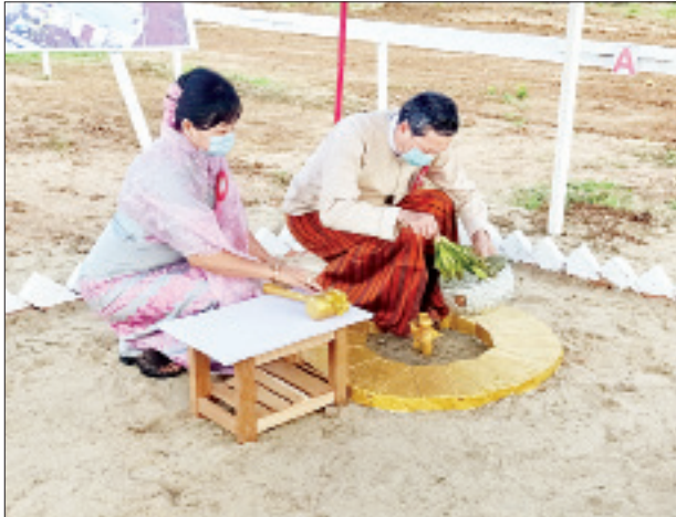
ပြည်ထောင်စုဝန်ကြီး ဒေါက်တာမျိုးသိမ်းကြီး ပန္နက်တော်အား အမွှေးနံ့သာရည် ပက်ဖျန်းပေးစဉ်။

ယနေ့ကျင်းပသည့် မကွေးတက္ကသိုလ်တွင် အကောင်အထည်ဖော် တည်ဆောက်မည့် မကွေးပညာရိပ်သာစီမံကိန်းကို Public Private Partnership (ppp) နည်းလမ်းဖြင့် အကောင်အထည်ဖော် ဆောင်ရွက်ခြင်းဖြစ်ပြီး ရန်ကုန်မြို့ ၌ အဆင့်အတန်းမြှင့်တင်ပေးခြင်း Facilities ပြည့်စုံစွာပါဝင်သော Living Environment ကောင်းမွန်သည့် မင်းဓမ္မပညာရိပ်သာ၊ လှိုင်ပညာရိပ်သာနှင့်