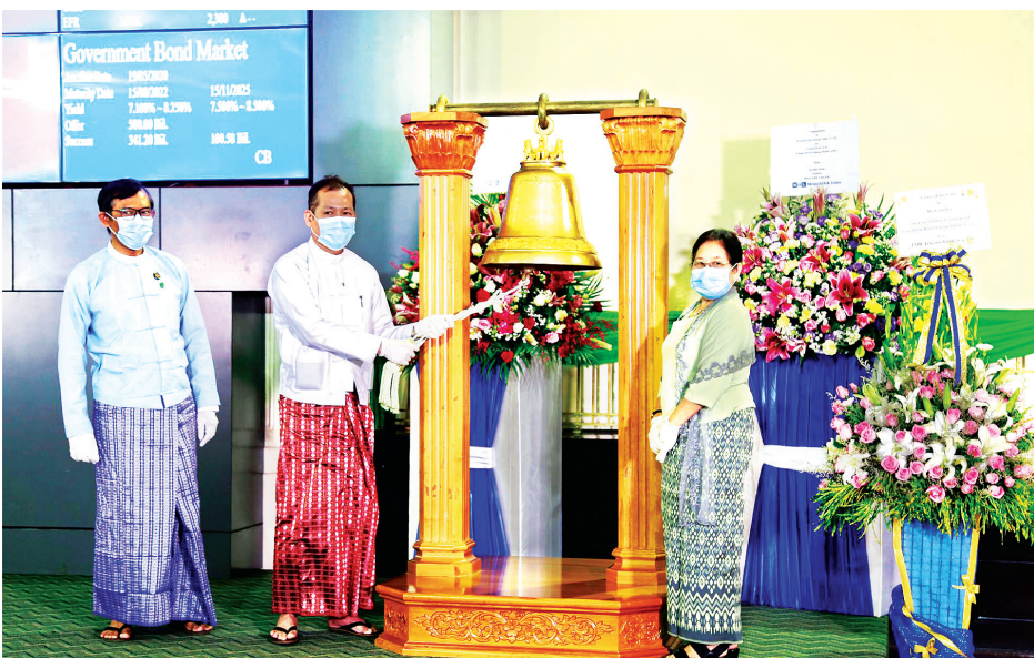
ကိုဗစ်-၁၉ ကာလအတွင်း မြောက်အမေရိကန်စာရင်းဝင်ကုမ္ပဏီဖြစ်လာသည့် EFR ၏ စာရင်းဝင်ခြင်း အခမ်းအနားတွင် ခေါင်းလောင်းတီးခတ်စဉ်။

ယခုအခါမှာ ကမ္ဘာ့အရပ်ရပ်ရှိ နိုင်ငံများစွာတို့တွင် အချို့အချို့သော ကုမ္ပဏီများသည် အကြောင်းအမျိုးမျိုးကြောင့် ပုဂ္ဂလိကပိုင်ကုမ္ပဏီ (Private Company) မှ အများနှင့်သက်ဆိုင်သည့်ကုမ္ပဏီ (Public Company) အဖြစ် ပြောင်းလဲဖွဲ့စည်း၍ အစုရှယ်ယာဈေးကွက်အတွင်းသို့ ဝင်ရောက်လေ့ရှိကြပါသည်။ အင်မတန် လူသိထင်ရှားကြပြီး ကမ္ဘာကျော် ကုမ္ပဏီကြီးများဖြစ်ကြသော ဖျော်ဖြေရေးကုမ္ပဏီတစ်ခုဖြစ်သည့် The Walt Disney (Stock Code - DIS)၊ Google ကုမ္ပဏီကို ပိုင်ဆိုင်ထားသည့် Alphabet Inc. (Stock Code - GOOG)၊ နည်းပညာကုမ္ပဏီတစ်ခုဖြစ်သည့် Apple Inc. (Stock Code - AAPL)၊ ကြော်ငြာကုမ္ပဏီတစ်ခုဖြစ်သည့် Facebook, Inc. (Stock Code - FB)၊ e-Commerce ကုမ္ပဏီတစ်ခုဖြစ်သည့် Amazon (Stock Code - AMZN)၊ နည်းပညာကုမ္ပဏီတစ်ခုဖြစ်သည့် Microsoft Corporation (Stock Code - MSFT)၊ စားသောက်ကုန်ထုတ်လုပ်သည့် ကုမ္ပဏီတစ်ခုဖြစ်သည့် The Coca-Cola Company (Stock Code - KO)၊ နည်းပညာကုမ္ပဏီ တစ်ခုဖြစ်သည့် Alibaba Group Holding Ltd. (Stock Code - BABA) အစရှိသည်တို့သည်လည်း အမေရိကန်နိုင်ငံရှိ New York Stock Exchange (NYSE) ကို အများနှင့်သက်ဆိုင်သည့် ကုမ္ပဏီအဖြစ် ဖွဲ့စည်းတည်ထောင်ပြီးနောက် စာရင်းဝင်ကုမ္ပဏီ (Listed Company) များအဖြစ် အသီးသီးဝင်ရောက်ခဲ့ကြပါသည်။ “ယင်းကုမ္ပဏီများသည် အဘယ်ကြောင့် အများနှင့်သက်ဆိုင်သည့်ကုမ္ပဏီများအဖြစ် ဖွဲ့စည်းတည်ထောင်ပြီးနောက် အစုရှယ်ယာဈေးကွက်အတွင်းသို့ ဝင်ရောက်ခဲ့ကြသနည်း” ဆိုသည့်အချက်မှာ စိတ်ဝင်စားဖွယ်ရာပင်ဖြစ်သည်။