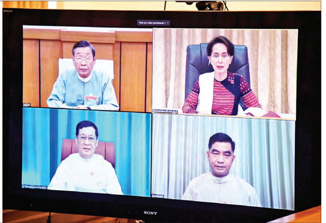
နိုင်ငံတော်၏အတိုင်ပင်ခံပုဂ္ဂိုလ် ဒေါ်အောင်ဆန်းစုကြည် COVID-19 ကာကွယ်၊ ထိန်းချုပ်၊ ကုသရေးကာလအတွင်း ရွေးကောက်ပွဲများ အောင်မြင်စွာကျင်းပနိုင်ရေးအတွက် ကြိုတင်ပြင်ဆင်ဆောင်ရွက်နေမှုများနှင့်စပ်လျဉ်း၍ ပြည်ထောင်စုဝန်ကြီး ဦးသိန်းဆွေ၊ ပြည်ထောင်စုရွေးကောက်ပွဲကော်မရှင်အဖွဲ့ဝင် ဦးမြင့်နိုင်၊ အထွေထွေအုပ်ချုပ်ရေးဦးစီးဌာန ဒုတိယညွှန်ကြားရေးမှူးချုပ် ဦးထက်အောင်တို့နှင့် အပြန်အလှန်ဆွေးနွေးစဉ်။

နိုင်ငံတော်၏အတိုင်ပင်ခံပုဂ္ဂိုလ်မှ ရှေးဦးစွာ Coronavirus Disease 2019 (COVID-19) ကာကွယ်၊ ထိန်းချုပ်၊ ကုသရေး အမျိုးသားအဆင့်ဗဟိုကော်မတီဥက္ကဋ္ဌ၊ နိုင်ငံတော်၏အတိုင်ပင်ခံပုဂ္ဂိုလ်က နှုတ်ခွန်းဆက်အမှာစကားပြောကြားရာ၌ ယနေ့တွင် နိုင်ငံသားများအတွက် များစွာအရေးကြီးသည့် အခြေခံအခွင့်အရေးနှစ်ခုနှင့်ပတ်သက်၍ ဆွေးနွေးမည်ဖြစ်ပါကြောင်း၊ ပထမတစ်ခုသည် ကျန်းမာရေးဖြစ်ပါကြောင်း၊ ပြည်သူတိုင်း ကျန်းမာရေးကောင်းမွန်ရေးသည် မိမိတို့၏ အဓိကတာဝန်ဖြစ်ပါကြောင်း၊ ယင်းသည် ပြည်သူပြည်သားများ၏ရပိုင်ခွင့်ဖြစ်ပါကြောင်း၊ နောက်တစ်ခုသည် ရွေးကောက်ပွဲတွင်ပါဝင်၍ မဲပေးနိုင်ရန်ဖြစ်ပါကြောင်း၊ ယင်းသည်လည်း နိုင်ငံသူနိုင်ငံသားများ၏ ရပိုင်ခွင့်နှင့် တာဝန်ဖြစ်ပါကြောင်း၊ ယင်းကိစ္စများကို ဖြစ်မြောက်အောင် ဆောင်ရွက်ပေးရေးတွင် အလုပ်သမား၊ လူဝင်မှုကြီးကြပ်ရေးနှင့်ပြည်သူ့အင်အားဝန်ကြီးဌာန၊ အုပ်ချုပ်ရေးပိုင်းဆိုင်ရာနှင့် ပြည်ထောင်စုရွေးကောက်ပွဲကော်မရှင်တို့သည် အဓိကကျပါကြောင်း။