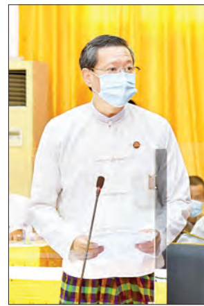
ပြည်ထောင်စုဝန်ကြီး ဒေါက်တာမျိုးသိမ်းကြီး

သို့မှသာ သိပ္ပံ၊ နည်းပညာနှင့် ဆန်းသစ်တီထွင်မှုဆိုင်ရာ အမျိုးသားအဆင့်မူဝါဒများကို ဖော်ဆောင်ရေးဆွဲရာမှ နိုင်ငံဖွံ့ဖြိုးတိုးတက်မှုကို ဦးတည်သည့်မူဝါဒများ ဖြစ်လာစေရေး သာမက ကုလသမဂ္ဂ၏ စဉ်ဆက်မပြတ် ဖွံ့ဖြိုးတိုးတက်ရေး ရည်မှန်းချက်ပန်းတိုင်များ (Sustainable Development Goals - SDGs) 2030 နှင့်အညီ ဆောင်ရွက်သွားရန် လိုအပ်ပါကြောင်း။ ဥပမာအားဖြင့် သိပ္ပံ၊ နည်းပညာနှင့် ဆန်းသစ်တီထွင်မှု လုပ်ငန်းများကို စဉ်ဆက်မပြတ် ဖွံ့ဖြိုးတိုးတက်ရေး ရည်မှန်းချက်ပန်းတိုင်များ (SDGs) အနက် ပန်းတိုင်အမှတ်(၄) ဖြစ်သည့် အရည်အချင်းပြည့်ဝသော ပညာရေး ရရှိရေး၊ ပန်းတိုင်အမှတ်(၅)ဖြစ်သည့် ကျား-မ တန်းတူ ညီမျှရေးနှင့် ပန်းတိုင် အမှတ်(၉)ဖြစ်သည့်