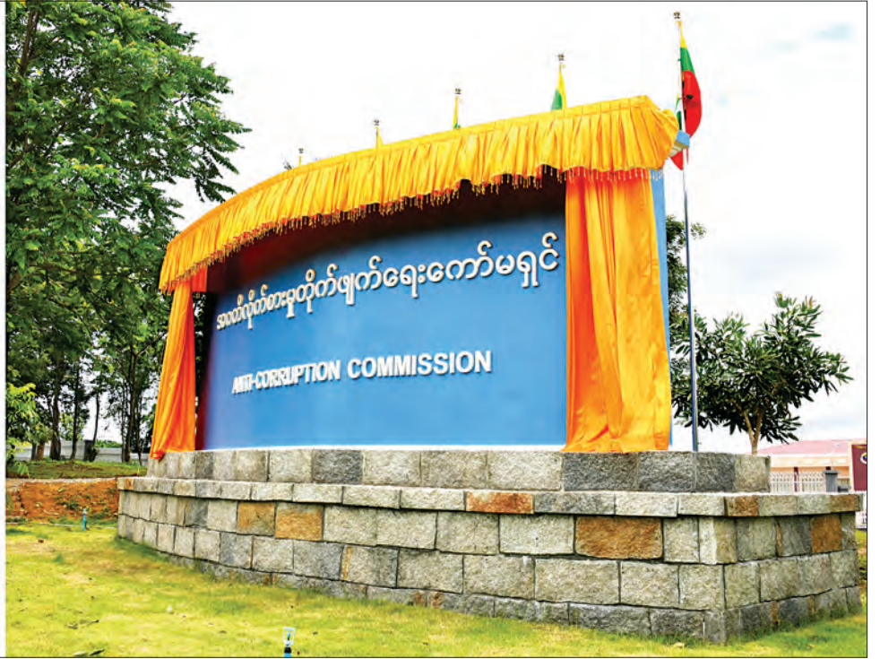
နိုင်ငံတော်သမ္မတ ဦးဝင်းမြင့် အင်္ဂတိလိုက်စားမှုတိုက်ဖျက်ရေးကော်မရှင်ရုံးသစ် အဆောက်အအုံ ဆိုင်းဘုတ်ကို စက်ခလုတ်နှိပ်ဖွင့်လှစ်ပေးစဉ်။

○ နိုင်ငံတော်သမ္မတမှ ဆက်လက်၍ ဆောက်လုပ်ရေး ဝန်ကြီးဌာန ပြည်ထောင်စုဝန်ကြီး ဦးဟန်ဇော်နှင့် အင်္ဂတိလိုက်စားမှု တိုက်ဖျက်ရေးကော်မရှင် ဥက္ကဋ္ဌ ဦးအောင်ကြည်တို့က အင်္ဂတိလိုက်စား မှုတိုက်ဖျက်ရေးကော်မရှင်ရုံး ကမ္ဘာ့ ဖော်ကွန်းကြေးပြားဆိုင်းဘုတ်ကို အမွှေး နံ့သာရည် ပက်ဖျန်းပေးကြသည်။ ယင်းနောက် ဖွင့်ပွဲအခမ်းအနားကို ဆက်လက်ကျင်းပရာ နိုင်ငံတော် သမ္မတ ဦးဝင်းမြင့်က အင်္ဂတိလိုက် စားမှုတိုက်ဖျက်ရေး ကော်မရှင်ရုံးသစ် အဆောက်အအုံဖွင့်ပွဲ အထိမ်းအမှတ် မိန့်ခွန်းပြောကြားသည်။ (နိုင်ငံတော်သမ္မတ ဦးဝင်းမြင့် ပြောကြားသည့် မိန့်ခွန်းအပြည့်အစုံကို စာမျက်နှာ (၅)တွင် သီးခြားဖော်ပြထား ပါသည်။) ထို့နောက် အင်္ဂတိလိုက်စားမှု တိုက်ဖျက်ရေးကော်မရှင် ဥက္ကဋ္ဌ ဦးအောင်ကြည်က အင်္ဂတိလိုက်စားမှု တိုက်ဖျက်ရေးလုပ်ငန်းများ ဆောင် ရွက်နေမှု အခြေအနေနှင့်စပ်လျဉ်း၍ ရှင်းလင်းတင်ပြရာတွင် နိုင်ငံတော် အစိုးရက အင်္ဂတိလိုက်စားမှုတိုက်