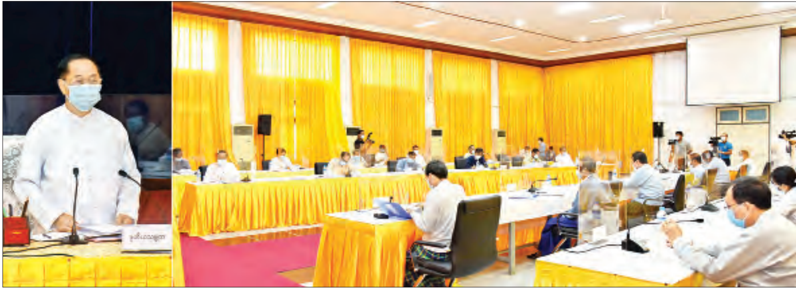
ဒုတိယသမ္မတ ဦးမြင့်ဆွေ အမျိုးသားသိပ္ပံ၊ နည်းပညာနှင့် ဆန်းသစ်တီထွင်မှုကောင်စီ၏ (၁/၂၀၂၀) အစည်းအဝေးတွင် အမှာစကားပြောကြားစဉ်။

နေပြည်တော် ဩဂုတ် ၅ အမျိုးသားသိပ္ပံ၊ နည်းပညာနှင့် ဆန်းသစ်တီထွင်မှုကောင်စီ၏ (၁/၂၀၂၀)အစည်းအဝေးကို ယနေ့နံနက် ၉ နာရီခွဲတွင် နေပြည်တော်ရှိ ပညာရေးဝန်ကြီးဌာန အစည်းအဝေး ခန်းမ၌ ကျင်းပရာ အမျိုးသားသိပ္ပံ၊ နည်းပညာနှင့် ဆန်းသစ်တီထွင်မှု ကောင်စီဥက္ကဋ္ဌ၊ ဒုတိယသမ္မတ ဦးမြင့်ဆွေ တက်ရောက်အမှာစကား ပြောကြားသည်။