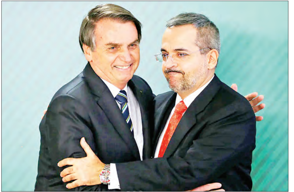
ဘရာဇီးသမ္မတ ဘိုလ်ဆိုနာရီနှင့် ပညာရေးဝန်ကြီး အောဘာဟမ်ဝင်းထရပ်။

သို့ သွားရောက်ကာ ကိုရိုနာဗိုင်းရပ်စ်ကို မကြောက်ရန် ပြည်သူများအား တိုက်တွန်းခဲ့ကြောင်း သိရသည်။ ဘရာဇီးသမ္မတ ဘိုလ်ဆိုနာရီသည် စီးပွားရေးလုပ်ငန်းများပြန်လည်စတင်ရန် ရည်ရွယ်ချက်ရှိရှိ ဘရာဇီးနိုင်ငံ၏ ပြည်သူ ၁၀ သန်းသည်လည်း မတ်လကတည်းက ၎င်းတို့၏ အလုပ်အကိုင်များဆုံးရှုံးမှုဖြစ်ပေါ်ခဲ့ကြောင်း သိရသည်။ ဘရာဇီးနိုင်ငံသည် ကိုရိုနာဗိုင်းရပ်စ်ကူးစက်မှုနှင့် သေဆုံးမှု၌ ကမ္ဘာပေါ်တွင် အမေရိကန်နိုင်ငံပြီးနောက် ဒုတိယနေရာတွင် ရပ်တည်လျက်ရှိပြီး တစ်ရက်အတွင်း ကူးစက်မှုအများဆုံး ၅၀၀၀ အထိရှိခဲ့ကာ ဩဂုတ် ၄ ရက်အထိ ကူးစက်ခံရသူပေါင်း ၂ ဒသမ ၈ သန်းရှိကြောင်းနှင့် သေဆုံးသူအရေ အတွက် ၉၅၀၀၀ ရှိကြောင်း သိရသည်။ ကိုးကား-အင်န်အိတ်ချ်ကော့ဘာသာပြန်-အလင်းသစ်