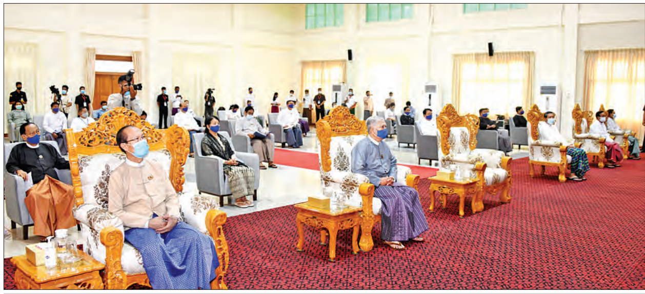
အင်္ဂတိလိုက်စားမှုတိုက်ဖျက်ရေးကော်မရှင်ရုံးသစ် အဆောက်အအုံ ဖွင့်ပွဲအခမ်းအနားသို့ တက်ရောက်ကြသူများကို တွေ့ရစဉ်။