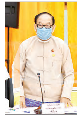
ပြည်ထောင်စုဝန်ကြီး ဒေါက်တာမြင့်ထွေး

အခြေခံလုပ်ငန်းစဉ် နည်းပညာနှင့် တီထွင်ဆန်းသစ်မှုများ ပိုမိုတိုးတက်များပြားလာစေရန် အခြေခံပညာ အဆင့်မှ စတင်၍ အသိပညာပေးနိုင်ရန် စီမံဆောင်ရွက်နေခြင်းသည်လည်း STI ၏ အခြေခံလုပ်ငန်းတစ်ခုဖြစ်ပါကြောင်း၊ ရှာဖွေတွေ့ရှိထားသည့် နည်းပညာနှင့် တီထွင်မှု (Invention) များကို ကာကွယ်မှုနှင့်တန်ဖိုးတန်ကြေးရရှိစေနိုင်ရန် ဆောင်ရွက်ပေးခြင်းသည်လည်း STI ၏ လုပ်ငန်းစဉ်တစ်ခုဖြစ်ပါကြောင်း၊ ယခုလို ကာကွယ်မှုများ ပေးနိုင်ရန်အတွက် အသိဉာဏ်ပစ္စည်း မူပိုင်ခွင့်ဆိုင်ရာ ဥပဒေများ ကိုလည်း ပြဋ္ဌာန်းထားပြီးဖြစ်ပါကြောင်း၊ နည်းပညာလွှဲပြောင်းခြင်းနှင့် မူပိုင်ခွင့်မျှဝေသုံးစွဲခြင်းတို့ အသက်ဝင်လာအောင်ဆောင်ရွက်မည့် တီထွင်သူနှင့် သုံးစွဲသူ (လုပ်ငန်းရှင်)အကြား ဆက်သွယ်ပေးမည့် ကြားခံအဖွဲ့အစည်း လိုအပ်ပါကြောင်း၊ နိုင်ငံတကာတွင် Technology Transfer Office သို့မဟုတ် Technology Transfer Center များ ထူထောင်ပြီး ဆောင်ရွက်နေသည်ကို တွေ့ကြရမည်ဖြစ်ပါကြောင်း။ မြန်မာနိုင်ငံ အနေဖြင့်လည်း နည်းပညာ လွှဲပြောင်းခြင်းဆိုင်ရာ