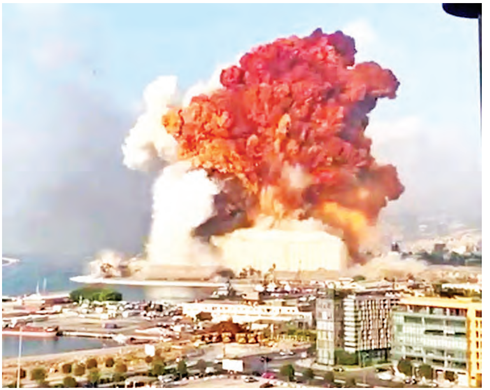
သမ္မတ အော်ယွန်က လက်ဘနွန်နိုင်ငံအား နိုင်ငံ အစိုးရက ခွင့်ပြုပေးခဲ့ကြောင်း ပြောကြားခဲ့သည်။ တကာ အသိုက်အဝန်းမှ အကူအညီပေးရန် တောင်းခံခဲ့ပြီး အရေးပေါ် ရန်ပုံငွေအဖြစ် အမေရိကန်ဒေါ်လာ ၆၆ သန်းကို ကိုးကား-ဆင်ဟွာ၊ ဘီဘီစီ ဘာသာပြန်-အလင်းသစ်

လက်ဘနွန်နိုင်ငံ သမ္မတအောယွန်က အခင်းဖြစ်ပွား သောနေ့တွင်ပင် အရေးပေါ်လိုခြုံရေး အစည်းအဝေးခေါ်ယူ ခဲ့ပြီး ပေါက်ကွဲမှုနေရာပိုင်းကိစ္စရပ်များကို ဆောင်ရွက်ရန် စစ်တပ်ကို ညွှန်ကြားခဲ့ကြောင်းနှင့် ဒဏ်ရာရသူများကို သက်ဆိုင်ရာဌာနက အခမဲ့ကုသပေးရန်၊ နေအိမ်ပျက်စီး အိုးမဲ့ အိမ်မဲ့ဖြစ်သော မိသားစုများအား ကူညီထောက်ပံ့မှုပေးရန် ညွှန်ကြားခဲ့ကြောင်း သိရသည်။ ပေါက်ကွဲမှုဖြစ်ပွားခြင်း ကြောင့်လူပေါင်း သုံးသိန်းကျော် အိုးမဲ့အိမ်မဲ့ဖြစ်ခဲ့ရကြောင်း ဘေရွတ်မြို့တော်ဝန် မာဝန်အဘောက ပြောကြားခဲ့သည်။