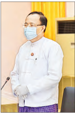
ပြည်ထောင်စုဝန်ကြီး ဦးကျော်တင်

❖ ကျောပိုးမှ ဒုတိယဝန်ကြီးများ ဖြစ်ကြသည့် ဒေါက်တာမင်းရဲပိုင်ဟိန်းနှင့် ဦးစိုးအောင်၊ အမျိုးသားပညာရေးမူဝါဒကော်မရှင်ဥက္ကဋ္ဌ၊ အမြဲတမ်းအတွင်းဝန်များ၊ ညွှန်ကြားရေးမှူးချုပ်များ၊ ဦးဆောင် ညွှန်ကြားရေးမှူးများ၊ ပြည်ထောင်စုသမ္မတ မြန်မာနိုင်ငံ ကုန်သည်များနှင့် စက်မှုလက်မှုလုပ်ငန်းရှင်များအသင်းချုပ်၊ မြန်မာနိုင်ငံအင်ဂျင်နီယာကောင်စီ၊ မြန်မာနိုင်ငံကုန်ပျူတာအသင်းချုပ်၊ ပါမောက္ခချုပ်များ ကော်မတီ၊ မြန်မာနိုင်ငံ အင်ဂျင်နီယာအသင်းချုပ်၊ မြန်မာနိုင်ငံ နည်းပညာ ပညာရှင်အဖွဲ့၊ မြန်မာနိုင်ငံ ဆောက်လုပ်ရေးဆိုင်ရာ လုပ်ငန်းရှင်များအသင်းချုပ်နှင့် မြန်မာနိုင်ငံ လူငယ်စွန့်ဦး တီထွင်လုပ်ငန်းရှင်များအသင်း (ဗဟို)တို့မှ ဥက္ကဋ္ဌများနှင့် တာဝန်ရှိသူများ တက်ရောက်ကြသည်။