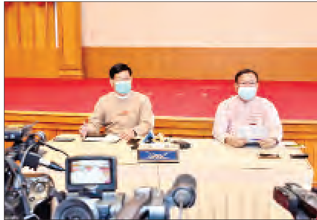
နိုင်ငံတော်က ဖိတ်ပေးပါမယ်လို့ ပြောပါတယ်။ ဒါပေမယ့် AA ကလွဲပြီး ကျန်တဲ့ ၇ ဖွဲ့ကို ဖိတ်ကြားပေးပါမယ်လို့ ဒီနေ့ အစည်းအဝေးမှာ တရားဝင်ပြောခဲ့ပါတယ်။ သို့သော် ထိပ်သီးခေါင်းဆောင်က ကိုယ်စားလှယ်လွှတ်လို့မရပါဘူး။ ထိပ်သီး ခေါင်းဆောင်ကိုယ်တိုင် တက်မယ်ဆိုရင် တက်လို့ရပါတယ်ဆိုပြီးတော့ နိုင်ငံတော်ကနေတစ်ဆင့် ဖိတ်ကြားပေးသွားမှာပါ။ ကျန်တာကတော့ ကျွန်တော် တို့ JICM အစည်းအဝေးမှာပဲ အဖြေကောင်းကောင်း ထွက်မယ်လို့လည်း မျှော်လင့် ပါတယ်” ဟုပြောသည်။

ကျွန်တော်တို့က နိုင်ငံတော်အပေါ် တောင်းဆိုထားတဲ့ အပစ်အခတ်ရပ်စဲရေး မလုပ်သေးတဲ့ အဖွဲ့တွေကိုလည်း ဖိတ်ကြားဖို့ ပြောထားပါတယ်။ ဒါကိုလည်း