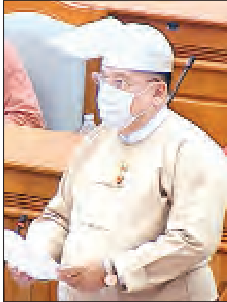
ဒုတိယဝန်ကြီး ဦးဖရတ်ဆင်း

ယင်းနောက် နိုင်ငံတော်သမ္မတထံမှ ပေးပို့ထားသော ဒေသတွင်း ဘက်စုံစီးပွားရေးပူးပေါင်းဆောင်ရွက်မှု သဘော တူစာချုပ်တွင် မြန်မာနိုင်ငံက ပါဝင်လက်မှတ်ရေးထိုးနိုင် ရေးနှင့် စက်မှုဝန်ကြီးဌာန ဒုတိယဝန်ကြီး ဦးမောင်မောင်ဝင်း က ပြန်လည်ရှင်းလင်းဆွေးနွေးရာတွင် စီမံကိန်းအဆင့်-၃