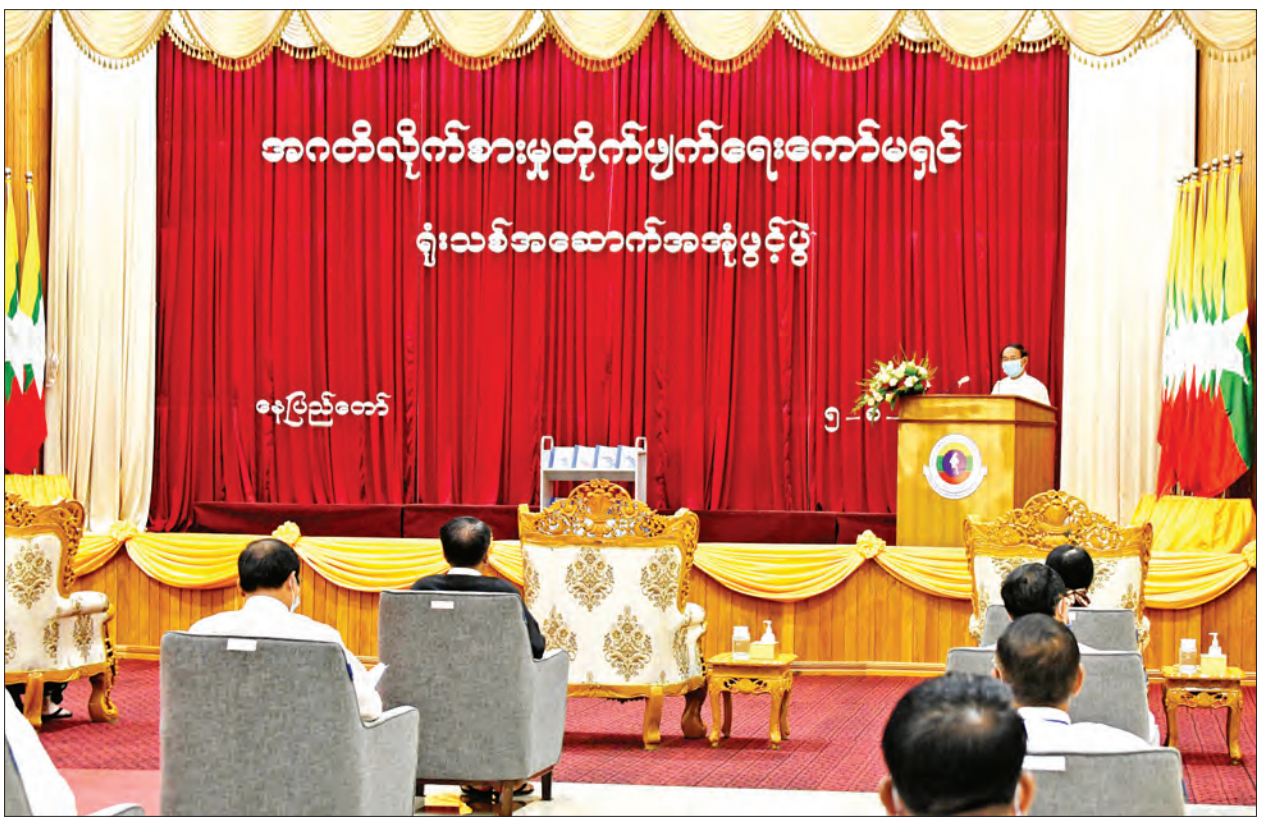
နိုင်ငံတော်သမ္မတ ဦးဝင်းမြင့် အင်္ဂတိလိုက်စားမှုတိုက်ဖျက်ရေးကော်မရှင်ရုံးသစ် အဆောက်အအုံ ဖွင့်ပွဲအခမ်းအနားတွင် မိန့်ခွန်းပြောကြားစဉ်။

ဖျက်ရေးကော်မရှင်ကို ၂၀၁၇ ခုနှစ် နိုဝင်ဘာလတွင် ပြန်လည်ဖွဲ့စည်းပေး ခဲ့ပါကြောင်း၊ ကော်မရှင်အနေဖြင့် နိုင်ငံအတွင်း ဖြစ်ပွားနေသော အင်္ဂတိ လိုက်စားမှုများကို အောင်မြင်စွာ တိုက်ဖျက်နိုင်ရေးအတွက် ကော်မရှင် ၏ အင်္ဂတိလိုက်စားမှု တိုက်ဖျက်ရေး မဟာဗျူဟာစီမံချက် (၂၀၁၈ - ၂၀၂၀) ကိုရေးဆွဲကာ နှစ်အလိုက် လုပ်ငန်း အစီအစဉ်များ ချမှတ်အကောင် အထည်ဖော် ဆောင်ရွက်ခဲ့ပါကြောင်း၊ ယင်းမဟာဗျူဟာတွင် လုပ်ငန်း နယ်ပယ် ၅ ခု၊ လုပ်ငန်းစဉ် ၁၃ ခု၊ စံသတ်မှတ်ချက် ၅၃ ခု ပါရှိပါ ကြောင်း၊ ၂၀၂၀ ပြည့်နှစ် ဇွန်လကုန် အထိ ကော်မရှင်၏ ဆောင်ရွက်ပြီးစီး ခဲ့မှုများကို ပြန်လည်သုံးသပ်ရာတွင် စံသတ်မှတ်ချက် ၈၀ ရာခိုင်နှုန်း အထက် အောင်မြင်ပြီးမြောက်ခဲ့ ကြောင်းကို စိစစ်တွေ့ရှိရပါကြောင်း၊ သို့ရာတွင် ကော်မရှင်၏ အင်္ဂတိ လိုက်စားမှုတိုက်ဖျက်ရေး မဟာ ဗျူဟာအား လက်တွေ့ကျပြီး တာရှည် ခံသော အောင်မြင်မှုများ ဖြစ်ထွန်း စေရန်အတွက် အင်္ဂတိလိုက်စားမှု စာမျက်နှာ ၄ သို့