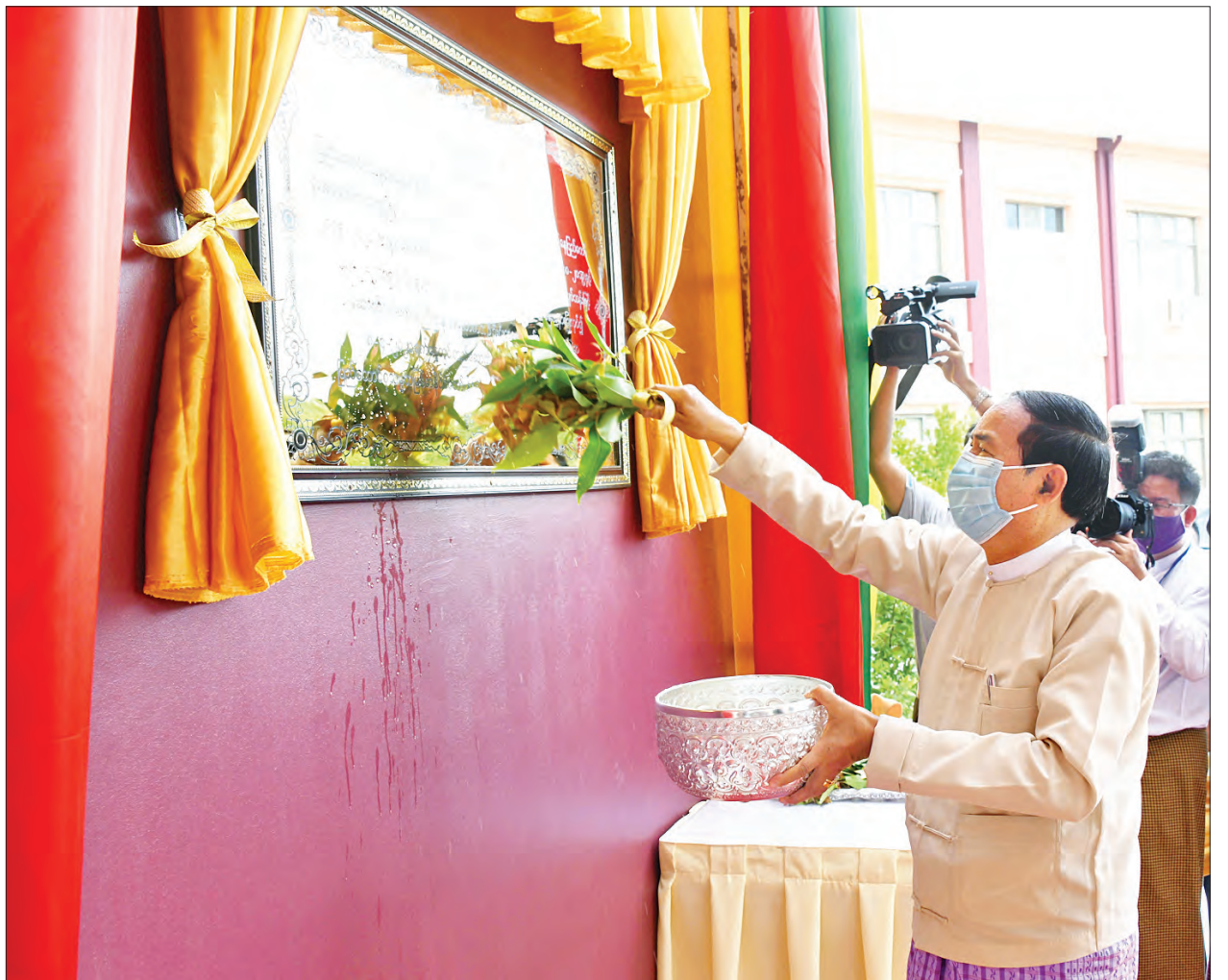
နိုင်ငံတော်သမ္မတ ဦးဝင်းမြင့် အင်အားစုတိုက်ဖျက်ရေးကော်မရှင်ရုံး ကမ္ဘာ့ဦးစီးဌာနကြီးများဆိုင်ရာတိုက်ဖျက်ရေးအဖွဲ့အစည်းများအဖွဲ့ဝင်များနှင့်အတူ ပတ်ဖျန်းပေးစဉ်။

အဓိကထုတ်ပြန်ထား အလားတူ ပုဂ္ဂလိကစီးပွားရေးလုပ်ငန်းများကိုလည်း ကော်မရှင်က