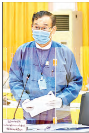
ပြည်ထောင်စုဝန်ကြီး ဦးအုန်းဝင်း

သိပ္ပံ၊ နည်းပညာနှင့် ဆန်းသစ်တီထွင်မှုလုပ်ငန်း (Science, Technology and Innovation - STI) များ အကောင်အထည်ဖော်ဆောင်ရွက်နိုင်ရန် အမျိုးသားအဆင့်မူဝါဒများနှင့်