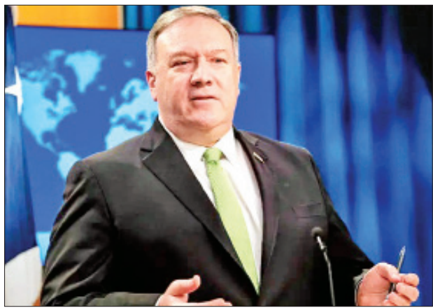
အမေရိကန် နိုင်ငံခြားရေးဝန်ကြီး မိုက်ပွန်ပီယို

ဒိုဟာ ဩဂုတ် ၄ အမေရိကန် နိုင်ငံခြားရေးဝန်ကြီး မိုက်ပွန်ပီယိုသည် အာဖဂန်နစ္စတန် ငြိမ်းချမ်းရေးလုပ်ငန်းစဉ်အကြောင်း ဆွေးနွေးရန် တာလီဘန်အဖွဲ့၏ စေလွှတ် ညှိနှိုင်းရေးမှူးချုပ် မူလာဘရာဒါ အာခန်နှင့် ယမန်နေ့က ဗီဒီယို ကွန်ဖရင့်တစ်ရပ် ကျင်းပခဲ့ကြောင်း တာလီဘန်အဖွဲ့ ပြောရေးဆိုခွင့်ရှိသူ တစ်ဦးက ပြောကြားသည်။