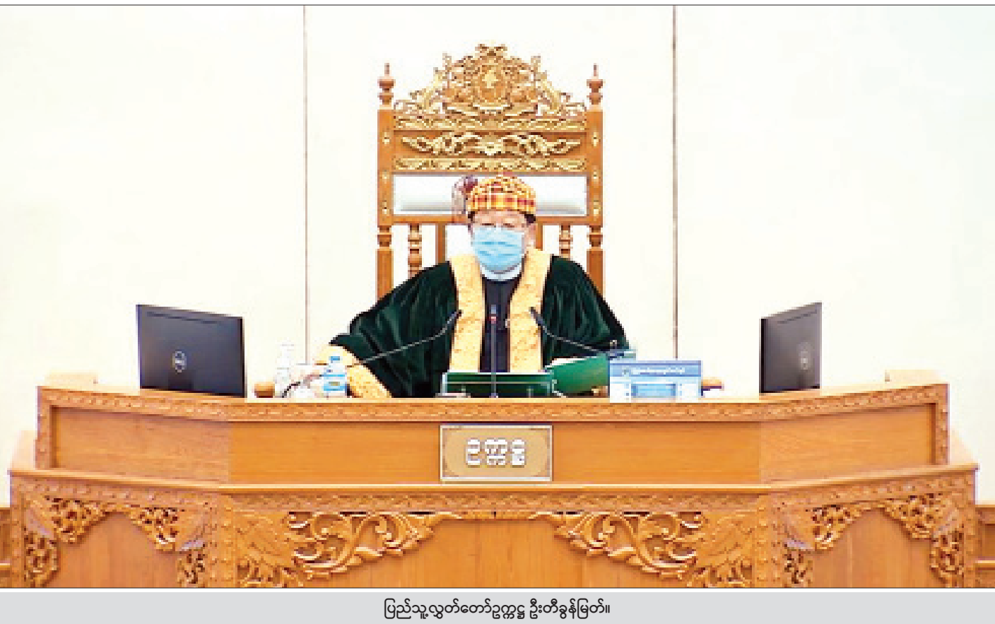
ပြည်သူ့လွှတ်တော်ဥက္ကဋ္ဌ ဦးတင်မြင့်

နေပြည်တော်၊ ဩဂုတ် ၄ ဒုတိယအကြိမ် ပြည်သူ့လွှတ်တော် (၁၇)ကြိမ်မြောက် ပုံမှန်အစည်းအဝေး အငြိမ်းစားနေ့ကို ယနေ့နံနက် ၁၀ နာရီတွင် နေပြည်တော်ရှိ ပြည်သူ့လွှတ်တော် အစည်းအဝေးခန်းမ၌ ကျင်းပသည်။ အစည်းအဝေးတွင် လက်ပံတန်းမဲဆန္ဒနယ်မှ ဦးကျော်မင်း၏ လက်ပံတန်းမြို့နယ် မကျီးကွင်းကျေးရွာ အုပ်စုပိုင် စားကျက်မြေ ၁၆၃ ဒဿမ ၆၂ ဧက စားကျက်မြေ အားလုံးကို တည်ဆဲဥပဒေများနှင့် ညီညွတ်ခြင်းမရှိဘဲ ပယ်ဖျက်ခဲ့သည့်အတွက် မည်သို့ပြန်လည်ဆောင်ရွက်ပေးမည်ကို သိလိုခြင်းမေးခွန်းနှင့်စပ်လျဉ်း၍ ပြည်ထောင်စု အစိုးရအဖွဲ့ရုံးဝန်ကြီးဌာန ဒုတိယဝန်ကြီး ဦးတင်မြင့်က ၂၀၂၀ ပြည့်နှစ် ဇွန် ၂၈ ရက်တွင် လက်ပံတန်းမြို့နယ် အထွေထွေအုပ်ချုပ်ရေးဦးစီးဌာန အုပ်ချုပ်ရေးမှူးရုံး၌ ညှိနှိုင်းဆွေးနွေးသဘောတူဆုံးဖြတ်ချက်အရ မိုးပုလဲဖြူ ကုမ္ပဏီ(ယခင် မဏိကမ္ဘာကုမ္ပဏီ)က လက်ရှိလုပ်ကိုင်နေသော ဧရိယာ ၉၁ ဒဿမ ၅၅ ဧကအနက်မှ ၅၁ ဒဿမ ၅၅ ဧကအား ဒေသဖွံ့ဖြိုးရေးအတွက် ပြန်လည်သုံးစွဲနိုင်ရန် ပဲခူးတိုင်းဒေသကြီးအစိုးရအဖွဲ့သို့ ပြန်လည်အပ်နှံသွားမည် ဖြစ်ပါကြောင်း၊ အဆိုပါ နုတ်ပယ်ခွင့်ပြုပြီး စားကျက်မြေ ဧရိယာ ၁၆၃ ဒဿမ ၆၂ ဧကအနက် အခြားမြေ ၂၀ ဒဿမ ၁၆ ဧကသည် လက်ရှိမြေပြင်တွင် လမ်းမြေ ၄ ဒဿမ ၀၅ ဧက၊ အိုင်မြေ ၁ ဒဿမ ၈၆ ဧက၊ ရိုးမြေ ၆ ဒဿမ ၅၄ ဧကနှင့် ကျန်အခြားမြေ ၇ ဒဿမ ၇၁ ဧကတို့အား အသုံးချဆောင်ရွက် ထားရှိရာ အဆိုပါ အခြားမြေ ၂၀ ဒဿမ ၁၆ ဧကအနက် လမ်းမြေ ၄ ဒဿမ ၀၅ ဧကကို ချန်လှပ်၍ စုစုပေါင်း ၁၆ ဒဿမ ၁၁ ဧကကို စာမျက်နှာ ၄ ကော်လံ ၁ သို့ ၂