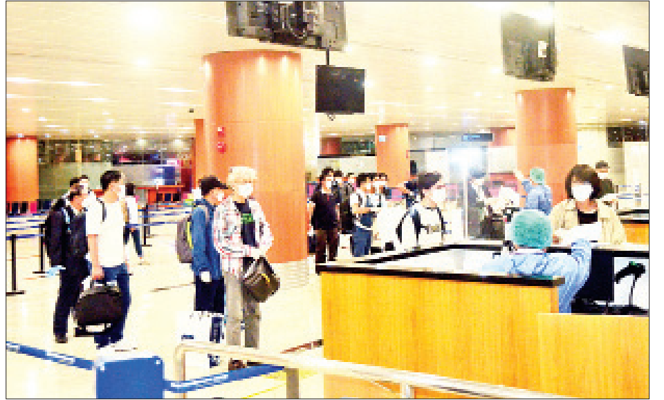
သတင်းစဉ်

အင်အားဝန်ကြီးဌာန၊ ကျန်းမာရေးနှင့် အားကစားဝန်ကြီးဌာနနှင့် ရန်ကင်းတိုင်းဒေသကြီးအစိုးရအဖွဲ့တို့က သက်ဆိုင်ရာအခန်းကဏ္ဍအလိုက် တာဝန်ယူဆောင်ရွက်ပေးခဲ့သည်။ နိုင်ငံခြားရေးဝန်ကြီးဌာနအနေဖြင့် Coronavirus Disease 2019(COVID-19) ကာကွယ် ထိန်းချုပ်၊ ကုသရေးအမျိုးသားအဆင့်ပဟိုကော်မတီ၏ လမ်းညွှန်ချက်နှင့်အညီ ပြည်ပနိုင်ငံများတွင် အခက်အခဲကြုံတွေ့နေရသည့် မြန်မာ နိုင်ငံသားများအား ဆွဲရပ်နိုင်ငံဖြစ်သည့် ကိုရီးယားသမ္မတနိုင်ငံ အင်ဒိုနီးရှားအပြည်ပြည်ဆိုင်ရာ လေဆိပ်မှတစ်ဆင့် ချိတ်ဆက်လျက် ပြန်လည်ခေါ်ဆောင်နိုင်ရေးအတွက် သက်ဆိုင်ရာဝန်ကြီးဌာနများ၊ မြန်မာသံရုံးများနှင့် ပူးပေါင်း ညှိနှိုင်း၍ ဆောင်ရွက်ပေးလျက်ရှိရာ ကယ်ဆယ်ရေး လေယာဉ် ၁၆ ကြိမ် ပျံသန်းပြေးဆွဲလျက် မြန်မာနိုင်ငံသား စုစုပေါင်း ၉၄၄၂ ဦးအား မြန်မာနိုင်ငံသို့ အဆင်ပြေချောမွေ့စွာ ပြန်လည်ခေါ်ဆောင်ပေးနိုင်ခဲ့ပြီး ဖြစ်ကြောင်း သိရသည်။