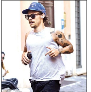
စာမျက်နှာတွေပေါ်မှာ ဖော်ပြခဲ့ကြတာကို တွေ့ရပါတယ်။

အမျိုးသားတေးဂီတအဖွဲ့ One Direction ရဲ့ အဖွဲ့ဝင်တစ်ဦးဖြစ်သူ ဟယ်ရီစတိုင်းဟာ လတ်တလောမှာ အီတလီကို ရောက်ရှိနေပြီး သူ့ရဲ့ အားလပ်ရက်ခရီးစဉ်အတွင်း ရိုက်ကူးထားတဲ့ ဓာတ်ပုံတွေကို အင်စတာဂရမ်စာမျက်နှာပေါ်မှာ တွေ့မြင်ရတဲ့အချိန်မှာတော့ သူ့ရဲ့ ပရိသတ်တွေကို နှစ်ခြမ်းကွဲသွားစေခဲ့ပါတယ်။