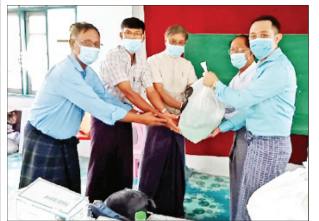
နေလင်း(ညောင်လေးပင်)

သတင်းသမားများကိုယ်စား မြို့နယ်သတင်းထောက်များက အသီးသီး လက်ခံရယူသည်။ ထို့နောက် မြို့နယ် မြန်ကြားရေးနှင့် ပြည်သူ့ဆက်ဆံရေးဦးစီး ဌာနအတွက် နှာခေါင်းစည်း အခု ၅၀၀ အား ပေးအပ်လှူဒါန်းသည်။ အဆိုပါ လှူဒါန်းပွဲသို့ ညောင်လေးပင်မြို့နယ်အတွင်းရှိ မြန်မာနိုင်ငံ စာရေးဆရာအသင်းဝင် စာရေးဆရာများ၊ သတင်းသမားများ တက်ရောက်ခဲ့ ကြပြီး မတက်ရောက်နိုင်သော စာရေးဆရာများအား အိမ်တိုင်ရာရောက် လိုက်လံပေးအပ်လှူဒါန်းခဲ့ကြကြောင်း သိရသည်။