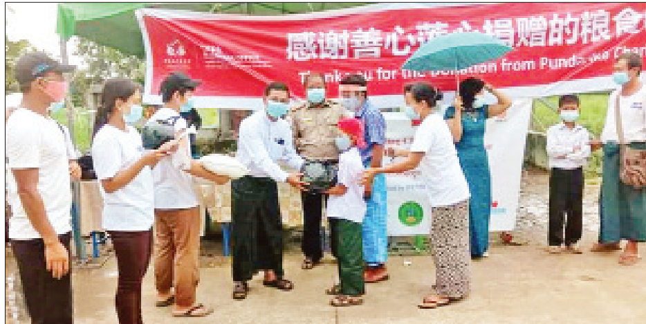
ကိုလည်း ပြုလုပ်ခဲ့ကြောင်း သိရသည်။ ကျောင်းများသို့လည်း စာရေးကိရိယာ ကြောင်း We Love North Dagon မှ ထိုပြင် ဘုန်းတော်ကြီးသင်ပညာရေး များ လှူဒါန်းသွားရန် အစီအစဉ်ရှိ အေးမင်းသူ

ရန်ကင်း ဩဂုတ် ၄ ရန်ကင်းတိုင်းဒေသကြီး ဒဂုံမြို့နယ် (မြောက်ပိုင်း)မြို့နယ် (၄၈)ရပ်ကွက် အမှတ်(၂၅) အခြေခံပညာမူလတန်း ကျောင်းရှိ ကျောင်းသား ကျောင်းသူ ၁၀၀ အတွက် အခြေခံစားသောက်ကုန် များကို We Love North Dagon ပရဟိတအဖွဲ့က ယနေ့ မွန်းလွဲပိုင်း တွင် သွားရောက်ထောက်ပံ့လှူဒါန်း သည်။ ထိုသို့လှူဒါန်းရာတွင် ကျောင်းသား တစ်ဦးလျှင် ဆန်(၆) ပြည်ပါ နှစ်အိတ်၊ ဆီ (၅၀) ကျပ်သား၊ ပဲ၊ ခေါက်ဆွဲခြောက် ထုပ် စသည့် အခြေခံစားသောက်ကုန် များကို လှူဒါန်းခဲ့ပြီး ကလေးများ အတွက် အဟာရဒါနကျွေးမွေးမှုများ