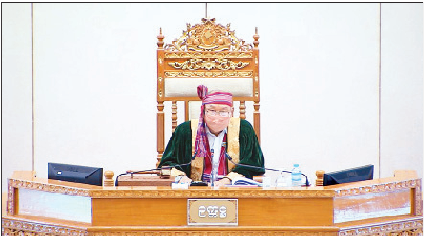
အမျိုးသားလွှတ်တော်ဥက္ကဋ္ဌ မန်းဝင်းခိုင်သန်း။

အစည်းအဝေးတွင် စစ်ကိုင်းတိုင်းဒေသကြီး မဲဆန္ဒနယ်အမှတ်(၄)မှ ဦးလှဦး၏ မန္တလေး-စစ်ကိုင်း-မုံရွာ-ရေဦးလမ်း (ပြည်ထောင်စုလမ်း၊ မုံရွာမြို့ရှောင်လမ်း) တွင် မိုင်တိုင်အမှတ် (၈၆/၁)နှင့် (၈၈/၅)ကြားလမ်း အရှည် ၂ မိုင် ၄ ဖာလုံ လက်ရှိလမ်းအား အကျယ်ပေ ၃၀ ချဲ့ပြီး ကတ္တရာကွန်ကရစ်ခင်းရန်အတွက် ၂၀၂၀-၂၀၂၁ ဘဏ္ဍာနှစ်တွင် ထည့်သွင်းလျာထားပေးရန် အစီအစဉ်ရှိ မရှိ မေးခွန်းနှင့်စပ်လျဉ်း၍ ဆောက်လုပ်ရေး ဝန်ကြီးဌာန ပြည်ထောင်စုဝန်ကြီး ဦးဟန်ဇော်က မုံရွာမြို့ရှောင်လမ်းပိုင်း၏ မိုင်တိုင်အမှတ်(၈၁/၂)မှ (၈၄/၀)အထိ ၂ မိုင် ၆ ဖာလုံအား ၄၈ ပေအကျယ်နှင့် မိုင်တိုင်အမှတ် (၈၅/၃)မှ (၈၈/၅)အထိ ၃ မိုင် ၂ ဖာလုံတို့အား ပေ ၃၀ အကျယ် ကတ္တရာကွန်ကရစ်ခင်းခြင်းလုပ်ငန်းများ ဆောင်ရွက်နိုင်ရန်အတွက် ၂၀၂၀-၂၀၂၁ ဘဏ္ဍာနှစ် တိုင်းဒေသကြီး ငွေလုံးငွေရင်း ရန်ပုံငွေတွင် လျာထားတင်ပြတောင်းခံခဲ့သော်လည်း ရန်ပုံငွေကန့်သတ်ချက်အရ မိုင်တိုင်အမှတ် (၈၅/၂)မှ (၈၆/၁) အတွင်းရှိ ၆ ဒသမ ၅ ဖာလုံအား ကတ္တရာကွန်ကရစ်ခင်းခြင်း လုပ်ငန်းဆောင်ရွက်ရန်အတွက် ငွေကျပ် သန်း ၅၀၀ သာ လျာထားနိုင်ခဲ့သဖြင့် ကျန်ရှိနေသည့် စာမျက်နှာ ၅ ကော်လံ ၁ သို့ ❖