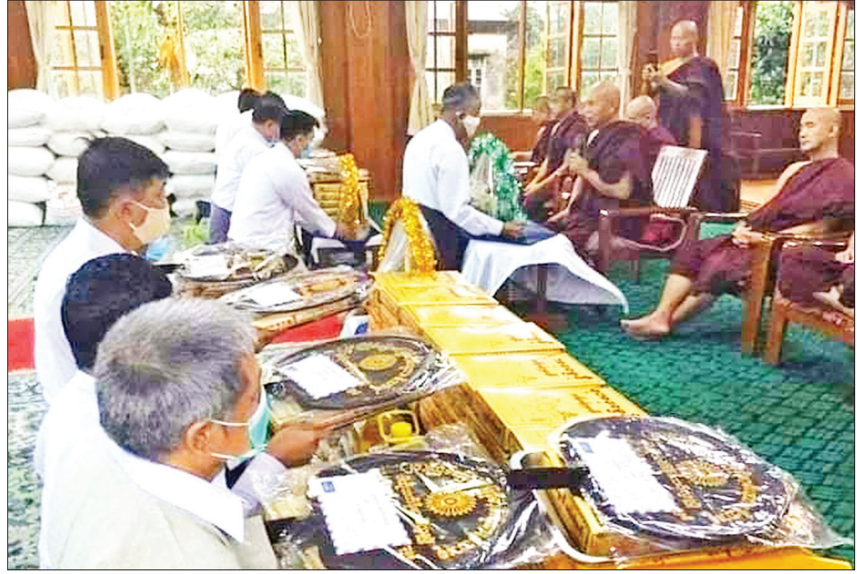
ရန်ကုန်မြို့ ဗဟန်းမြို့နယ်ရှိ တောင်ကြီးကျောင်းတိုက်၌ မြန်မာ့ဗိရထာဝန်ထမ်းမိသားစုများ၏ (၂၃)ကြိမ်မြောက် ဝါဆိုသင်္ကန်းဆက်ကပ်လှူဒါန်းပွဲ ကျင်းပစဉ်။