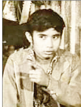
ကိုမြင့်