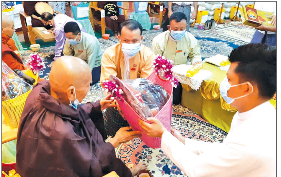
ကော့သောင်းမြို့ ပြည်တော်အေး သာသနာ့ဗိမာန်တော်၌ တနင်္သာရီတိုင်းဒေသကြီးအစိုးရအဖွဲ့ ဝန်ကြီးချုပ်နှင့် တာဝန်ရှိသူများက ဆရာတော်အား ဝါဆိုသင်္ကန်းဆက်ကပ်လှူဒါန်းစဉ်။