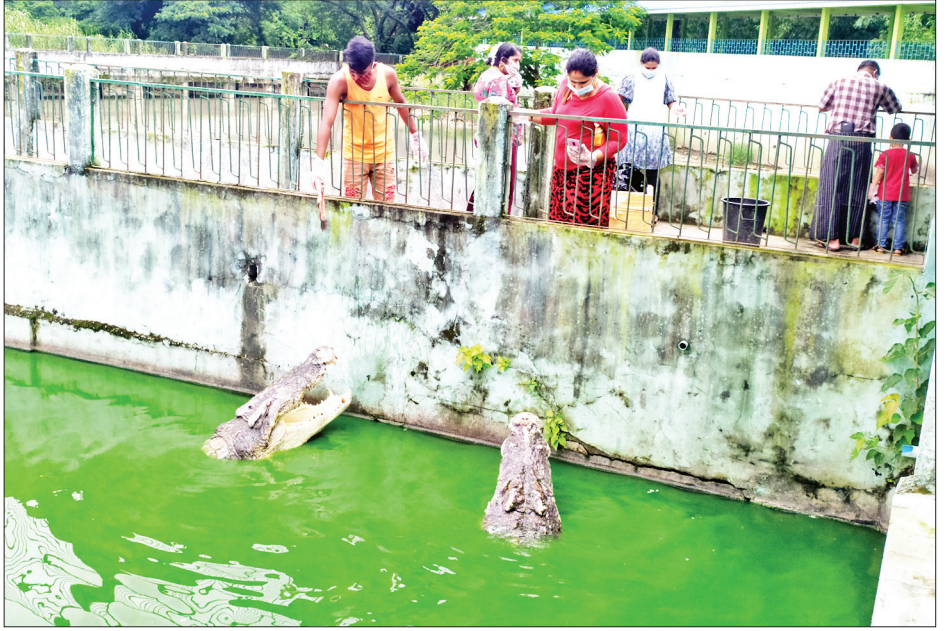
ဝါဆိုလပြည့်နေ့တွင် ရန်ကုန်တိုင်းဒေသကြီး သာကေတမြို့နယ်ရှိ မိကျောင်းမွေးမြူရေးစခန်း၌ မိကျောင်းစာကျွေးကုသိုလ်ပြုကြသူများကို တွေ့ရစဉ်။