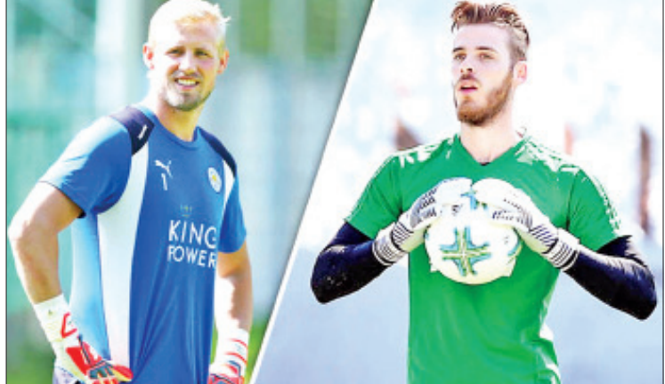
ဌေးကြယ် - ရေးသားသည်

မန်ယူအသင်းဟာ ထိပ်တန်းအဆင့်ရှိ ဂိုးသမား တစ်ဦးခေါ်ယူနိုင်ခဲ့မယ်ဆိုရင် တစ်ပတ်လုပ်ခလစာ ပေါင် ၃၇၅၀၀၀ ပေးထား ရတဲ့ ဂိုးသမား ဒီဂီယာကို ရောင်းထုတ်သွားမယ် လို့လည်း ဆိုပါတယ်။