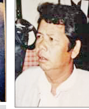
ချစ်မင်းလူ

အတော်ကို တိုးတက်တဲ့ မြန်မာကားတွေ ကြည့်ရမှာလို့။ ကြည်စိုးထွန်း။ ။ ဟာ မှန်တယ်၊ မှန်ပါ တယ်။