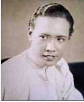
ခင်မောင်ညွန့်