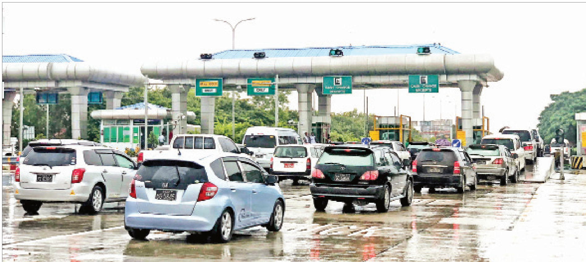
ဝါဆိုလပြည့်နေ့တွင် ဘုရားဖူး၊ ခရီးသွားလာကြသည့် ယာဉ်များအား ရန်ကုန် - မန္တလေးအမြန်လမ်းမကြီး၌ တွေ့ရစဉ်။

နေပြည်တော်၊ ဩဂုတ် ၃ ဝါဆိုလပြည့်နေ့သည် ဗုဒ္ဓဘာသာဝင်တို့အတွက် ဂေါတမဘုရားလောင်းပဋိသန္ဓေတည်သောနေ့၊ တောထွက်တော်မူသောနေ့၊ ဓမ္မစကြာတရား စတင်ဟောကြားသောနေ့၊ ရေမီးအစုံစုံတို့ဖြင့် တန်ခိုးပြာဋိဟာပြတော်မူသောနေ့၊ ဘုရားအဖြစ်ကို ဝန်ခံတော်မူသောနေ့၊ တရားရတနာ စတင်ပေါ်ပေါက်သောနေ့၊ သံဃာရတနာ စတင်ပေါ်ပေါက်သောနေ့၊ ပုထုဇဉ်ခရီးမှ အရိယာခရီးသို့ စတင်ကူးပြောင်းခွင့်ကြုံသောနေ့၊ "ဧဟိတိက္ခန္ဓာ"ဟူသော စကားကို စတင်ကြားရသော