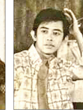
ဝင်းညွန့်