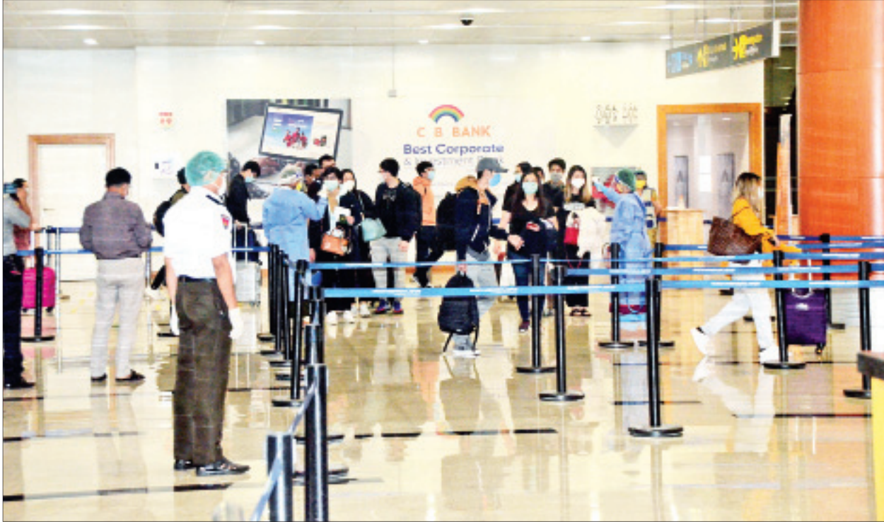
ဩစတြေးလျနိုင်ငံမှ ပြန်လည်ရောက်ရှိလာသည့် မြန်မာနိုင်ငံသားများအား ရန်ကုန်အပြည်ပြည်ဆိုင်ရာလေဆိပ်၌ တွေ့ရစဉ်။

နေပြည်တော် ဩဂုတ် ၃ ဩစတြေးလျနိုင်ငံတွင် အကြောင်းအမျိုးမျိုးဖြင့် ရောက်ရှိနေပြီး နိုင်ငံတကာ ခရီးသည်တင်လေယာဉ်များ ပျံသန်းမှု ယာယီရပ်ဆိုင်းထားခြင်းကြောင့် မြန်မာနိုင်ငံသို့ပြန်ရန် အခက်အခဲကြုံတွေ့နေရသည့် မြန်မာနိုင်ငံသားများနှင့် မြန်မာသင်္ဘောသားများ စုစုပေါင်း ၁၄၁ ဦးတို့အား မြန်မာသံရုံး ကင်ဘာရာမြို့နှင့် ပူးပေါင်းညှိနှိုင်းလျက် မြန်မာအမျိုးသားလေကြောင်း(MNA) ကယ်ဆယ်ရေးလေယာဉ်ဖြင့် ပြန်လည်ခေါ်ဆောင်ခဲ့ရာ ယနေ့ညပိုင်းတွင် ရန်ကုန်အပြည်ပြည်ဆိုင်ရာလေဆိပ်သို့ အဆင်ပြေချောမွေ့စွာ ပြန်လည်ရောက်ရှိကြသည်။ အဆိုပါ မြန်မာနိုင်ငံသားများ ရန်ကုန်အပြည်ပြည်ဆိုင်ရာလေဆိပ်သို့ ရောက်ရှိချိန်တွင် လူဝင်မှုကြီးကြပ်ရေး၊ ကျန်းမာရေးစစ်ဆေးရေးနှင့် ၂၁ ရက်တာ အသွားအလာကန့်သတ်ရေးတို့ကို အလုပ်သမား၊ လူဝင်မှုကြီးကြပ်ရေးနှင့် ပြည်သူ့အင်အားဝန်ကြီးဌာန၊ ကျန်းမာရေးနှင့် အားကစားဝန်ကြီးဌာနနှင့် ရန်ကုန်တိုင်းဒေသကြီးအစိုးရအဖွဲ့တို့က သက်ဆိုင်ရာအခန်းကဏ္ဍအလိုက် တာဝန်ယူဆောင်ရွက်ပေးခဲ့သည်။ ထိုသို့နိုင်ငံတကာခရီးသည်တင်လေယာဉ်များ ပျံသန်းမှု ယာယီရပ်ဆိုင်းထားခြင်းကြောင့် ပြည်ပနိုင်ငံများတွင် အခက်အခဲကြုံတွေ့နေကြသည့် မြန်မာနိုင်ငံသားများအား Coronavirus Disease 2019 (COVID-19) ကာကွယ်၊ ထိန်းချုပ်၊ ကုသရေး အမျိုးသားအဆင့်ဗဟိုကော်မတီ၏လမ်းညွှန်ချက်နှင့်အညီ နိုင်ငံခြားရေးဝန်ကြီးဌာနအနေဖြင့် သက်ဆိုင်ရာနိုင်ငံများရှိ မြန်မာသံရုံးများနှင့် မြန်မာနိုင်ငံရှိ သက်ဆိုင်ရာဝန်ကြီးဌာနတို့နှင့် ပူးပေါင်းညှိနှိုင်းဆောင်ရွက်ပေးခဲ့ရာ ဧပြီလကုန်မှ ယနေ့အထိ ပြည်ပနိုင်ငံအသီးသီးတွင် အခက်အခဲကြုံတွေ့နေရသည့် မြန်မာနိုင်ငံသား ၉၃၃၆ ဦးအား ကယ်ဆယ်ရေး/ အထူးလေယာဉ်များဖြင့် မြန်မာနိုင်ငံသို့ အဆင်ပြေချောမွေ့စွာ ပြန်လည်ခေါ်ဆောင်ပေးခဲ့ပြီးဖြစ်ကြောင်း သိရသည်။ သတင်းစဉ်