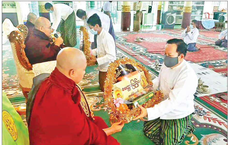
မေတ္တာပြည့်ဝသာသနာပြုအဖွဲ့က နိုင်ငံတော်ပရိယတ္တိသာသနာ့တက္ကသိုလ်(ရန်ကုန်) မိုးကုတ်ဆွမ်းစားဆောင်၌ ဆရာတော် သံဃာတော်များအား ဝါဆိုသင်္ကန်းဆက်ကပ်လှူဒါန်းစဉ်။

များသို့လည်း သွားရောက်အပန်းဖြေအနားယူကြကြောင်း သိရသည်။ သတင်းစဉ်