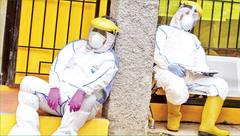
အနောက်ဂျာဗားပြည်နယ်တွင် ကိုဗစ်-၁၉ ရောဂါစမ်းသပ်စစ်ဆေးမှုများပြုလုပ်ပြီးနောက် အနားယူနေသော ဆရာဝန်များကို တွေ့ရစဉ်။

ယူကာတာ ဩဂုတ် ၃ အင်ဒိုနီးရှားနိုင်ငံတစ်ဝန်းတွင် ကိုဗစ်-၁၉ ရောဂါကြောင့် အနည်းဆုံး ဆရာဝန် ၇၂ ဦးသေဆုံးခဲ့ကြောင်း အင်ဒိုနီးရှား ဆေးဘက်ဆိုင်ရာ အဖွဲ့အစည်းက ပြောကြားခဲ့သည်။