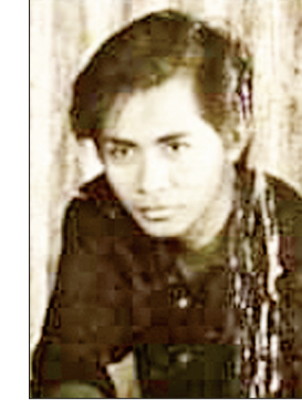
တိုးညွန့်