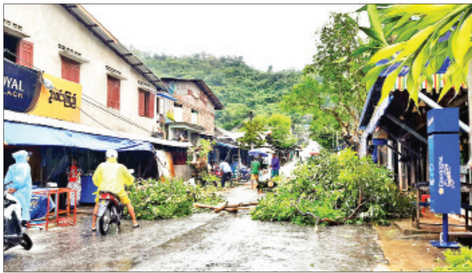
ဖြစ်ပွားခဲ့သည်။ စုငယ်ဘာလိုင်ကျေးရွာအုပ်စု ကပ်မာတမ်း ကျေးရွာ၌ ပင်လယ်လှိုင်းများရိုက်ခတ်သဖြင့် ကျေးရွာ ရေဆင်း သစ်သားတံတားငယ်တစ်စင်း ပြိုကျပျက်စီးမှုနှင့် လူနေအိမ်အချို့ အမိုးလန်ပျက်စီးမှုများ ဖြစ်ပွားခဲ့ကြောင်း သိရသည်။ အဆိုပါဖြစ်စဉ်များအတွင်း သက်ဆိုင်ရာဌာနအလိုက်

ကော့သောင်း ဩဂုတ် ၃ ကော့သောင်းမြို့၌ ယမန်နေ့ နံနက် ၅ နာရီခန့်က မိုးသည်းထန်စွာရွာသွန်းပြီး လေပြင်းတိုက်ခတ်သဖြင့် တယ်လီဖုန်းတိုင်၊ လျှပ်စစ်ဓာတ်အားပေးတိုင်၊ သစ်ပင်များ ပြိုလဲမှုနှင့် မြို့ပေါ်ရပ်ကွက်အချို့နှင့် ကျေးရွာအချို့ရှိ လူနေအိမ်အချို့ အမိုးလန်ပျက်စီးဆုံးရှုံးမှုများဖြစ်ပေါ် ခဲ့ကြောင်း သိရသည်။ တိုက်ခတ်လေပြင်းကြောင့် ဖြစ်ပေါ်နေသော အပူပိုင်း မုန်တိုင်း “စင်လကူ” (Sinlaku) အရှိန်ကြောင့် တနင်္သာရီ တိုင်းဒေသကြီး ကော့သောင်းမြို့တွင် ယမန်နေ့ နံနက် ၅ နာရီခန့်မှစတင်ကာ မိုးသည်းထန်စွာရွာသွန်း၍ လေပြင်း များ တိုက်ခတ်ရာ မြို့တွင်းနေရာအချို့တွင် ဖုန်းကြိုးနှင့် လျှပ်စစ်ဓာတ်ကြိုးများပေါ်သို့ အပင်များ ပြိုလဲကျမှုကြောင့် ဖုန်းတိုင်နှင့် ဓာတ်တိုင်များပြိုလဲခဲ့ပြီး မြို့ပေါ်ရပ်ကွက် အချို့ရှိ လူနေအိမ်များ အမိုးလန်ပျက်စီးဆုံးရှုံးမှုများ ဖြစ်ပွား ခဲ့ခြင်းဖြစ်သည်။ အလားတူ ကော့သောင်းမြို့နယ်အတွင်းရှိ ချမ်းဖန်း ကျေးရွာ၌လည်း လေပြင်းတိုက်ခတ်သဖြင့် လူနေအိမ် အချို့ အမိုးလန်ပျက်စီးဆုံးရှုံးမှုနှင့် အပင်များပြိုလဲမှုအချို့