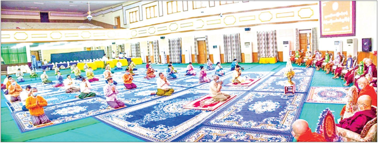
မန္တလေးမြို့တော်ခန်းမ၌ မန္တလေးတိုင်းဒေသကြီးအစိုးရအဖွဲ့က ဝါဆိုသင်္ကန်းဆက်ကပ်လှူဒါန်းပွဲကျင်းပစဉ်။

❖ ရှေ့ဖိုးမှ ယနေ့နံနက်ပိုင်းမှစတင်ပြီး နေပြည်တော်ရှိ ထာဝရငြိမ်းချမ်းရေးစေတီတော်၊ လက်လုပ်တောင် ရွှေနန်းသွင်းစေတီတော်၊ ဒက္ခိဏသီရိမြို့နယ်ရှိ ရန်အောင်မြင်စေတီတော်၊ လယ်ဝေးမြို့ ဖောင်တော်ချက်မစေတီတော်၊ ပျဉ်းမနား ဘုရားကိုးဆူစေတီတော်၊ ဓာတုဇယဓာတ်ပေါင်းစုစေတီတော် အပါအဝင် ဘုရား၊ စေတီ၊ ပုထိုးများ၊ ဘုန်းတော်ကြီးကျောင်းများနှင့် ဓမ္မရိပ်သာများတွင် ဘုရားဖူးများ လာရောက်ပြီး ဝါဆိုသင်္ကန်းကပ်လှူခြင်း၊ ဥပုသ်သီလ ဆောက်တည်ခြင်း၊ တရားဘာဝနာ ပွားများခြင်းတို့ဖြင့် ကုသိုလ်ယူကြသည်။