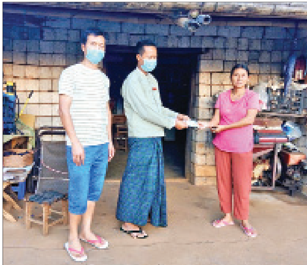
ကိုဗစ်-၁၉ ရောဂါ ကာကွယ်ဖို့ စနစ်တကျ လက်ဆေးဖို့

ပန်ဆိုင်း(ကြူကုတ်)မြို့ ရပ်ကွက်(၃) အတွင်းရှိ ပုံမှန်ဝင်ငွေမရှိသော အခြေခံ လူတန်းစားအိမ်ထောင်စုများအတွက် အိမ်ထောင်စုတစ်စုလျှင် ငွေကျပ် ၂၀၀၀၀ နှုန်းဖြင့် အိမ်ထောင်စုပေါင်း ၂၀ အား ပေးအပ်ခဲ့ပြီး ကျန်ရှိသည့် ရပ်ကွက်များတွင်လည်း လက်ဝယ် အရောက် ဆက်လက်ပေးအပ်သွား မည်ဖြစ်ကြောင်း သိရသည်။ သန်းမိုးခိုင်(ပြန်/ဆက်)