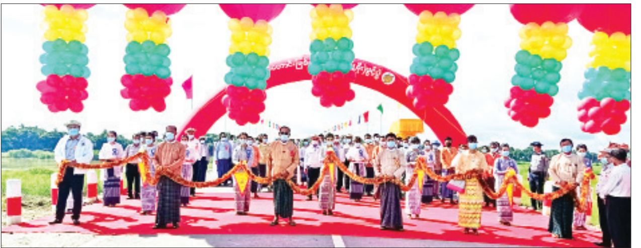
ပြည်ထောင်စုဝန်ကြီး ဦးဟန်ဇော်၊ ပဲခူးတိုင်းဒေသကြီး ဝန်ကြီးချုပ် ဦးဝင်းသိန်းနှင့် တာဝန်ရှိသူများက စစ်တောင်းမြစ်ကူးတံတား (မြို့စိုး) အား ဖဲကြိုးဖြတ်ဖွင့်လှစ်ပေးစဉ်။

ယခုဖွင့်လှစ်သည့် စစ်တောင်းမြစ်ကူး(မြို့စိုး)တံတားသည် ယခုအစိုးရ လက်ထက်တွင် ပဲခူးတိုင်းဒေသကြီးအတွင်း၌ တည်ဆောက်ပြီးစီးခဲ့သည့် ၄၄ စင်းမြောက် ဖွင့်လှစ်သည့် တံတားကြီးလည်းဖြစ်ပါကြောင်း၊ ပဲခူးတိုင်းဒေသ ကြီးအတွင်း၌ တည်ဆောက်လျက်ရှိသည့် စစ်တောင်းမြစ်ကူးတံတား (အုတ်ဖြတ်) ပေ ၆၂၅၊ စစ်တောင်းမြစ်ကူးတံတား (ရေတာရှည်) ပေ ၈၀၀၊ ရွှေကျင်ချောင်းကူးတံတား ပေ ၁၆၈၀၊ ဒါးပိန်မြစ်ကူးတံတား ပေ ၂၀၀၊ မြို့ဦးကင်းတံတား ၅၅၈ ပေ၊ ကဝတံတား ပေ ၆၀၀၊ တောင်ငူ-လိပ်သို-ယာဒို- လှိုင်ကော်လမ်းပေါ်ရှိ တံတားအမှတ်(၄/၁၃) ပေ ၂၀၀ တို့ကိုလည်း တံတား ဦးစီးဌာန တံတားအထူး အဖွဲ့(၆)၊ တံတားအထူးအဖွဲ့(၉)၊ တံတားအထူးအဖွဲ့