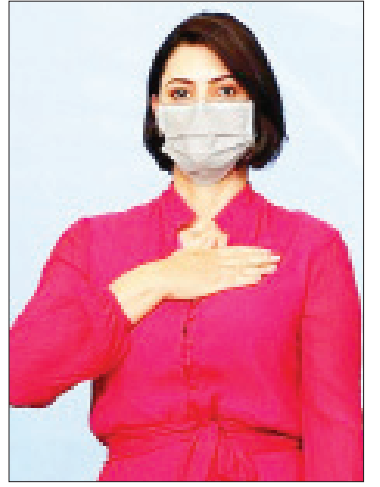
သမ္မတကတော် မစ်ချယ်