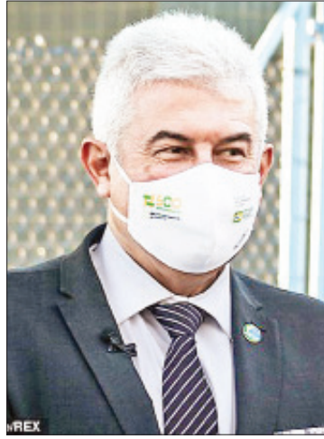
ဝန်ကြီး မားကိုစ်ပွန်တက်စ်

ကိုးကား-သည်စထရိုက်တိုင်းမ် ဘာသာပြန်-ကျော်ထိုက်စိုး