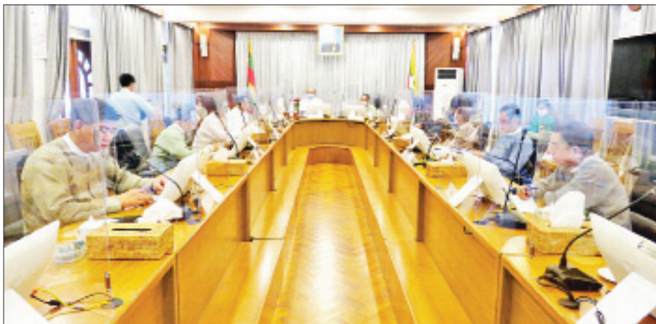
ကို ဖန်တီးပေးနိုင်မည်ဖြစ်သည်။ ယနေ့အစည်းအဝေးတွင် ခွင့်ပြုခဲ့သည့် လုပ်ငန်းများအနက် စင်ကာပူနိုင်ငံ Sembcorp CSSD Myanmar Co.,

ရန်ကုန် ဇူလိုင် ၃၁ မြန်မာနိုင်ငံရင်းနှီးမြှုပ်နှံမှုကော်မရှင်၏ (၁၀/၂၀၂၀) ကြိမ်မြောက် အစည်းအဝေးကို ယနေ့နံနက်ပိုင်းတွင် ရန်ကုန်မြို့ရှိ ကော်မရှင် အစည်းအဝေးခန်းမ၌ ကျင်းပသည်။ အစည်းအဝေးသို့ မြန်မာနိုင်ငံရင်းနှီးမြှုပ်နှံမှုကော်မရှင် ဥက္ကဋ္ဌ ပြည်ထောင်စုဝန်ကြီး ဦးသောင်းထွန်း၊ ဒုတိယဥက္ကဋ္ဌ ပြည်ထောင်စုဝန်ကြီး ဒေါက်တာသန်းမြင့်နှင့် အဖွဲ့ဝင် ၁၀ ဦး တက်ရောက်ကြသည်။