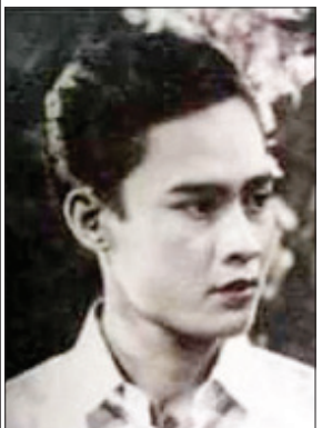
မြင့်အောင်

လည်း အင်မတန်စိတ်ဝင်စားစရာကောင်း ပါတယ်။ အဲဒီတော့ ဘာပဲဖြစ်ဖြစ် အစ်မတို့က ဒီမျိုးဆက်ထဲကိုတော့ ဝင်သွားကြတယ်ပေါ့။ ဝင်သွားကြပြီးတော့ ဒေါ်မေမြရယ်။ အစ်မ ရယ်ကတော့ ဆွေမျိုးဖြစ်သွားပြီ။ ဒီထဲမှာမှ ဆွေမျိုးမတော်ဘဲနဲ့ ဆွေမျိုးဖြစ်နေတာတော့