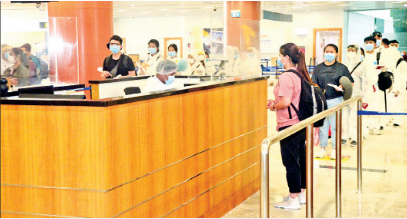
ကမ္ဘာ့ဒီးယားနိုင်ငံမှ ပြန်လည်ရောက်ရှိလာသည့် မြန်မာနိုင်ငံသားများအား ရန်ကုန်အပြည်ပြည်ဆိုင်ရာလေဆိပ်၌ တွေ့ရစဉ်။

နေပြည်တော် ဇူလိုင် ၃၁ ပြည်ပနိုင်ငံများတွင် အခက်အခဲကြုံတွေ့နေရသည့် မြန်မာနိုင်ငံသားများအား ပြန်လည်ခေါ်ဆောင်ရန် Coronavirus Disease 2019(COVID-19) ကာကွယ်၊ ထိန်းချုပ်၊ ကုသရေးအမျိုးသားအဆင့် ဗဟိုကော်မတီ၏ လမ်းညွှန်ချက်နှင့်အညီ နိုင်ငံခြားရေးဝန်ကြီးဌာနအနေဖြင့် သက်ဆိုင်ရာ ဝန်ကြီးဌာနများ၊ မြန်မာသံရုံးများနှင့် ပူးပေါင်းညှိနှိုင်း၍ ဆောင်ရွက်ပေးလျက်ရှိပါသည်။ ထိုသို့ ဆောင်ရွက်လျက်ရှိရာ ဂျော်ဒန်နိုင်ငံတွင် အကြောင်းအမျိုးမျိုးဖြင့် ရောက်ရှိနေပြီး မြန်မာနိုင်ငံသို့ပြန်ရန် အခက်အခဲကြုံတွေ့နေရသည့် မြန်မာနိုင်ငံသား ၁၂၁ ဦးအား မြန်မာသံရုံး၊ တဲလ်အစီးမြို့၏ ညှိနှိုင်းဆောင်ရွက်ပေးမှုဖြင့် အပြည်ပြည်ဆိုင်ရာမြန်မာလေကြောင်း(MAI) ကယ်ဆယ်ရေးလေယာဉ်ဖြင့် တတိယ