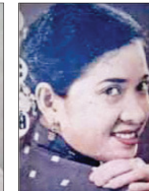
ခင်လေးဆွေ