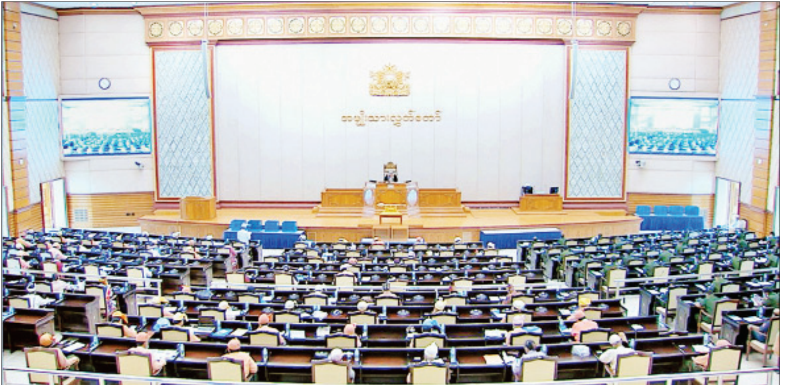
ဒုတိယအကြိမ် အမျိုးသားလွှတ်တော် (၁၇)ကြိမ်မြောက် ပုံမှန်အစည်းအဝေး သတ္တမနေ့ ကျင်းပစဉ်။

ကြိုးပမ်းဆောင်ရွက်လျက်ရှိ အစည်းအဝေးတွင် ရခိုင်ပြည်နယ် မဲဆန္ဒနယ်အမှတ်(၁၁)မှ ဒေါ်ထုမေ၏ မြန်မာနိုင်ငံအနေဖြင့် နိုင်ငံတကာမှ ဖိအားများ၊ စိန်ခေါ်မှုများနှင့် ရင်ဆိုင် ရလျက်ရှိရာ မိမိတို့နိုင်ငံရင်ဆိုင်နေရ သည့် အခြေအနေများကို နိုင်ငံတကာ မှ ပိုမိုနားလည်သဘောပေါက်ကာ မြန်မာနိုင်ငံအပေါ် အမြင်ရှင်းလင်းလာ စေရေးအတွက်လည်းကောင်း၊ နိုင်ငံ တကာမှ ဖိအားများ လျော့ကျသွားစေ ရန်အတွက်လည်းကောင်း၊ နိုင်ငံနှင့် နိုင်ငံသားများ၏ပုံရိပ်ကို မြှင့်တင် နိုင်ရန်အတွက် လည်းကောင်း၊ နိုင်ငံတော်အစိုးရအနေဖြင့် သံခင်း တမန်ခင်းအရ မည်သို့ကြိုးပမ်း ဆောင်ရွက်လျက်ရှိကြောင်း သိရှိ လိုခြင်းမေးခွန်းနှင့် စပ်လျဉ်း၍ စာမျက်နှာ ၅ ကော်လံ ၁ သို့ ၀