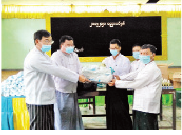
ဆက်လက်၍ အခြေခံပညာကျောင်းများနှင့် ဝန်းကျင်စိမ်းလန်းစိုပြည်စေရေးအတွက် စိန်တစ်လုံးသရက် ပျိုးပင် ၂၀၀ ကို ကျောင်းအုပ်ကြီးများထံ ဆက်လက်လှူဒါန်းခဲ့ကြောင်း သိရသည်။

ကျောင်းကုန်းမြို့အထက်တန်းကျောင်းများအတွက် ကိုဗစ်-၁၉ ရောဂါ ကာကွယ်ရေးပစ္စည်းများ လှူဒါန်း ကျောင်းကုန်း ဇူလိုင် ၃၀ ဧရာဝတီတိုင်းဒေသကြီး ကျောင်းကုန်းမြို့နယ် အခြေခံပညာအထက်တန်းကျောင်းများအတွက် ကိုဗစ်-၁၉ ရောဂါ ကာကွယ်ရေးပစ္စည်းများ လှူဒါန်းမှုကို ယမန်နေ့ မွန်းလွဲပိုင်းက မြို့နယ်ပညာရေးမှူးရုံးရှိ မြတ်ပညာခန်းမ၌ ကျင်းပခဲ့သည်။