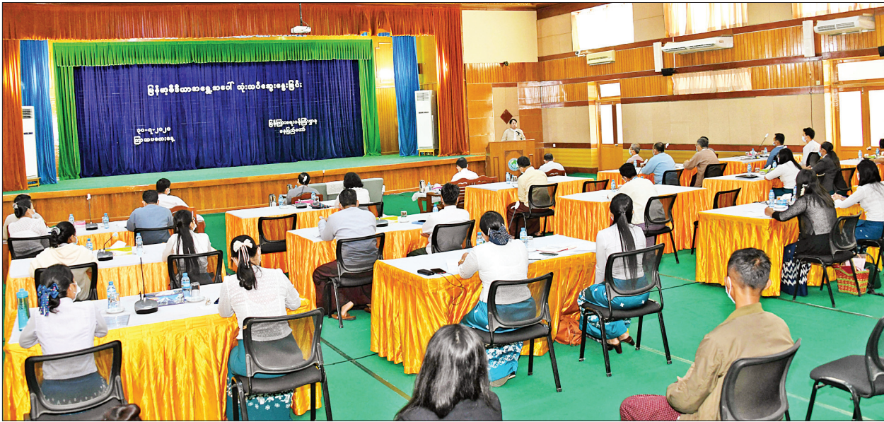
ပြည်ထောင်စုဝန်ကြီး ဒေါက်တာဖေမြင့် မြန်မာ့မီဒီယာအရွှေ့အပေါ် သုံးသပ်ဆွေးနွေးခြင်းအခမ်းအနားတွင် အဖွင့်အမှာစကား ပြောကြားစဉ်။