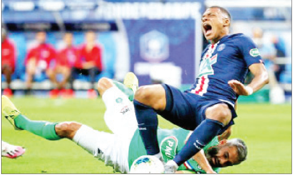
ကစားမှုကနေတစ်ဆင့် ဒဏ်ရာရရှိခဲ့ပြီး ပြိုင်ပွဲအတွင်း ကနေ ထွက်ခွာခဲ့ရတာဖြစ်ပါတယ်။ အမ်ဘတ်ပီဟာ ၂၀၁၈ ခုနှစ်က မိုနာကိုအသင်းကနေ အမြဲတမ်းစာချုပ်နဲ့ ပြောင်းရွှေ့လာခဲ့ပြီးနောက် ပီအက်စ်ဂျီ အသင်းအတွက် ၅၁ ပွဲမှာ ၄၉ ဂိုးအထိ သွင်းယူပေးနိုင်ခဲ့သူ လည်း ဖြစ်ပါတယ်။

ပြင်သစ်ကြယ်ပွင့် အမ်ဘတ်ပီဟာ ပီအက်စ်ဂျီအသင်း က စိန့်အက်စ်တီယန်အသင်းကို အနိုင်ရရှိခဲ့တဲ့ ပွဲစဉ်ရဲ့ ပထမပိုင်းပွဲချိန်အတွင်းမှာ စိန့်အက်စ်တီယန်အသင်း နောက်တန်းကစားသမား လျှိုက်ပါရင်ရဲ့ ကြမ်းတမ်းစွာ