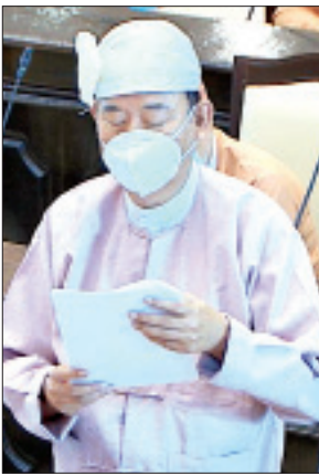
ဒုတိယဝန်ကြီး ဦးဝင်းမော်ထွန်း

ချင်းပြည်နယ် မဲဆန္ဒနယ်အမှတ်(၈)မှ ဦးမာန်လောမောင်း၏ ချင်းပြည်နယ် ရှိလက်ရှိ မြို့နယ်အဆင့် မြို့ပြနှင့်အိမ်ရာ ဖွံ့ဖြိုးရေးဦးစီးဌာနရှိသော ဟားခါးမြို့ မင်းတပ်မြို့နှင့် ဖလမ်းမြို့များတွင် ခရိုင်အဆင့် မြို့ပြနှင့် အိမ်ရာဖွံ့ဖြိုးရေးဦးစီးဌာန များ တိုးချဲ့ဖွင့်လှစ်ပေးရန်နှင့် ကျန်မြို့နယ်များရှိ မြို့နယ်အဆင့် မြို့ပြနှင့် အိမ်ရာဖွံ့ဖြိုးရေးဦးစီးဌာနများ တိုးချဲ့ဖွင့်လှစ်ပေးရန် အစီအစဉ် ရှိ မရှိ မေးခွန်းနှင့် စပ်လျဉ်း၍ ဆောက်လုပ်ရေးဝန်ကြီးဌာန ဒုတိယဝန်ကြီး ဒေါက်တာကျော်လင်းက