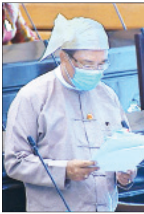
ဒုတိယဝန်ကြီး ဒေါက်တာကျော်လင်း