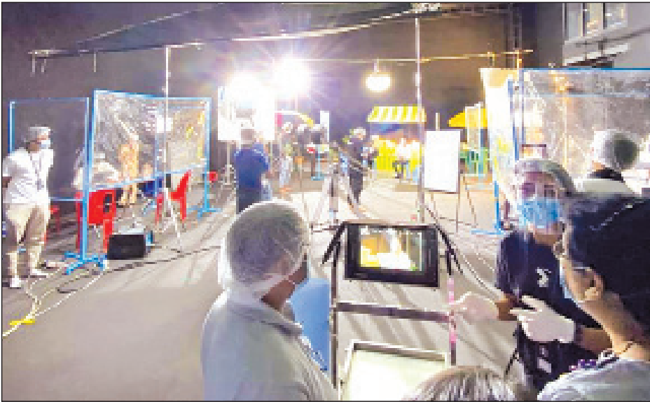
ဇူလိုင် ၄ ရက်က ရုပ်ရှင်သရုပ်ပြရိုက်ကူးခဲ့ကြစဉ်။

ကိုဗစ်-၁၉ ရောဂါကာကွယ် ထိန်းချုပ် ကုသရေး အမျိုးသားအဆင့်ဗဟို ကော်မတီမှ ရုပ်ရှင်၊ ဗီဒီယိုနှင့် ရုပ်သံ ဇာတ်လမ်းတွဲများကို ပြန်လည် ရိုက်ကူး ခွင့်ပြုလိုက်ပြီဖြစ်ရာ ရိုက်ကူး မည့်သူများအနေဖြင့် ကျန်းမာရေးနှင့် အားကစားဝန်ကြီးဌာနနှင့် ပြန်ကြားရေးဝန်ကြီးဌာနတို့ ပူးပေါင်းရေးဆွဲ ထားသောလုပ်ငန်းလမ်းညွှန်ချက်များ ထဲမှ စည်းမျဉ်းစည်းကမ်းများကို လိုက်နာဆောင်ရွက်ကြရန်လိုအပ်ပြီး ရုပ်ရှင်ရိုက်ကူးရေးလုပ်ငန်းနှင့် ရှိဖွင့် ပြသရေးလုပ်ငန်းများအားလုံး အဆင်ပြေ ချောမွေ့စေရန်အတွက် ရုပ်ရှင် လောကသားများက စည်းလုံးညီညွတ်သောအသိစိတ်ဖြင့် ဆောင်ရွက်ကြရန်လိုအပ်ကြောင်း မြန်မာနိုင်ငံ ရုပ်ရှင်အစည်းအရုံးဥက္ကဋ္ဌ ဦးညီညီထွန်းလွင်က ပြောသည်။