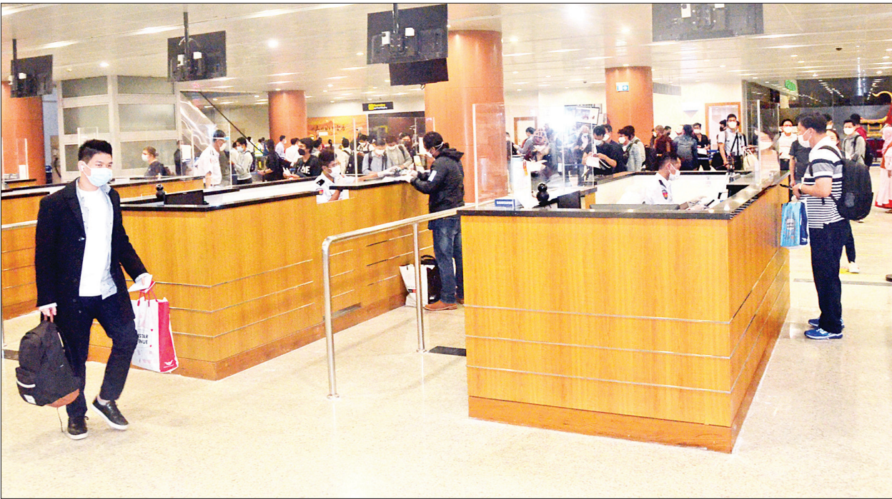
ကိုရိုနာဗိုင်းရပ်စ် အန္တရာယ်အပြည့်အဝရှိသည့်အခါ အခက်အခဲကြုံတွေ့နေရသည့် မြန်မာနိုင်ငံသားများအား ရန်ကင်းအပြည်ပြည်ဆိုင်ရာလေဆိပ်၌ တွေ့ရစဉ်။

နေပြည်တော် ဇူလိုင် ၂၈ နိုင်ငံတကာ ခရီးသည်တင်လေယာဉ်များပျံသန်းမှု ယာယီရပ်ဆိုင်းထားခြင်းကြောင့် ပြည်ပနိုင်ငံများ၌ အခက်အခဲကြုံတွေ့နေရသည့် ကိုရိုနာဗိုင်းရပ်စ် အန္တရာယ်အပြည့်အဝရှိသည့် မြန်မာနိုင်ငံသားများအား ပြန်လည်ခေါ်ဆောင်ရန် အစီအစဉ်များ ရှိနေပါသည်။ အင်ဒိုနီးရှားနိုင်ငံ၊ ဘယ်လ်ဂျီယံနိုင်ငံ၊ အီတလီနိုင်ငံ၊ ဟန့်ဂေရီနိုင်ငံ၊ ဆိုက်ပရပ်စ်နိုင်ငံ၊ ဂျပန်နိုင်ငံ၊ ဂျာမနီနိုင်ငံတို့မှ မြန်မာနိုင်ငံသား ၇၇ ဦး စုစုပေါင်း ၁၁၄ ဦးတို့အား အင်ဒိုနီးရှားအပြည်ပြည်ဆိုင်ရာလေဆိပ်မှတစ်ဆင့် (၁၅)ကြိမ်မြောက် ကိုရိုနာဗိုင်းရပ်စ် အန္တရာယ်အပြည့်အဝရှိသည့် မြန်မာနိုင်ငံသားများအား ပြန်လည်ခေါ်ဆောင်ရန် ယနေ့ညပိုင်းတွင် ရန်ကင်းအပြည်ပြည်ဆိုင်ရာလေဆိပ်သို့ အဆင်ပြေချောမွေ့စွာ ပြန်လည်ရောက်ရှိကြသည်။