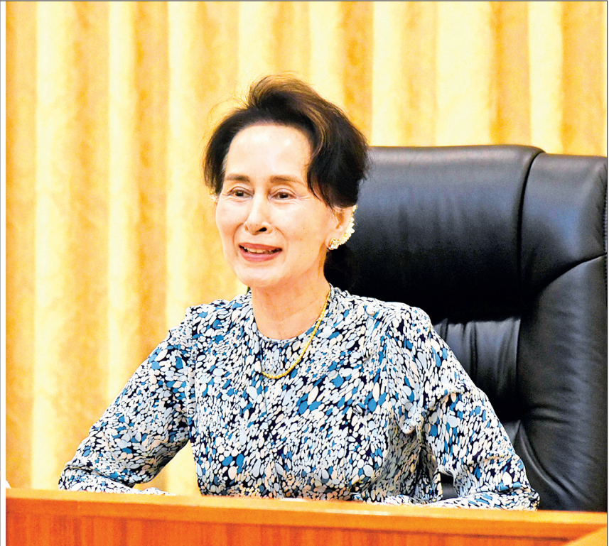
Coronavirus Disease 2019 (COVID-19) ကာကွယ်၊ ထိန်းချုပ်၊ ကုသရေး အမျိုးသားအဆင့်ဗဟိုကော်မတီဥက္ကဋ္ဌ၊ နိုင်ငံတော်၏အတိုင်ပင်ခံပုဂ္ဂိုလ် ဒေါ်အောင်ဆန်းစုကြည် COVID-19 ကာကွယ်၊ ထိန်းချုပ်၊ ကုသရေးကာလတွင် ရုပ်ရှင်လုပ်ငန်းများ ပြန်လည်လည်ပတ်နိုင်ရေးနှင့်စပ်လျဉ်း၍ ပြည်ထောင်စုဝန်ကြီး ဒေါက်တာမြင့်ထွေး၊ မြန်မာနိုင်ငံရုပ်ရှင်အစည်းအရုံးဥက္ကဋ္ဌ ဦးညီညီထွန်းလွင်၊ မင်္ဂလာရုပ်ရှင်ရုံများအုပ်စုဥက္ကဋ္ဌ ဦးဇော်မင်းတို့နှင့် အပြန်အလှန်ဆွေးနွေးစဉ်။

နေပြည်တော် ဇူလိုင် ၂၈ Coronavirus Disease 2019(COVID-19)ကာကွယ်၊ ထိန်းချုပ်၊ ကုသရေး အမျိုးသားအဆင့်ဗဟိုကော်မတီဥက္ကဋ္ဌ၊ နိုင်ငံတော်၏အတိုင်ပင်ခံပုဂ္ဂိုလ် ဒေါ်အောင်ဆန်းစုကြည်သည် COVID-19 ကာကွယ်၊ ထိန်းချုပ်၊ ကုသရေးကာလတွင် ရုပ်ရှင်လုပ်ငန်းများ ပြန်လည်လည်ပတ်နိုင်ရေးနှင့်စပ်လျဉ်း၍ ကျန်းမာရေးနှင့်အားကစားဝန်ကြီးဌာန ပြည်ထောင်စုဝန်ကြီး ဒေါက်တာမြင့်ထွေး၊ မြန်မာနိုင်ငံရုပ်ရှင်အစည်းအရုံးဥက္ကဋ္ဌ ဦးညီညီထွန်းလွင်၊ မင်္ဂလာရုပ်ရှင်ရုံများအုပ်စုဥက္ကဋ္ဌ ဦးဇော်မင်းတို့နှင့် ယနေ့နံနက် ၁၀ နာရီတွင် နေပြည်တော်ရှိ နိုင်ငံတော်သမ္မတအိမ်တော် အစည်းအဝေးခန်းမ၌ Video Conferencing စနစ်ဖြင့် ချိတ်ဆက်တွေ့ဆုံ၍ လက်တွေ့အခြေအနေများကို အပြန်အလှန်ဆွေးနွေးသည်။ ရှေးဦးစွာ Coronavirus Disease 2019 (COVID-19) ကာကွယ်၊ ထိန်းချုပ်၊ ကုသရေး အမျိုးသားအဆင့်ဗဟိုကော်မတီဥက္ကဋ္ဌ၊ နိုင်ငံတော်၏အတိုင်ပင်ခံပုဂ္ဂိုလ်က နှုတ်ခွန်းဆက်စကား ပြောကြားရာတွင် ယခုအခါတွင် ကိုဗစ်နှင့်ပတ်သက်ပြီး ပြည်သူများပေါ့ဆလာသည်ကို ပြည်ထောင်စုဝန်ကြီး ဒေါက်တာမြင့်ထွေးက များစွာစိုးရိမ်နေပါကြောင်း၊ ယခုအချိန်သည် ပေါ့ဆ၍ရသည့်အချိန် မဟုတ်သေးသည့်အတွက် ဆက်လက်၍ သတိနှင့် နေထိုင်ရမည်ဖြစ်ပါကြောင်း၊ စာမျက်နှာ ၃ ကော်လံ ၁ သို့ ။