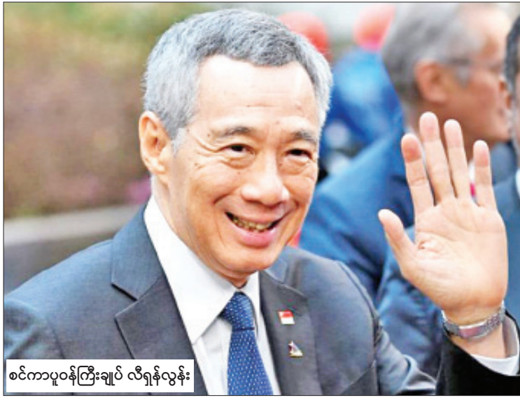
စင်ကာပူဝန်ကြီးချုပ် လီရှန်လွန်း