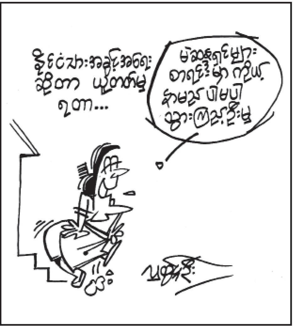
ဥပဒေဘောင်အတွင်း နေထိုင်ခြင်း ဘေးကင်းရန်ကွာ လွန်ချမ်းသာ

ထို့အပြင် ကလေးဝမြို့နယ် သက္ကယ်ကျင်း-ဖောင်းပြင်-ဟုမ္မလင်းကား လမ်း မိုင်တိုင် (၄/၅) ဖာလုံအနီးနေရာနှင့် ပလ္လင်ကြိုးပိုင်းအတွင်းတို့မှ တရားမဝင် ကညင်သစ် ၁၉ တန်၊ ထွန်စက်သုံးစီး၊ လက်ကိုင်စက်လွှတ်စက်နှင့်အတူ ပြစ်မှုကျူးလွန်သူ တစ်ဦး၊ ယင်းမာပင်မြို့နယ် တရော်ကျင်းကျေးရွာအနီး ကျောက်တွင်းကွင်းတောလမ်းတွင် ယာဉ်ပေါ်မှ တရားမဝင်ကျွန်းခွဲသား နှစ်တန်နှင့်အတူ ပြစ်မှုကျူးလွန်သူ တစ်ဦး၊ လှည်းကူးမြို့နယ် ရန်ကုန်-မန္တလေး အမြန်လမ်းမကြီး မိုင်တိုင်(၃/၅) တွင် မော်တော်ယာဉ်ပေါ်မှ တရားမဝင် ကျွန်းတံခါးရွက်အပိုင်းအစ၊ ပျဉ်းကတိုးခွဲသားတစ်တန်နှင့်အတူ ပြစ်မှုကျူးလွန်သူ တစ်ဦးတို့အား ဖမ်းဆီးရမိခဲ့သည်။ ပြစ်မှုကျူးလွန်သူများအား ဥပဒေနှင့်အညီ အရေးယူနိုင်ရေး သက်ဆိုင်ရာရဲစခန်းတွင် အမှုဖွင့်ဆောင်ရွက်လျက်ရှိကြောင်း သစ်တောဦးစီးဌာနမှ သိရသည်။