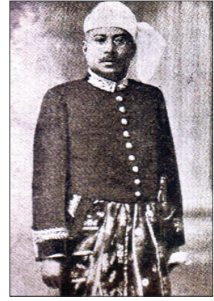
ဒိုင်အာဒီခေတ် ပြည်ထဲရေးဝန်ကြီး ဦးမေအောင်

(ကွယ်လွန်)နဲ့ ဆရာကြီး ဒေါက်တာမင်းတင်မွန်တို့က ဒီမိနစ်ကြီးမှာပဲ လူငယ်တွေနားလည်လွယ်တဲ့နည်းနဲ့ အဘိဓမ္မာသင်တန်းတွေ ပို့ချပေးခဲ့ပါတယ်။ ဒီမိနစ်ကြီးမှာ ပထမဆုံး တရားဟောခွင့်ရတဲ့ ဆရာကြီးဦးလင်းရဲ့ ဘဝဇာတ်ကြောင်းကလည်း စိတ်ဝင်စားဖို့ကောင်း ပါပါတယ်။