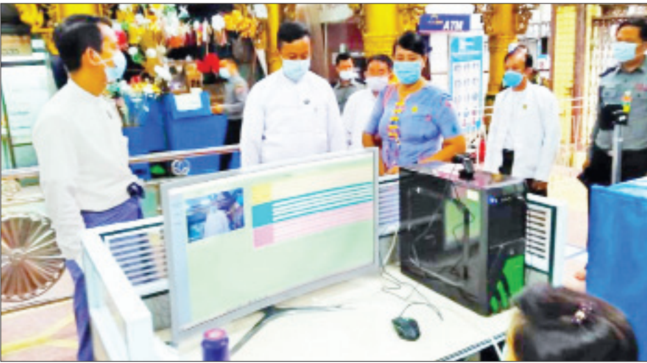
ဆူးလေစေတီတော်ဖွင့်လှစ်ရန်အတွက် ယနေ့ညနေပိုင်းက စစ်ဆေးနေကြစဉ်။