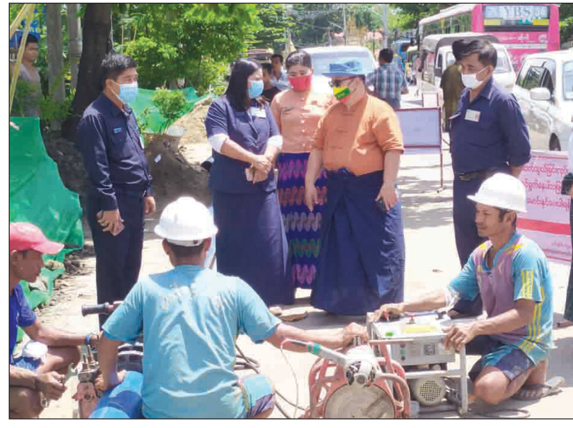
ခြင်း၊ မြို့နယ်အလိုက် ရေပိုက်လိုင်းကွန်ရက်များကို နှစ်စဉ်ဘတ်ဂျက်အလိုက် တည်ဆောက်ခြင်း စသည် ဖြင့် ဘက်ပေါင်းစုံမှ ဆောင်ရွက်နေကြောင်း သိရသည်။

အဓိကအားဖြင့် ရန်ကုန်မြို့ကို ချိုးဖြူနှင့် လှော်ကားကန်တို့ မှ ရေကိုသန့်စင်လျက် ရေပိုက်လိုင်းကြီးများဖြင့် ပေးပို့လျက်ရှိ ကြောင်း၊ လဂွမ်းပြင် ရေရရှိရေးစီမံကိန်းကိုလည်း အကောင် အထည်ဖော်ဆောင်ရွက်နေကြောင်း၊ သို့သော်လည်း ရန်ကုန်မြို့၏ ရေလိုအပ်ချက်ကို ပြည့်ဆည်းပေးနိုင်ရန် ရေအရင်းအမြစ်သစ် များ အကောင်အထည်ဖော်ဆောင်ရွက်ခြင်း၊ ဆွေးမြည့်နေသော ပိုက်လိုင်းများကိုလည်း အဆင့်မြင့်ကော်ပိုက်များဖြင့် အစားထိုး