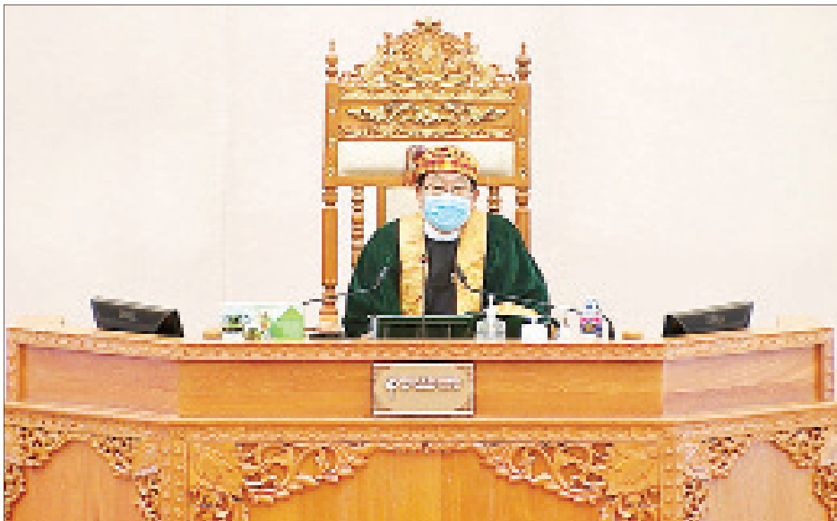
ဒုတိယအကြိမ် ပြည်ထောင်စုလွှတ်တော် (၁၇) ကြိမ်မြောက် ပုံမှန်အစည်းအဝေး ဆဋ္ဌမနေ့ ကျင်းပစဉ်။

အနေဖြင့် အမျိုးသားခေါင်းဆောင်ကြီး ဗိုလ်ချုပ်အောင်ဆန်း ရုပ်ပုံပါ ငါးရာကျပ်တန်ပုံစံသစ် ငွေစက္ကူကို ၂၀၂၀ ပြည့်နှစ် ဇူလိုင် ၁၉ ရက်တွင် စတင်ထုတ်ဝေမည်ဖြစ်ကြောင်း ထုတ်ပြန်ကြေညာခဲ့ပြီးဖြစ်ပါကြောင်း။ သို့သော် ၂၀၂၀ ပြည့်နှစ် ဇူလိုင် ၁၉ ရက်သည် အစိုးရရုံးပိတ်ရက်ဖြစ်သည့်အတွက် ရုံးဖွင့်ရက်ဖြစ်သည့် ၂၀၂၀ ပြည့်နှစ် ဇူလိုင် ၂၁ ရက်တွင် ပြည်သူများထံသို့ စာမျက်နှာ ၄ ကော်လံ ၁ သို့ ❖