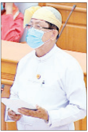
ဒုတိယဝန်ကြီး ဦးမောင်မောင်ဝင်း