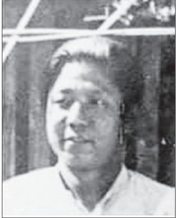
ပြည်လှဖေ