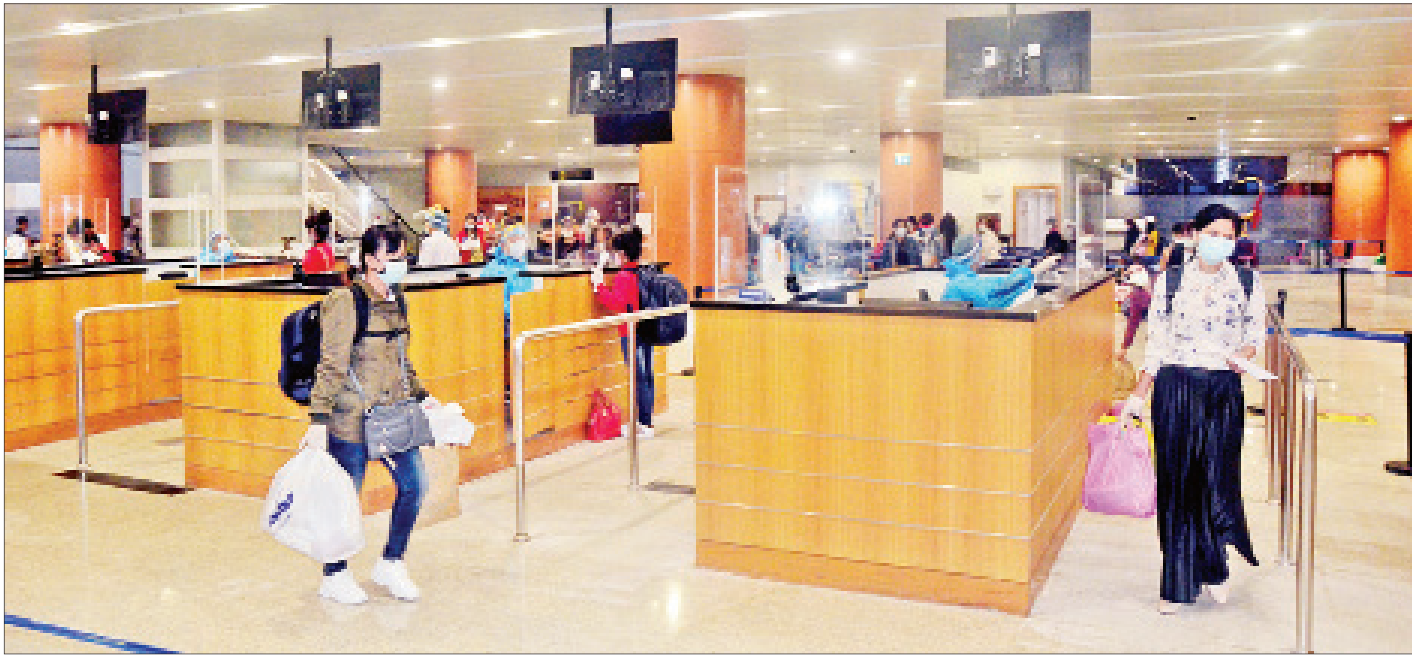
ကျော်ဒန်နိုင်ငံမှ ပြန်လည်ရောက်ရှိလာသည့် မြန်မာနိုင်ငံသားများအား ရန်ကုန်အပြည်ပြည်ဆိုင်ရာလေဆိပ်၌ တွေ့ရစဉ်။