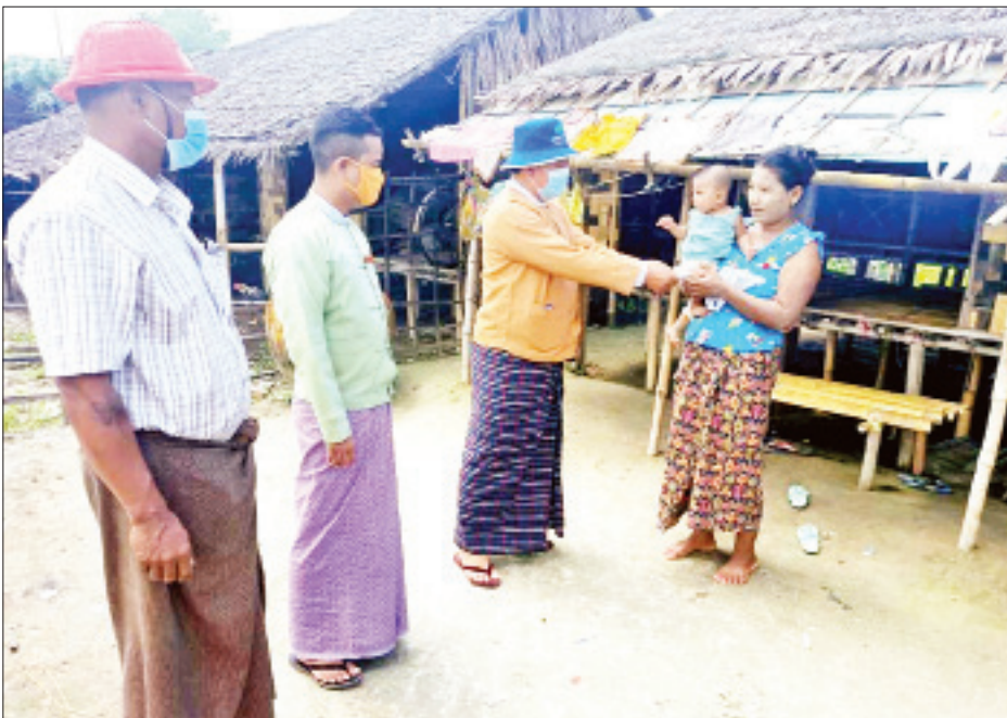
ဦးမျိုးဆွေ၊ မြို့နယ်အထွေထွေအုပ်ချုပ် ကျေးရွာအုပ်စု အုပ်ချုပ်ရေးမှူးများက ကြောင်း သိရသည်။ မြို့နယ်(ပြန်/ဆက်)

သုံးခွ ဇူလိုင် ၂၆ ရန်ကုန်တောင်ပိုင်းခရိုင် သုံးခွမြို့နယ် တွင် ပုံမှန်ဝင်ငွေမရှိသောအခြေခံလူ တန်းစားများအား ထောက်ပံ့ငွေပေး အပ်ခြင်းကို ယမန်နေ့ နံနက်ပိုင်းတွင် ရပ်ကွက်/ကျေးရွာများ သို့ အိမ်တိုင်ရာ ရောက် လိုက်လံပေးအပ်ခဲ့ကြောင်း သိရသည်။ ထောက်ပံ့ ပုံမှန်ဝင်ငွေမရှိသော အိမ်ထောင်စု များအား တတိယအကြိမ်အဖြစ် တစ် အိမ်ထောင်လျှင် ငွေကျပ် ၂၀၀၀၀ နှုန်း ဖြင့် အိမ်ထောင်စု ၂၆၆၃၅ စုအတွက် စုစုပေါင်းငွေကျပ် ၅၃၂၇၀၀၀၀ ထောက်ပံ့ခြင်းဖြစ်ကြောင်း မြို့နယ် အထွေထွေအုပ်ချုပ်ရေး ဦးစီးဌာနမှ သိရသည်။ အဆိုပါ ထောက်ပံ့ငွေများကို လိုက်လံပေးအပ်ရာတွင် အမှတ်(၁) တိုင်းဒေသကြီးလွှတ်တော်ကိုယ်စား လှယ် ဦးနေဝင်း၊ အမှတ်(၂)တိုင်း ဒေသကြီး လွှတ်တော်ကိုယ်စားလှယ်