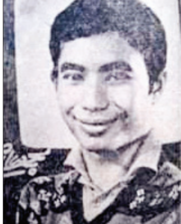
ကိုမြင့်