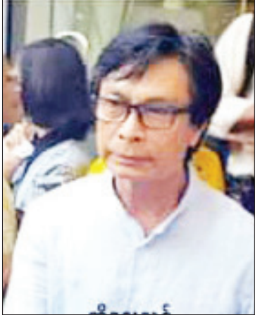
ကိုဌေးသစ်