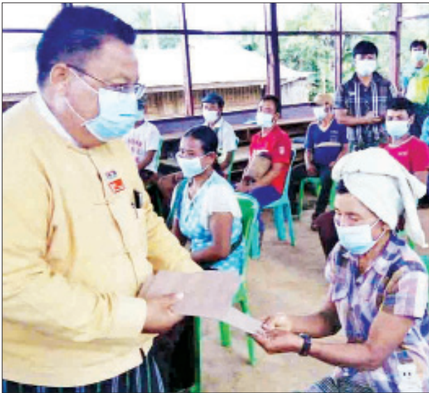
ဒီးမော့ဆို ဇူလိုင် ၂၆

ပုံမှန်ဝင်ငွေမရှိသော အိမ်ထောင်စုများအား ထောက်ပံ့ငွေပေးအပ်ခြင်းကို