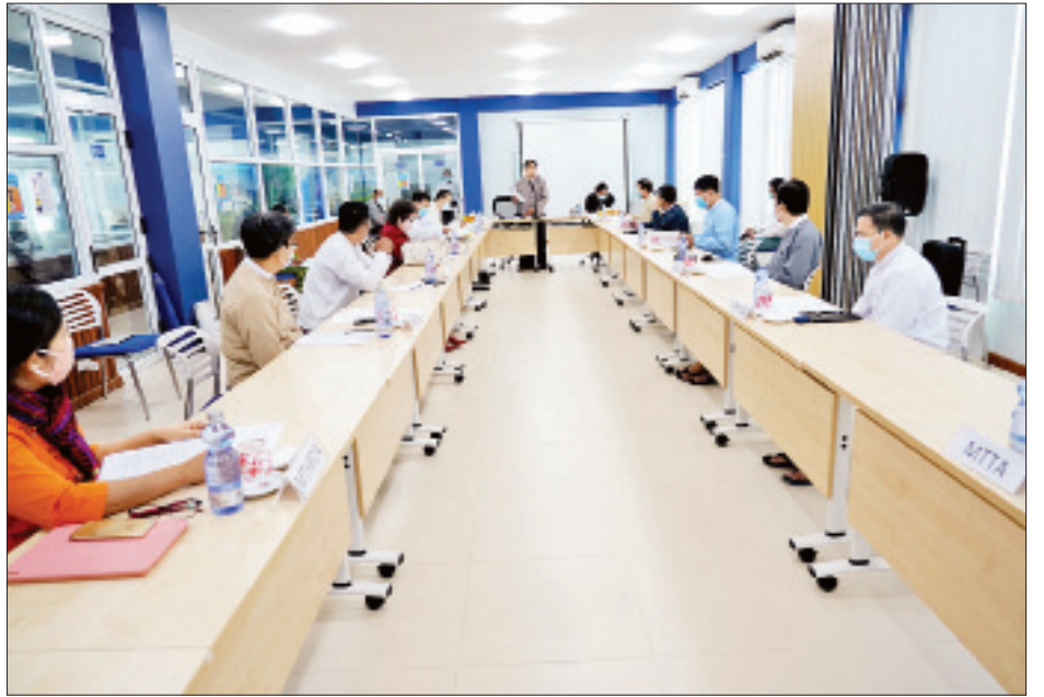
ကဏ္ဍအလိုက် လုပ်ငန်းဆောင်ရွက်နေမှု အခြေအနေများကို သည်များကို ဖြည့်စွက်ဆွေးနွေးကာ ပေါင်းစပ်ဆောင်ရွက်အသီးသီးဆွေးနွေးတင်ပြကြရာ ဒုတိယဝန်ကြီးက လိုအပ်ပေးခဲ့ကြောင်း သိရသည်။ သတင်းစဉ်

ခရီးသွားလုပ်ငန်းအဖွဲ့ချုပ်နှင့် ညီနောင်အသင်းများ၏ အကြံပြုချက်များကိုလည်း ပင်မစီမံကိန်းတွင် ထည့်သွင်းသွားမည်ဖြစ်ပါကြောင်း၊ ထို့ကြောင့် တက်ရောက်လာကြသူများအနေဖြင့် ပင်မစီမံကိန်းတွင် ထပ်မံဖြည့်စွက်လိုသည်များကို အကြံပြုဆွေးနွေးကြစေလိုပါကြောင်း ပြောကြားသည်။ ရှင်းလင်းတင်ပြ ထို့နောက် ဟိုတယ်နှင့်ခရီးသွားညွှန်ကြားမှုဦးစီးဌာန လေ့ကျင့်ရေးနှင့် ပညာပေးရေးဌာနမှ ညွှန်ကြားရေးမှူးက ခရီးသွားလုပ်ငန်း ပင်မစီမံကိန်းရေးဆွဲဆောင်ရွက်ထားရှိမှုများ၊ စီမံကိန်းပါမဟာဗျူဟာ(၆)ရပ်နှင့် ဆောင်ရွက်ရမည့် အချက်အလက်များကို ရှင်းလင်းတင်ပြသည်။ ယင်းနောက် ကရင်တိုင်းရင်းသားလူမျိုးရေးရာဝန်ကြီး ဒေါ်နော်ပန်းသဗ္ဗာဗျို၊ မြန်မာနိုင်ငံ ခရီးသွားလုပ်ငန်းအဖွဲ့ချုပ်နှင့် ညီနောင်အသင်း ၁၁ သင်းမှ ဥက္ကဋ္ဌများ၊ အတွင်းရေးမှူးနှင့် အလုပ်အမှုဆောင်များက ခရီးသွားလုပ်ငန်းပင်မစီမံကိန်းတွင် ဖြည့်စွက်သင့်သည့်အချက်များကို အကြံပြုဆွေးနွေးပြီး ရန်ကုန်တိုင်းဒေသကြီးအတွင်း ခရီးသွားလုပ်ငန်းဖွံ့ဖြိုးတိုးတက်မှု ဆောင်ရွက်နေမှုများ၊ ခရီးစဉ်ဒေသအသစ်များ ဖော်ထုတ်ရေးဆောင်ရွက်နေမှုများ၊ လက်ရှိတွေ့ကြုံနေရသည့် အခက်အခဲများနှင့် သက်ဆိုင်ရာ