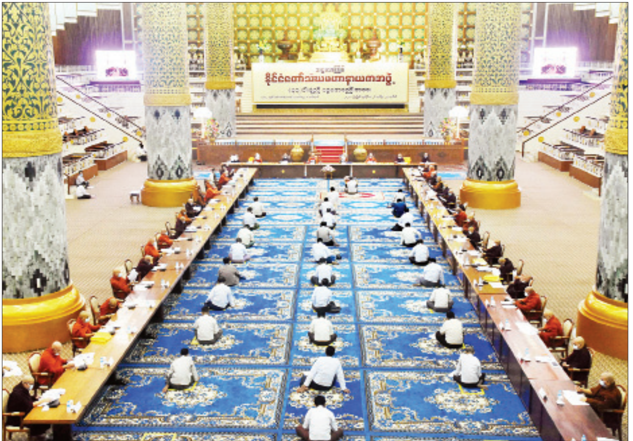
အဋ္ဌမအကြိမ် နိုင်ငံတော်သံဃမဟာနာယကအဖွဲ့ (၄၇)ပါးစုံညီ ပဋ္ဌမအစည်းအဝေး ပထမနေ့ ကျင်းပစဉ်။

ဝိနိစ္ဆယရေးရာမှူးများဖြစ်ပွား၍ နှစ်ဖက်ပက္ခပုဂ္ဂိုလ်များကို သံဃဝိနိစ္ဆယအဖွဲ့များဖြင့် စစ်ဆေးခြင်း၊ ဗဟိုဝန်ဆောင် စုံစမ်းရေးအဖွဲ့များ ဖွဲ့စည်း၍ စစ်ဆေးခြင်းများ ဆောင်ရွက်ရာတွင် စစ်ဆေးဆောင်ရွက်ကြသူများအနေဖြင့် ဆန္ဒ၊ ဒေါသ၊ ဘယ၊ မောဟ ဟူသော အကြောင်းတရားလေးပါးကြောင့် ဖြစ်စဉ်အမှန်အကြောင်းအရာကို သွေဖည်၍ မမှန်မကန်ဆုံးဖြတ်ခြင်းဟုခေါ်ဆိုသည့် အကတိလေးဖြာကင်းရှင်းစွာ စစ်ဆေးဆုံးဖြတ်ရန် လိုအပ်သကဲ့သို့ စစ်ဆေးဆုံးဖြတ်ပြီးသော ဆုံးဖြတ်ချက်များကိုလည်း အကြိမ်ကြိမ် ပြင်ဆင်ဆုံးဖြတ်ခြင်းများကို အတတ်နိုင်ဆုံးမပြုလုပ်ရန် လိုအပ်ပါကြောင်း၊ သို့မှသာ လိုက်နာအကောင်အထည်ဖော် ဆောင်ရွက်သူများအနေဖြင့် မှန်မှန်ကန်ကန်နှင့် မြန်မြန်ဆန်ဆန် ထိရောက်အောင်မြင်အောင် အကောင်အထည်ဖော်ဆောင်ရွက်နိုင်မည်ဖြစ်ပါကြောင်း။