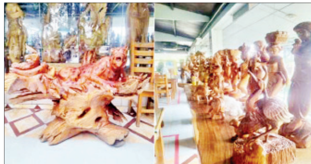
နေပြည်တော် ဇူလိုင် ၂၆ နေပြည်တော် မျှော်လင့်ရုံမျိုးနွယ်အသင်း စစ်မှန်မြန်မာ့စက်မှုလက်မှု အနုပညာ လုပ်ငန်းနှင့် အထွေထွေစီးပွားရေးသမဝါယမအသင်းကို ၂၀၁၅ ခုနှစ်တွင်ဖွဲ့စည်း

ခဲ့ပြီး အနုပညာလက်ရာမြောက်ပန်းပုလုပ်ငန်းဖြစ်သည့် ရုပ်တု၊ ရုပ်လုံး၊ ရုပ်ကြွ များ၊ ကျောက်ဆစ်လုပ်ငန်း၊ အဆောက်အအုံများတွင် အလှဆင်ပစ္စည်းများ၊ ခန်းဆီး၊ လိုက်ကာ၊ ပန်းခက်၊ ပန်းဆွဲ၊ ပွတ်လုံး၊ မှန်ပေါင် စသည့်လုပ်ငန်းများ အပြင် ရွှေချည်ထိုးလုပ်ငန်းများ၊ ပိုးထည်ချည်ထည် ရောင်းဝယ်ခြင်းလုပ်ငန်း၊ ယွန်းထည်ပစ္စည်းများ ထုတ်လုပ်ရောင်းချခြင်းလုပ်ငန်း၊ ငွေထည်ပစ္စည်းများ၊ ပန်းချီ၊ ဓာတ်ပုံများ ရောင်းဝယ်ခြင်းနှင့် အနုပညာလက်ရာမြောက်ပစ္စည်းများ ကိုလည်း ပြည်တွင်းစေ့စပ်ကွက်တွင်သာမက နိုင်ငံခြားဝင်ငွေရရှိရေးအတွက် ပြည်ပဈေးကွက်အထိ တင်ပို့ရောင်းချနိုင်ရန် ဆောင်ရွက်လျက်ရှိသည်။