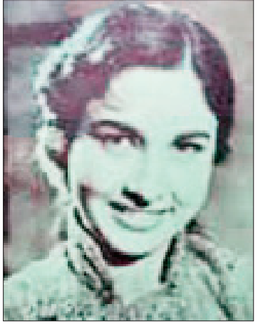
မေလှဝင်း