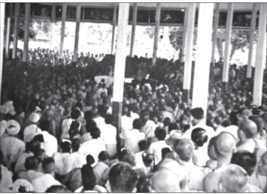
၁၄ ခန်းဧရပ်ထဲက အခမ်းအနား။

ရောက်တိုင်း၊ အာဇာနည်နေ့အခမ်းအနားများ ကျင်းပပြီး အလေးပြု၊ မေတ္တာပို့၊ အမျှဝေကြတယ်။ ဒီလိုကျင်းပကြတဲ့ အနက် ရန်ကုန်ရွှေတိဂုံခြေရင်းက အာဇာနည်မိမိမာန်မှာ ကျင်းပတဲ့ အာဇာနည်နေ့အခမ်းအနားပြီးရင် မန္တလေး အိမ်တော်ရာ ၁၄ ခန်းဧရပ်ကြီးမှာ ကျင်းပတဲ့ အာဇာနည်နေ့ အခမ်းအနားက အကြီးကျယ်ဆုံး ဖြစ်ပါလိမ့်မယ်။ ၁၄ ခန်းဧရပ်ကြီးရဲ့ အနောက်ဘက်ခြမ်းမှာ ကြက်သွေးရောင် ကတ္တီပါကားကြီး ဆင်ထားတယ်။ အလျားပေ ၅၀၊ အမြင့်ပေ ၂၀ လောက်ရှိမှာပေါ့။ ကတ္တီပါကားကြီးမှာ အာဇာနည်ကြီးများ ဓာတ်ပုံကို ချိတ်ဆွဲထားတယ်။ အလယ်ခေါင် အမြင့်ဆုံးမှာ ဗိုလ်ချုပ်အောင်ဆန်းဓာတ်ပုံကို ချိတ်ဆွဲပြီး ဝဲ/ယာနှစ်ဘက် အညီအမျှနှင့် မှောက်ထားတဲ့ စက်ဝိုင်းခြမ်းသဏ္ဍာန်အတိုင်း ကျန်အာဇာနည်ကြီးများ ဓာတ်ပုံတွေ ချိတ်ဆွဲတယ်။ ဒီစက်ဝိုင်းကွေးအောက်မှာ