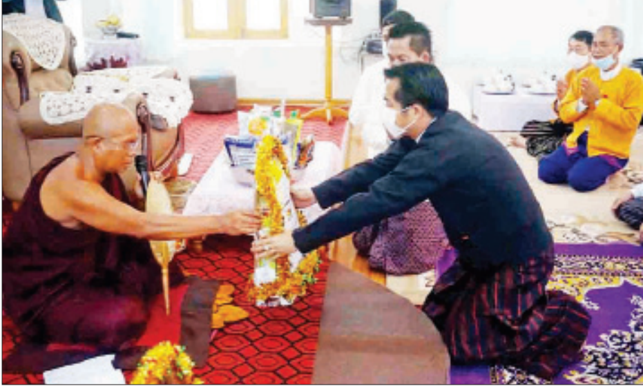
(၇၃)နှစ်မြောက် အာဇာနည်နေ့အထိမ်းအမှတ်အဖြစ် ကယားပြည်နယ်ဝန်ကြီးချုပ် ဦးအယ်လ်ဖောင်းရှိ ဆရာတော်ထံ လှူဖွယ်ဝတ္ထုပစ္စည်းများ ဆက်ကပ်လှူဒါန်းစဉ်။

လှူဒါန်းပွဲကို ဇူလိုင် ၁၉ ရက် နံနက် ၆ နာရီက မြို့နယ် အထွေထွေအုပ်ချုပ်ရေးဦးစီးဌာန စကားဝါမြေခန်းမ၌ ကျင်းပသည်။