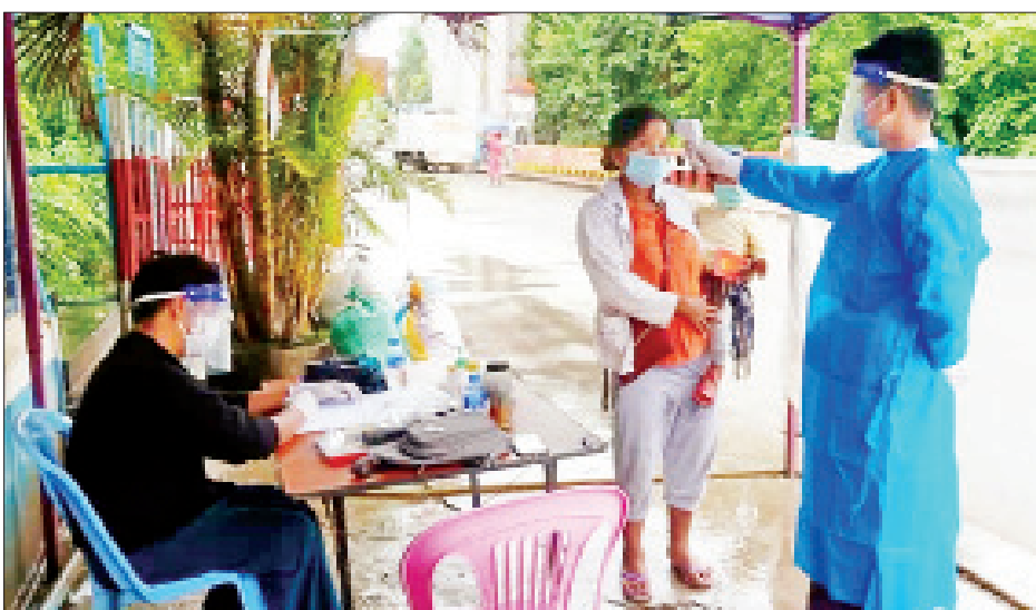
ကျန်းမာရေးနှင့် အားကစားဝန်ကြီးဌာန