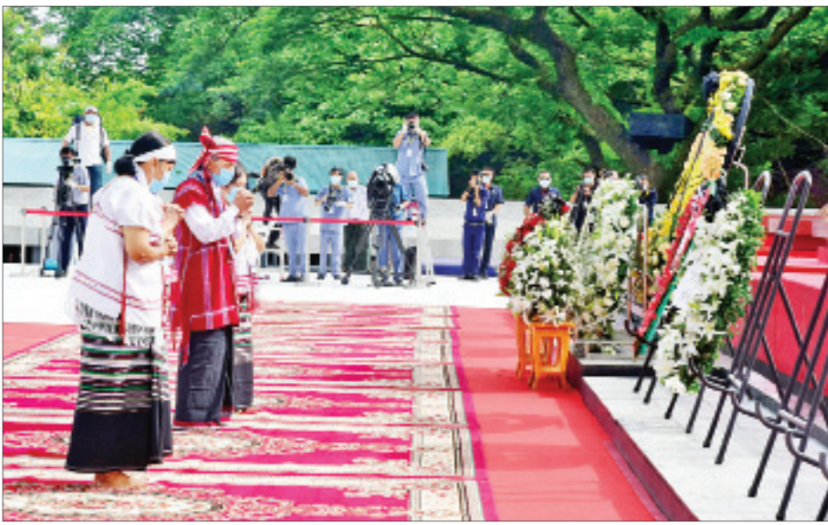
မန်းဘခိုင်ဂူဗိမာန်၌ မန်းဘခိုင်၏ မိသားစု လွမ်းသူပန်းခွေချ ဂါရဝပြုစဉ်။ (သတင်း-ရှေ့ဖုံး)