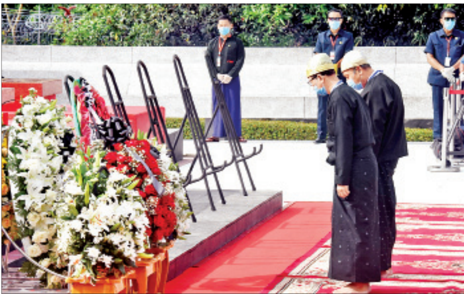
ဒီးဒုတ်ဦးဘချိုဂူဗိမာန်၌ ဒီးဒုတ်ဦးဘချို၏ မိသားစု လွမ်းသူပန်းခွေချ ဂါရဝပြုစဉ်။ (သတင်း-ရှေ့ဖုံး)