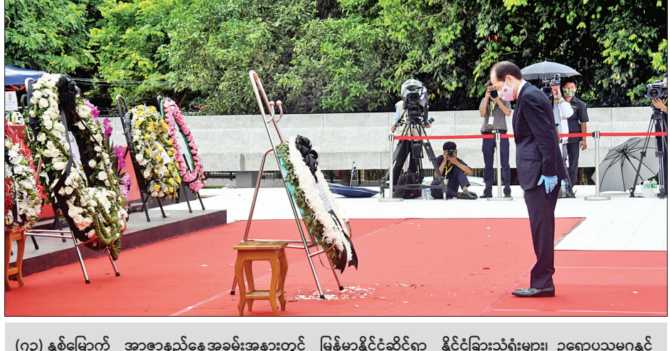
(၇၃) နှစ်မြောက် အာဇာနည်နေ့အခမ်းအနားတွင် မြန်မာနိုင်ငံဆိုင်ရာ နိုင်ငံခြားသံရုံးများ၊ ဥရောပသမဂ္ဂနှင့် ကုလသမဂ္ဂလက်အောက်ခံအဖွဲ့အစည်းများမှ သံအမတ်ကြီးများ၊ သံရုံးယာယီတာဝန်ခံများနှင့် ကိုယ်စားလှယ်များက အာဇာနည်ခေါင်းဆောင်ကြီးများ၏ ဂူဗိမာန်၌ လွှမ်းသူးပန်းခွေချ ဂါရဝပြုစဉ်။