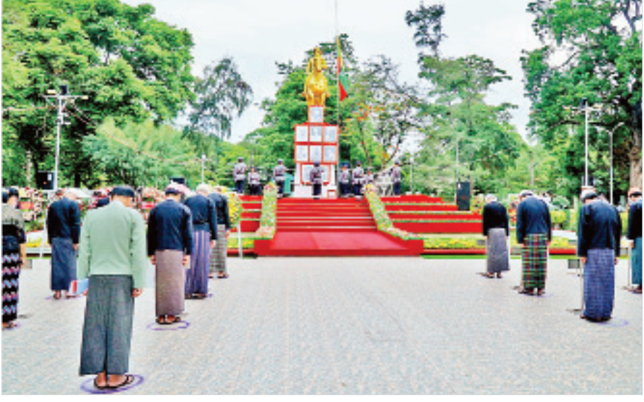
မကွေးတိုင်းဒေသကြီး ဝန်ကြီးချုပ် ဒေါက်တာအောင်မိုးညိုနှင့် တက်ရောက်လာကြသူများ ဗိုလ်ချုပ်အောင်ဆန်း နှင့် တကွ အာဇာနည်ခေါင်းဆောင်ကြီးများအား အလေးပြုကြစဉ်။