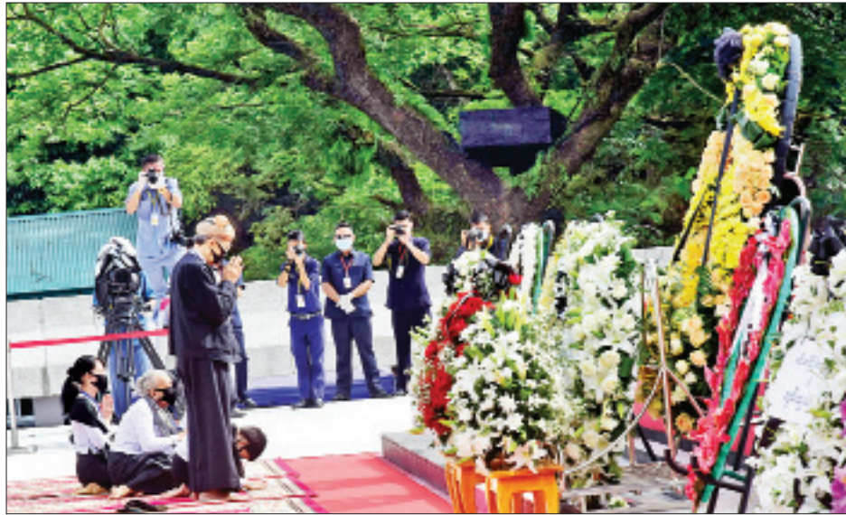
မိုင်းပွန်စော်ဘွားကြီး စစ်ထွန်းဂုဏ်မာန်၌ မိုင်းပွန်စော်ဘွားကြီး စစ်ထွန်း၏ မိသားစု လွှမ်းမိုးမှုနှင့်အညီ ကန်တော့စဉ်။

ခရာမှတ်၍ လည်းကောင်း အလေးပြုကြသည်။ ထို့နောက် ဗိုလ်ချုပ်အောင်ဆန်း၏ သားဖြစ်သူ ဦးအောင်ဆန်းဦး ကိုယ်စားတူတော်စပ်သူ ဦးရဲအောင်သန်း၊ သမီးဖြစ်သူ နိုင်ငံတော်၏အတိုင်ပင်ခံပုဂ္ဂိုလ် ဒေါ်အောင်ဆန်းစုကြည်အပါအဝင် အာဇာနည်ခေါင်းဆောင်ကြီးများ၏ မိသားစုဝင်များက အထိမ်းအမှတ်ဂုဏ်မာန်၌ လွှမ်းမိုးမှုနှင့်အညီ ဝမ်းနည်းခြင်းများချကာ အလေးပြုကြပြီး ဂါရဝပြုမေတ္တာပို့သ အမျှပေးဝေကြသည်။ ယင်းနောက် အခမ်းအနားကျင်းပရေးလုပ်ငန်းကော်မတီဥက္ကဋ္ဌ ရန်ကုန်တိုင်းဒေသကြီး ဝန်ကြီးချုပ်နှင့် တိုင်းဒေသကြီး ဝန်ကြီးများ၊ တိုင်းဒေသကြီးလွှတ်တော်ဥက္ကဋ္ဌနှင့် လွှတ်တော်ကိုယ်စားလှယ်များ၊ နိုင်ငံရေးပါတီများမှ ကိုယ်စားလှယ်များက ဗိုလ်ချုပ်အောင်ဆန်းနှင့်တကွ အာဇာနည်ခေါင်းဆောင်ကြီးများ၏ အထိမ်းအမှတ်ဂုဏ်မာန်၌ လွှမ်းမိုးမှုနှင့်အညီ အလေးပြုကြသည်။ စာမျက်နှာ ၄ သို့ ❖