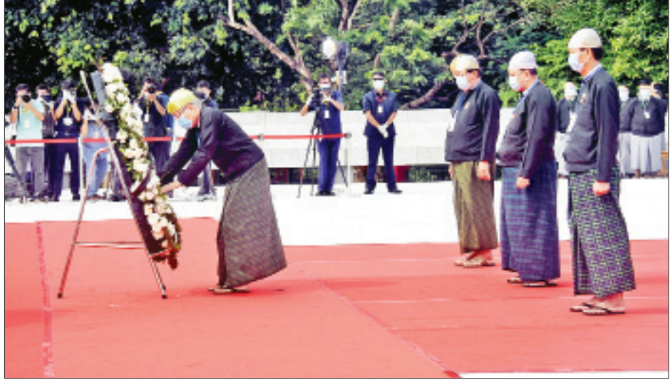
(၇၃)နှစ်မြောက် အာဇာနည်နေ့အခမ်းအနားတွင် အာဇာနည်ခေါင်းဆောင်ကြီးများ၏ ဂုဏ်မာန်၌ ရန်ကုန်တိုင်းဒေသကြီး လွှတ်တော်ဥက္ကဋ္ဌနှင့် လွှတ်တော်ကိုယ်စားလှယ်များ လွှမ်းမိုးမှုနှင့်အညီ ကန်တော့စဉ်။