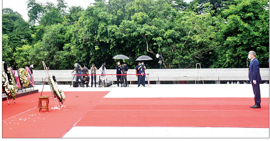
(၇၃) နှစ်မြောက် အာဇာနည်နေ့အခမ်းအနားတွင် မြန်မာနိုင်ငံဆိုင်ရာ နိုင်ငံခြားသံရုံးများ၊ ဥရောပသမဂ္ဂနှင့် ကုလသမဂ္ဂလက်အောက်ခံအဖွဲ့အစည်းများမှ သံအမတ်ကြီးများ၊ သံရုံးယာယီတာဝန်ခံများနှင့် ကိုယ်စားလှယ်များက အာဇာနည်ခေါင်းဆောင်ကြီးများ၏ ဂူဗိမာန်၌ လွှမ်းသူးပန်းခွေချ ဂါရဝပြုစဉ်။