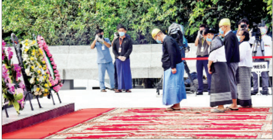
ရဲဘော်ကိုထွေးဂုဏ်မာန်၌ ရဲဘော်ကိုထွေး၏ မိသားစု လွှမ်းမိုးမှုနှင့်အညီ ဂါရဝပြုစဉ်။