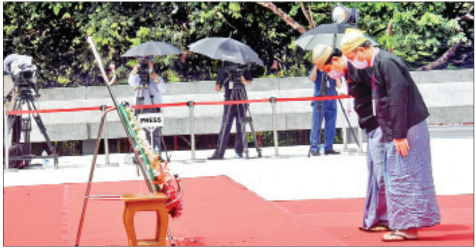
(၇၃) နှစ်မြောက် အာဇာနည်နေ့အခမ်းအနားတွင် အာဇာနည်ခေါင်းဆောင်ကြီးများ၏ ဂူဗိမာန်၌ လူမှုရေးအသင်းအဖွဲ့များ လွှမ်းသူးပန်းခွေချ ဂါရဝပြုစဉ်။