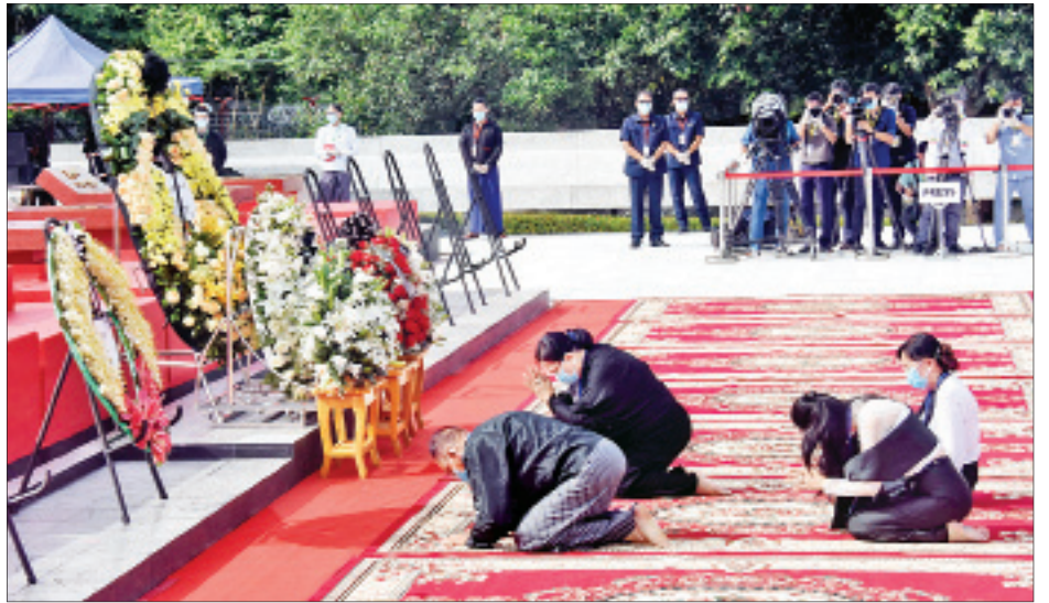
သခင်မြဂူဗိမာန်၌ သခင်မြ၏ မိသားစု လွမ်းသူပန်းခွေချ ကန်တော့စဉ်။ (သတင်း-ရှေ့ဖုံး)