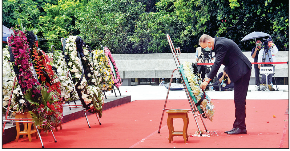
(၇၃) နှစ်မြောက် အာဇာနည်နေ့အခမ်းအနားတွင် မြန်မာနိုင်ငံဆိုင်ရာ နိုင်ငံခြားသံရုံးများ၊ ဥရောပသမဂ္ဂနှင့် ကုလသမဂ္ဂလက်အောက်ခံအဖွဲ့အစည်းများမှ သံအမတ်ကြီးများ၊ သံရုံးယာယီတာဝန်ခံများနှင့် ကိုယ်စားလှယ်များက အာဇာနည်ခေါင်းဆောင်ကြီးများ၏ ဂူဗိမာန်၌ လွှမ်းသူးပန်းခွေချ ဂါရဝပြုစဉ်။