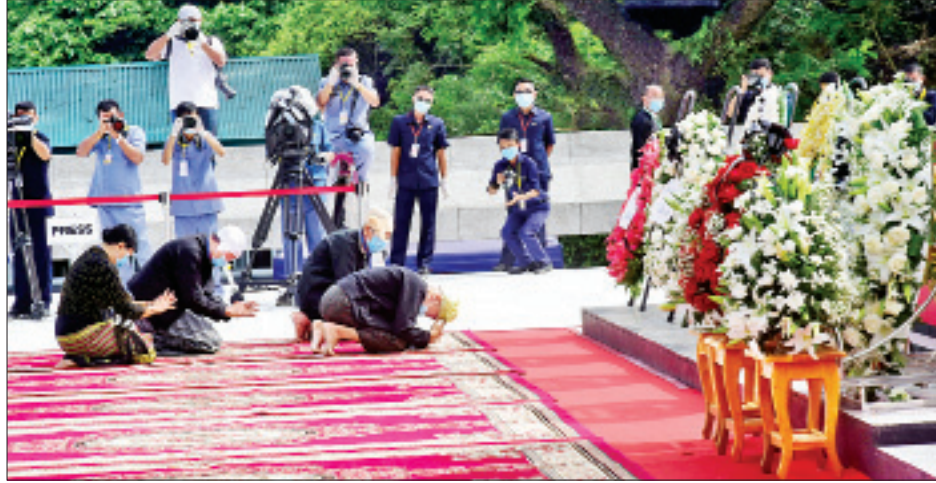
ဦးအုန်းမောင်ဂုဏ်မာန်၌ ဦးအုန်းမောင်၏ မိသားစု လွှမ်းမိုးမှုနှင့်အညီ ကန်တော့စဉ်။