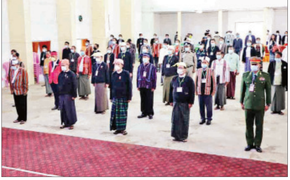
ချင်းပြည်နယ်ဝန်ကြီးချုပ် ဦးဆလင်းလျန်လွယ်နှင့် တက်ရောက်လာကြသူများ ဗိုလ်ချုပ်အောင်ဆန်းနှင့် တကွ အာဇာနည်ခေါင်းဆောင်ကြီးများအား အလေးပြုကြစဉ်။

ရှမ်းပြည်နယ်(မြောက်ပိုင်း) မူဆယ်မြို့၌ (၇၃)နှစ်မြောက်