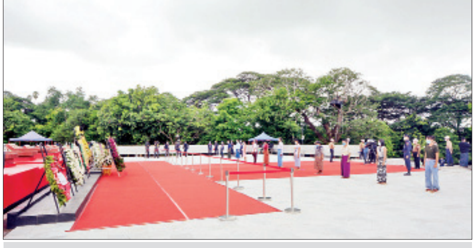
(၇၃) နှစ်မြောက် အာဇာနည်နေ့အခမ်းအနားတွင် အာဇာနည်ခေါင်းဆောင်ကြီးများ၏ ဂူဗိမာန်၌ ပြည်သူများ ဂါရဝပြုကြစဉ်။

* စာမျက်နှာ ၃ မှ ဆက်လက်၍ မြန်မာနိုင်ငံစစ်မှုထမ်းဟောင်းအဖွဲ့၊ မြန်မာနိုင်ငံ မီးသတ်တပ်ဖွဲ့၊ မြန်မာနိုင်ငံ ကြက်ခြေနီအသင်း၊ မြန်မာနိုင်ငံလုံးဆိုင်ရာ အမျိုးသမီးကော်မတီ၊ မြန်မာနိုင်ငံ ရုပ်ရှင်အစည်းအရုံး၊ မြန်မာနိုင်ငံ ဂီတအစည်းအရုံး၊ မြန်မာနိုင်ငံ သဘာဝပညာရှင်များအစည်းအရုံး၊ မြန်မာနိုင်ငံ ပန်းချီ ပန်းပု အစည်းအရုံး(ဗဟို)၊ မြန်မာနိုင်ငံ စာပေထုတ်ဝေသူနှင့် ဖြန့်ချိသူများအသင်း၊ မြန်မာနိုင်ငံ စာရေးဆရာအသင်း၊ မြန်မာနိုင်ငံသတင်းစာဆရာအသင်း၊ မြန်မာနိုင်ငံ အမျိုးသမီးရေးရာအဖွဲ့ချုပ်၊ မြန်မာနိုင်ငံမိခင်နှင့် ကလေးစောင့်ရှောက်ရေးအသင်း၊ မြန်မာနိုင်ငံ အင်ဂျင်နီယာအသင်းချုပ်နှင့် မြန်မာနိုင်ငံဆရာဝန်အသင်းတို့အပါအဝင် လူမှုရေးအသင်းအဖွဲ့များမှ ကိုယ်စားလှယ်များက ဗိုလ်ချုပ်အောင်ဆန်းနှင့်တကွ အာဇာနည်ခေါင်းဆောင်ကြီးများ၏ အထိမ်းအမှတ်ဂူဗိမာန်၌ လွှမ်းသူးပန်းခွေချ အလေးပြုကြသည်။ ထို့နောက် မြန်မာနိုင်ငံဆိုင်ရာ နိုင်ငံခြားသံရုံးများ၊ ဥရောပသမဂ္ဂနှင့် ကုလသမဂ္ဂလက်အောက်ခံအဖွဲ့အစည်းများမှ သံအမတ်ကြီးများ၊ သံရုံးအကြီးအကဲများနှင့် သံရုံးယာယီတာဝန်ခံများက ဗိုလ်ချုပ်အောင်ဆန်းနှင့်တကွ အာဇာနည်ခေါင်းဆောင်ကြီးများ၏ အထိမ်းအမှတ် ဂူဗိမာန်၌ လွှမ်းသူးပန်းခွေချ အလေးပြုကြသည်။ ယင်းနောက် (၇၃) နှစ်မြောက် အာဇာနည်နေ့အခမ်းအနားသို့ တက်ရောက် ဂါရဝပြုကြသည့် ပြည်သူများက ကျန်းမာရေးနှင့် အားကစားဝန်ကြီးဌာနမှ သတ်မှတ်ထားသော Social Distancing နှင့်အညီ တစ်ဦးချင်း ခြောက်ပေအကွာ စနစ်တကျတန်းစီပြီး အာဇာနည်ခေါင်းဆောင်ကြီးများ၏ ကျေးဇူးတရားကို