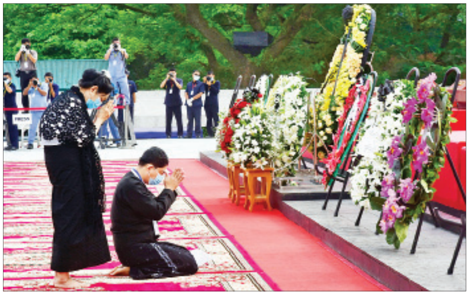
မန်းဘခိုင်ဂူဗိမာန်၌ မန်းဘခိုင်၏ မိသားစု လွမ်းသူပန်းခွေချ ကန်တော့စဉ်။ (သတင်း-ရှေ့ဖုံး)