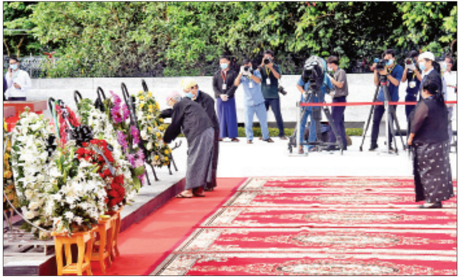
ဦးရာဇတ်ဂုဏ်မာန်၌ ဦးရာဇတ်၏ မိသားစု လွှမ်းမိုးမှုနှင့်အညီ ကန်တော့စဉ်။