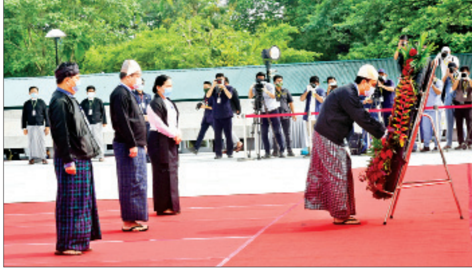
(၇၃)နှစ်မြောက် အာဇာနည်နေ့အခမ်းအနားတွင် အာဇာနည်ခေါင်းဆောင်ကြီးများ၏ ဂုဏ်မာန်၌ ရန်ကုန်တိုင်းဒေသကြီး ဝန်ကြီးချုပ်နှင့် တိုင်းဒေသကြီးဝန်ကြီးများ လွှမ်းမိုးမှုနှင့်အညီ ကန်တော့စဉ်။