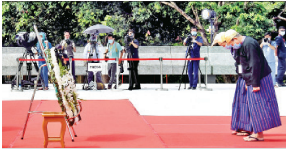
(၇၃) နှစ်မြောက် အာဇာနည်နေ့အခမ်းအနားတွင် အာဇာနည်ခေါင်းဆောင်ကြီးများ၏ ဂူဗိမာန်၌ နိုင်ငံရေးပါတီများ လွှမ်းသူးပန်းခွေချ ဂါရဝပြုစဉ်။