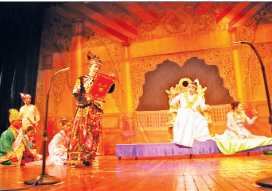
အော်ပရာ ။

“အငြိမ့်မှာ မင်းသမီးရယ်၊ လူပြက်ရယ်၊ အတီးအဖွဲ့ရယ် သုံးပိုင်းရှိတယ်။ အငြိမ့်မင်းသမီးက သီချင်းဆိုပြီးကတည်း၊ သူသီဆိုတဲ့ သီချင်းက ဖေတော့ မောင်တော့ ရည်းစားမျှော် သီချင်းပဲ ဖြစ်ရမယ်လို့ လှေခန်းထဲထဲ သတ်မှတ်ပေးထား ပါဘူး။ အငြိမ့်မင်းသမီးချင်းက ခေတ်ကာလနဲ့ အခြေ အနေနဲ့ ပတ်ဝန်းကျင်နဲ့ အချိန်အခါကို လိုက်ပြီး လူတွေ လှုပ်ရှားစိတ်ဝင်စားနေတဲ့ အကြောင်းအရာ ဘာကိုမဆို သီချင်းဆိုလို့ ရပါတယ်။ အငြိမ့်သီချင်းဆိုတာ ဘယ် အကြောင်းအရာမျိုးကိုသာ ရေးစပ်ထားတာ ဖြစ်ရမယ်လို့ ဘယ်တုန်းကမှလည်း မသတ်မှတ်ခဲ့ဖူးဘူး။ ဘယ်သူကမှ လည်း သတ်မှတ်မှတ်မှတ် ရေးစပ်ပေးမနေပါဘူး။ ဒါကြောင့် အငြိမ့်သီချင်းတွေဟာ အချစ်ရေးနဲ့လည်း ရှိ၊ စစ်ရေးနဲ့လည်း ရှိ၊ နိုင်ငံရေးနဲ့လည်း ရှိ၊ လူမှုရေးနဲ့လည်း ရှိ ဆိုသလို အရေးမျိုးစုံ ရှိနေပါတယ်” တဲ့။