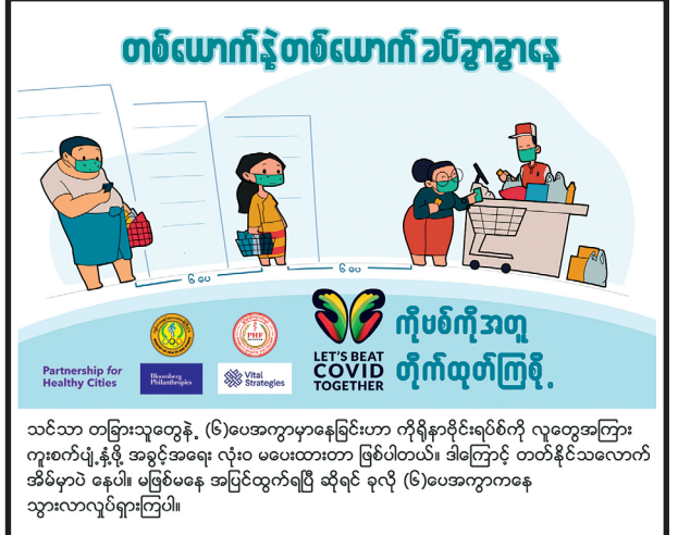
သင်သာ တခြားသူတွေနဲ့ (၆)ပေအကွာမှာနေခြင်းဟာ ကိုရိုနာဗိုင်းရပ်စ်ကို လူတွေအကြား ကူးစက်ပျံ့နှံ့ဖို့ အခွင့်အရေး လုံးဝ မပေးထားတာ ဖြစ်ပါတယ်။ ဒါကြောင့် တတ်နိုင်သလောက် အိမ်မှာပဲ နေပါ။ မဖြစ်မနေ အပြင်ထွက်ရပြီ ဆိုရင် ခုလို (၆)ပေအကွာကနေ သွားလာလုပ်ရားကြပါ။

ထိုသို့ဆောင်ရွက်ရာတွင် နိုင်ငံသားတိုင်း မဲပေးပိုင်ခွင့်မဆုံးရှုံးစေရန် ဒဂုံ မြို့သစ်(အရှေ့ပိုင်း)မြို့နယ် အလုပ်သမား လူဝင်မှုကြီးကြပ်ရေးနှင့် အမျိုးသား မှတ်ပုံတင်ရေးဦးစီးဌာနမှ မြို့နယ်ဦးစီးမှူးနှင့် အဖွဲ့ဝင်များ၊ ရပ်ကွက်အုပ်ချုပ် ရေးမှူးများ ပူးပေါင်း၍ ရပ်ကွက်များအတွင်းရှိ ပြည်သူများအား မြန်မာနိုင်ငံ သားဥပဒေ လုပ်ထုံးလုပ်နည်းများနှင့်အညီ မဲဆန္ဒရှင်စာရင်းများမှ နိုင်ငံသား စိစစ်ရေးကတ်မရှိသူများအား အသစ်ပြုလုပ်ပေးခြင်း၊ လဲလှယ်ခြင်း၊ ပျက်စီး ပျောက်ဆုံးပြုလုပ်ခြင်းနှင့် အိမ်ထောင်စုစာရင်းပြုလုပ်ခြင်းများကို နေ့ချင်းပြီး ကွင်းဆင်းဆောင်ရွက်ပေးခဲ့ကြောင်း သိရသည်။ မြို့နယ်(ပြန်/ဆက်)