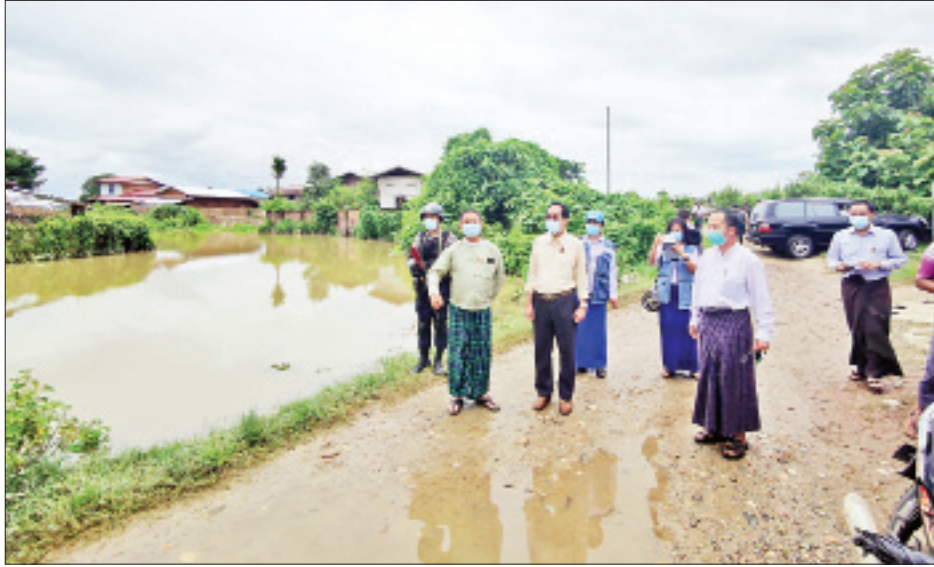
ယာယီစခန်းများ ဖွင့်လှစ်၍ ရွှေ့ပြောင်းနေရာချထားပေး နိုင်ရေး စသည့် ကူညီကယ်ဆယ်ရေးလုပ်ငန်းများ ကြိုတင် စီမံဆောင်ရွက်ထားရှိရေး တာဝန်ရှိသူများနှင့် ညှိနှိုင်း ဆောင်ရွက်ပေးခဲ့သည်။

မြစ်ကြီးနား ဇူလိုင် ၁၂ ကချင်ပြည်နယ်အတွင်း ဧရာဝတီမြစ်အထက်ပိုင်း၌ မိုးသည်းထန်စွာ အဆက်မပြတ်ရွာသွန်းမှုကြောင့် ဧရာဝတီ မြစ်ရေမြင့်တက်လာပြီး မြစ်ကြီးနားမြို့ပေါ်ရှိ မြေနိမ့်ပိုင်း ရပ်ကွက်အချို့၌ မြစ်ရေများ ဝင်ရောက်လာခဲ့သဖြင့် နေအိမ်အချို့မှ ပြည်သူများအား ယာယီပြောင်းရွှေ့ထား ရှိမှုအခြေအနေနှင့် လိုအပ်ချက်များ ကြိုတင်စီစဉ် ဆောင်ရွက်နိုင်ရေး ယနေ့နံနက်ပိုင်းတွင် ပြည်နယ် ဝန်ကြီးချုပ် ဒေါက်တာခက်အောင်နှင့် တာဝန်ရှိသူများက ကွင်းဆင်းစစ်ဆေး ဆောင်ရွက်ပေးကြသည်။