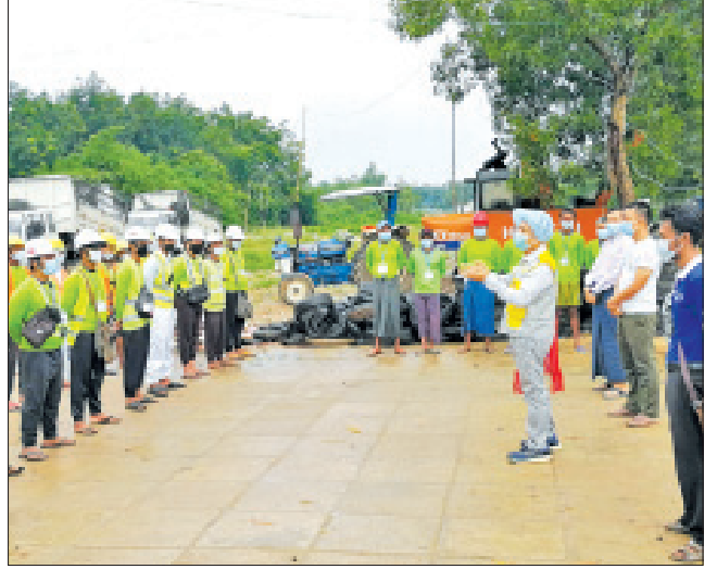
ဆောင်ရွက်မှုများအတွက် အားပေး ဆောင်ရွက်ပေးမည်ဖြစ်ကြောင်း ပြောကြား စကားနှင့် အခက်အခဲများနှင့် လိုအပ် ခဲ့ကြောင်း သိရသည်။

ဆက်လက်၍ ပဲခူးတိုင်းဒေသကြီး ပြည်သူ့ကျန်းမာရေးနှင့် ကုသရေး ဦးစီးဌာနမှူးသည် ပြည်တော်ပြန်များ အား ယာယီထားရှိရေးစခန်းဖြစ်သည့် ဘုရားကြီး Facility Quarantine Camp သို့လည်းကောင်း၊ ညောင်လေးပင် မြို့နယ်ဆေးရုံ၊ ဖြန့်တန်ဆာတိုက်နယ် ဆေးရုံ၊ ပိန်းဇေလုပ်တိုက်နယ်ဆေးရုံတို့ သို့လည်းကောင်း သွားရောက်၍ မြို့နယ် ဆရာဝန်ကြီး၊ တိုက်နယ်ဆရာဝန်များ၊ သူနာပြုများ၊ ကျန်းမာရေးဝန်ထမ်းများ နှင့် ရင်းရင်းနှီးနှီးတွေ့ဆုံ၍ လုပ်ငန်း