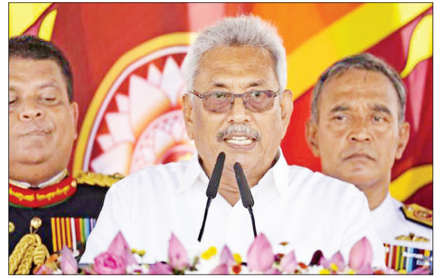
သီရိလင်္ကာသမ္မတ ဂိုတာဘာရာ ရာဂျာပတ်ဆာ

ဩဂုတ် ၅ ရက်တွင် ကျင်းပမည့် ရွေးကောက်ပွဲအတွက် မဲဆွယ်စည်းရုံးမှုများကိုလည်း ရပ်ဆိုင်းထားကြောင်းနှင့် ဩဂုတ် ၁ ရက်တွင် ပြန်လည်ဖွင့်လှစ်ရန် ကြေညာထားသည့် နိုင်ငံတကာလေဆိပ်ကိုလည်း ဆက်လက်ပိတ်သိမ်းထားမည်ဖြစ်ကြောင်း သိရသည်။ လက်ရှိအချိန်အထိ နိုင်ငံအတွင်း၌ ဗိုင်းရပ်စ်ကူးစက်ခံရသူ ၂၆၀၅ ဦးရှိပြီး သေဆုံးသူ ၁၁ ဦးရှိကြောင်း သိရသည်။ ကိုးကား-စီအင်န်အေဘာသာပြန်-အောင်ကျော်ကျော်