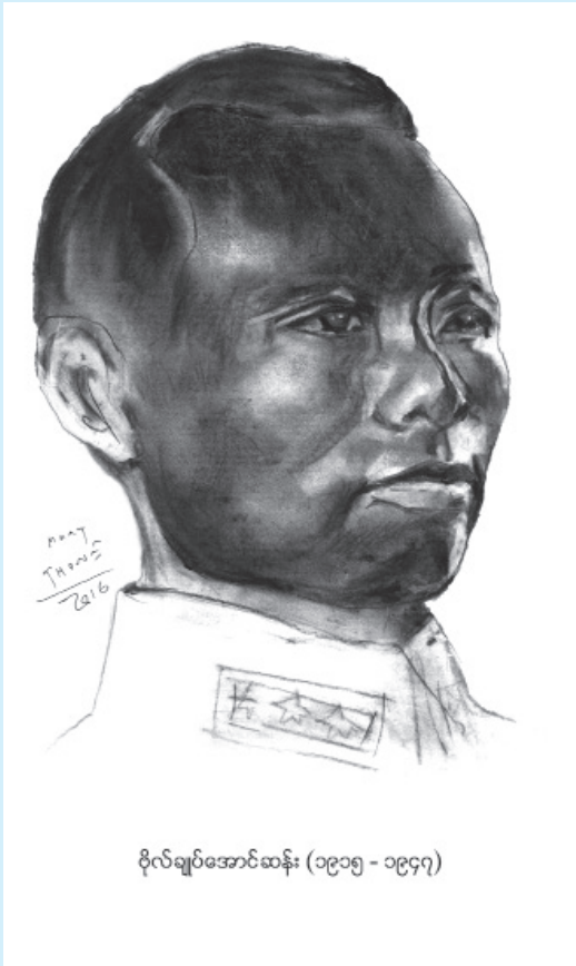
ဗိုလ်ချုပ်အောင်ဆန်း (၁၉၁၅ - ၁၉၄၇)