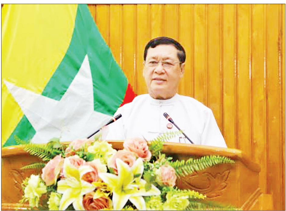
အလုပ်သမား၊ လူဝင်မှုကြီးကြပ်ရေးနှင့် ပြည်သူ့အင်အားဝန်ကြီးဌာန ပြည်ထောင်စုဝန်ကြီး ဦးသိန်းဆွေ ILO Virtual Global Summit on COVID-19 and the world of work အစည်းအဝေးတွင် ဝီဒီယိုဖြင့် မိန့်ခွန်းပြောကြားစဉ်။

များအား အကျဉ်းချုပ်ပြောရလျှင် မြန်မာအစိုးရအနေဖြင့် ပါဝင်သက်ဆိုင်သူအားလုံးတို့နှင့်အတူ ရောဂါကိုရင်ဆိုင်ရန် ကပ်ရောဂါ ကာကွယ်ရေး၊ ထိန်းချုပ်ရေးနှင့် ကုသရေးဆောင်ရွက်ချက်များကို ကြိုးပမ်းဆောင်ရွက်ခဲ့ကြောင်း၊ ထိုသို့ဆောင်ရွက်ခဲ့ရာတွင် တစ်နိုင်ငံလုံး ပူးပေါင်းပါဝင်မှုနည်းလမ်း (A Whole of Nation Approach) ဖြင့် ဆောင်ရွက်ခဲ့ခြင်းဖြစ်ပြီး နောက်ပိုင်းတွင် ILO က အကြံပြုခဲ့သော ကိုဗစ်-၁၉ တုံ့ပြန်ရေးမူဝါဒရေးရာမူဘောင်နှင့်အညီ အကောင်အထည်ဖော်မှုများကို ဆောင်ရွက်ခဲ့ခြင်းဖြစ်ကြောင်း၊ နိုင်ငံတော်အစိုးရက ကိုဗစ်-၁၉ ကပ်ရောဂါကြောင့် စီးပွားရေးထိခိုက်မှုများကို ကြုံကြုံခံနိုင်ရန်နှင့် ပြန်လည်ကုစားနိုင်ရန်အတွက် ကော်မတီတစ်ရပ်ကို ဖွဲ့စည်းခဲ့ပြီး ထိုခိုက်မှုအများဆုံးခံနေရသော အဓိက စီးပွားရေးလုပ်ငန်းအမျိုးအစား သုံးမျိုးကို ကူညီပံ့ပိုးပေးရန် ရန်ပုံငွေတစ်ရပ်ကို ထူထောင်ခဲ့ကြောင်း၊ ဘဏ်အတိုးနှုန်းများ၊ ဝင်ငွေခွန်နှင့် ကုန်သွယ်ခွန်များကိုလည်း လျှော့ချပေးခဲ့ကြောင်း၊ အလုပ်ရှင်၊ အလုပ်သမားများကို လူမှုဖူလုံရေးဆိုင်ရာ ဖြေလျှော့မှုများနှင့် အထောက်အပံ့ပေးမှုများကို ဆောင်ရွက်ပေးလျက်ရှိကြောင်း၊ ပြည်ပတွင်ရောက်ရှိနေသည့် မြန်မာရွှေ့ပြောင်းအလုပ်သမားများကို ကယ်ဆယ်ရေးလေယာဉ်ခရီးစဉ်များဖြင့် ပြန်လည်ခေါ်ယူပေးခြင်း၊ ပြန်လည်ဝင်ရောက်လာသော ရွှေ့ပြောင်းအလုပ်သမားများကို နယ်စပ်ဂိတ်များတွင် ကြိုဆို၍ အသွားအလာကန့်သတ်စောင့်ကြည့်စခန်းများသို့ ပို့ဆောင်ခြင်းတို့ကိုလည်း ဆောင်ရွက်နေကြောင်း။ မြန်မာနိုင်ငံသို့ ကိုဗစ်-၁၉ ကပ်ရောဂါ မရောက်ရှိမီကတည်းက ILO နှင့်ပူးပေါင်း၍ သုံးပွင့်ဆိုင်အစည်းအဝေးများ ကျင်းပခဲ့ကြောင်း၊ အနာဂတ်တွင် ဆောင်ရွက်မည့် အစီအမံများအနေဖြင့် စိုက်ပျိုးရေးနှင့် မွေးမြူရေးကဏ္ဍ