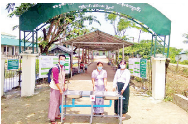
ထို့အပြင် ကျောင်းများတွင် လက်ဆေးဆပ်ပြာ၊ ကာဘော်လစ်ဆပ်ပြာ၊ လက်သန့်ဆေးရည်များ ထောက်ပံ့ခြင်းနှင့် မိုးရာသီတွင် အဖြစ်များသည့် သွေးလွန်တုပ်ကွေးရောဂါ ကာကွယ်ရေးအတွက် ခြင်ဆေးဖျန်းခြင်း စသည့် လှုပ်ရှားမှုများကို ဆက်လက်ဆောင်ရွက်သွားရန် စီစဉ်လျက်ရှိကြောင်း သိရ သည်။

ဂျာမန်ကြက်ခြေနီအသင်း၏ အထောက်အပံ့ဖြင့် ရန်ကုန်တိုင်းဒေသကြီး ဒဂုံမြို့သစ်(တောင်ပိုင်း)မြို့နယ်တွင် အခြေခံပညာကျောင်း ရှစ်ကျောင်း၊ ဒဂုံမြို့သစ်(ဆိပ်ကမ်း) မြို့နယ်တွင် အခြေခံပညာကျောင်း သုံးကျောင်းနှင့် ဘုန်းတော်ကြီးသင်ပညာရေးကျောင်း တစ်ကျောင်း၊ ဒဂုံမြို့သစ်(အရှေ့ပိုင်း) မြို့နယ်တွင် အခြေခံပညာကျောင်း လေးကျောင်း၊ ခရမ်းမြို့နယ်တွင် အခြေခံ ပညာကျောင်း ၁၃ ကျောင်း၊ သန်လျင်မြို့နယ်တွင် အခြေခံပညာကျောင်း ၁၀ ကျောင်းတို့တွင် လက်ဆေးဘေစင်များ တပ်ဆင်ပေးခြင်း၊ ကိုဗစ်-၁၉ ရောဂါ ကာကွယ်ရေး အသိပညာပေးပို့စာတင်နှင့် ဗီနိုင်းကပ်ခြင်းများကို ဇူလိုင် ၄ ရက်မှ စတင်ဆောင်ရွက်လျက်ရှိပါသည်။