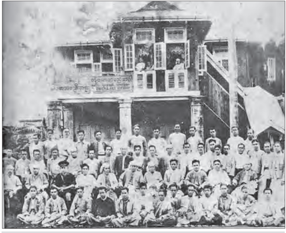
၁၉၃၈ တို့ဗမာ အစည်းအရုံးဌာနချုပ် (ရေကျော်လမ်းမပေါ်ရှိ အဆောက်အအုံ)ရှေ့၌ သခင်အဖွဲ့ဝင်များနှင့် ဆရာမိုင်း။

ဤကြားကာလ ၁၉၄၀ ပြည့်နှစ်စက်တင်ဘာလ ၇ ရက် နေ့က ဦးပု ညွှန်ပေါင်းအစိုးရပြုတ်ကျကာ ဦးစောဦးဆောင်သော ညွှန်ပေါင်းအစိုးရ စက်တင်ဘာလ ၉ ရက်နေ့တွင် တက်ကာ