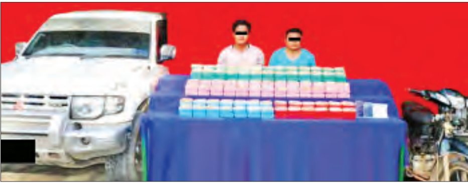
မုန်ဆန်၊ ရှုရွယ်တို့အား သိမ်းဆည်းရမိသည့် ဘိန်းဖြူများနှင့်အတူ တွေ့ရစဉ်။

ဖြစ်စဉ်နှင့်ပတ်သက်၍ ပြည်ထွန်းအား အင်းတော်မြို့မရဲစခန်းက အမှုဖွင့် အရေးယူထားကြောင်း သိရသည်။ အေးမြသက်ထား