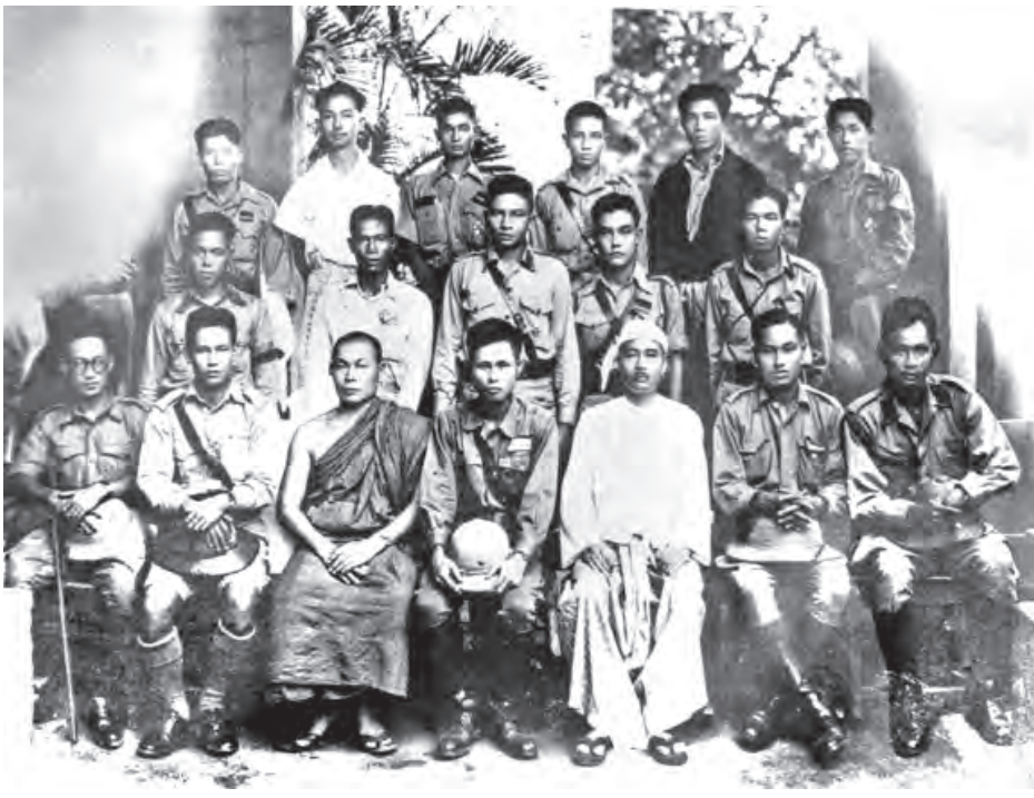
ဗိုလ်ချုပ်အောင်ဆန်း၊ ဗိုလ်မှူးကြီးဆူဇူကီး(ခေါ်)ဗိုလ်မှူးကြီးနှင့် ရဲဘော်သုံးကျိပ်ဝင်အချို့။

ဧပြီလ ၃ ရက်နေ့ ဂျပန်ဗုံးကြဲမန္တလေးတစ်မြို့လုံးနီးပါး မီးလောင်ပျက်စီးဆုံးရှုံးခဲ့သည်။ မြို့သူမြို့သား ၂၀၀၀ ကျော် အသက်ဆုံးရှုံးခဲ့သည်။ ဗြိတိသျှတို့သည် ၎င်းတို့ ဆုတ်ခွာရာလမ်းကြောင်းရှိ စက်ရုံ၊ တံတား စသည်တို့ကို ဖောက်ခွဲဖျက်ဆီးပြီးသွားကြသည်။ မေလ ၁ ရက်နေ့တွင် မန္တလေးမြို့ကို BIA က သိမ်းပိုက်လိုက်ပြန်သည်။ BIA တပ်များ၊ အောင်ပွဲတစ်ခုပြီးတစ်ခု ရရှိနေချိန်၊ မိမိတို့အခြေအနေမကောင်းတော့သည်ကို သဘောပေါက်၍ ဘုရင်ခံ Dorman Smith သည် မေလ ၄ ရက်နေ့တွင် တပ်လေယာဉ်ဖြင့် မြစ်ကြီးနားမှ အိန္ဒိယနိုင်ငံသို့ ဆုတ်ခွာခဲ့သည်။ ရန်ကုန်မြို့ကို မတ်လ ၈ ရက်နေ့တွင် BIA က အောင်မြင်စွာ သိမ်းပိုက်နိုင်ခဲ့သည်။ စစ်ဘေးစစ်ဒဏ်ဝေးရာ ဓနုဖြူသို့ အဖေတို့မိသားစု စစ်ရှောင်ရန်ရောက်သွားကြသည်။ အဖေစိတ်ထဲမှာတော့ နယ်ချဲ့ကိုဆန့်ကျင်သည့် ကျောင်းသားသပိတ်များကို အမှတ်ရနေသည်။