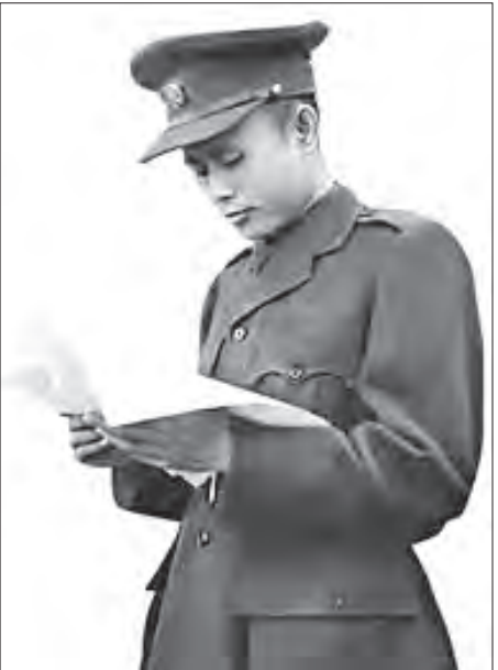
ကောင်စီတွင် ပထမဆုံး ကျောင်းသားကိုယ်စားလှယ်အဖြစ် ရွေးကောက်တင်မြှောက်ခံခဲ့ရသည်။

၁၉၃၈ ခုနှစ် နှစ်ဆန်းပိုင်း ချောက်မြို့မှတစ်ဆင့် နေထိုင်ခဲ့သည့် ရေနံမြေသပိတ်ကြီး၏ လှုပ်ရှားမှုကဏ္ဍက ရန်ကုန်သို့ တပြည်းဖြည်းချင်း ရိုက်ခတ်လာသည်။ မတ်လ ၅ ရက်နေ့ ရန်ကုန်မြို့လုံးကျွတ် အစည်းအဝေးကြီးက ဗြိတိသျှပိုင် BOC ရေနံကုမ္ပဏီကြီးကို ရွတ်ချခဲ့သည်။