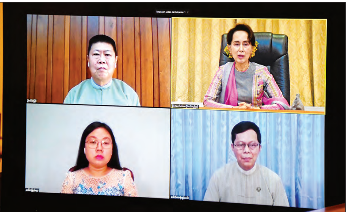
Coronavirus Disease 2019 (COVID-19) ကာကွယ်၊ ထိန်းချုပ်၊ ကုသရေး အမျိုးသားအဆင့်ဗဟိုကော်မတီဥက္ကဋ္ဌ၊ နိုင်ငံတော်၏အတိုင်ပင်ခံပုဂ္ဂိုလ် ဒေါ်အောင်ဆန်းစုကြည် COVID-19 နှင့် သားငါးမွေးမြူထုတ်လုပ်ရေးကဏ္ဍအပေါ် သက်ရောက်မှုများနှင့် စပ်လျဉ်း၍ ဒေါက်တာရဲထွန်းဝင်း၊ ဒေါ်စာမြည်ဌေး၊ ဦးသိန်းမြင့်တို့နှင့် အပြန်အလှန်ဆွေးနွေးစဉ်။

နေပြည်တော် ဇူလိုင် ၇ Coronavirus Disease 2019(COVID-19) ကာကွယ်၊ ထိန်းချုပ်၊ ကုသရေး အမျိုးသားအဆင့် ဗဟိုကော်မတီဥက္ကဋ္ဌ၊ နိုင်ငံတော်၏အတိုင်ပင်ခံပုဂ္ဂိုလ် ဒေါ်အောင်ဆန်းစုကြည်သည် COVID-19 နှင့် သားငါးမွေးမြူထုတ်လုပ်ရေးကဏ္ဍအပေါ် သက်ရောက်မှုများနှင့်စပ်လျဉ်း၍ စိုက်ပျိုးရေး၊ မွေးမြူရေးနှင့် ဆည်မြောင်းဝန်ကြီးဌာန မွေးမြူရေးနှင့် ကုသရေးဦးစီးဌာန ညွှန်ကြားရေးမှူးချုပ် ဒေါက်တာရဲထွန်းဝင်း၊ မြန်မာနိုင်ငံ ငါးလုပ်ငန်းအဖွဲ့ချုပ် အတွင်းရေးမှူး ဒေါ်စာမြည်ဌေး၊ မြန်မာ နိုင်ငံ မွေးမြူရေးလုပ်ငန်းအဖွဲ့ချုပ် ဒုတိယဥက္ကဋ္ဌ၊ မြန်မာနိုင်ငံ ကြက်၊ ဘဲ မွေးမြူထုတ်လုပ်သူများ အသင်းဥက္ကဋ္ဌ ဦးသိန်းမြင့် တို့နှင့် ယနေ့နံနက် ၁၀ နာရီတွင် နေပြည်တော်ရှိ နိုင်ငံတော်သမ္မတ အိမ်တော် အစည်းအဝေးခန်းမ၌ Video Conferencing စနစ်ဖြင့် ချိတ်ဆက်တွေ့ဆုံ၍ လက်တွေ့ အခြေအနေများကို အပြန်အလှန် ဆွေးနွေးသည်။