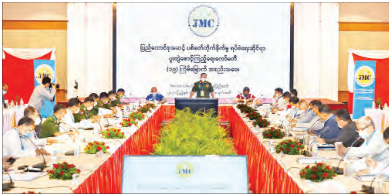
ဒုတိယဗိုလ်ချုပ်ကြီးရာပြည့် ပြည်ထောင်စုအဆင့် ပစ်ခတ်တိုက်ခိုက်မှုရပ်စဲရေးဆိုင်ရာ ပူးတွဲစောင့်ကြည့်ရေးကော်မတီ (၁၉)ကြိမ်မြောက် အစည်းအဝေး တွင် အမှာစကားပြောကြားစဉ်။