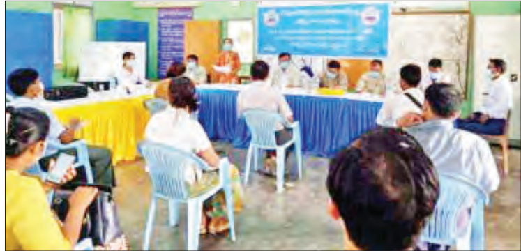
အပူချိန် တိုင်းတာစစ်ဆေးခြင်းများကို ဆောင်ရွက်ပေးခဲ့ကြောင်း သိရသည်။ မြို့နယ်ငါးလုပ်ငန်းဦးစီးဌာန ဝန်ထမ်းများက သတင်းစဉ်

တင်ဒါငါးဖမ်းလုပ်ကိုင်သူများ၊ ရေလုပ်သားများနှင့် လေလံဆွဲဝယ်သူများ တက်ရောက်ကြသည်။ လေလံရောင်းချပွဲ အခမ်းအနားသို့ တက်ရောက်သူများအား ကိုဗစ်-၁၉ ရောဂါကာကွယ်ထိန်းချုပ်ရေးအတွက် နှာခေါင်းစည်းများ တပ်ဆင်ဝင်ရောက်စေခြင်း၊ လက်သန့်ဆေးရည်ဖြင့် လက်ဆေးစေခြင်း၊ ကိုယ်