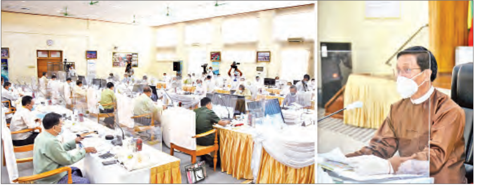
ဒုတိယသမ္မတ ဦးဟင်နရီဗန်ထီးယူ အမျိုးသားခရီးသွားလုပ်ငန်း ဖွံ့ဖြိုးတိုးတက်ရေးဗဟိုကော်မတီအစည်းအဝေးတွင် အမှာစကားပြောကြားစဉ်။

နေပြည်တော် ဇူလိုင် ၇ အမျိုးသားခရီးသွားလုပ်ငန်း ဖွံ့ဖြိုး တိုးတက်ရေးဗဟိုကော်မတီ အစည်း အဝေး(၁/၂၀၂၀)ကို ယနေ့နံနက် ၁ နာရီတွင် နေပြည်တော်ရှိ ဟိုတယ်နှင့် ခရီးသွားလာရေးဝန်ကြီးဌာန အစည်း အဝေးခန်းမ၌ ကျင်းပရာ အမျိုးသား ခရီးသွားလုပ်ငန်း ဖွံ့ဖြိုးတိုးတက်ရေး ဗဟိုကော်မတီဥက္ကဋ္ဌ ဒုတိယသမ္မတ ဦးဟင်နရီဗန်ထီးယူ တက်ရောက်အမှာ စကားပြောကြားသည်။