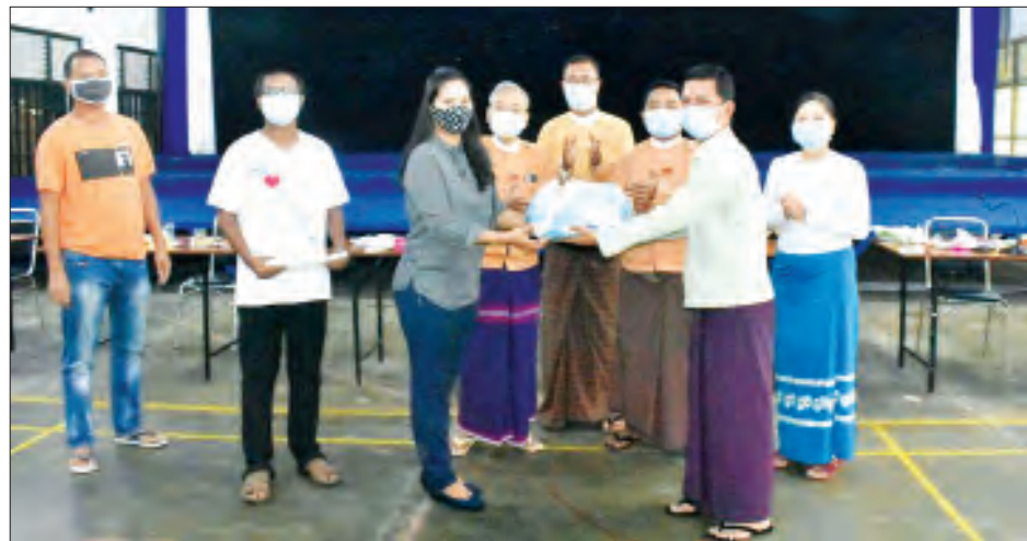
အခမ်းအနားတွင် အမျိုးသားအဆင့် စေတနာ့ဝန်ထမ်းဦးဆောင်အဖွဲ့က ပေးအပ်သော ဂုဏ်ပြုမှတ်တမ်းလွှာများနှင့် ဂုဏ်ပြုလက်ဆောင်ပစ္စည်းများကို တာဝန်ရှိသူများက လူမှုရေးပရဟိတအဖွဲ့များနှင့် စေတနာ့ဝန်ထမ်းများအား ပေးအပ်ချီးမြှင့်ခဲ့သည်။ မြင့်ဦး

တက်ရောက် အခမ်းအနားသို့ အင်းစိန်မြို့နယ်၊ ပြည်သူ့လွှတ်တော်ကိုယ်စားလှယ် ဦးမောင်မောင်ဦး၊ တိုင်းဒေသကြီးလွှတ်တော်ကိုယ်စားလှယ်များဖြစ်ကြသည့် ဦးသာအောင်၊ ဦးဝေဖြိုးဟန်၊ မြို့နယ်အုပ်ချုပ်ရေးမှူး၊ မြို့နယ်ပညာရေးမှူး၊ ဌာနဆိုင်ရာများ၊ လူမှုဝန်ထမ်းဦးစီးဌာနမှ တာဝန်ရှိသူများ၊ မြို့နယ်စည်ပင်သာယာရေးကော်မတီဥက္ကဋ္ဌ၊ မြို့နယ်အတွင်းရှိ လူမှုရေးပရဟိတအသင်းအဖွဲ့များ We Love Insein Volunteer Team စေတနာ့ဝန်ထမ်းအဖွဲ့များ တက်ရောက်ကြသည်။