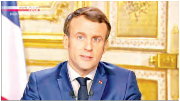
လုပ်ဆောင်ရေးအတွက် စွမ်းအင်ကဏ္ဍနှင့် မည်ဖြစ်သည်။ ကိုးကား - အင်န်အိတ်ချ်ကော့ အိမ်ရာကဏ္ဍနှစ်ခုစလုံးကို လွှမ်းခြုံဆောင်ရွက် ဘာသာပြန် - အလင်းသစ်

မက်ရွန်သည် ဂေဟဗေဒပညာရှင်တစ်ဦး ဖြစ်သည့် ဘာဘာရာပွမ်ပီလီကို သဘာဝ ပတ်ဝန်းကျင်ဝန်ကြီးဌာန ဝန်ကြီးအဖြစ် ခန့်အပ် ခဲ့ပြီး ဘာဘာရာပွမ်ပီလီသည် အိမ်ထောင်စု အများအပြား၏ စွမ်းအင်ခွေတာရေး တိုးမြှင့်