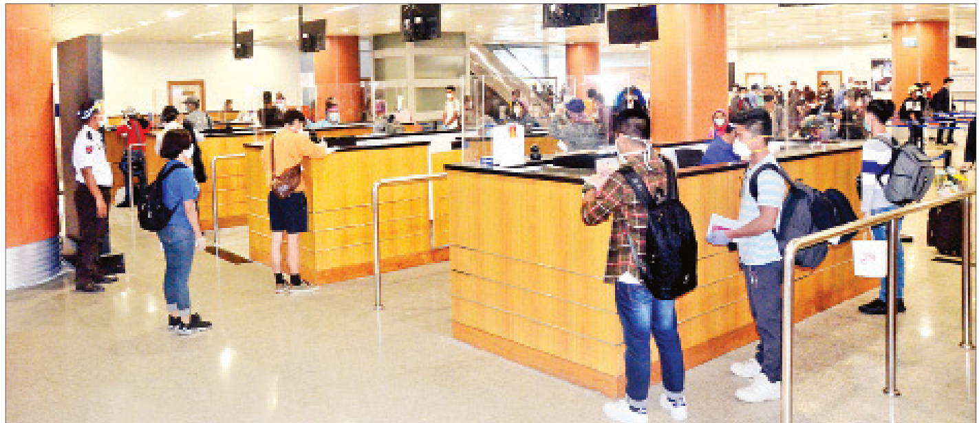
ဖိလစ်ပိုင်နိုင်ငံမှ ပြန်လည်ရောက်ရှိလာသော မြန်မာနိုင်ငံသားများအား ရန်ကုန်အပြည်ပြည်ဆိုင်ရာလေဆိပ်၌ တွေ့ရစဉ်။

ဖိလစ်ပိုင်နိုင်ငံတွင် ရောက်ရှိနေပြီး မြန်မာနိုင်ငံသို့ပြန်ရန် အခက်အခဲကြုံတွေ့နေရသည့် မြန်မာနိုင်ငံသား ၁၅ ဦးနှင့် Carnival အပျော်စီးသင်္ဘောလိုင်း၏ Conquest၊ Dream၊ Holland America သင်္ဘောများပေါ်တွင် တာဝန်ထမ်းဆောင်လျက်ရှိသည့် မြန်မာသင်္ဘောသားအမှုထမ်း ၁၀၇ ဦး စုစုပေါင်း ၁၂၂ ဦးအား အဆိုပါသင်္ဘောကုမ္ပဏီနှင့် မြန်မာသံရုံးတို့၏ စီစဉ်ပေးမှုဖြင့် မြန်မာအပြည်ပြည်ဆိုင်ရာလေကြောင်း ကယ်ဆယ်ရေးလေယာဉ်ဖြင့် မြန်မာနိုင်ငံသို့ ပြန်လည်ခေါ်ဆောင်ခဲ့ရာ ယနေ့ညနေ ၆ နာရီတွင် ရန်ကုန်အပြည်ပြည်ဆိုင်ရာ လေဆိပ်သို့ အဆင်ပြေချောမွေ့စွာ ပြန်လည်ရောက်ရှိခဲ့ကြသည်။