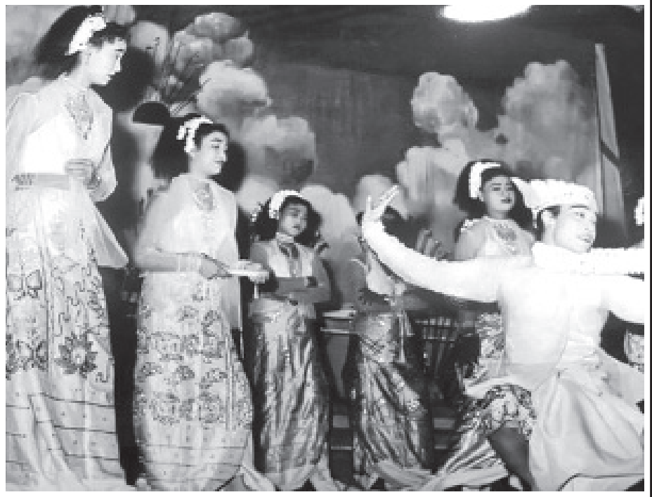
ရွှေမန်းသဘင်ဇာတ်ပွဲ။

ထိုင်များဖြစ်သည်။ ကုလားထိုင်ကလည်း ဘေးတန်း၊ ရှေ့ဆုံးတန်းတွေက ပွဲမစခင်ကတည်းက ရောင်းချပြီးသား။ ဈေးချိုက အများဆုံးအားပေးသည့် ဇာတ်ပွဲများ ဖြစ်သောကြောင့် အဖိတ်နေ့ညလိုမျိုးမှာ ကြိတ်ကြိတ်တိုး စည်ကားလှသည်။ နက်ဖြန်ဥပုသ်နေ့ ဈေးပိတ်သည် မဟုတ်လား။ A Rool က လက်မှတ်ယူထားသည့် ဈေးချို သူလေးတွေ အဖိတ်နေ့ညနေစောင်းကတည်းက ပွဲသွားဖို့ ပြင်ရဆင်ရတော့သည်။ ပွဲသွားသည်ကလည်း တကယ့် ခမ်းခမ်းနားနား။ ကြွရည်သုတ် ငါးဆင့်ချိုင့်ကြီးတွေမှာ ပွဲခင်းထဲမှာစားဖို့ လက်ဖက်သုပ်၊ ချင်းသုပ်များ၊ ဆန္ဒင်း မကင်း၊ ထိုးမုန့် စသည်များထည့်ကြသည်။ ထို့ပြင် မင်းသားအတွက် လက်ဆောင်ပေးရန် အစားအသောက် များလည်းပါသည်။ အကောင်းဆုံး၊ အသစ်ဆုံးကော်စော ကြီးတွေ၊ မိုးအုံး၊ ခေါင်းအုံးတွေနှင့် ပွဲကြည့်သွားကြ၏။ မပါမဖြစ် ပါရသည်က ဇွန်ပန်း၊ စံပယ်ပန်းကုံးကြီးများဖြစ် သည်။ လက်မောင်းလောက်တုတ်သည့် ပန်းကုံးကြီးများ ဖြစ်၏။ သည်ပန်းကုံးတွေက မင်းသားကို လက်ဆောင်ပေး