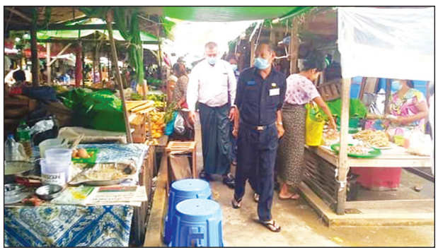
ခြင်း ရှိ၊ မရှိ လိုက်လံစစ်ဆေးခဲ့ပြီး မြို့သစ်(က-၇)လမ်းဈေးရှိ ရောင်းချမှု အခြေအနေနှင့် အတိုင်းပြုလုပ်ခြင်းလုပ်ငန်းသို့ ကြည့်ရှုစစ်ဆေးပြီး လိုအပ်သည်များ မှာကြားခဲ့ကြောင်း သိရသည်။ ခွဲထက်ကို (ပြန်/ဆက်)