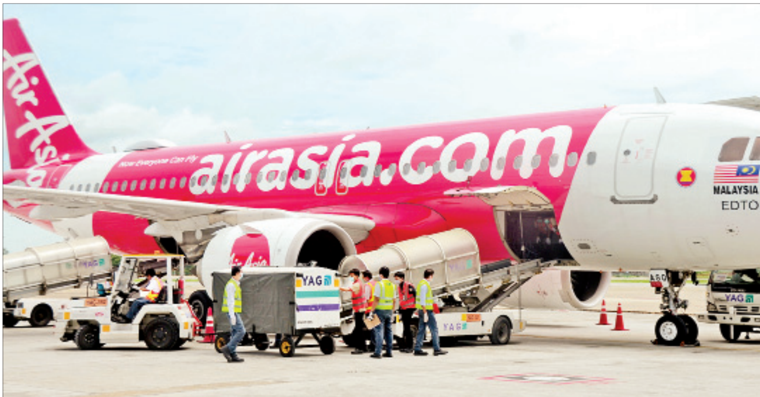
ကိုဗစ်-၁၉ ရောဂါ ကာကွယ်၊ ထိန်းချုပ်ရေးလုပ်ငန်းသုံး အထောက်အကူပြုပစ္စည်းများနှင့် လူသားချင်းစာနာထောက်ထားမှုဖွံ့ဖြိုးရေးဆိုင်ရာ ကူညီဆောင်ရွက်ပေးမည့် ကျွမ်းကျင်ဝန်ထမ်းများ တင်ဆောင်လာသော အထူးလေယာဉ် ရန်ကုန်အပြည်ပြည်ဆိုင်ရာလေဆိပ်သို့ ရောက်ရှိစဉ်။

ရန်ကုန် ဇူလိုင် ၅ ကမ္ဘာ့စားနပ်ရိက္ခာအစီအစဉ်(WFP)၏ ကမ္ဘာလုံး ဆိုင်ရာ ထောက်ပံ့ပို့ဆောင်ရေးဝန်ဆောင်မှု အစီအစဉ်ဖြင့် မြန်မာနိုင်ငံ၌ ကိုဗစ်-၁၉ ရောဂါ ကာကွယ်၊ ထိန်းချုပ်ရေးလုပ်ငန်းများ ဆောင်ရွက် ရာတွင် အသုံးပြုမည့် အထောက်အကူပြုပစ္စည်း များနှင့် လူသားချင်းစာနာထောက်ထားမှု ဖွံ့ဖြိုးရေးဆိုင်ရာ ကူညီဆောင်ရွက်ပေးမည့် ကျွမ်းကျင်ဝန်ထမ်းများ တင်ဆောင်လာသော လူသားချင်း စာနာထောက်ထားမှုဆိုင်ရာ အထူးလေယာဉ်သည် ယနေ့နံနက် ၁၀ နာရီ ၁၀ မိနစ်တွင် မလေးရှားနိုင်ငံမှ ရန်ကုန် အပြည်ပြည်ဆိုင်ရာလေဆိပ်သို့ ရောက်ရှိလာ သည်။