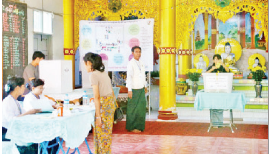
ပြီးခဲ့သည့် ၂၀၁၅ ခုနှစ်က ကျင်းပခဲ့သည့် အထွေထွေ အနက် ၃၂ သိန်းကျော် မဲပေးရွေးချယ်ခဲ့ကြောင်း သိရသည်။ ရွေးကောက်ပွဲတွင် မန္တလေးတိုင်းဒေသကြီးမှ မဲပေးပိုင်ခွင့်ရှိ သည့် မဲဆန္ဒရှင်စာရင်းမှာ ၄၄ သိန်း ကျော်ရှိခဲ့ပြီး ၎င်းတို့ မင်းထက်အောင် (မန်းကိုယ်ပွား)

ဇွန်လကုန်အထိ ကောက်ယူထားတဲ့စာရင်းအရ ၄၅၃၀၀၀၀ ကျော်ရှိနေပါတယ်။ ပြည်ထောင်စုရွေးကောက်ပွဲကော်မရှင်က ခွင့်ပြုတဲ့အချိန်မှာ ဒီမဲစာရင်းတွေကို မြို့နယ်/ရပ်ကွက် အလိုက် ၁၄ ရက်နှစ်ကြိမ် ကြေညာပေးသွားမှာဖြစ်ပါတယ်။ ရွေးကောက်ပွဲဥပဒေမှာ လွတ်လပ်စွာ မဲပေးပိုင်ခွင့်ရှိသလို မဲမပေးချင်လည်း ရပါတယ်ဆိုပြီး ပြဋ္ဌာန်းထားပေးမယ့် ကိုယ့်နိုင်ငံရဲ့ အုပ်ချုပ်ရေး၊ ဥပဒေပြုရေးနှင့် တရားစီရင်ရေး ကဏ္ဍတွေမှာ ပါဝင်ဆောင်ရွက်ရမယ့် ကိုယ်စားလှယ် လောင်းတွေကို ပြည်သူတွေက မှန်မှန်ကန်ကန်နဲ့ ရွေးချယ် ပေးနိုင်ရင် တိုင်းပြည်အတွက် အကောင်းဆုံးဖြစ်မယ်လို့ မျှော်လင့်ပါတယ်" ဟု ၎င်းက ပြောကြားသည်။ မန္တလေးတိုင်းဒေသကြီးအတွင်း၌ လာမည့် ၂၀၂၀ ပြည့်နှစ် နိုဝင်ဘာ ၈ ရက်တွင် ကျင်းပမည့် ရွေးကောက်ပွဲ အတွက် ပြည်သူ့လွှတ်တော်မဲဆန္ဒနယ် ၂၈ နေရာ၊ အမျိုးသားလွှတ်တော်မဲဆန္ဒနယ် ၁၂ နေရာနှင့် တိုင်းဒေသ ကြီး လွှတ်တော်မဲဆန္ဒနယ် ၅၆ နေရာတွင် လွှတ်တော် ကိုယ်စားလှယ်များ ဝင်ရောက်ယှဉ်ပြိုင် အရွေးခံကြမည် ဖြစ်ကြောင်း သိရသည်။