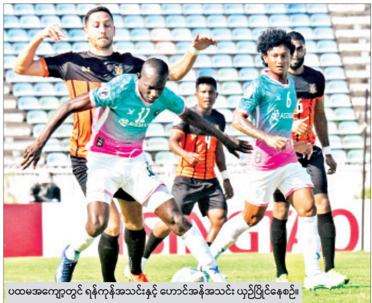
ပထမအကျော့တွင် ရန်ကုန်အသင်းနှင့် ဟောင်အန်အသင်း ယှဉ်ပြိုင်နေစဉ်။