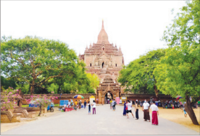
ရိုကြောင်း၊ စနေ၊ တနင်္ဂနွေနေ့မှလွဲ၍ ကျန်ရက်များ ဘုရားဖူးလာရောက်မှုရှိကြောင်း ထီးလှိုင်းလှိုင် တွင် တစ်ရက် ၄၅၀ ခန့် လာရောက်ကြပြီး စနေ၊ တနင်္ဂနွေရက်များတွင် တစ်ရက် ၁၂၀၀ ကျော်အထိ သိရသည်။

ညောင်ဦး ဇူလိုင် ၅ ပုဂံ-ညောင်ဦး ရှေးဟောင်းယဉ်ကျေးမှုအမွေအနှစ် ဒေသ၌ ကိုဗစ်-၁၉ ရောဂါစတင်ကာကွယ်ထိန်းချုပ် ချိန်မှတ်ကာလအရောက်လည်ပတ်သည့် ဘုရားဖူး ဧည့်သည်မရှိခဲ့ရာမှ ယခုရက်ပိုင်းအတွင်း တစ်ရက် လျှင် ပျမ်းမျှ ၄၅၀ ခန့် ဝင်ရောက်မှုရှိလာကြောင်း ရွှေစည်းခုံဘုရားဂေါပကအဖွဲ့ထံမှ သိရသည်။