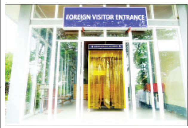
ရွှေတိဂုံစေတီတော်မြတ်၌ ပိုးသတ်ဆေးဖျန်းရုံ စီစဉ်ဆောင်ရွက်ထားသည်ကို တွေ့ရစဉ်။

ငမဲ ဇူလိုင် ၅ မကွေးတိုင်းဒေသကြီး ငမဲမြို့နယ် စိုက်ပျိုးရေးဦးစီးဌာန ကော်မီ-ရာသီသီးနှံဌာနခွဲ၊ ကော်မီနည်းပညာ ဖွံ့ဖြိုးရေးခြံသည် တောင်ပေါ်ဒေသသာဘဝ ပတ်ဝန်းကျင်ထိန်းသိမ်းရေး၊ စိမ်းလန်းစိုပြည်ရေးနှင့် ကျေးလက်လူမှုစီးပွားဘဝ ဖွံ့ဖြိုးရေးတို့အတွက် လာမည့် ၂၀၂၁ ခုနှစ် မိုးရာသီတွင် တောင်သူများ စိုက်ပျိုးနိုင်ရန်အတွက် ကော်မီမြေပျိုးဥယျာဉ်တွင် ပျိုးပင်ပေါင်း ငါးသောင်းကို စတင်ပျိုးထောင်လျက် ရှိကြောင်း သိရသည်။ လာမည့်နှစ်တွင် တောင်ပေါ်ဒေသခံကော်မီ စိုက်တောင်သူများအား ဖြန့်ဝေပေးနိုင်ရေးအတွက် ကော်မီပျိုးပင် ငါးသောင်းကို ယနေ့နံနက်ပိုင်းမှစတင်၍ ပျိုးထောင်ဆောင်ရွက်လျက်ရှိကြောင်းနှင့် ငမဲမြို့နယ်ကော်မီမြေမှ နှစ်စဉ်ကော်မီပျိုးပင်များကို တောင်သူများအား ဖြန့်ဝေပေးလျက်ရှိကြောင်း သိရသည်။ မြို့နယ်(ပြန်/ဆက်)