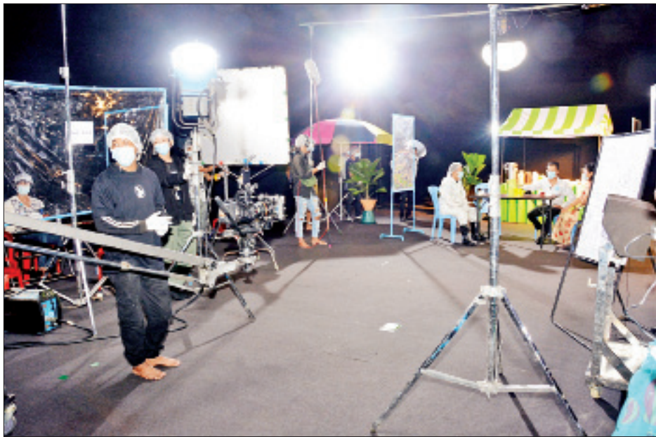
ကိုဗစ်-၁၉ ကာလ သတ်မှတ်ထားသည့် စည်းကမ်းချက်များနှင့်အညီ ရုပ်ရှင်/ရုပ်သံ ရိုက်ကူးရေးလုပ်ငန်းများ သရုပ်ပြရိုက်ကူးမှုကို တွေ့ရစဉ်။