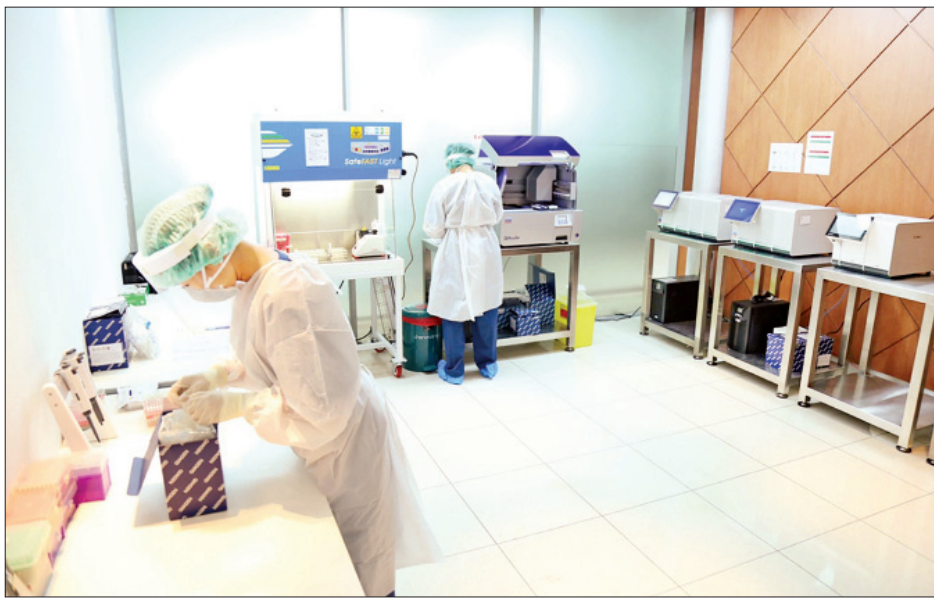
ပြန်လည်ခွင့်ပြုမည်ဟု ထိုင်းအစိုးရအဖွဲ့က ယခု ဖြစ်သည်။ ရက်သတ္တပတ်အတွင်း ပြောကြားခဲ့ပြီးနောက် အဆိုပါ လက်ရှိအချိန်တွင် စီးပွားရေးလုပ်ငန်းများနှင့် ဓာတ်ခွဲခန်းကို သုဝဏ္ဏဘူမိလေဆိပ်၌ ဖွင့်လှစ်ခဲ့ခြင်း ပတ်သက်၍ ရက်တိုခရီးစဉ်ဖြင့် လာရောက်သော

ဗန်ကောက် ဇူလိုင် ၄ ထိုင်းနိုင်ငံ သုဝဏ္ဏဘူမိနိုင်ငံတကာလေဆိပ်၌ ကိုဗစ်-၁၉ ရောဂါပိုး ရှိ မရှိ စစ်ဆေးနိုင်သည့် ဓာတ်ခွဲခန်းတစ်ခု ဖွင့်လှစ် ထားကြောင်း ယနေ့သတင်းများအရ သိရသည်။ ယခုလအတွင်း နိုင်ငံခြားသားဧည့်သည်များအား နိုင်ငံအတွင်းသို့ ပြန်လည်ဝင်ရောက်ခွင့်ပေးမည်ဖြစ်သည့် အတွက် အဆိုပါဓာတ်ခွဲခန်းကို တည်ဆောက်ခဲ့ခြင်းဖြစ် သည်ဟု ကျန်းမာရေးတာဝန်ရှိသူများက ဆိုသည်။ ပြည်ဝင်ခွင့်ရရှိသော နိုင်ငံခြားသားဧည့်သည်များ အနေဖြင့် ၁၄ ရက် သီးခြားနေထိုင်ရမည်ဟု စည်းမျဉ်း ထုတ်ပြန်ထားသော်လည်း အဆိုပါဓာတ်ခွဲခန်း၏ ဆေးစစ်ချက်တွင် ရောဂါပိုးမရှိကြောင်း ရလဒ်ထွက်ပေါ်ပါက ၁၄ ရက်သီးခြားနေထိုင်ရန်မလိုအပ်ကြောင်း သိရသည်။ အဆိုပါဓာတ်ခွဲခန်းသည် နှစ်နာရီအတွင်း ရောဂါ ရှိ မရှိ ဆေးစစ်ချက်အဖြေများကို ထုတ်ပြန်ပေးနိုင်သည်။ ကနဦးတွင် တစ်ရက်လျှင် လူ ၂၀၀ ခန့် ဆေးစစ်မှုများ ဆောင်ရွက်ပေးမည်ဖြစ်ပြီး နောက်ပိုင်းတွင် လူ ၁၀၀၀ အထိ တိုးမြှင့်ကာ ဆေးစစ်မှုများ ဆောင်ရွက်ပေးမည်ဖြစ် ကြောင်း လေဆိပ်အာဏာပိုင်များက ပြောသည်။ နိုင်ငံအတွင်း ကိုဗစ်-၁၉ ရောဂါကူးစက်ပျံ့နှံ့မှုကြောင့် ပိတ်ပင်ထားသည့် နိုင်ငံတကာလေကြောင်းလိုင်းများကို