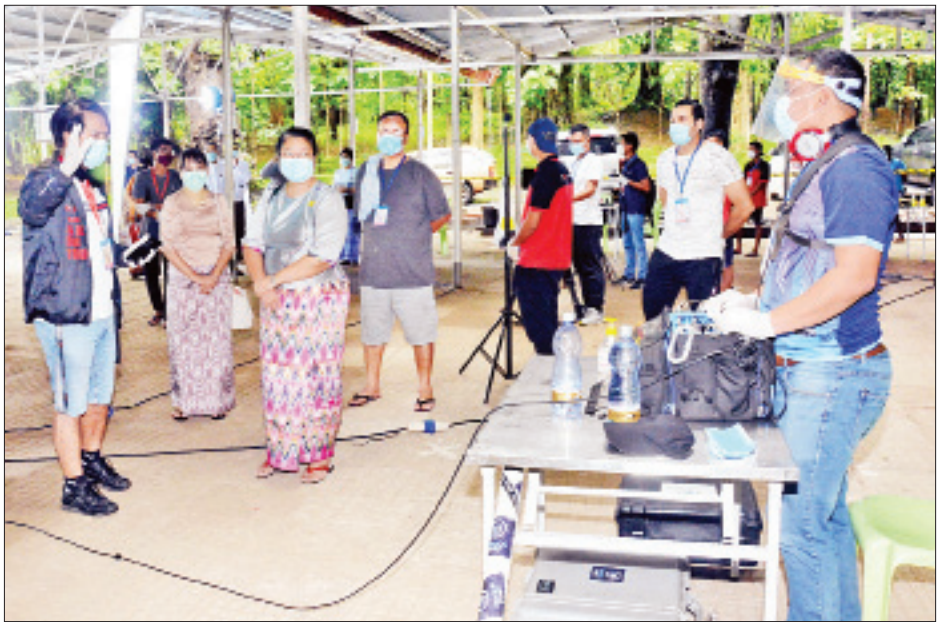
ကိုဗစ်-၁၉ ကာလ သတ်မှတ်ထားသည့် စည်းကမ်းချက်များနှင့်အညီ ရုပ်ရှင်/ရုပ်သံ ရိုက်ကူးရေးလုပ်ငန်းများ သရုပ်ပြရိုက်ကူးမှုကို တာဝန်ရှိသူများ ကြည့်ရှုစစ်ဆေးစဉ်။

* ကျော့ဖိုးမှ ကိုဗစ်-၁၉ စည်းမျဉ်းစည်းကမ်းများနှင့်အညီ ရိုက်ကူးကြရန် လိုအပ်ကြောင်း အကြံပြုကြားသိရသည်။