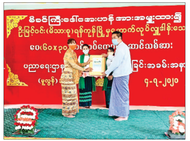
တစ်ထပ်ကျောင်းဆောင် အဆောက်အအုံသစ်အား

ထိုသို့ဆောင်ရွက်ရာတွင် မြို့နယ်အုပ်ချုပ်ရေးမှူးနှင့် မြို့နယ်အဆင့် ဌာနဆိုင်ရာများ၊ လူမှုရေးအသင်းအဖွဲ့များပူးပေါင်း၍ ကျောင်းသား ကျောင်းသူ များ မိုးရာသီတွင်ဖြစ်ပွားတတ်သည့် ရောဂါများ၊ ခြင်ကြောင့်ဖြစ်ပွားတတ်သော သွေးလွန်တုပ်ကွေးရောဂါ မဖြစ်ပွားစေရေး၊ ကြိုတင်ကာကွယ်ရေး၊ ကိုဗစ်-၁၉ ရောဂါ ကာကွယ်ထိန်းချုပ်ရေးလုပ်ငန်းများအတွက်ရည်ရွယ်၍ ကျောင်းဝင်း အတွင်းရှိ အမှိုက်များရှင်းလင်းခြင်း၊ သစ်ပင်ချွန်များရှင်းလင်းခြင်း၊ ရေမြောင်း များရှင်းလင်းခြင်းနှင့် စာသင်ခန်းများတွင် ပိုးသတ်ဆေးဖျန်းခြင်း၊ ခြင်ဆေး ဖျန်းခြင်းတို့ကို ဆောင်ရွက်ခဲ့ကြောင်း သိရသည်။ သန်းထွန်းဦး(ပြန်/ဆက်)