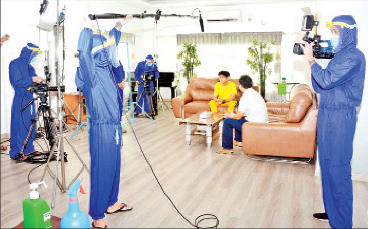
ကိုဗစ်-၁၉ ကာလ သတ်မှတ်ထားသည့် စည်းကမ်းချက်များနှင့်အညီ ရုပ်ရှင်၊ ရုပ်သံ ရိုက်ကူးရေးလုပ်ငန်းများ သရုပ်ပြရိုက်ကူးမှုကို တွေ့ရစဉ်။

ရန်ကုန် ဇူလိုင် ၄ ကိုဗစ်-၁၉ ကာလအတွင်း ရုပ်ရှင်၊ ရုပ်သံ ရိုက်ကူးရေးလုပ်ငန်းများကို ကျန်းမာရေးနှင့် အားကစားဝန်ကြီးဌာနက သတ်မှတ်ထားသည့် စည်းကမ်းသတ်မှတ်ချက်များနှင့်အညီ ရိုက်ကူးနိုင်ရေး သရုပ်ပြရိုက်ကူးပြဿနာကို ကျန်းမာရေးနှင့် အားကစားဝန်ကြီးဌာနမှ တာဝန်ရှိသူများက ယနေ့ နံနက်ပိုင်းတွင် ကြည့်ရှုစစ်ဆေးကြသည်။