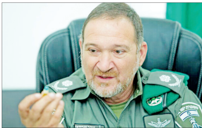
ရက်စ်လင်၊ အစွရေးကာကွယ်ရေးတပ်ဖွဲ့အကြီးအကဲ ဗိုလ်ချုပ် အပစ်ကန်ချာဗီနှင့် ဝန်ကြီးချုပ် ဘင်နီဂန်စ် တို့လည်း ပါဝင်သည်။ ကိုးကား-သည်ဂျေရုဆလင်ပို့စ် ဘာသာပြန်-ကျော်ထိုက်စိုး

ယာကော့စ်နှင့် ထိတွေ့ခဲ့သူများအား သီးသန့် ခွဲထားရန် စစ်ဆေးမှုများ ပြုလုပ်လျက်ရှိသည်ဟု ထုတ်ပြန်ချက်အရ သိရသည်။ ယာကော့စ်သည် ၂၀၁၄ ခုနှစ် ဇူလိုင် ၂ ရက်က ဂါဇာဒေသ၌ ဆောင်ရွက် ခဲ့သည့် Protective Edge စစ်ဆင်ရေးအတွင်း ကျဆုံးခဲ့သူတပ်ဖွဲ့ဝင်များ အောက်မေ့ဖွယ်အခမ်း အနားတစ်ခုသို့ တက်ရောက်ခဲ့သည်။ အဆိုပါအခမ်း အနားသို့ တက်ရောက်ခဲ့သူများတွင် အစွရေးသမ္မတ