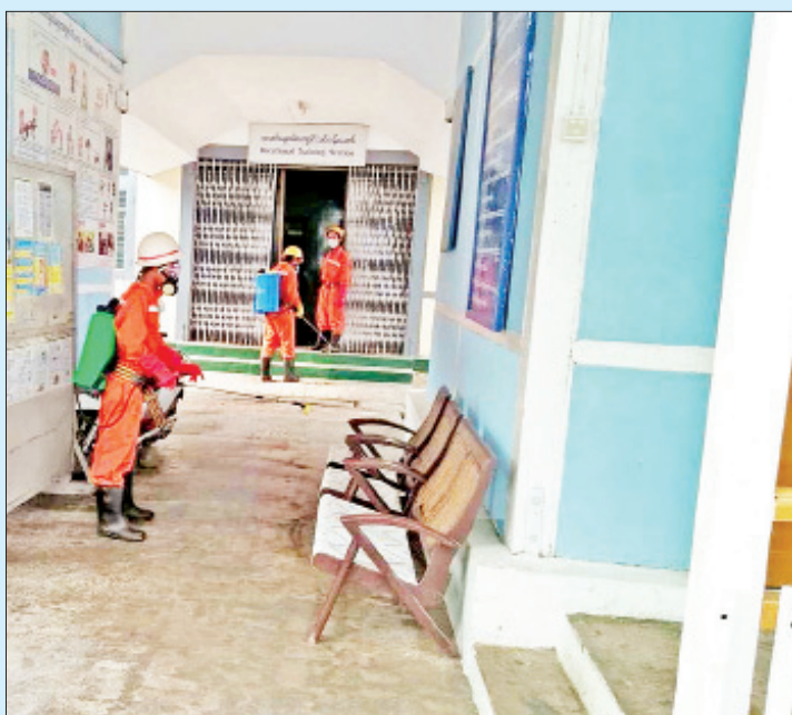
မန္တလေးတိုင်းဒေသကြီး ချမ်းမြသာစည် တောင်ရပ်ကွက်၌ ကိုဗစ်-၁၉ ရောဂါ ကာကွယ်ရေး ပိုးသတ်ဆေးဖျန်းစဉ်။