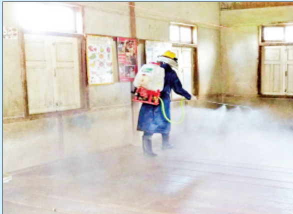
စစ်ကိုင်းတိုင်းဒေသကြီး အင်းတော်မြို့နယ်၌ ကိုဗစ်-၁၉ ရောဂါ ကာကွယ်ရေး ပိုးသတ်ဆေးဖျန်းစဉ်။