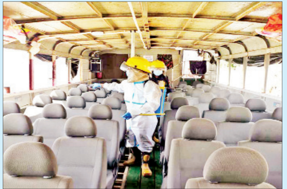
ရခိုင်ပြည်နယ် မြောက်ဦးခရိုင် မင်းပြားမြို့၌ ပြေးဆွဲနေသော ရွှေပြည်တန်အမြန်ရေယာဉ်အား ကိုဗစ်-၁၉ ရောဂါကာကွယ်ရေး ပိုးသတ်ဆေးဖျန်းစဉ်။