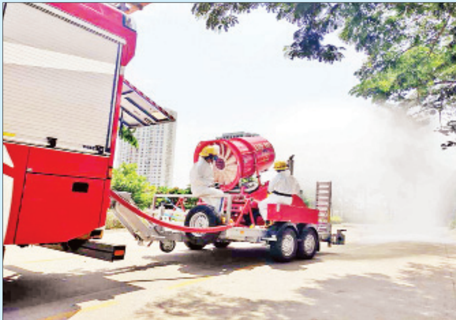
ရန်ကုန်တိုင်းဒေသကြီး သန်လျင်မြို့နယ်၌ ကိုဗစ်-၁၉ ရောဂါကာကွယ်ရေး ပိုးသတ်ဆေးဖျန်းစဉ်။