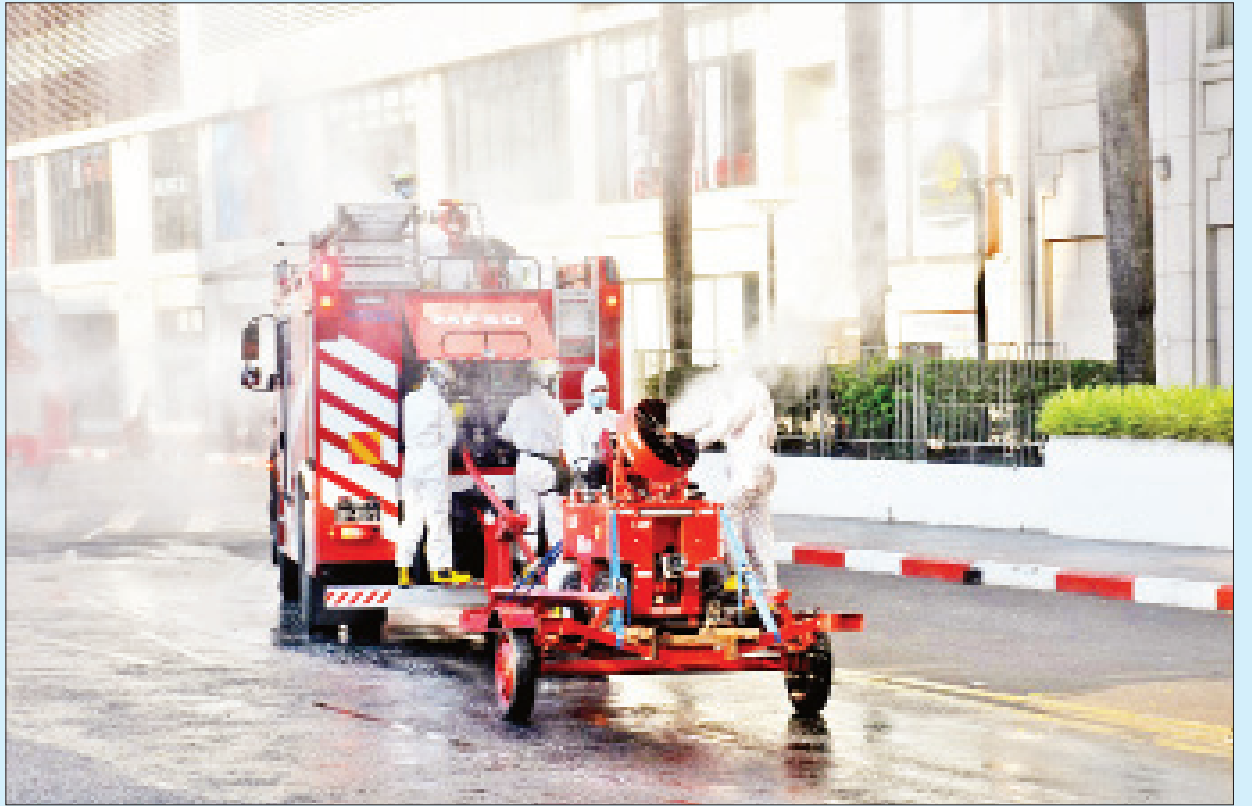
ရန်ကုန်မြို့ ဗဟန်းမြို့နယ်၌ ကိုဗစ်-၁၉ ရောဂါကာကွယ်ရေး ပိုးသတ်ဆေးဖျန်းစဉ်။