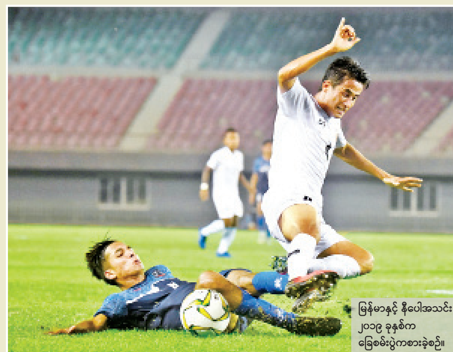
မြန်မာနှင့် နီပေါအသင်း ၂၀၁၉ ခုနှစ်က ခြေစမ်းပွဲကစားခဲ့စဉ်။