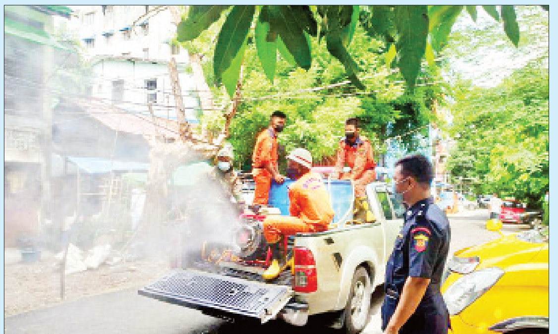
ရန်ကုန်မြို့ စမ်းချောင်းမြို့နယ်၌ ကိုဗစ်-၁၉ ရောဂါကာကွယ်ရေး ပိုးသတ်ဆေးဖျန်းစဉ်။