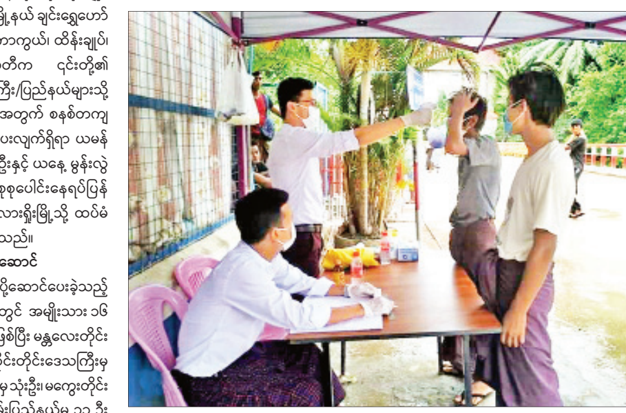
ပြည်နယ်များသို့ လွှဲပြောင်းပို့ဆောင်ပေးခဲ့ သည့် နေရပ်ပြန်ပြည်သူများမှာ ဧပြီ ၃၀ ရက် မှ ယနေ့အထိ အမျိုးသား ၆၇၉၅ ဦးနှင့် အမျိုး သမီး ၅၄၄၉ ဦးတို့ဖြစ်ပြီး စုစုပေါင်းနေရပ်ပြန် ပြည်သူ ၁၂၂၄၄ ဦးတို့ကို စနစ်တကျလွှဲပြောင်း ပို့ဆောင်ပေးခဲ့ကြောင်း သိရသည်။ ဇင်ဇင်(ပြန်/ဆက်)