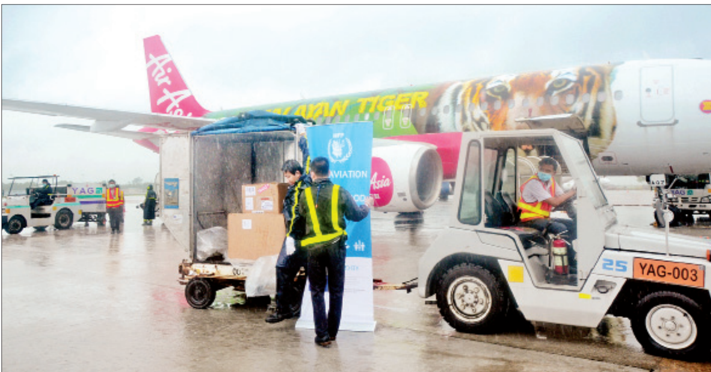
ကမ္ဘာ့ကျန်းမာရေးအဖွဲ့က ထောက်ပံ့ကူညီသည့် ဓာတ်ခွဲခန်းသုံး အထောက်အကူပြုပစ္စည်းများနှင့် လူသားချင်းစာနာထောက်ထားမှုဖွံ့ဖြိုးရေးဆိုင်ရာ ကူညီဆောင်ရွက်ပေးမည့် ကျွမ်းကျင်ဝန်ထမ်းများ တင်ဆောင်လာသော အထူးလေယာဉ် ရန်ကုန်အပြည်ပြည်ဆိုင်ရာလေဆိပ်သို့ ရောက်ရှိလာစဉ်။

ရန်ကုန် ဇွန် ၂၈ ကမ္ဘာ့စားနပ်ရိက္ခာအစီအစဉ်(WFP)၏ ကမ္ဘာလုံးဆိုင်ရာ ထောက်ပံ့ပို့ဆောင်ရေး ဝန်ဆောင်မှုအစီအစဉ်ဖြင့် မြန်မာ နိုင်ငံ၌ ကိုဗစ်-၁၉ ရောဂါ ကာကွယ် ထိန်းချုပ်ရေးလုပ်ငန်း များဆောင်ရွက်ရာတွင် အသုံးပြုရန်အတွက် ကမ္ဘာ့ကျန်းမာ ရေးအဖွဲ့(WHO)က ထောက်ပံ့ကူညီသည့် ဓာတ်ခွဲခန်းသုံး အထောက်အကူပြုပစ္စည်းများနှင့် လူသားချင်းစာနာ ထောက်ထားမှုဖွံ့ဖြိုးရေးဆိုင်ရာ ကူညီဆောင်ရွက်ပေးမည့် ကျွမ်းကျင်ဝန်ထမ်းများ တင်ဆောင်လာသော လူသားချင်း စာနာထောက်ထားမှုဆိုင်ရာ အထူးလေယာဉ်သည် ယနေ့ နံနက် ၁၀ နာရီ ၁၀ မိနစ်တွင် မလေးရှားနိုင်ငံမှ ရန်ကုန် အပြည်ပြည်ဆိုင်ရာလေဆိပ်သို့ ရောက်ရှိလာသည်။