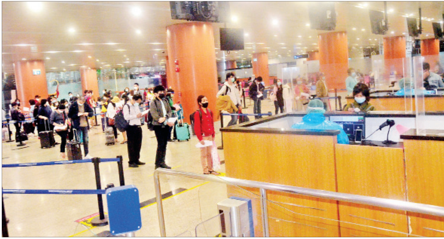
စင်ကာပူနိုင်ငံမှ ပြန်လည်ရောက်ရှိလာသော မြန်မာအလုပ်သမားများအား ရန်ကုန်အပြည်ပြည်ဆိုင်ရာလေဆိပ်၌ တွေ့ရစဉ်။

နေပြည်တော် ဇွန် ၂၈ ပြည်ပနိုင်ငံများတွင် အခက်အခဲကြုံတွေ့နေရ သည့် မြန်မာနိုင်ငံသားများအား ပြန်လည် ခေါ်ဆောင်ရန် Coronavirus Disease 2019 (COVID-19) ကာကွယ်၊ ထိန်းချုပ်၊ ကုသရေး အမျိုးသားအဆင့်ဗဟိုကော်မတီ၏ လမ်းညွှန် ချက်နှင့်အညီ နိုင်ငံခြားရေးဝန်ကြီးဌာနအနေ ဖြင့် သက်ဆိုင်ရာဝန်ကြီးဌာနများ၊ သက်ဆိုင်ရာ နိုင်ငံများရှိ မြန်မာသံရုံးများနှင့် ပူးပေါင်း ညှိနှိုင်း၍ ဆောင်ရွက်ပေးလျက်ရှိရာ စင်ကာပူ နိုင်ငံတွင် ရောက်ရှိနေပြီး မြန်မာနိုင်ငံသို့ ပြန်ရန် အခက်အခဲကြုံတွေ့နေရသည့် မြန်မာနိုင်ငံသား ၁၅၄ ဦးတို့အား စင်ကာပူနိုင်ငံ ချန်ဂီ အပြည်ပြည်ဆိုင်ရာလေဆိပ်မှတစ်ဆင့် မြန်မာ အမျိုးသားလေကြောင်းလိုင်း (MNA) ကယ်ဆယ်ရေးလေယာဉ်ဖြင့် ပြန်လည်ခေါ် ဆောင်ခဲ့ရာ ယနေ့ ညနေ ၅ နာရီတွင် ရန်ကုန် အပြည်ပြည်ဆိုင်ရာလေဆိပ်သို့ အဆင်ပြေ ချောမွေ့စွာ ပြန်လည်ရောက်ကြသည်။ အဆိုပါ မြန်မာနိုင်ငံသားများ ရန်ကုန် အပြည်ပြည်ဆိုင်ရာလေဆိပ်သို့ ရောက်ရှိချိန် တွင် လူဝင်မှုကြီးကြပ်ရေး၊ ကျန်းမာရေး စစ်ဆေးရေးနှင့် ၂၁ ရက်တာ အသွားအလာ ကန့်သတ်နေထိုင်ရေးတို့ကို အလုပ်သမား၊ လူဝင်မှုကြီးကြပ်ရေးနှင့် ပြည်သူ့အင်အား ဝန်ကြီးဌာန၊ စာမျက်နှာ ၈ ကော်လံ ၁ သို့ ❖