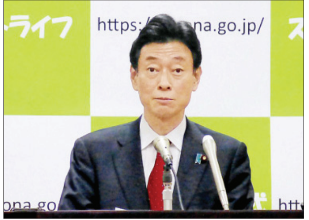
ကိုရိုနာဗိုင်းရပ်စ်တုံ့ပြန်ရေးအဖွဲ့အကြီးအကဲ နီရှိမူရာယာဆူတိုရှိ