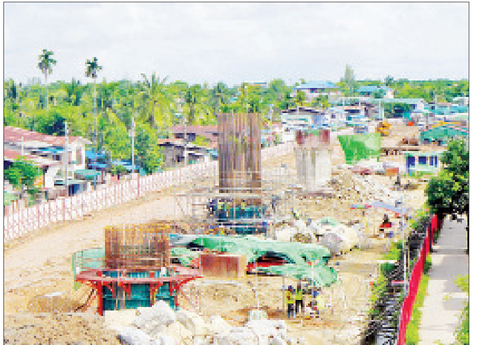
ဖြင့် တည်ဆောက်ခြင်းဖြစ်ပြီး ၂၀၁၉ ခုနှစ် မေလတွင် ဆောက်လုပ်ရေးဝန်ကြီးဌာန တံတားဦးစီးဌာနမှ သိရ တည်ဆောက်ရေးလုပ်ငန်းများစတင်ခဲ့ပြီး ၂၀၂၂ ခုနှစ် သည် ဆောက်လုပ်ရေးဝန်ကြီးဌာန တံတားဦးစီးဌာနမှ သိရ အောက်တိုဘာလတွင် တည်ဆောက်ပြီးစီးမည်ဖြစ်ကြောင်း

မြန်မာ-ကိုရီးယားချစ်ကြည်ရေး ဒလမြစ်ကူးတံတား တည်ဆောက်ရာတွင် ဒလဘက်ခြမ်း ချဉ်းကပ်တံတား တည်ဆောက်ရေးအတွက် ဘိုးပိုင်ပေါင်း ၁၄၁ လုံးနှင့် ရန်ကုန်ဘက်ခြမ်းချဉ်းကပ်တံတားအတွက် ဘိုးပိုင်ပေါင်း ၈၂ လုံး၊ ဆင်ခြေလျှောက်တံတားအတွက် Ram A ဘိုးပိုင် ၄၈ လုံး၊ Ram B ဘိုးပိုင် ၅၂ လုံးတို့ကို တူးဖော်ဆောင်ရွက်သွား ရမည်ဖြစ်ပြီး ရေလယ်တိုင် ပင်မတံတားအနေဖြင့် ဒလ ဘက်ခြမ်းတွင် PY 1 ဘိုးပိုင် ၂၃ လုံးနှင့် P 14 ဘိုးပိုင် ၁၂ လုံး၊ ရန်ကုန်ဘက်ခြမ်းတွင် PY 2 ဘိုးပိုင် ၂၃ လုံးနှင့် P 19 ဘိုးပိုင် ၁၈ လုံး တူးဖော်ရမည်ဖြစ်ရာ လက်ရှိအချိန်တွင် ချဉ်းကပ်တံတားအတွက် ဘိုးပိုင်လုပ်ငန်းများ ဆောင်ရွက် ပြီးစီးနေသော ရန်ကုန်ဘက်ခြမ်း၌ Pile Cap ပိုင်ထိပ် အုတ်ခြင်းခြောက်တိုင်နှင့် ဒလဘက်ခြမ်း၌ ငါးတိုင်ဆောင် ရွက်လျက်ရှိပြီး Pier Column တိုင်များ ဆက်လက်ဆောင် ရွက်လျက်ရှိကြောင်း သိရသည်။