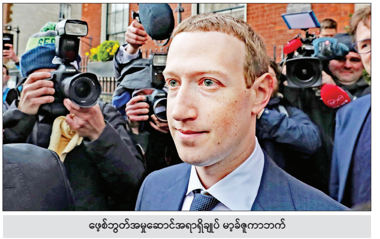
ဖေ့စ်ဘွတ်အမှုဆောင်အရာရှိချုပ် မာ့ခ်ဇူကာဘက်

တွစ်တာက အလေးပေးဖော်ပြခဲ့သည်။ ယင်းသို့ တွစ်တာ၏ဖော်ပြချက်များကို ဇူကာဘက်က ဝေဖန်ခဲ့ပြီး နိုင်ငံရေးကိစ္စရပ်များအပေါ် ထင်မြင်ချက်ရေးသားမှုများကို သတိကြီးစွာ ကိုင်တွယ်သင့်သည်ဟု မှတ်ချက်ပြုပြောကြားခဲ့သည်။ မကြာသေးမီက အမေရိကန်နိုင်ငံအတွင်း လူမည်းလူငယ်တစ်ဦး သေဆုံးမှုနှင့်ပတ်သက်ပြီး ဆန္ဒထုတ်ဖော်မှုများ မြင့်တက်လာသည့် အတွက် ဖေ့စ်ဘွတ်၏မူဝါဒကို ပြောင်းလဲရန် ဇူကာဘက်အနေဖြင့် ဖိအားအများအပြားနှင့် ရင်ဆိုင်နေရဖွယ်ရှိသည်ဟု စောင့်ကြည့်လေ့လာသူများက ဆိုသည်။ ကိုးကား-အင်န်အိတ်ချ်ကော့ဘာသာပြန်-အောင်ကျော်ကျော်