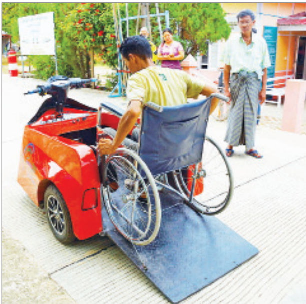
ကားငယ်တစ်စီးကို စတင်စမ်းသပ် ပြုလုပ်ခဲ့ပြီး ယနေ့အချိန်အထိ ဆိုင်ကယ်အင်ဂျင် အသုံးပြုသည့် မိနီကားငယ် သုံးစီး၊ မသန်စွမ်းသူ များအသုံးပြုနိုင်သည့် ဆိုင်ကယ် ၂၀

ပြောကြားသည်။ အဆိုပါ လျှပ်စစ်ဆိုင်ကယ်ကို အသုံးပြုမည့် မသန်စွမ်းသူများ အနေဖြင့် ဝိုးချဲပေါ်မှ ဆင်းရန် မလိုအပ်ဘဲ ဆိုင်ကယ်ပေါ်အထိ တက်ရောက် မောင်းနှင်နိုင်သည်။ ဆိုင်ကယ်ပေါ် တက်ရောက်ရာတွင် လုံခြုံရေးတံခါးအား မောင်းတံဆွဲဖြင့် ဤ တက်ရောက်ကာ အပေါ်သို့ ရောက်လျှင် လုံခြုံရေးတံခါးအား ပြန်ပိတ်ရမည် ဖြစ်သည်။ ယင်းနောက် ဆိုင်ကယ်အား သော့ဖွင့်၍ လီဘာ ဆွဲကာ မောင်းနှင်နိုင်ပြီး ရှေ့နောက် ဘက်တို့ကိုလည်း လက်ကိုင်တွင် အလွယ်တကူ အသုံးပြုနိုင်ရန် တပ်ဆင်ပေးထားကာ အဆိုပါ လျှပ် စစ်ဆိုင်ကယ်အား ရှေ့နောက် မောင်းနှင်နိုင်ရန် ရှေ့နောက် ဂီယာ စနစ်ပါ ထည့်သွင်းပေးထားကြောင်း သိရသည်။ ၂၀၁၃ ခုနှစ်မှ စတင်၍ ဆိုင်ကယ် အင်ဂျင် ၁၁၀ အား အသုံးပြု၍ မိနီ များအသုံးပြုနိုင်သည့် ဆိုင်ကယ် ၂၀ ခု